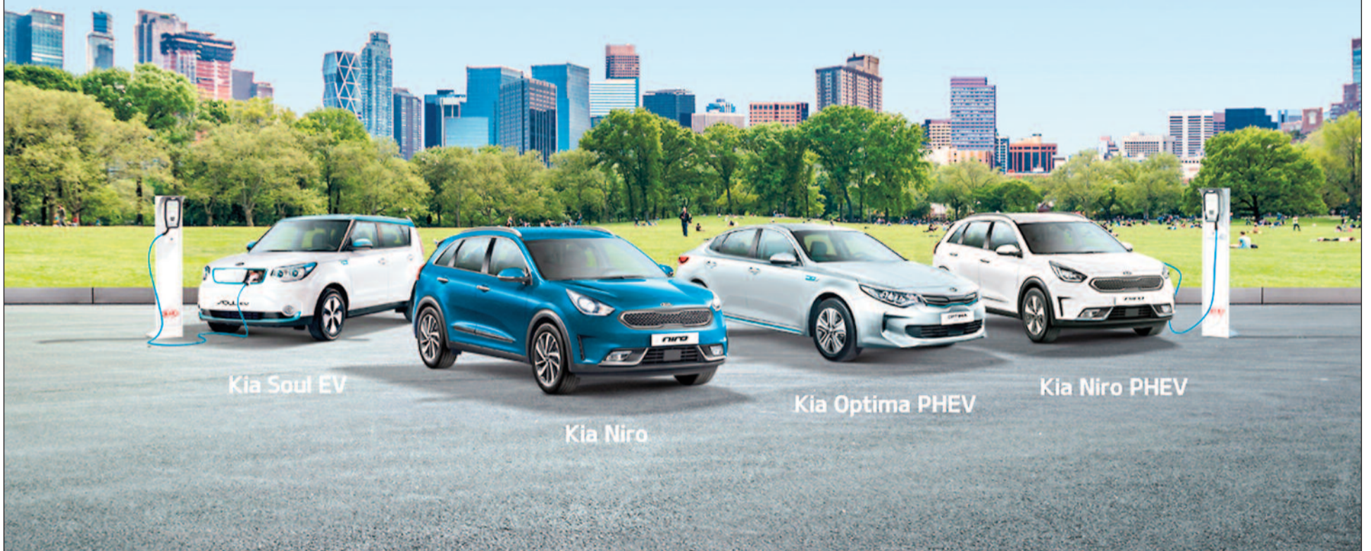
Kia Soul EV