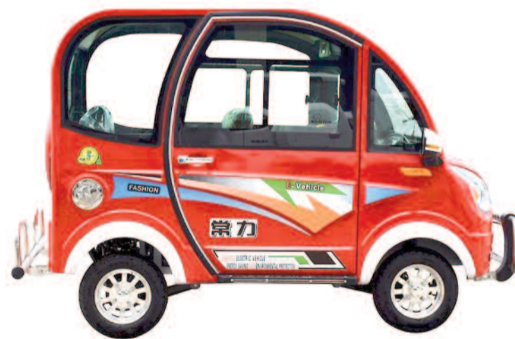
El coche eléctrico más barato ronda los 1.000 euros y es chino

En definitiva: en la decisión de compra priman el precio del propio vehículo y la amortización de las ayudas del Estado. En cualquier caso, el próximo martes se prevé que el gobierno active un nuevo Plan MOVES de 65 millones de euros para ayudar a la venta de vehículos eléctricos.