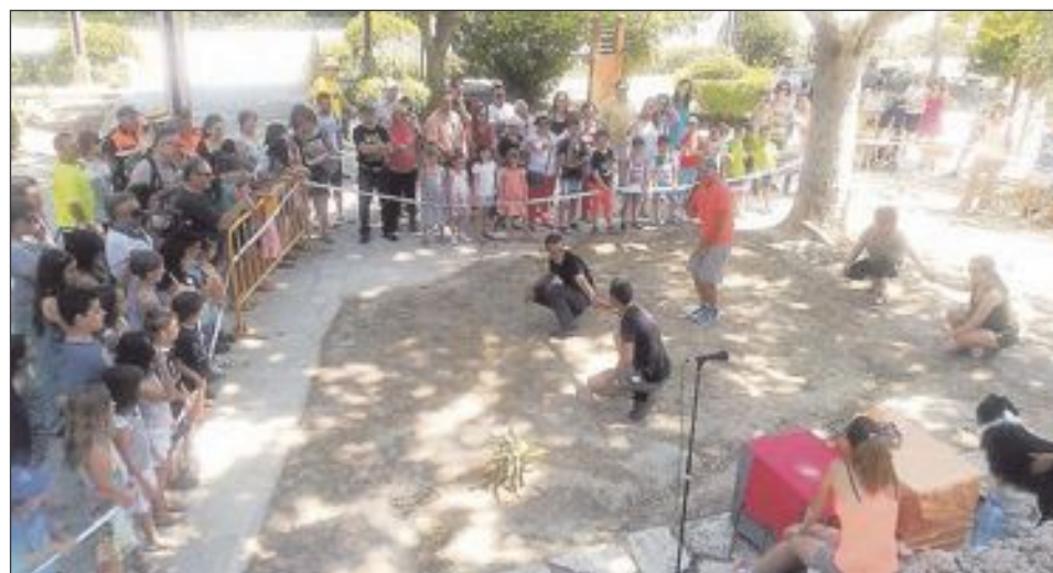
Para los niños se organizaron talleres y juegos durante el fin de semana