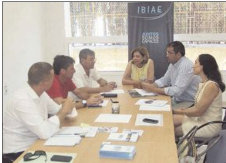
La reunión entre COEVAL, IBIAE y FEDAC tuvo lugar el 29 de junio

La Plataforma solicitará reuniones con todas las administraciones para trasladarles en detalle las necesidades empresariales y colaborar en temas donde puedan aportar valor.