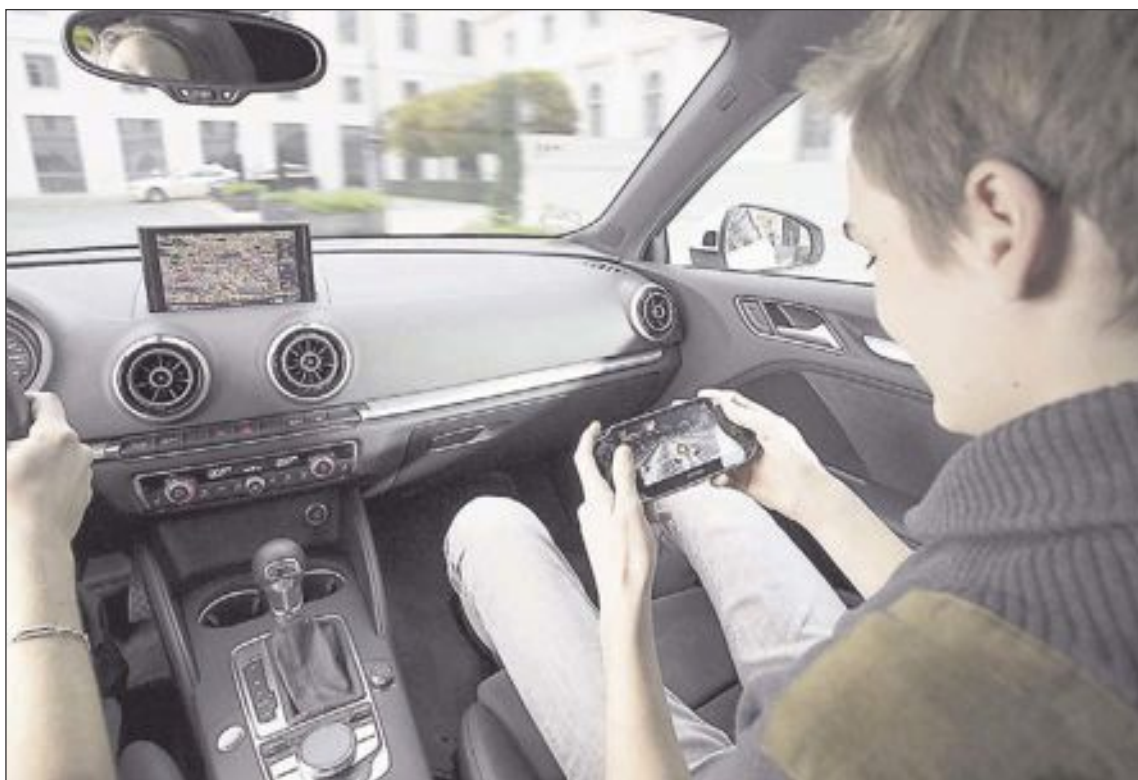
En un futuro no muy lejano, todos los vehículos nuevos aprovecharán la conexión a Internet como una ventaja más

Nos llega una posibilidad muy grande de poder disfrutar mejor de nuestros vehículos en un tiempo muy cercano.