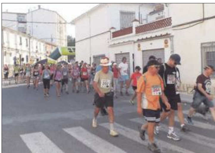
Los participantes toman la salida en el barrio de La Dulzura

El domingo 28 de junio tuvo lugar la decimocuarta edición de la Subida al Refugio, carrera y marcha de 16 kilómetros organizada por la Asociación de Vecinos del barrio La Dulzura, el Club Teixereta d'Atletisme y el Ayuntamiento de Ibi. Bajo un calor sofocante, 170 heroicos participantes se atrevieron con esta prueba (90 corredores y 80 marchadores). Afortunadamente, la organización habilitó siete puestos de avituallamiento durante el recorrido, donde no faltaron el agua y la fruta.