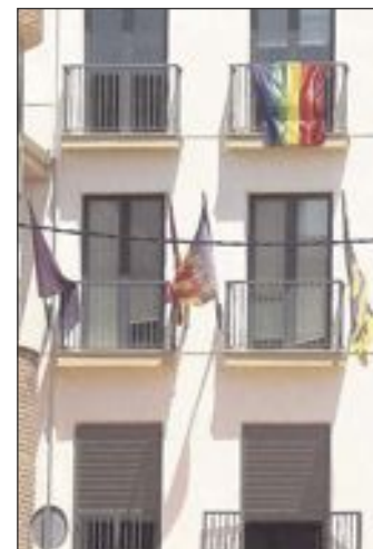
Fachada del Ayuntamiento de Onil

tratación de basura, “en el cual estamos encontrando ciertas incongruencias entre los pliegos y el contrato final, de las cuales informaremos en breve”.