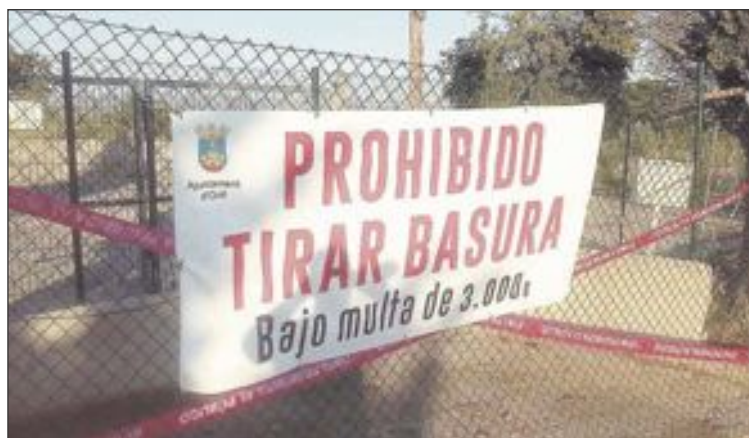
El punto limpio del camí de Franco ha sido clausurado recientemente

Según Monllor, “son hechos que mejorarían la vida de los vecinos de las zonas del extrarradio, como pueden ser el Pla, la Creueta, la Cava, etcétera, que, lejos de disponer de este servicio, tienen que desplazarse al punto limpio del polígono de los Vasalos o ir a parar a algún