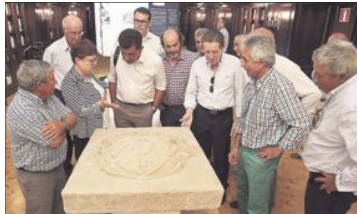
Al acto asistieron los alcaldes de Tibi y Mutxamel

La pieza original, tallada en piedra, fue cedida al Museo