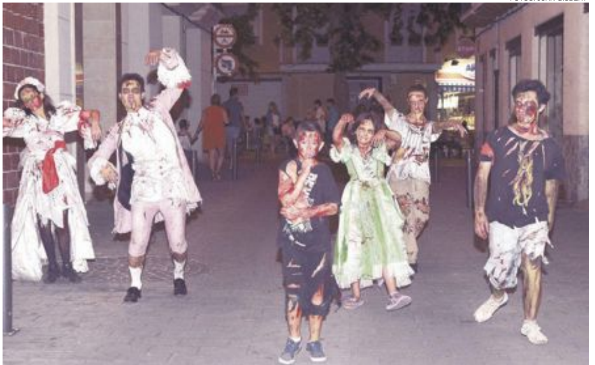
Los zombis deambularon por las calles ibenses con la intención de infectar a los supervivientes participantes

La organización estuvo formada por 60 personas y colaboraron como zombis miembros del Enfarinats , Moros y Cristianos y de la asociación Reyes Magos.