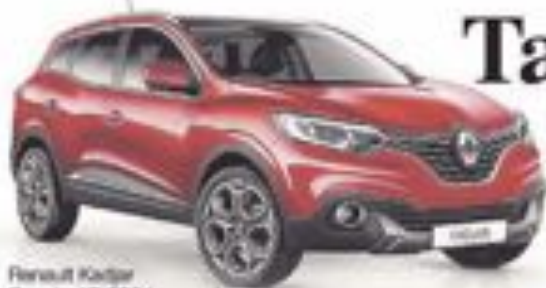
Renault Kadjar Desde 17.600€