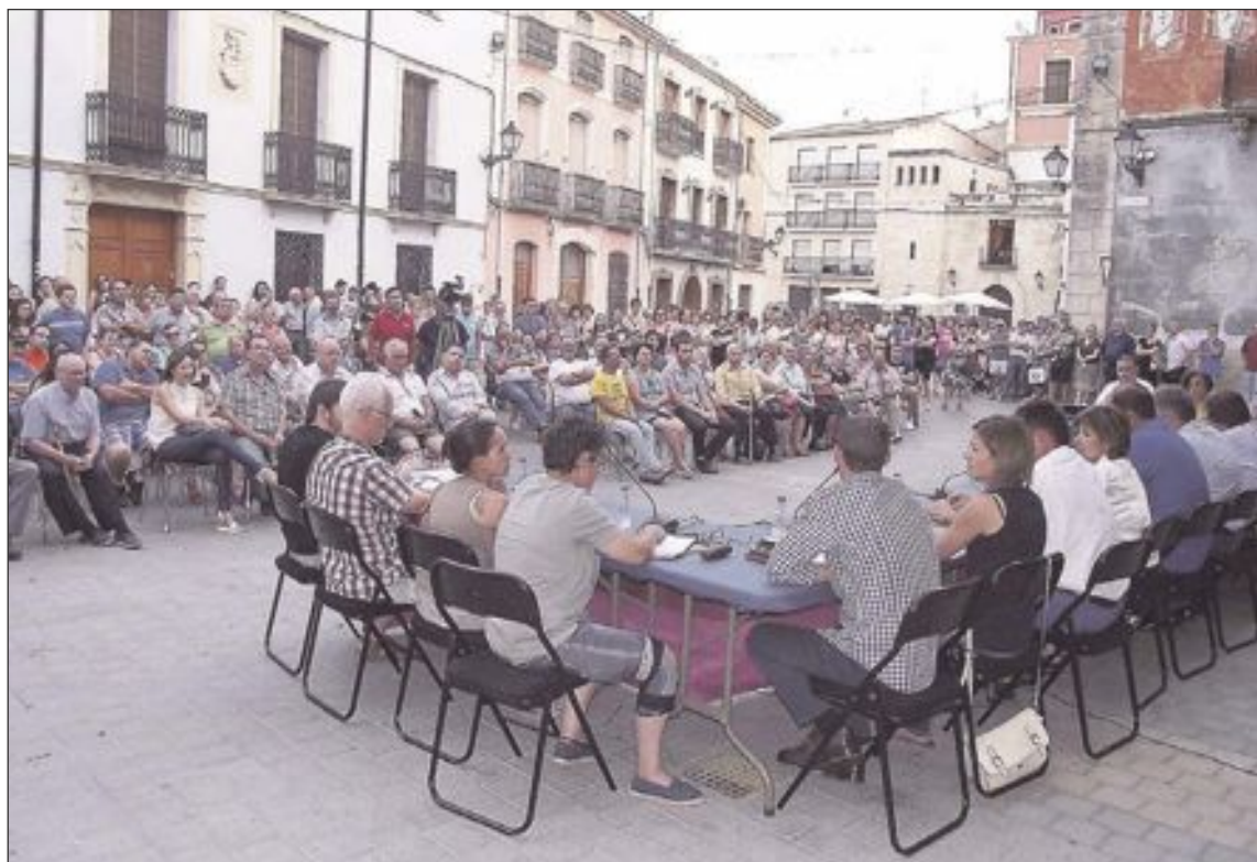
El pleno extraordinario del 1 de julio se celebró en la plaza Mayor ante unas 200 personas

Asimismo, para todos los concejales (tanto del gobierno como