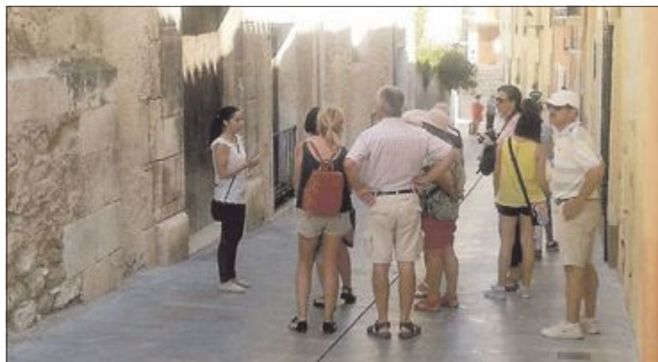
El Ayuntamiento organizó varias rutas guiadas por el casco antiguo y, una de ellas, nocturna