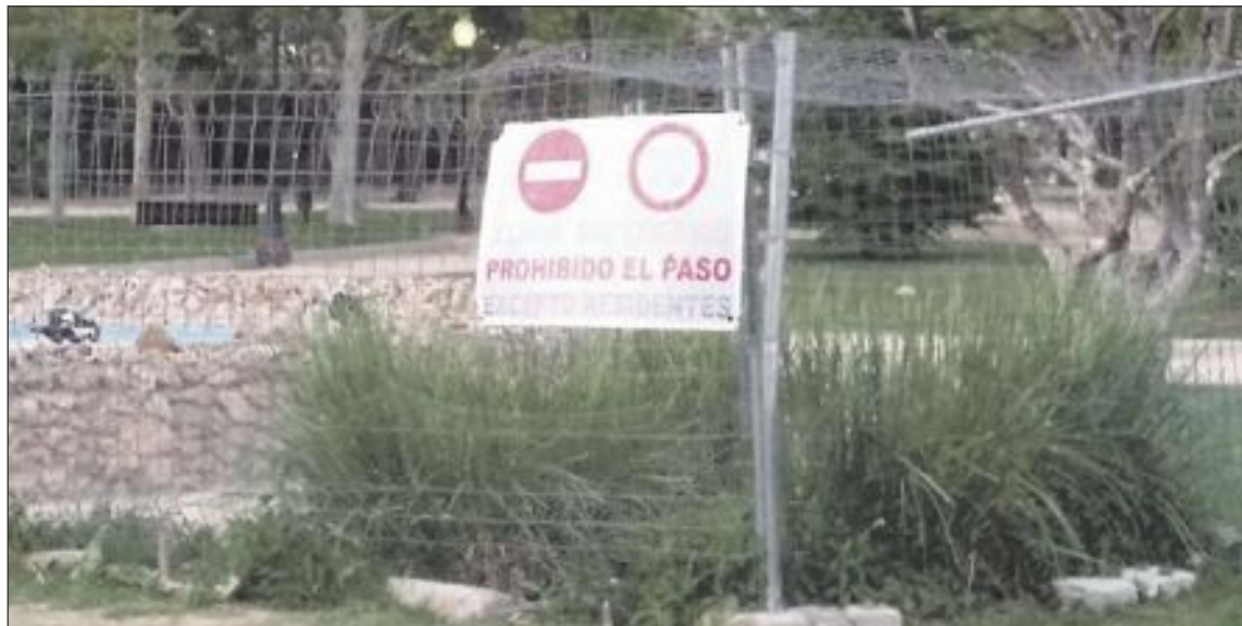
EU considera inadecuado el vallado que se ha colocado junto al estanque de los patos en el Derramador

La portavoz de EU opina que si se ha llegado a la situación actual de deterioro de las zonas verdes "es porque el Ayuntamiento no ha invertido en su cuidado y la solución no es apelar a la buena voluntad de los vecinos, sino contratar a las per-