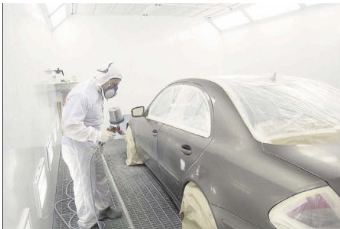
Asegúrese de elegir un color 'antiaccidentes' cuando lleve su coche a pintar la próxima vez

Según otro estudio sobre los propietarios europeos de la compañía alemana Standox, los hombres suelen decantarse por los colores más oscuros y las mujeres por los claros.