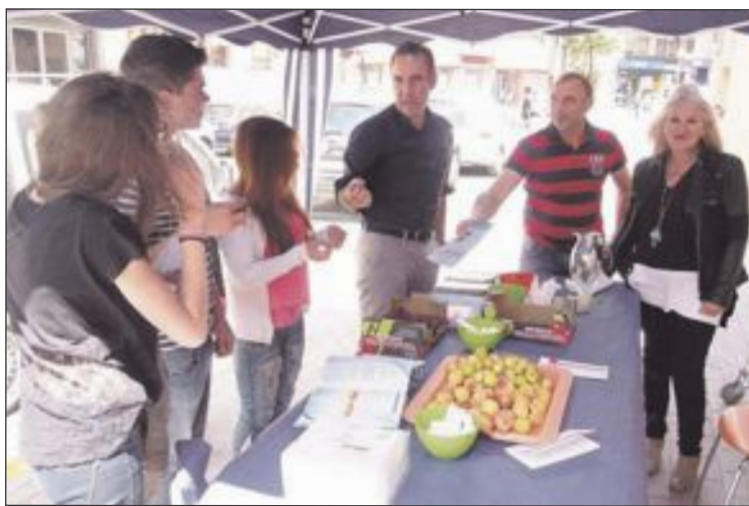
El alcalde visitó el stand montado por Servicios Sociales

La jornada estuvo organizada por la concejalía de Servicios Sociales, desde la Unidad de Prevención de Conductas Adictivas (UPCCA).