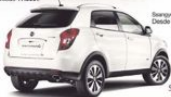
SsangYong Korando Desde 16.450€