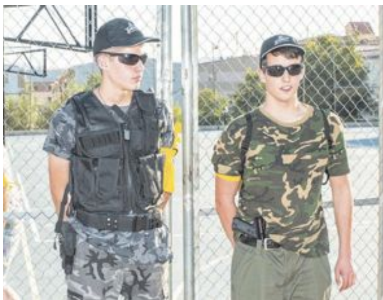
La Yincana arrancó en el parque Giravela donde algunos zombies estaban enjaulados y custodiados por guardianes 'profesionales'