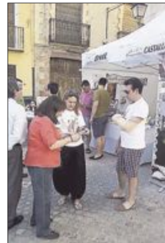
Estands de Onil y Castalla en la plaza del Ayuntamiento de Onil