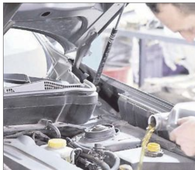
Antes de afrontar la operación salida, asegúrate de que tu coche está en perfectas condiciones para viajar

Recordemos: un mantenimiento regular evitará reparaciones costosas y averías inoportunas. Buen viaje.