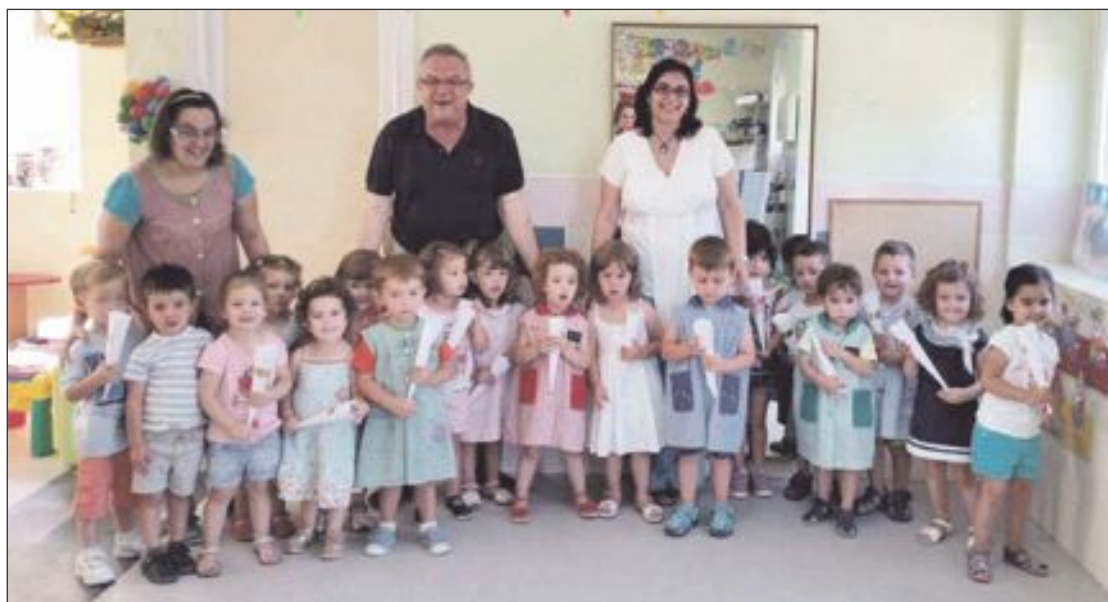
El alcalde y la concejal de Educación con alumnos de Infantil tras la entrega de los cucuruchos de peladillas

Valencia, impartirá una clase y por la noche, habrá concierto de 2i2 quartet. El día 16, Roberto Pacheco dará una clase magistral sobre 'Iniciación a la improvisación como lenguaje de comunicación'. Después, concierto de Art of Brass Valencia .