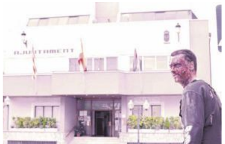
El alcalde zombi a punto de comenzar su eterna legislatura