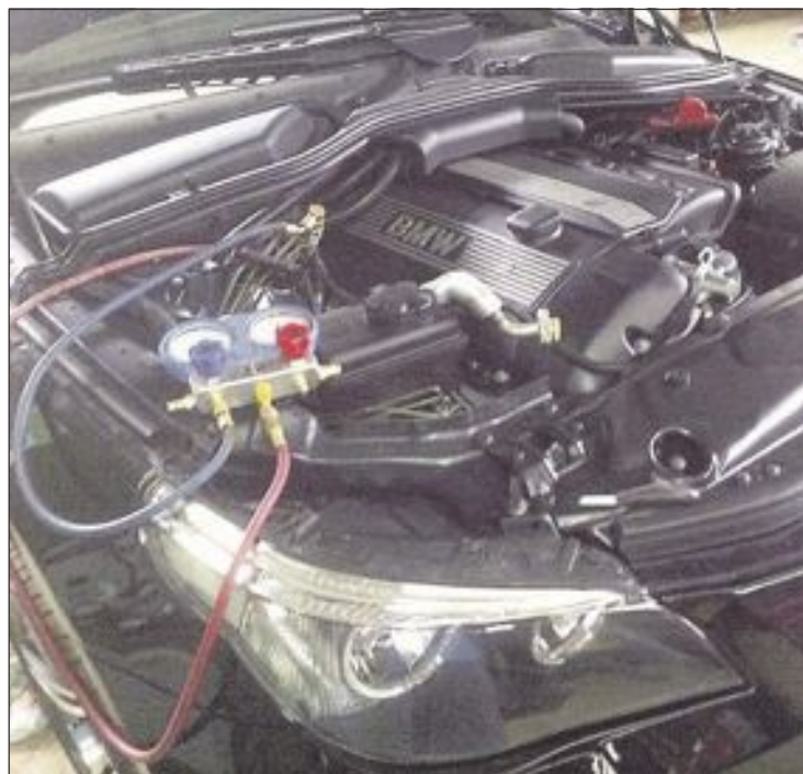
Una característica que indica un mal funcionamiento del aire acondicionado es que no enfríe o que emita un olor parecido al vinagre

ajuste de carga de gas del fluido refrigerante, es fácil notar que "ya no enfría como antes".