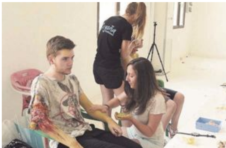
El equipo de Estética Begoña se encargó de la caracterización de los zombis