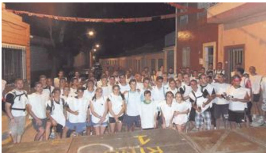
Los supervivientes esperan las instrucciones para acometer la última de las pruebas