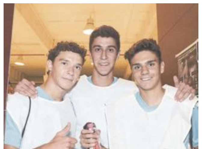
Ganadores de la Yincana