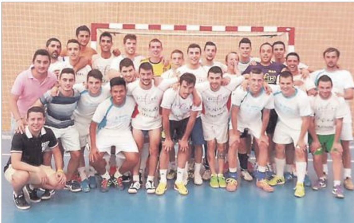
Equipos participantes en la final de fútbol sala: PFH-Ca Abraham-Erjutoys y Construcciones Montero-La Cantera