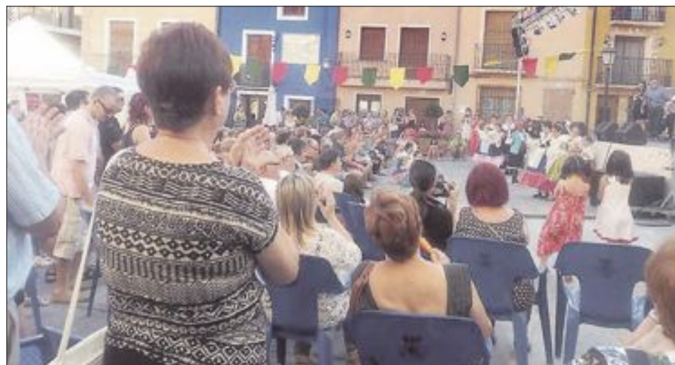
Las actuaciones musicales y de grupos folclóricos locales se celebraron en la plaza de España