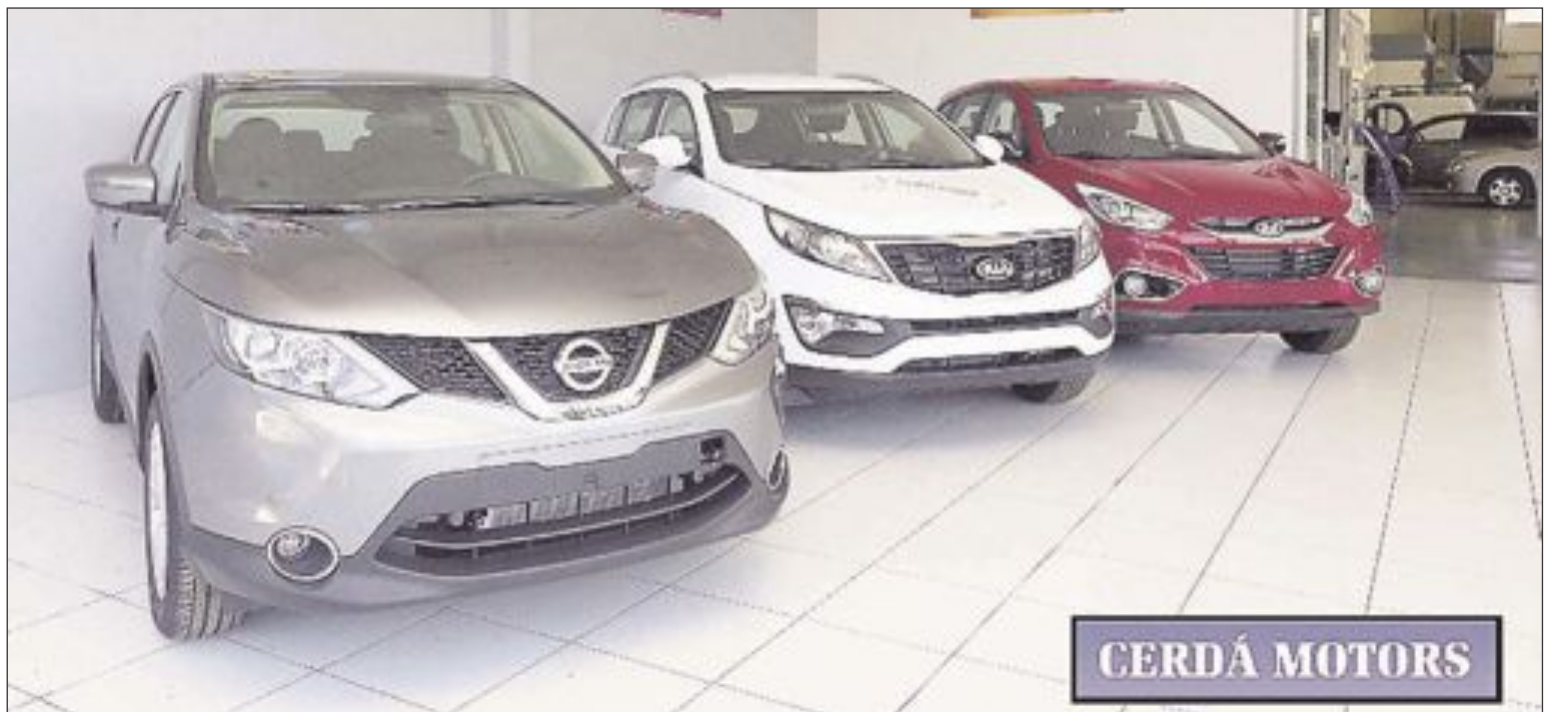
Vista parcial de la amplia exposición de vehículos nuevos y de ocasión que puede encontrarse en Cerdá Motors