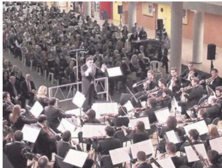
La prestigiosa Orquesta Sinfónica de Elda interpretará esta gran partitura