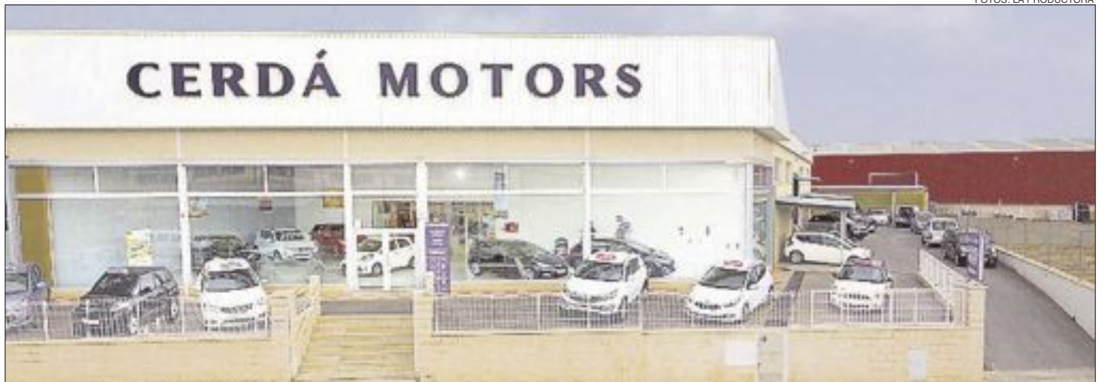
Las instalaciones de Cerdá Motors están ubicadas en la calle Colonia, número 5, de Castalla

Hasta el 30 de agosto, Cerdá Motors ofrece una interesante promoción: con el cambio de cuatro neumáticos o con la revisión periódica completa del vehículo, obsequio de dos placas de matrícula acrílicas o regalo equivalente. Además, recarga de aire acondicionado por sólo 49 euros. Para más información: 96.656.07.72, 96.654.30.48, 96.656.09.11 (fax). Correo electrónico: info@cerdamotors.com .