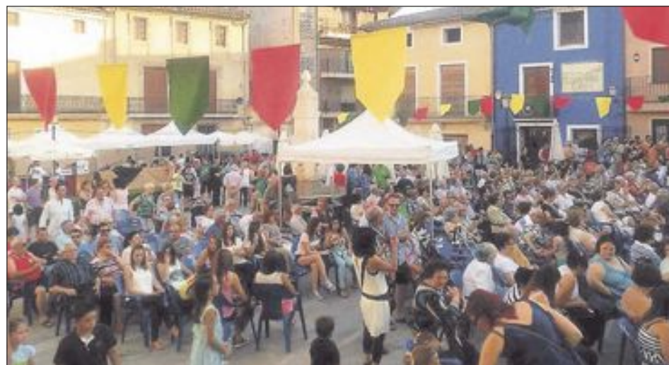
Cientos de personas asistieron a las actuaciones, prolongando la jornada durante toda la noche