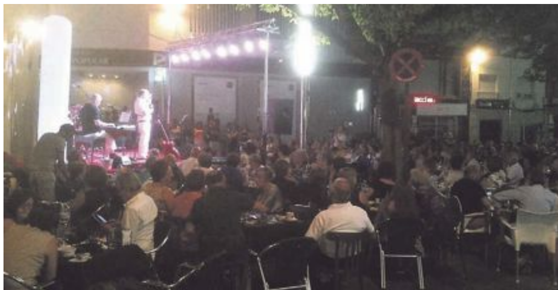
Actuación del grupo Els Carlos en la plaza la Palla en verano de 2014

Hasta el 2 de agosto puede visitarse en la tetería la Goullete, la exposición de carteles de trece ilustradores ibenses, realizados con motivo de la clausura de la temporada de proyecciones y actividades del Cine Club Layndon. Cada artista ha elegido una película o uno de sus mitos cinematográficos y le ha dado una vuelta de tuerca, creando una nueva obra de arte. Los trabajos están recogidos en el catálogo 'Kinetoscopio de papel'.