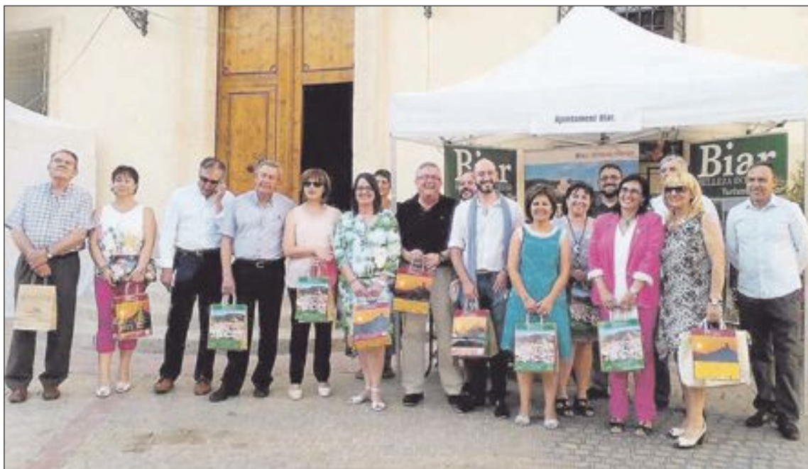
Todos los miembros de la corporación municipal en la plaza de la Constitución, donde este año hubo expositores

La Mostra contó con cerca de 60 expositores y una amplísima programación para todas las edades. Desde el mismo viernes por la noche, la afluencia fue constante, registrándose visitantes de localidades como Teulada, Monforte, Elche, Agullent, Yecla, Alcoy, Villena, Elda y de toda la comarca de la Foia de Castalla.