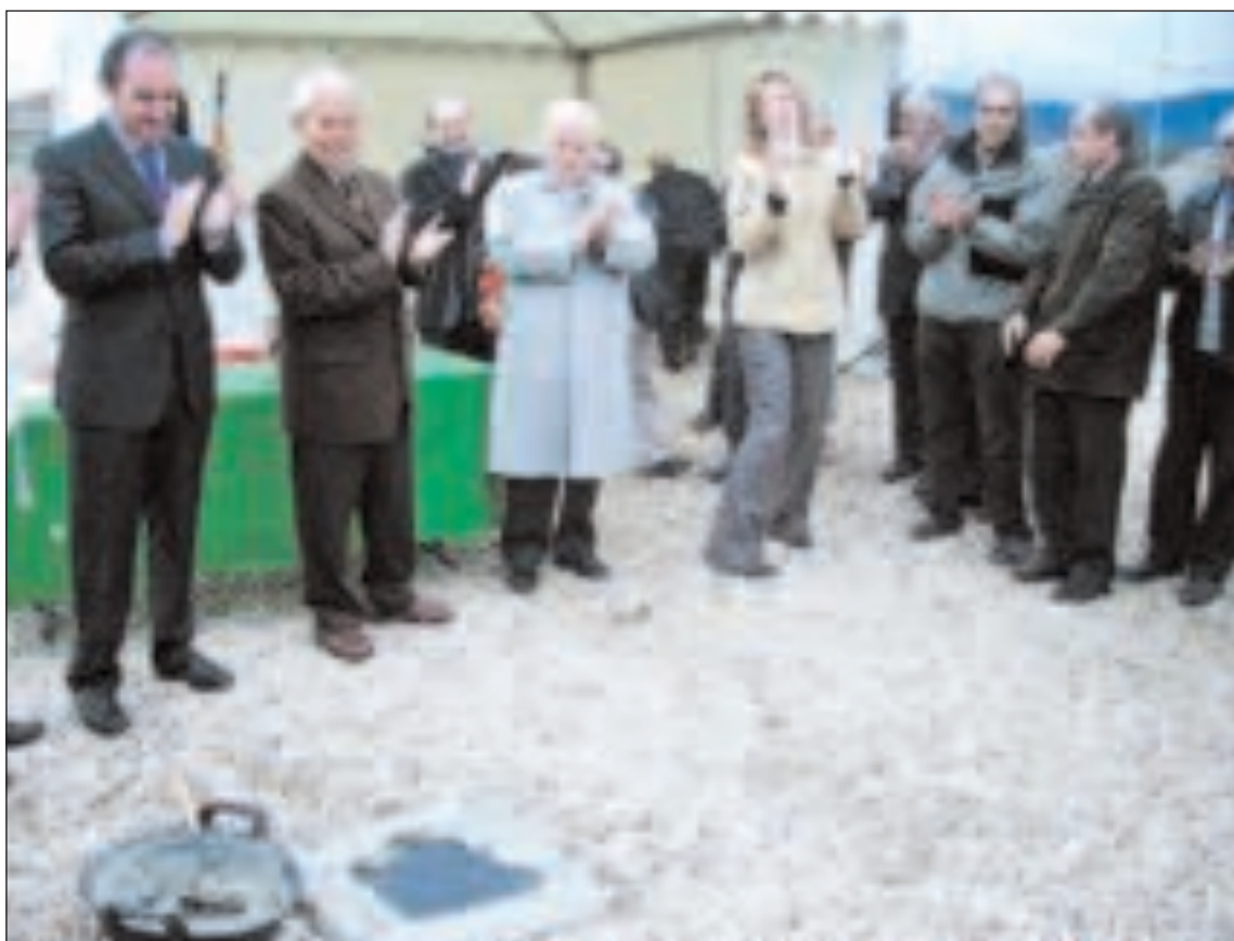
El alcalde, el presidente provincial, el presidente de Ecisa y varios concejales aplauden esta 1ª piedra

El Auditorio, cuyo proyecto fue aprobado en el Pleno de julio de 2006, con un presupuesto de cerca de 2.034.000 euros, tendrá capacidad para 452 espectadores en la platea y contará con un escenario de 182 m², capaz de albergar grandes orquestas y montajes teatrales de cierta envergadura.