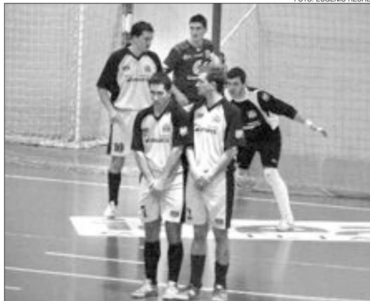
Jugada previa a un gol por parte del equipo ibense