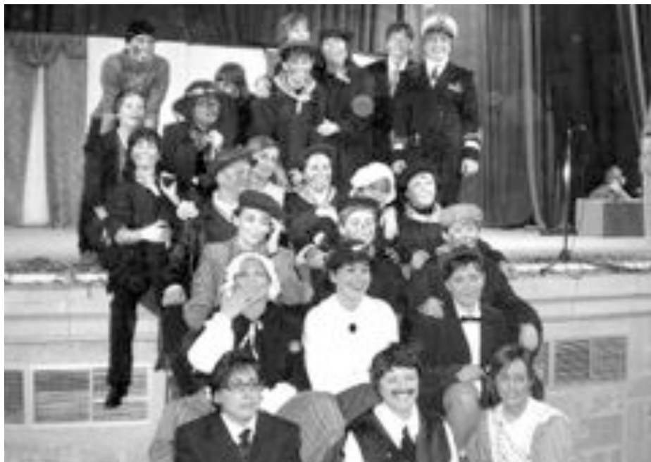
Grupo de teatro de madres tras la representación de la obra 'Mary Poppins'

Actualmente ambas entidades están inmersas en la preparación de tres nuevas piezas y coreografías para los capitanes de las comparsas Cruzados y Ligeros de Alcoy y otra para el Capitán Moro de San Vicente del Raspeig.