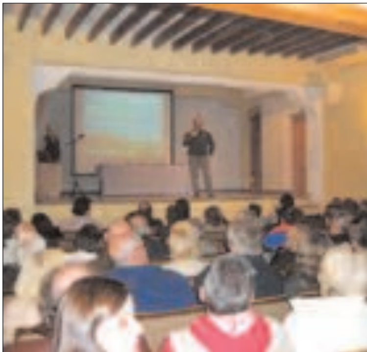
Más de 140 vecinos asistieron la semana pasada a la reunión que convocó el Ayuntamiento para presentar el proyecto del agua

Agregan que desde que están gobernando, "no han generado ni un sólo metro de suelo residencial". En el citado comunicado, los socialistas desmienten que los vecinos vayan a soportar el coste de la obra en la tarifa del agua puesto que "el proyecto se financia con cánones de urbanización que deberán pagar los urbanizadores". También desmienten que con la concesión, el Ayuntamiento se vaya a desatender del servicio y que habrá sobreexplotación de los pozos. Para vigilar la gestión, se constituirá una comisión que puede rescindir el contrato si el servicio no funciona.