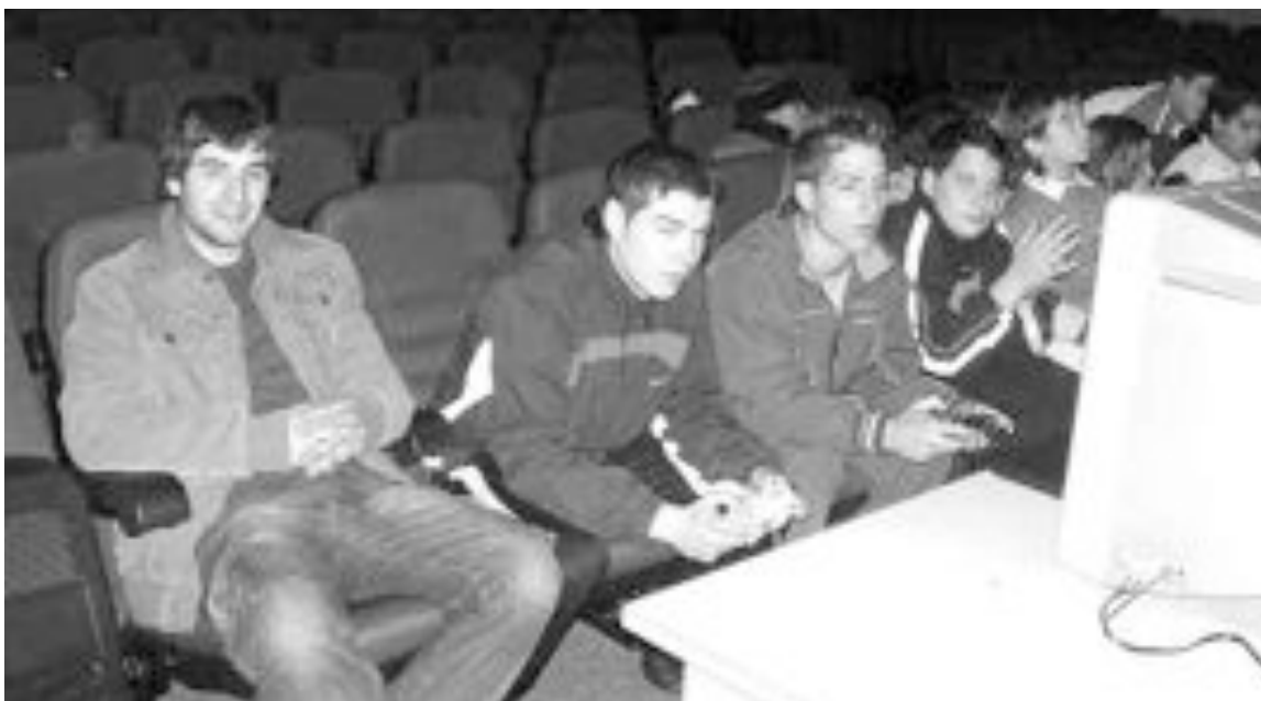
Algunos de los participantes en el campeonato de Play Station celebrado en Onil el sábado 27 de enero