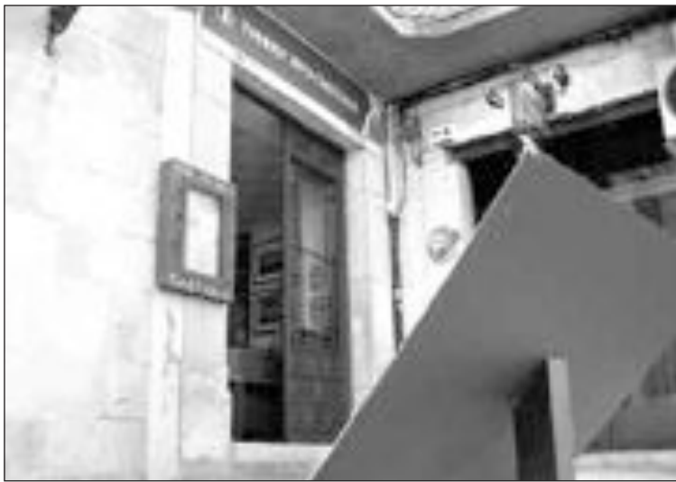
La Oficina de Turismo de Castalla está ubicada en la plaza Mayor

Las visitas se dispararon en 2005, con 6.650 personas, y se ha mantenido la progresión positiva también en 2006, si bien el número de visitantes fue tan sólo de 93 personas más. La causa principal del espectacular crecimiento de visitantes en 2005 (3.069 más respecto a 2004) fue, según las mismas fuentes, la Recreación Histórica de las Batallas