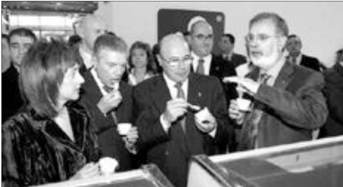
La alcaldesa ibense y la comitiva prueban algunos de los helados de la muestra de más de 200 sabores

Con este centro, ubicado en Xixona, se pretende dotar a la industria de “equipamiento e infraestructuras de primer orden que propicien la implantación de actividades productivas que incrementen la competitividad, la generación de empleo y el desarrollo económico”, explicaba Justo Nieto.