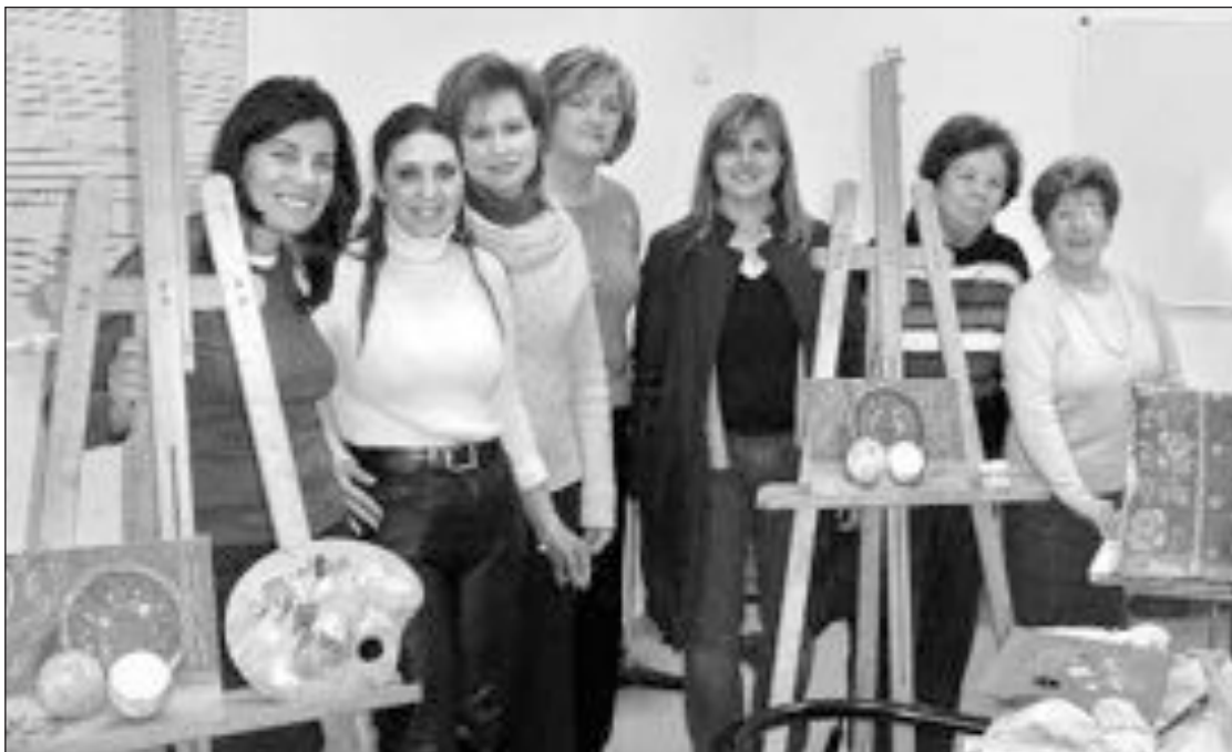
Asistentes al taller de pintura

Para más información, las interesadas deben dirigirse al departamento de Servicios Sociales, ubicado en el Centro Social Polivalente.