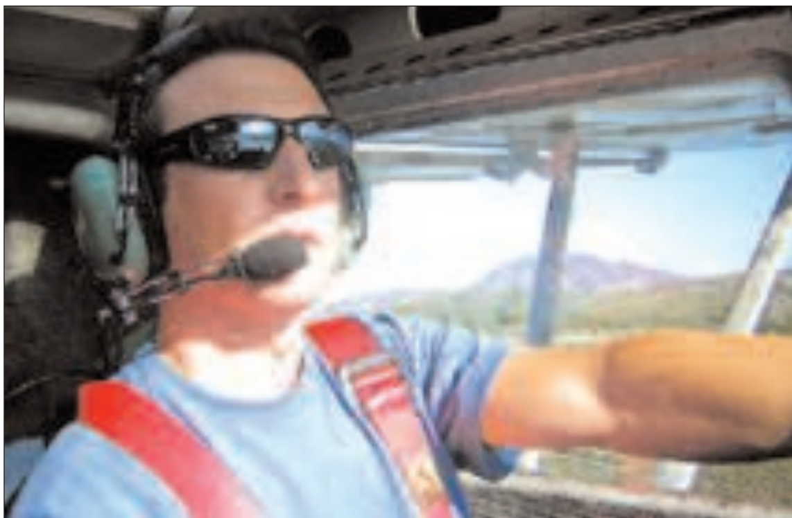
Cada domingo sin falta, este empresario se transforma en un experimentado piloto

pasar que te hace olvidar todos los problemas".