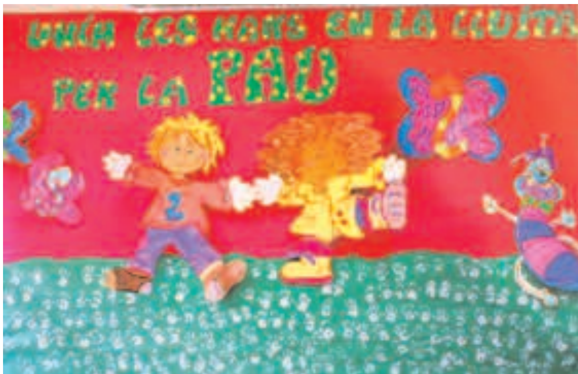
Mural realizado por los alumnos de 1º y 2º de Primaria del colegio San Juan y San Pablo