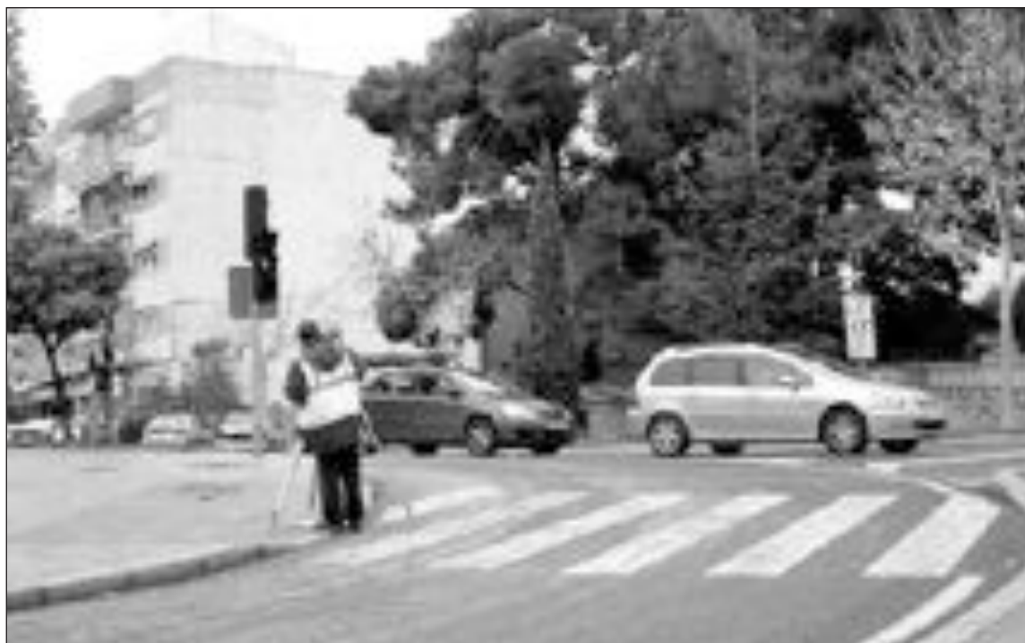
Estos días se está procediendo al replanteo de la zona para comenzar a mediados de febrero las obras

ción de las obras está previsto que duren dos meses y medio, por lo que será a finales del mes de abril cuando terminen los trabajos y la nueva rotonda se abra al tráfico rodado.