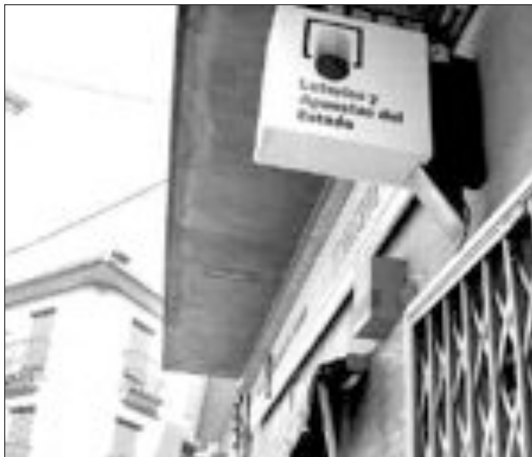
La administración de Castalla seguía cerrada esta semana

El caso levantó un gran revuelo en Castalla, donde el presunto estafador consiguió hacerse con la confianza del lotero de la localidad y se llevó 15.000 décimos para el Gordo y el Niño, participaciones que no pagó. Dada la elevada deuda de la administración, la Organización Nacional de Loterías y Apuestas del Estado decidió clausurar la administración mientras no se salde la deuda.