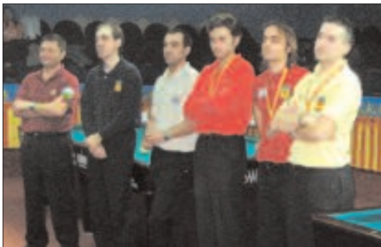
Los seis participantes en las rondas celebradas en el hotel Caseta Nova

El primer partido de liga se disputará el sábado 3 entre el Caseta Nova y el CB Idella.