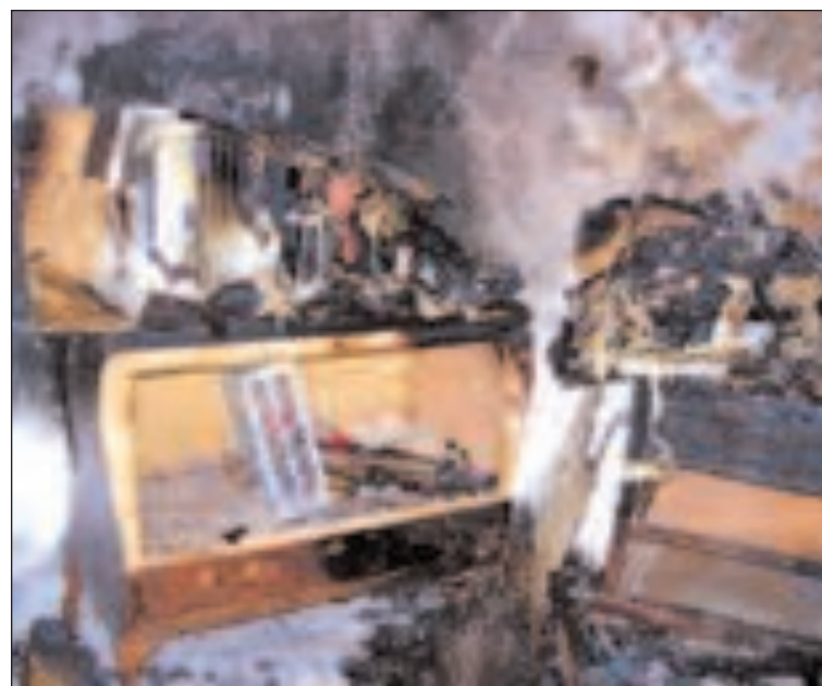
Estado de algunos muebles quemados tras el incendio en el sótano

En el trastero se quemaron muebles antiguos y otros enseres que almacenaba la familia. Los padres y la niña están actualmente viviendo en casa de unos familiares en Alicante a la espera de asear su vivienda.