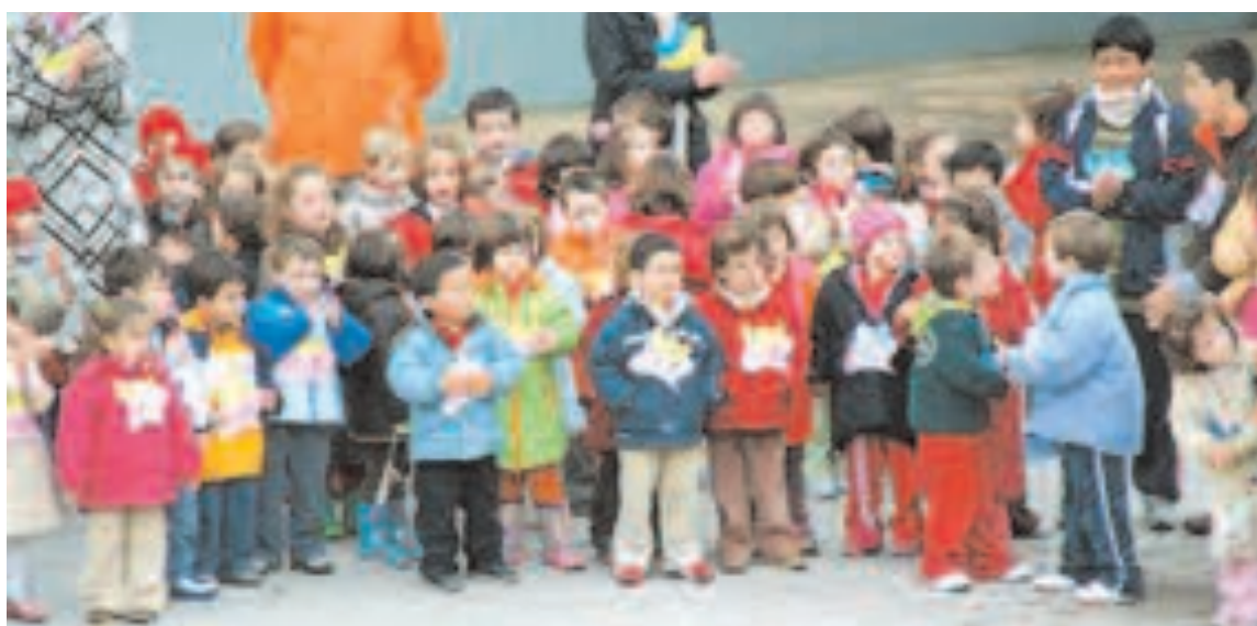
Los más pequeños salieron al patio con la paloma de la paz que ellos habían dibujado