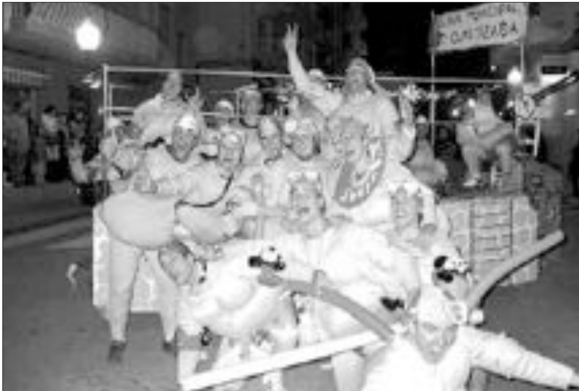
El pasado año la verbena de Carnaval se celebró en la plaza de la Palla

Asimismo se otorgará un premio de 300 euros al mejor grupo de más de 6 personas, seis premios de 70 euros en la categoría libre y un último de 350 euros al mejor elemento creativo de elaboración propia