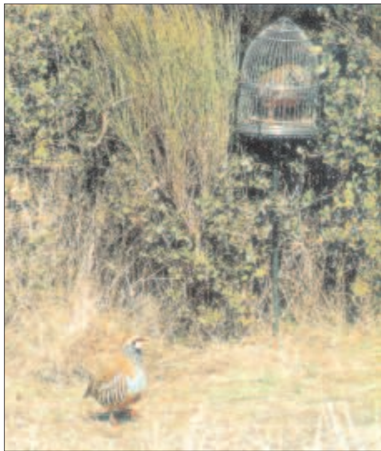
El reclamo (en la jaula) ha atraído con su canto al macho a la plaza

En el campo de tiro se construirá un cercón donde se colocará el reclamo, mientras que los jueces y los participantes estarán camuflados. Los aficionados podrán seguir el desarrollo del campeonato desde el bar del campo de tiro, gracias a que habrá dos cámaras de televisión recogiendo las imágenes.