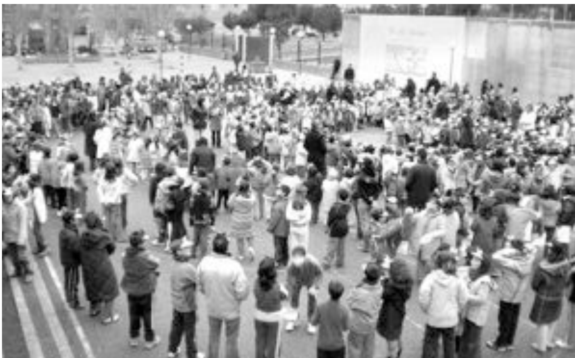
Los alumnos de infantil formaron una paloma de la paz en el patio acompañados por el resto de alumnos