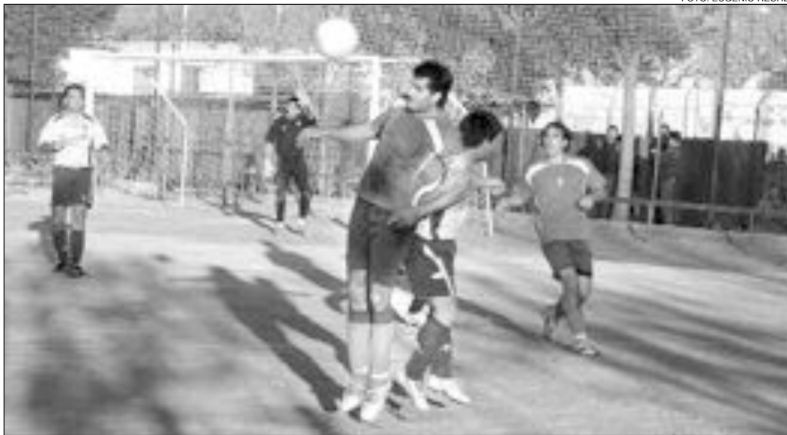
Imagen de archivo de un partido jugado por el Rayo Ibense