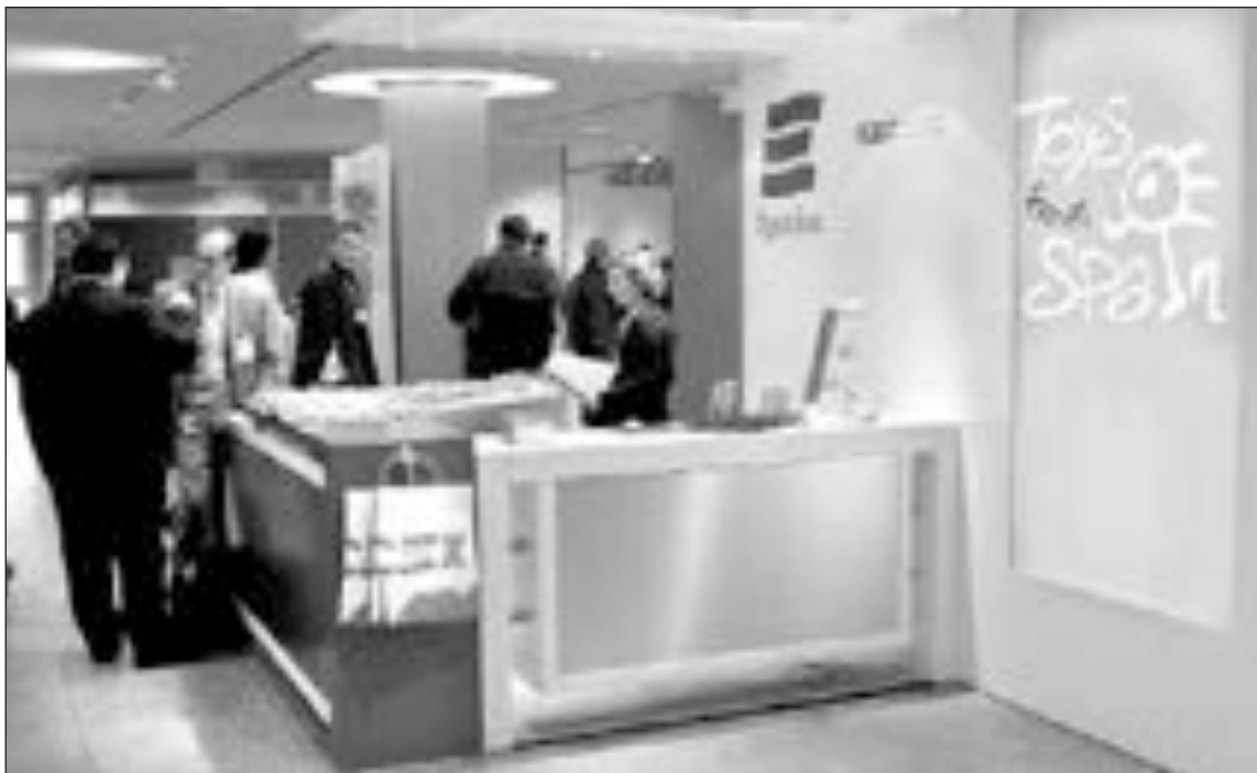
Stand de la Asociación Española de Fabricantes de Juguetes y del ICEX en la feria de Nüremberg del pasado año

Los países europeos siguen siendo el mercado principal de las exportaciones nacionales, representan el 70 por ciento de las ventas del sector y a pesar del fuerte estancamiento