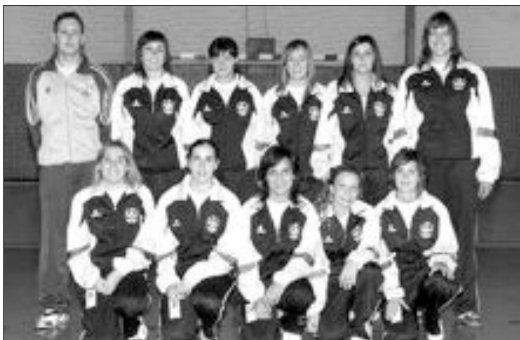
Plantilla del equipo Sénior Femenino

Sénior Femenino. Dos partes notablemente diferenciadas las que jugó el Teixe en su partido