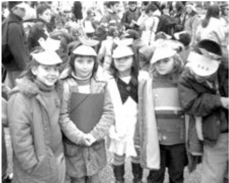
Cada niño se ha hecho una visera con motivos de la paz

Después interpretaron todos la canción de la Paz de este año, composición creada por el profesor de música del Virgen de la Salud. También se cantaron otros temas que los niños habían aprendido los cursos anteriores. Como es costumbre, se leyeron las redacciones selec-