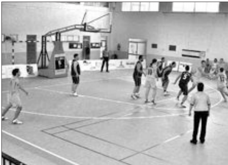
El Sénior B ganó en la prórroga al Altea

Sénior Masculino. Comenzaron ganando de 13 y 14 puntos tres cuartos de partido, hasta que el Altea plantea una zona, en la el Onil B no puede apenas sumar puntos. El Altea consigue ponerse por delante, pero en los últimos instantes empataron los locales, con la consiguiente prórroga. La prórroga se sucede con ventajas alternas y, en los últimos instantes, la buena defensa del Onil B consigue recupe-