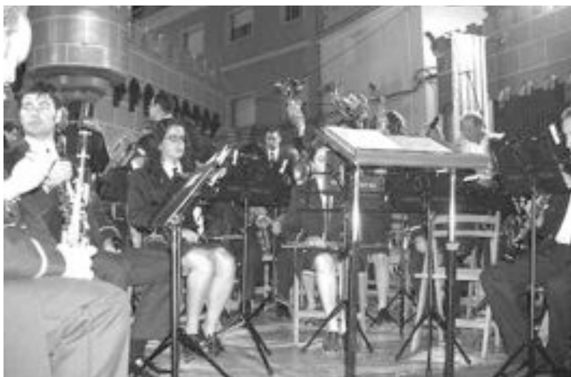
La Unión Musical de Ibi durante el concierto de Fiestas, en una imagen de archivo

La Unión Musical de Ibi fue seleccionada, mediante sorteo en noviembre del pasado año,