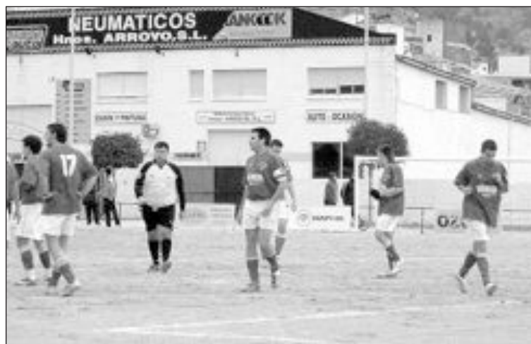
Los colivencs perdieron en su campo el pasado domingo

aliento a tiempo vale su peso en oro. Sin embargo, parecía que el Onil se iba a llevar el gato al agua, puesto que Molles inauguró el marcador en el minuto 15. A la primera parte se llegó con empate a 1. El otro gol del Onil fue obra de Carlos, en el 40 de la segunda parte, y el Vallada desempató en el descuento.