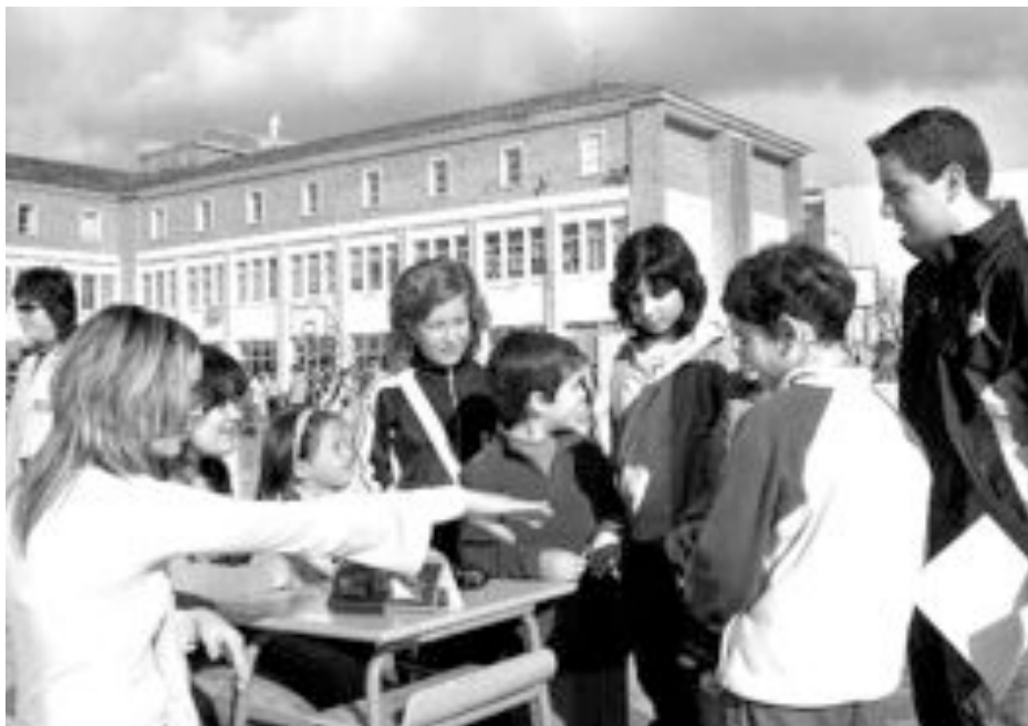
El patio del colegio Salesiano se convierte en el centro de la fiesta de Don Bosco