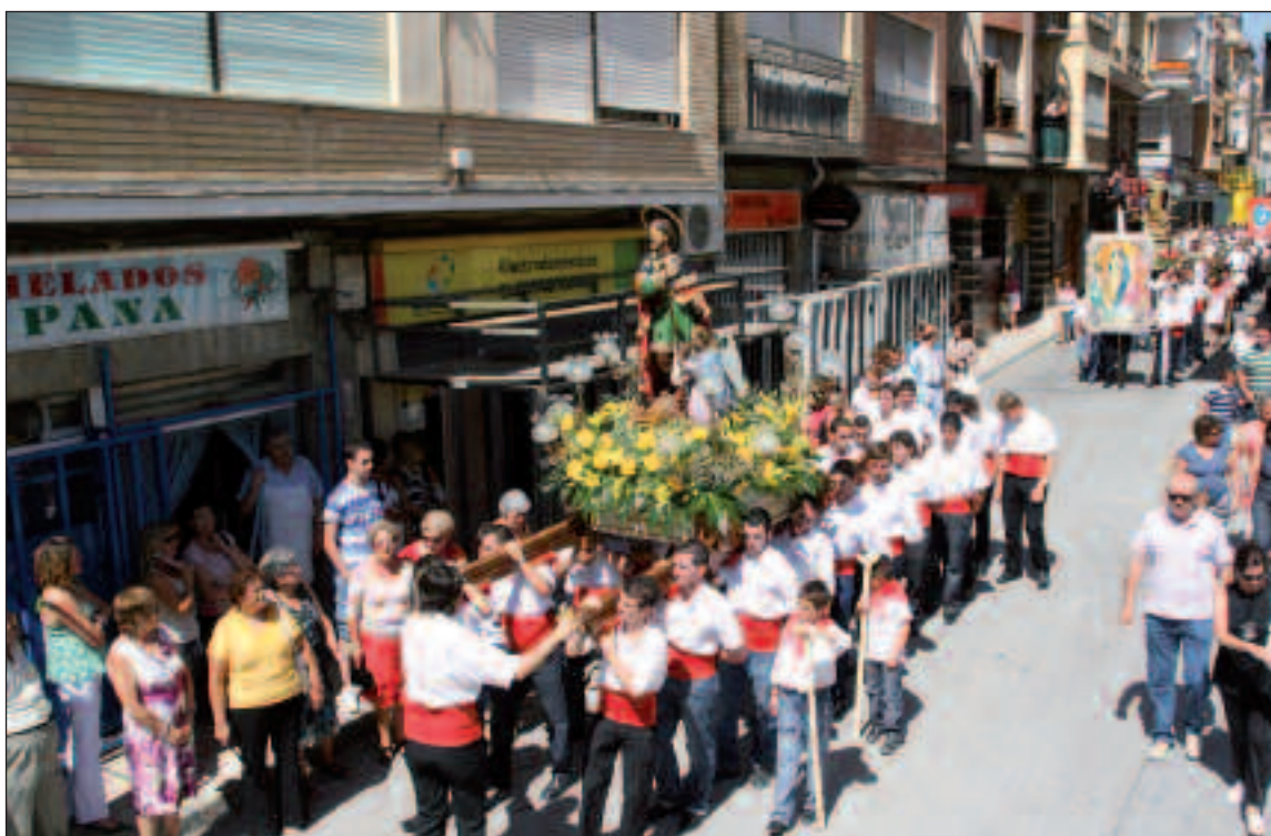
Numerosos fieles siguieron la procesión en honor a San Roc y la Virgen de la Asunción