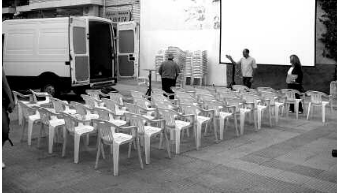
Las proyecciones en la plaza La Foia comenzarán el 2 de septiembre

Como en la primera edición, también habrá una exposición