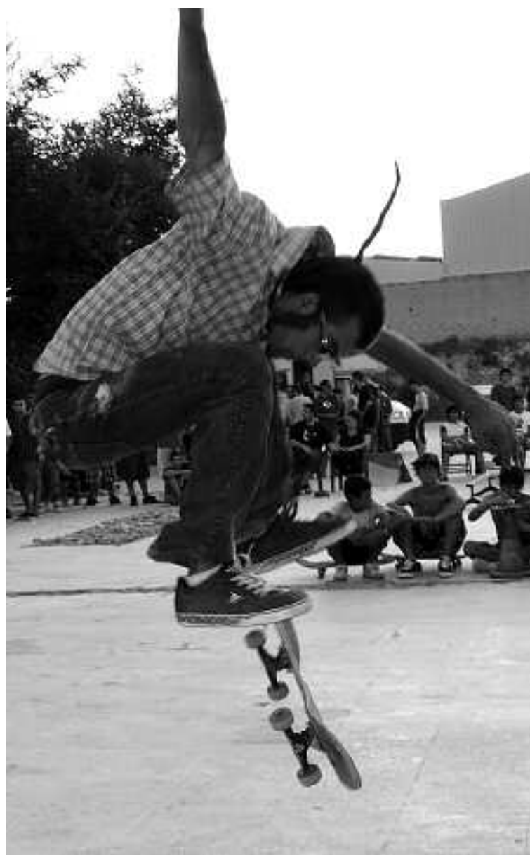
Un skater realiza un truco ante la mirada de los asistentes

Grupos de Elche, Alcoy e Ibi animaron la noche tras la paella gigante que la organización encargó a Presi Naka. Los grupos Zotas, CWK, Santa Morte, La Plaga y Trikona, en ese orden, actuaron en directo para las 150 personas que, aproximadamente, acudieron a disfrutar de esta fiesta del skate, la música y el graffiti. De hecho, durante la competición, participantes y asistentes pudieron disfrutar de las sesiones con las que DJ Xinoh puso ritmo a la competición. Al final, las negociaciones entre miembros de la organización y las Fuerzas de Seguridad forjaron una relación de mutuo respeto que permitió alargar el evento hasta altas horas de la madrugada, dejando a los asistentes muy contentos con la competición y la fiesta organizadas.