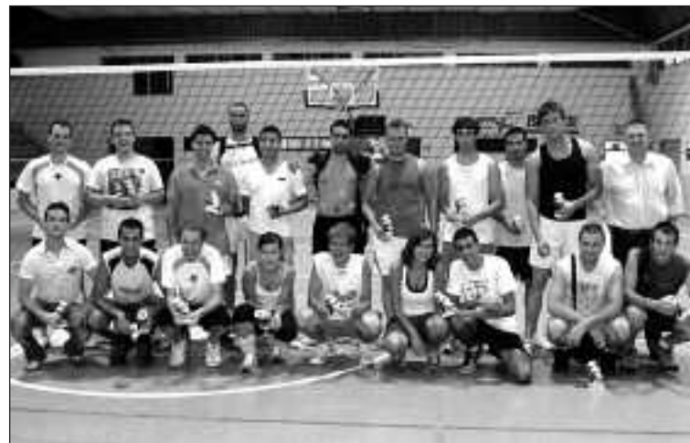
Los dos conjuntos finalistas de las 24 Horas de Voleibol de Onil posan en la entrega de trofeos

El momento cumbre del torneo llegó con la gran final. Dado el alto nivel que los dos