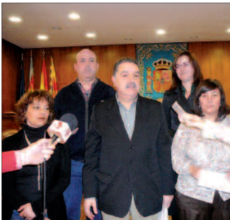
Concejales del PSOE tras una sesión plenaria

Para el Grupo Municipal Socialista, esta modificación puntual del PGOU, encierra "una auténtica aberración