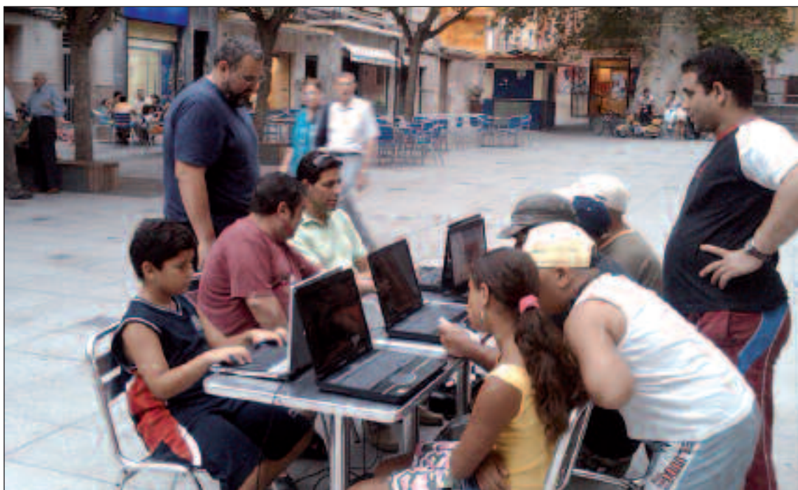
La Plaza de la Palla es el primer espacio público de Ibi con servicio wi-fi

Este año, cuatro niñas y siete niños pasan sus vacaciones de verano en Ibi. A mediados de julio, fueron recibidos por la alcaldesa y la concejal de Servicios Sociales.