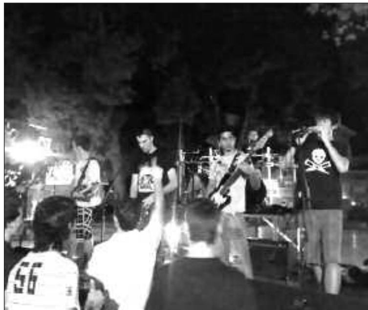
Imagen de la actuación de Plan Kásual , uno de los grupos que han actuado en las 'Noches de Música en El Kiosket', concretamente el pasado sábado 15 de agosto junto con Vergüenza Ajena .

Esta iniciativa promocinará el festival IbiRock'09, que vuelva a celebrarse en Ibi con más de 15 grupos locales, los días 18 y 19 de septiembre, en el Parc de les Hortes.