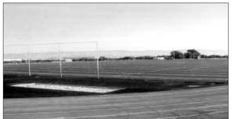
Las 24 Horas de Fútbol 7 se disputarán en el campo de césped artificial.