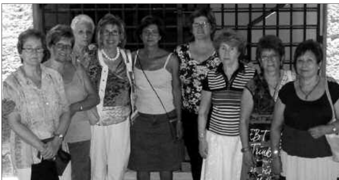
La alcaldesa junto a integrantes de la asociación de Amas de Casa, que ayudan a repartir la sandía a los niños