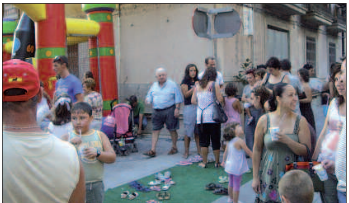
Los más pequeños pudieron disfrutar de un castillo hinchable emplazado en la Calle Mossen Guillem