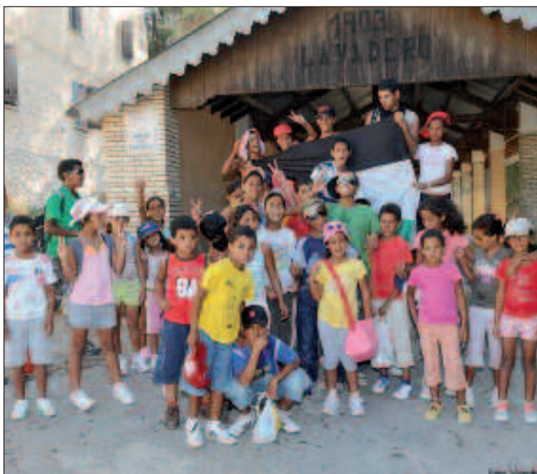
Los niños saharauis, delante del lavadero municipal, durante una excursión