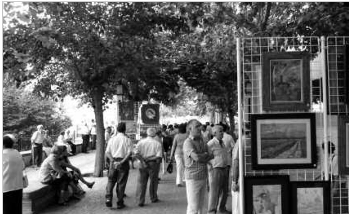
El certamen de pintura aglutinó a numeroso público