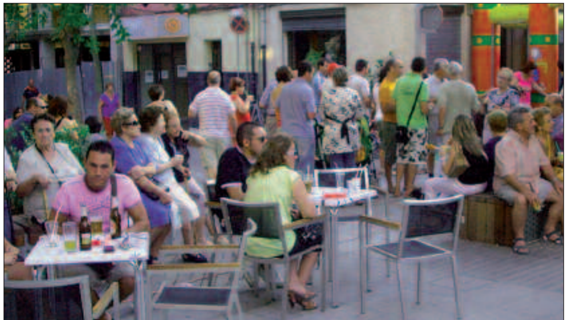
Durante la fiesta, amenizada con música, se repartieron helados y granizados entre los asistentes a la celebración