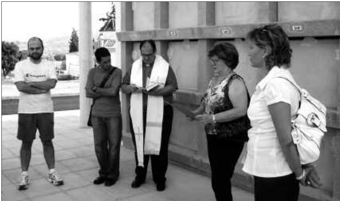
La alcaldesa junto a los concejales y el cura párroco durante el acto de inauguración de los nichos y osarios

El proyecto, que ha contado con un presupuesto de 248.005 euros, se incluye dentro del Fondo de Inversión Local, conocido como Plan E; un proyecto del Gobierno que busca reactivar sectores muy perjudicados por la crisis económica como es el caso del sector de la construcción. Para ello, la constructora adjudicata-