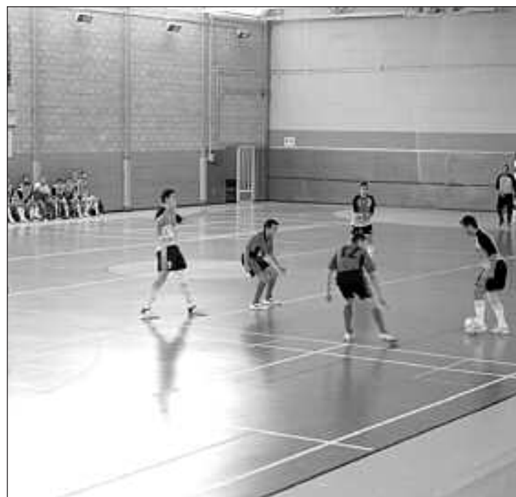
Imagen de un partido entre la U.D. Ibense y el Papas la Muñeca

Otra intención del club es empezar con un equipo Cadete. Las pruebas para este equipo se llevarán a cabo la siguiente semana, aunque aún no se saben los días concretos ni el lugar donde se harán. Toda la información se podrá ver en la web del club, www.ibifs.com