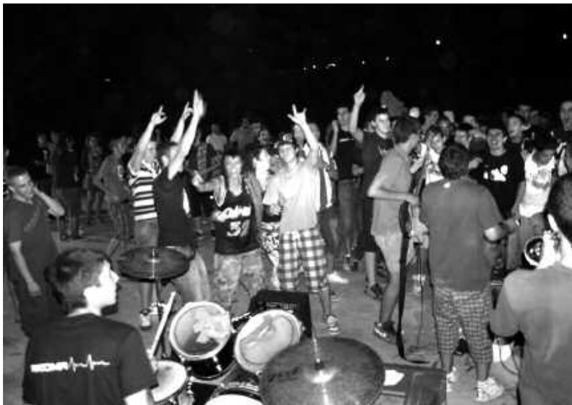
Trikoma, uno de los grupos que tocaron en la fiesta del skate ibense, durante su actuación