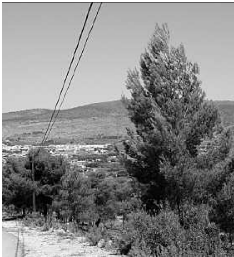
El nuevo depósito se construirá en la zona de Els Plans de Ibi

En segundo lugar, se organizará un periodo de participación pública en el que 97 grupos y asociaciones locales (tales como la Agrupación Fotográfica, la Asociación Ornitológica o la Protectora de Animales) podrán exponer sus propuestas para que la ejecución del proyecto se efectúe de la mejor manera posible.