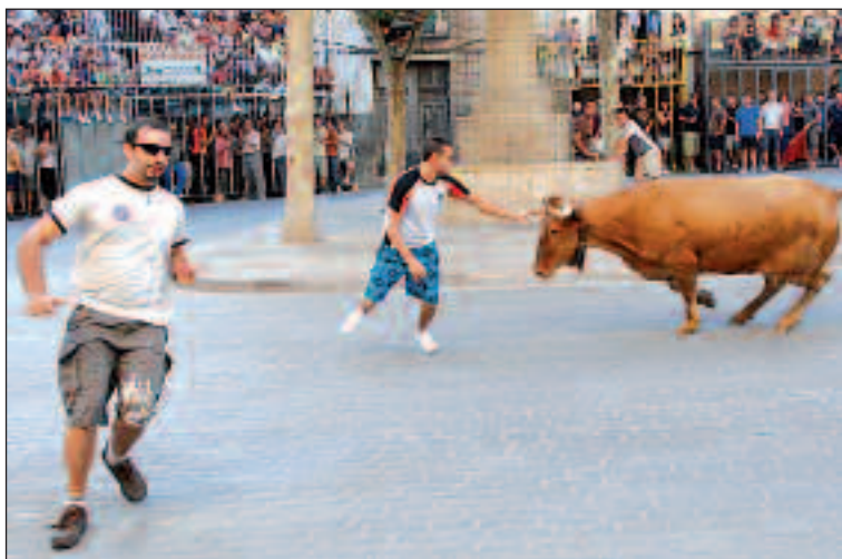
Este año se han reforzado las medidas de seguridad y se ha establecido una edad mínima de participación para evitar posibles accidentes

Según el festerio, no se esperaba salir este año como pregonero, aunque ha aceptado el cargo con mucha gusto e ilusión.