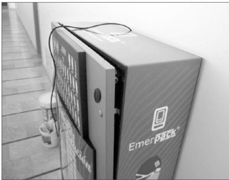
La máquina de artículos acuáticos ha quedado inservible

El primer robo tuvo lugar hace tres semanas y, en esa ocasión, los autores lograron apoderarse de más de 500 euros que había en un despacho, dinero procedente del cobro de las entradas y para