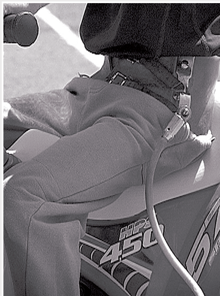
Los artículos infantiles más solicitados son las motos, los coches, los triciclos y las bicicletas

La conselleria de Industria, a través del IMPIVA, va a destinar en 2011 un total de 43,6 millones de euros a apoyar la labor de investigación, estudio y asesoramiento que realizan los institutos tecnológicos de la Comunidad Valenciana.