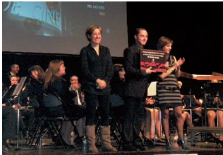
La alcaldesa y la concejal de Educación entregaron placas conmemorativas

Interpretaron conjuntamente las piezas Braveheart , Piratas del Caribe y Tarzán y, al finalizar, los alumnos cantaron el tema Luna Mediterránea , de Teodoro Aparicio, una canción dedicada a la paz que emocionó a todos los presentes.