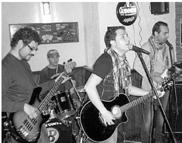
Actuación del grupo La Duda , de Alicante, en el pub Black Rose

Los del Medio , un grupo ibense que cultiva un curioso estilo rumbero con denominación de origen, tendrá que competir con el pop-rock de los alicantinos Arenae , con la ventaja de que 'juegan' en casa. Por último, Kubbe también es un grupo de Ibi, con sonidos de metal extremo.