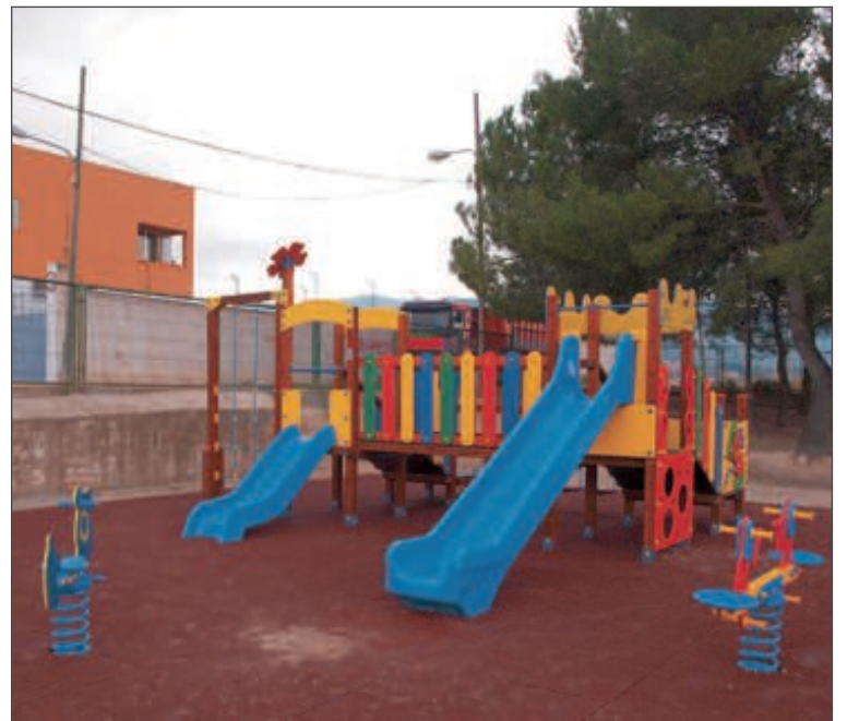
Los juegos se han instalado en el patio de los alumnos de Infantil

Cuando finalicen los trabajos en este parque, los alumnos del taller de empleo se trasladarán a la Glorieta Fofó para realizar allí otras actuaciones encaminadas a su mejora y remodelación.