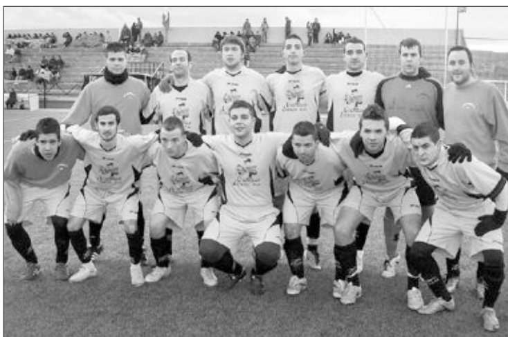
Once inicial de la Peña Madridista de Ibi en el partido contra el Bocairente

mera parte excelente, siempre intentando jugar la pelota con criterio y materializando su juego combinativo con ocasiones. Con este resultado aparentemente cómodo llegó el descanso. Con el Agullent recortando distancias, el árbitro decidió convertirse en protagonista del partido y echarles una mano a los visitantes, pitando un manos inexistente y echando a Txema sin motivo, de modo que el Castalla CF se desmoralizó y acabó cediendo.