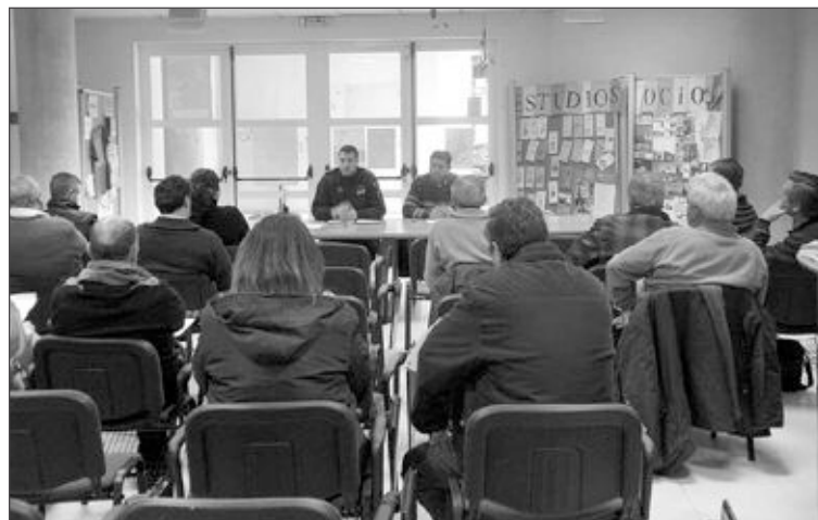
La reunión con empresarios de Los Vasalos tuvo lugar el 28 de enero

-Solicitar la colaboración ciudadana, que resulta "de