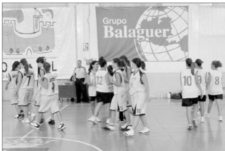
El Júnior Femenino ha acabado la primera fase con una notable mejoría