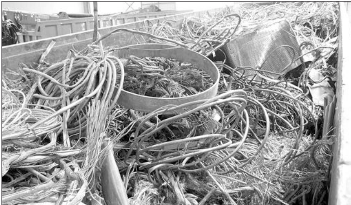
El cobre ha triplicado su valor por la fuerte demanda que existe en el mercado

Este es el segundo robo que se registra en el polígono