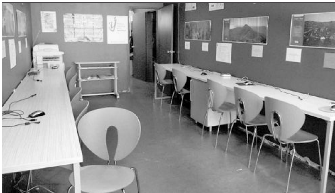
El Centro de Información Juvenil dejará de prestar el servicio hasta que se reponga el material