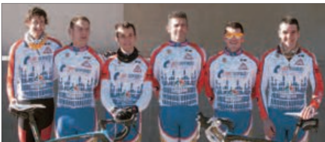
Equipo de carretera del C.C. Tibi

El Club Ciclista de Tibi agradece la colaboración de sus patrocinadores: