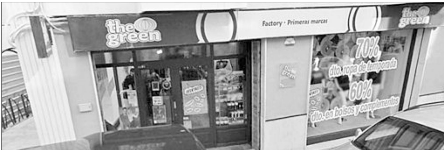
The Green está ubicado en la calle Tibi número 3 de Ibi