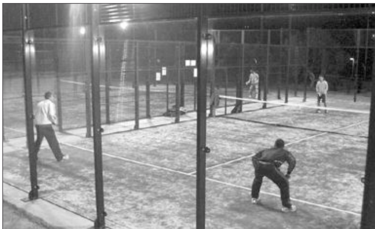
Momento de un partido de pádel en las nuevas pistas de Onil

Asociación Intercomarcal para la Colaboración Policial (AI-COP), medidas efectivas y con la celeridad suficiente de intercambio de información, prestación de material y colaboración policial.