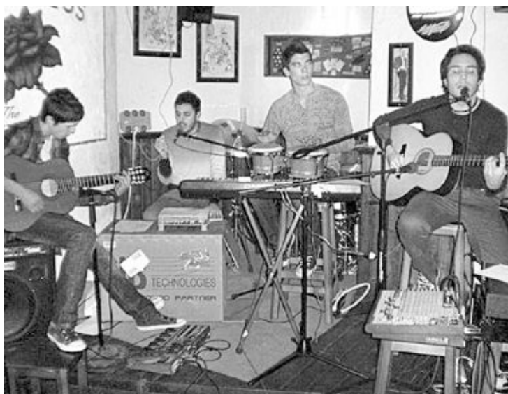
El grupo Nynphea , de Muro de Alcoy, durante su concierto acústico