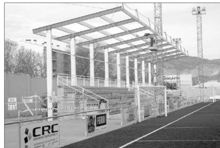
Las obras avanzan a buen ritmo y estarán acabadas en un par de semanas