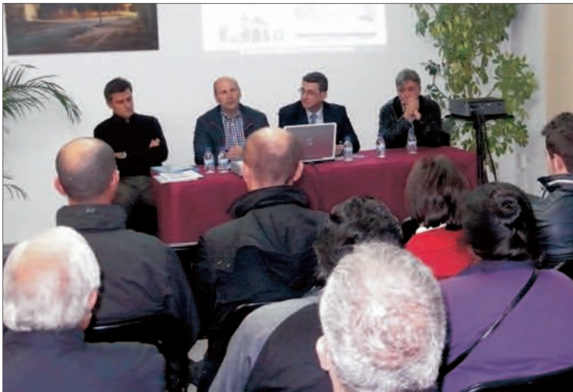
A mediados de enero se presentó el proyecto de las 22 VPP en la Casa de Cultura de Castalla