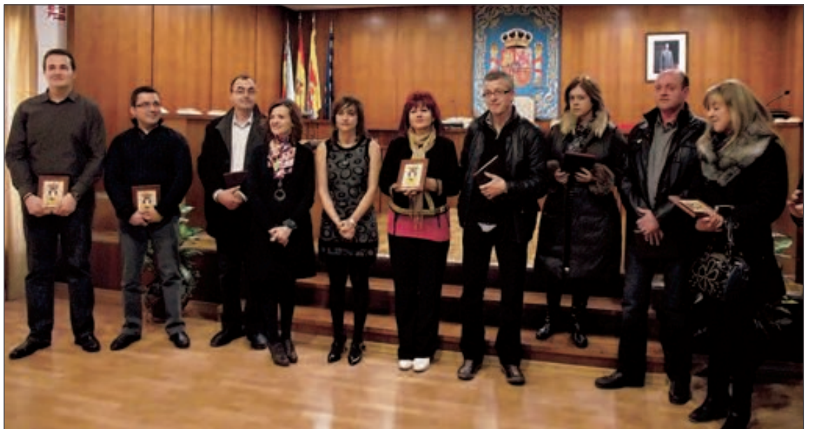
La alcaldesa obsequió a los comerciantes premiados con una placa conmemorativa

ha sido el municipio con más comercios premiados de la Comunidad Valenciana y les felicitó por su dedicación y profesionalidad. La primera edil les obsequió con una placa conmemorativa. Los comercios son: Pienso Sanjuán, Fernando Ramírez Joyeros, Estilor Joyeros, Deo Moda Joven, Charcutería Marín, Electrodomésticos Ibitel, Ibi Ópticos y Ruíz Fotografía.