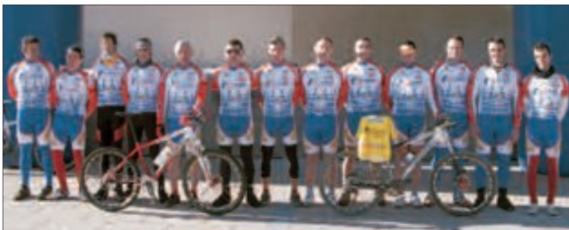
Equipo de BTT que disputará el open de la Comunitat Valenciana, Campeonato Autonómico XC y Maratón