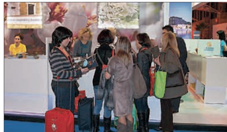
El stand de Castalla en Fitur fue muy visitado

"Ante esto, Fermed propone que ciertos ejes transeuropeos de mercancías sean considerados como prioritarios y puedan acceder a las subvenciones que desde Europa se están dando a otros ejes", concluyó el diputado provincial.