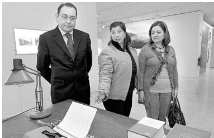
La exposición puede visitarse hasta el 27 de marzo

Valor aglutinó en su persona el cultivo de campos fundamentales para la recuperación de la lengua y la cultura, además de su tarea como periodista en publicaciones como 'El Tio Cuc', 'El Luchador', 'El Camí', 'La República de les Lletres' o la revista