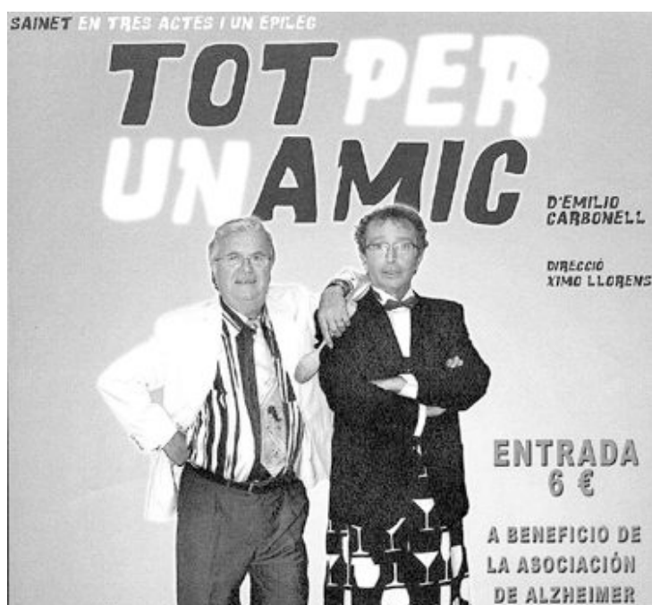
Obra del cuadro escénico de la Asociación Sant Jordi

Este viernes 4 de febrero en el Centro Cultural