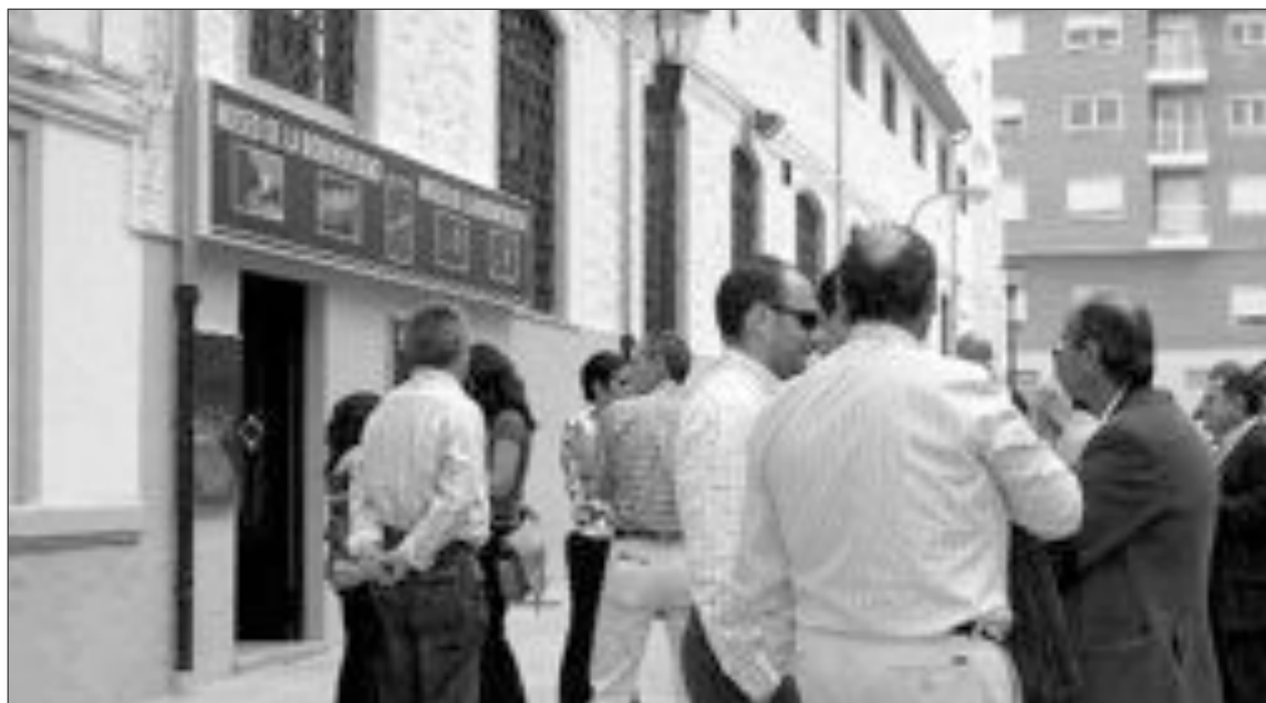
Entrada del futuro Museo del Juguete, en la fábrica Payá