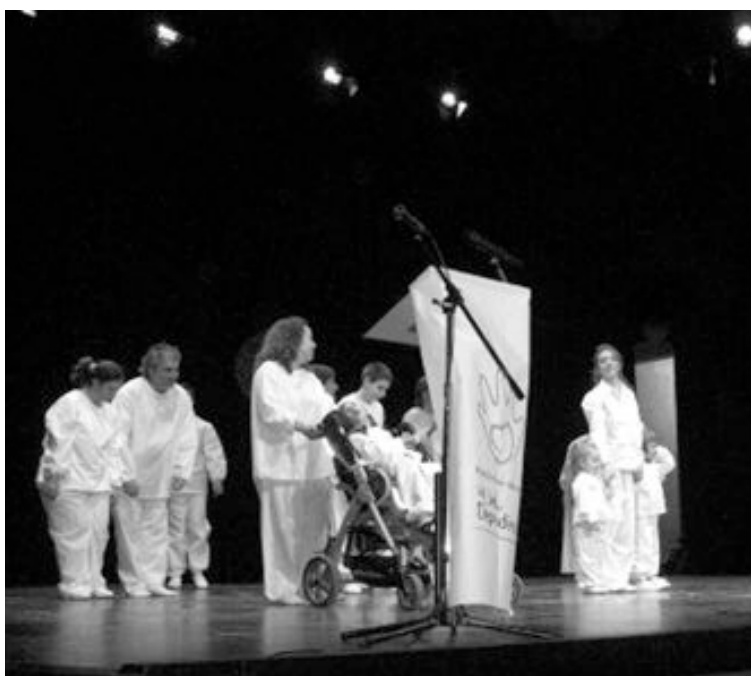
Actuación del grupo Faula Teatre en el Centro Cultural de Ibi