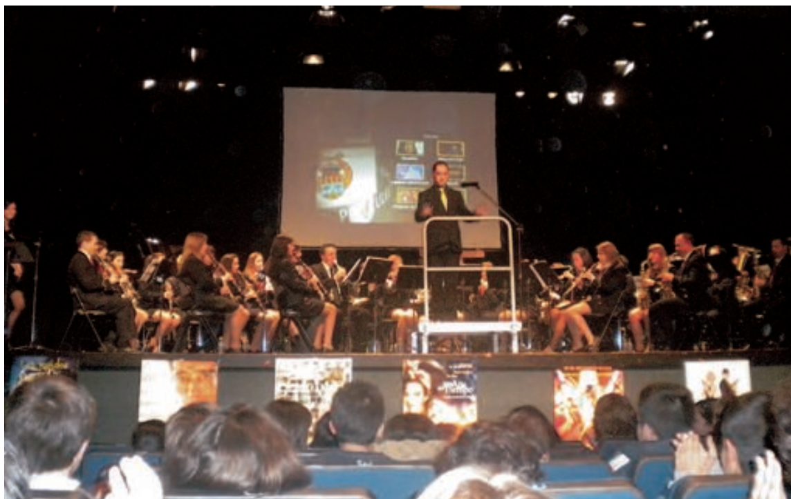
Más de 400 personas asistieron al concierto pedagógico que se celebró el pasado sábado por la tarde

VIDEO CLUB C/. Tibi, 8 • Tel. 96 633 82 09 • IBI www.mundocineibi.com