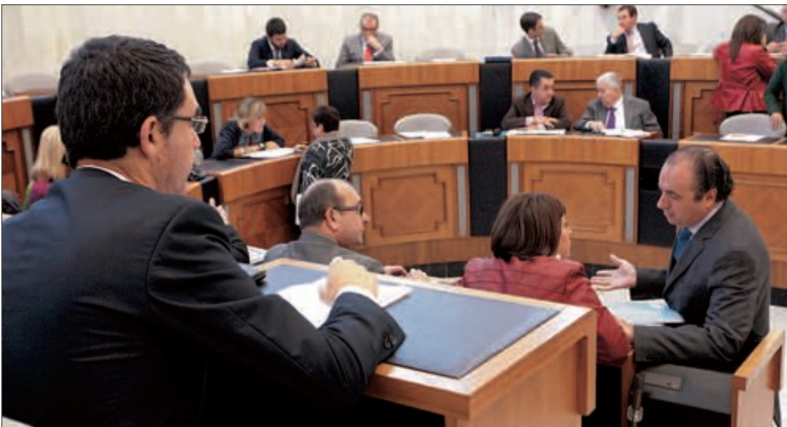
El presidente de la Diputación, José Joaquín Ripoll, habla con una diputada en un receso del Pleno de enero