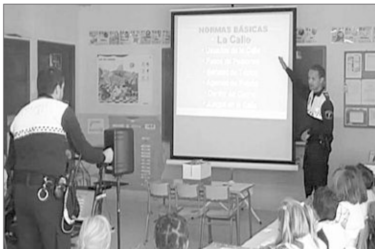
Momento de una de las clases de Educación Vial en un colegio de Castalla

La primera fase, que se celebró entre septiembre y diciembre de 2010, estuvo centrada en las normas generales de tráfico. Esta segunda fase versará sobre el peatón y la vía, mientras que la tercera fase, entre abril y junio, se centrará