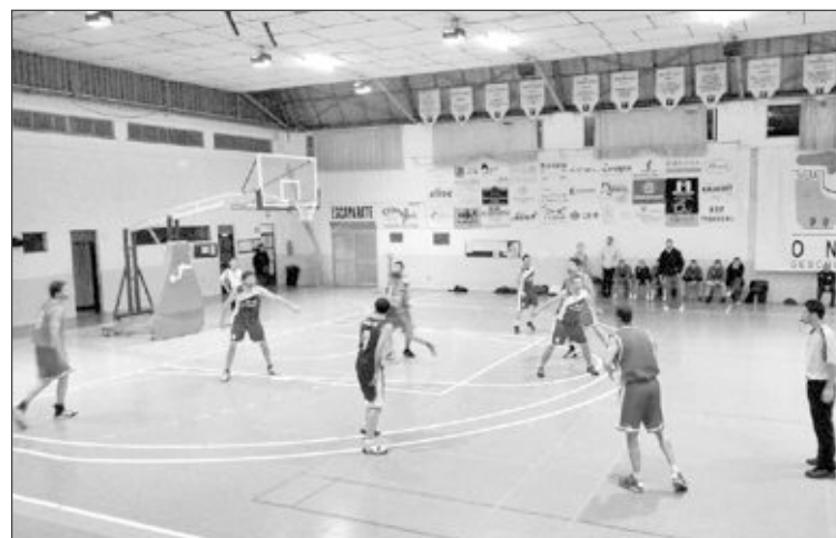
El Onix CB jugó contra el equipo de Crevillente en el pabellón de Onil

La diferencia llegó a ser de 29 puntos pero la relajación del Onil ocasionó que la diferencia se redujese a 15, para finalmente dejarla en algo más lógico. www.cdonil.com