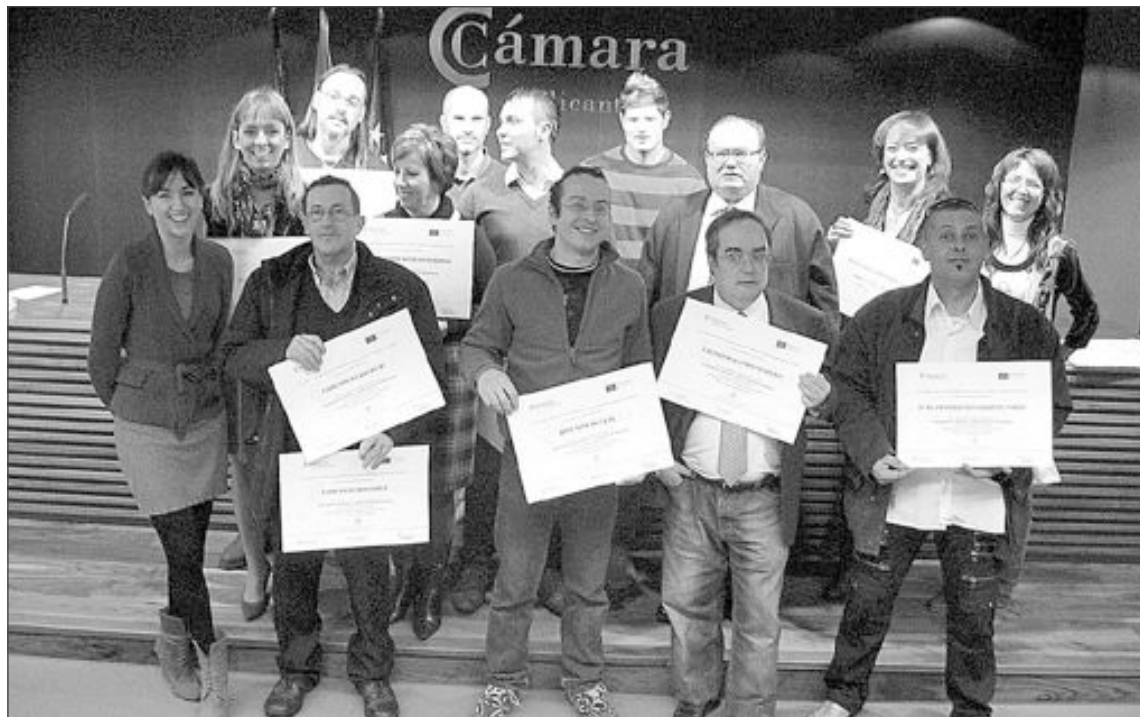
Grupo de emprendedores y empresarios ibenses que han conseguido los planes de viabilidad para sus proyectos

con la participación de un total de 177 emprendedores y empresarios, que ya desarrollan sus proyectos de nuevas empresas o aplican en sus pymes las herramientas aprendidas. Desde la Antena Local de la Cámara, ubicada en Promoi, se anima a todos los emprendedores y empresarios que quiera consolidar su proyecto y hacerlo realidad, "a que utilicen nuestros servicios para seguir formándose, para participar en nuestras misiones comerciales o para asesorarse en cualquier materia".