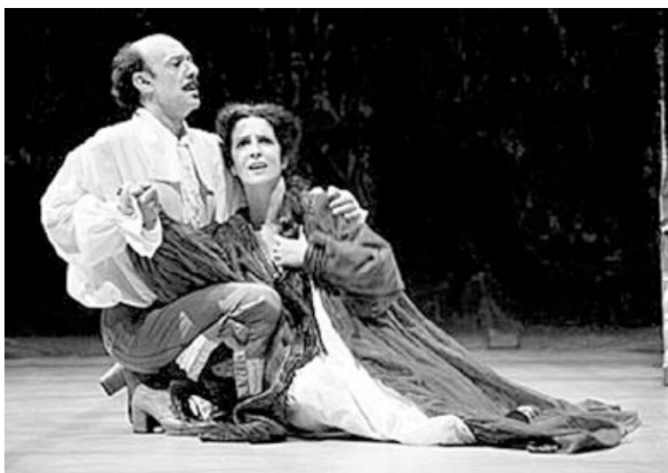
Una escena de la obra de teatro

entre otros actores, por alumnos y maestros del colegio de educación especial Sanchis Banús, bajo la dirección de Paco Valls. El pasado 6 de enero, el Ayuntamiento de Ibi otorgó al grupo la Mención Especial al Mérito Artístico, por transmitir su pasión, ilusión y entusiasmo en cada una de sus representaciones.