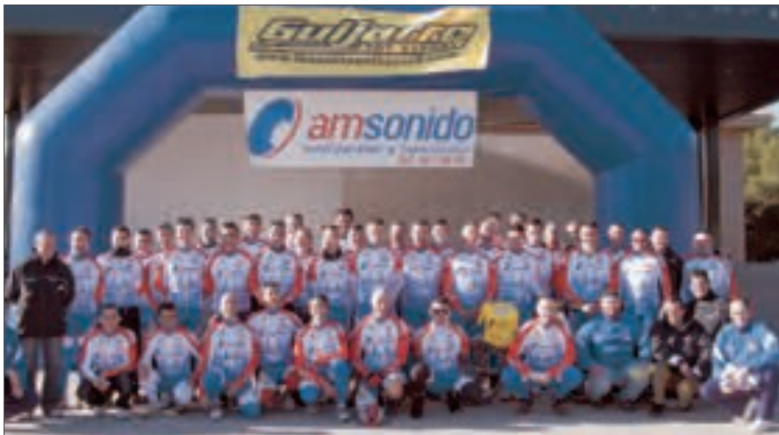
Presentación del C.C. Tibi-AMSonido

Para toda la gente enamorada de este deporte y que quiera seguir las andadas del CC Tibi-AM Sonido en la actual campaña, puede hacerlo en www.club-ciclistatibi.es .