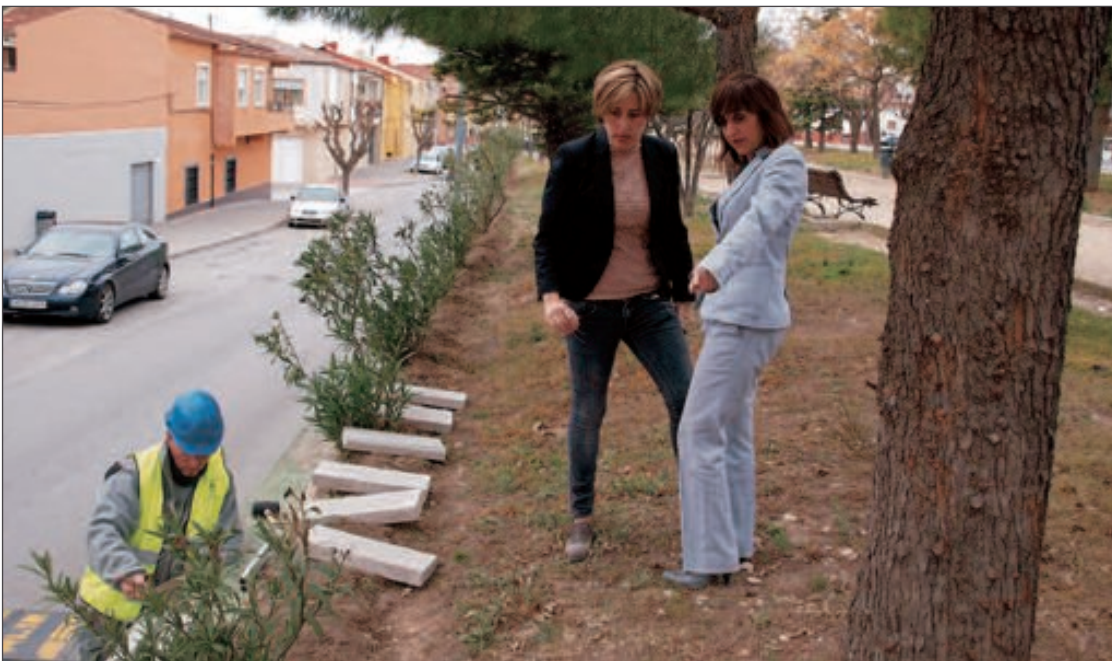
La alcaldesa y la concejal de Servicios visitaron esta semana las obras del parque