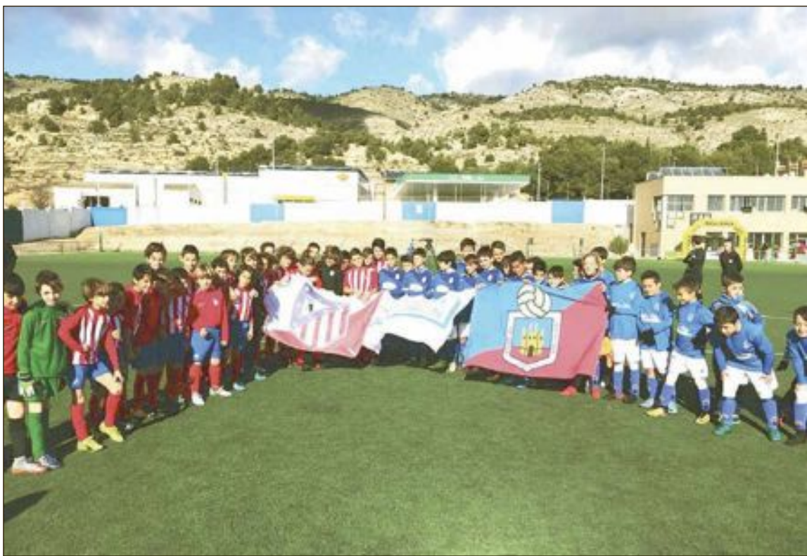
Equipos del Atlético de Madrid y la Unión Deportiva Onil en la categoría Benjamín

Toda la información del evento, con fotos tanto de esta como de las ediciones anteriores, y con todos los resultados de los partidos disputados en ambas categorías, se puede encontrar en la siguiente página web: www.torneovalledeljuguete.com .