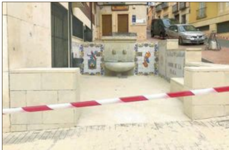
Una empresa especializada ha trabajado duro en la limpieza de la piedra y el suelo del Xorro de la Plaça para desincrustar los chicles pegados

Toda la información sobre el certamen y formas de inscripción están disponibles en www.gastrocastalla.es . Asimismo, GastroCastalla mantendrá activa la comunicación sobre el certamen a través de Facebook y Twitter.