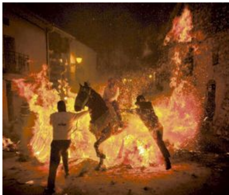
Fotografía de Vicent Guill Fuster ganadora del primer premio de la temática 'San Antón' del veterano concurso fotográfico eldense