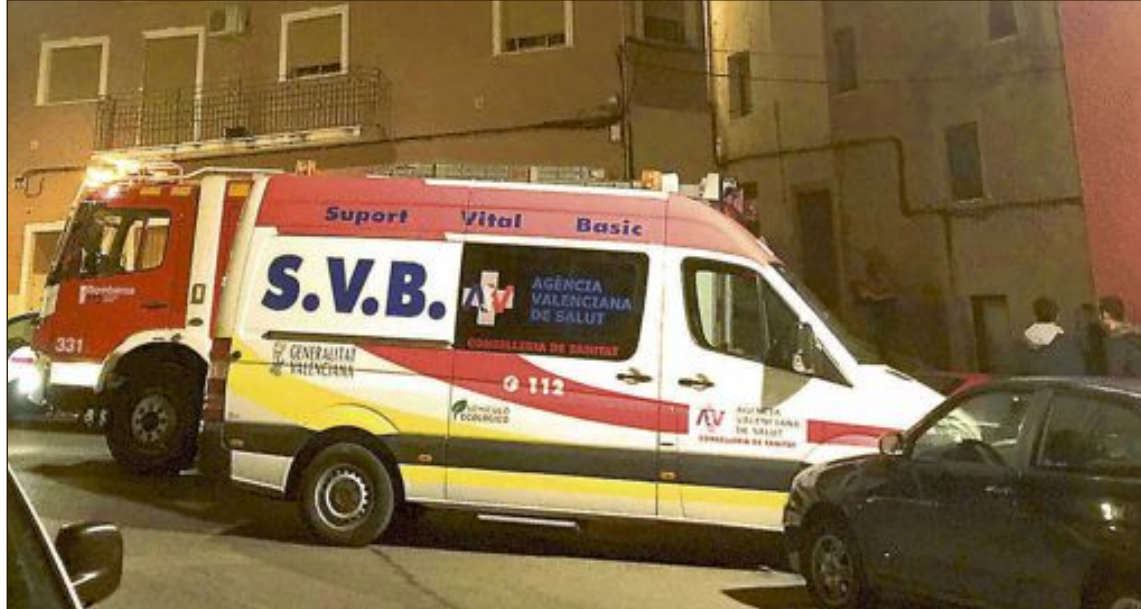
La huelga se iba a realizar del 1 al 10 de enero y afectaría al transporte sanitario de toda la Comunidad

podieran producirse despidos de los trabajadores huelguistas por no tener cobertura legal, una vez desaparecida la empresa, el sindicato tomaba la decisión de des-