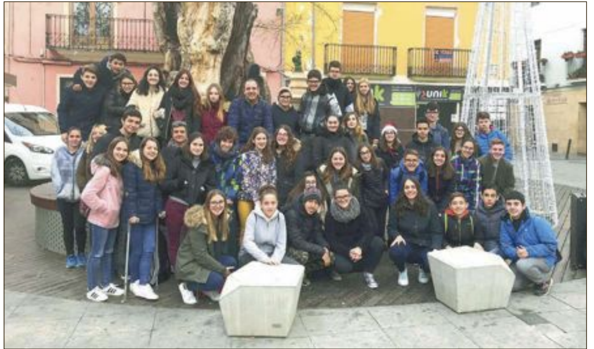
El 20 de desembre els músics de la Banda de l'Institut i alumnes de 4t d'ESO van oferir un concert a l'Asil