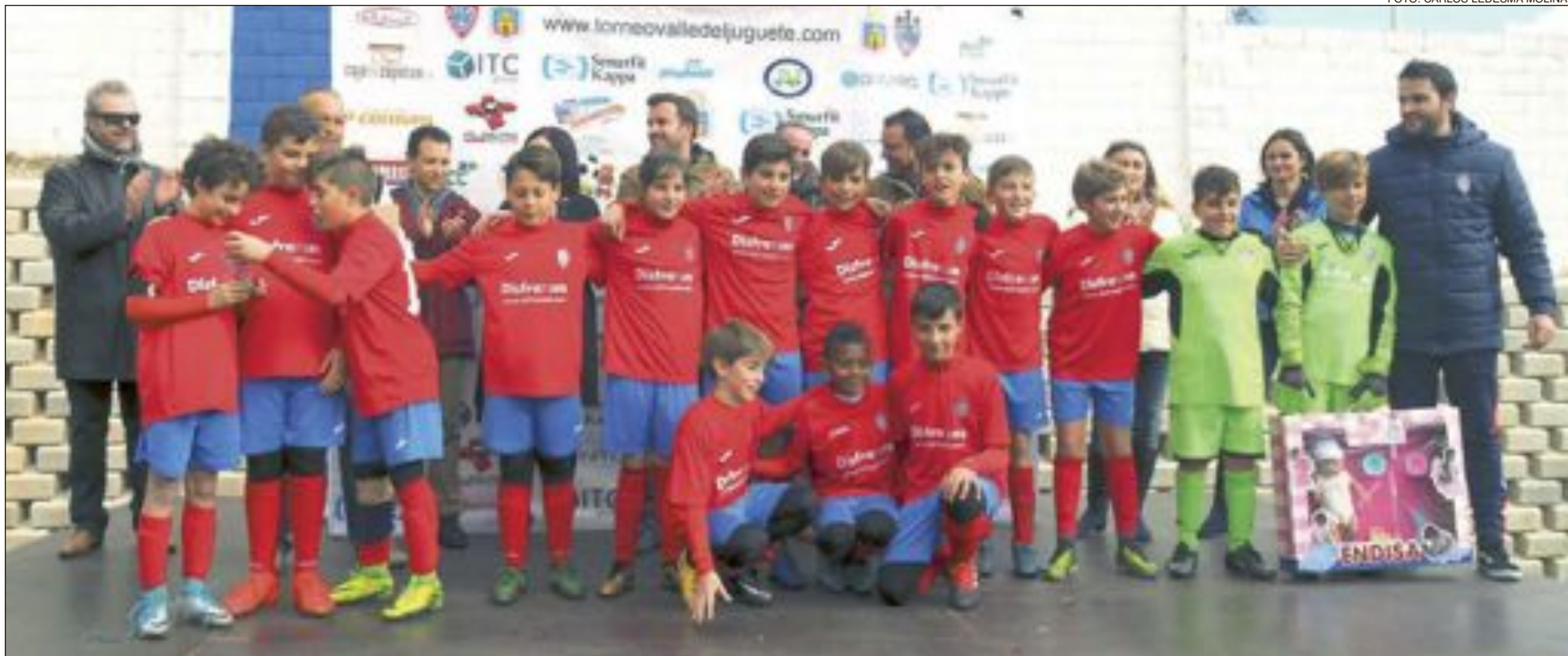
El equipo Alevín de la UD Rayo Ibense llegó a la final contra el Valencia CF, donde perdió por un resultado de 0-3, proclamándose así subcampeón de este quinto Torneo Solidario