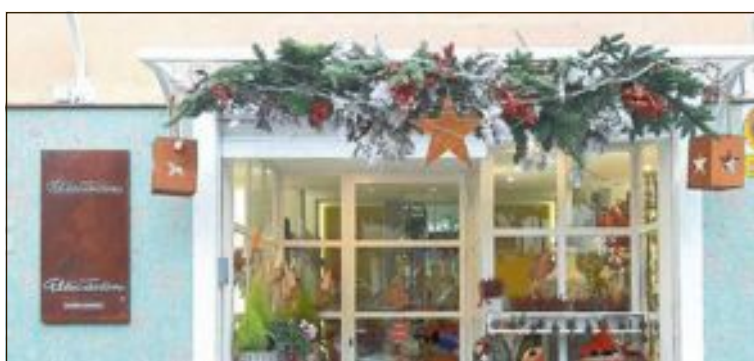
Floricatessen, premi del primer concurs d'adorn de fatxades