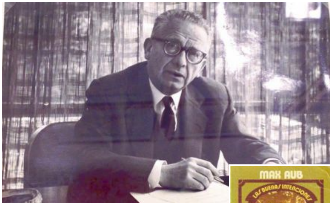
Imagen de Max Aub tomada en 1962

La obra se titula Las buenas intenciones y fue publicada en 1954. Es de extensión moderada y está dividida en tres partes, integradas respectivamente por 16, 17 y 14 capítulos. Actualmente, hay disponibles diversas ediciones, de entre las que cabe destacar la del Institut d'Estudis Alfons el Magnànim y la Biblioteca Valenciana (València, 2008), la de la editorial Bibliotex (Barcelona, 2001) y la de Alianza Editorial (Madrid, 1970).