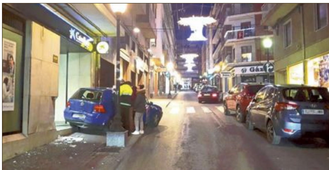
El accidente tuvo lugar en la calle Constitución la tarde del 25 de diciembre

Afortunadamente, el accidente no ocasionó daños personales sólo materiales en la fachada.