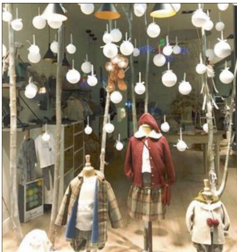
El Jardín de los Sueños, primer premi d'aparadors