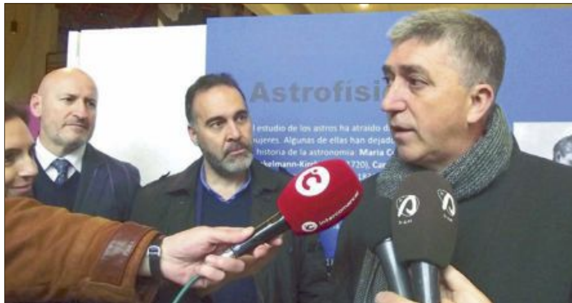
El conseller Rafael Climent visitó Ibi el 11 de diciembre y ya anunció un aumento de las ayudas hasta el 90%

Ahora, el nuevo incremento cubre por completo el coste de las obras efectuadas en un total de 73 polígonos y áreas indus-