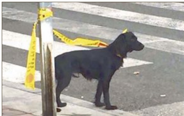
Uno de los perros hallados fue atado a una farola con cordón policial

En el caso de que un perro se pierda de forma reincidente, se imponen sanciones al dueño.