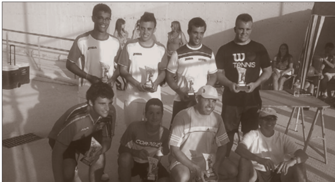
Los ocho tenistas laureados en las pasadas 24 Horas Dobles de Ibi

La segunda prueba para ambos fue la media, donde no pudieron conseguir la clasificación para la final con muchos errores.