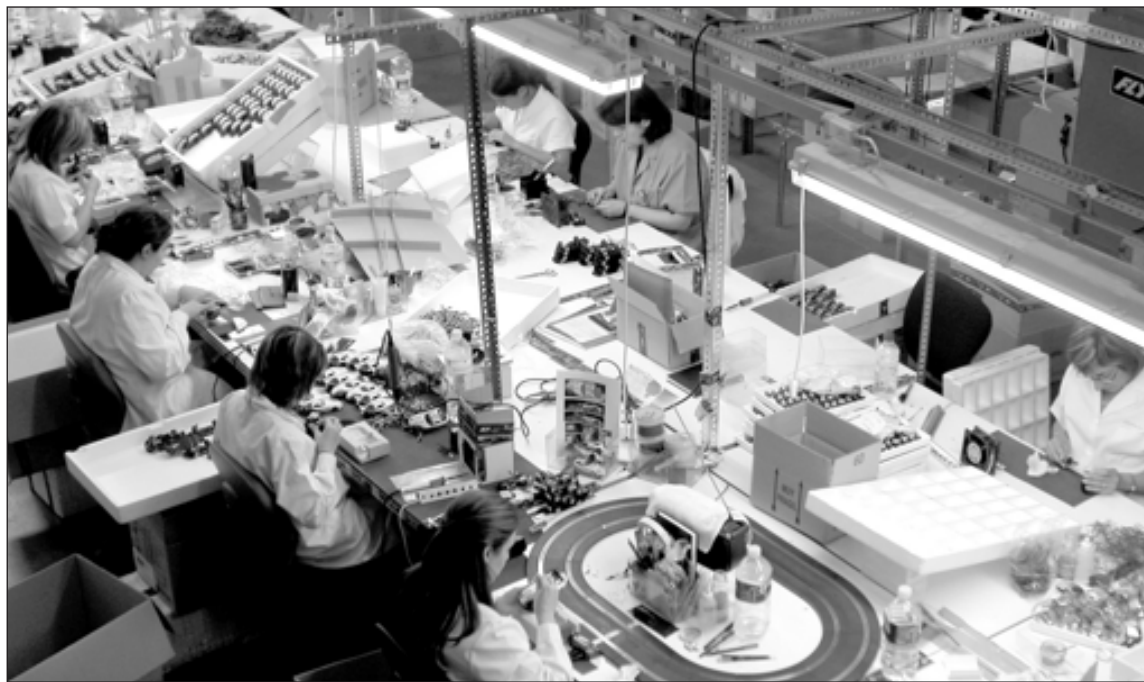
En el sector de la Industria, el paro bajó en ochenta personas

todos los sectores de la economía. En la agricultura se crearon cuatro puestos de trabajo, 80 en la industria, 69 en la construcción y 111 en los servicios. El colectivo sin empleo anterior se redujo en 82 personas.