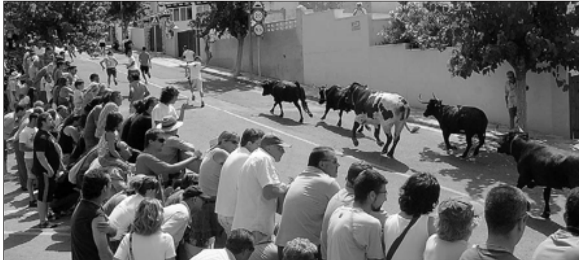
La Entrà de Vaques, primer acto festivo, se celebra el sábado 21 de julio, por lo que se espera mucha afluencia de gente

El Sindicato recuerda que tras el recorte de un agente en la plantilla policial, pasando de seis a cinco, en abril se intentó "hablar con el Ayuntamiento para organizar el trabajo, sin