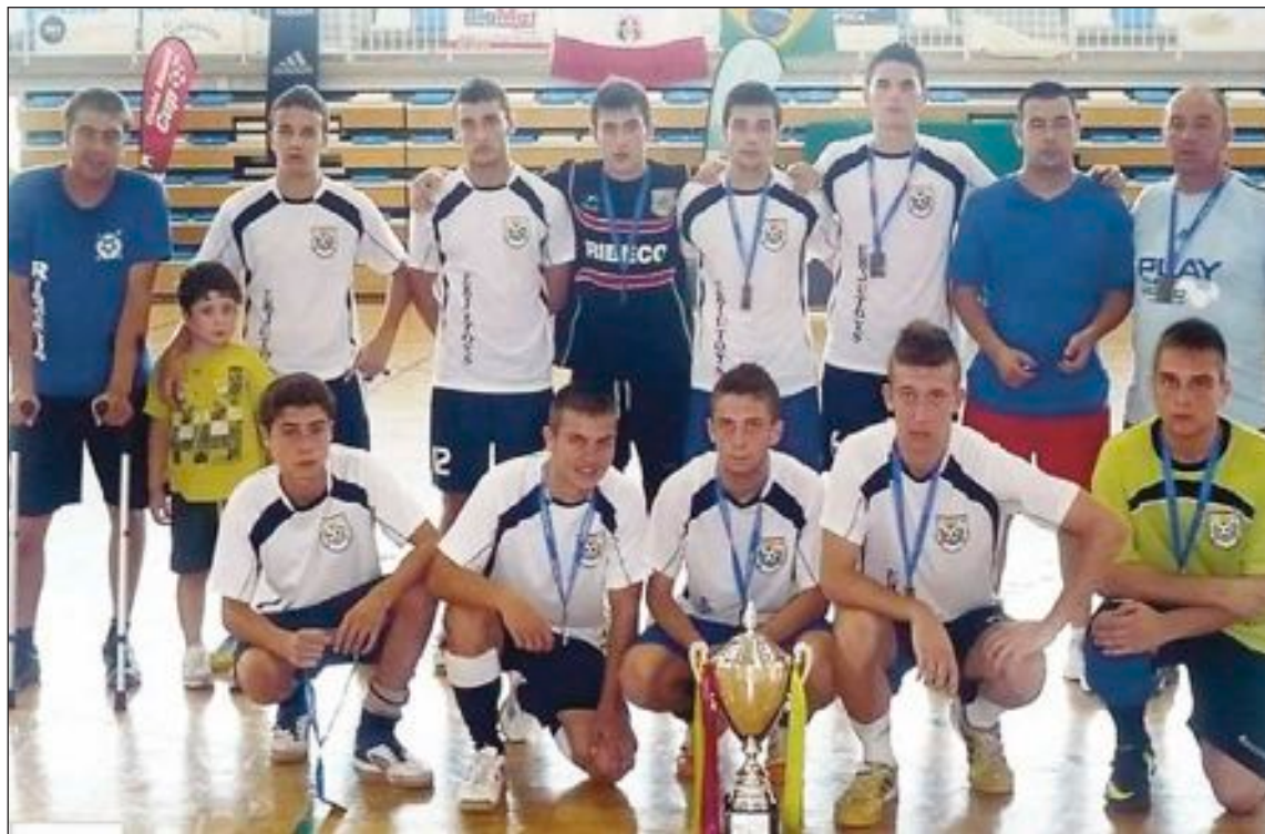
El equipo Juvenil del Castalla se proclamó subcampeón de este torneo internacional celebrado en Benidorm