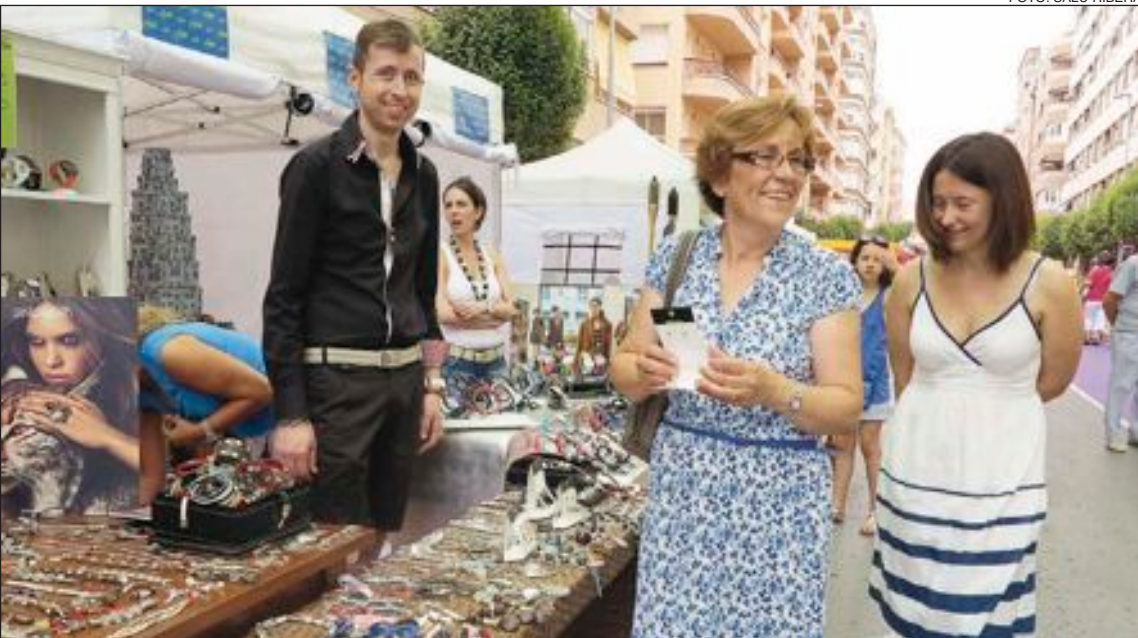
Un tramo de la avenida de la Paz estuvo reservado a los comerciantes locales