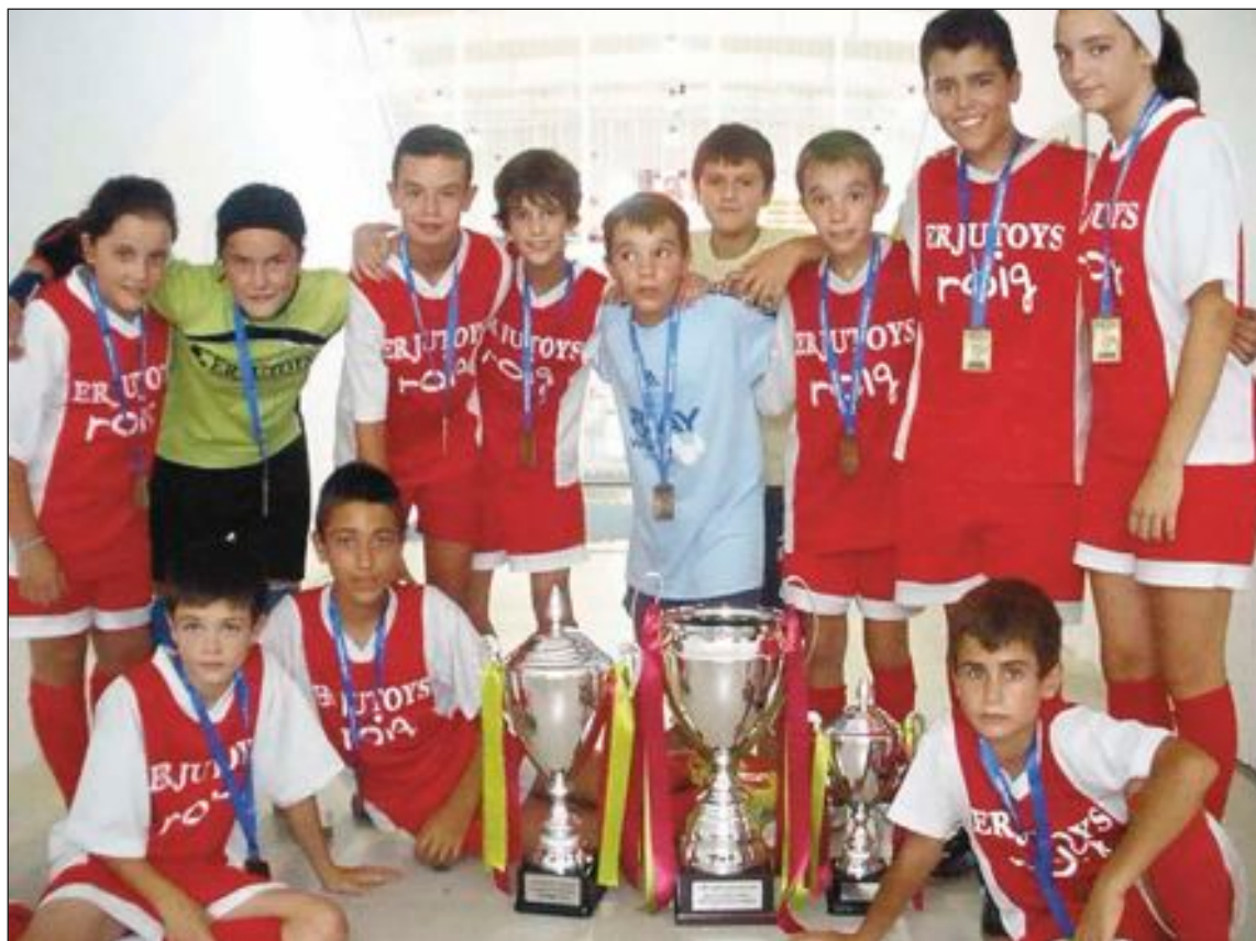
Jugadores del Castalla Alevín tras proclamarse campeones del Costa Blanca Cup