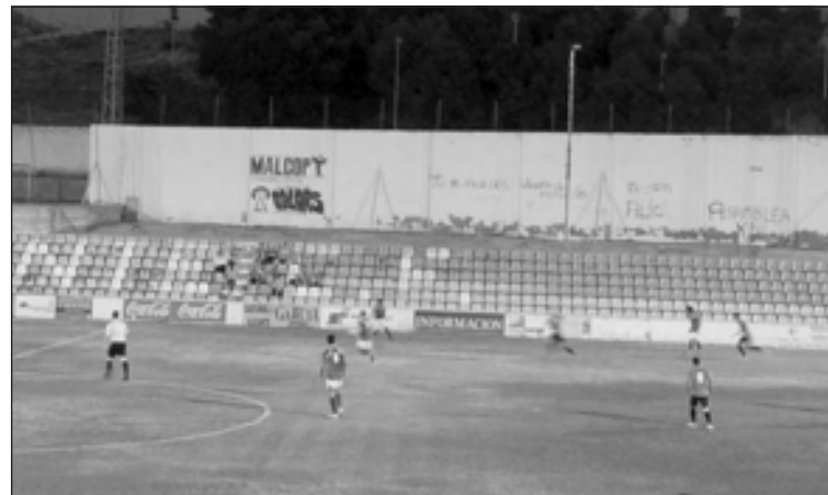
Momento del partido entre el Alicante y el Rayo Ibense

Al finalizar las diferentes partidas se hará entrega de los premios a los respectivos campeones y subcampeones de cada modalidad, con la participación del diputado de Deportes de Alicante, Pascual Díaz.