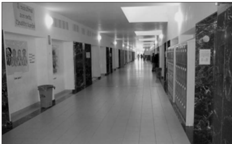
Interior del Instituto de Educación Secundaria Enric Valor de Castalla

Fuentes del IES Enric Valor afirman que se sigue "en la misma línea de los últimos años, con unas notas superiores a la media en la mayoría de materias". Y todo ello, apostillan, "a pesar de los brutales recortes a la educación pública y a pesar