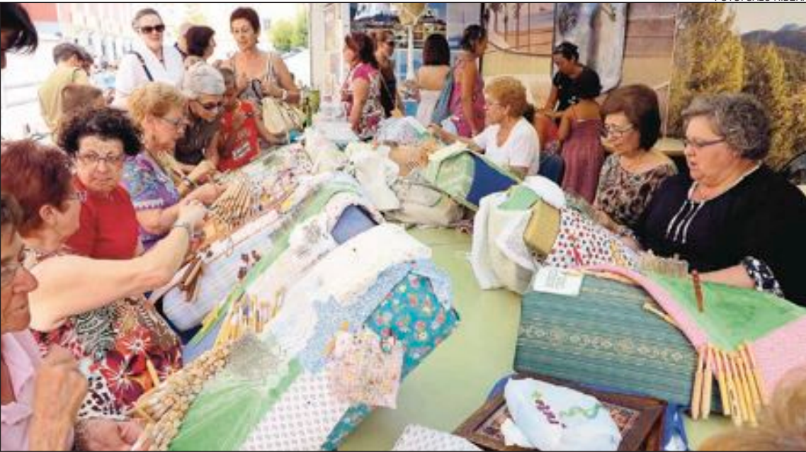
Un grupo de bolilleras mostró su buen hacer en el camión-expositor de la Diputación Provincial de Alicante