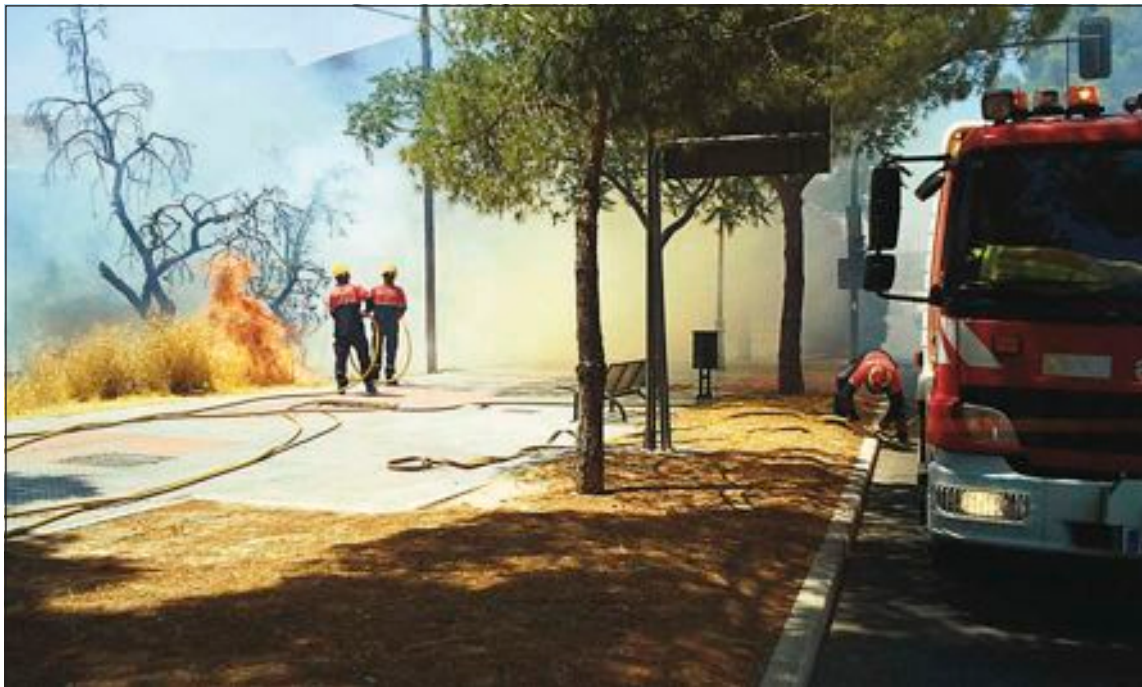
El incendio se produjo el jueves 19 de julio, a las 14 horas, y fue sofocado en veinte minutos por los bomberos

Pese a la espectacularidad de las llamas, no hubo ninguna incidencia personal ya que los bomberos acudieron a sofocar el fuego de manera inmediata, dada la cercanía del parque, y sólo necesitaron veinte minutos para sofocar el incendio. Frente a la zona siniestrada se encuentra la urbanización el Alamí, donde hay también gran cantidad de matorrales secos, debido a la falta de mantenimiento.