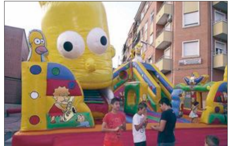
Arriba, corte de cinta inaugural. Abajo, una atracción para niños