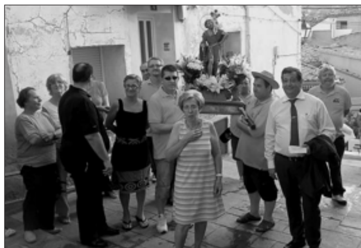
Momento de la procesión de San Cristóbal

El domingo 8 de julio se celebraron en Onil los actos habituales en honor del patrón de los conductores, San Cristóbal, con la tradicional bendición de vehículos delante del Palacio del Marqués de Dos Aguas, por parte del párroco local, Noé Ordóñez. También tuvo lugar la tradicional procesión por las calles del centro histórico.