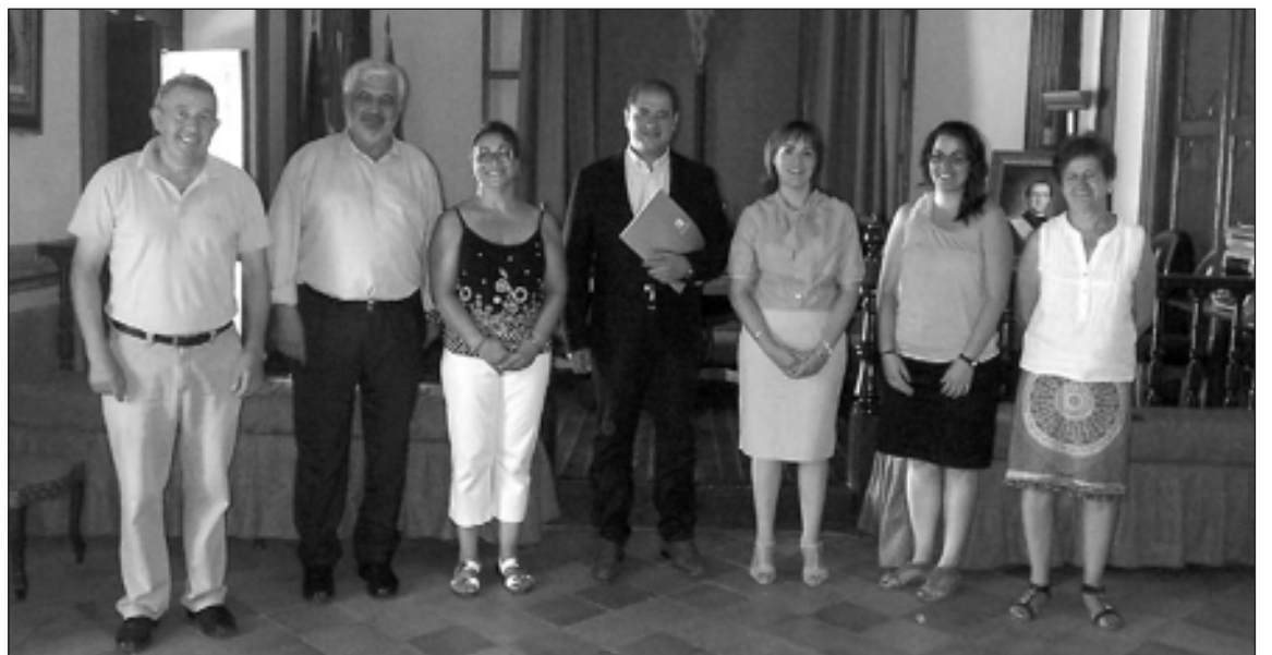
El diputado, junto a la alcaldesa y otros concejales del equipo de gobierno, en la presentación

El diputado está recorriendo la provincia informando sobre esta nueva convocatoria de ayudas que "constituyen una apuesta de la Diputación por estar cerca de los ciudadanos", según señaló Ferrando.