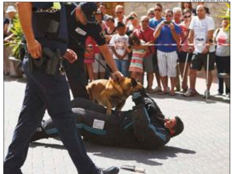
Momento del simulacro conjunto de la Guardia Civil y la Policía Local