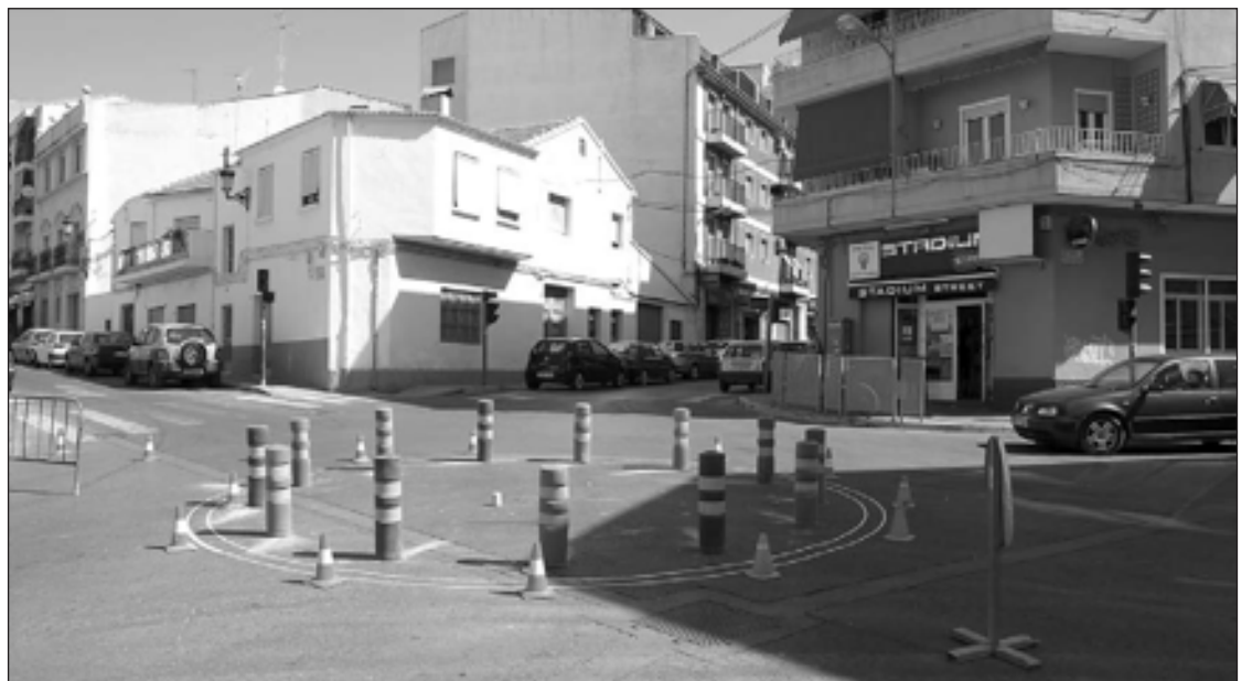
La rotonda provisional se ha colocado en el cruce de las calles Tibi, El Salvador y Dos de Mayo

El Centro abrirá el plazo de matriculación del 5 al 15 de septiembre.