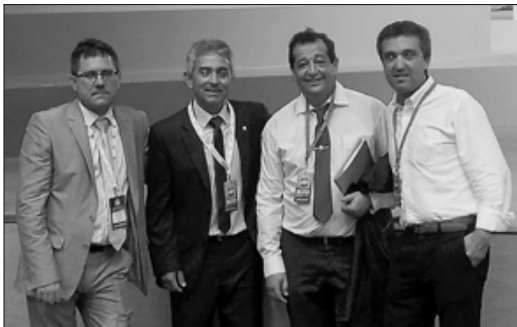
De izquierda a derecha, los alcaldes de Sax, Tibi, Onil y Agost