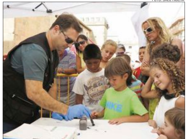
La Guardia Civil Científica mostró a los niños cómo se toman huellas