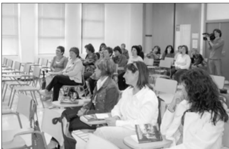
Centro de Formación de Personas Adultas 'Joan Lluís Vives'

Los conciertos de los alumnos del curso serán los días 24, 25 y 26 de julio.