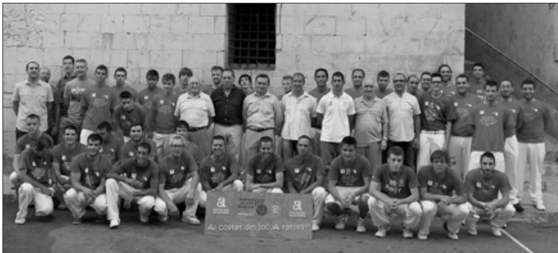
Equipos finalistas del Trofeo Diputación de Alicante