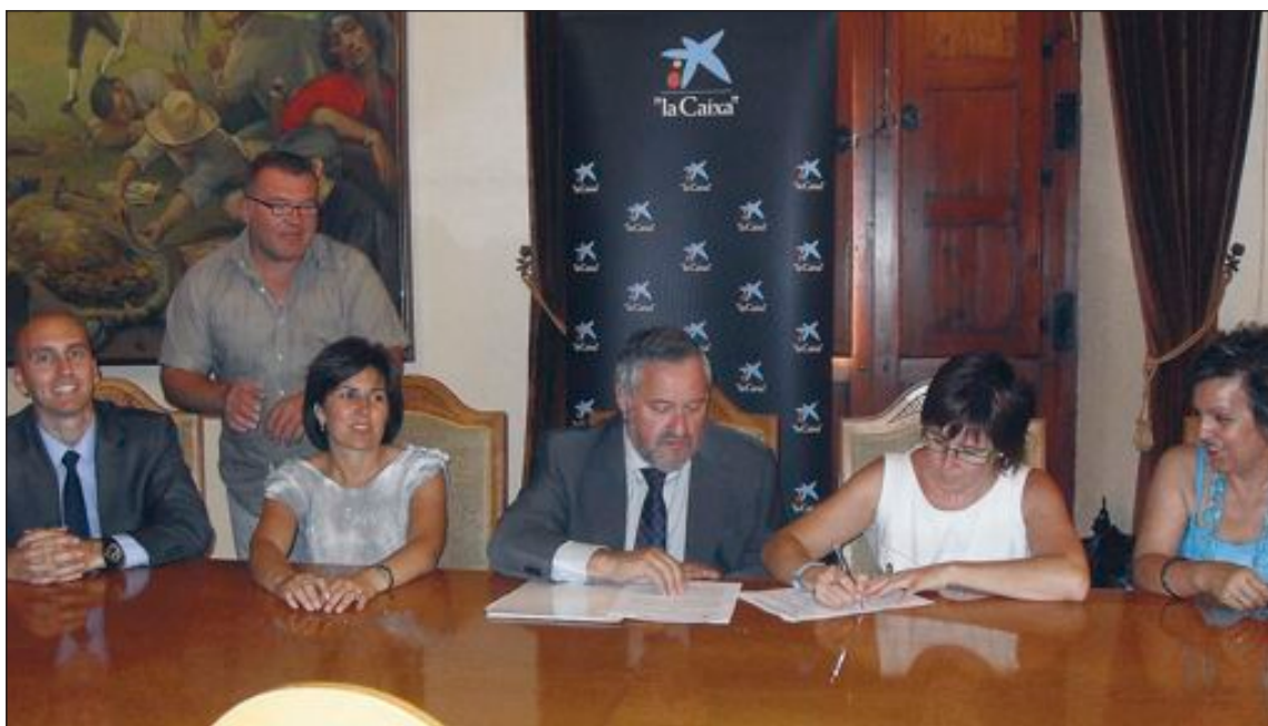
Momento de la firma del convenio de colaboración entre La Caixa y la Asociación de Alzheimer de Castalla (AFA)