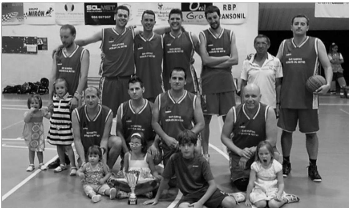
Bar Huertas fue el equipo ganador de la pasada edición de las 24 Horas de Baloncesto Masculino de Onil

El Bar Huertas se impone al Restaurante Samalet en las 24 Horas