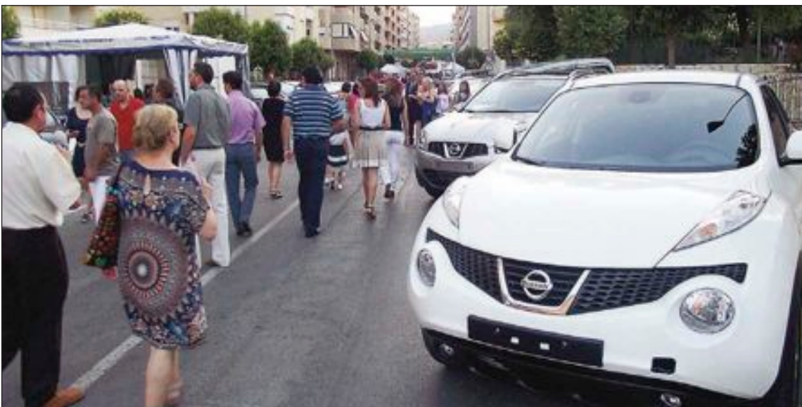
La avenida de la Paz fue un continuo ir y venir de visitantes durante los dos días y medio que duró la Feria