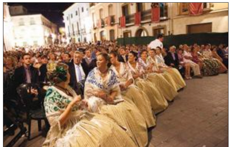
La Reina, las damas y las autoridades ocuparon las primeras filas

El nerviosismo de las chicas fue aminorando mientras transcurría la velada de la que eran protagonistas y, como tales, recibieron un buen número de aplausos. El acto finalizó con el disparo de un castillo de fuegos artificiales.