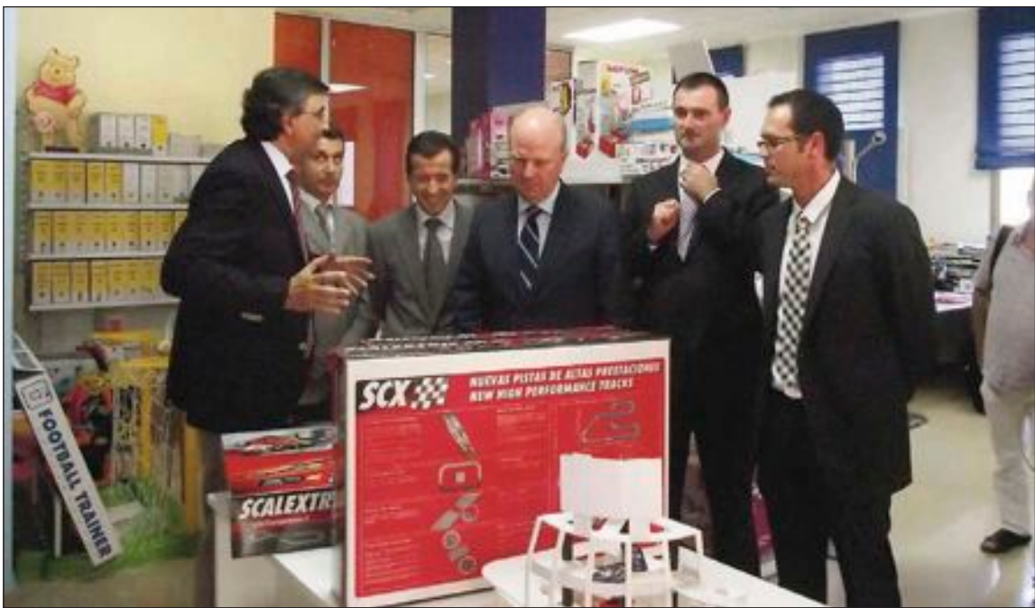
El conseller, en el centro, durante su visita a la empresa Chicos. La alcaldesa no asistió al acto.