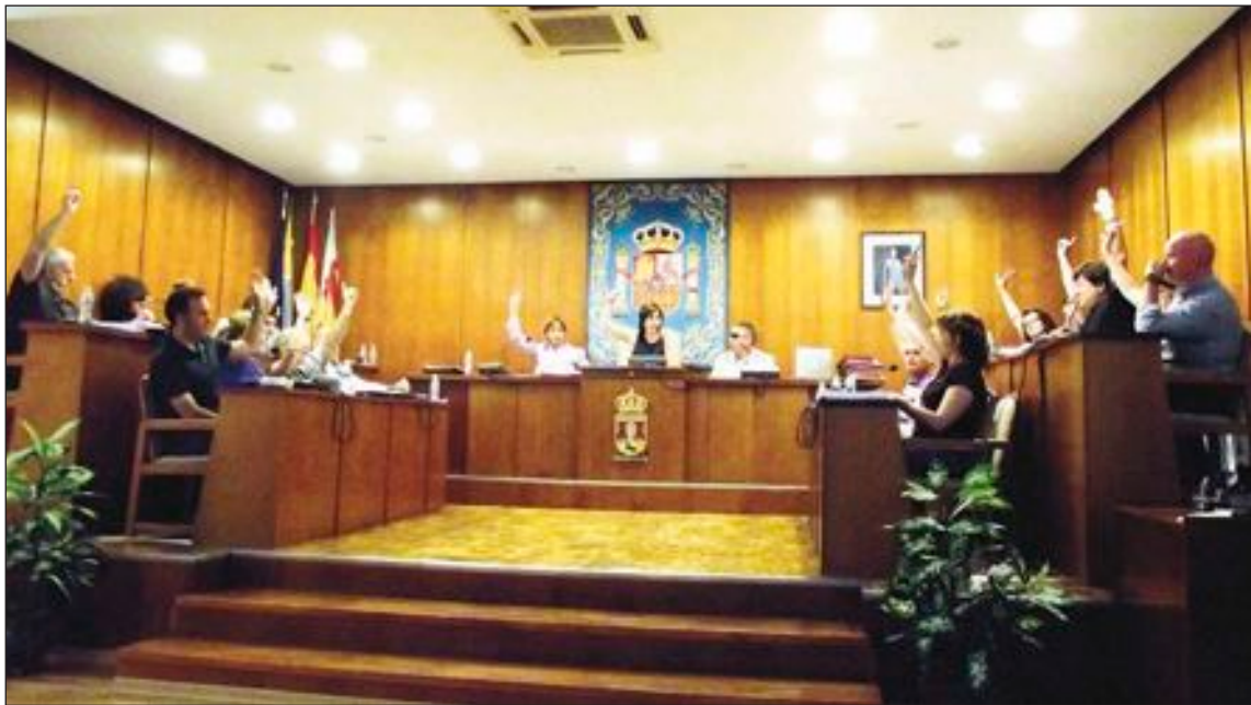
Todos los grupos de la Corporación han tomado la medida

El Grupo de Esquerra Unida también se ha pronunciado en contra de esta decisión "injusta e insolidaria que hace recaer el coste de la crisis financiera en los colectivos más desfavorecidos: desempleados, dependientes, funcionarios, pensionistas y