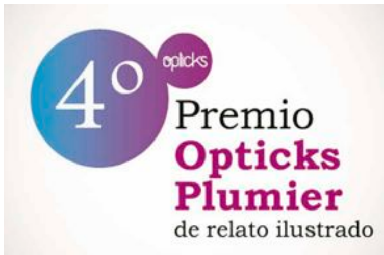
Cartel de la cuarta edición del premio Opticks Plumier

350 euros para el autor del relato ganador y otro, de la misma cantidad, para el autor de la ilustración que lo acompañe. En el caso de un único autor, se le concederá un premio en metálico de 700 euros.