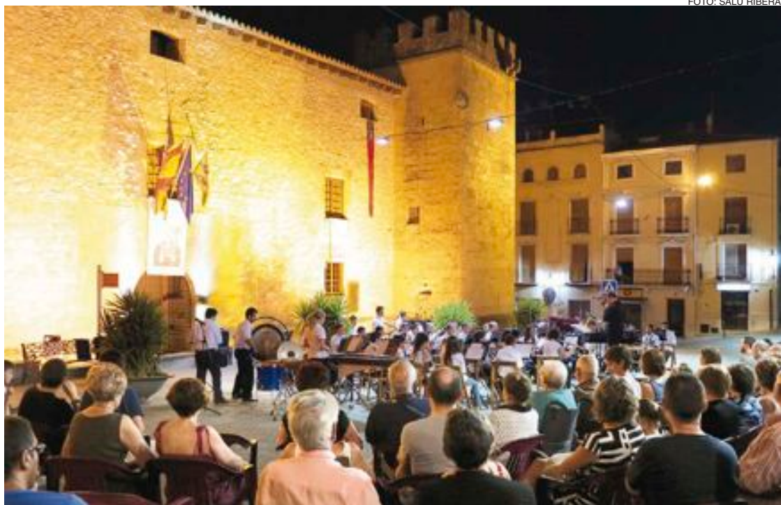
La Banda Jove del Centro Instructivo Musical de Onil (CIMO) ofreció su concierto de verano delante del Palacio del Marqués de Dos Aguas aprovechando la primera jornada de la IV Feria de San Cristóbal