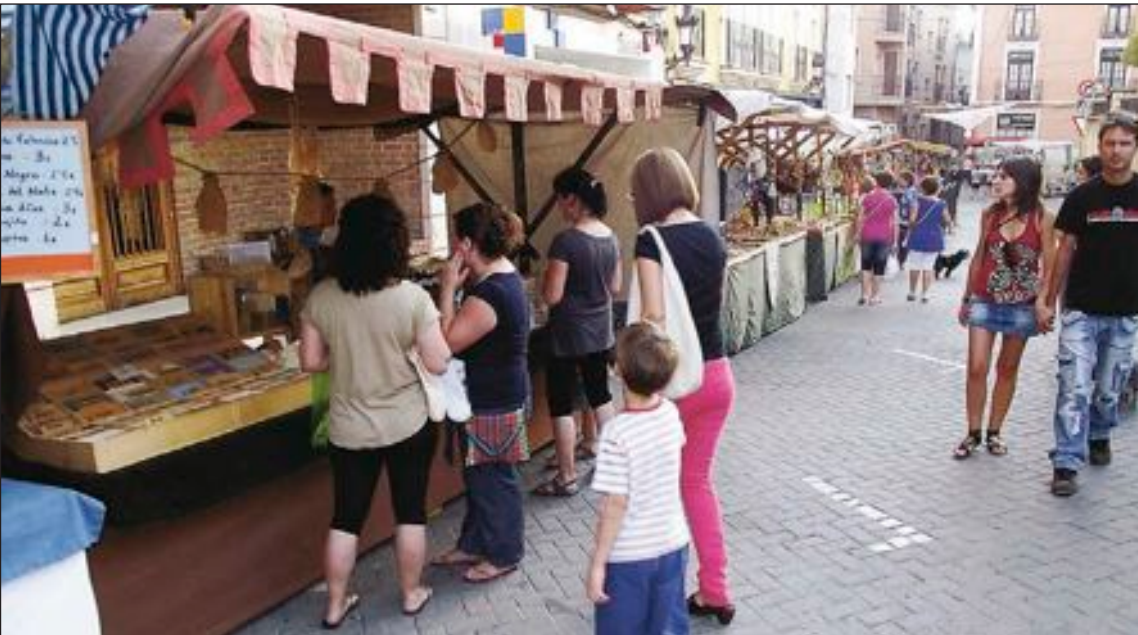
Los puestos del mercado medieval rodearon el Palacio del Marqués de Doa Aguas