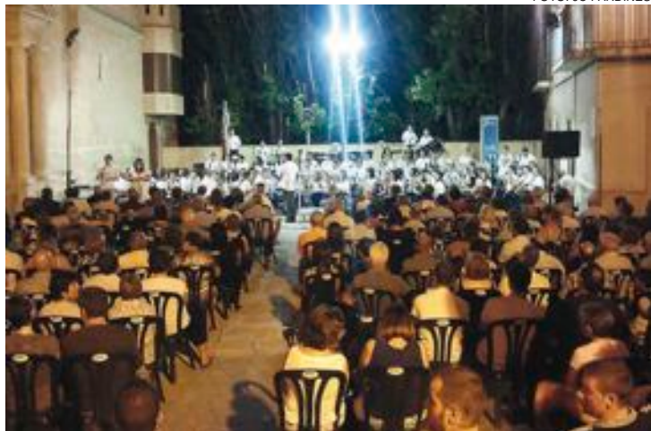
El concierto de Castalla se celebró en la plaza de la Iglesia