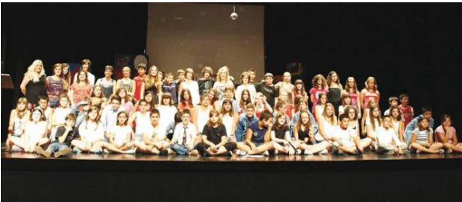
El acto de clausura del curso tuvo lugar el jueves 19 de julio en el Centro Cultural