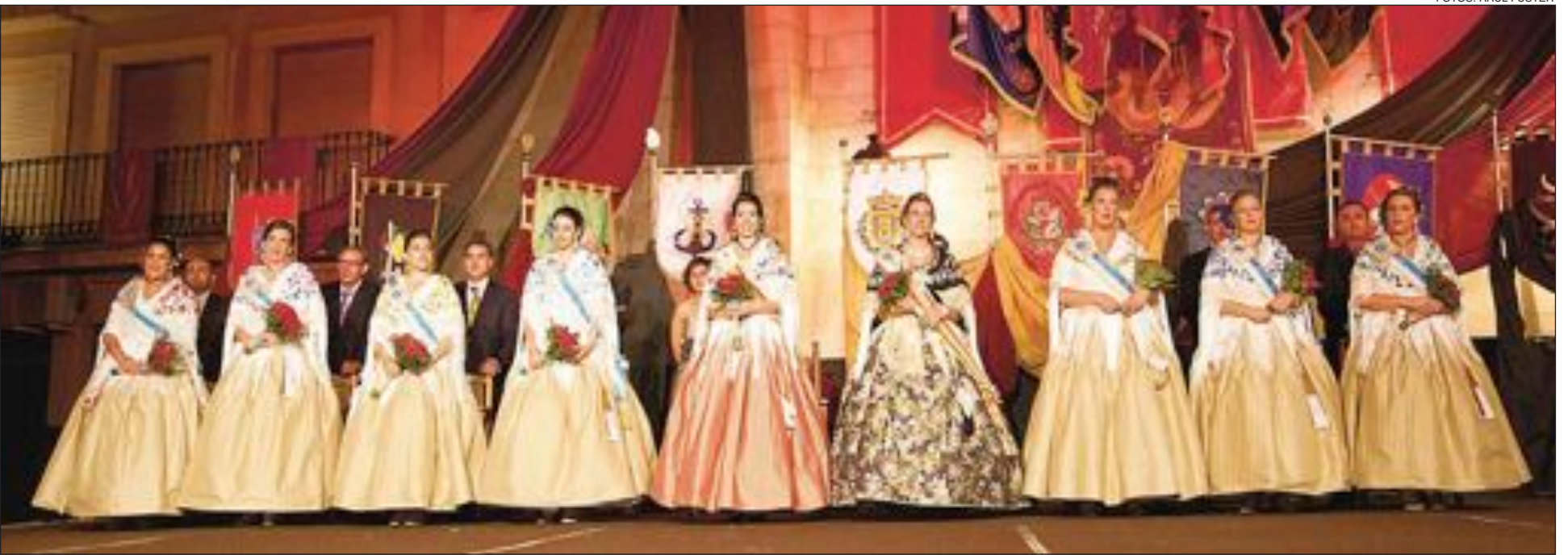
Las damas de las siete comparsas de Moros y Cristianos, junto a la Reina de 2011 y la Reina de este año, sobre el escenario de la plaza Mayor donde el día 14 se celebró el acto de presentación