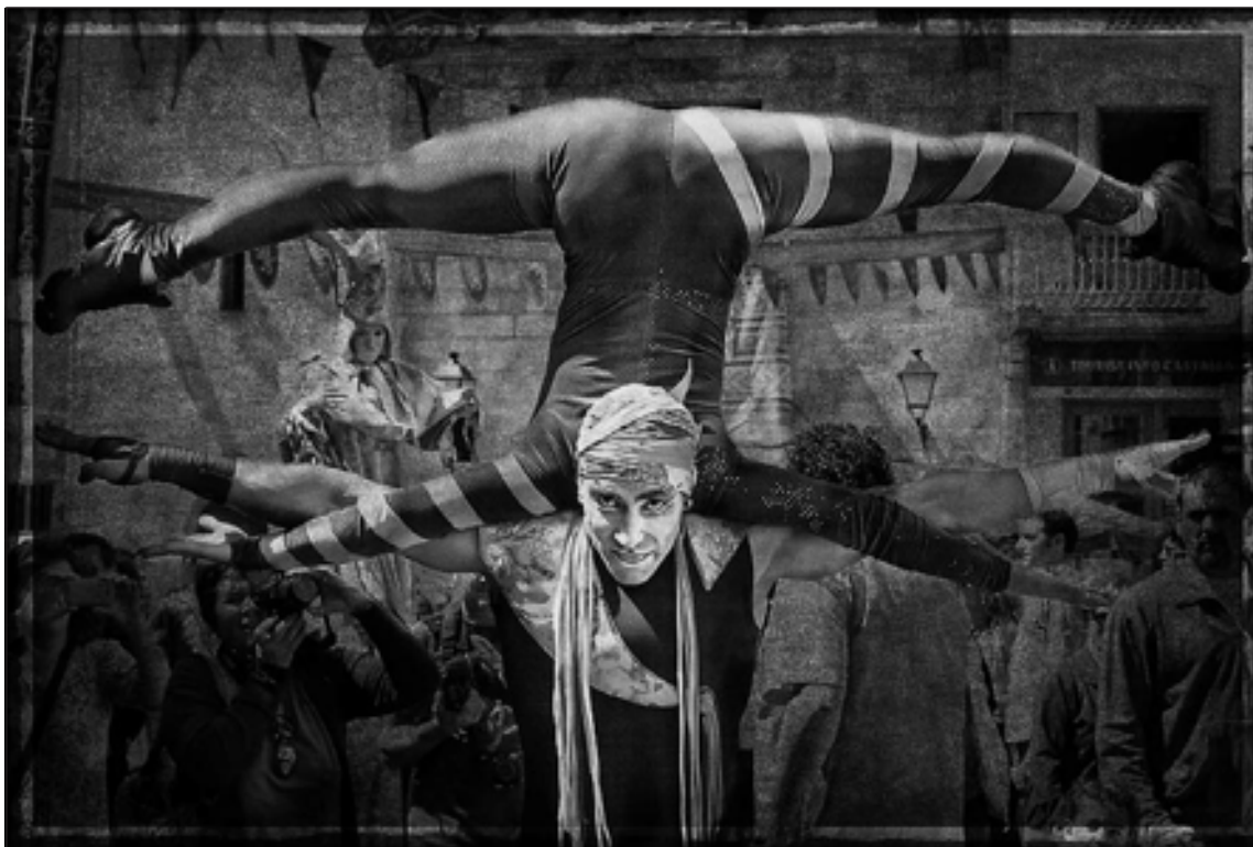
Accésit: 'Cuadro 2 Boina' (José Ricardo Sanchis)