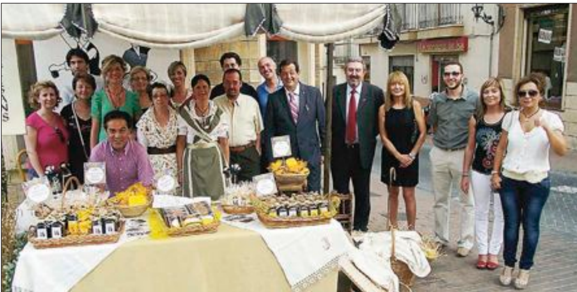
El alcalde, varios concejales y dos representantes de la Diputación Provincial, en el stand del Grup Folkloric d'Onil