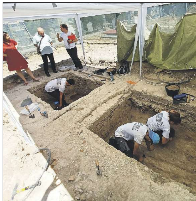
Hasta el momento, en 4 fosas se han encontrado 73 víctimas procedentes de 16 localidades alicantinas, entre ellas de Ibi y Onil

Hasta el momento, en cuatro fosas se han encontrado 73 víctimas procedentes de las localidades alicantinas de Aspe, Alcoi, Ibi, Novelda, Elx, Benejúzar, Almoradí, Banyeres, Callosa de Segura, Elda, Torrevieja, Onil, Monforte del Cid, Rojales, Cocentaina y Monòver, además de Madrid y La Unión, en Murcia.