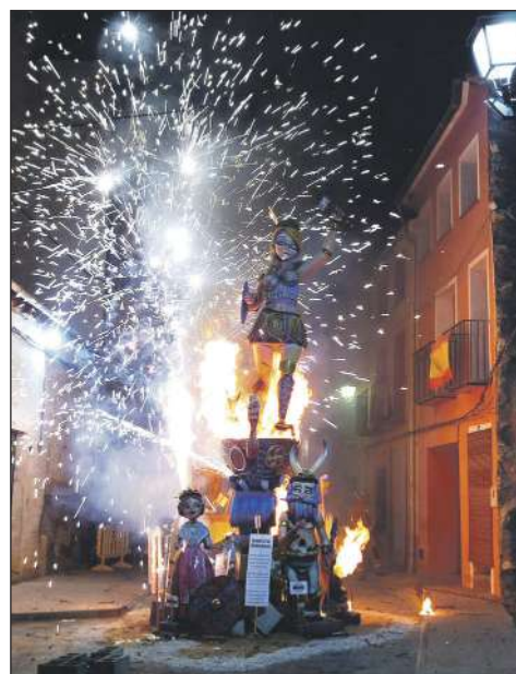
La Cremá se pospuso al martes 26 de julio