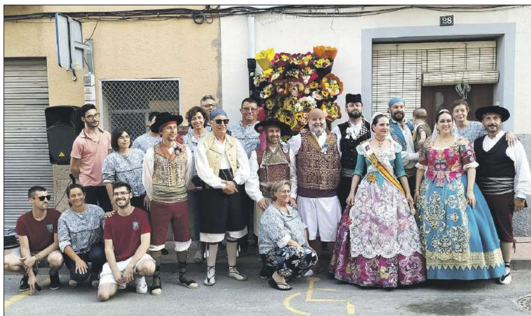
Miembros de la Colla de Sant Jaume