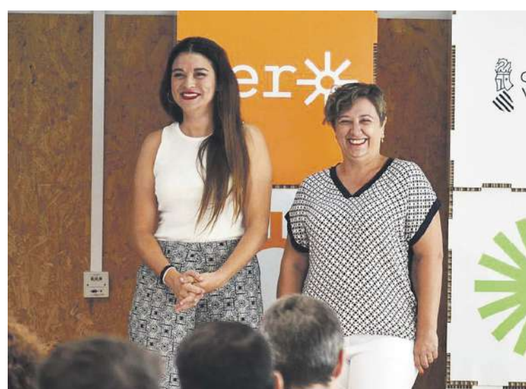
La conselleras de Transición Ecológica y Educación, Mireia Mollà y Raquel Tamarit, respectivamente, presentaron el programa el martes 26 de julio a los equipos directivos de los centros educativos implicados

Durante el próximo otoño se publicará la licitación de los pro-