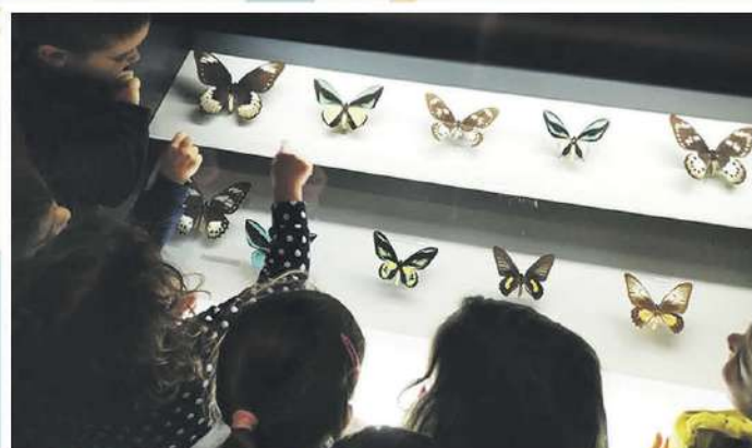
Museo de la Biodiversidad

Abierto en agosto de martes a domingo de 10 a 14 h.