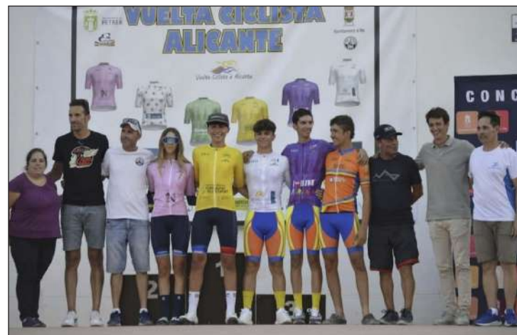
Los campeones de la etapa compartieron podio con los exciclistas profesionales ibenses Rubén Plaza y Mariano Sánchez