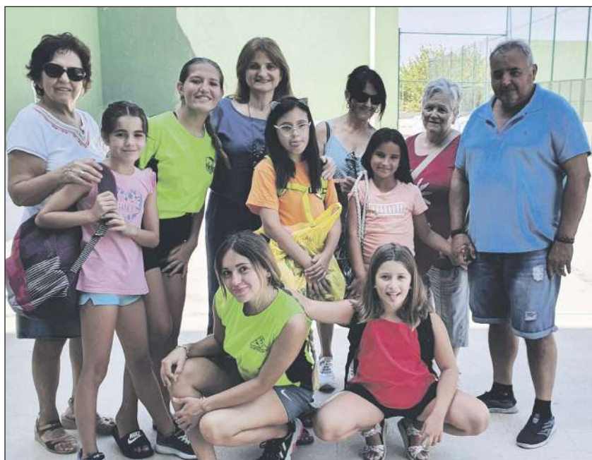
El Día de los abuelos se celebró en los campus Crea y Aprende, Esport Viu, Marcaís, Ceap y Rayo Ibense, donde se organizaron juegos y el Ayuntamiento repartió granizado de limón