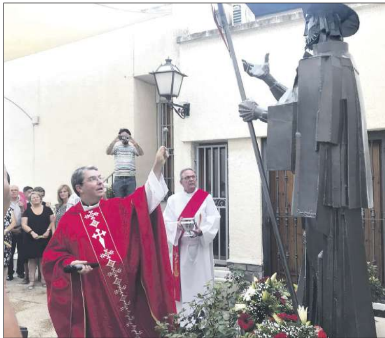
El 25 de julio se procedió a la apertura del Año Jubilar Jacobeo

A lo largo del año, la parroquia irá celebrando actos especiales y el primero de ellos tendrá lugar el sábado 30 de julio, con el concierto del dúo de jazz Cherokke and Melero, titulado Namibia.