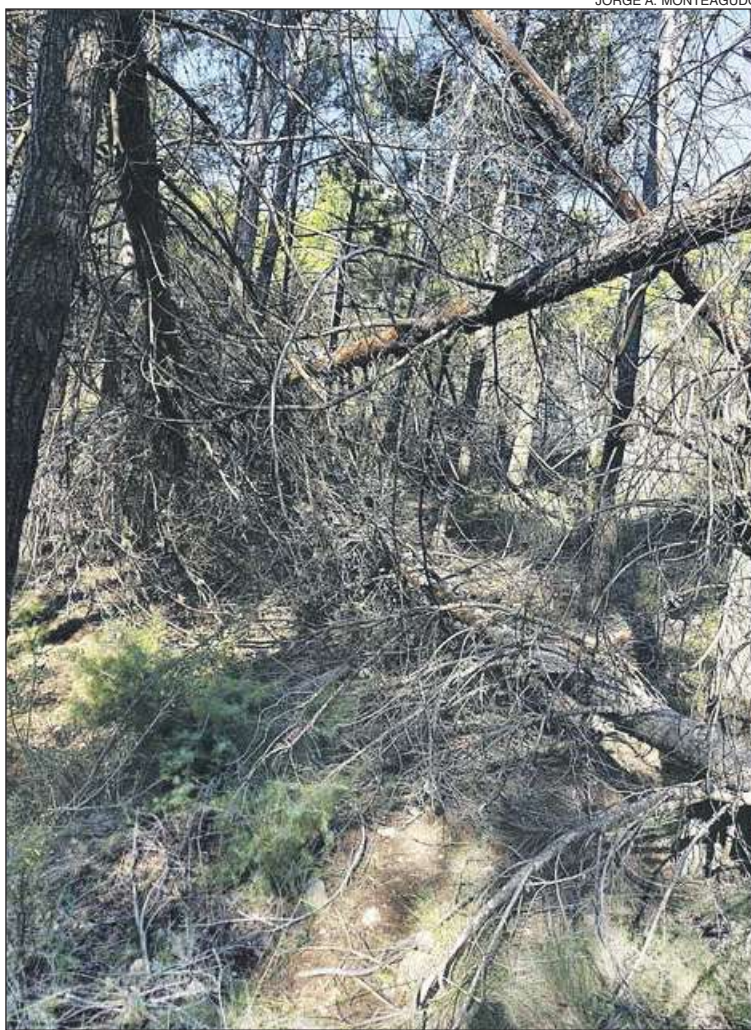
La limpieza de los terrenos forestales corresponde a sus propietarios

Ibi también se puede hacer, porque no nos regimos por una legislación diferente al resto de municipios».