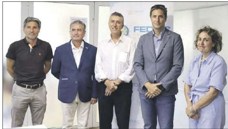
Representantes de la Plataforma por la Reindustrialización Territorial junto al consejero de Economía y la directora del Ivace, el 28 de julio en Alcoi

La Plataforma y la Conselleria están de acuerdo en mantener el encuentro en el ámbito autonómico y localizado en un lugar geográfico centrado en el mapa del territorio para favore-