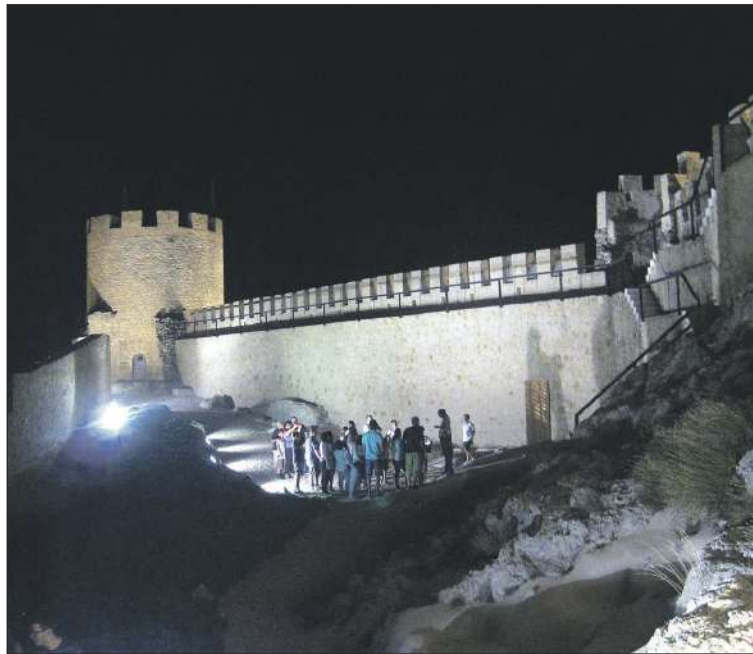
"Per a visitar el Castell s'ha de realitzar una reserva prèvia

Les persones que ho visiten descobriran una de les principals i millor conservades fortificacions de la província d'Alacant. Declarat BIC amb la categoria de Monument, posseïx tres parts que permeten conèixer l'evolució de la fortificació: el Palau, el Pati d'Armes i la Torre Grossa.