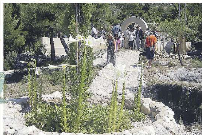
Estación Biológica Torretes

Abierto en agosto de martes a domingo de 10 a 14 h.