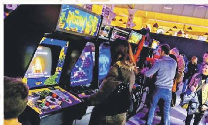
Museo Arcade Vintage

Abierto en agosto sábados y domingos de 10 a 14 h. y de 16 a 20 h.