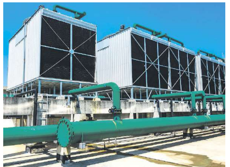
Podrá acogerse a estas ayudas cualquier entidad o persona jurídica, de naturaleza pública o privada

Esta línea de ayudas prevé apoyar los equipos para el tratamiento en campo de la biomasa para su astillado o empaquetado, para su utilización en procesos energéti-