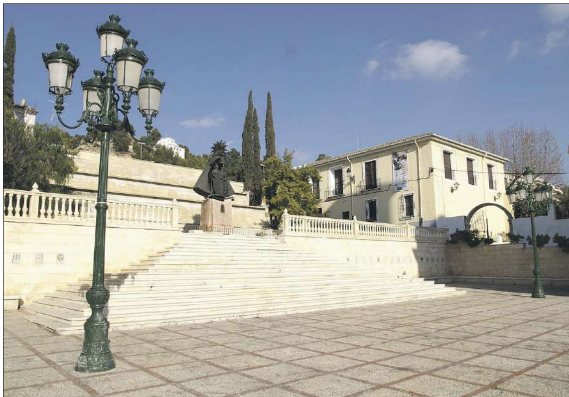
La obra de remodelación de la plaza de la Iglesia está previsto que se realice en un plazo de 18 meses

El Ayuntamiento aprobó en el pleno el gasto plurianual de la