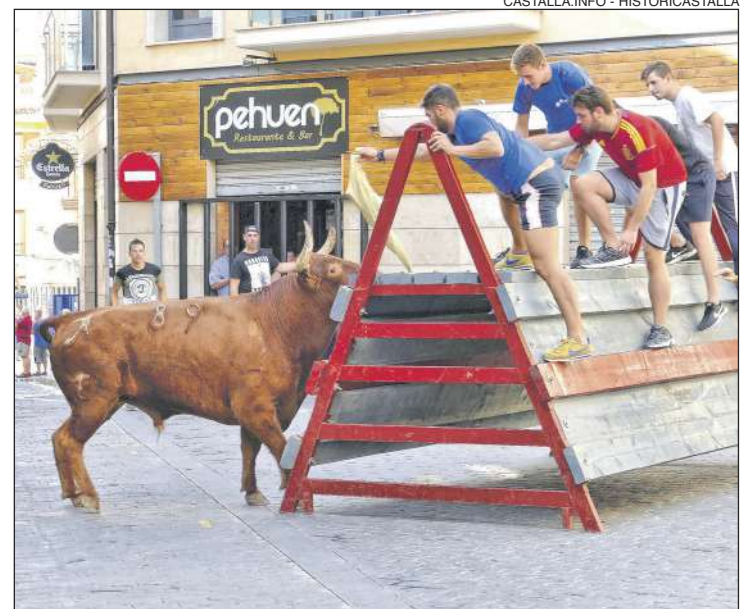
Hi haurà solta de vaquetes tots els dies

A més de realitzar un diagnòstic de la situació actual de la recollida de residus domèstics, s'ha de realitzar actuacions de recollida selectiva que reduïsquen les quantitats destinades a la planta de tractament de residus domèstics. En aquesta línia, les possibilitats de millora i optimització del servei passen per la prevenció en la generació i el desenvolupament de la recollida selectiva de residus.