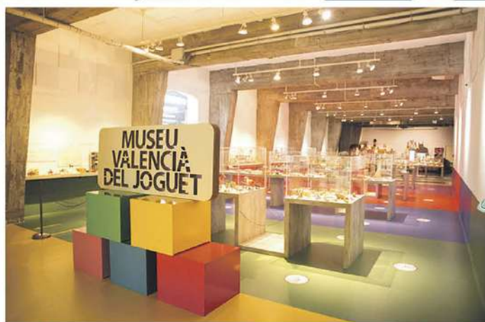
Museo del Juguete