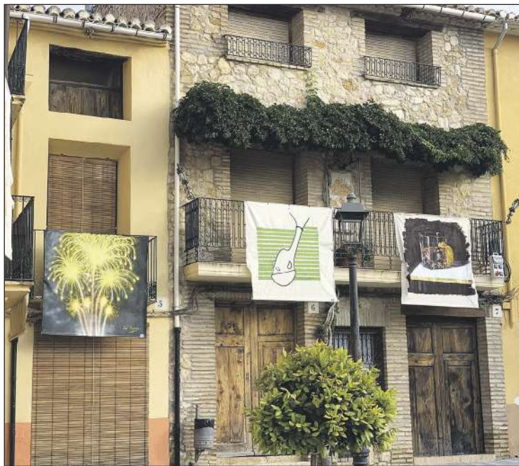
L'exposició es pot veure durant tot el mes d'agost

El dissabte 6 d'agost també en la plaça del Convent, l'Associació d'Estudis Tradicionals Sagueta Nova, oferirà un espectacle de balls tradicionals.