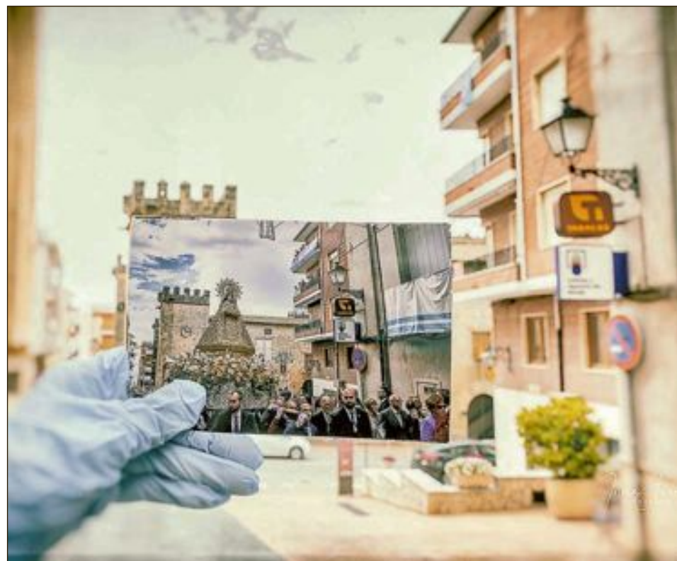
Comienzo de la procesión, en la calle de El Nostre Senyor Robat