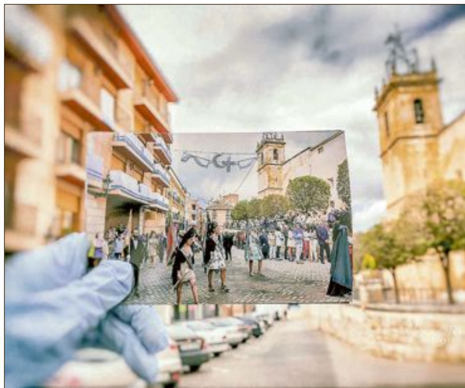
Desfile de las capitanes, detrás de la patrona