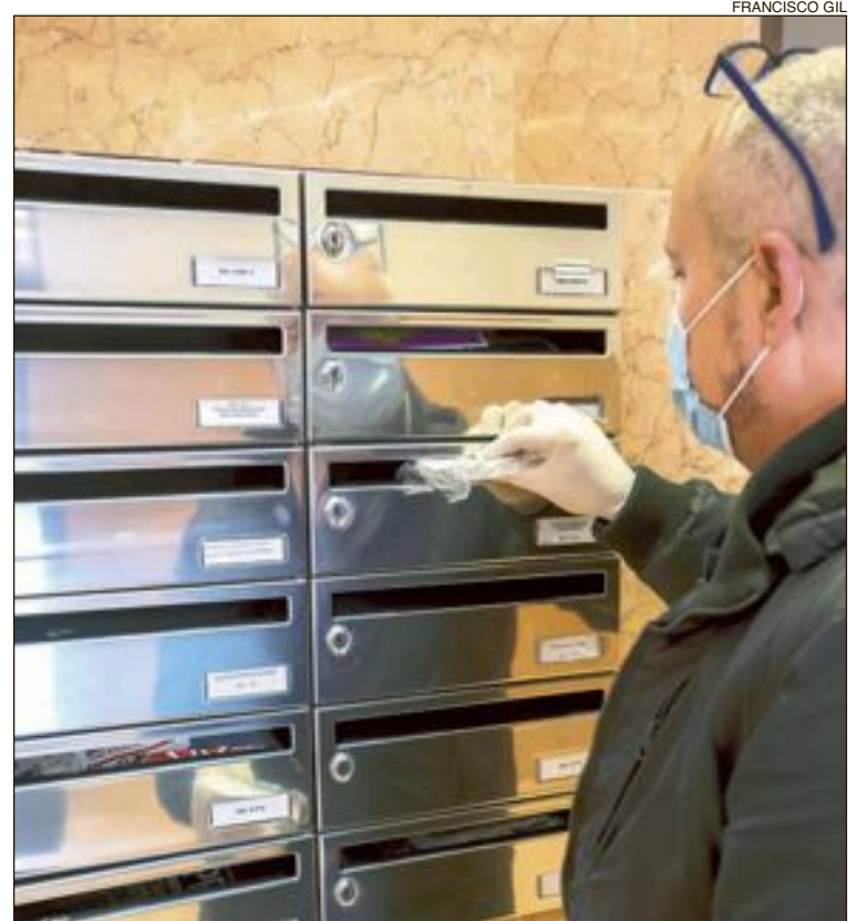
En la mayoría de los casos, las mascarillas se han buzoneado