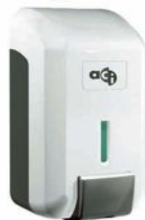
Dispensador de gel que está repartiendo ACI en todos los comercios

La nueva normalidad podría llegar a finales de junio, en el caso de que no se produzca un repunte del caso de contagios y enfermos por coronavirus.