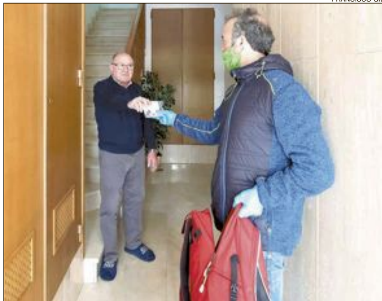
En cada paquete hay tres mascarillas, con las indicaciones de uso

Ya se anunció que el reparto duraría varios días y, en el caso de las personas que residen habitualmente en el campo, tendrán que ser ellas quienes recojan las mascarillas en el Ayuntamiento, presentando únicamente el DNI de una de las personas empadronadas en ese domicilio.