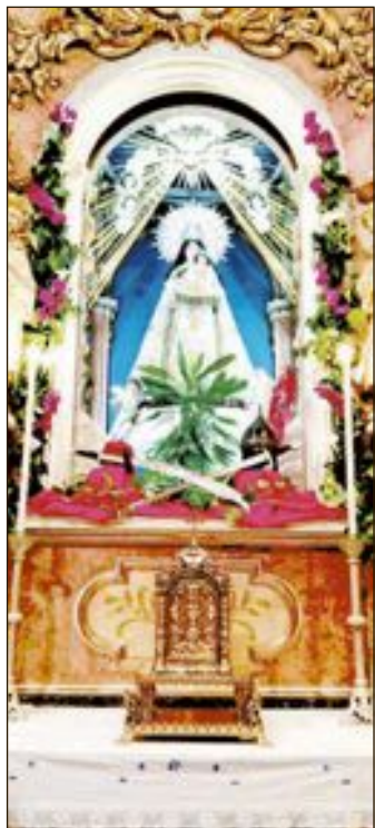
Virgen de la Salud, en la parroquia