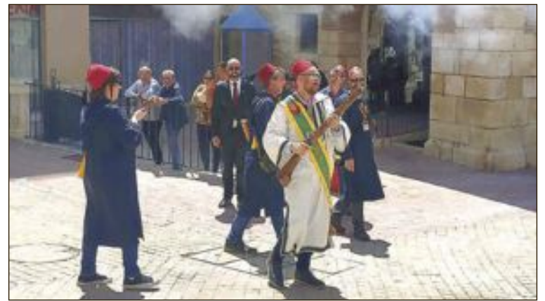
Les festes havien de celebrar-se del 9 al 13 de maig