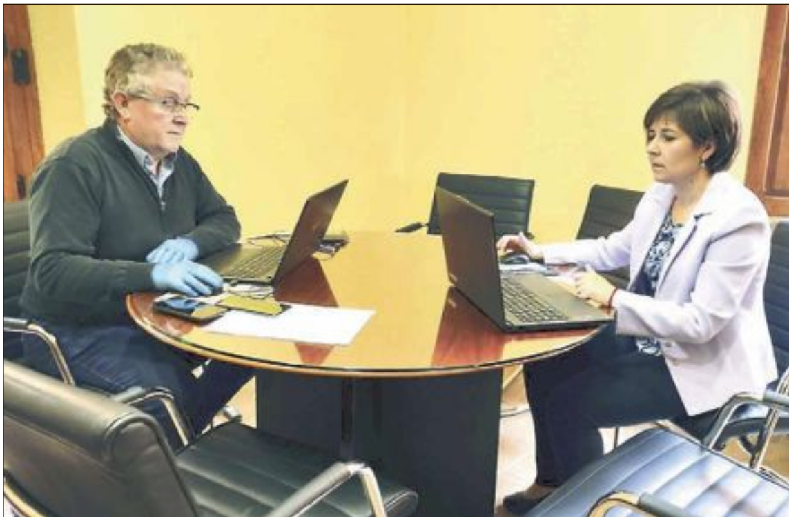
Videoconferència de l'equip de govern amb representants de l'oposició el dimarts 28 d'abril

El primer edil castellut assegura que "traspassarem pressupost de distintes partides pressupostàries que ja no es podran gastar a altres que ho necessiten mitjançant ajustaments comptables i administratius, seguint les directrius de Conselleria i complint amb el pressupost i, per tant, amb el límit de despesa i els