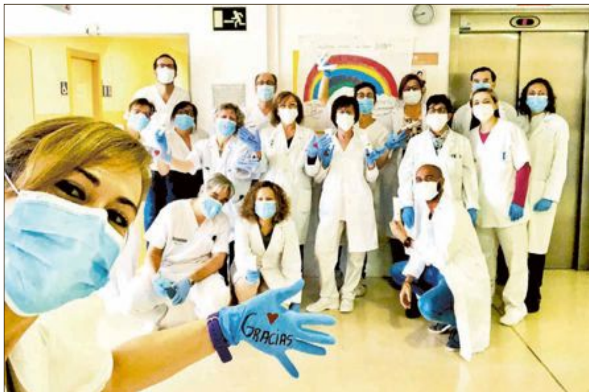
Personal sanitario agradece la donación de cosméticos a Natural Cosmetic Lab

A lo largo de la semana, se han ido realizando entregas de lotes de cremas hidratantes ecológicas en los diferentes centros sanitarios y de mayores, con las que aliviar los daños que están causando en las manos de estos profesionales las duras jornadas de trabajo a las que se están viendo sometidos. Sequedad, grietas o picores... son algunas de las consecuencias del reiterado