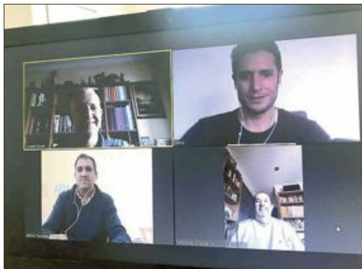
Videoconferencia entre los directores de COEVAL, IBIAE y FEDAC

Por eso, la patronal propone la adopción por parte de las administraciones públicas de medidas de choque incentivadoras en todos los ámbitos, por ejemplo a nivel financiero, fiscal y laboral que permitan no solo que la industria del territorio pueda aportar todo su potencial a clusters como el de la industria sanitaria de la