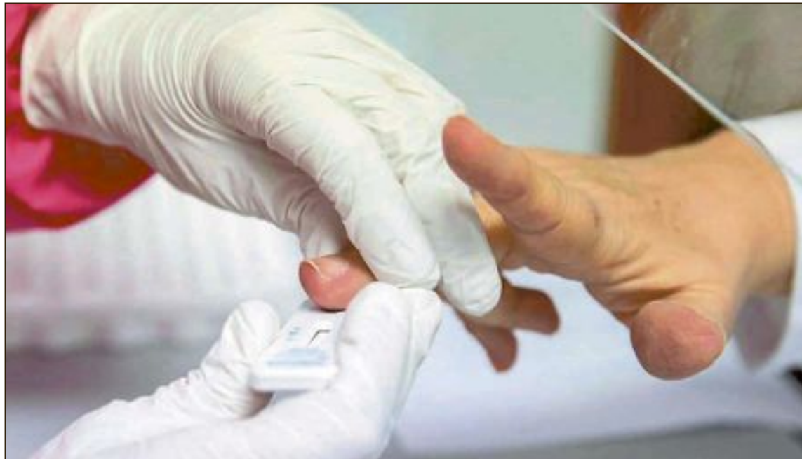
Los test rápidos permiten conocer en unos 15 minutos si la persona está o no infectada por el virus

Los 90 test adquiridos por el Consistorio se realizaron el lunes 27 de abril y permitieron conocer en unos 15 minutos si la