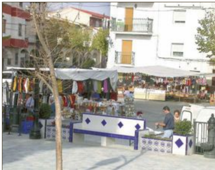
L'Ajuntament demana als veïns de la localitat que siguen responsables

L'Ajuntament demana als veïns de la localitat que siguen responsables i tinguen en compte les mesures de precaució que s'han pres.