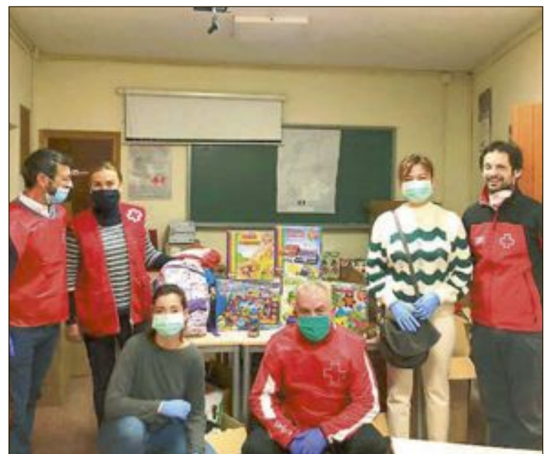
Se han repartido 50 lotes compuestos por cinco juegos de mesa, una mochila con material escolar, libros de lectura y productos alimentarios en las localidades de Ibi, Castalla y Onil

aportaciones a los centros sanitarios. Desde el Ayuntamiento señalan la importante colaboración que está existiendo y que permite seguir luchando contra el virus.