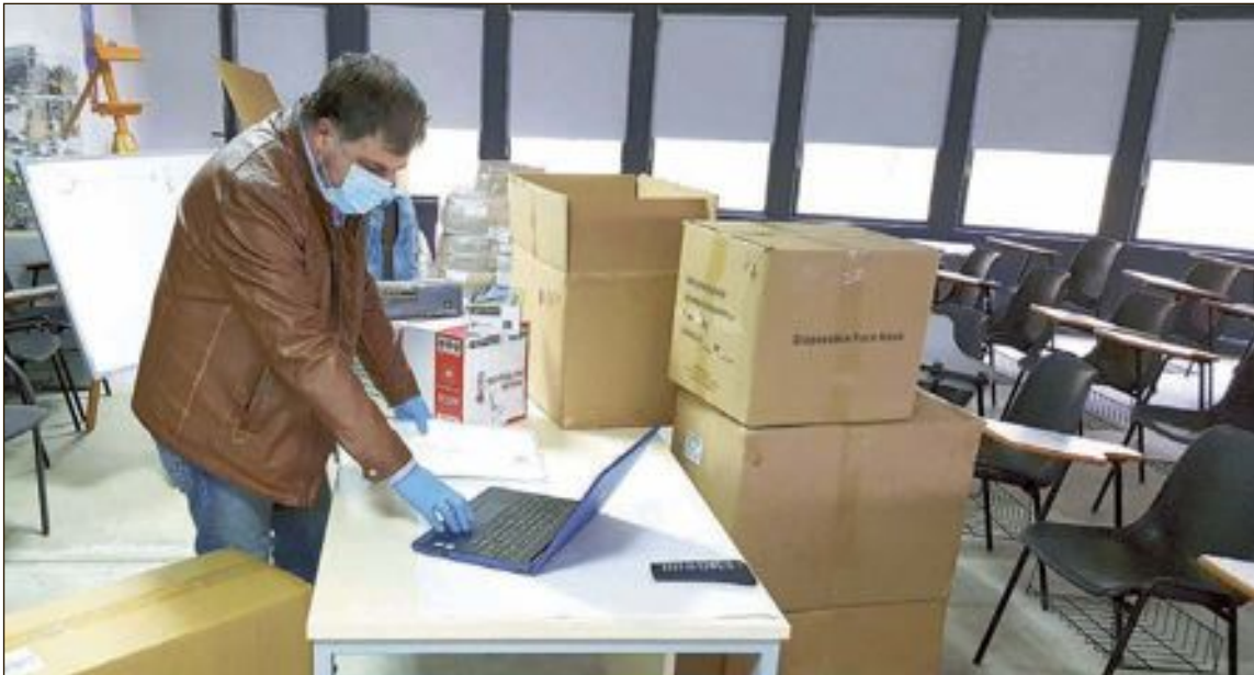
Els equips estan formats per màscares, guants i bussos de diverses talles