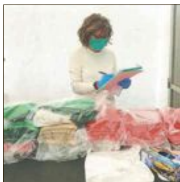
Algunas de las 25 mujeres que, junto a un hombre, componen el grupo #yomequedoencasacosiendo