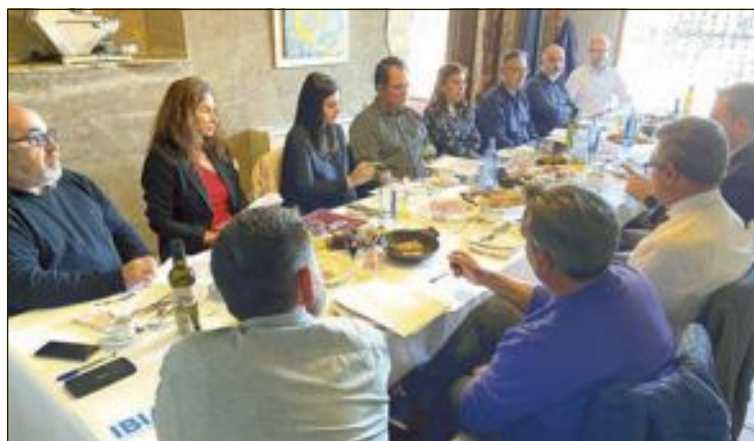
En los desayunos empresariales de marzo se explicó este proyecto

Actualmente, el eje industrial Ontinyent-Alcoy-Ibi es uno de los más potentes de la Comunidad, capaz de adaptarse y de ofrecer respuestas rápidas como ha demostrado siempre, especialmente ahora, y con un saber hacer y talento consolidado a base de una larga trayectoria.