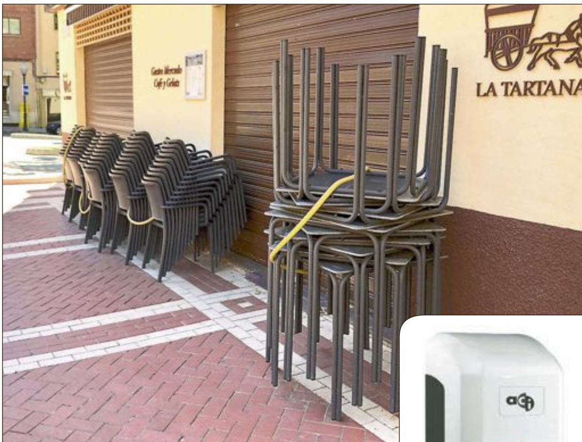
El plan contempla, en su primera fase, la apertura de terrazas en la restauración con un límite del 30 por ciento del aforo

Sin embargo, lo que ya no podrá instalarse será el mercadillo de los lunes, añade Ruiz, ya que el plan del Gobierno solo permite puestos de alimentación y de productos esenciales, como limpieza, y en el caso de Ibi