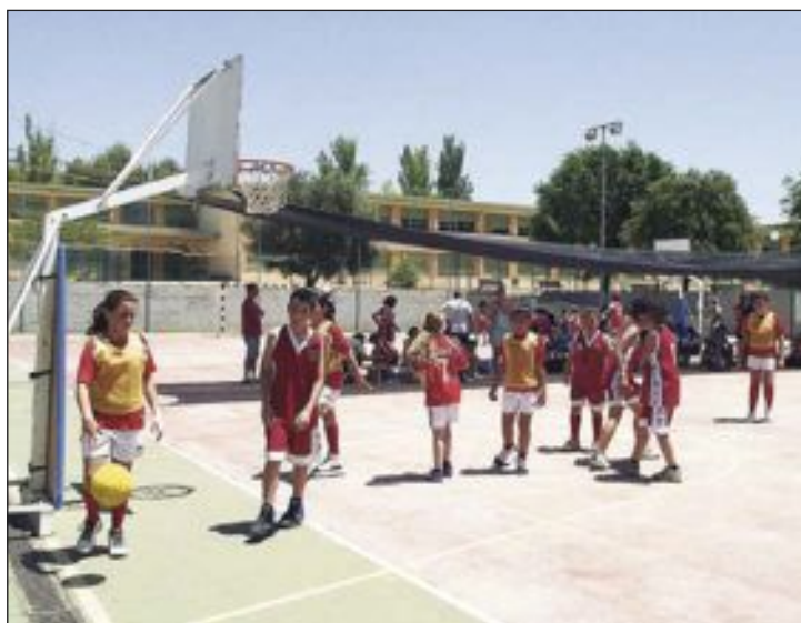
Hasta ahora sólo podían inscribirse en las Escuelas los alumnos de Primaria

El precio de la entrada es de 3,50 euros.