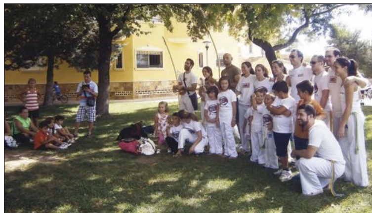
Un grupo de capoeira realizó una exhibición a lo largo de la mañana