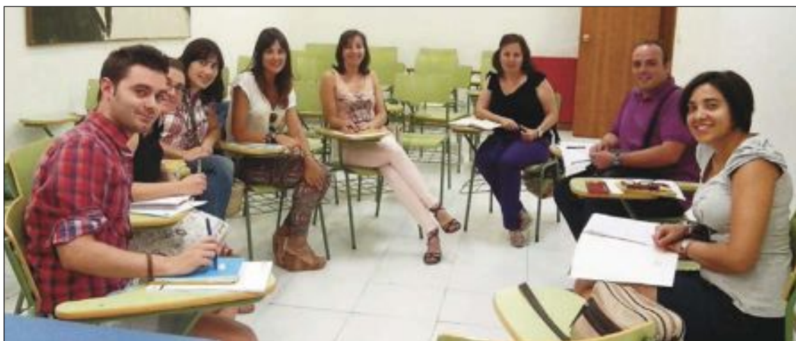
Técnicos de Turismo de poblaciones de la comarca, durante una reunión reciente celebrada en Villena

proyecto 'AVE Villena y Levante Interior', una de cuyas reuniones se celebró a principios de septiembre en la capital del Alto Vinalopó y a la que acudieron téc-