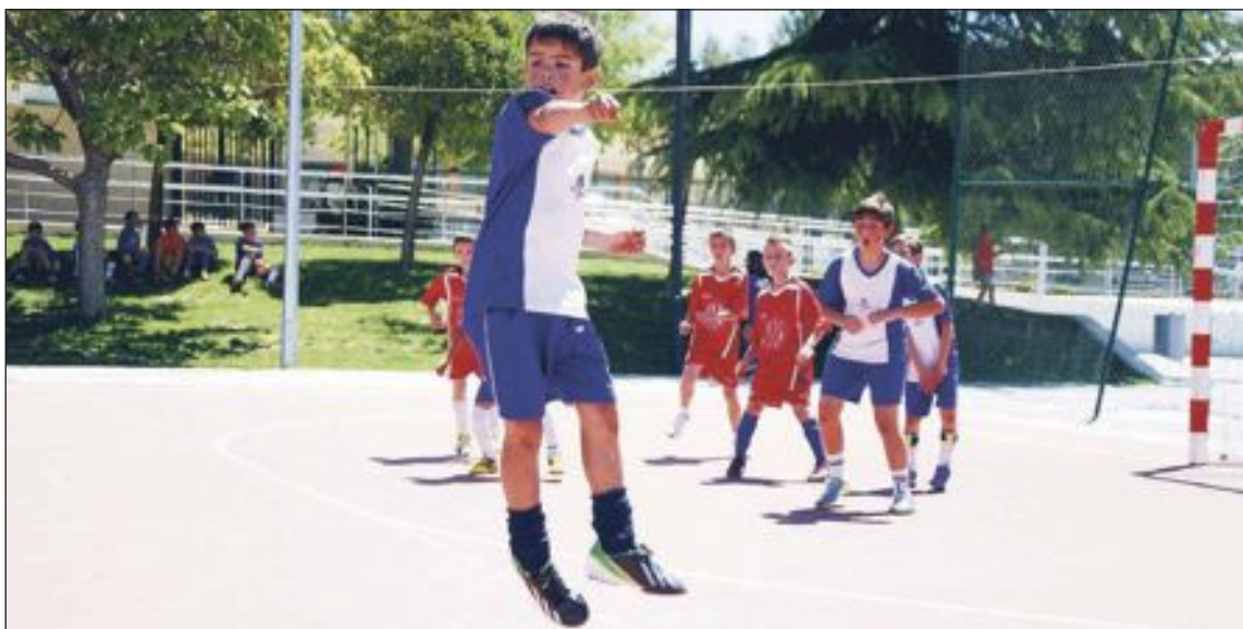
Unos niños juegan a futbito en una pista exterior

las educativas, posibilidad de federar equipos en próximas temporadas, cobertura sanitaria, pack de entrenamiento y un seguimiento evaluativo del alumno durante todo el curso.