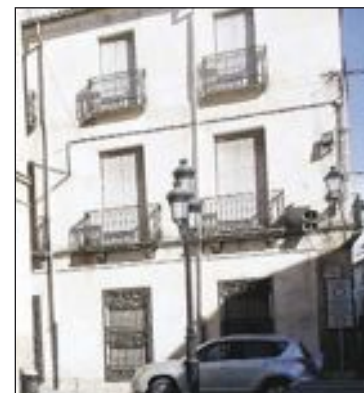
La casa se encuentra junto al actual edificio consistorial

En el Pleno de septiembre se aprobó destinar 375.000 euros a la compra de una casa junto al Ayuntamiento para trasladar allí varias dependencias municipales. El alcalde explicó que este inmueble, de unos 1.000 metros cuadrados y cuatro plantas, será totalmente accesible, a diferencia del actual edificio consistorial. Candela prevé que en el primer trimestre de 2014 ya esté habilitada al menos la planta baja.