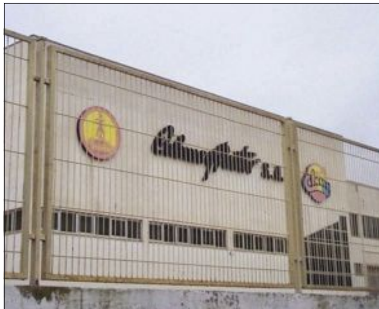
Exterior de la empresa Coloma y Pastor