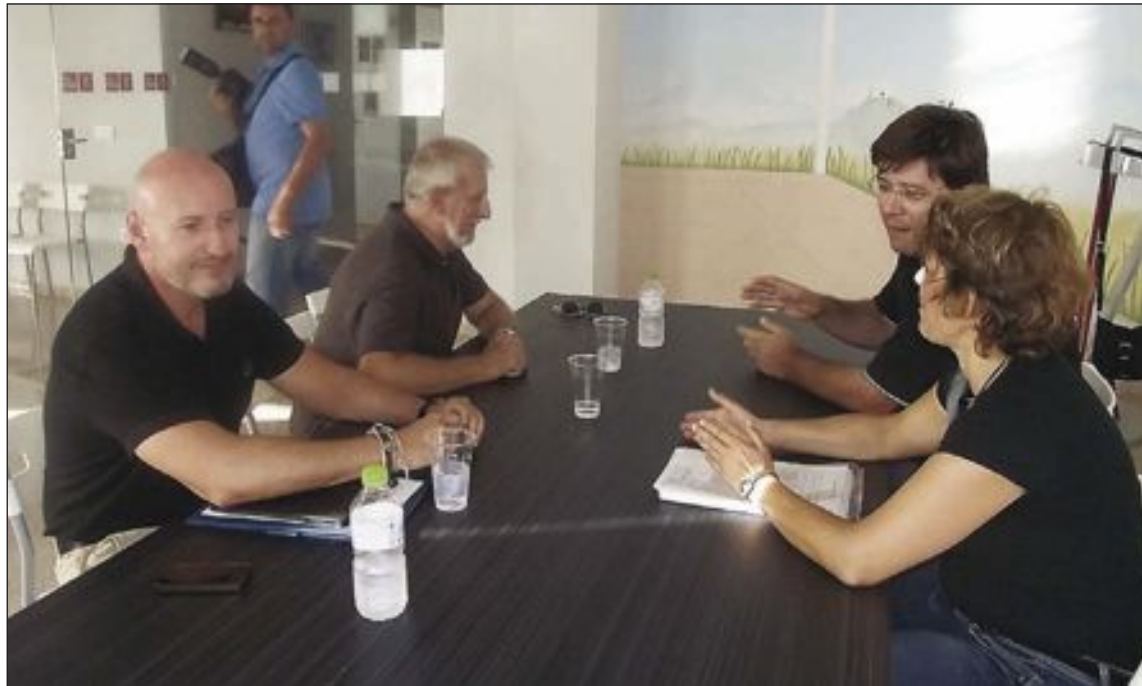
El CDL se reunió el 24 de septiembre con PSOE, ADI y EU y el 1 de octubre lo harán de nuevo