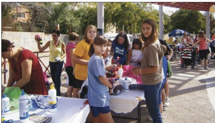
En el Parque Municipal de Onil hubo varias actividades infantiles y juveniles