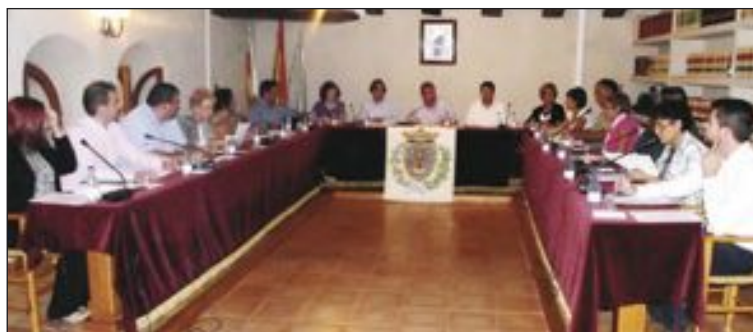
El miércoles 25 de septiembre se celebró el cuarto Pleno del año

A diferencia de algunas localidades vecinas, las arcas municipales de Castalla se encuentran en un estado envidiable: no sólo permiten al Ayuntamiento funcionar sin problemas en el día a día, sino que ahora han hecho posible amortizar de un plumazo todos los préstamos en vigor, gracias a una modificación de crédito de 847.000 euros aprobada en el último Pleno. De esta cantidad, más de 400.000 euros se destinarán a pagar todos los préstamos (con un importante ahorro en concepto de intere-