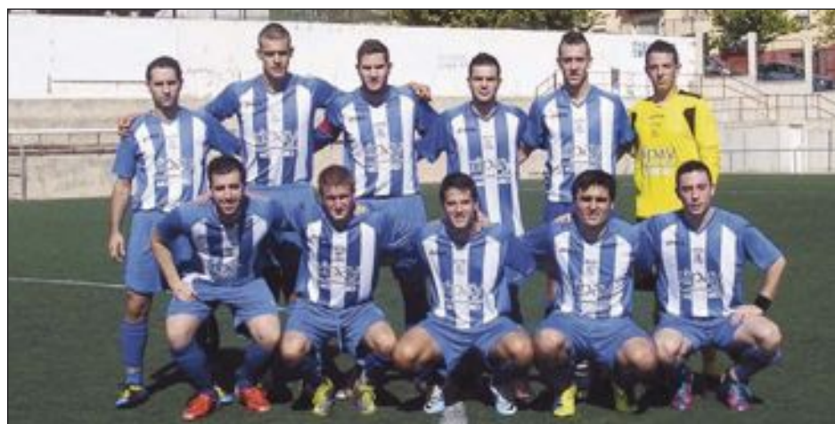
Once inicial del Castalla CF en el partido contra el Xixona Esportiu