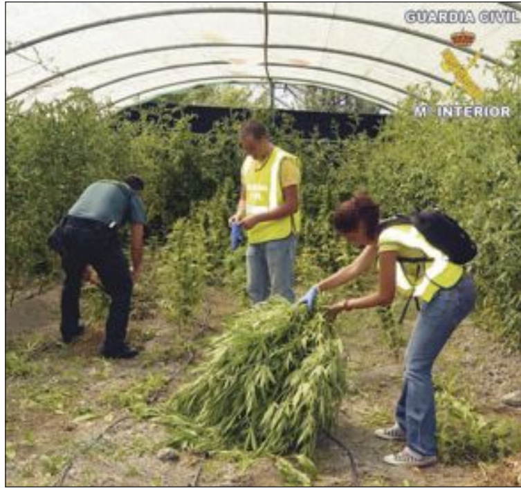
Plantación de marihuana desmantelada por la Guardia Civil en Castalla

Unos días después, la Guardia Civil volvió a decomisar 21 plantas: nueve en Ibi y 12 en Castalla. Según fuentes policiales, medían más de metro y medio y estaban en casas de campo, camufladas entre árboles y vegetación frondosa. Esta operación llevó a los agentes hasta otra plantación de 342 ejemplares en dos invernaderos: uno de