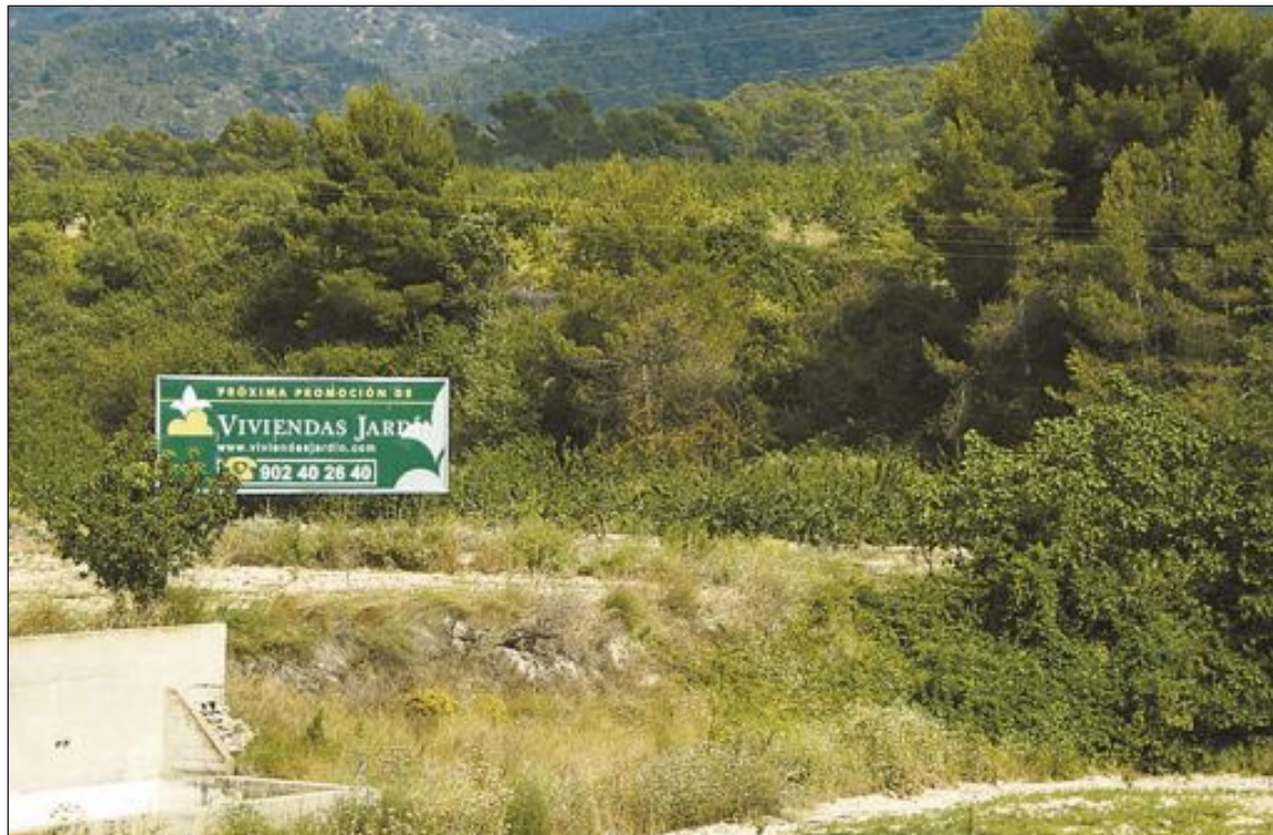
La promotora preveía la construcción de 350 chalés en una zona de alto valor ecológico y con poca agua

Este es el segundo recurso que rechazan los tribunales. En mayo de 2012, el Tribunal Superior de Justicia de la Comunidad Valenciana también desestimó un recurso contencioso-administrati-