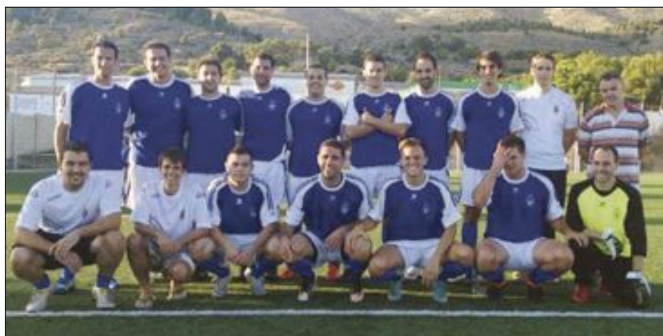
Plantilla de la Unión Deportiva Onil

puso contra las cuerdas a la Peña, que supo aguantar y llevarse los tres puntos, que dan mucha moral al equipo para seguir trabajando y mejorar.