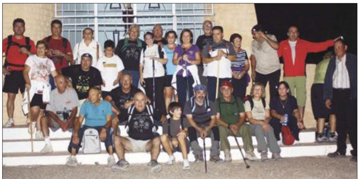
Los senderistas durante su visita a la ermita de San Pascual

Esta marcha está incluida en el programa que está realizando la asociación de vecinos de La Dulzura para dar a conocer los parajes históricos de Ibi y de su casco urbano.