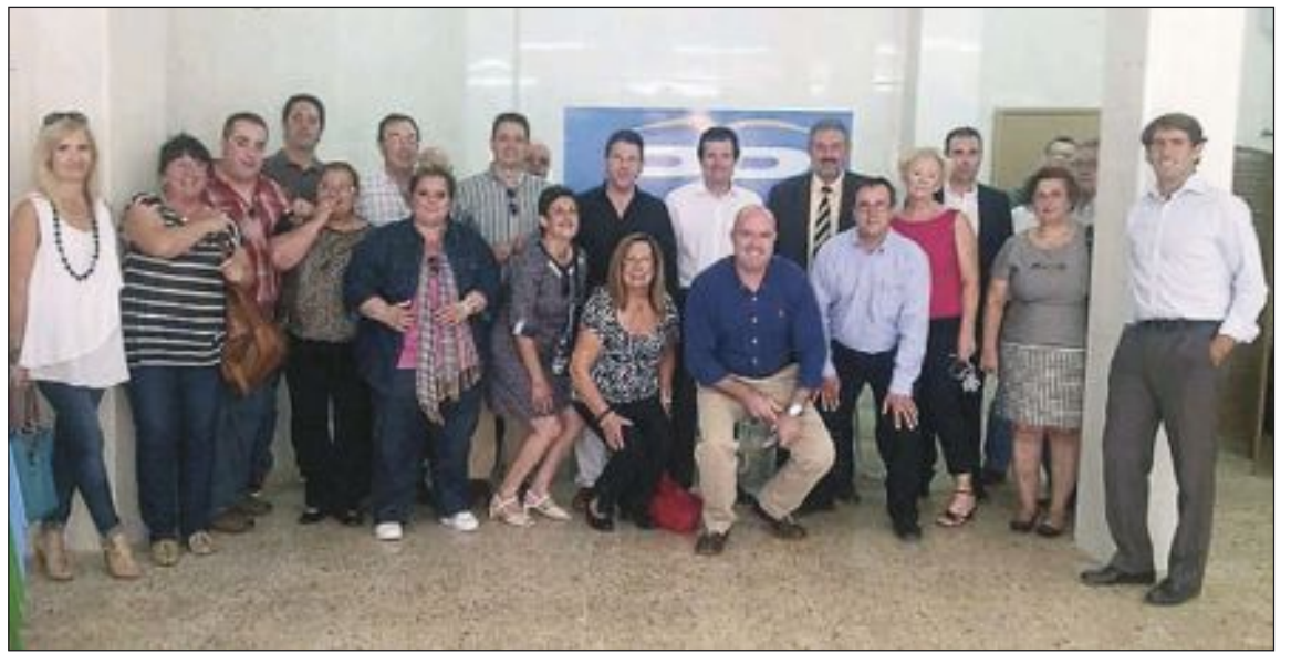
El presidente del PP en la provincia de Alicante, junto al alcalde, concejales y militantes populares de Castalla

Cientos de ciclistas de todas las edades, y con bicicletas decoradas de las formas más variopintas, participaron el 22 de septiembre en la primera edición del Castalla Cycle Chic , una simpática iniciativa que inundó la localidad de colorido y diversión sobre ruedas.