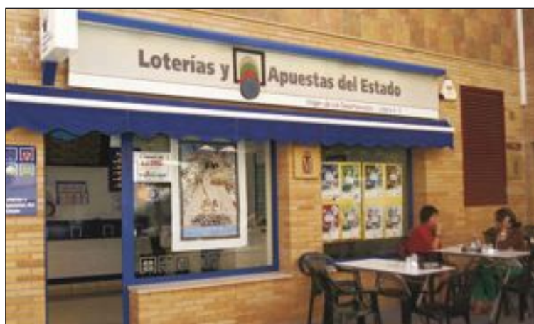
Administración Virgen de los Desamparados

El anterior boleto premiado, con la misma cantidad económica, se selló en el mes de junio y en septiembre de 2012 esta administración dio el premio de mayor cuantía, de 100.000 euros.