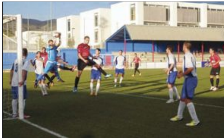
Una tensa jugada del partido entre la Peña Madridista de Ibi y el CD Biarense

En la segunda parte no hubo demasiada mejoría en el juego