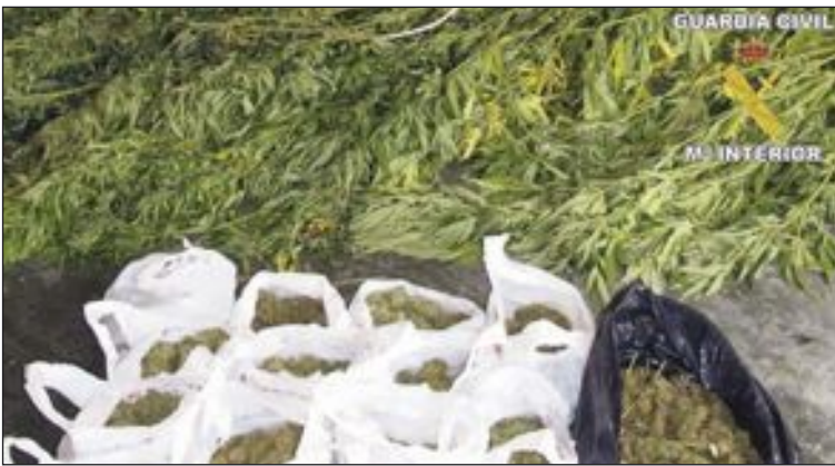
Plantas incautadas por la Guardia Civil

La operación tuvo lugar en Finca Terol el 14 de septiembre