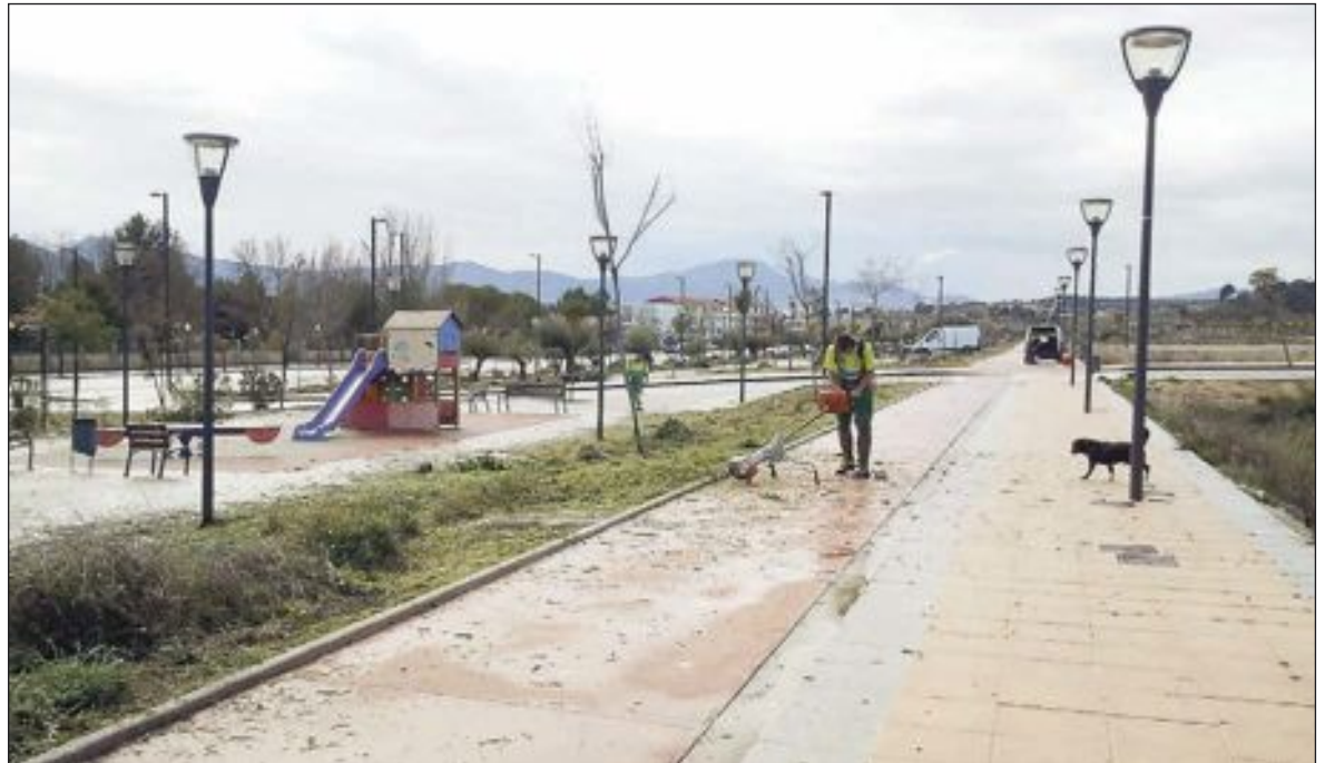
Trabajos de limpieza en el Alamí

Los propietarios piden al Ayuntamiento que reclame a la Generala las penalizaciones correspondientes por el retraso de las obras, ya que han transcurrido cinco años desde que la empresa fijara en el convenio urbanístico el 6 de noviembre de 2008 como fecha de finalización del Alamí.