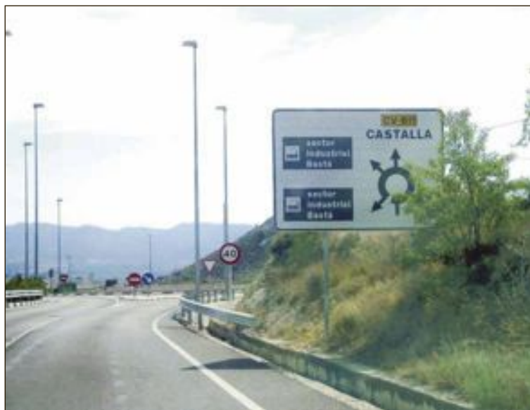
Acceso al polígono industrial Bastá, de Castalla

En la primera fase se urbanizarán 317.000 metros cuadrados, para atender una demanda de suelo industrial de 270.000