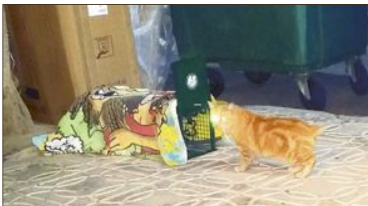
Para poder atrapar a los gatos callejeros y llevarlos al veterinario para su esterilización, los voluntarios instalaron y camuflaron jaulas con comida