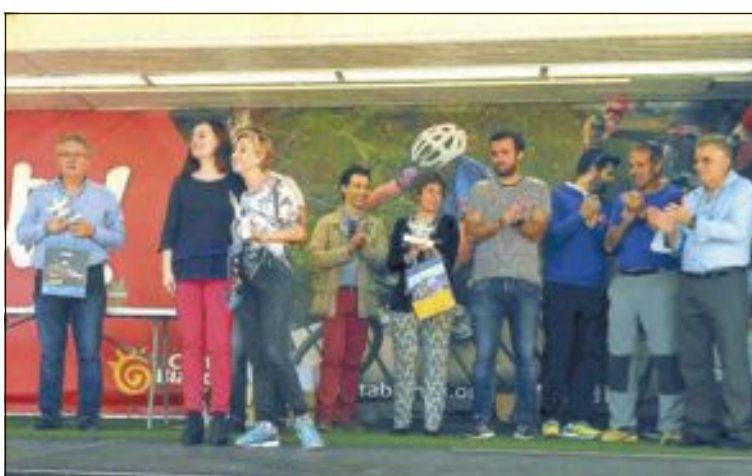
En la entrega de trofeos participaron los alcaldes y los concejales de Deportes de Ibi, Castalla y Onil