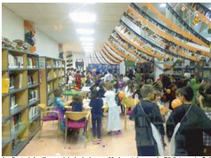
La fiesta infantil se celebró el viernes 28 de octubre en la Biblioteca de Onil

Esta exposición, titulada 'Senderos a la modernidad', cuenta con 77 pinturas y puede visitarse hasta el próximo 15 de enero.