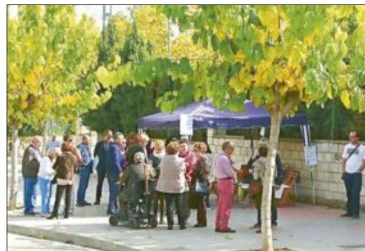
El acto fue organizado por la 'Plataforma canina sí, pero no así'