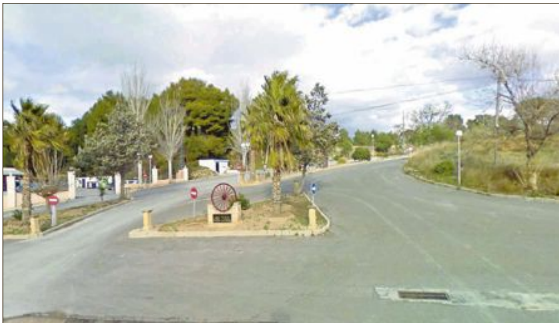
Entrada a Urbanización Terol por la carretera CV805

De momento, Suma está procediendo a la devolución íntegra de los recibos del IBI y posteriormente remitirá los nuevos donde el valor catastral corresponderá al suelo rústico. Aunque los vecinos de Terol desconocen todavía el importe resultante, el abogado añade que “la reduc-