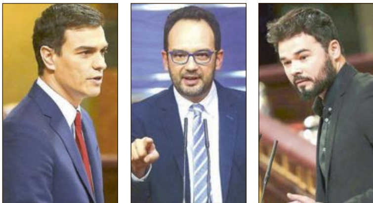
De izquierda a derecha. Pedro Sánchez, Antonio Hernando y Gabriel Rufián

Y aquí llega la tercera parte del título de este Editorial, en referencia al diputado de ERC Gabriel Rufián, quien en su breve intervención durante el acto de investidura no hizo más que decir verdades como puños americanos (que diría Mister X), sin anestesia y con valentía, capaces de sacar los colores a la bancada socialista y a una gran parte del hemicycle. Como las verdades molestan e incomodan, sobre todo si se retransmiten por televisión y hay riesgo de que el pueblo abra los ojos y caiga del guindo, casi todos los diputados (excepto los de Podemos y algunos más) se pusieron de acuerdo para denunciar públicamente lo que ellos consideraron una perorata ofensiva, impertinente y maleducada, impropia de un foro donde, hombre, ya se sabe, entre bomberos no conviene pisarse la manguera. Si se lo perdieron en directo, vale la pena buscar el discurso íntegro por internet (porque la presidenta del Congreso, Ana Pastor, le cerró los micrófonos antes de tiempo y no se escuchó el final). Por último, reseñar lo que votó Gabriel Rufián cuando le llegó el turno, que es lo que debería haber defendido Pedro Sánchez si realmente hubiera sido íntegro y coherente con su postura e ideas y no hubiera hecho mutis por el foro: "¡No es no!", espetó el independentista. Con un par.