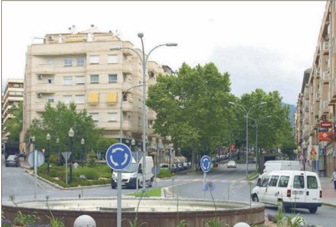
La poda de árboles es uno de los siete proyectos que van a ejecutarse en estos dos meses

Han quedado pendientes otros importantes proyectos, cuya ejecución podría incluirse en los presupuestos municipales de 2017. Entre ellos, la accesibilidad del Museo de la Biodiversidad, actuación valorada en 57.765 euros, y la señalización en polígono industrial, en 15.000 euros.