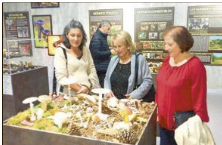
Hasta el 20 de noviembre puede visitarse la exposición sobre la variedad de setas que existen en el Museo de la Biodiversidad

El concierto fue ampliamente aplaudido por los asistentes, tanto por la calidad interpretativa de músicos y cantantes como por la buena acústica del templo parroquial ibense para este tipo de obras musicales.