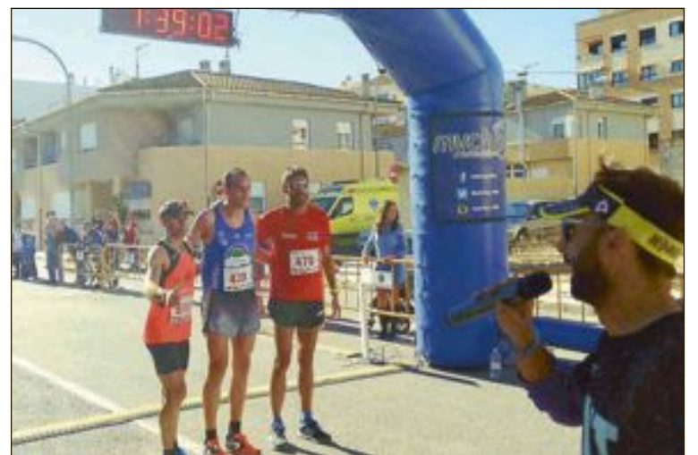
Los tres primeros clasificados de la carrera, en la línea de meta