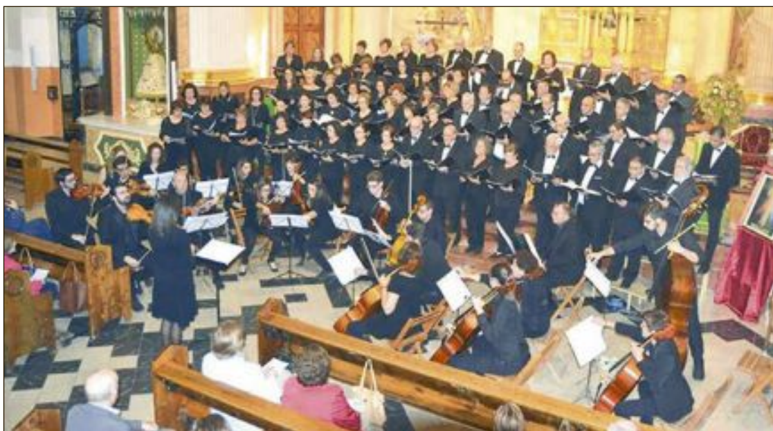
En la segunda parte del concierto actuaron conjuntamente las corales de Ibi y Onil y la Camerata de la Foia

IV Concierto de Todos los Santos, en la Transfiguración del Señor