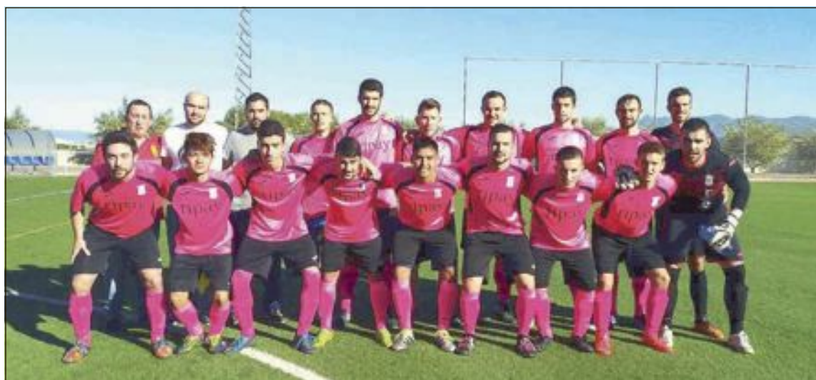
El CF Castalla presentó su nueva segunda equipación en Aiello de Malferrit

Comentario (José Payá): Partido muy raro el disputado la jornada pasada en Aiello de Malferrit, donde, por cierto, el CF Castalla estrenó la segunda equipación, de un llamativo combinado de los colores magenta y negro.