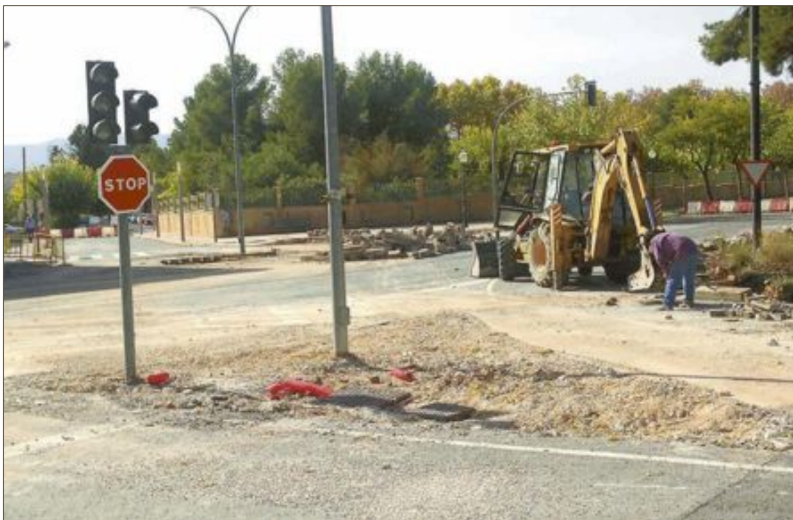
Los establecimientos de la zona se están resintiendo ya de la falta de circulación de vehículos y peatones

Sin embargo, mientras duran las obras los conductores se están viendo obligados a desviarse muchos metros de sus trayectos habituales y los establecimientos de la zona se están resintiendo ya de la falta de circulación de coches y peatones.