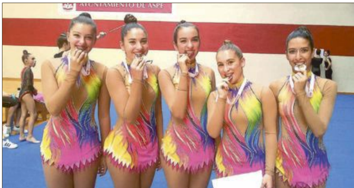
El conjunto Juvenil del Club Rítmica Ibi logró la segunda posición en el Torneo de Aspe, disputado el 16 de octubre

Pueden leer el resto de la crónica en la página web del club: www.futsalibi.com .