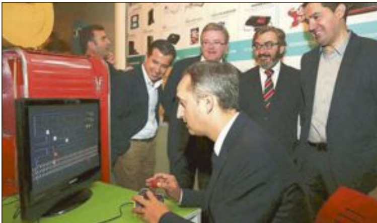
El presidente de la Diputación de Alicante, César Sánchez, juega al clásico Comecocos (Pac-Man) ante la mirada del alcalde de Alcoy y otros políticos

La colección, propiedad de Pablo Avilés, vecino de El Campello, incluye desde los primeros modelos comercializados hasta