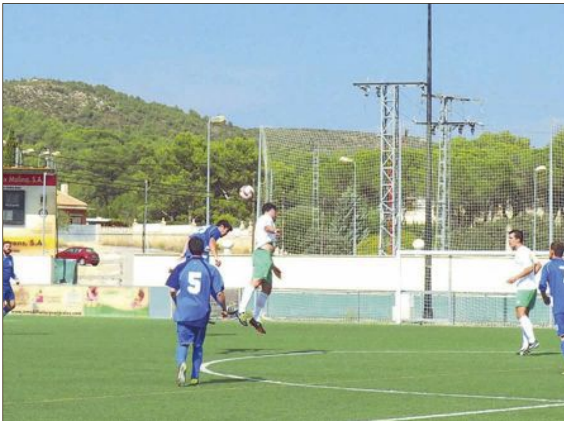
Imagen de archivo de un partido jugado por la Peña Madridista de Ibi esta temporada

Tras un inicio dubitativo, en el que la Peña no conseguía trenzar jugadas que hicieran daño al rival, el equipo supo calmar los nervios iniciales y ponerse el mono de trabajo, y con ello empezaron a llegar las claras ocasiones frente a la portería rival, pero no estaban precisos los jugadores de la Peña.