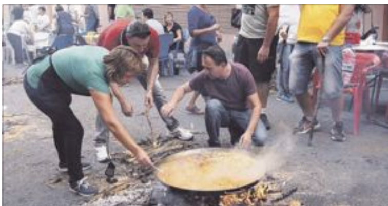
Participantes en el concurso de paella durante el pasado 9 d'Octubre