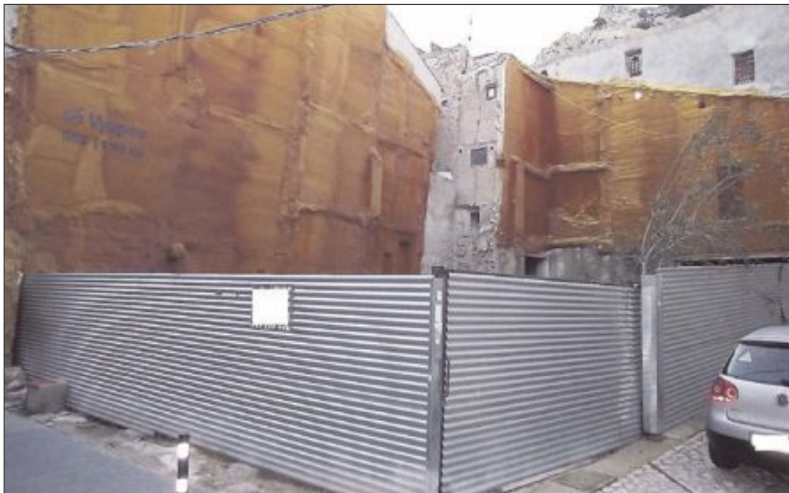
La parcela que se quiere expropiar se encuentra situada en la calle Mayor, a la altura del número 36

El sábado 26 de septiembre se celebró en el Auditorio una gala de variedades a beneficio de la Asociación de Familiares y Amigos de Enfermos de Alzheimer de Castalla y Onil.