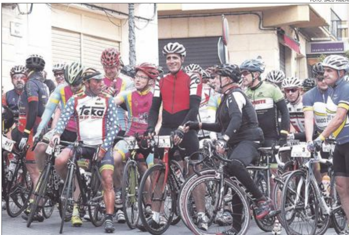
Algunos corredores rodean a Miguel Induráin momentos antes del inicio de la marcha

Ha habido casos, pero en el ciclismo ahora se está trabajando bien y hay controles serios y rigurosos. Lamentablemente ha habido algunos casos que han manchado bastante la imagen de este deporte, pero yo creo que va por buen camino, y entre la federación, equipos y corredores están haciendo un buen trabajo y creo que dentro de unos años dará su fruto.