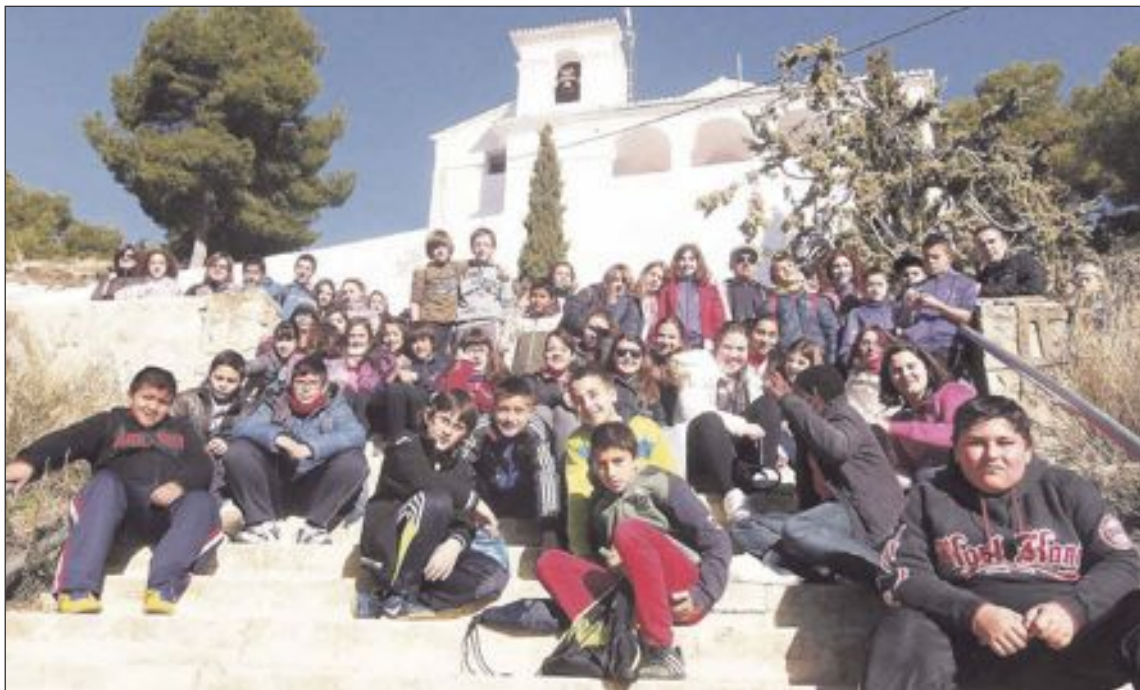
Esta actividad va dirigida a alumnos de 5º y 6º de Primaria y lleva incluida una excursión a Santa Lucía