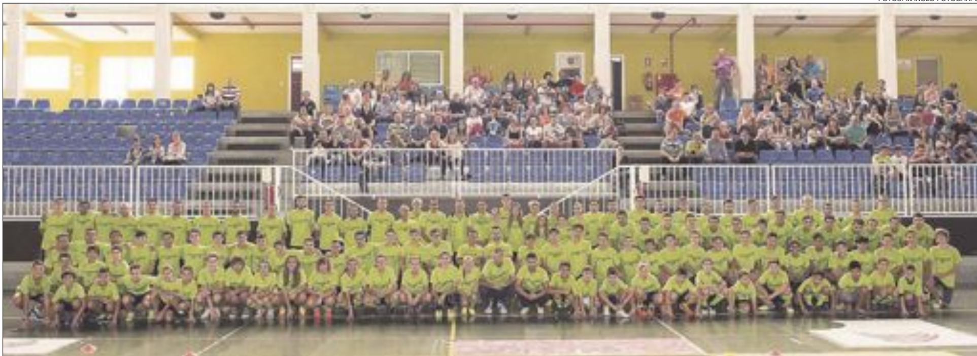
La presentación de todos los equipos del club Futsal Ibi se celebró el sábado 19 de septiembre en el Polideportivo Derramador