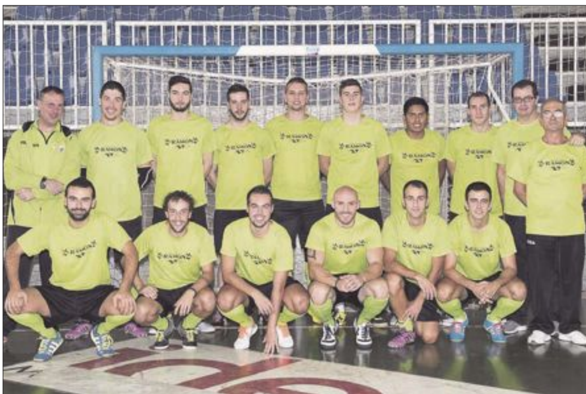
Futsal Ibi Sénior (Tercera División)