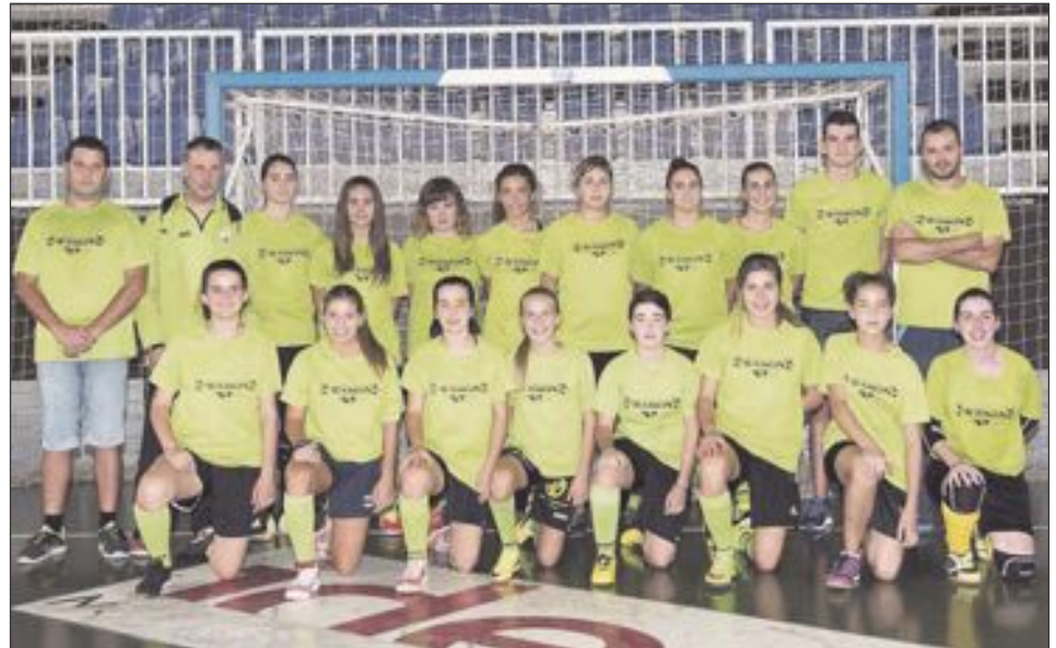
Futsal Ibi Sénior Femenino