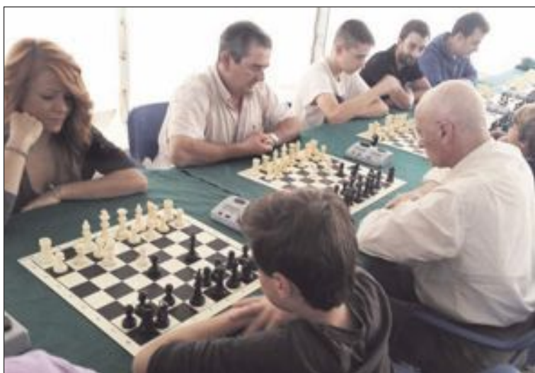
Las partidas de ajedrez levantaron gran expectación en el interior de la carpa