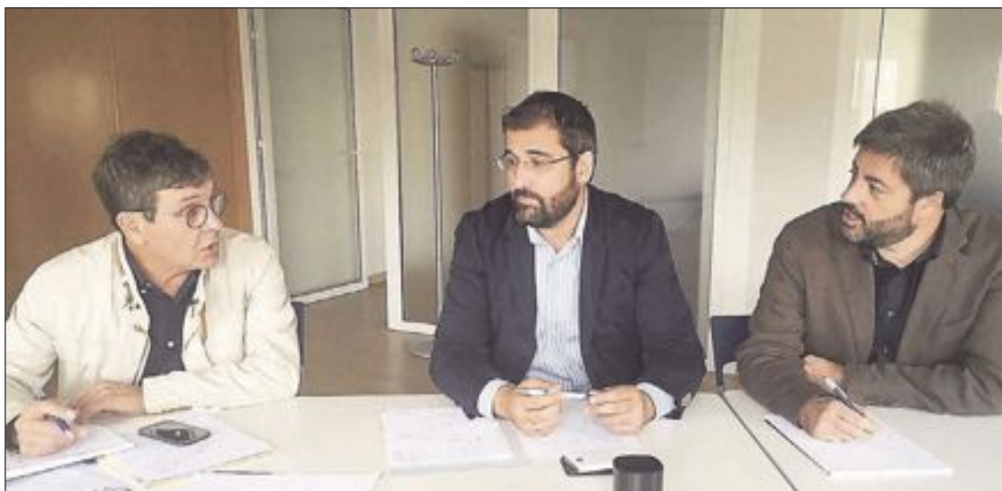
Responsables de las asociaciones empresariales COEVAL, IBIAE y FEDAC

Además, y en relación a la Ley de Participación Institucional, la Plataforma manifiesta su desacuerdo con el contenido de la misma, desacuerdo que ya se le