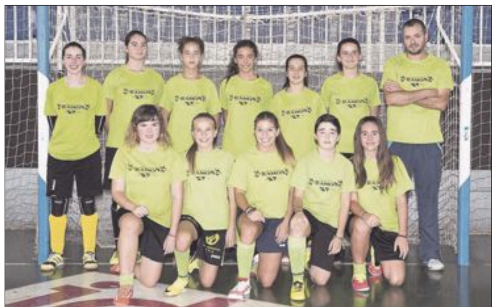
Futsal Ibi Cadete Femenino