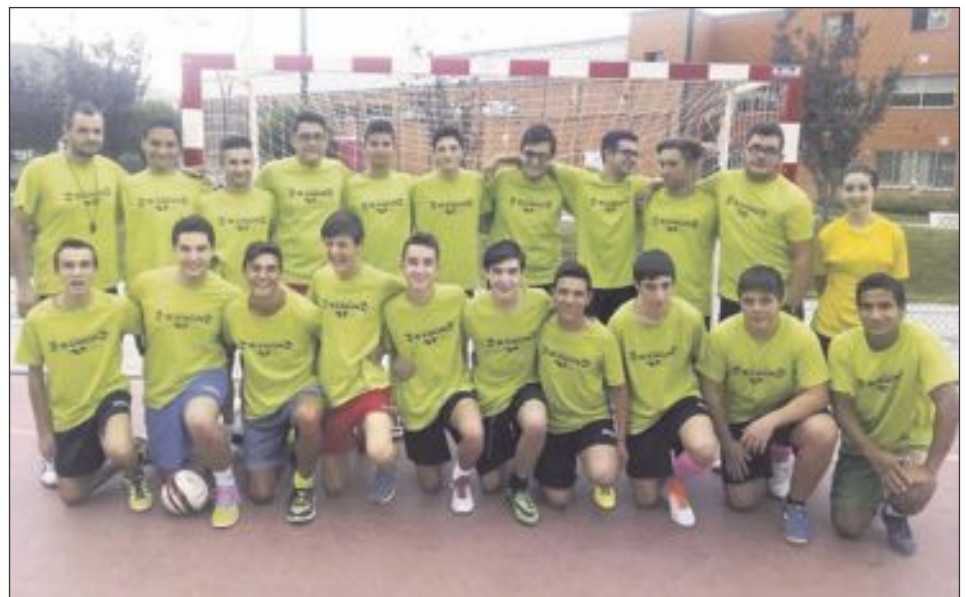
Futsal Ibi Juvenil 'B'