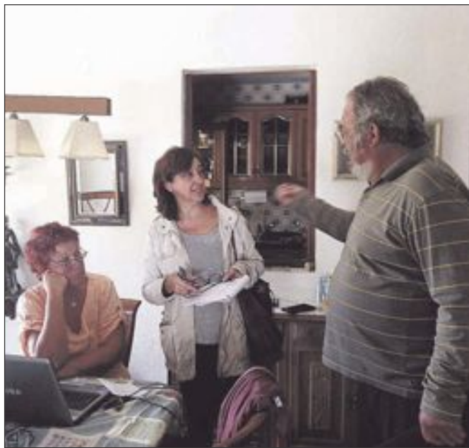
La pareja explica el suceso a la periodista