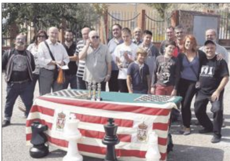
Algunos participantes en el V Trofeo de Ajedrez de las fiestas de San Miguel