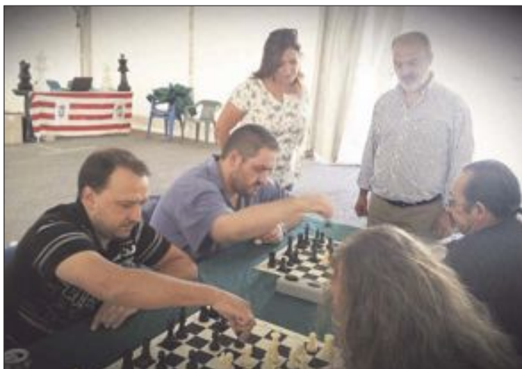
Un total de 22 jugadores participó en el V Trofeo de Ajedrez