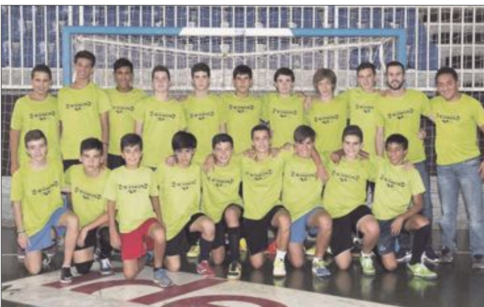
Futsal Ibi Cadete Masculino