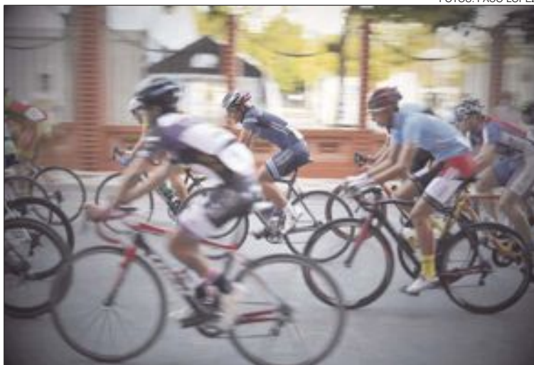
Alrededor de 150 cadetes participaron en el XXI Trofeo Ciclista de San Miguel