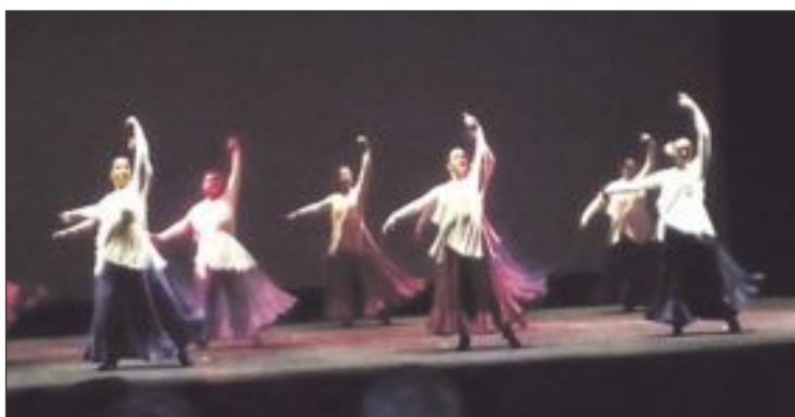
Arriba, Banda Jove de Castalla; abajo, Escuela de Danza de Santa Cecilia