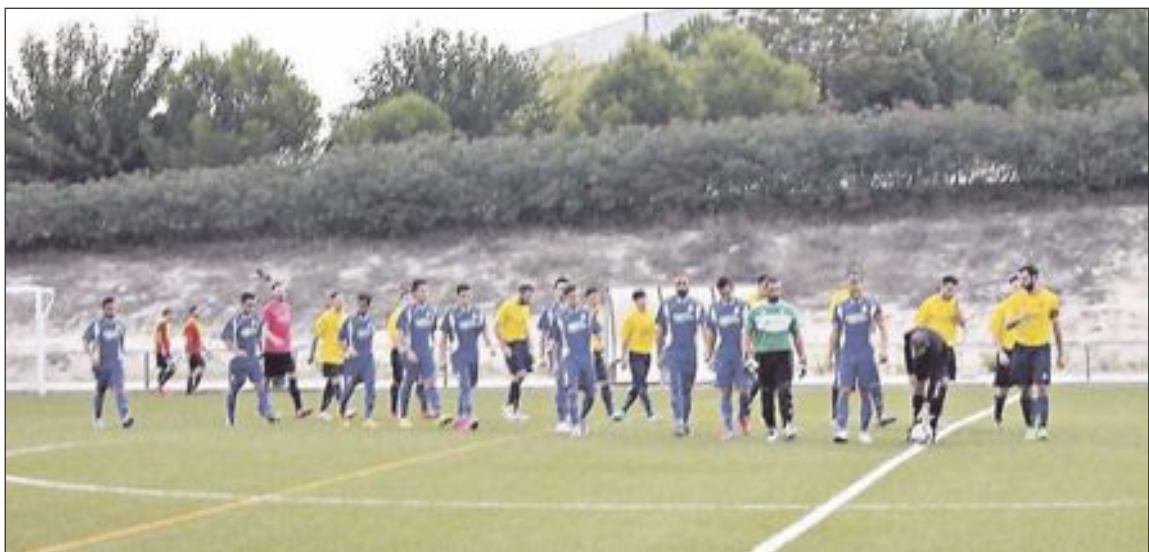
Montaverner y UD Onil se enfrentaron en la segunda jornada de la presente temporada

La siguiente jornada, el Onil recibe al Villena CF 'B', el sábado 3 de octubre a las 17:00 horas en el Estadio Municipal.