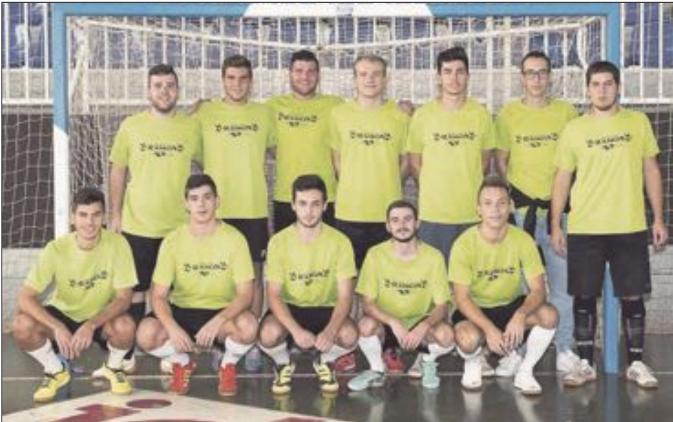
Futsal Ibi Sénior (Preferente)