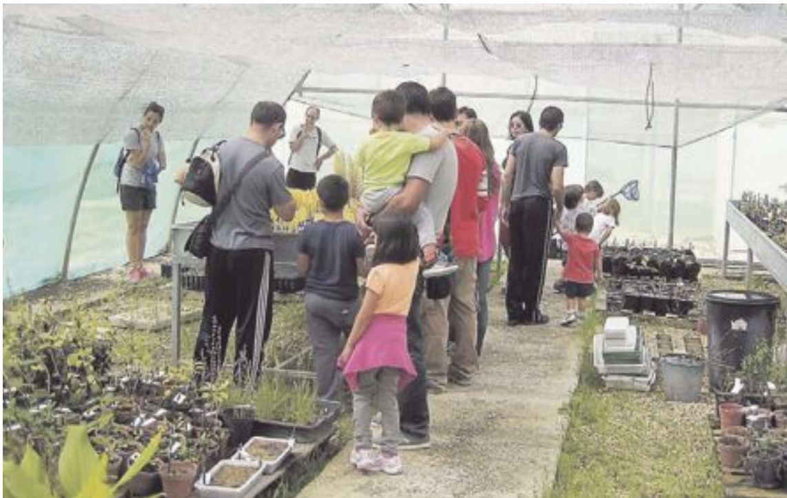
La exposición está instalada en los invernaderos del Jardín Botánico y fue inaugurada el 27 de septiembre