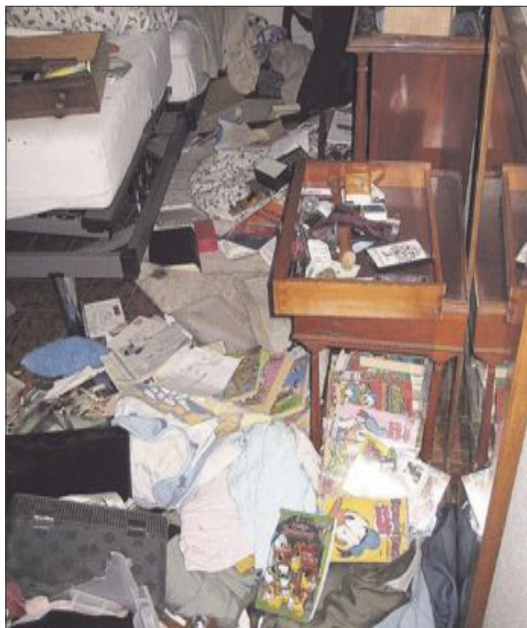
Los ladrones rebuscaron por toda la vivienda