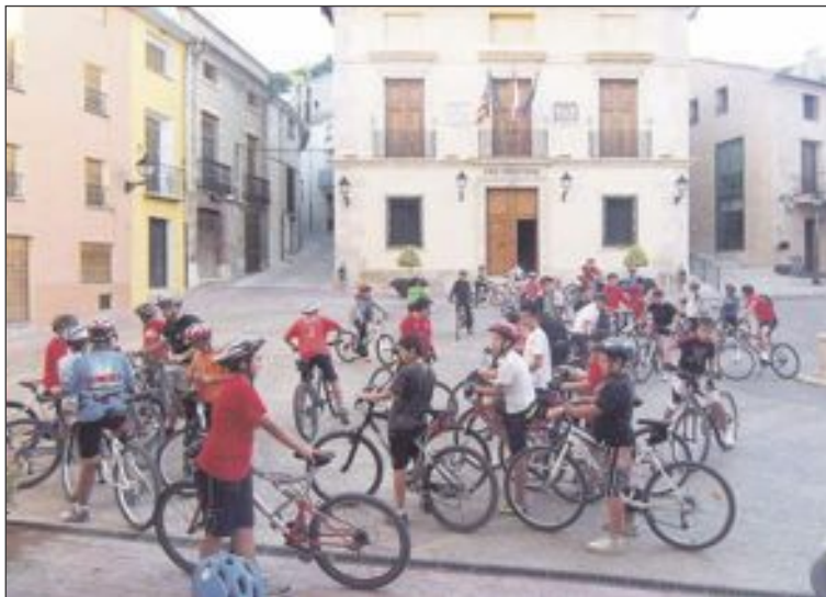
La vuelta al pueblo en bicicleta congrega cada año a numerosos vecinos