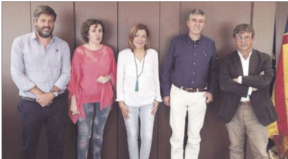
El encuentro con el Conseller tuvo lugar a principios de septiembre y asistió también la directora general de Industria

Además, es un claro ejemplo de la vertebración económica territorial que, a partir de una idiosincrasia industrial común y uniendo esfuerzos, pretende ser una única voz con suficiente potencial para ser tenida en cuenta en los foros donde se establezcan los marcos que propi-