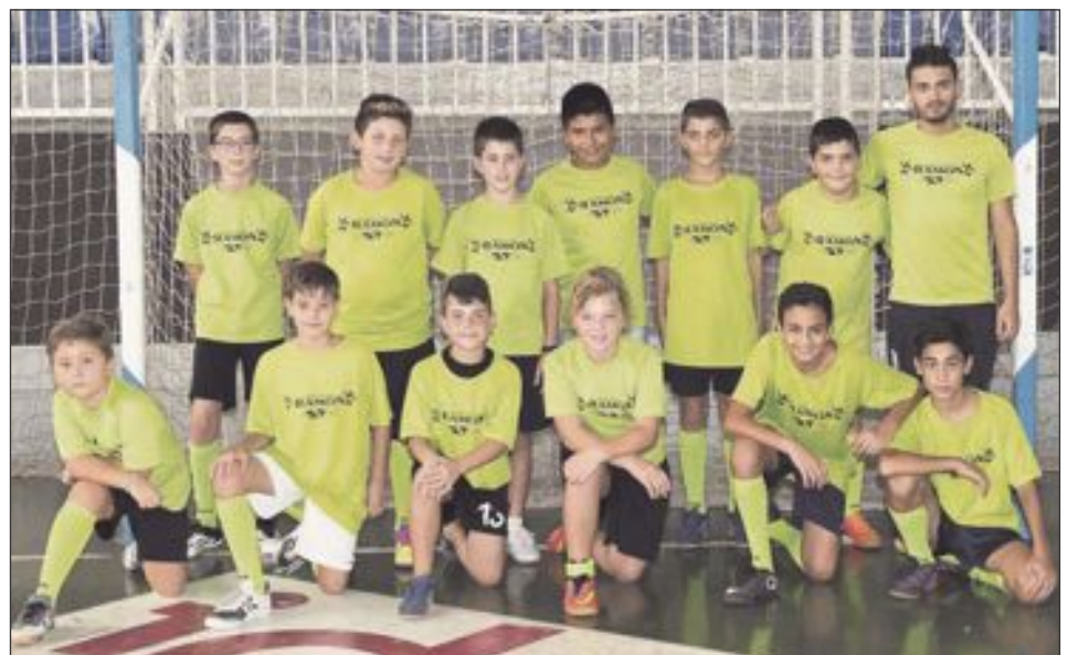
Futsal Ibi Infantil 'B'