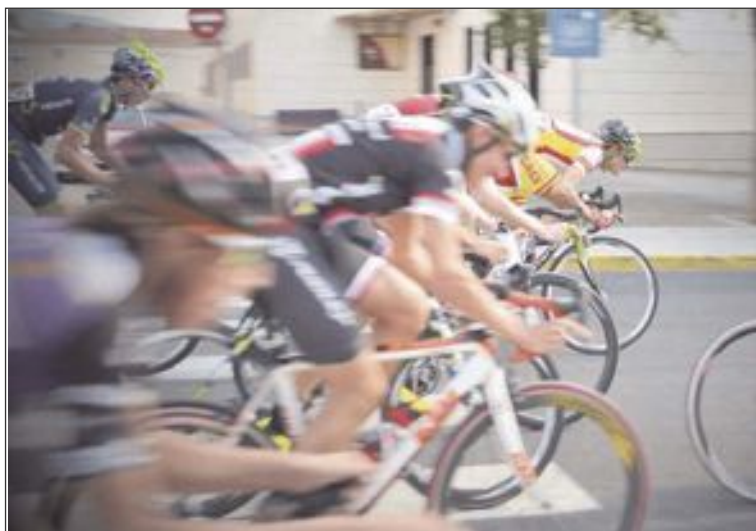
Los ciclistas dieron varias vueltas a un circuito urbano