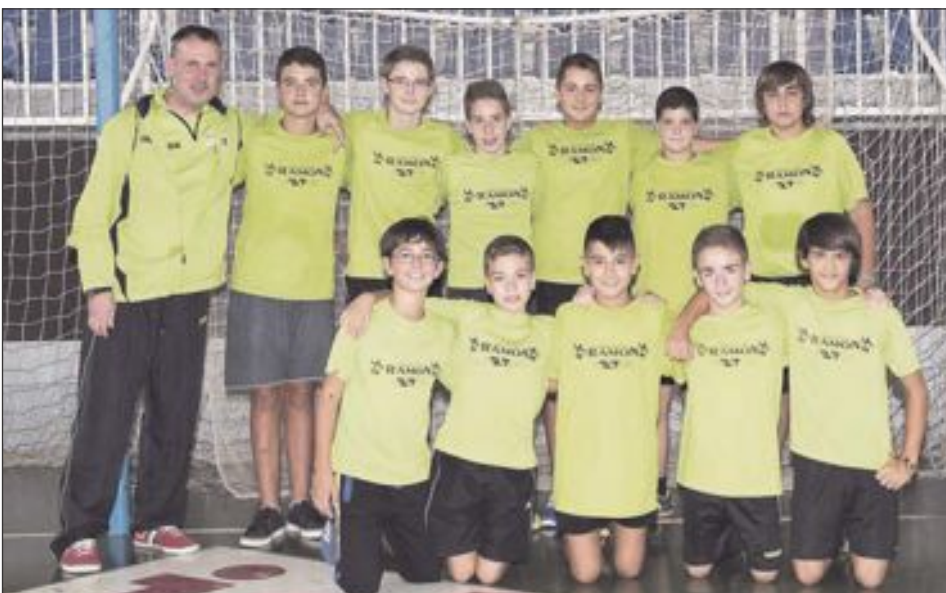
Futsal Ibi Infantil 'A'