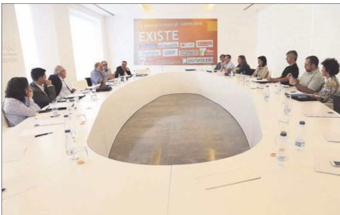
Responsables de los medios mantuvieron una intensa jornada de trabajo para dibujar el futuro colectivo de la prensa escrita local y comarcal de la región