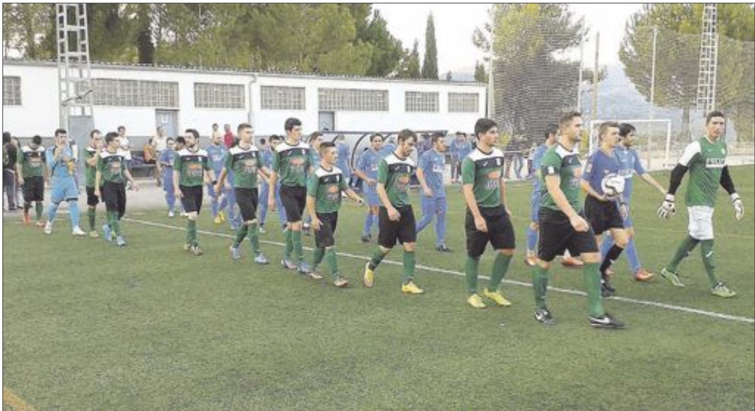
Los jugadores del CF Castalla (con equipación verde y negra) salen al terreno de juego (foto de archivo)