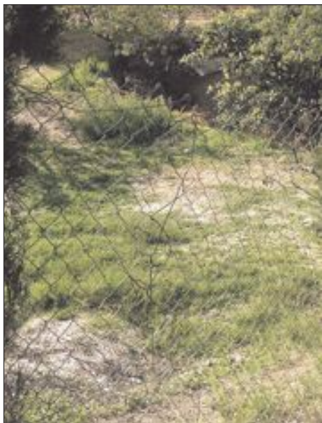
Los asaltantes cortaron la alambrada y cruzaron al interior de la finca