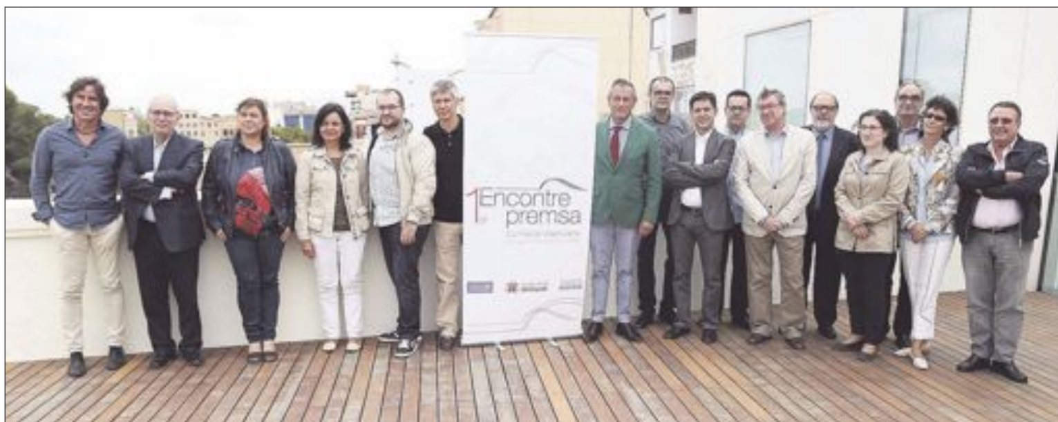
Editores y directores de once periódicos de la Comunidad Valenciana se dieron cita el pasado 29 de septiembre en Onteniente

Crónica de Vinaròs, 7 Dies Vinaròs, 7 Dies Benicarló, Crónica de Oliva, El Periòdic d'Ontinyent, Loclar (Ontinyent), El Nostre (Alcoi), Escaparat (Foia de Castalla), Valle de Elda, Canfali Marina Alta (Denia) y Portada (Villena) son los medios que