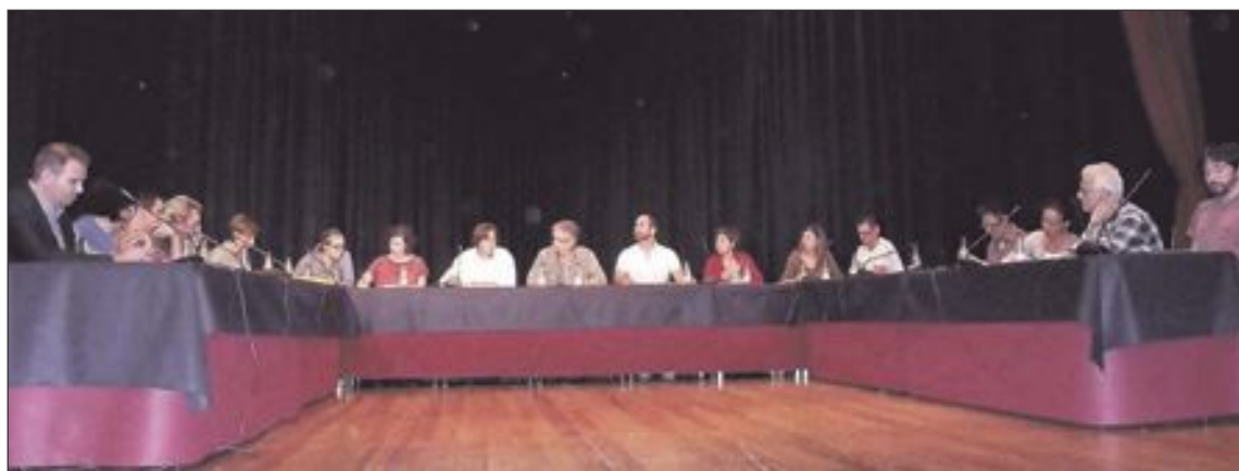
El Pleno del 30 de septiembre estaba convocado en la plaza del Carreter pero, por riesgo de lluvias, se celebró en el salón de actos de la Casa de Cultura, ante unos treinta espectadores

En todas las reuniones celebradas, la directora general de EIGE ha comunicado que se va a intensificar la presencia de los técnicos de esta entidad para informar a los inquilinos de los pisos sociales sobre las ayudas existentes, con el objetivo de facilitarles el pago de sus arrendamientos y, de esta forma, normalizar la situación del parque de viviendas.