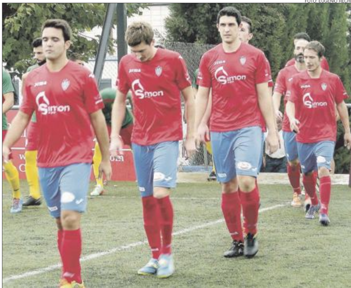
Los jugadores del Rayo Ibense salen al terreno de juego (foto de archivo)