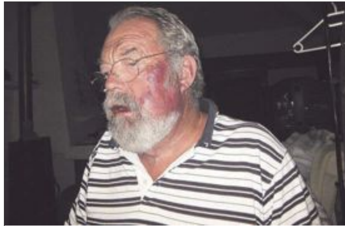
Uno de los ladrones golpeó en la cara al propietario de la casa con la culata de una escopeta

Según la declaración de las víctimas, los autores eran jóvenes y, aunque hablaban en español, lo hacían con un acento extranjero.