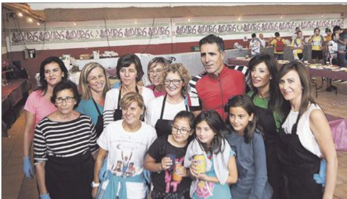
Induráin rodeado de voluntarias y aficionadas que prepararon el almuerzo a los ciclistas