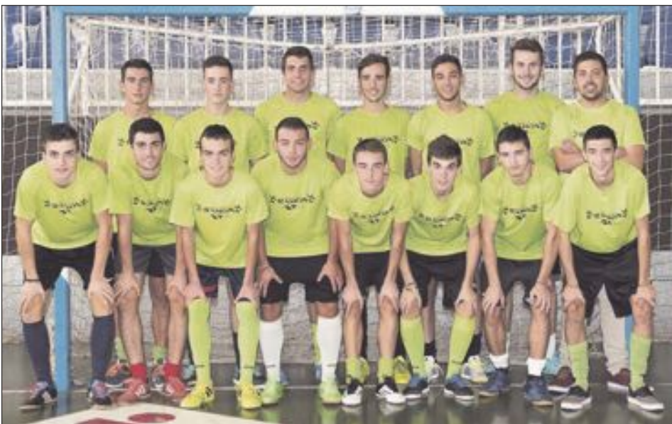
Futsal Ibi Juvenil 'A'