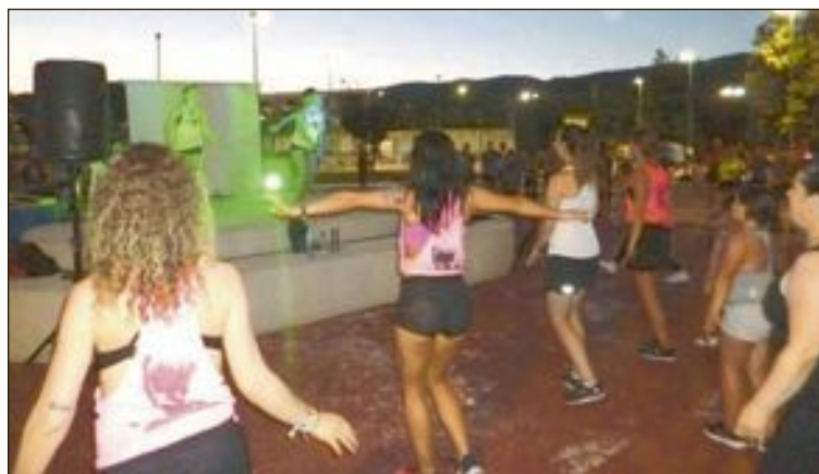
Masterclass de zumba (a beneficio de Adibi)