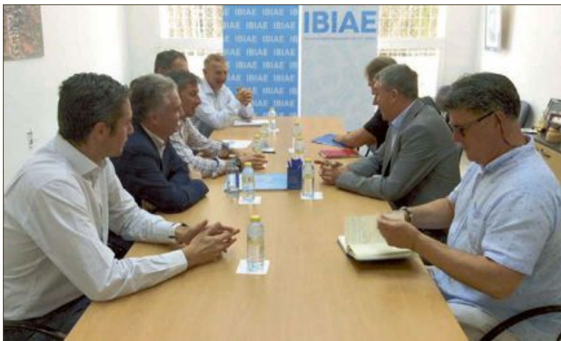
La reunión con el conseller tuvo lugar el lunes 1 de julio en la sede de IBIAE