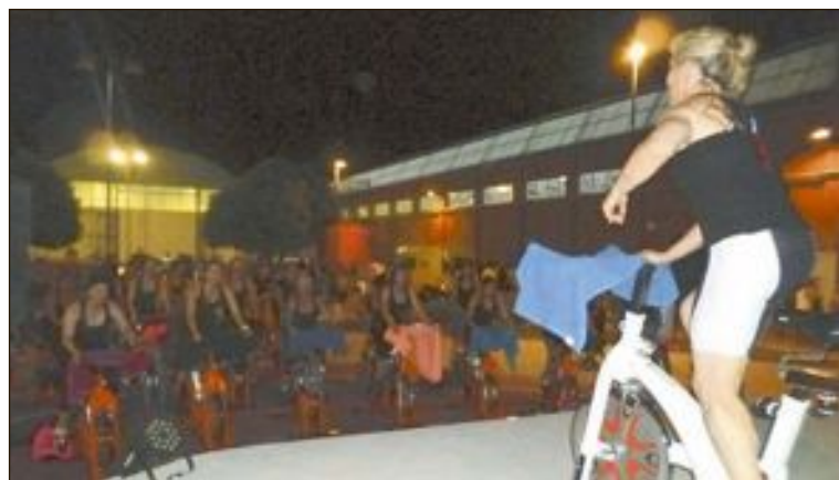
Maratón de spinning a cargo del gimnasio Magdeler