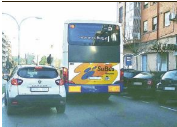
Parada de autobús con vehículos mal estacionados