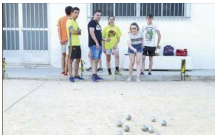
Competiciones de petanca