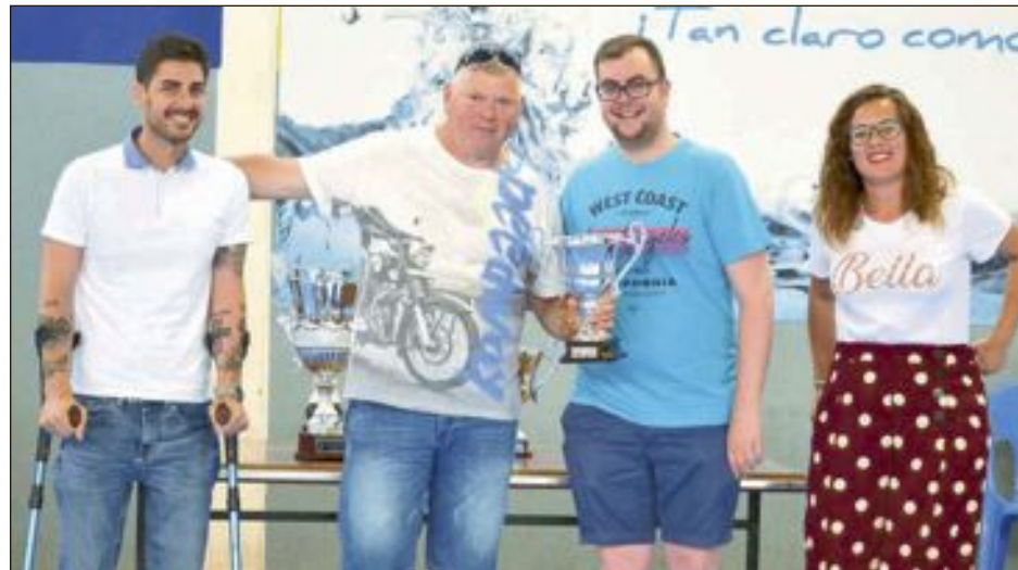
Equipo semifinalista: La Tartana