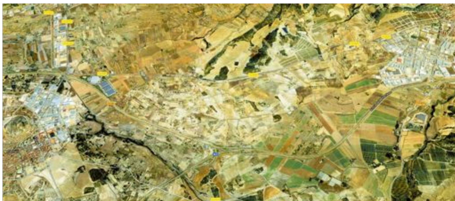
Imagen del espacio comprendido entre los términos municipales de Castalla e Ibi.

ción. Supondría una nueva compatibilidad de la residencia con la industria. Puede haber más cercanía. Ahí sacamos un campo importante".