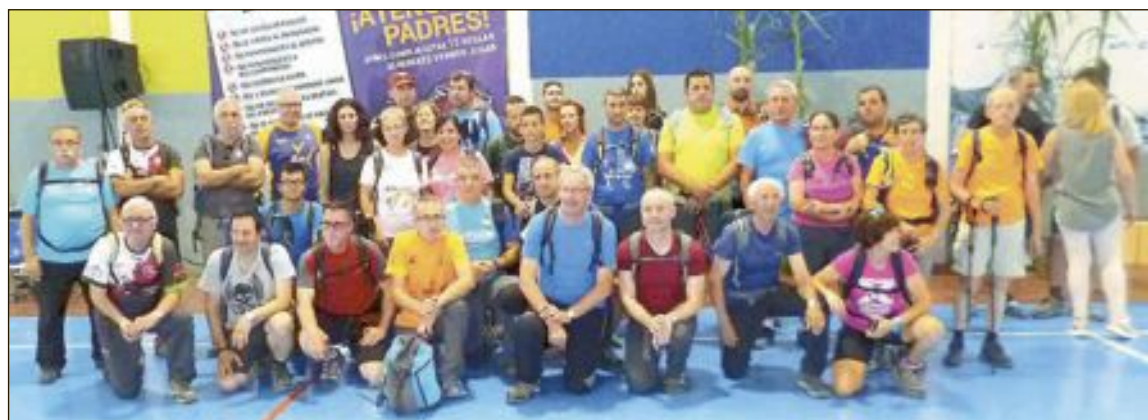
El Centro Excursionista Amics de les Muntanyes organizó una marcha nocturna entre el Port de Benifallim y el Polideportivo de Ibi, pasando por la Carrasqueta; los participantes se despidieron antes de emprender la caminata