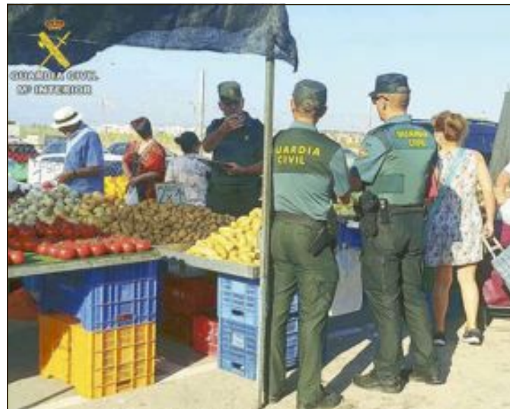
Dentro de las competencias de los equipos Roca también se encuentra la de inspeccionar la fruta y hortalizas de venta al público en mercadillos semanales, a fin de detectar mercancía de dudosa procedencia

Conocedores de su identidad, los investigadores prepararon un dispositivo de seguimiento desde su domicilio en Elda hasta un supermercado de Ibi. Una vez allí, agentes de paisano procedieron a su detención, en el momento de emplear su táctica de acercamiento a una nueva víctima. Tras pasar por los juzgados como presunto autor de 12 delitos de hurto ha quedado en libertad.