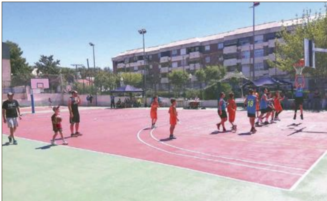
Se han instalado dos juegos de canastas de baloncesto, en una pista exterior, creando a su vez dos pistas