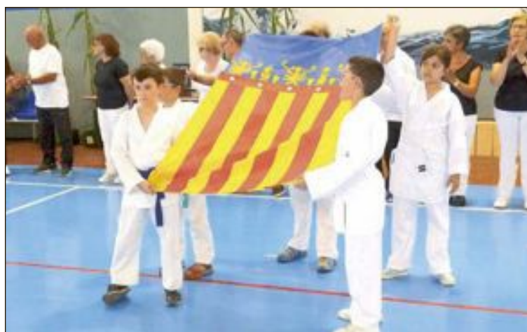
Alumnos de la Escuela Municipal de Artes Marciales desplegaron las banderas de España, Ibi y la Comunidad Valenciana