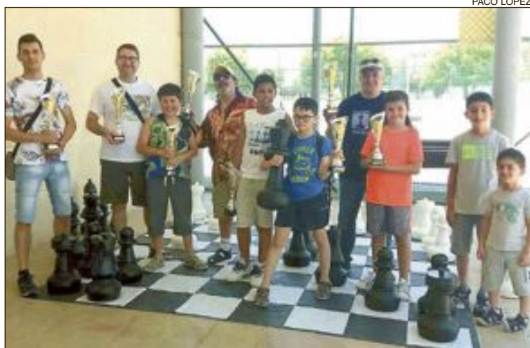
Ganadores de todas las categorías del Campeonato de Ajedrez