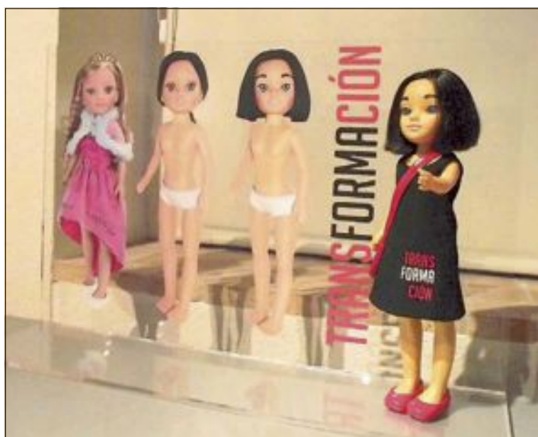
Una de las obras de la segunda exposición, que contó con 37 artistas

El martes 16 de julio volverán a la plaza de la Palla, al igual que el jueves 18 de julio, donde volverá a estar, de nuevo, la Rondalla. La concejalía de Fiestas y Tradiciones invita a todos a participar de estas noches de verano donde la música y el baile son los protagonistas.