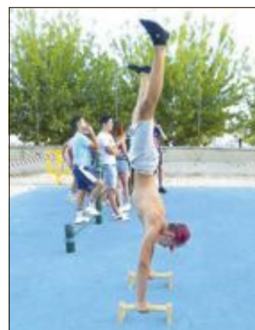
Ejercicios en la zona de calistenia