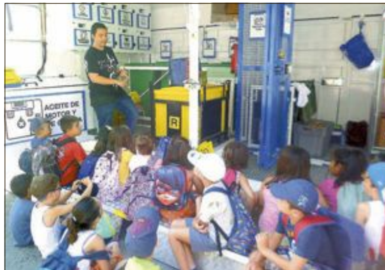
Alrededor de 70 niños de la Escuela de Verano visitaron el Ecoparque Móvil

Cabe recordar, y así lo hizo la edil de Obras y Servicios, que Onil cuenta desde hace años con un Ecoparque instalado en el