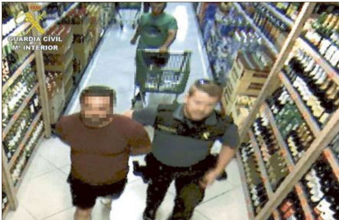
En menos de un año ha sido detenido siete veces por su implicación en 47 hurtos en supermercados de la zona sur de Alicante y parte de Albacete

La plataforma Pensionistas de España por su Dignidad retoma sus concentraciones quincenales en Onil