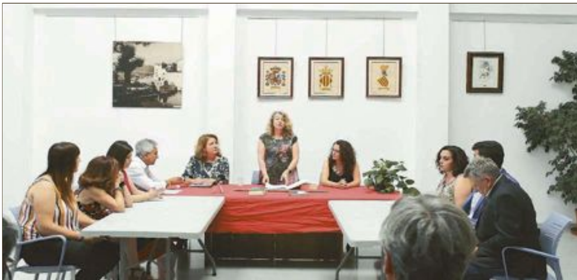
Ple d'investidura celebrat el passat 15 de juny

En esta segona edició i com a novetat es va presentar un nou coixí, d'Inv-ictus, dissenyat per a millorar el confort i les cures de pacients que han patit un ictus o un accident cerebrovascular.