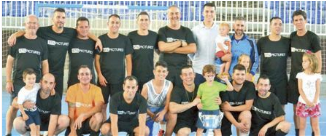
De un total de 15 equipos participantes, finalmente se proclamó ganador el Hollywood