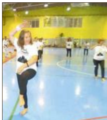
Taichi a cargo de la Escuela Municipal de Gimnasia Terapio-correctiva