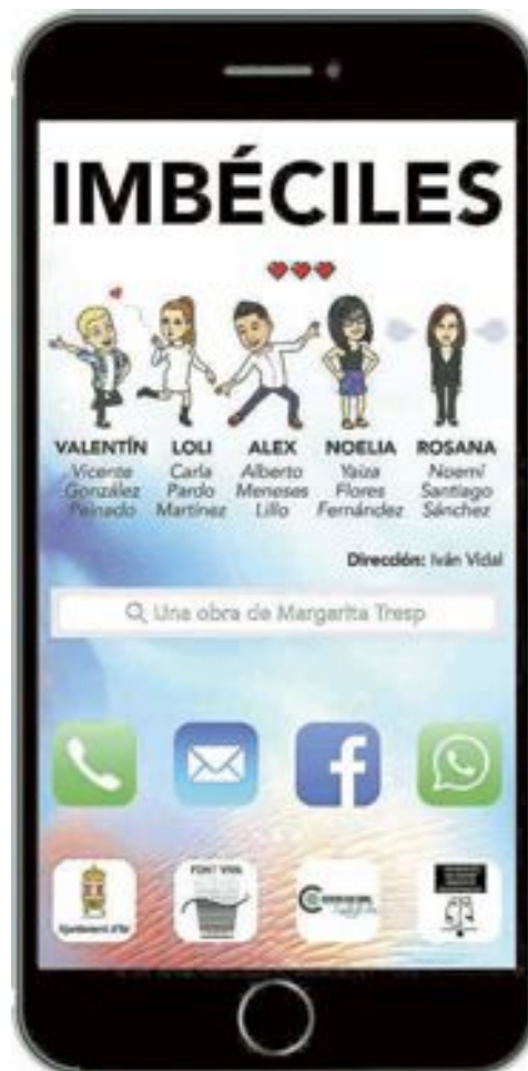
Cartel de la nueva obra de Font Viva