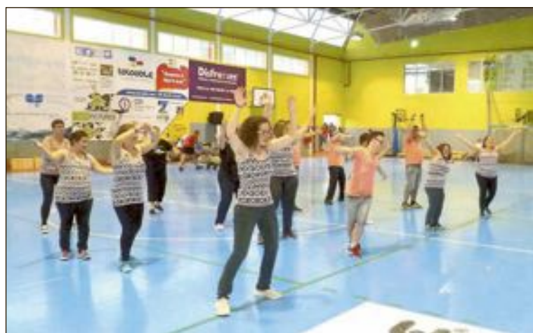
Exhibición de zumba a cargo del Centro Ocupacional San Pascual