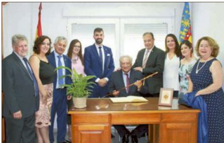
El pregoner va ser rebut per la Corporació i l'alcalde li fa entrega de la vara de comandament com a signe d'agraïment i mostra d'afecte