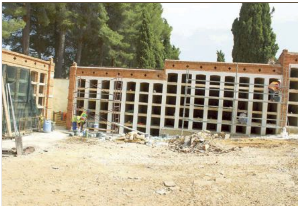
Los nichos irán agrupados en módulos prismáticos de cuatro alturas y longitud variable

El proyecto consiste en la construcción de 480 nuevos nichos en el recinto dos, que ocuparan una superficie de 1.077 metros cuadrados, de los cuales 712 metros son de urbanización. Los nichos irán agrupados en módulos prismáticos de cuatro alturas y longitud variable, organizando pequeñas zonas