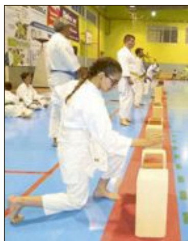
Exhibición de la Escuela Municipal de Artes Marciales