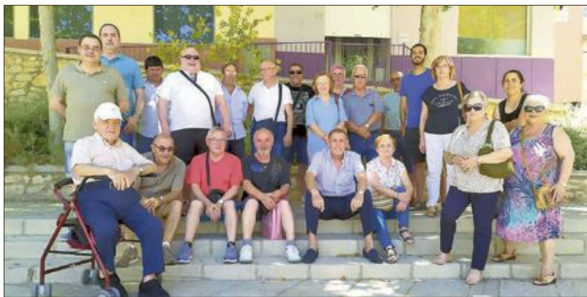
Por primera vez, la concentración tuvo lugar en la plaza de España, el sábado 29 de junio

Ayuntamiento y luego pasaron a la plaza Mayor, tendrán lugar a partir de ahora en la plaza de España. En esta ocasión, los organizadores y los asistentes hablaron sobre el IPC, el plan de sostenibilidad, la hucha de las pensiones, los planes de pensiones paneuropeos (PEPP) y el resultado de las elecciones. La próxima cita será el sábado 13 de julio a las 12 del mediodía.