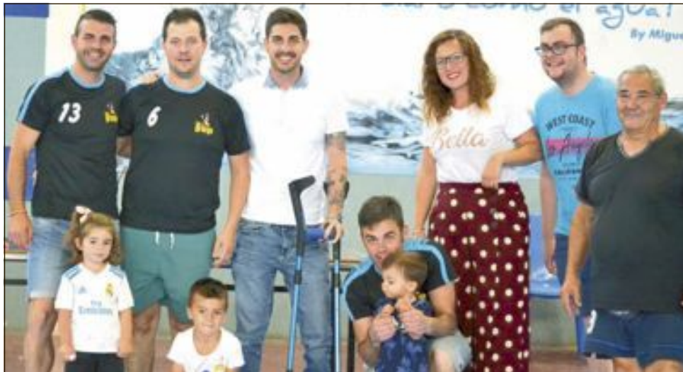
Equipo semifinalista: La Granja