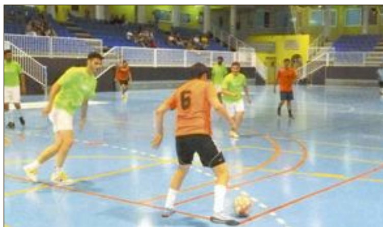
Campeonato de fútbol sala