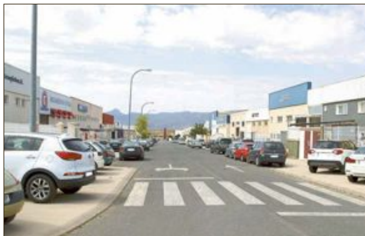
El sector industrial contrató a 49 personas el mes pasado

El paro ha descendido más en el colectivo de mujeres (74 paradas menos frente a 39 parados), sin embargo, el desempleo femenino, con 6.626 mujeres sin empleo, sigue siendo más elevado que el masculino, con 3.824 parados, lo que demuestra la gran brecha laboral que existe.