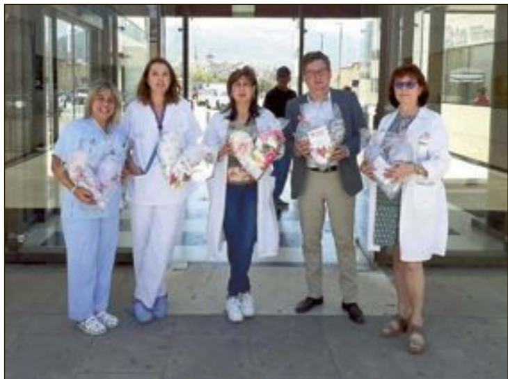
L'entrega de coixins la va realitzar el col·legi d'infermeria