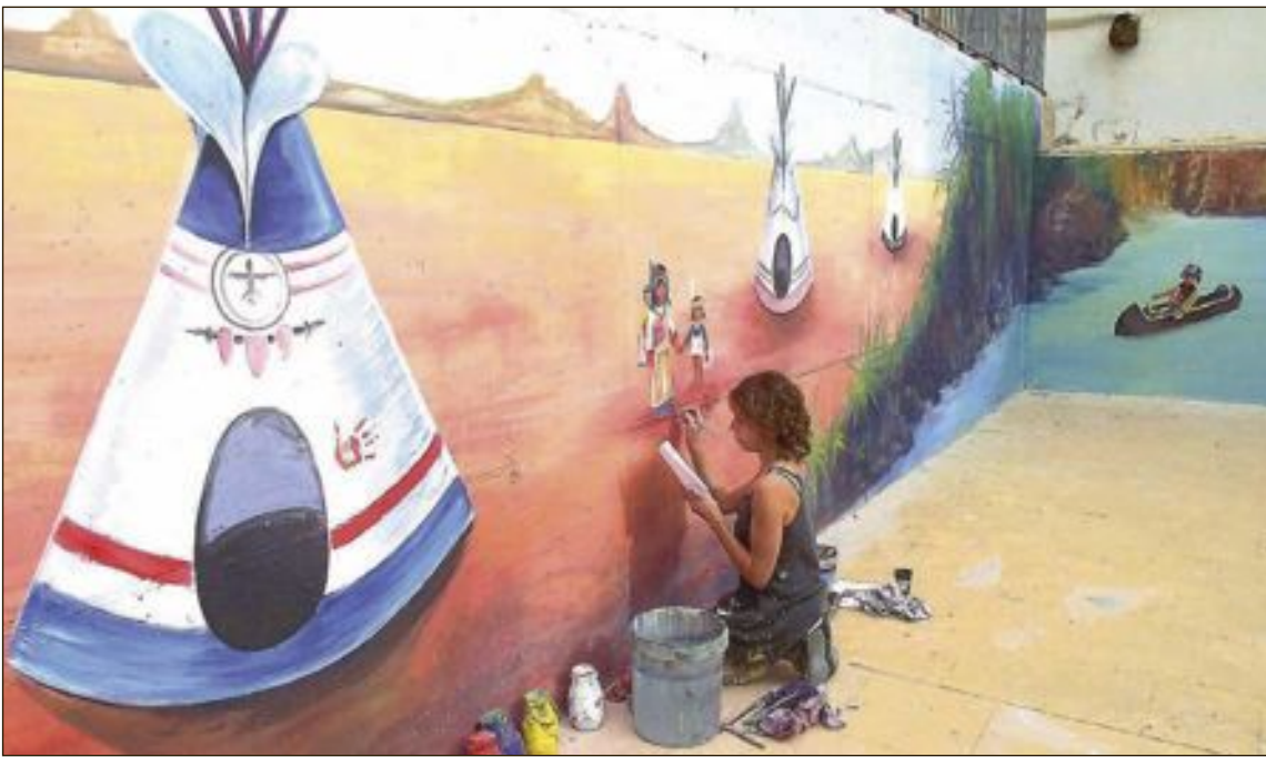
El parque Blasco, en el corazón del centro histórico, está siendo redecorado con pinturas de los clicks de Playmobil