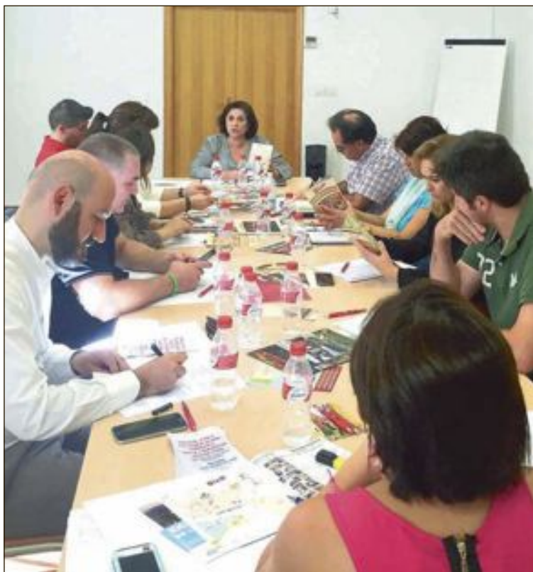
En la Mesa están representados todos los grupos políticos, los empresarios del sector, expertos de la UA y viviendas de segunda residencia

En sucesivos encuentros, la Mesa de Turismo pretende conocer los perfiles del turista que interesan a la localidad y proporcionar a cada uno lo que demanda: turismo familiar, de