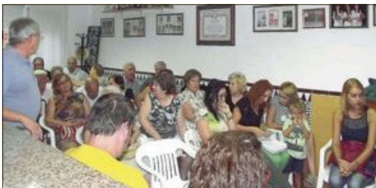
A finales de agosto se celebró en la sede de la AVV La Dulzura una reunión donde muchos de los vecinos expresaron sus reticencias al proyecto

Por la Plataforma 'Parque canino sí, pero no así'