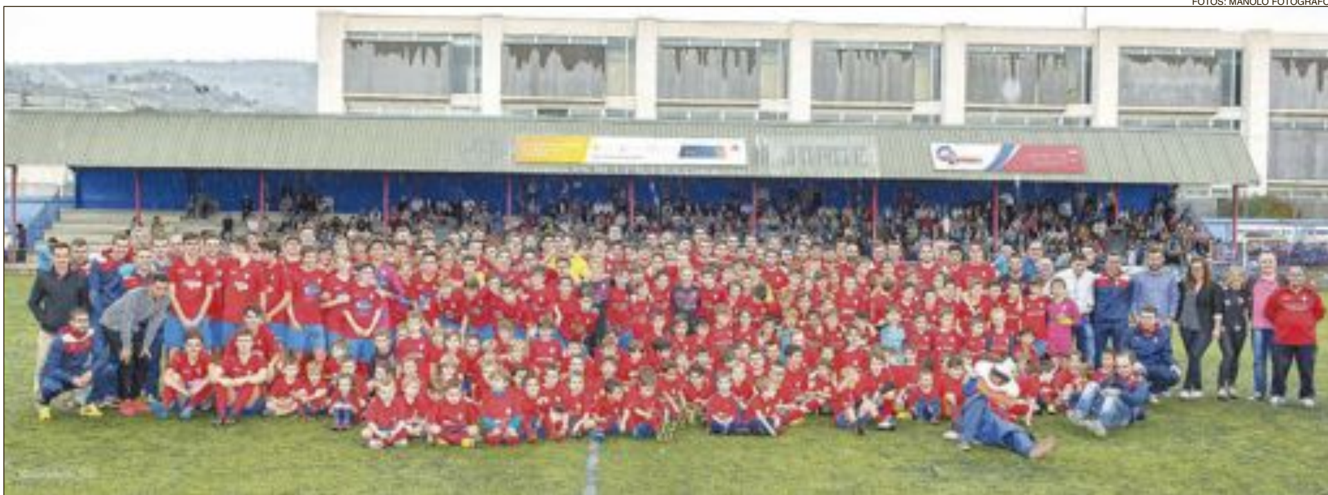
Todos los jugadores, técnicos y directivos de la Unión Deportiva Rayo Ibense, en el estadio Francisco Vilaplana Mariel junto a familiares y autoridades locales