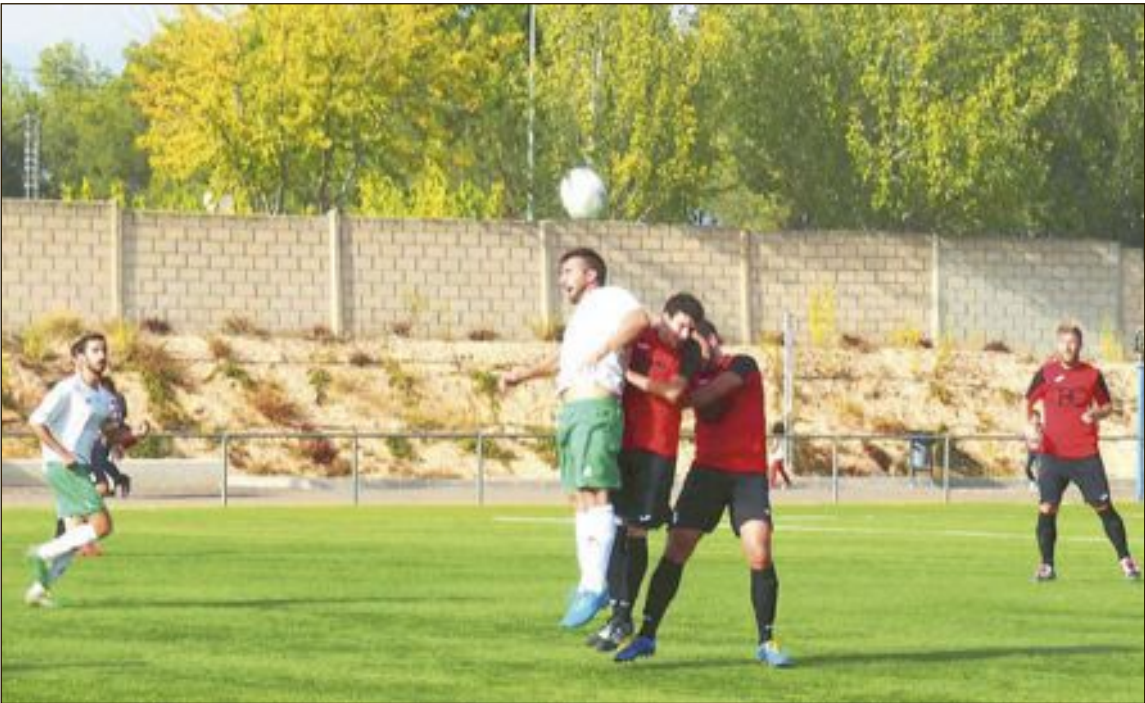
El partido de la pasada jornada se disputó en el campo de fútbol de Agullent (Valencia)

A la Peña le costó entrar en el partido y crear peligro al rival, pero poco a poco iba llevando el peso del partido, hasta que en el minuto 30 Candi pone un centro que se envenena y