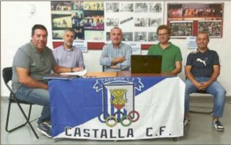
La asamblea anual del CF Castalla se celebró el 7 de octubre

de los dos equipos supo marcar y el Sax jugaba con el resultado. Finalmente, el marcador no se movería y los tres puntos se quedaron en Sax. La siguiente jornada se juega en casa el sábado día 22 a las 17:30 horas contra el Bocairente. Por otro lado, recientemente se celebró la asamblea general del CF Castalla, donde la Junta Directiva expuso el informe y balance de la temporada anterior y se debatieron diversos temas de la actualidad del club castallense.