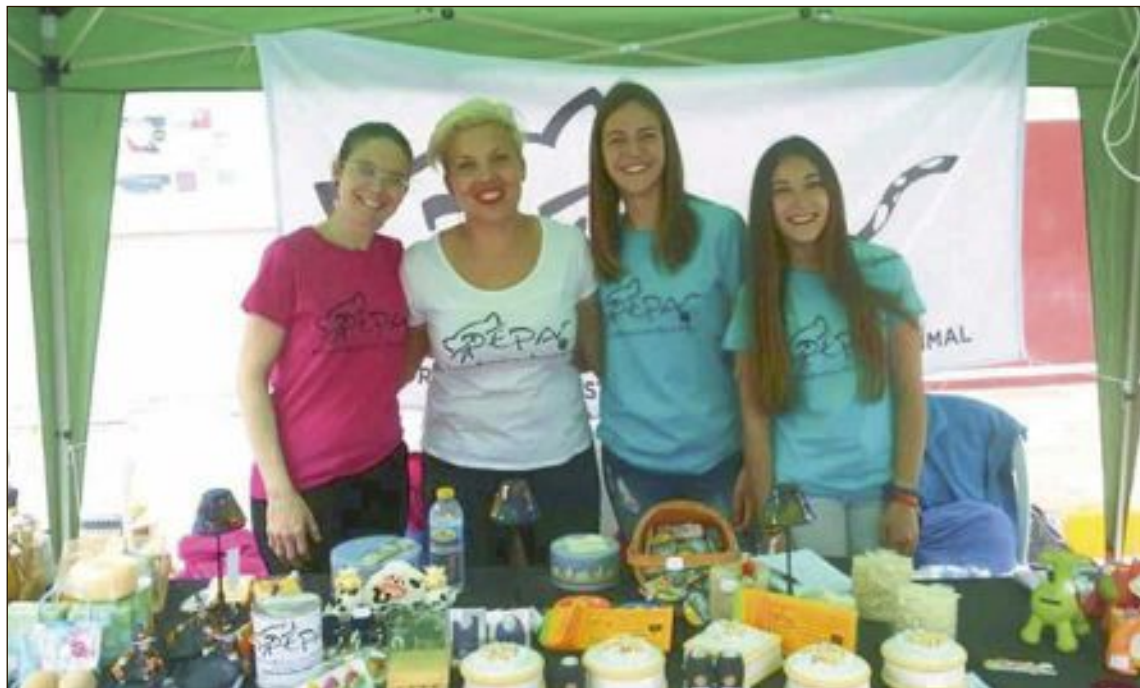
Representantes de la Plataforma Ecologista de Protección Animal, en la Feria de San Isidro de Castalla

El proyecto más importante que actualmente tienen en marcha es el protocolo C.E.S., que consiste en capturar, esterilizar y soltar a los gatos. “Está basado