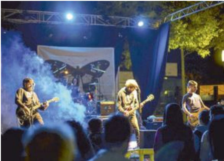
La jornada finalizó con los conciertos Inèrcia, Killing Calacas, Ebri Knight y Herba Negra