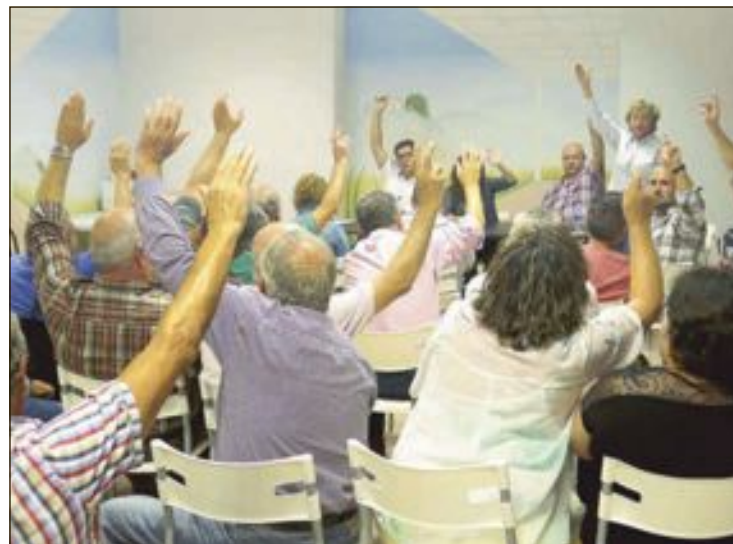
En la asamblea del 6 de octubre, los socialistas votaron no a un gobierno del Partido Popular, acuerdo que han trasladado a la Gestora del PSOE

Por otro lado, la asamblea de la Agrupación Socialista de Ibi aprobó el 6 de octubre por