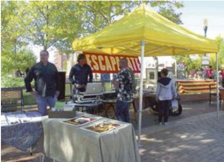
El periódico Escaparate colaboró con el Aplec montando un stand

La muestra que lleva por título Migracions a Ibi i identitats col·lectives forma parte se organizó con motivo de la celebración del IV Aplec de la Mariola, el 15 de octubre.