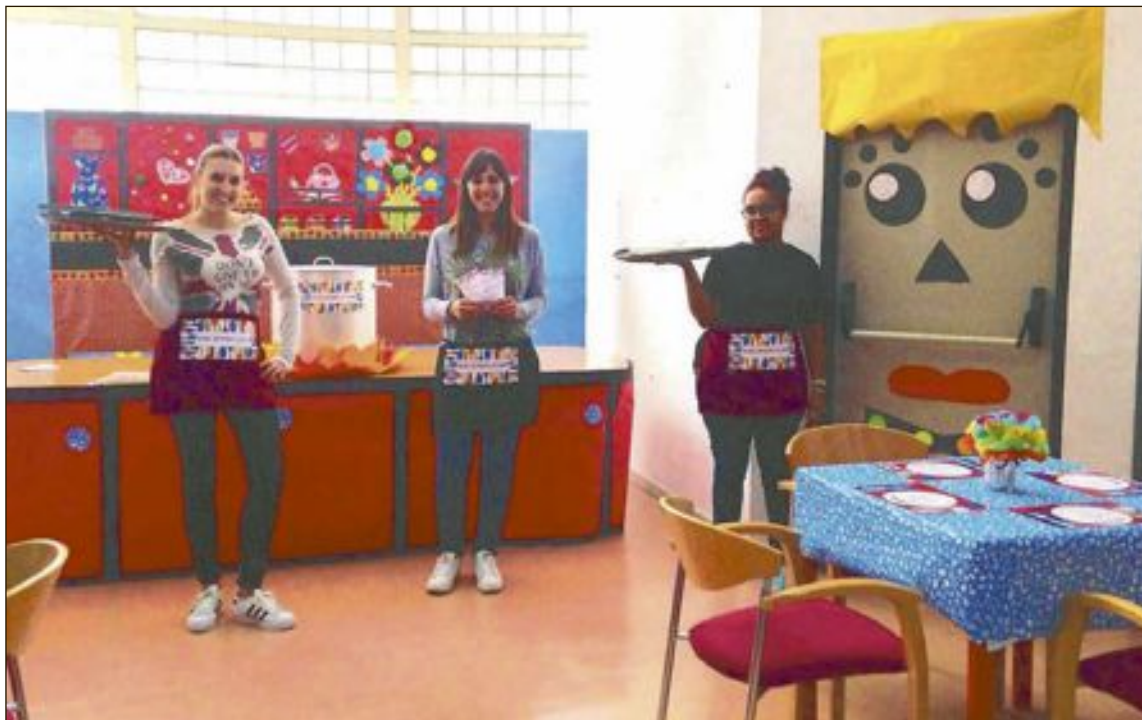
El viernes 14 de octubre se desarrolló la animación lectora 'Biblio-restaurant', con el personal de la Biblioteca

Por último, el desfile del Mig Any se aplazaría primero a las 23:00 y luego a las 23:30 h., quedando finalmente suspendido en caso de seguir lloviendo.