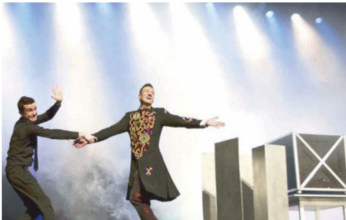
Mag Lari ofrecerá en el Teatro Río de Ibi su último espectáculo, titulado 'Lari Poppins'

Porque eres muy joven y no sabes cómo te irá la vida... Y bueno, estudié una carrera de