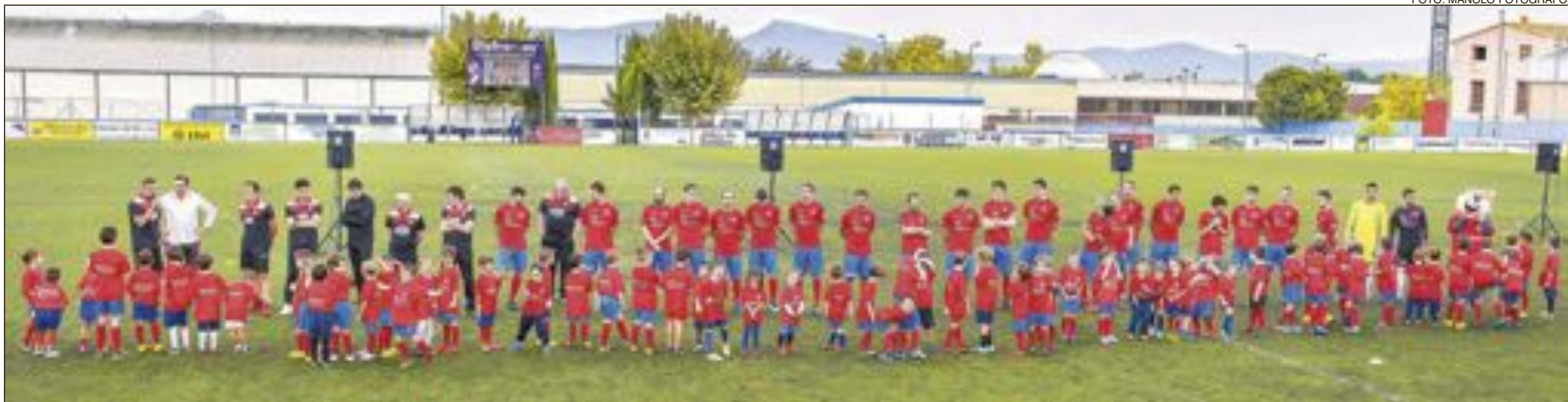
El equipo de la UD Rayo Ibense en Tercera División, junto a los chavales de las escuelas del club, el día de la presentación de la nueva temporada