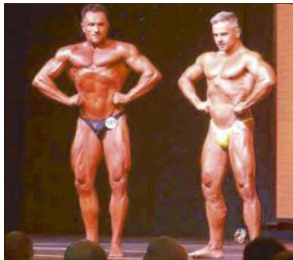
'Giro' se clasificó el cuarto de la Comunidad Valenciana