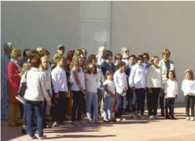
La Coral Ibense interpretó, tras el manifiesto, el tema ‘Serra de Mariola’