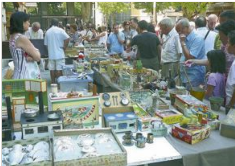
Mercadillo de juguetes antiguos en la Plaza de la Palla en 2011

Según Barea, el objetivo de esta iniciativa es "promover el conocimiento de la historia del