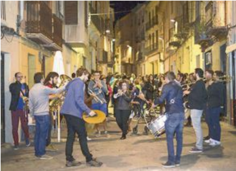
Una de las actividades fue el correbars , a cargo de la Xaranga La Xove