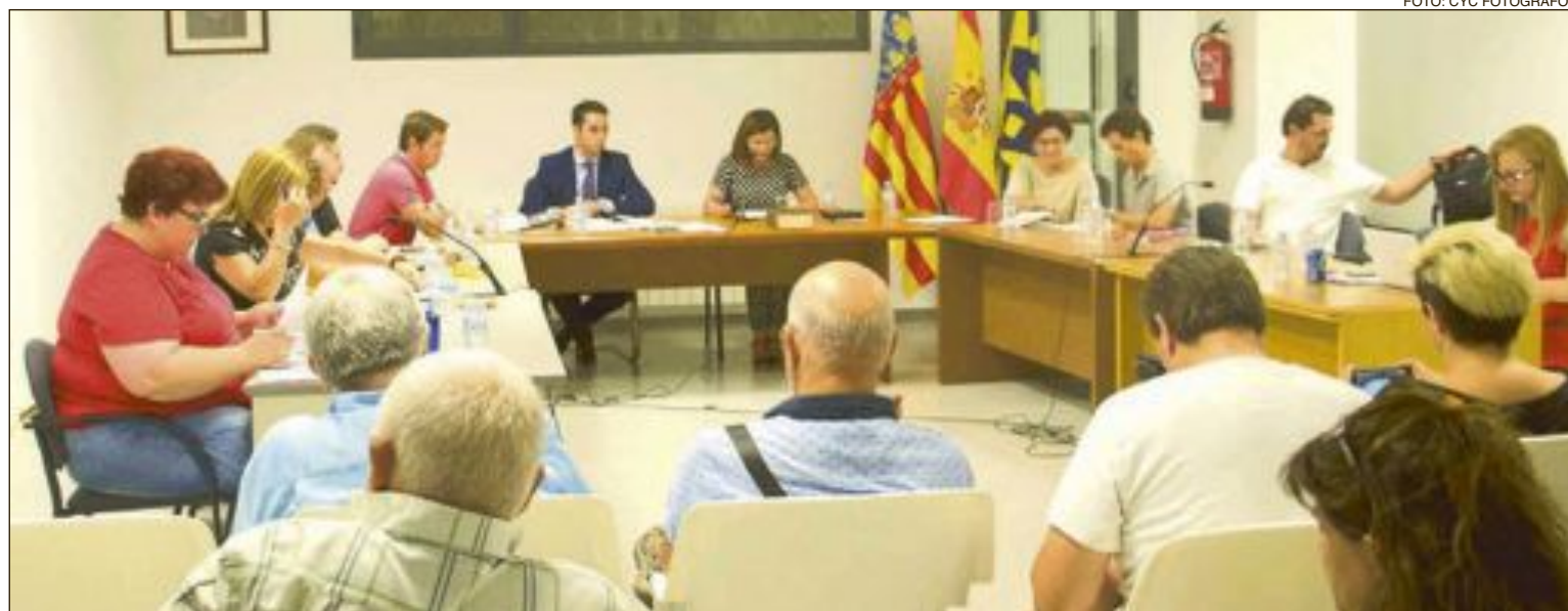
Imagen de archivo de un pleno celebrado en el Ayuntamiento de Onil

De hecho, la mesa de contratación estaba convocada para el miércoles 19 de octubre para proseguir con el proceso de identificación y valoración de las