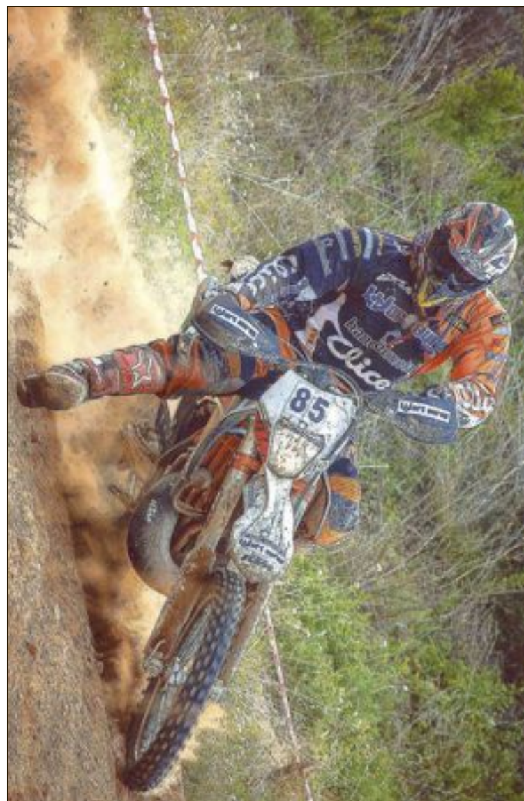
Álex Seguí, en plena prueba de cross country , una modalidad de motociclismo similar a la resistencia de enduro

Álex aprovechó este galardón para reivindicar, a través de las páginas de Escaparate, un reconocimiento similar en la villa que lo vio nacer.