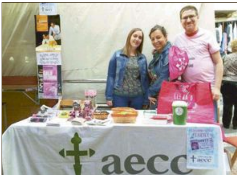
Mesa informativa de la AECC el lunes 17 de octubre, en el mercadillo

La película de animación Mascotas se proyecta en el Centro Cultural. El domingo 23 de octubre habrá tres pases: 16:30, 18:30 y 20:30 horas y el lunes día 24, a las 18:30 horas.