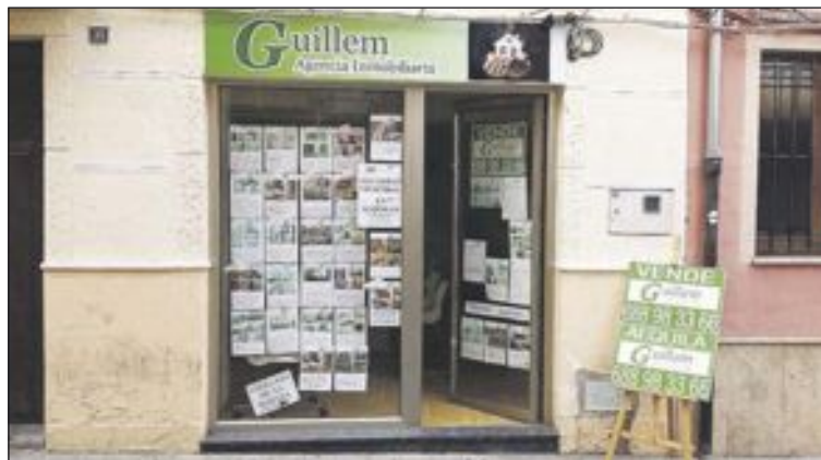
Agencia Inmobiliaria Guillem está ubicada en la calle Mayor, nº 35, de Ibi

Así pues, esta agencia inmobiliaria cuenta con 28 pisos en propiedad en Ibi destinados al alquiler, en los que no se cobra