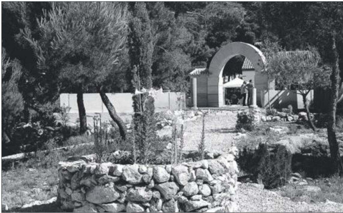
Para el camino de acceso a Torretes se ha proyectado un acabado de hormigón con franjas transversales

Por su parte, en el acondicionamiento del camino de acceso a la estación biológica Torretes desde el Campo de Tiro, se ha proyectado un acabado de hor-