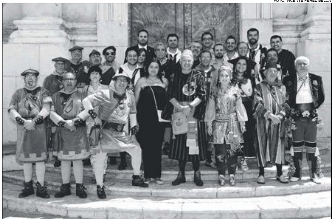
Integrantes de la Comisión de Fiestas

El reglamento de la Fiesta establece la obligación de encontrar Abanderada pero evidentemente no penaliza el hecho de que no se encuentre. Desagradablemente es muy difícil de quitar de la cabeza a las familias ibenses el hecho de que la parte importante de ejercer el cargo de Abanderada radica en lo que te puedas gastar para hacer algo muy bello. Y evidentemente una familia con posibilidades está en su legítimo derecho de hacerlo así, pero el pueblo valora también a una Abanderada que con medios modestos y con la ayuda