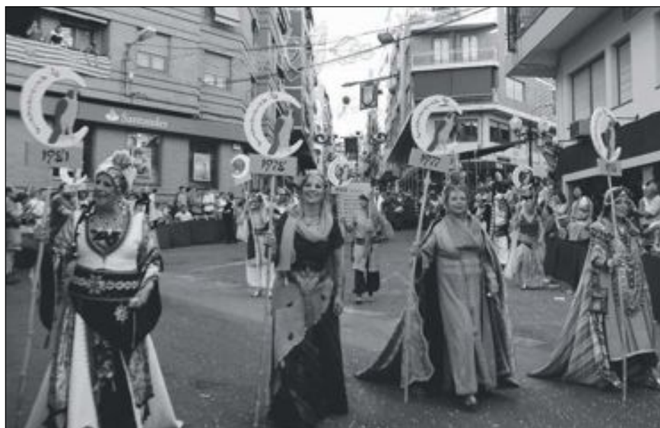
Las comparsas Almogávares y Beduinos celebraron su 50 aniversario, y en el desfile de la Entrada participaron los capitanes y abanderadas que han ostentado el cargo en estos años