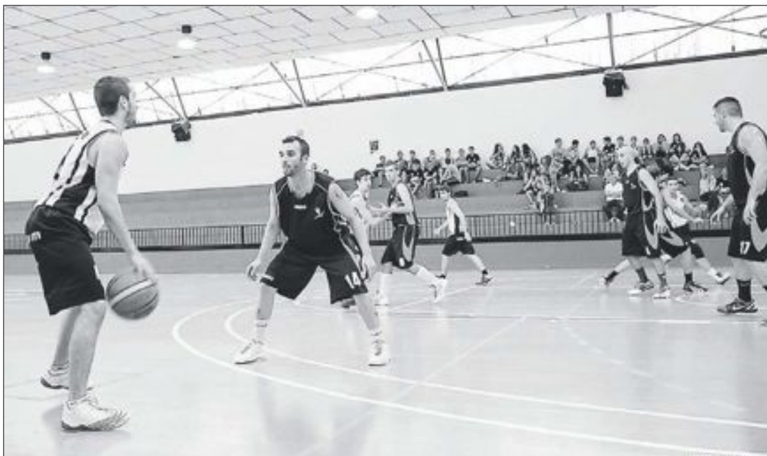
El CD Onil Sénior 'A' durante su primer partido de la nueva temporada, en el pabellón del Polideportivo colivenc

Sénior Masculino 'A': CD Onil 76-71 V-74 Villena.