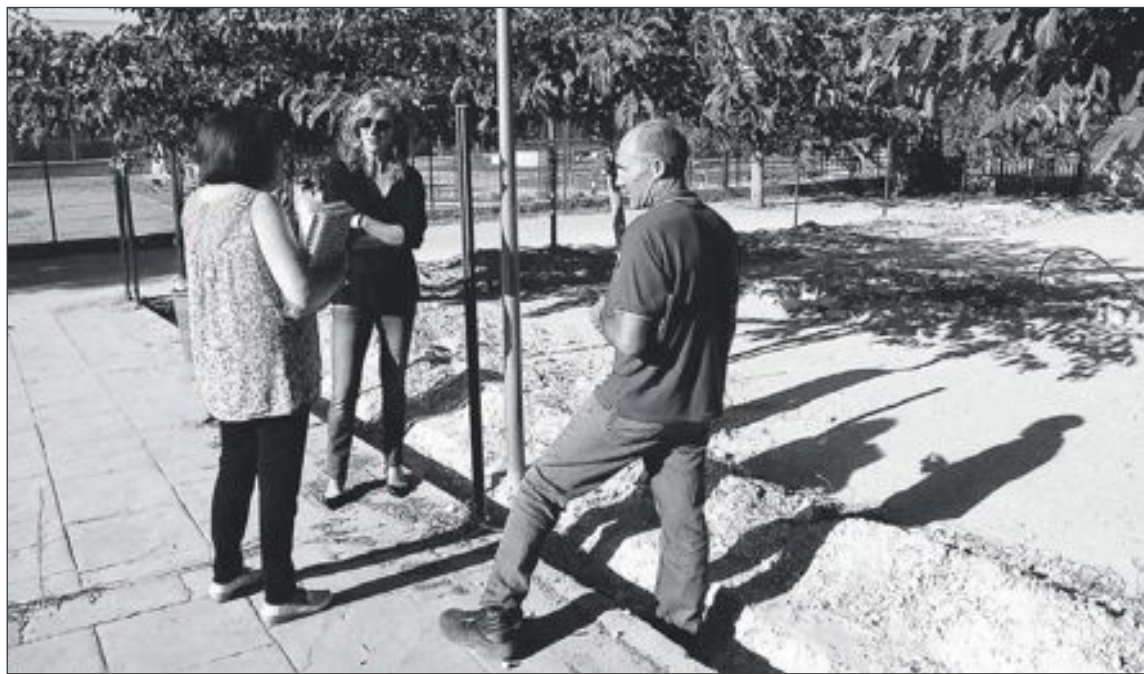
La concejal de Educación visitó el inicio de las obras junto a la directora del colegio y jefe de la brigada de obras

El Ayuntamiento, por su parte, pintará las estructuras de la zona infantil y les darán los trata-