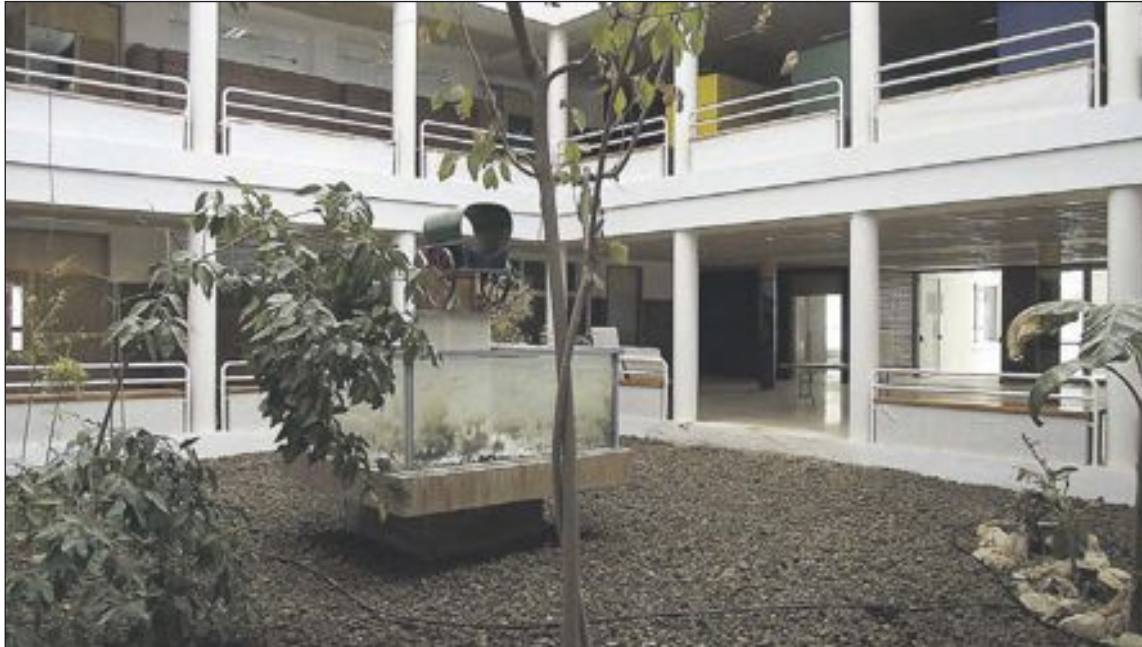
Las clases se impartirán en el instituto La Foia, en horario de tarde

Desde que se conoció la noticia de la apertura en Ibi de un