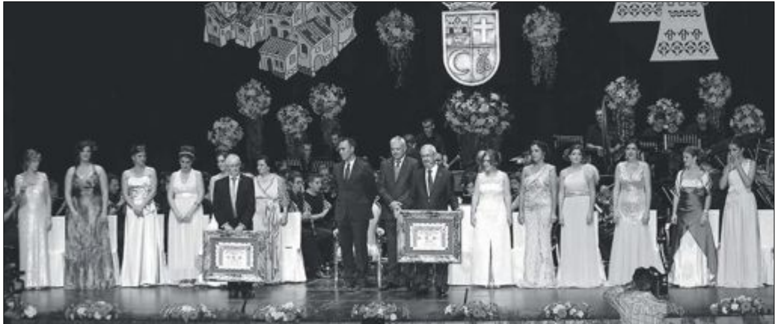
Exaltación Festera 2014

Bueno, creo que el espectáculo visto en las calles en las Entradas ha sido verdaderamente fastuoso. Es muy difícil valorar algo específicamente, ya que ha habido muchas abanderadas que han contribuido a la belleza del acto con boatos sorprendentes, cada Capitanía ha tenido una personalidad específica y ambas han dado un fantástico espectá-