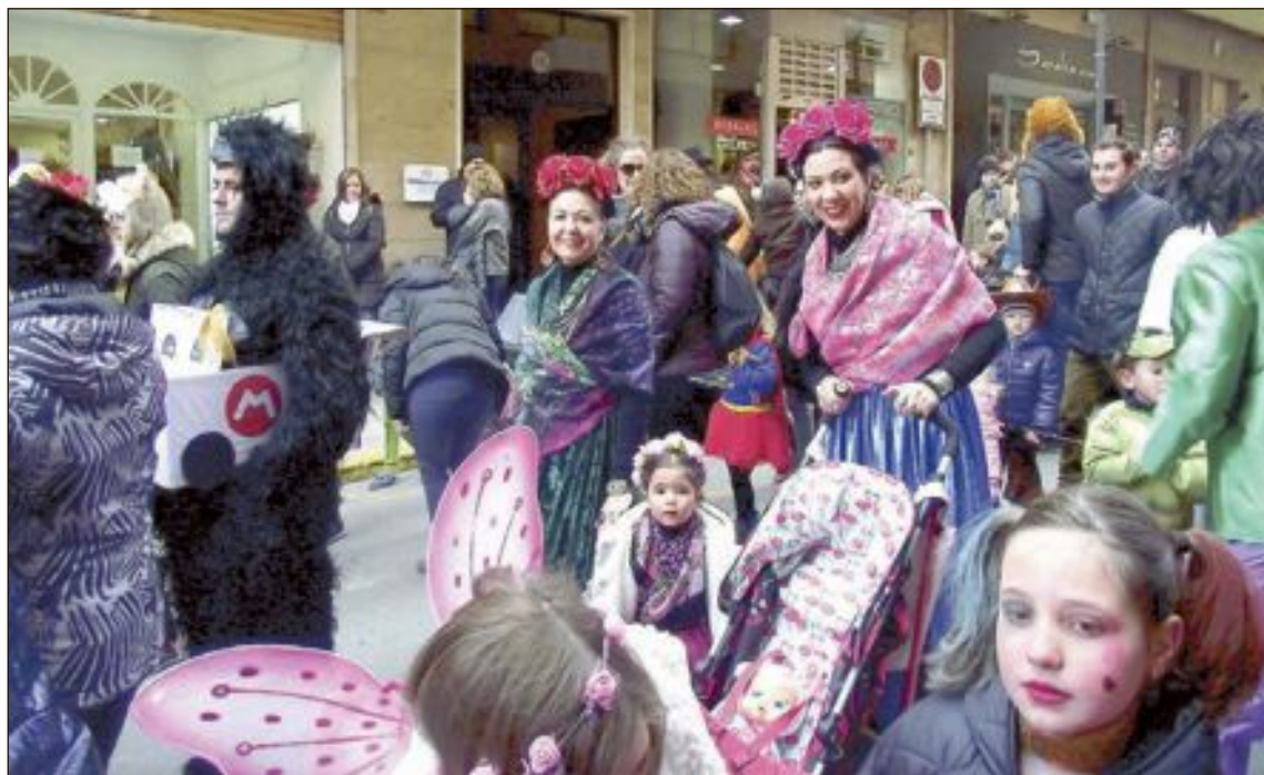
S'atorgaran tres primers premis per cada categoria, infantil i adults

El concurs estableix dos categories: Infantil, on també podran formar part adults, sempre en un