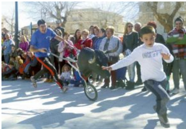
Un bon nombre de valents toreros va participar en el Concurs de Retalladors