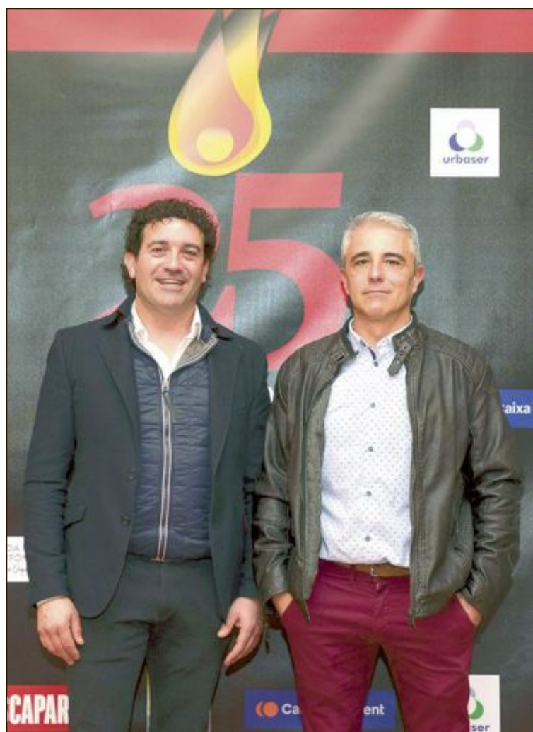
Representantes de Fobesa