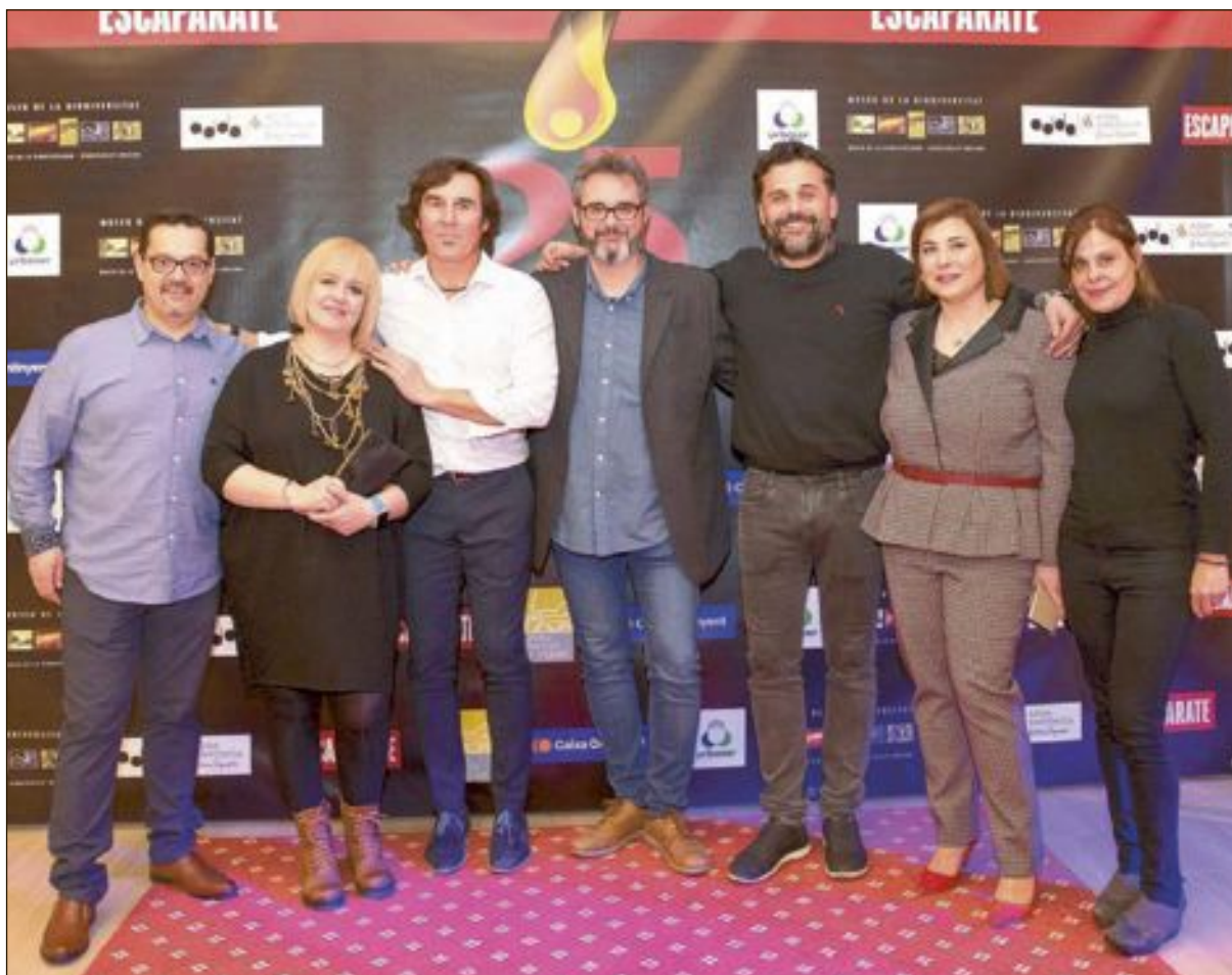
Miembros de la Associació de la Premsa Comarcal Valenciana y amigos