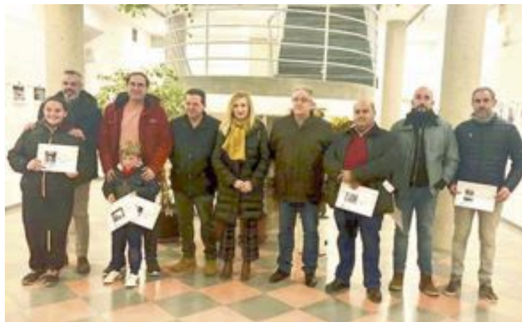
El dia 15 es van entregar els premis del Concurs de Fotografia de la Vaca de Castalla; les obres estan exposades en la Casa de Cultura

La regidora vol agrair el recolzament dels col·laboradors, "que van vigilar per a que tot eixirà perfecte i es compliren les normes"; també agraïx el treball de