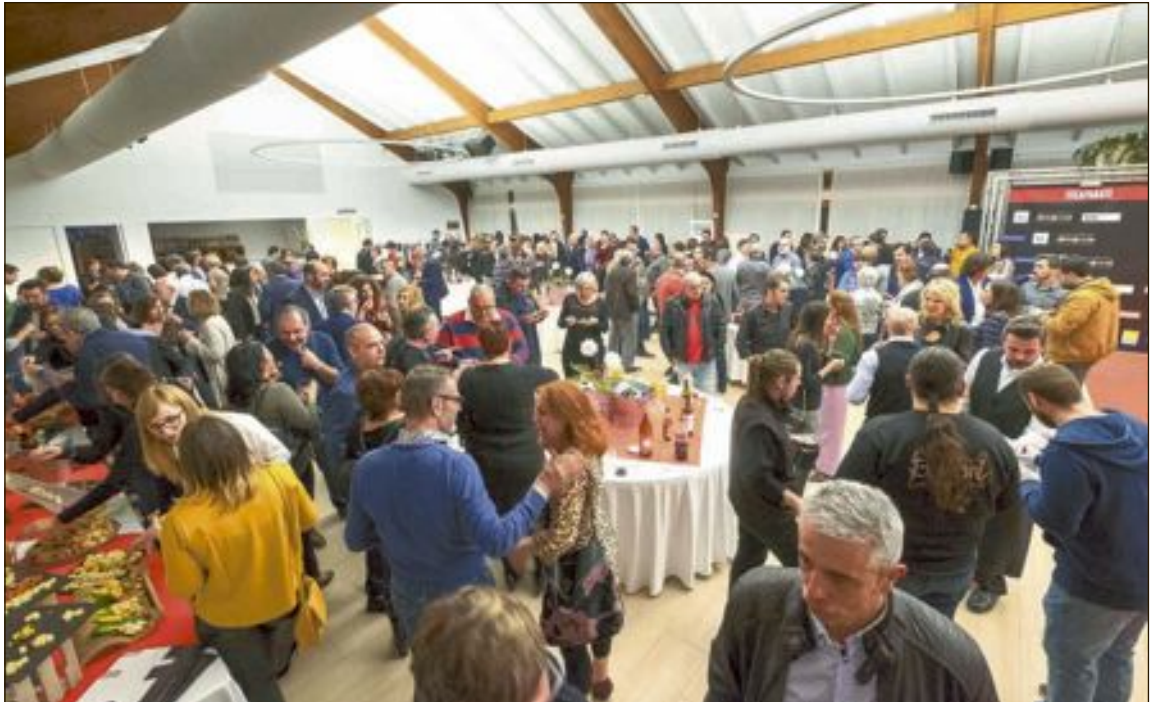
Más de doscientos invitados disfrutaron del vino de honor con motivo del 25 aniversario del periódico Escaparate

Escaparate cumple 25 años. El periódico Escaparate celebró el viernes 15 de febrero su veinticinco cumpleaños con una fiesta a la que asistieron más de doscientos invitados, entre políticos, empresarios, anunciantes, colaboradores, lectores y amigos. Fue una velada inolvidable y una buena ocasión para compartir vivencias, recuerdos y encarar, de nuevo juntos, los próximos años. El acto estuvo presentado por el mentalista José Carlos, que realizó varios juegos de magia, y acompañado a ritmo de jazz y swing por el dúo The Crooners.