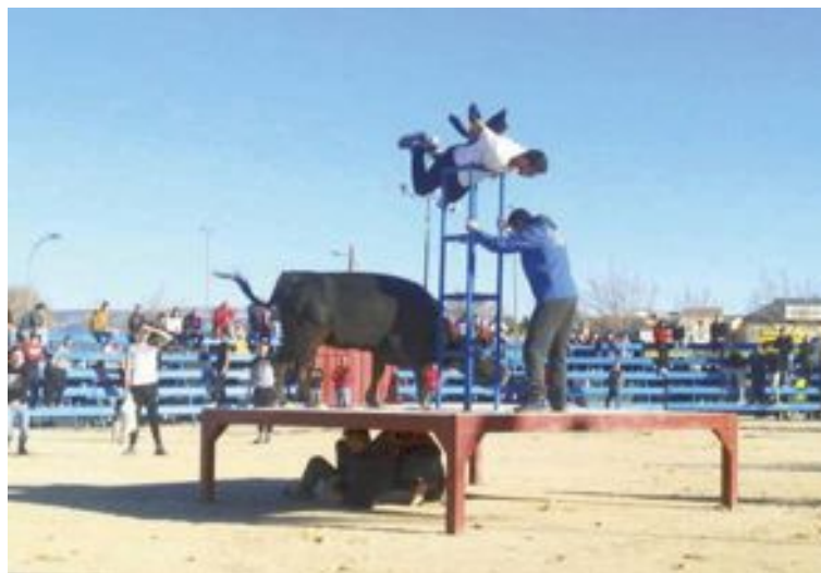
Un divertit moment de la solta de vaquetes, que va tindre dos sessions