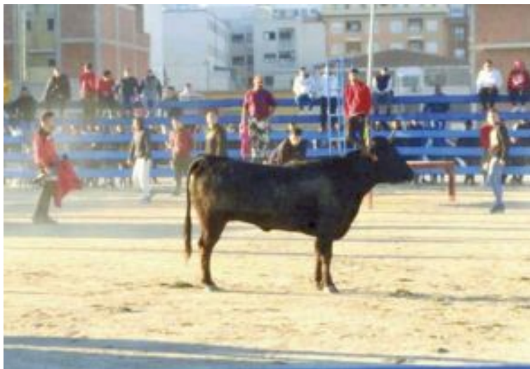
El recinte per a la solta de vaquetes es va instal·lar al costat de l'Auditori