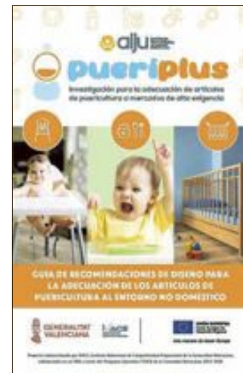
Portada de la Guía

El objetivo de esta Guía es garantizar la seguridad para los menores en este tipo de artículos cuando se utilizan en entornos no domésticos y que las empresas de puericultura de este tipo de artículos, fundamentalmente radicadas en la Comunitat Valenciana, tengan en cuenta las recomendaciones