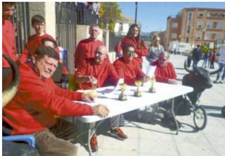
El jurat no va perdre punt de les actuacions dels xicotets retalladors