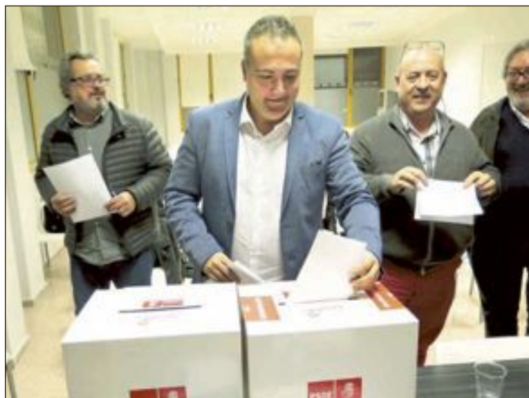
La lista se aprobó por mayoría en la asamblea del 20 de febrero

"Supone una renovación casi total, con personas que concurren por primera vez"