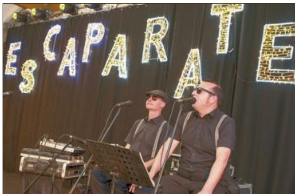
El dúo The Crooners amenizó la velada con sus cuidadas versiones de jazz y swing