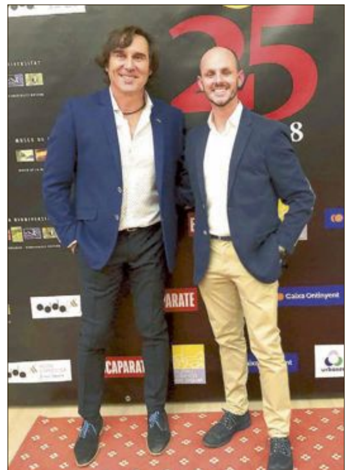
El responsable de Urbaser en la comarca junto al director de Escaparate