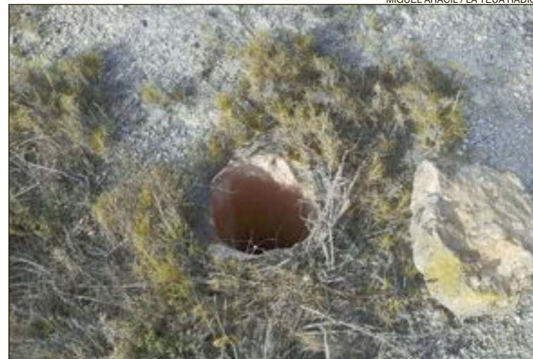
Uno de los pozos que se hallan sin sellar en una finca de Xorret de Catí