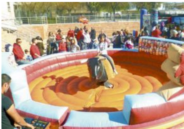
Davant de la Casa de Cultura hi va haver un inflable i un bou mecànic

ONIL: Museo de la Muñeca.- Horario de visitas guiadas gratuitas: de martes a domingo a las 12 h. y sábados, a las 18 h. Necesaria reserva previa: 606.023.307 /