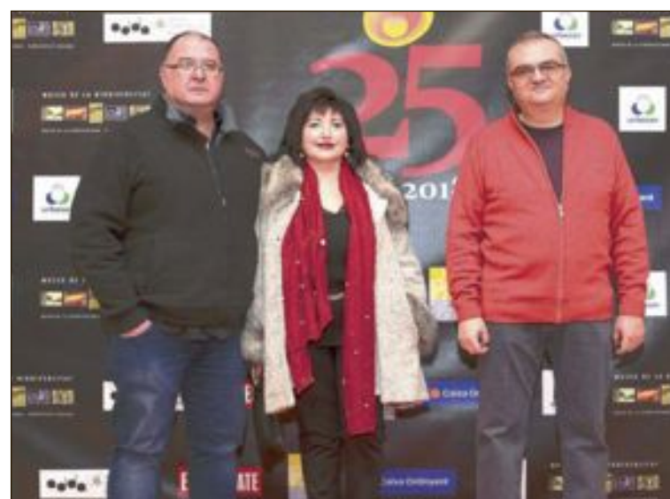
A la velada asistieron muchos amigos, así como antiguos trabajadores y colaboradores que, a lo largo de estos 25 años, han formado parte de la gran familia de Escaparate