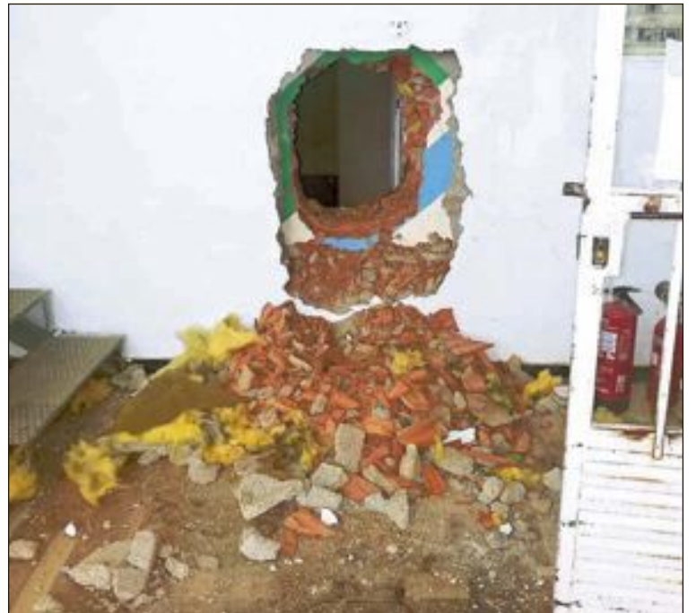
Los autores conocían la distribución de las naves ya que los butrones se realizaron en los lugares exactos por donde podían acceder sin dificultad

Asimismo, lograron neutralizar las alarmas ya que los afectados se enteraron de los robos a la mañana siguiente.