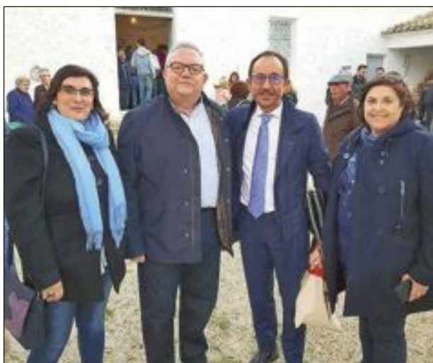
El regidor de Cultura va oferir una peça de ceràmica artística de Biar a l'ambaixador de la UNESCO, que posa amb l'alcalde i les regidores d'Educació i Turisme en l'altra imatge