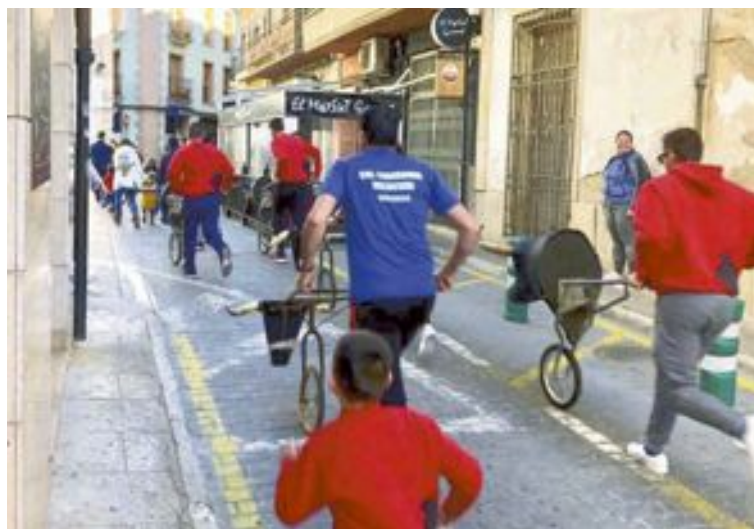
Un moment del encierro amb carretons