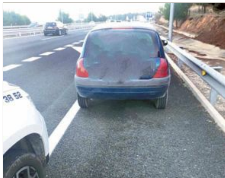
La persecució per a detindre al vehicle va finalitzar en l'autovia A-7