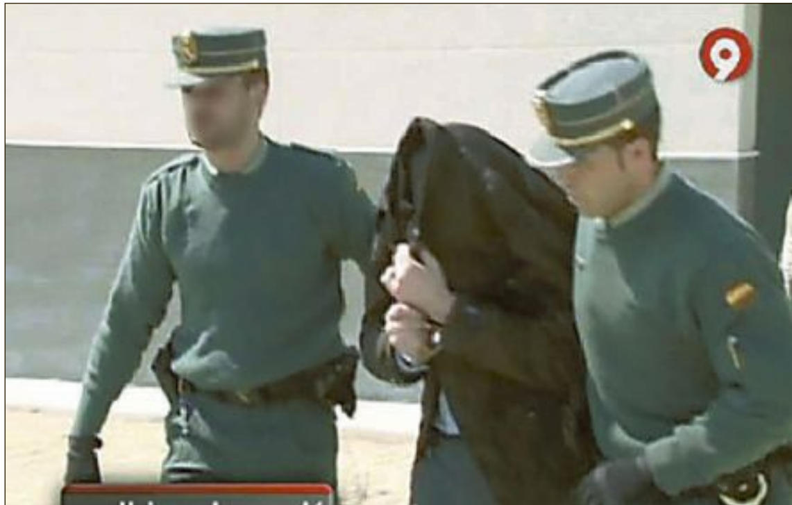
El acusado fue detenido el 27 de marzo de 2012

La empresa era Stem Cell , una firma alemana y cuyo abogado en España confirmó en su momento que cuando tuvo conocimiento de lo que estaba sucediendo enviaron una nota a todos los ginecólogos y hospitales de la zona de Levante para