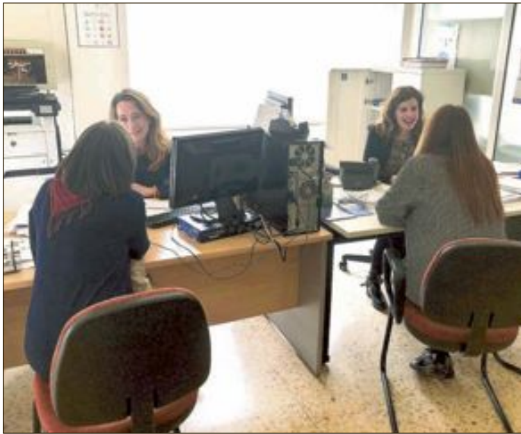
La Oficina Municipal de Información al Consumidor está ubicada frente al Ayuntamiento

También destaca el informe que los ciudadanos han acudido a la OMIC para informarse sobre temas relacionados con bancos y financieras, que han sido superadas solo por las consultas realizadas referentes al sector de las telecomunicaciones.