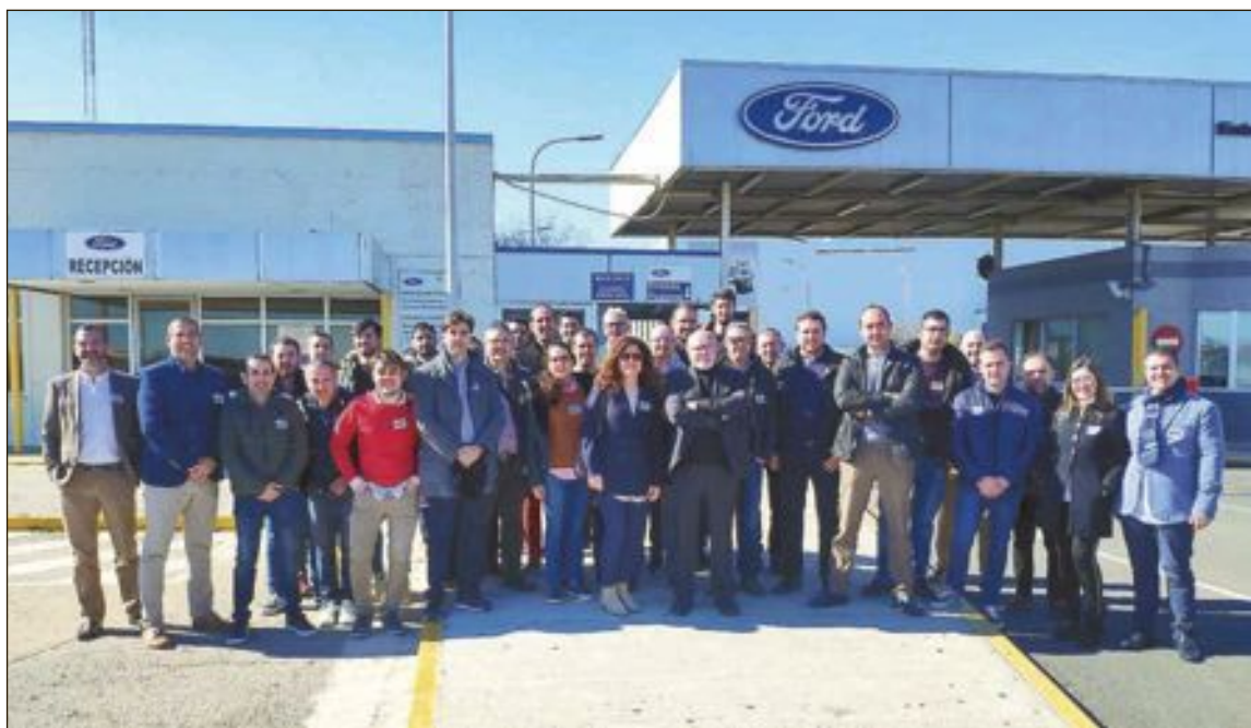
Los empresarios, asociados a IBIAE, que visitaron la planta de Ford, en Almussafes