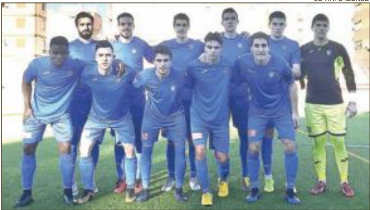
UD RAYO IBENSE

Los primeros compases fueron para los visitantes con ocasiones