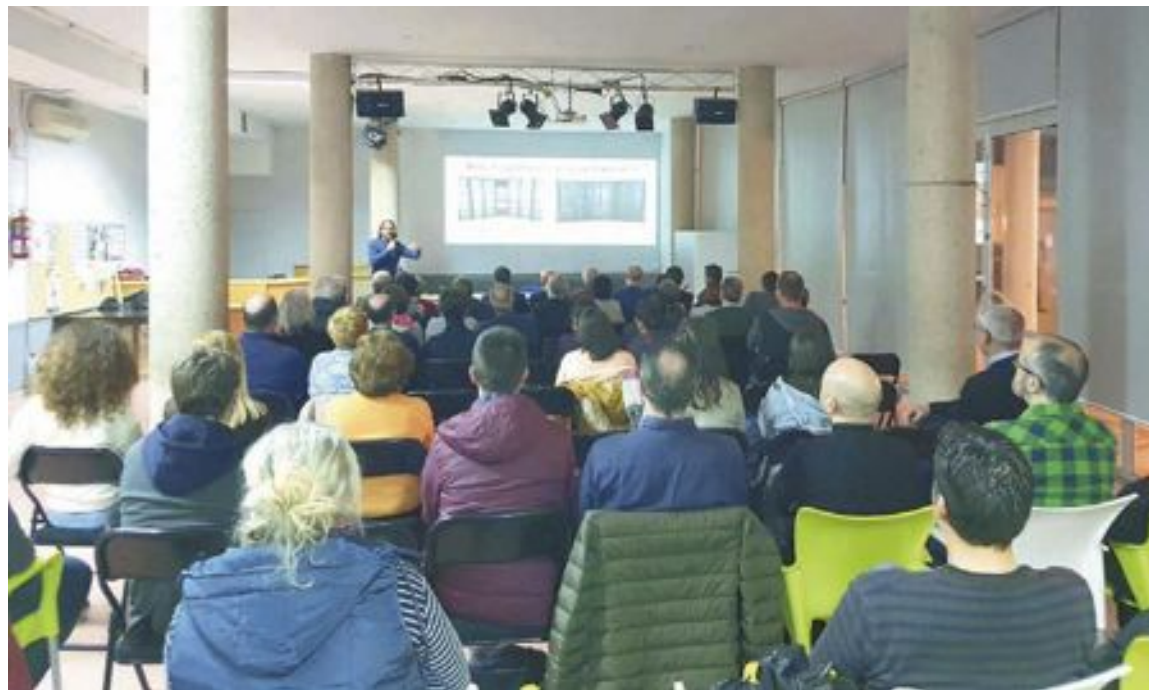
La xarrada va tindre lloc el 13 de febrer en la Casa de Cultura de Castalla, on va assistir un bon nombre de persones

finals del segle XIII, la zona situada als peus del Castell, on va fundar la vila de Castalla. Un nucli d'origen musulmà que va sorgir al segle XI i que es va desenvolupar, després de l'arribada dels cristians, al llarg dels segles XIV i XV.