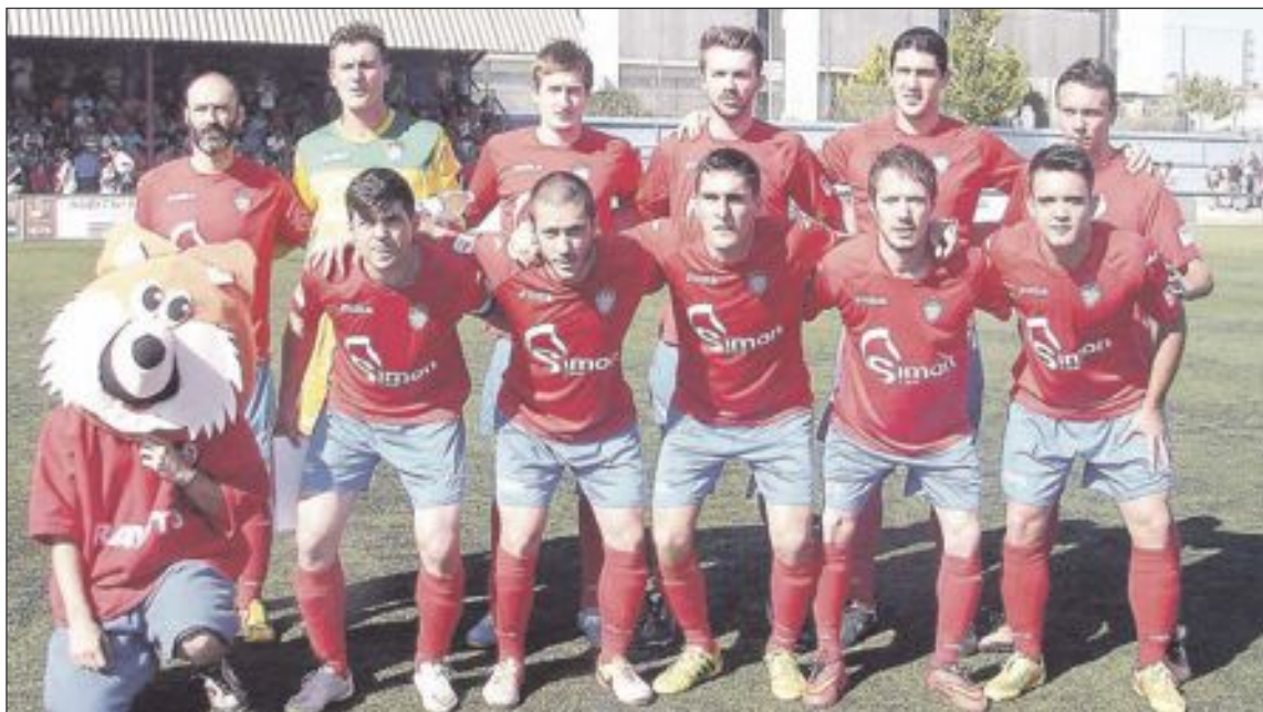
Once inicial del partido contra el Barrio del Cristo, junto a la mascota del equipo ibense, 'Rayito'

Los aficionados que deseen viajar el día 14 a Burriana para animar al equipo rojillo, tienen a su disposición dos autobuses gratuitos, por cortesía de la UD Rayo Ibense, que saldrán a las 15:45 horas desde la Iglesia de Santiago Apóstol. Para reserva de plazas: 667.660.859 ( Farley ).