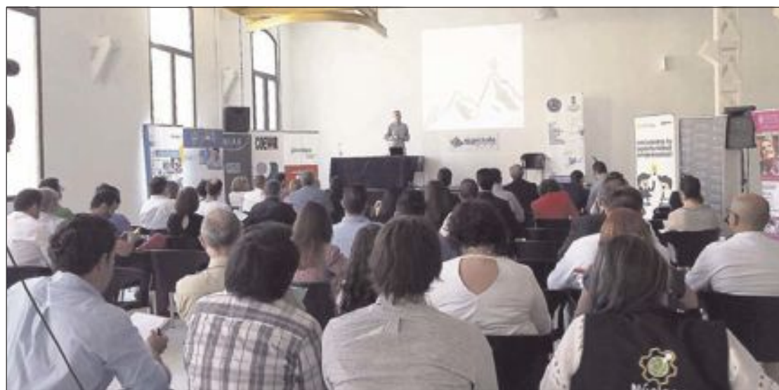
El director de la empresa ibense Hega Hogar ofreció una conferencia sobre su experiencia exportadora

La jornada, que comenzó con el tradicional intercambio de tarjetas, contó también con la colaboración de profesionales de éxito que compartieron su experiencia y las claves para alcanzar los objetivos