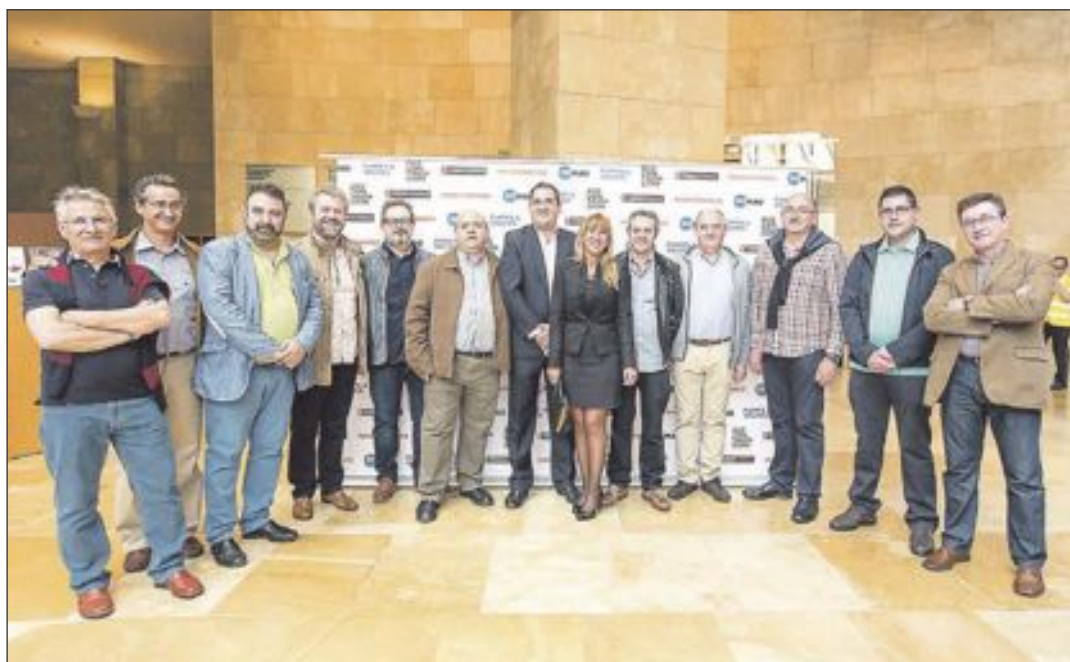
Las empresas asistieron de forma agrupada, en el certamen celebrado del 26 al 29 de mayo / Los empresarios asistieron a una recepción oficial ofrecida en el Museo Guggenheim