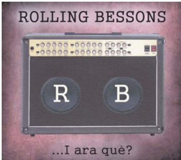
Portada del nuevo trabajo discográfico del grupo ibense Rolling Bessons

el tema 'Mis manos', una canción que se estrenó en el Auditorio de la Diputación de Alicante (ADDA), ante más de 1.300 asistentes, en una gala benéfica.