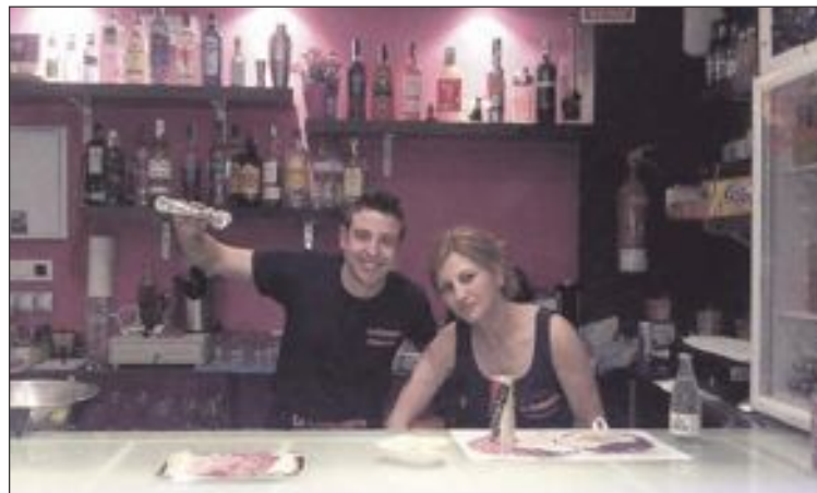
El personal de La Gintonería recibe a sus clientes con una sonrisa