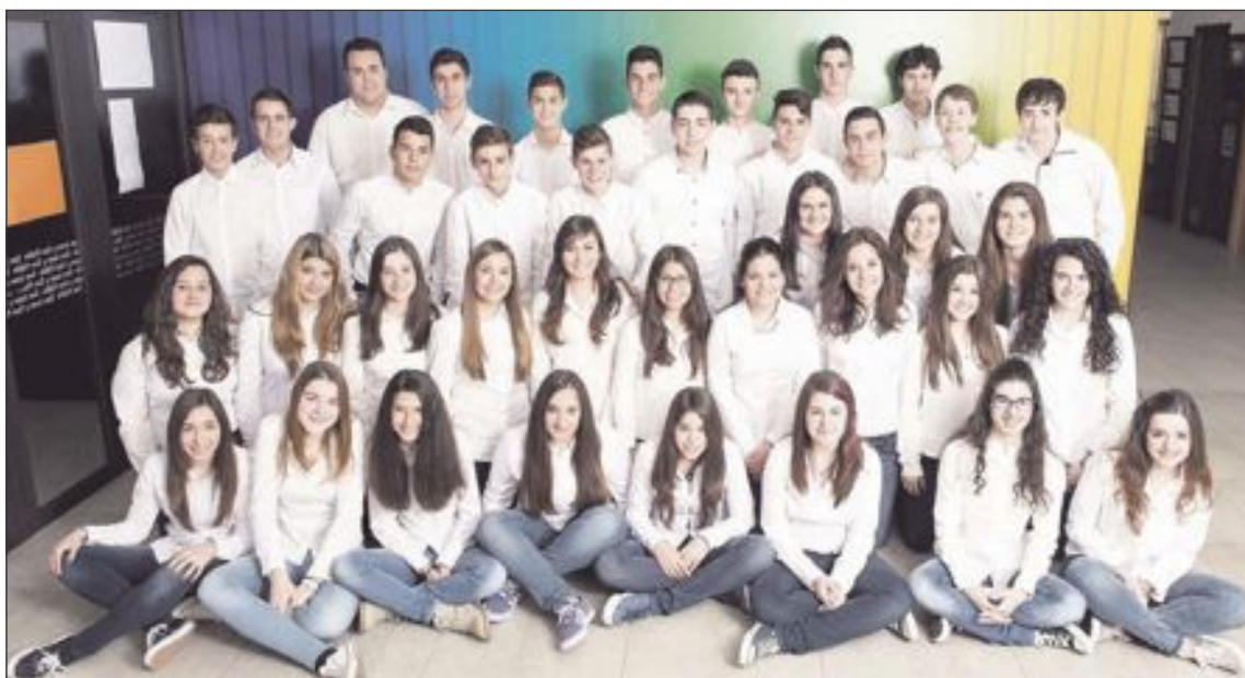
Alumnos de la decimosexta promoción, que han finalizado este año sus estudios de Secundaria en el centro

Las entradas para la cena ya están disponibles en el CEAM, la UDP y el Departamento de Servicios Sociales del Ayuntamiento, en el Centro Social Polivalente.