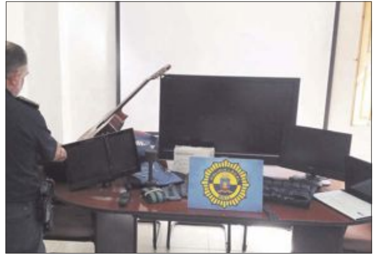
Un agente de la Policía Local, con algunos de los artículos recuperados

Respecto al Partido Popular, el voto de sus tres concejales en el acto de investidura está aún en el aire, según la futura alcaldesa, si bien a este periódico le ha sido imposible contactar con esta formación para conocer su postura de primera mano.