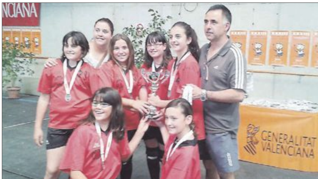
Equipo femenino de Minivoley, tras recoger el trofeo y las medallas de subcampeonas

La Gala se celebrará el sábado 20 de junio, a partir de las 21 horas, en el Polideportivo municipal.