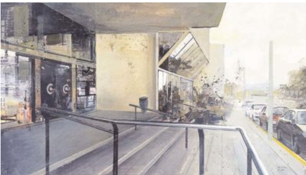
Cuarto premio: Salvador Ribes