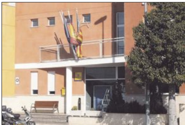
Dependencias del Ayuntamiento de Tibi