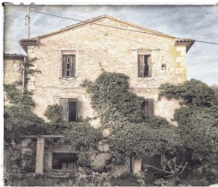
El premio del jurado ha sido para esta imagen del usuario _silver_

Amigos y alumnos arroparon el 5 de junio a Manuel Roig en la presentación de su libro Terra Sagrada , con el que consiguió el Premi Valencià de Poesia , en 2014. Como colofón, sus alumnos de Música, del IES Barrachina, le obsequiaron con una interpretación de La vida es bella , logrando emocionar a todos los presentes.