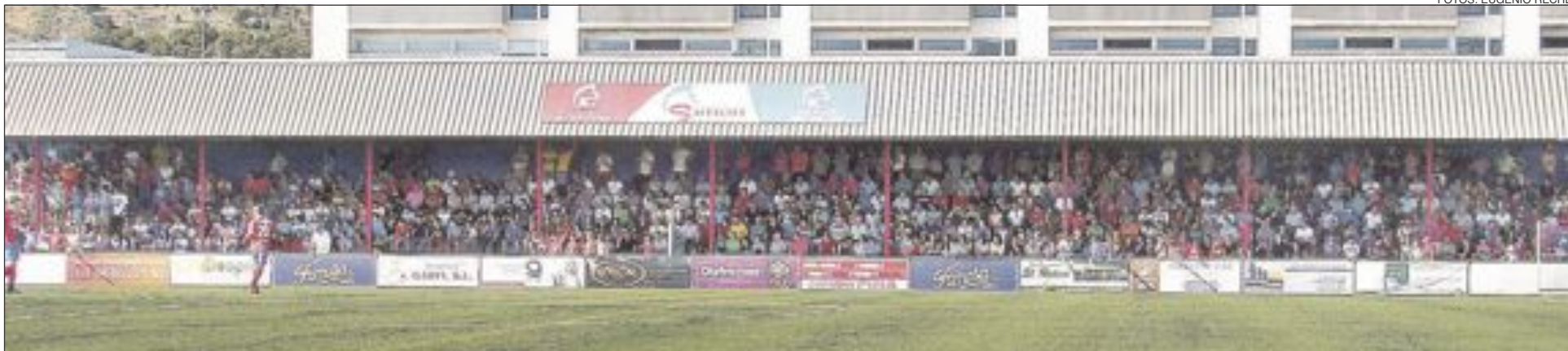
Alrededor de 1.500 personas, según la organización, presenciaron el partido del sábado 6 de junio en el Estadio Vilaplana Mariel, entre el Rayo Ibense y el Barrio del Cristo