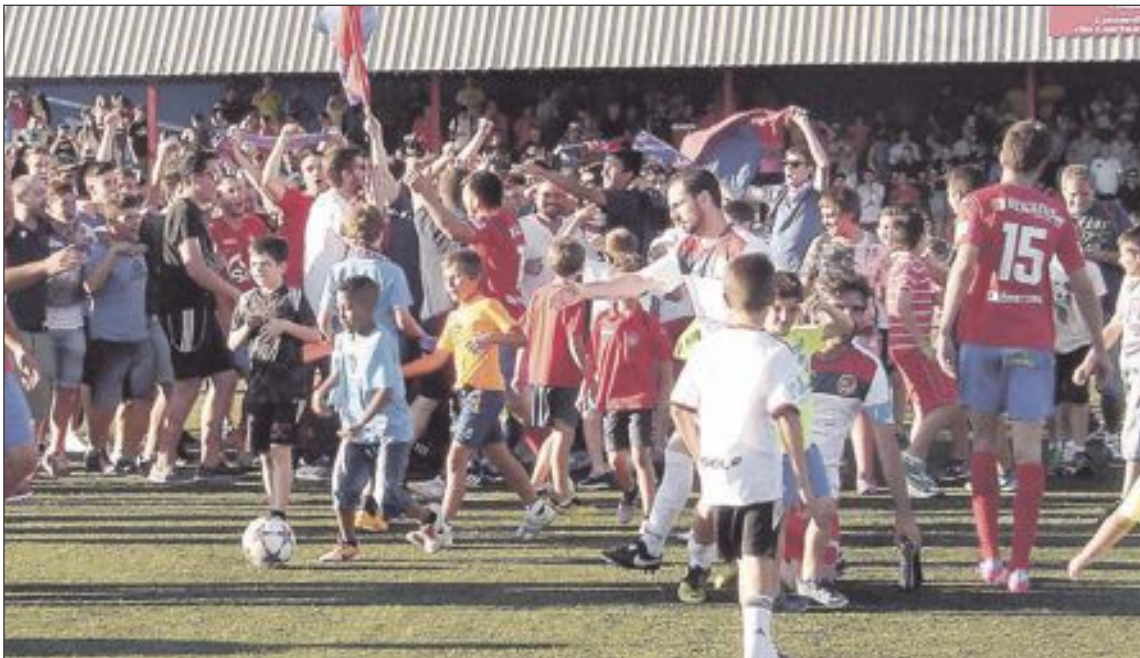
Al final del partido, muchos espectadores celebraron la victoria junto con los jugadores en pleno campo de fútbol