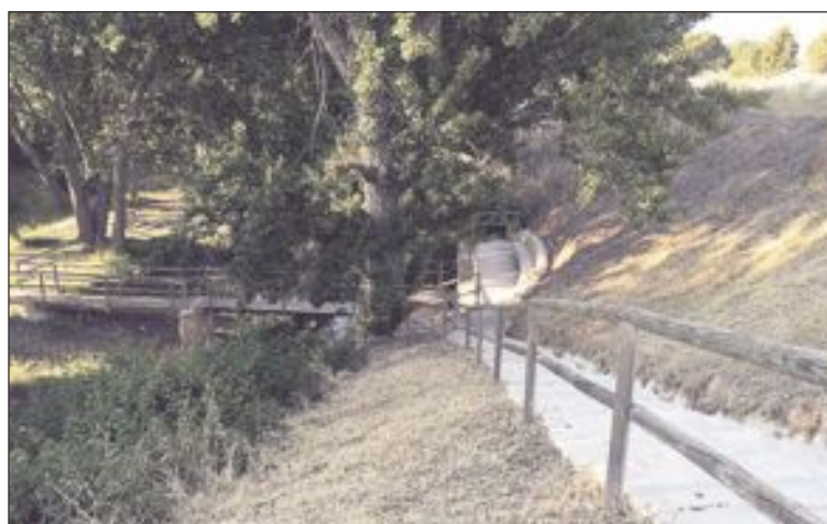
Los trabajos están siendo coordinados por la concejalía de Medio Ambiente

minar las hierbas y matorrales secos para evitar el peligro de incendios con las altas temperaturas durante los meses de mayor calor. La concejalía pide la máxima colaboración ciudadana en este tema, así como que se dé aviso de inmediato si aparece cualquier conato.