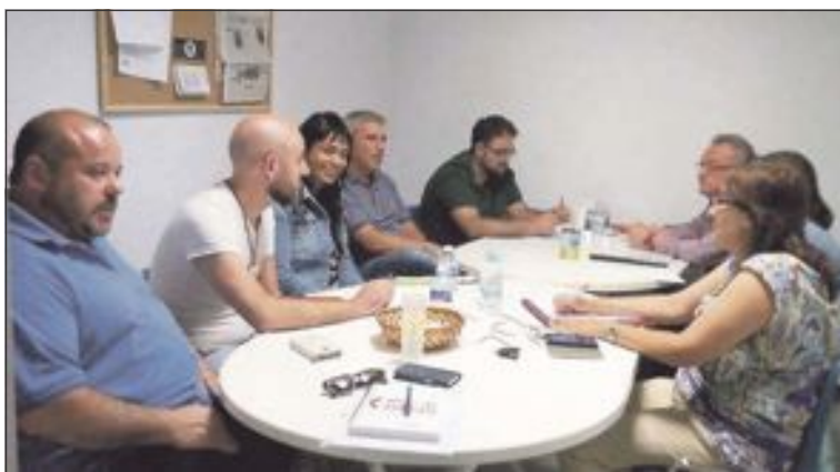
Una de las reuniones que han mantenido los tres partidos