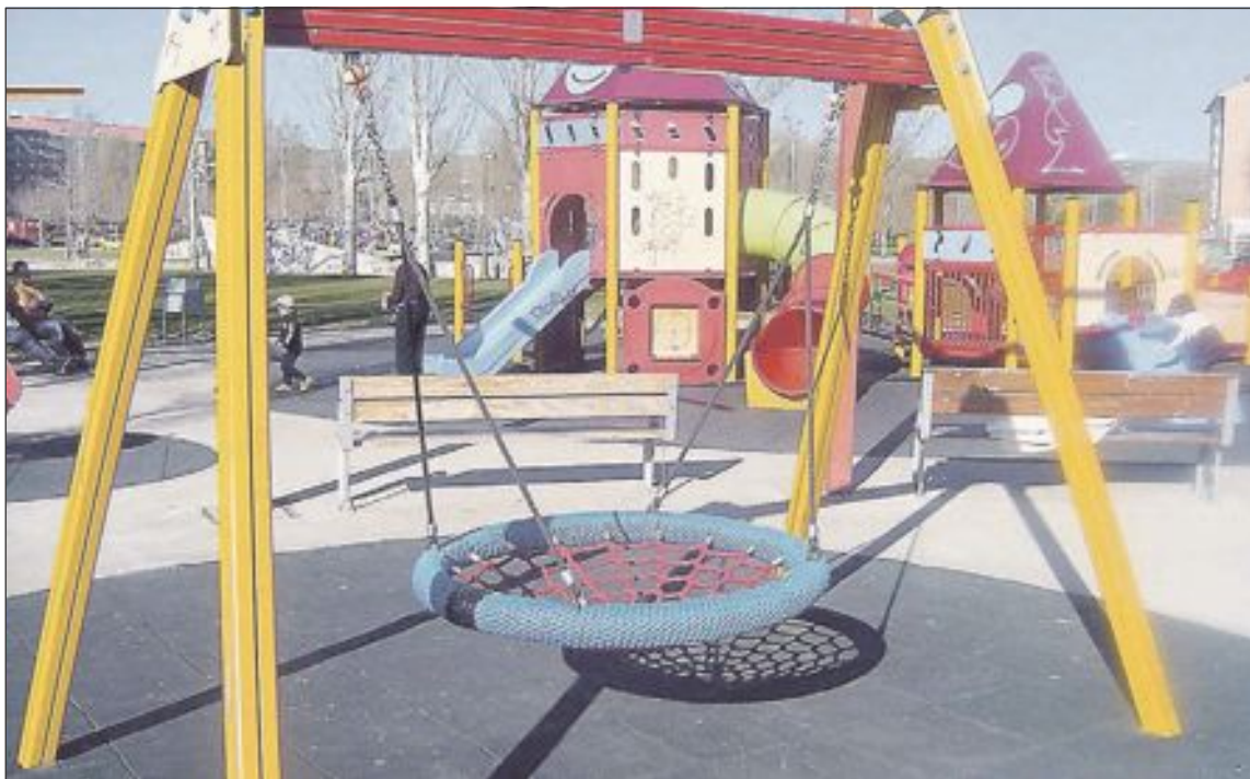
Uno de los múltiples modelos de columpio adaptado que existen en el mercado

Para la portavoz socialista, Susana Hidalgo, "desde el Ayuntamiento debemos garantizar la igualdad de derechos de todos los ciudadanos, especialmente en el caso de los colectivos más vulnerables. Todo niño necesita y