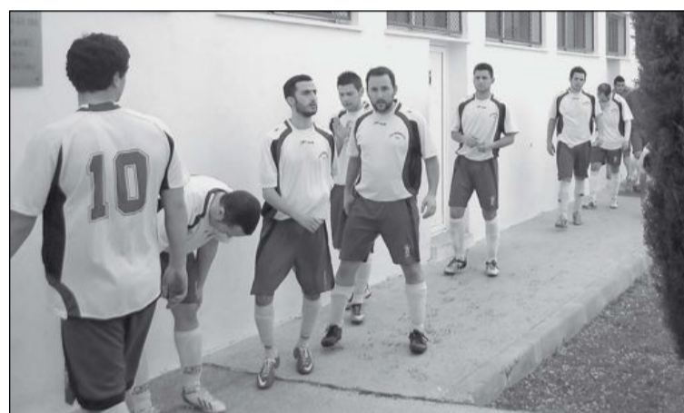
La Peña Madridista se prepara para salir al terreno de juego en el Vilaplana