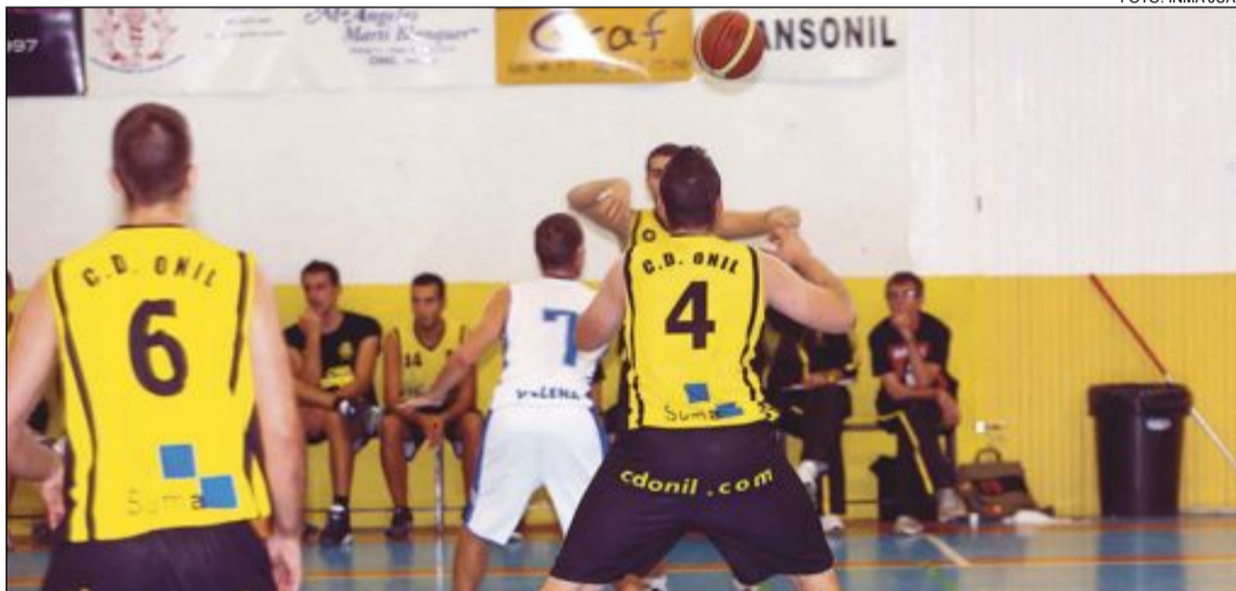
El CD Onil Sénior Masculino 'A' ganó al Calpe tras la prórroga (87-84)

En el tercer cuarto salieron más intensos, y fruto de ello se colocaron por delante en el marcador, pero volvieron al intercambio de canastas y el Xàbia de nuevo se marcha de +5, pero el Maño con dos triples puso a