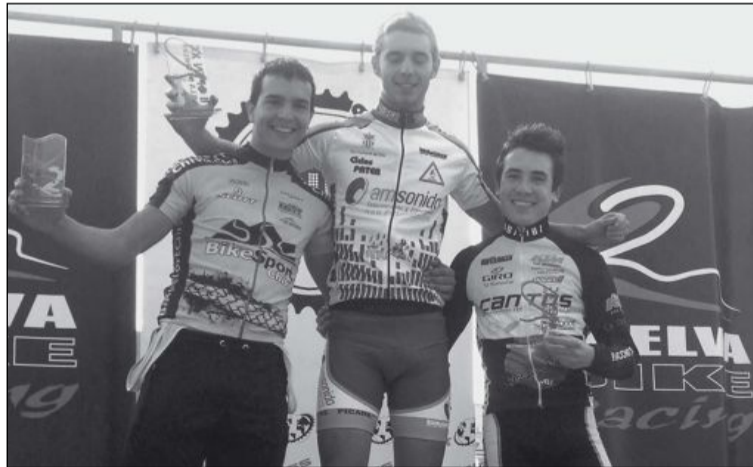
Podio de la categoría Júnior