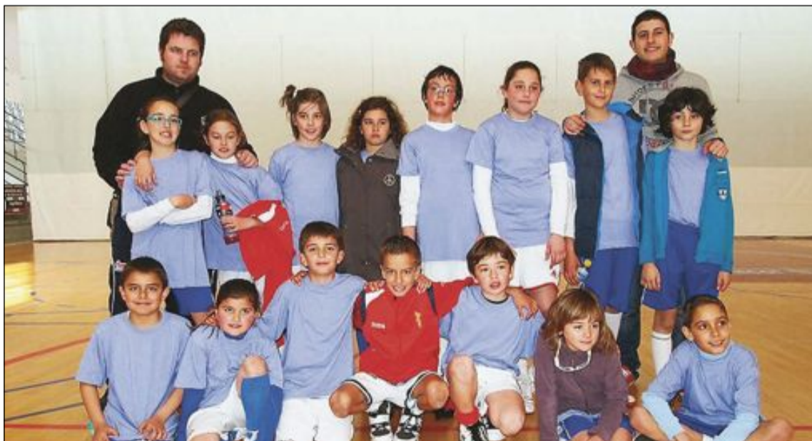
Equipo del CB Teixereta en categoría Benjamín Mixto, durante la convivencia en Alcoi

Júnior Masculino. El Villena se lleva un partido vibrante y lleno de rachas ante un Teixe que defendió poquito. Los ibenses iban a Villena a jugar uno de esos partidos trampa, ya que el equipo villenero tiene mucha más calidad de la que refleja la clasificación, y además tiene una pista corta, que al Teixe no le conviene nada.