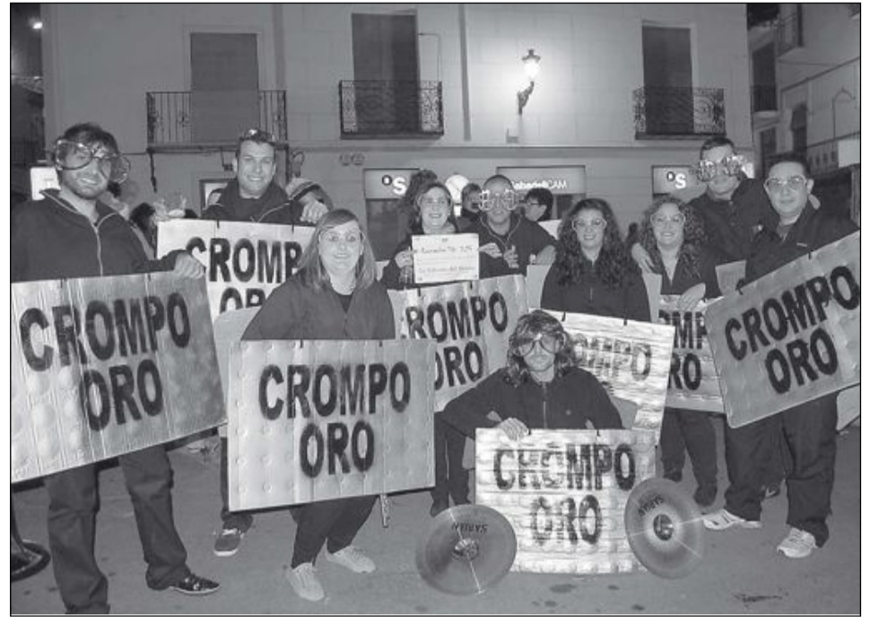
El grupo disfrazado de Compro Oro consiguió el tercer premio