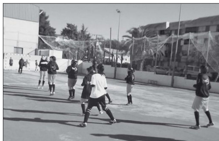
Las chicas del Kiwibi, jugando en una pista exterior del Polideportivo

El sábado día 23 a las 19:00 horas, siguiente encuentro contra La Salle en el Polideportivo Derramador, donde el apoyo del público será clave.