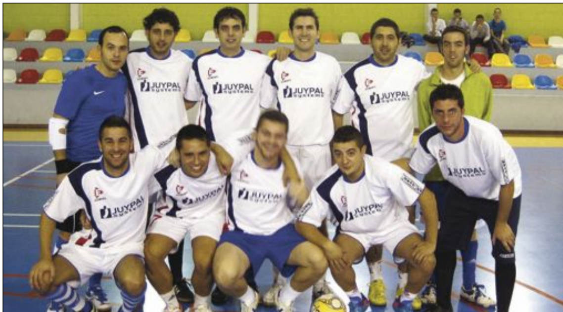
Equipo Juypal-Systems (La Granja)

Products 2-1 C. Maranatha Colchonería Silenzio 9-2 Autoescuela Ibi La Casa FS 7-5 Dos Lunas