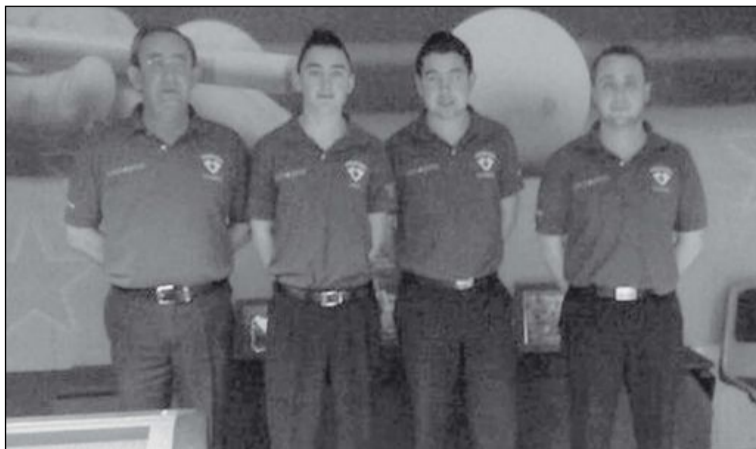
Participantes del equipo de billar del CB Castalla en categoría Nacional