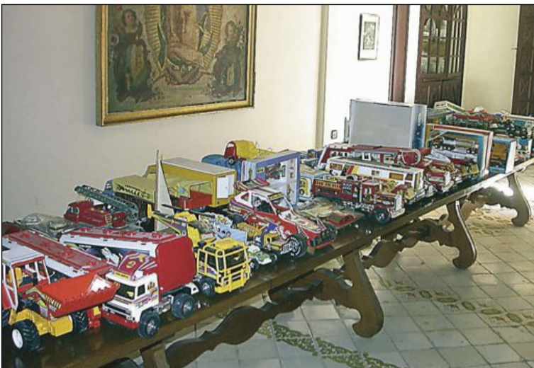
Uno de los muebles por lo que se pregunta es la gran mesa de madera