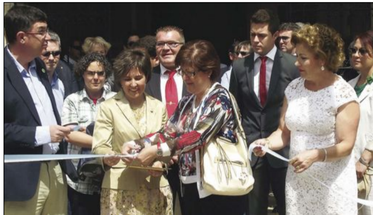
Corte de la cinta inaugural de la Feria de San Isidro 2012

De hecho, la Fiscalía expuso en su escrito remitido al juzgado decano de Ibi que los denunciantes (los ocho conceja-