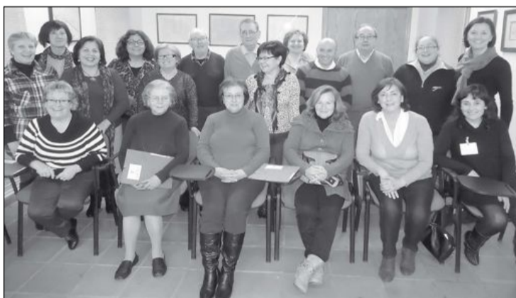
Asistentes al curso celebrado en la Casa de Cultura de Biar

La actividad se celebra el sábado 23 de febrero y el punto de partida será la plaza de la Iglesia, a partir de las 10 horas. Los participantes pueden llevarse sus propias herramientas. El Ayuntamiento obsequiará a todos los asistentes con un refresco.