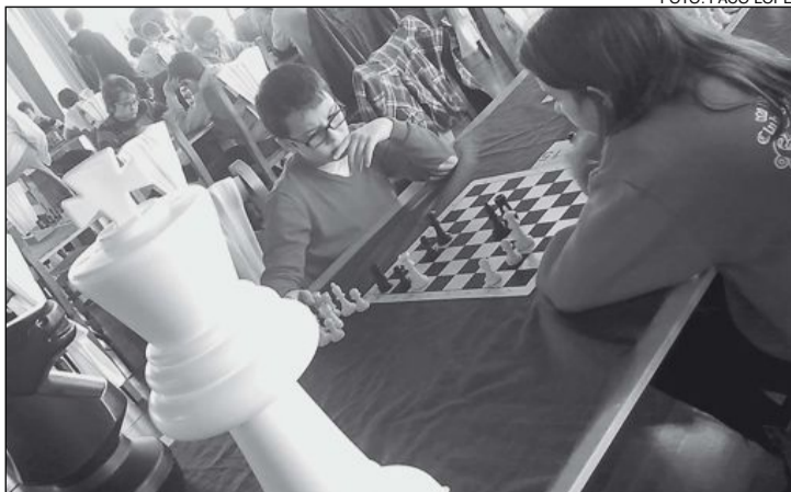
La primera jornada se disputó en el Hotel Caseta Nova

Es el II Campeonato Sub-21 de Billar a Tres Bandas, circuito Comunidad Valenciana, valedero para el Ránking de la Comunidad Valenciana.