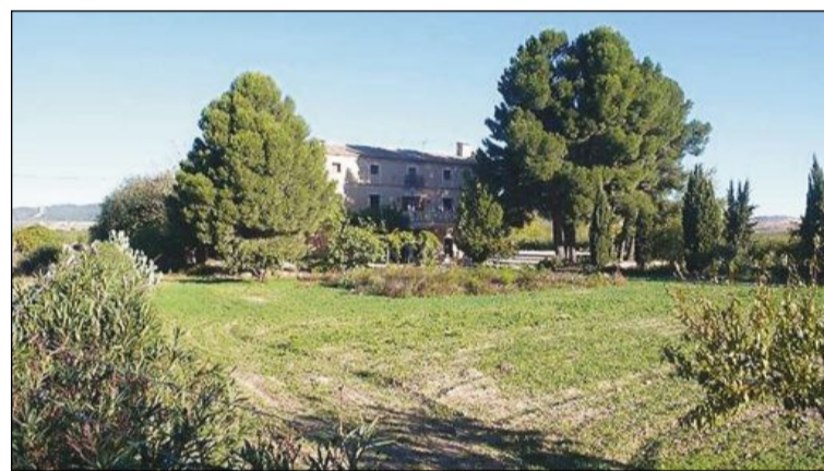
Un detalle de la Finca Casa del Derramador, en Caudete (Albacete)