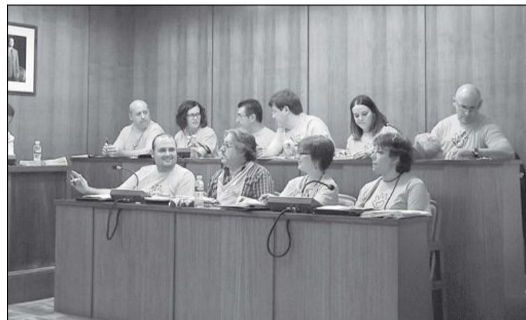
Los grupos de la oposición en un pleno

Además, critica que en vez de esperar a la nueva ley del Gobierno que regulará el funcionamiento de los ayuntamientos “aquí por la santa voluntad de un concejal con el que hemos sido críticos, se elimina a la oposición”.