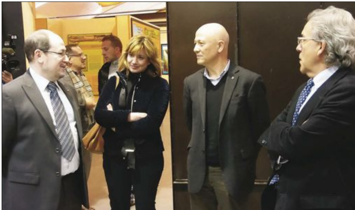
La concejal de Medio Ambiente, el director del Museo de Ciencias Naturales y el director del CIBIO en Ibi

El Museo de la Biodiversidad de Ibi es fruto del convenio firmado en 2004 entre el Ayuntamiento y la Universidad de Alicante, a través del Instituto Uni-