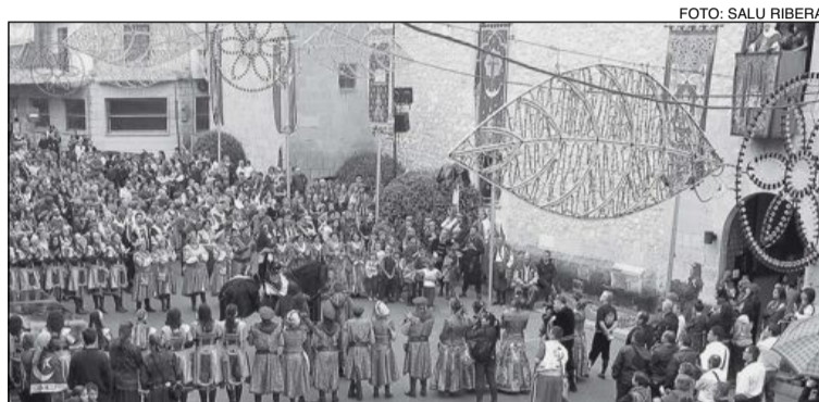
Momento de la Embajada de Onil (archivo)

En la actualidad, expertos y voluntarios están realizando un estudio exhaustivo de las caracte-