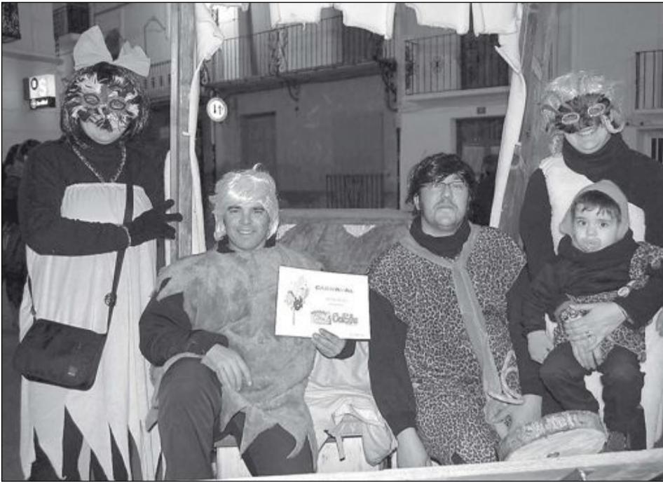
El grupo disfrazado de los personajes de la serie Picapiedra se llevó el primer premio