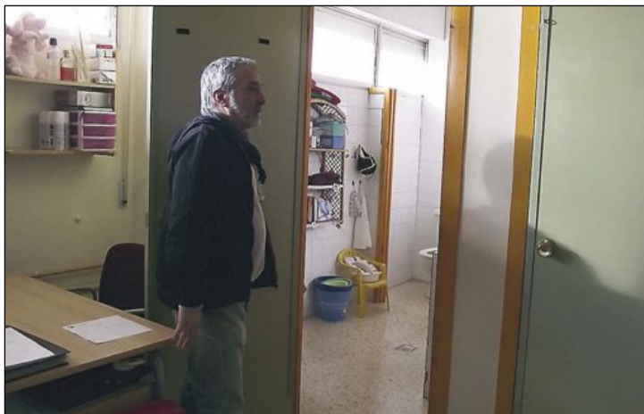
El director del centro muestra los aseos que deben ser adaptados

Sin embargo, no tuvo contestación para el resto de enseres. Valls afirmó que averiguará dónde han ido a parar. Al parecer, según ha explicado a este periódico, la mesa podría haberse desmontado y almacenado en los bajos del Ayuntamiento.