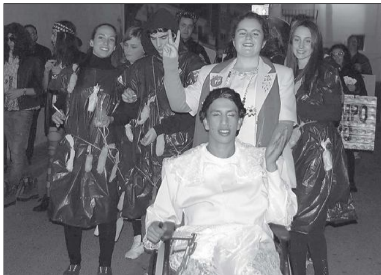
Parodia de Rita, fallera mayor y mascletà consiguió el segundo premio

Cientos de vecinos participaron en el desfile y también en el concurso, que premió a los mejores disfraces. El primer premio fue para el grupo Picapiedra; el segundo premio para la parodia de Rita, fallera mayor y mascletà; el tercero, para el grupo de Compro Oro; y el cuarto, para los roqueros. Los premios consistieron en descuentos en las tiendas locales.