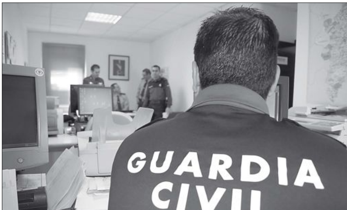
Refuerzo en el equipo de investigación de la Guardia Civil de Ibi.

En Ibi, la Policía investiga varios asaltos a viviendas ocurridos en la calle Alicante, Nueve de Octubre y San Isidro, de Ibi. Según fuentes cercanas al caso podría tratarse de los mismos delincuentes, ya que emplean el mismo modus operandi : el descuelgue, como se conoce en la jerga policial, es decir se descuelgan (con cuerdas) por los patios interiores de los edificios y una vez allí, entran a las viviendas por la ventana. De esta manera se cometieron tres robos en sendos domicilios el jueves 14 de febrero. En uno de los hogares se apoderaron de