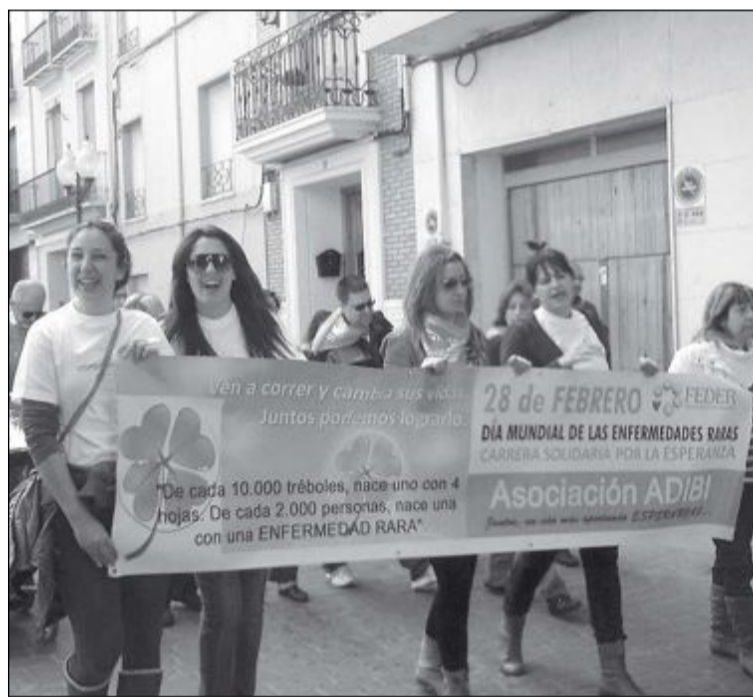
Marcha solidaria por las enfermedades raras del pasado año

El festival se celebra en el Teatro Río a las 18 horas.