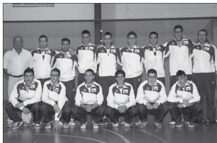
Plantilla del CFS Castalla en categoría Nacional Juvenil