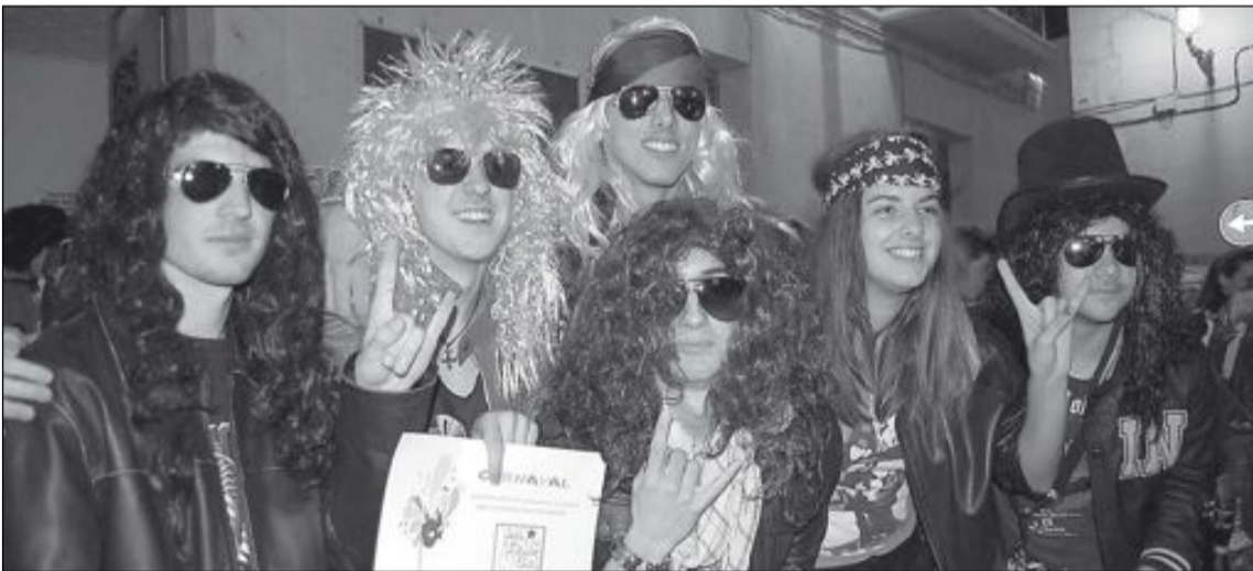
El cuarto premio fue para el grupo disfrazado de roqueros