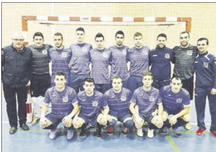
CFS Castalla en Tercera División

A pesar de ello, en la segunda parte el equipo sale a por todas, pero Pinoso no lo iba a poner fácil. A falta de dos minutos, el Pinoso marcaría otros dos goles muy merecidos.