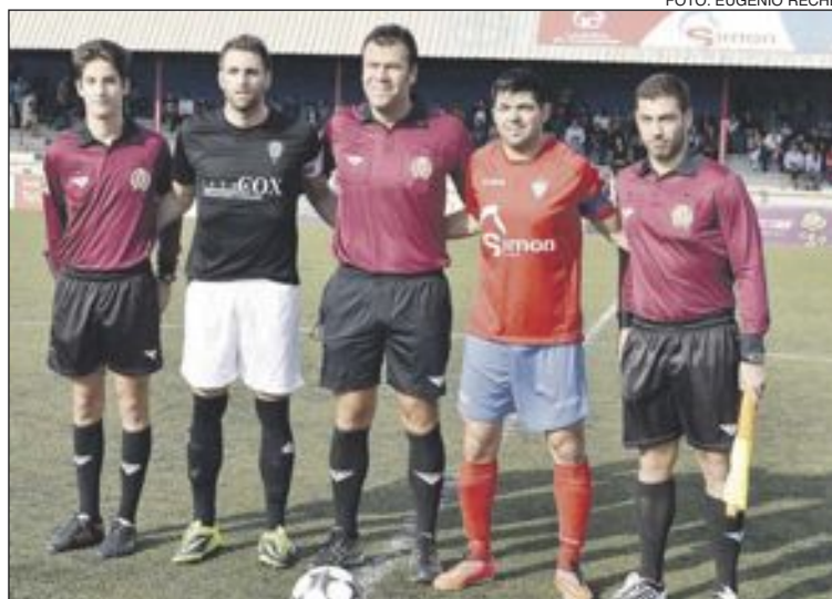
Imagen de archivo del partido de ida contra el equipo de Cox

En el minuto 73 se reclamó un penalti cometido sobre Juan-