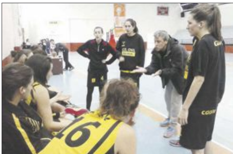
CD Onil Sénior Femenino en un tiempo muerto del partido pasado

Se perdió el partido en el primer cuarto, no se estuvo en nin-