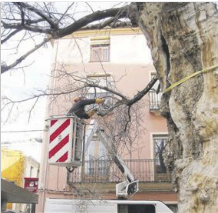
Las actuaciones las realizan técnicos municipales y de Conselleria