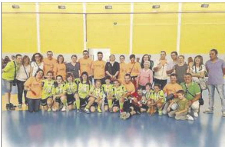
Futsal Ibi Cadete Femenino, nominado a mejor equipo en la Gala del Deporte

Con la pájara de ese gol, y en un córner en contra, llegó el segundo del Calpe, en un error de marcas y de posición. Y así se llegó al descanso. Los ibenses salieron a por todas, como siem-