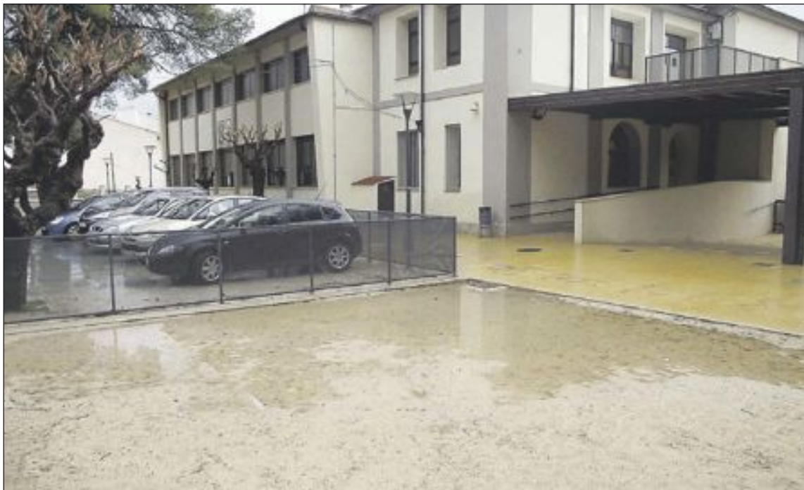
En días de lluvia, el arenero se encharca y no puede usarse durante días

Aún así, desde el centro se siguen remitiendo nuevos escritos para que atiendan su demanda. Recientemente se ha nombrado a un nuevo director territorial de Educación y el proceso parece que ha cobrado un cierto