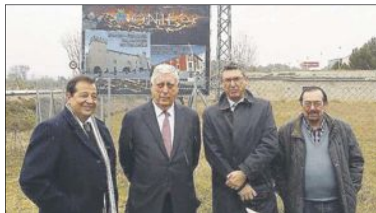
En la autovía procedente de Sax se ha colocado señalética turística e informativa sobre la villa de Onil