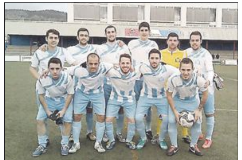
Once inicial de Ibi Racing en su partido contra el Petrelense

Supo aguantar el empuje final del conjunto local y con el pitido final se conseguiría esta victoria tan complicada.