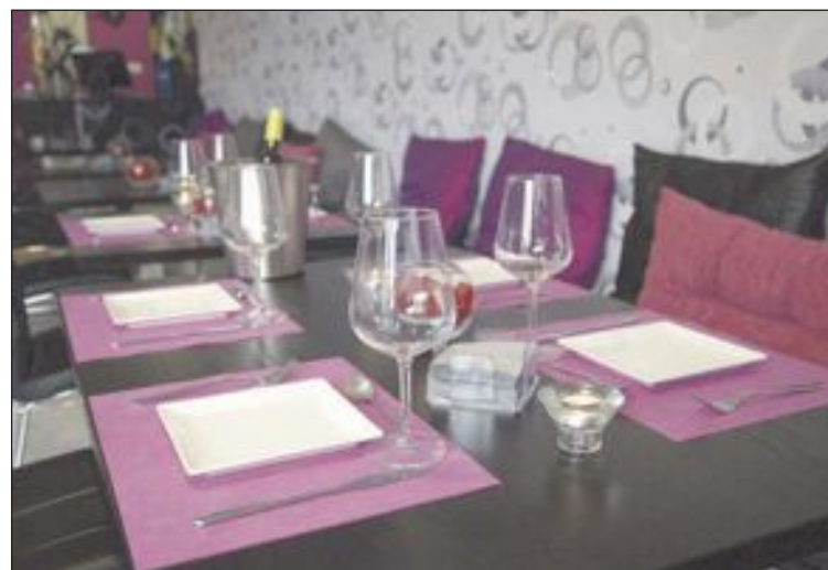
Una decoración agradable y funcional para disfrutar de la buena cocina