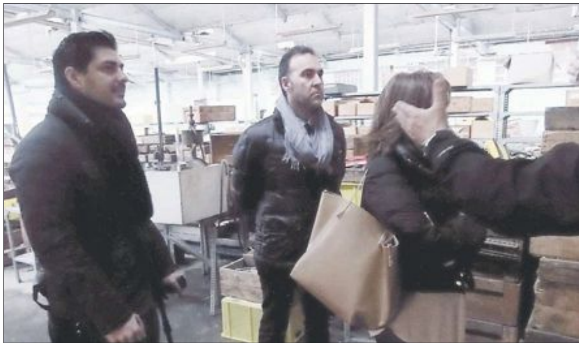
El concejal de Museos y el alcalde supervisan las tareas de limpieza en Payá, que ya han comenzado

La candidata socialista se ha comprometido a impulsar una acción “rentable, decidida e integral” en esta fábrica porque asegura que “Payá es mucho más