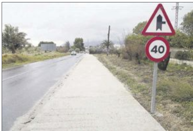
Acera habilitada en la CV-815 (entra la rotonda y el polígono La Marjal)

Sánchez realizó estas declaraciones el martes 17 de febrero en el Palacio del Marques de Dos Aguas, durante el acto de entrega al Ayuntamiento de las obras acometidas y sufragadas por la Generalitat Valenciana en un tramo de la carretera CV-815, donde se ha habilitado una acera de hormigón, de 130 metros de longitud y al menos 1'5 metros de ancho, para facilitar el paso de peatones entre la rotonda de acceso a Onil y el inicio