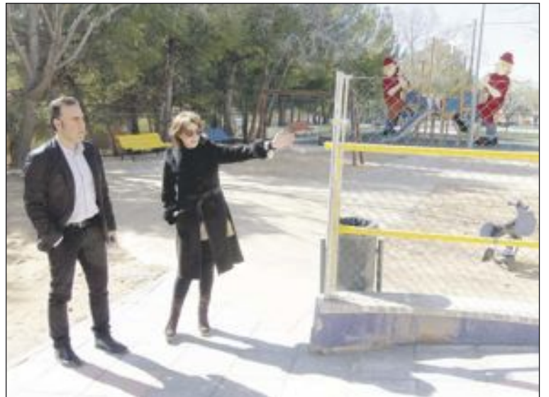
En la glorieta de Fofó se han eliminado las barreras arquitectónicas

Los trabajos están consistiendo en construir una acera de paso, con un bordillo de protección para los peatones y una nueva isleta, de menor tamaño, decorada con las mismas figuras que ornamentan la plaza del Centenario y la nueva Tourist Info : los primeros juguetes de hojalata, a gran escala, fabricados por la emblemática fábrica Payá. Se ha reducido el tamaño de la nueva isleta, con el fin de aumentar la seguridad vial en ese tramo.