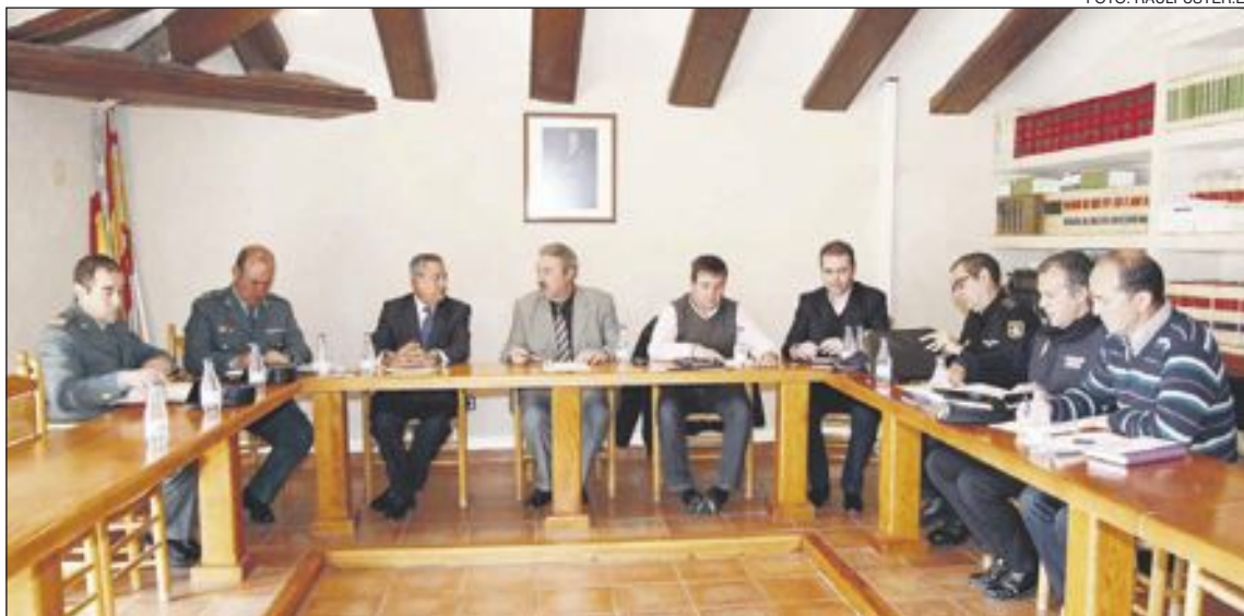
La Junta Local de Seguridad tuvo lugar el 29 de enero en el salón de plenos del Ayuntamiento de Castalla