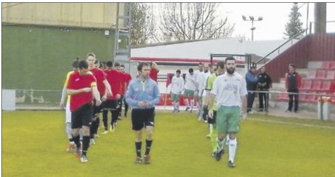
Los jugadores del Pinoso y la Peña Madridista de Ibi saltan al terreno de juego, de césped natural