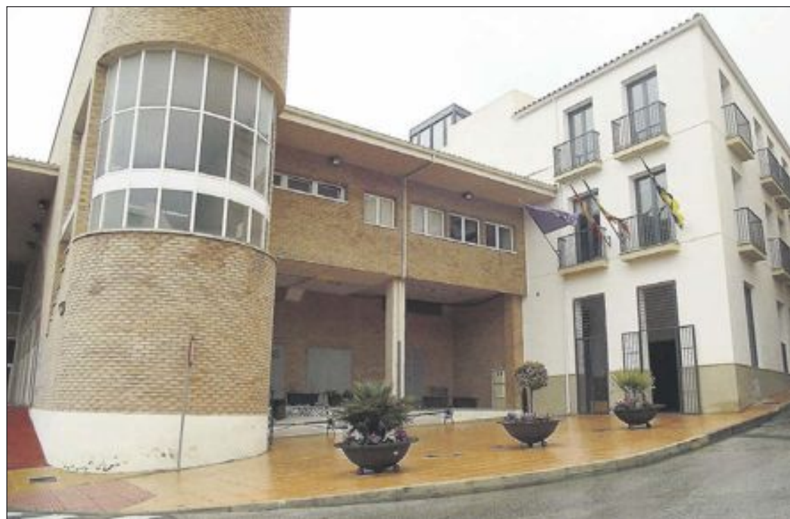
El nombre de esta plaza homenajeará a los atletas olímpicos de Onil

Por otro lado, y a petición del Consejo del Deporte de Onil, el Ayuntamiento va a incrementar “casi al doble” las ayudas al deporte local, “para compensar los años de esfuerzo anteriores de todos los clubes deportivos”, ha señalado el primer edil, quien anuncia que este aumento de las ayudas estará reflejado en los presupuestos municipales del año 2015. Según Blanes, esta medida es posible “gracias a la positiva situación económica actual de superávit y al remanente positivo de Tesorería (ver noticia superior en esta página).