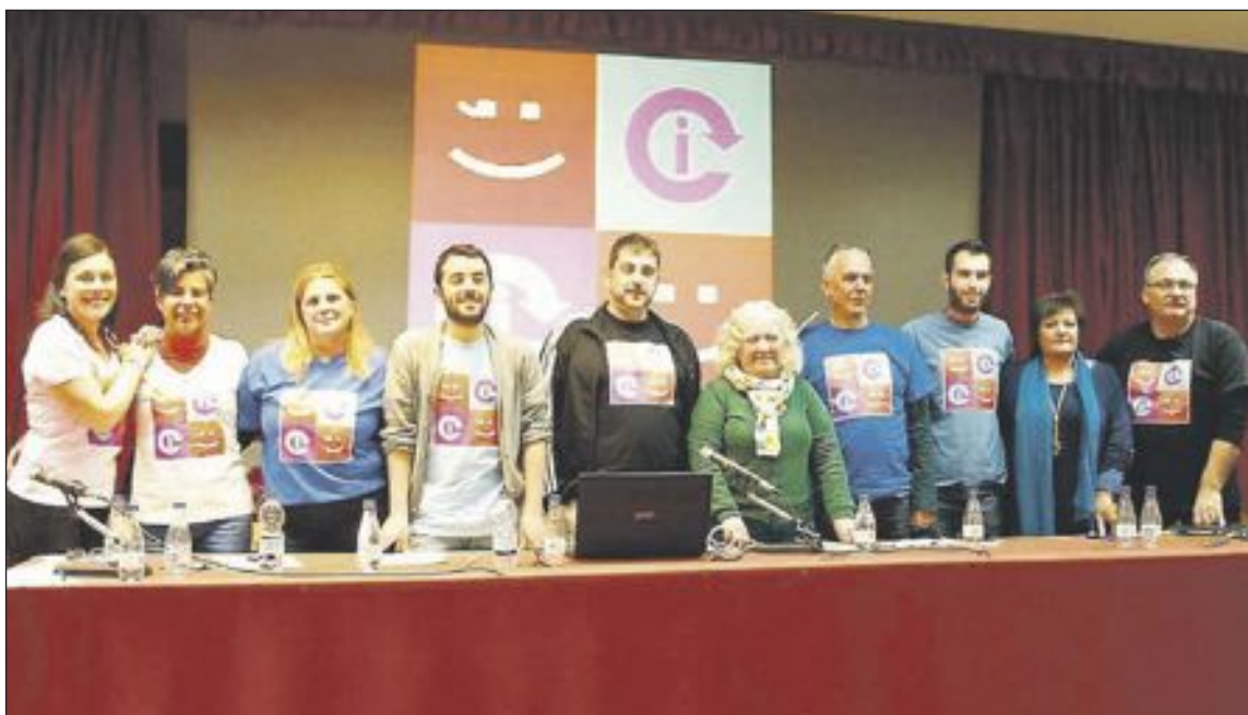
Algunos de los integrantes que forman la nueva coalición, en el acto de presentación del 6 de febrero

Nueva coalición política para las elecciones municipales de Ibi