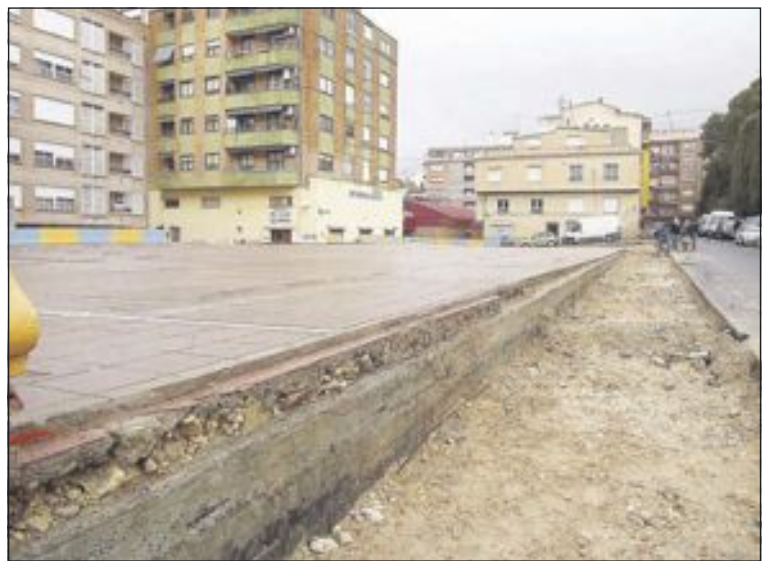
La plaza Einstein está siendo impermeabilizada y se cambiará su aspecto