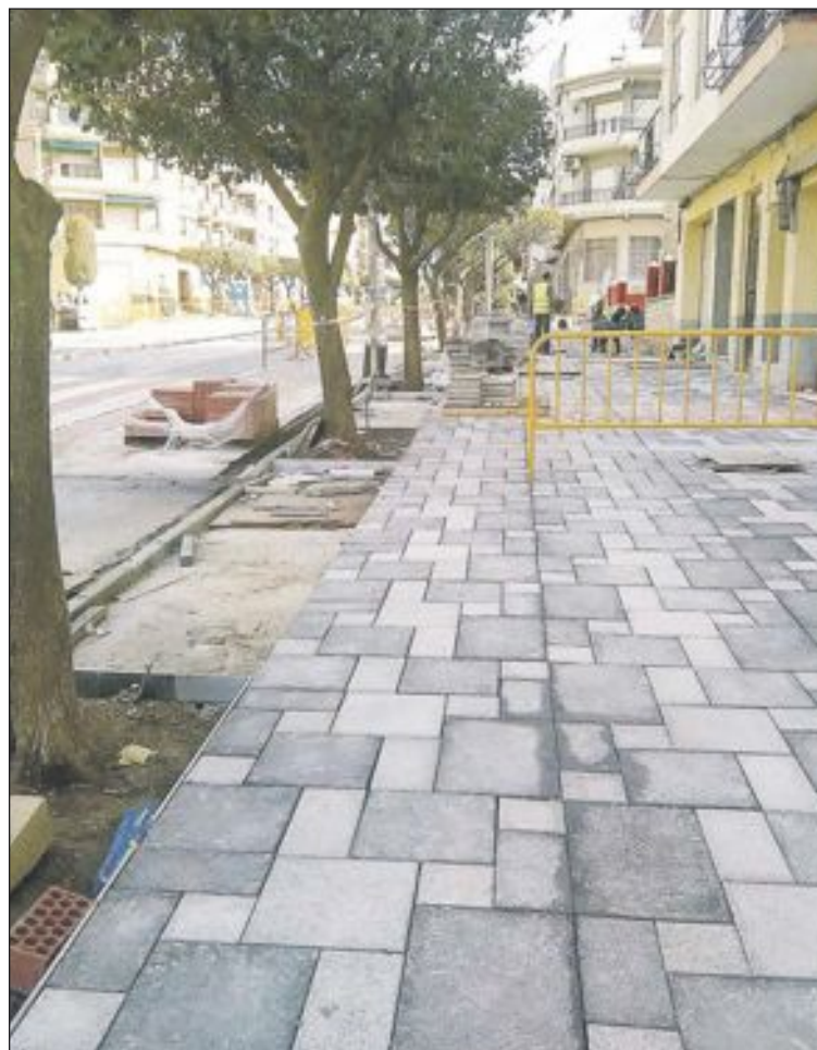
Además se han sustituido las viejas conducciones de agua y alcantarillado

Estos trabajos también están subvencionados por la Diputación dentro del programa de mejoras del ciclo hídrico.