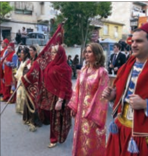
Desfile del bando Moro durante la Entrada de Fiestas