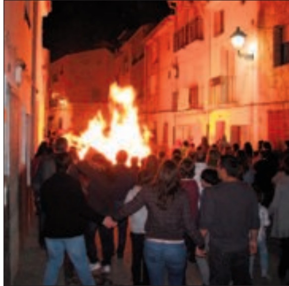
La noche de las Hogueras se trasladó al sábado 23 de abril