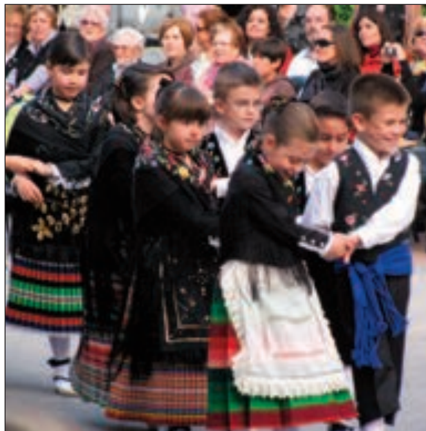
Alumnos de la Escola de Danses d'Onil durante las danzas populares celebradas en la plaza Mayor el miércoles 27