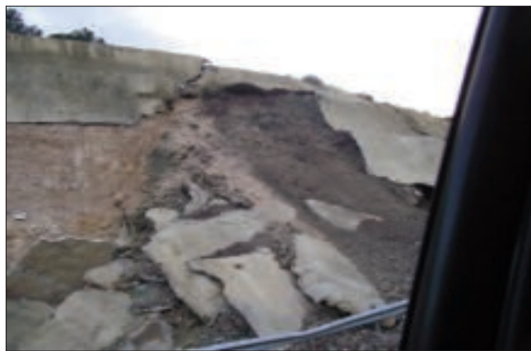
Aspecto del desprendimiento de tierras por la lluvia en el Maigmo

Al parecer, el desprendimiento se produjo por las intensas lluvias que se han registrado en la zona durante los últimos días, y, aunque la circulación de vehículos seguía cortada al día siguiente, la situación se normalizó a las pocas horas.