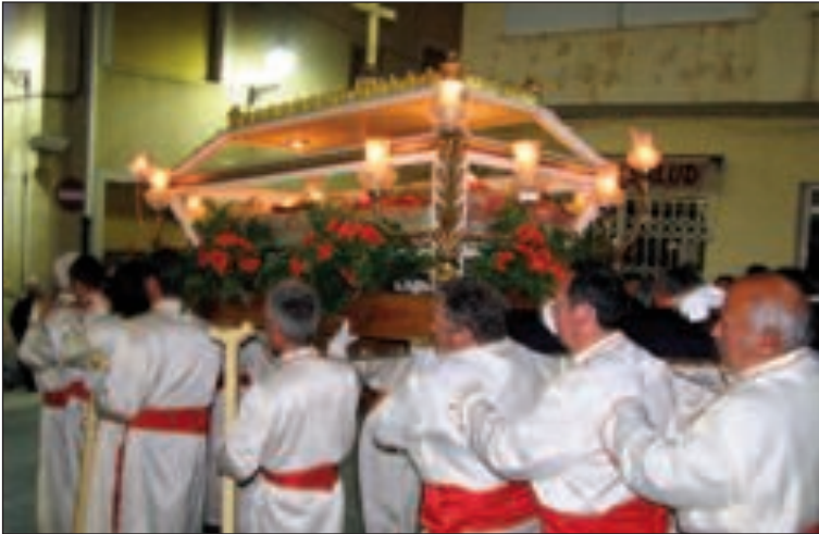
Momento de la procesión del Santo Entierro (Viernes Santo)