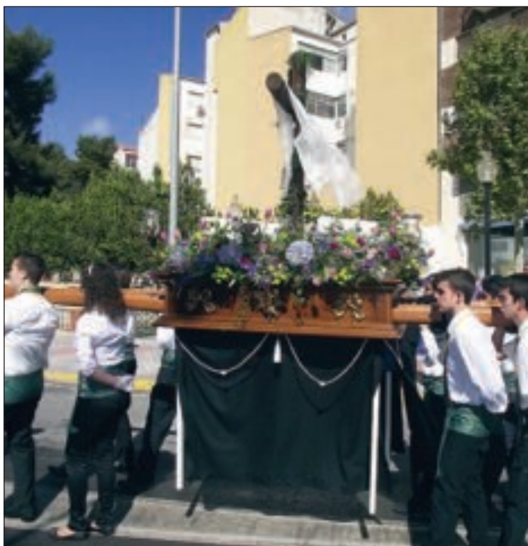
Paso de la Santa Cruz en la procesión del Viernes Santo por la mañana