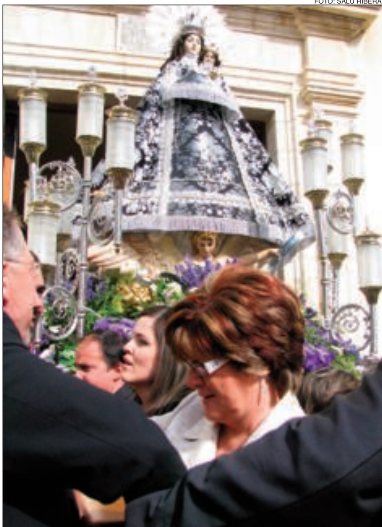
La alcaldesa y el resto de la Corporación sacan a la Virgen de la Ermita

Las Fiestas Patronales de Onil continúan hasta el domingo 1 de mayo