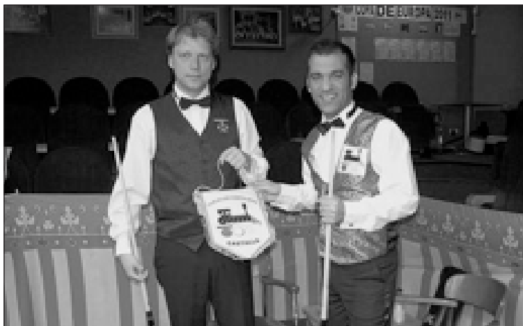
Un jugador del Gröndal de Dinamarca y otro del Caseta Nova sostienen un banderín con el anagrama del club ganador de esta fase clasificatoria