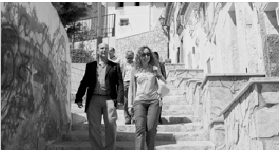
El alcalde y la directora general bajan por unas escaleras del casco antiguo