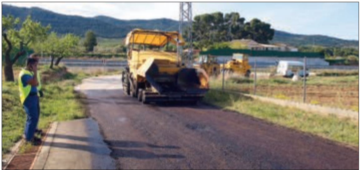
La empresa Pavasal ejecuta los trabajos con una inversión municipal de 26.000 euros