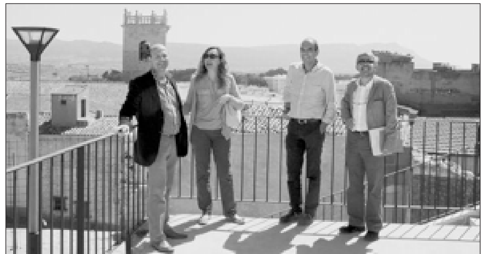
El alcalde y la directora general, junto al arquitecto municipal y otro técnico, en Las Parras