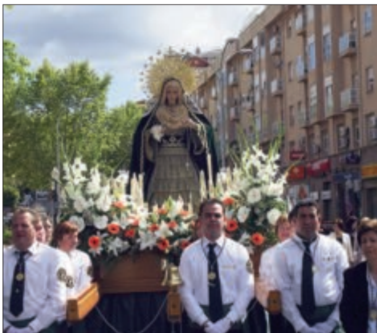
La imagen de la Virgen de los Dolores salió el Viernes por la mañana