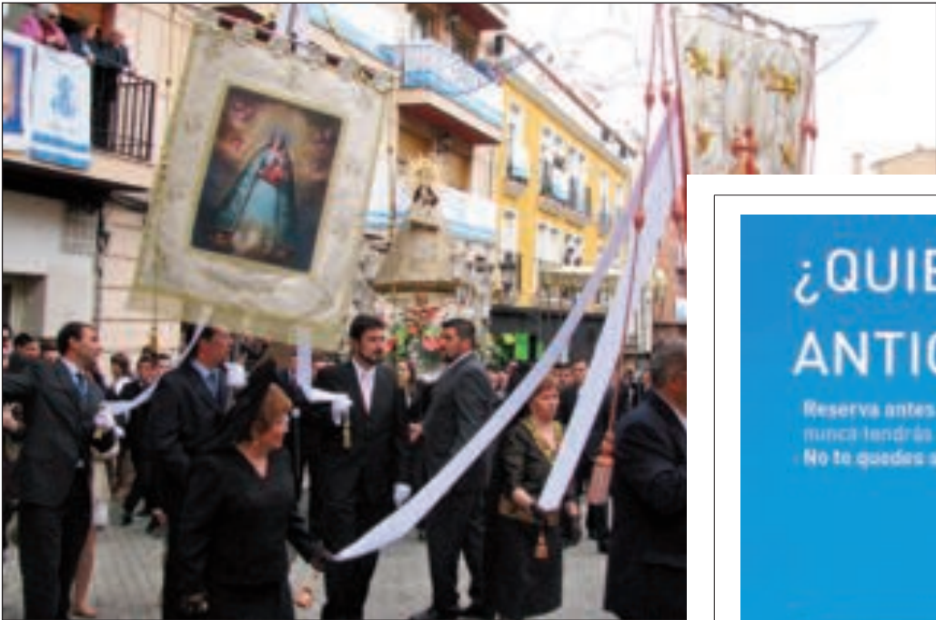
En primer término, la Virgen de la Salud durante la procesión del Encuentro (Domingo de Resurrección)