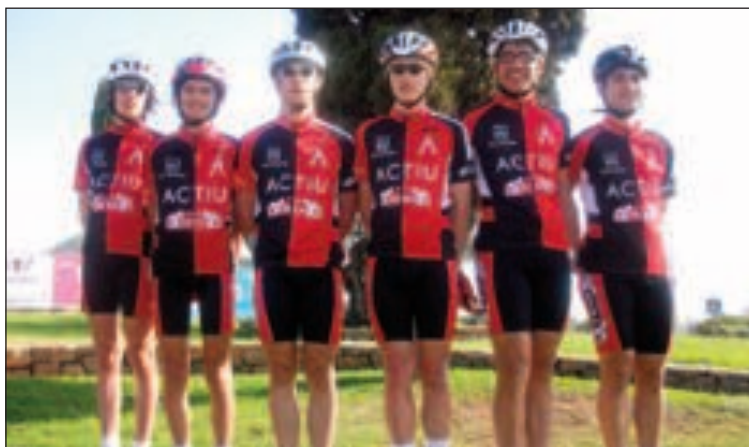
Equipo Cadete del Club Ciclista Castalla