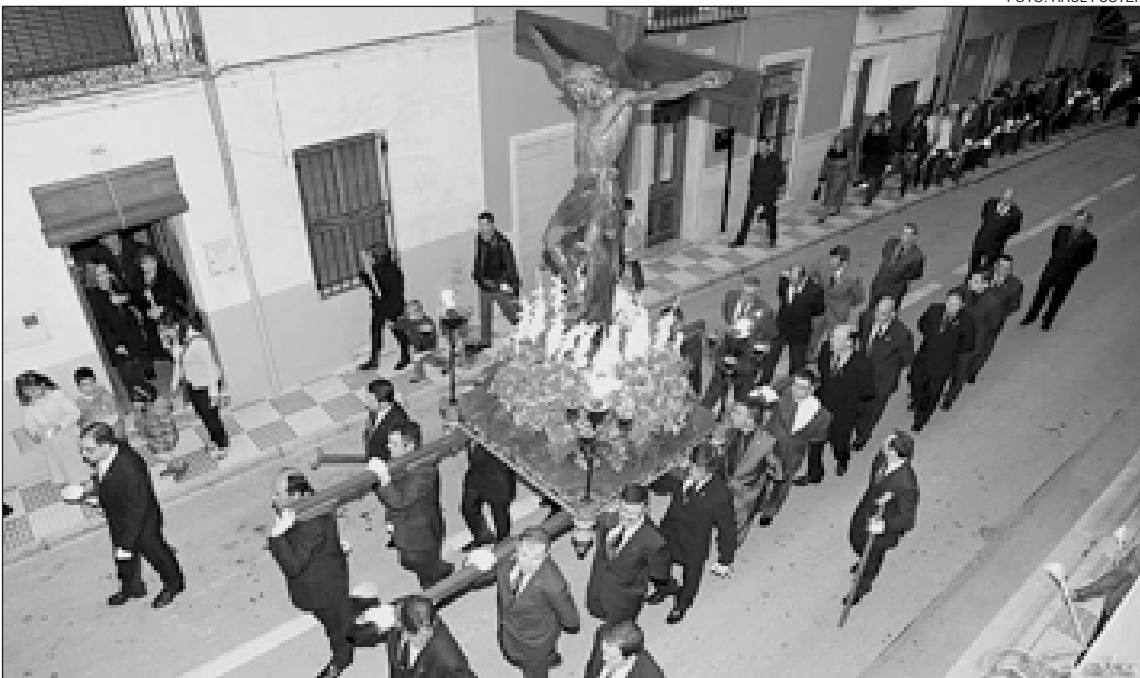
La imagen de Cristo en la Cruz es uno de los tronos que sale a la calle el Viernes Santo