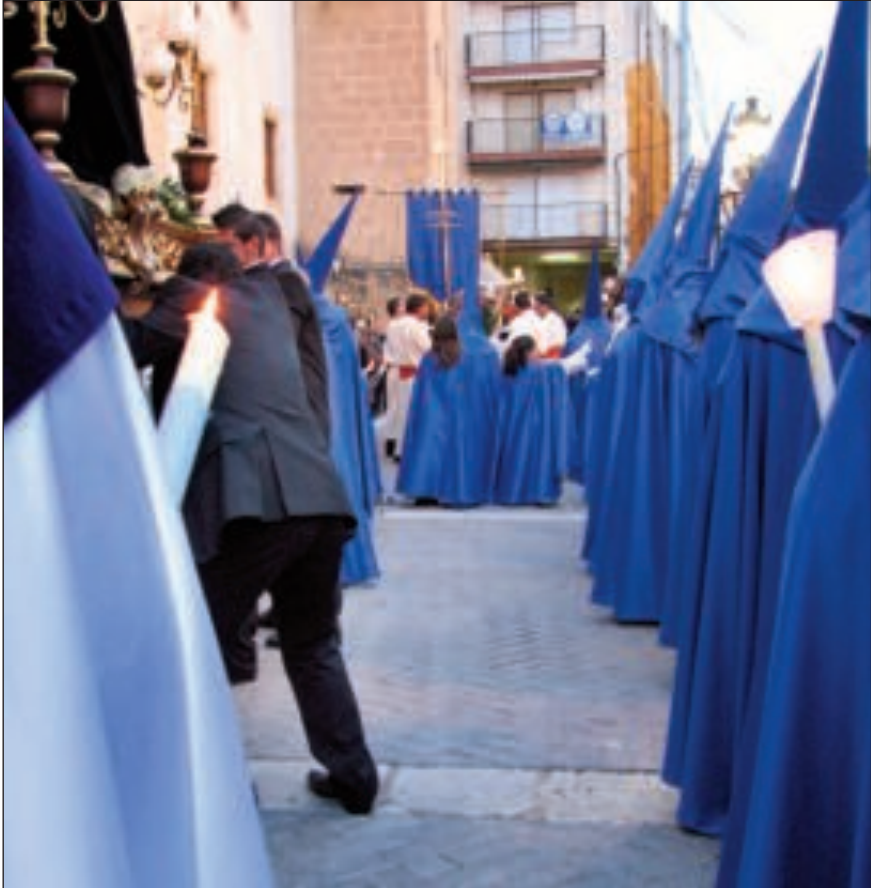
A las 20:30 horas del Viernes Santo comenzó la procesión del Santo Entierro