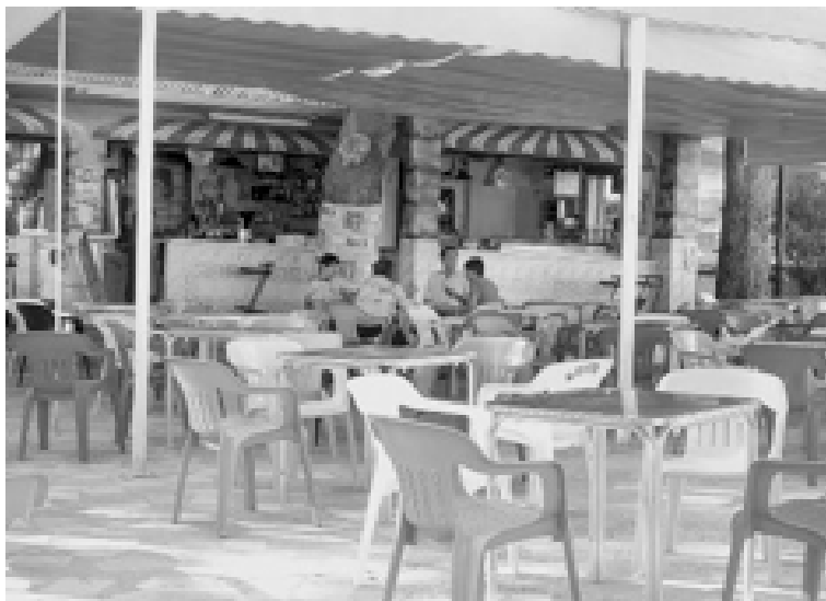
El Kiosket está ubicado en la Glorieta de España de Ibi

El primero de estos conciertos tendrá lugar el viernes 29 de abril para celebrar la apertura de la temporada 2011. El grupo Verghuenza Ajena, con