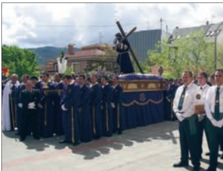
Tras la procesión del Viernes Santo se celebra el acto de las lanzas