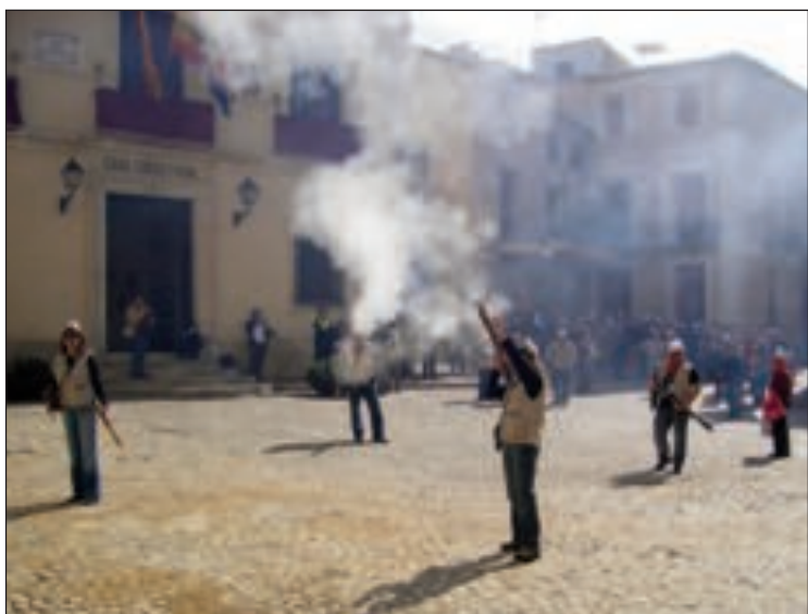
Imagen de archivo de los primeros disparos de arcabucería