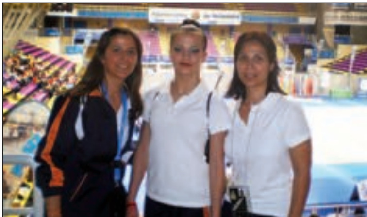
Parte de la expedición ibense que acudió a Valladolid