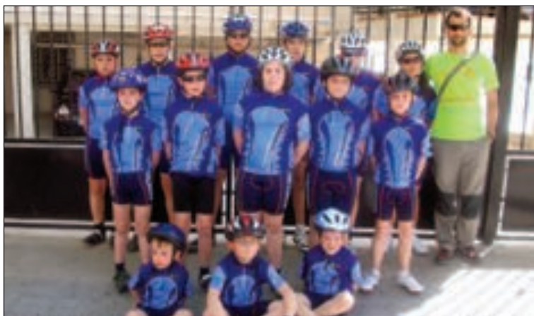
Alumnos de las Escuelas del Club Ciclista Castalla, junto a un monitor