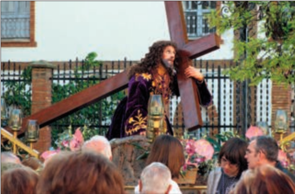
Estremecedora imagen de Cristo durante el Vía Crucis del Viernes Santo