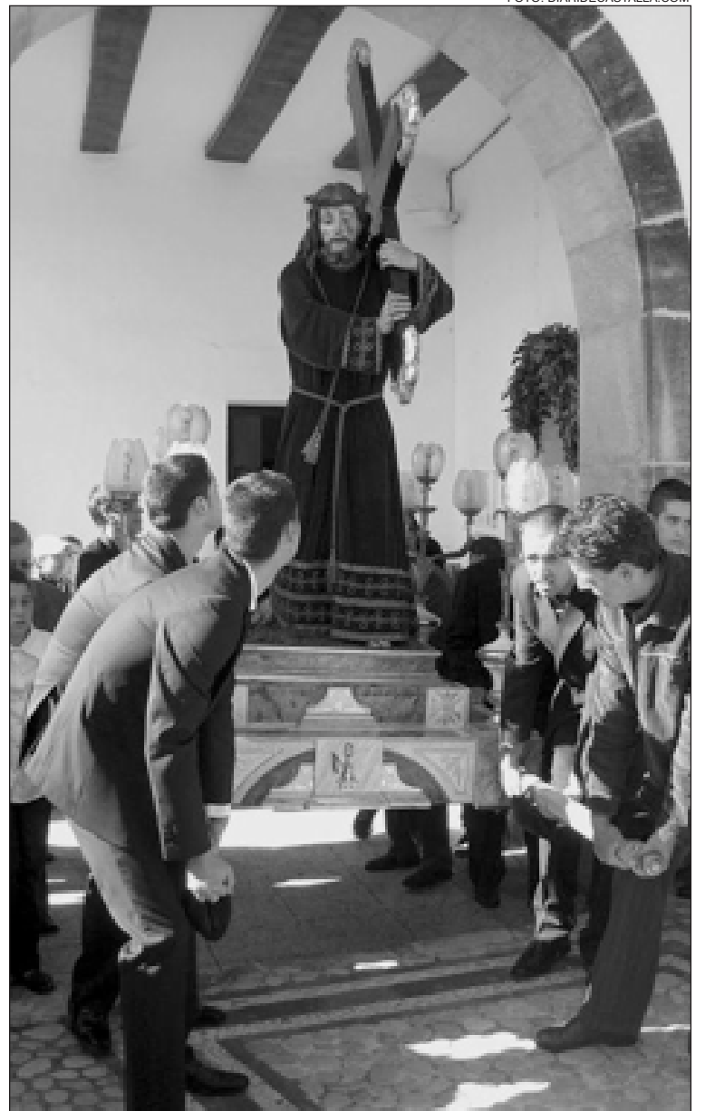
La imagen de Jesús entra en la plaza de la Ermita el Viernes Santo

Los actos finalizan el lunes 2 de mayo con una misa en valenciano