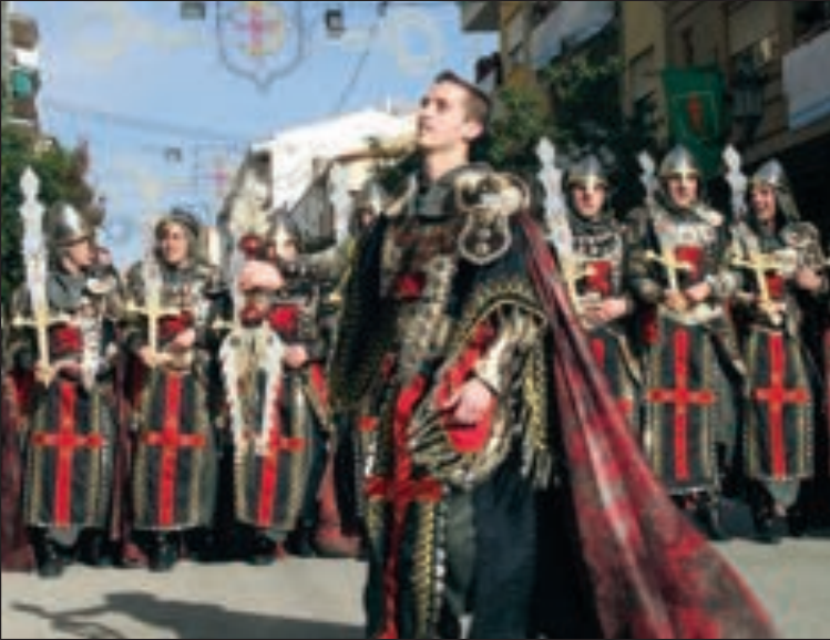
Desfile del bando Cristiano durante la Entrada de Fiestas