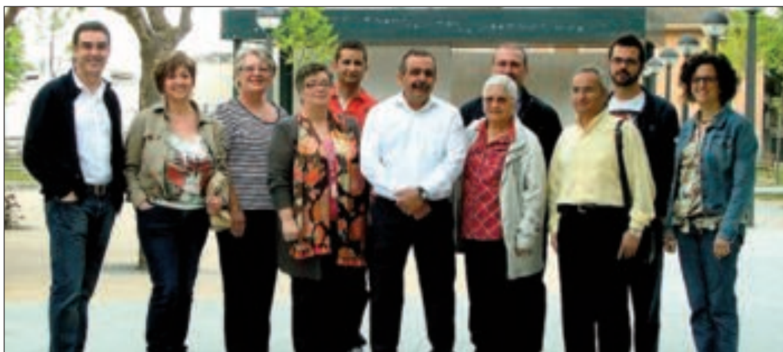
Componentes de la candidatura del Partido Socialista de Tibi

Las Fiestas Mayores de Biar se celebran del 9 al 13 de mayo, con actos tan tradicionales y singulares como el Ball de les Espies .