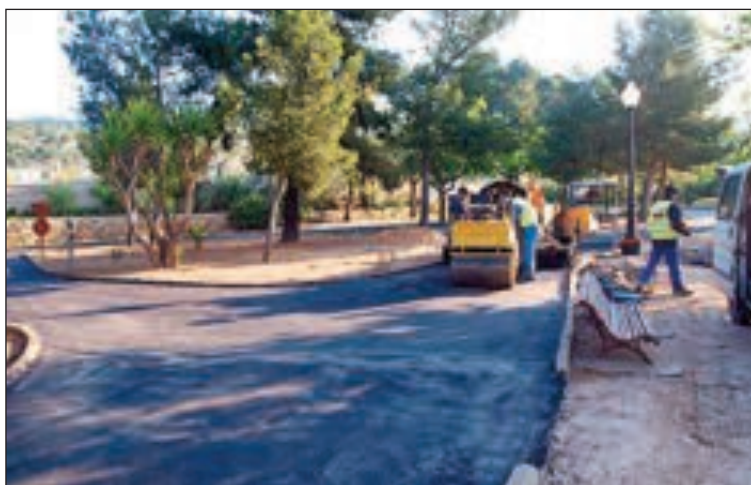
En el parque Derramador se está renovando el asfalto del circuito infantil

Por último, en el parque Pocoyó se está pavimentando con hormigón impreso la zona de arena, dejando sólo un pequeño arenero.