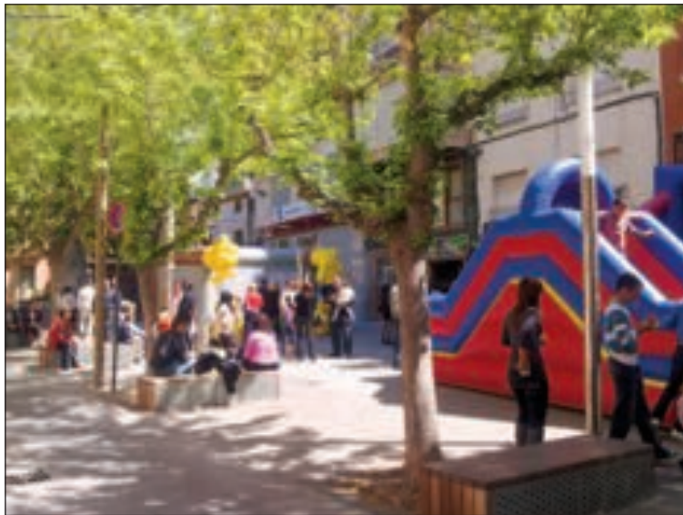
Hasta junio se instalarán juegos hinchables los fines de semana

La adecuación de caminos rurales continuará en Daroca y en la Devesa-Boquera. El proyecto de esta última actuación ya está elaborado por la consellería de Agricultura y supondrá una inversión de más de 200.000 euros.