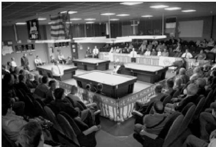
Las instalaciones del Club de Billar Caseta Nova registraron un lleno absoluto para seguir las partidas de este torneo de altísimo nivel