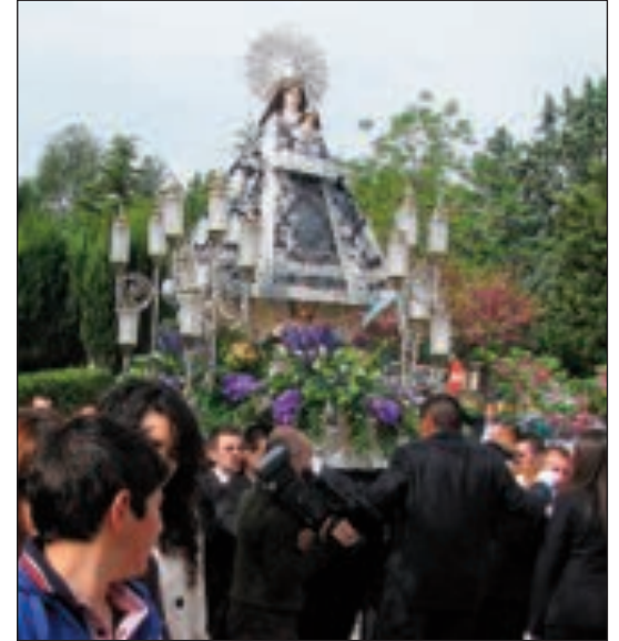
La Virgen de la Soledad durante el traslado de la Ermita al Convento