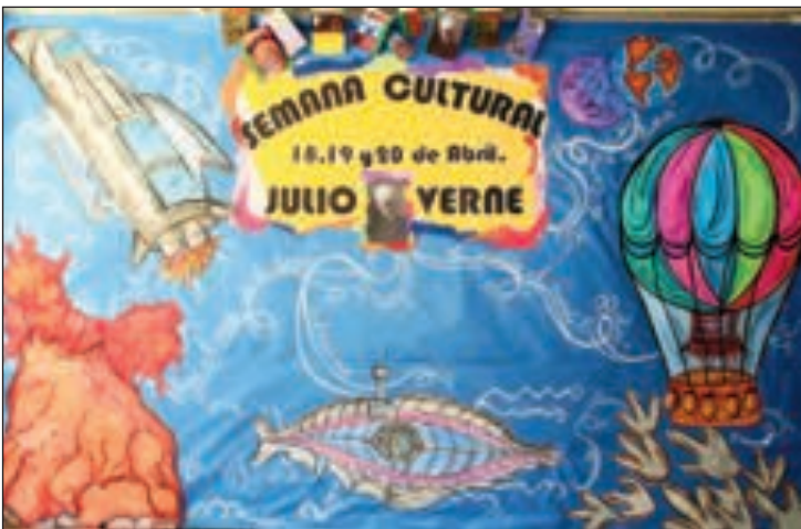
Uno de los carteles elaborados para la Semana Cultural