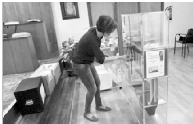
La concejal de Servicios Públicos en la apertura de plicas

El 27 de abril se procedió a la apertura de los sobres con las ofertas técnicas, que están siendo valoradas ahora por la oficina técnica municipal. En el plazo de diez días se conocerá el informe, para concluir con las ofertas económicas.