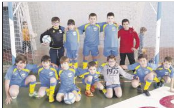
Arriba, el equipo Alevín del Salesianos, en Tibi; abajo, los benjamines