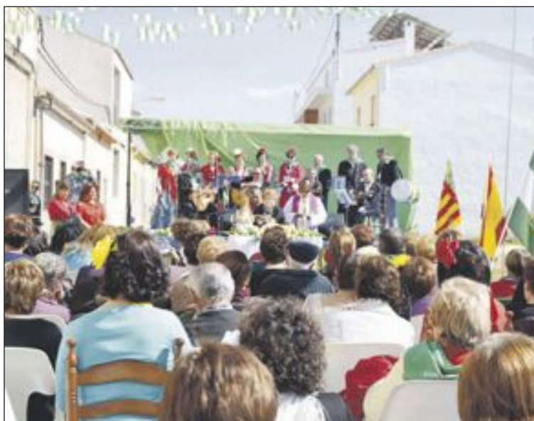
El domingo a mediodía se celebró una misa rociera al aire libre

El fin de semana del 28 de febrero y 1 de marzo