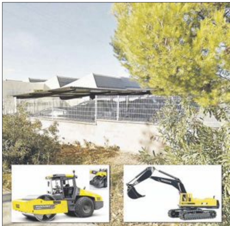
Joal está dedicada a la fabricación de juguetes metálicos en miniatura

Los socialistas se abstuvieron argumentando que "no era de buen gusto" asignar el nombre de Suárez, que padeció la enfermedad de Alzheimer, al Centro de Día y propusieron que se buscara una calle o una plaza de nueva creación para rendirle el homenaje al primer presidente de la Democracia.