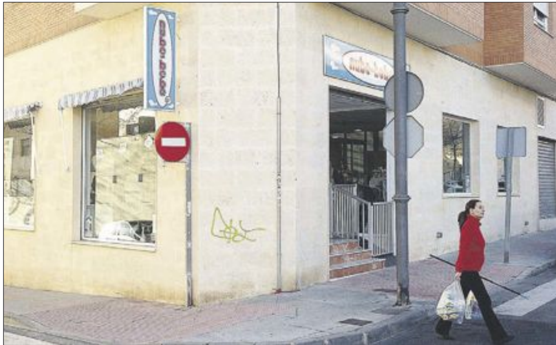
El hurto ocurrió a plena luz del día a las 11 de la mañana

Al parecer, fue en ese instante cuando la mujer mayor se