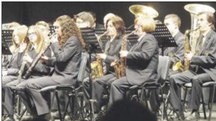
Un momento de la actuación del Centro Instructivo Musical de Onil (CIMO)