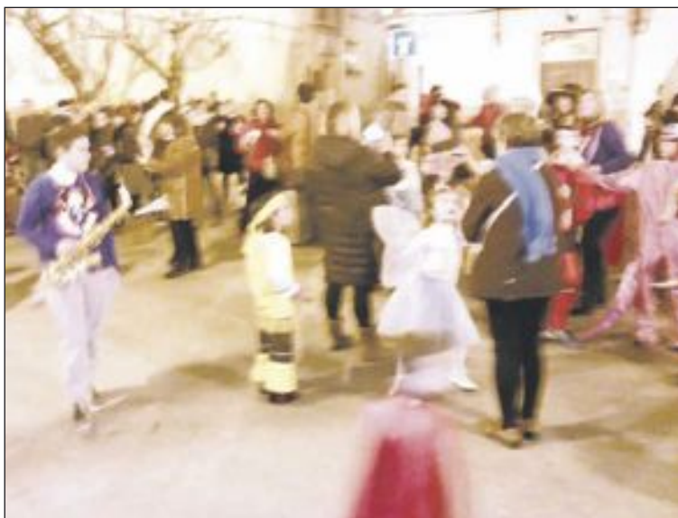
La fiesta de Carnaval estuvo muy animada y contó con mucha participación