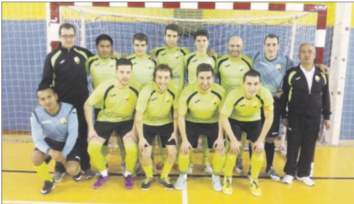
Equipo Futsal Ibi en categoría Sénior Masculino