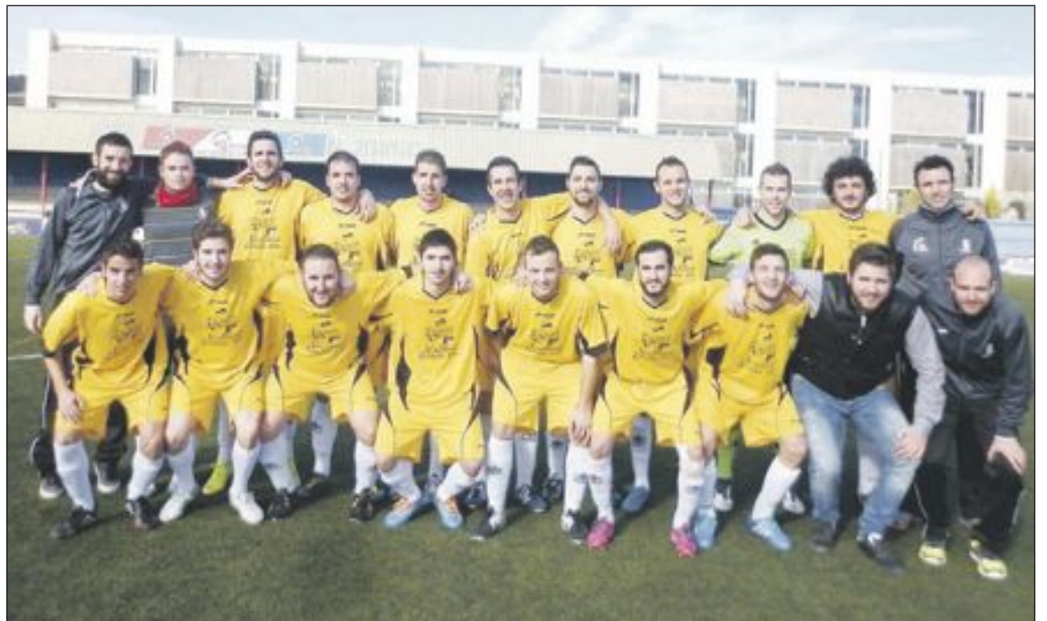
Plantilla del equipo Sénior de la Peña Madridista de Ibi