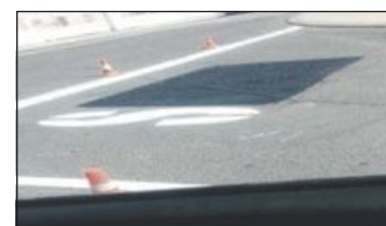
El error fue tapado a las pocas horas

En pocas horas el error fue subsanado y la señal quedó tapada y repintada con la palabra correcta: stop.