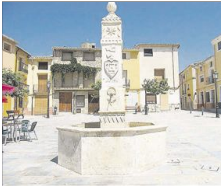
Uno de los rincones que se visita es la plaza España

El programa turístico de rutas guiadas y gratuitas por el municipio de Biar continúa este mes de marzo con salidas los domingos días 8, 15 y 22. Durante la ruta, los asistentes recorren el casco antiguo y conocen sus rincones y sus leyendas, de la mano de la guía turística. También se visitan las ermitas, el pozo de nieve y se organiza una ruta nocturna al Castillo, previamente concertada. La ruta parte desde la plaza de la Constitución a las 11 horas y el recorrido dura, aproximadamente, dos horas. Los visitantes pueden, además, disfrutar de la oferta gastronómica del municipio