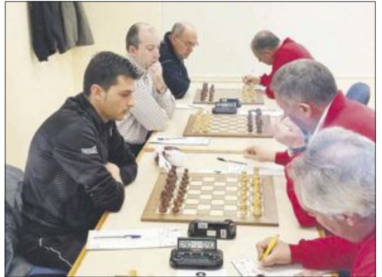
El equipo de 1ª Autonómica Sur disputó sus partidas en Muro