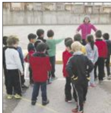
Uno de los contratos es de monitor deportivo

Los jóvenes se incorporaron el pasado mes de diciembre y la valoración desde el seno municipal ha sido “muy positiva”, ya que a fecha de hoy están perfectamente adaptados a las distintas áreas y prestando los servicios previstos con éxito.