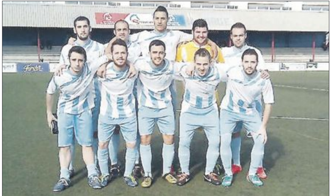
Once inicial del Ibi Racing en el derbi local disputado la jornada pasada contra la Peña Madridista de Ibi