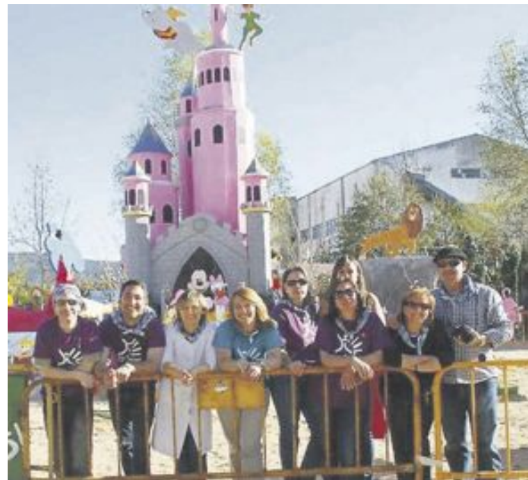
Equipo de profesores del centro con la falla del pasado año

Llegir, saber llegir, poder entendre, mitjançant les paraules, el món que ens envolta.