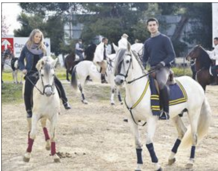
La concentración de caballos ha llegado ya a su undécima edición