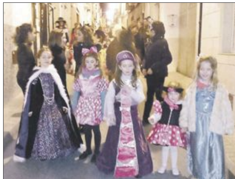
Los niños fueron los que más disfrutaron de la fiesta