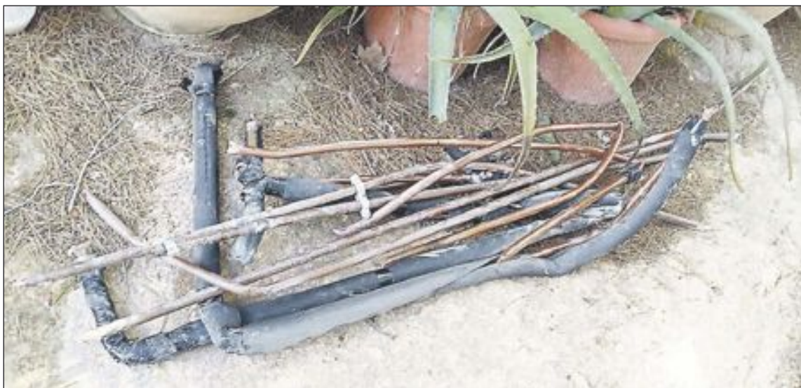
En una de las parcelas se encontró las cañerías serradas, seguramente preparadas para llevárselas después

Los robos se produjeron entre semana y en todos se siguió el mismo modus operandi : sustracción de todas las cañerías y grifos de cobre situados en el exterior de las viviendas, en las barbacosas y en el jardín, además de la desaparición de las herramien-