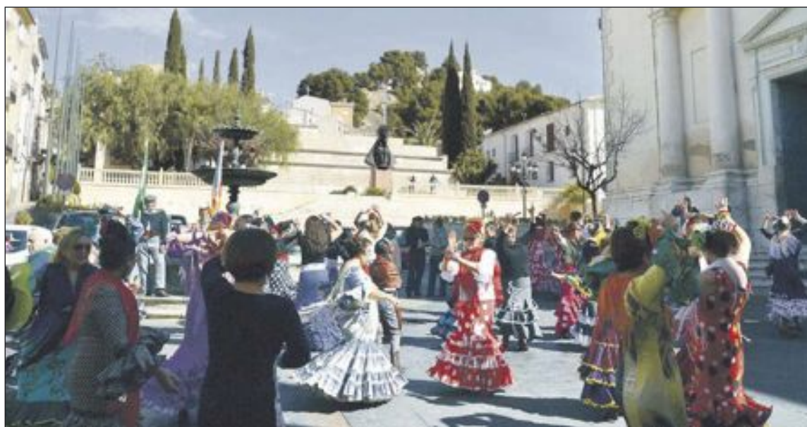
Durante el pasacalles, se realizaron exhibiciones de baile en la plaza de la Iglesia y frente al Ayuntamiento

El domingo tuvo lugar la undécima edición de la concentración de caballos y un pasacalles donde los participantes realizaron varias exhibiciones de baile. A mediodía, la misa rociera y por la tarde, más bailes.