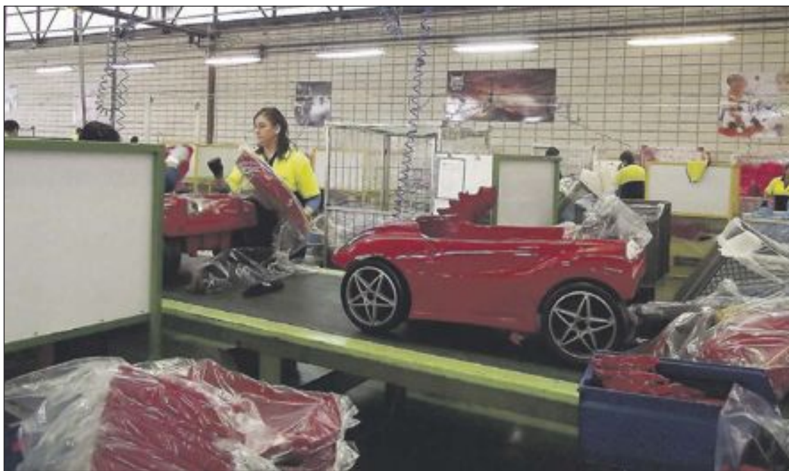
Luchar contra la estacionalidad en las ventas es uno de los principales objetivos de los jugueteros

En 2014 la estacionalidad durante el mes de diciembre aumentó de forma considerable concentrándose en este periodo el 53'7% de las ventas totales anuales, según destaca la patronal juguetera. Además, durante las dos primeras semanas de 2015 se realizaron el 14'9% de las ventas nacionales.