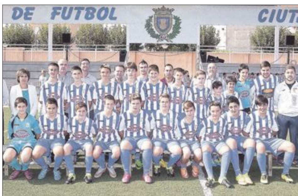
CF Castalla Infantil