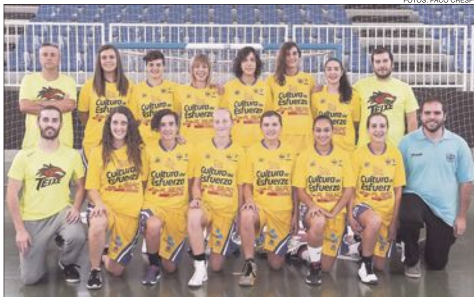
CB Valle del Juguete (Sénior Femenino: CB Teixereta + CD Onil)