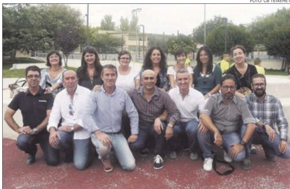
La nueva Directiva del CB Teixereta, en el hall del Polideportivo Derramador