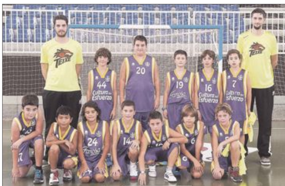
CB Teixereta Alevín Masculino