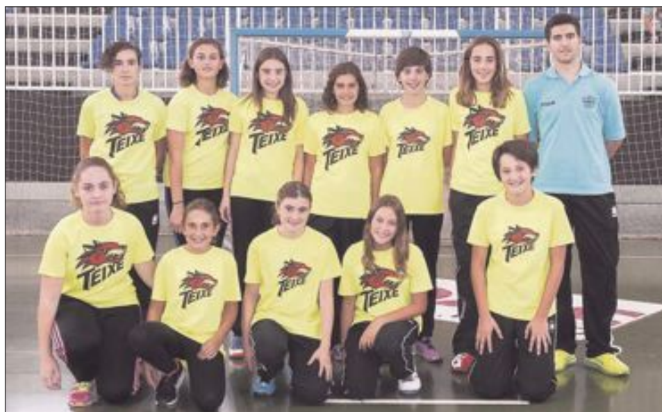
CB Teixereta Infantil Femenino 2003