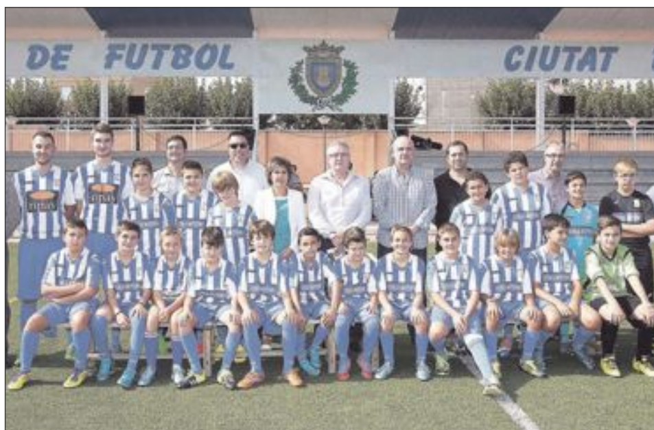
CF Castalla Alevín