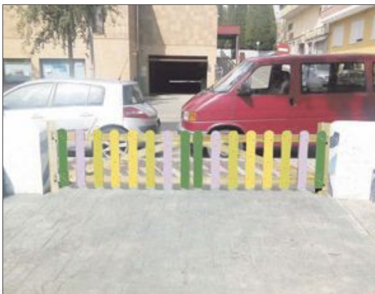
Una solución es colocar una barandilla en la salida de la calle Dr. Waksman