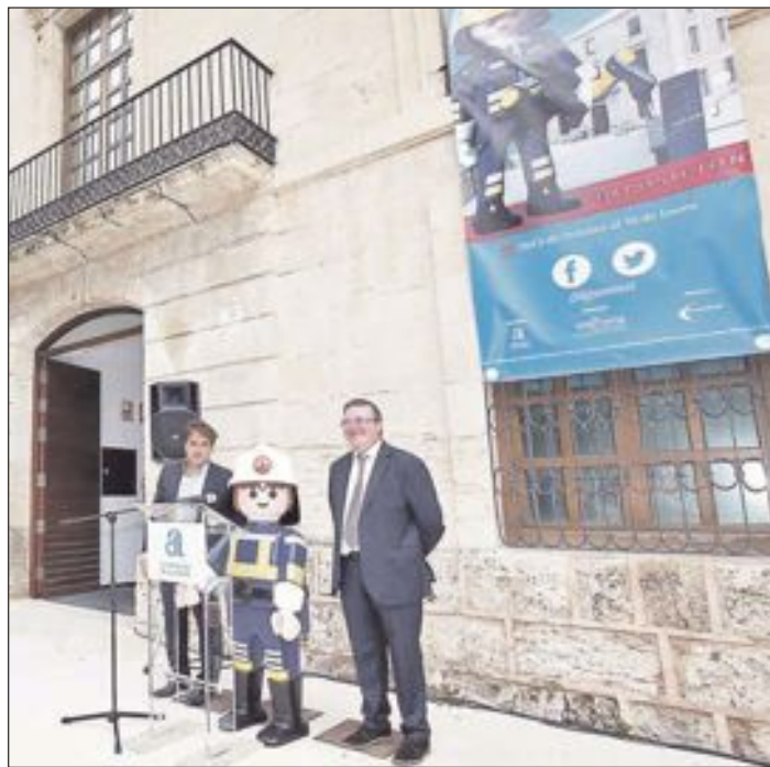
La exposición de los clicks de Playmobil fue inaugurada el 5 de octubre

Esta exposición puede visitarse sin coste adicional al precio de entrada al museo.