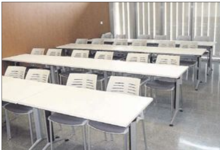
Un aula de la Escuela de Adultos de Castalla