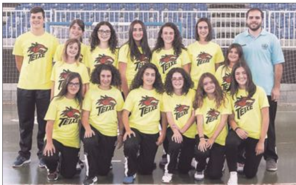
CB Teixereta Infantil Femenino 2002