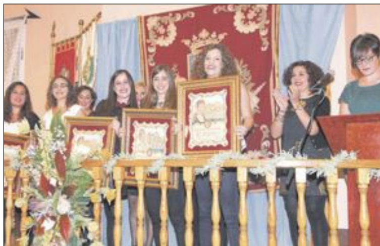
La Reina y sus damas de honor recibieron sendos detalles conmemorativos

Durante el acto se entregaron sendos detalles conmemorativos a la Reina y damas, así como insignias de la Agrupación de Comparsas a diversas personalidades. También se entregaron los premios del concurso de escapa-