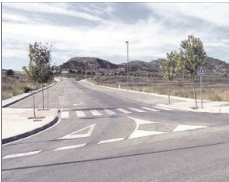
El polígono Bastà, de Castalla, lleva años construido y sin luz

El director de IBIAE incide en una percepción contrastada: "Los empresarios crecerán en otro lugar y perderemos la riqueza que se generará en la Foia. Se marcharán las inversiones y con ello los puestos de trabajo que se crearían con las nuevas industrias o la ampliación de las existentes". La demora hasta 2018 frena el crecimiento de las industrias de la Foia, por este