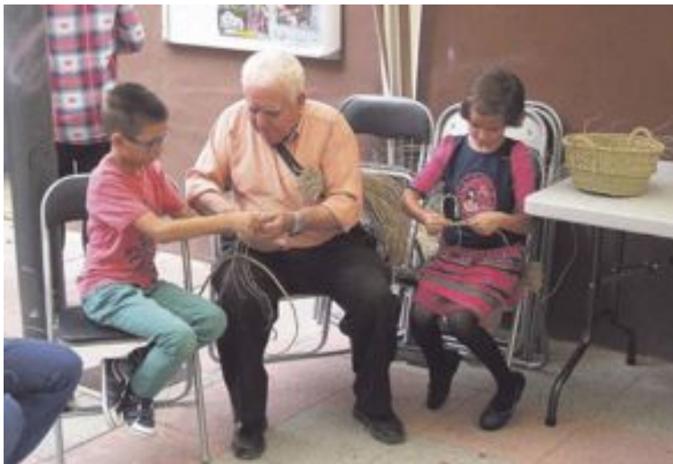
Expertos en el manejo del esparto enseñaron a los niños cómo trabajarlo

El Museo trata de difundir estas tradiciones que forman parte de nuestro patrimonio cultural para su mantenimiento, ya que se trata de una actividad que actualmente se está perdiendo. La exposición, que ha sido diseñada por la Asociación Ibero-macaronésica de Jardines Botánicos, estará abierta al público hasta el 25 de octubre.