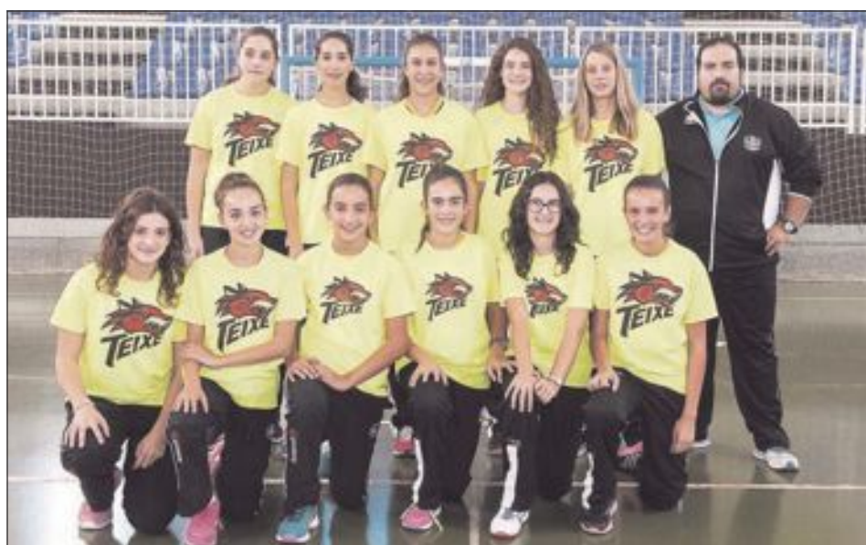
CB Teixereta Infantil Femenino 'A'