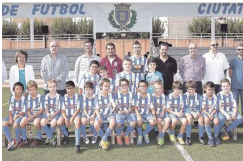
CF Castalla Benjamín