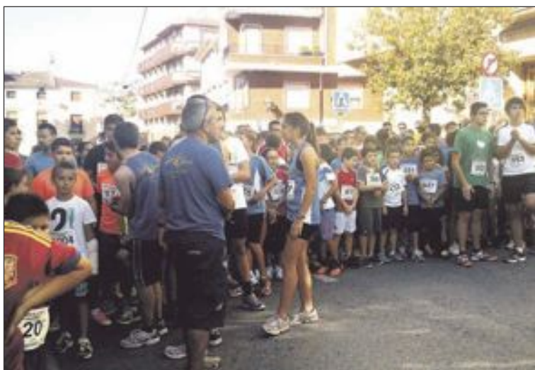
La Volta a Peu cumplir  31 a os el viernes 9 de octubre