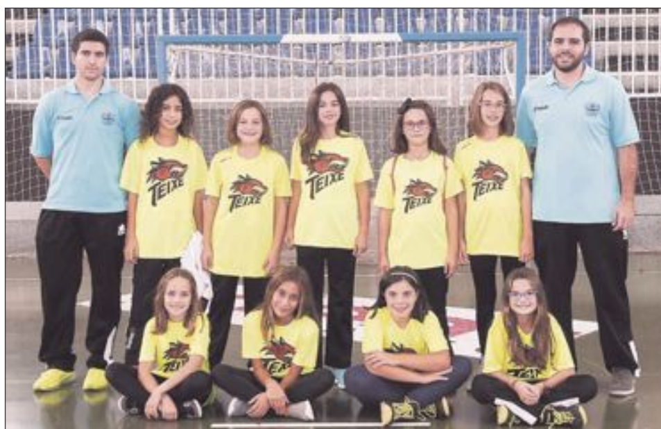
CB Teixereta Alevín Femenino