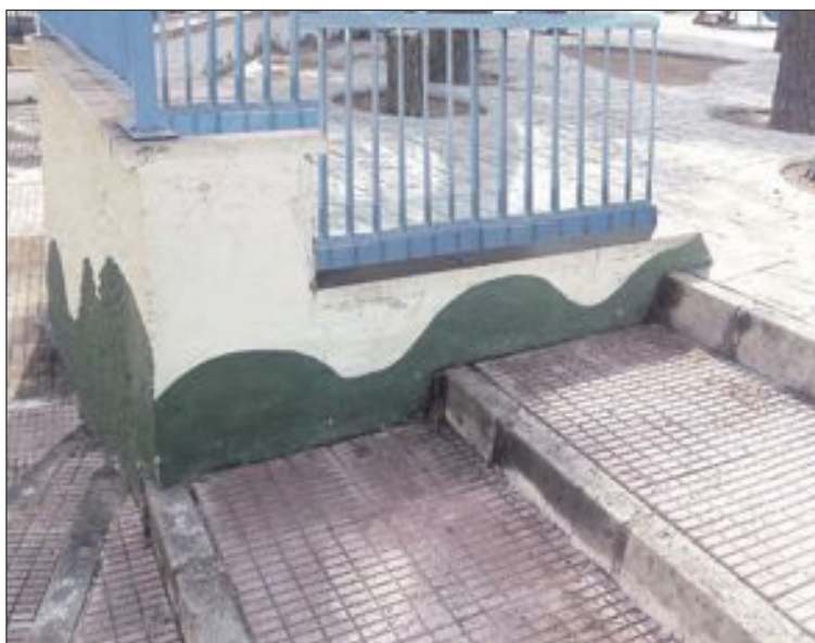
La otra barandilla se instalaría en el desnivel de las escaleras