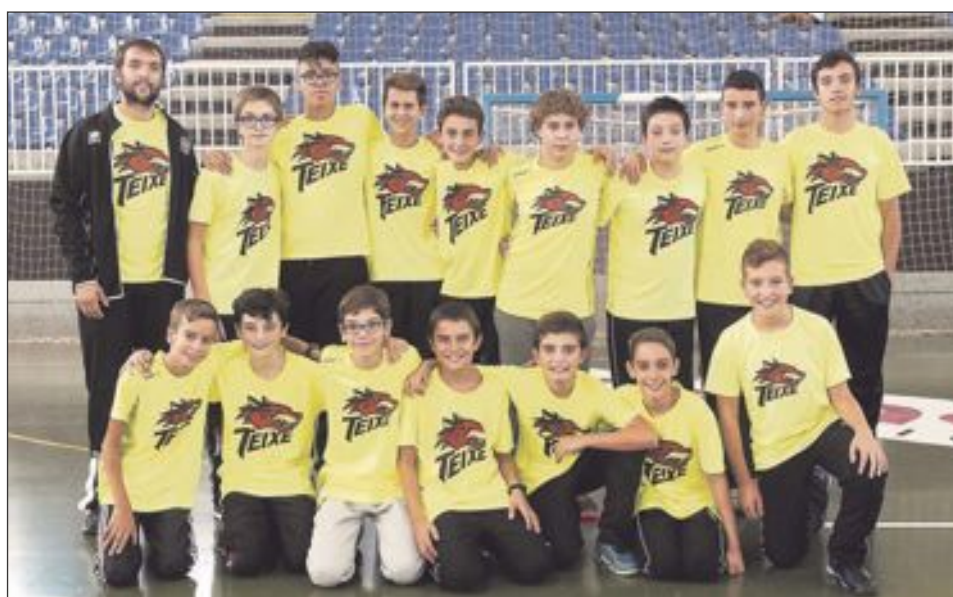
CB Teixereta Infantil Masculino