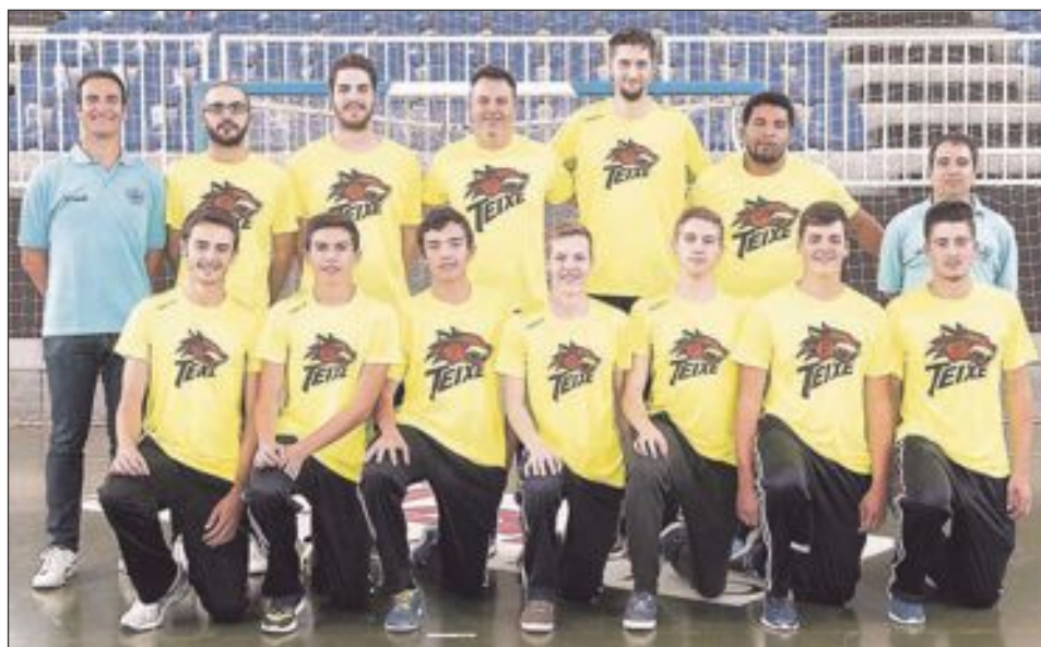
CB Teixereta Sénior Masculino