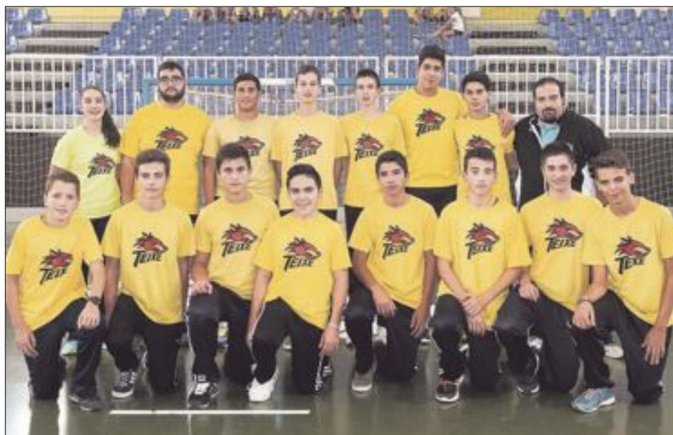
CB Teixereta Cadete Masculino