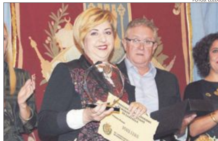
Dona i Fils ganó el primer premio del concurso de escapatismo festero

Músiques fue para la Societat Protectora Musical d'Antella, banda oficial de los Maseros.