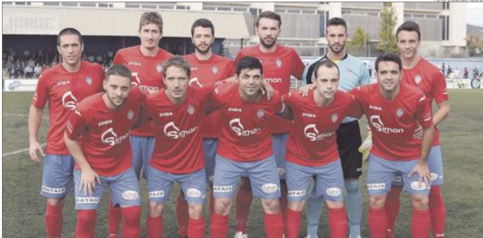
Once inicial del Rayo Ibense contra el Jove Espanyol de San Vicente

llo morían en la orilla. Y eso que llevaba el peso del partido para tratar de contrarrestar el temprano gol.