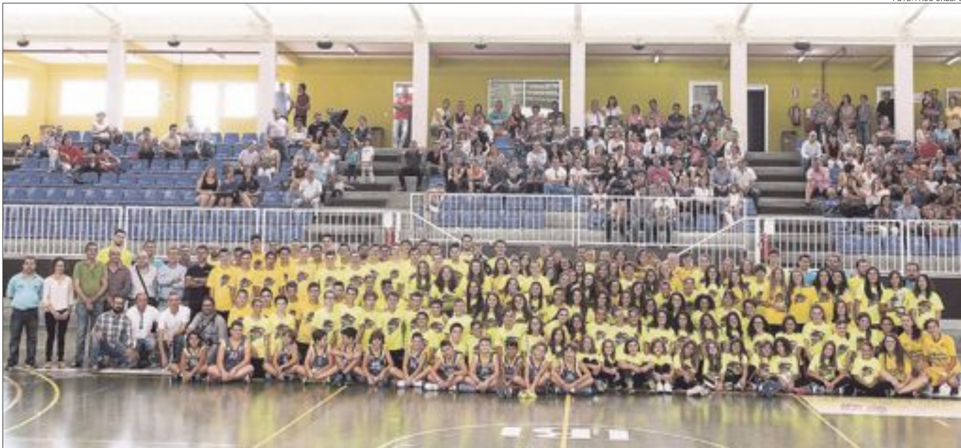
Todos los jugadores y técnicos del Club de Baloncesto Teixereta, junto a los miembros de la nueva Junta Directiva, tras la presentación de los equipos para la temporada 2015/2016