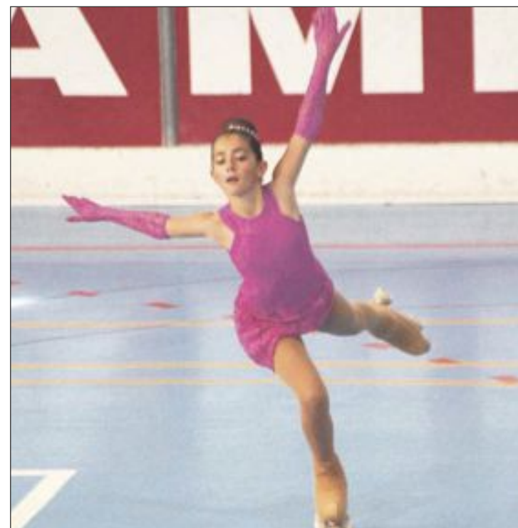
La patinadora, en el campeonato provincial de Alicante, celebrado en abril