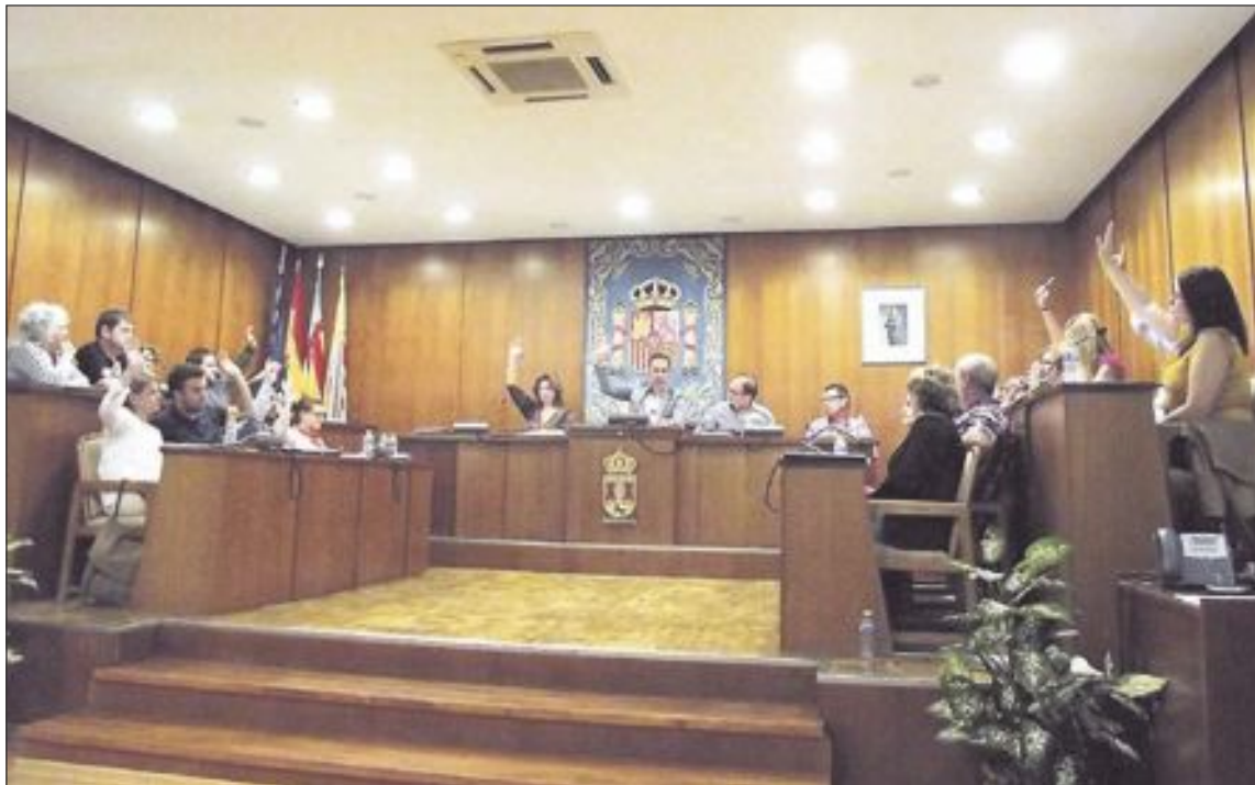
El acuerdo de las nuevas retribuciones se votó en el pleno del lunes 5 de octubre