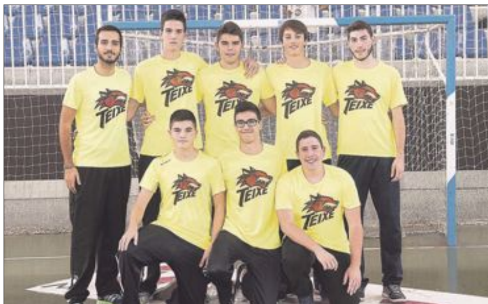
CB Teixereta Júnior Masculino