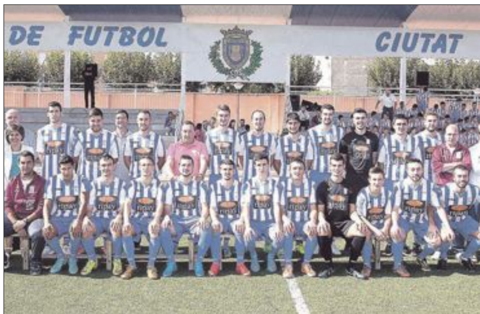
CF Castalla Sénior