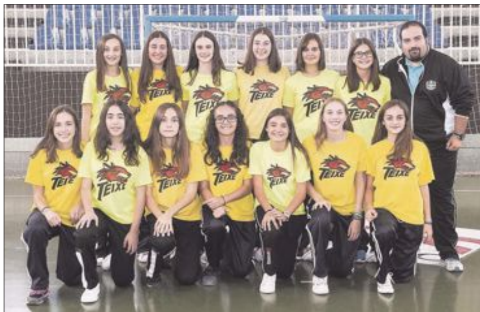
CB Teixereta Cadete Femenino 'A'