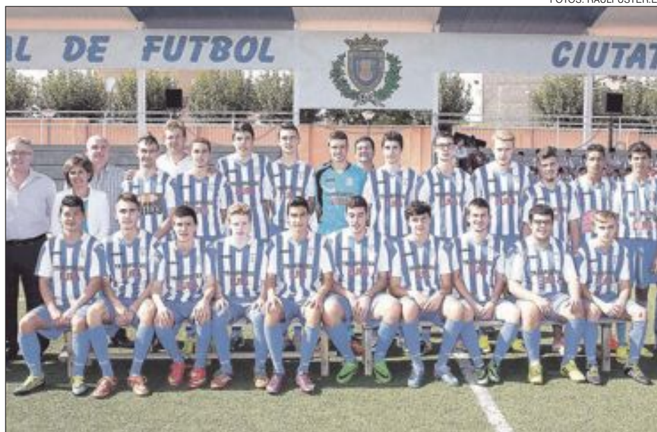
CF Castalla Juvenil