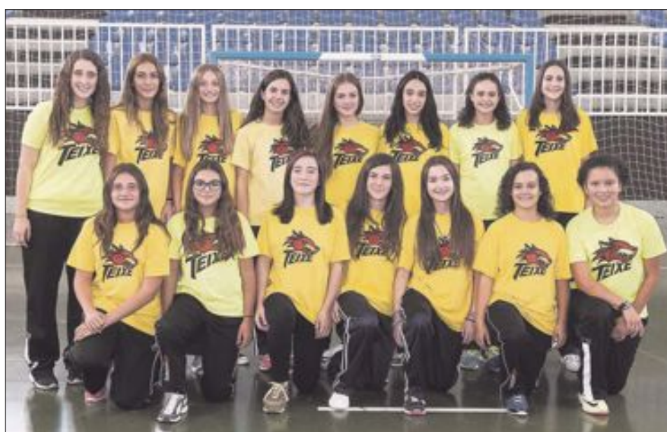
CB Teixereta Cadete Femenino 'B'