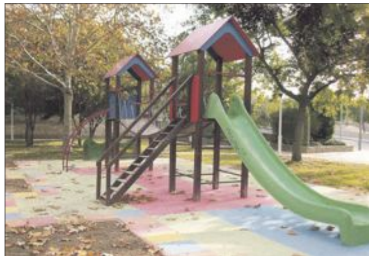
Onil es uno de los municipios que recibir  juegos infantiles para sus parques

El titular de Protecci n y gesti n del Territorio, Javier Sendra, ha destacado que la Diputaci n "quiere colaborar con los municipios de la provincia, especialmente con los m s peque os, para que cuenten con el mobiliario adecuado en sus parques y calles contribuyendo con ello a mejorar la