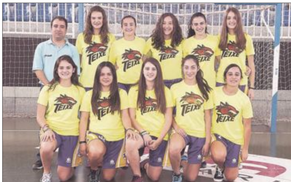
CB Teixereta Júnior Femenino