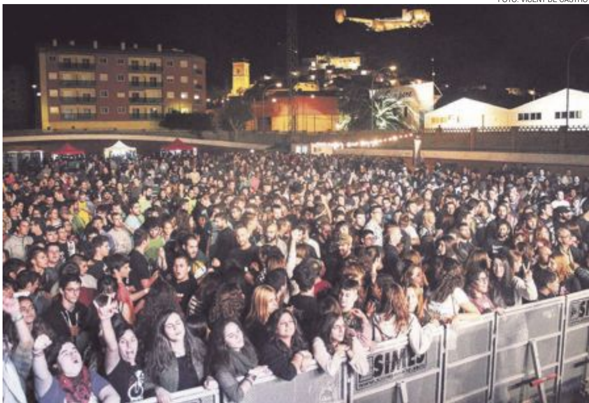
La primera edición del Castalla Rock reunió a más de 2.000 personas en el Velódromo Municipal