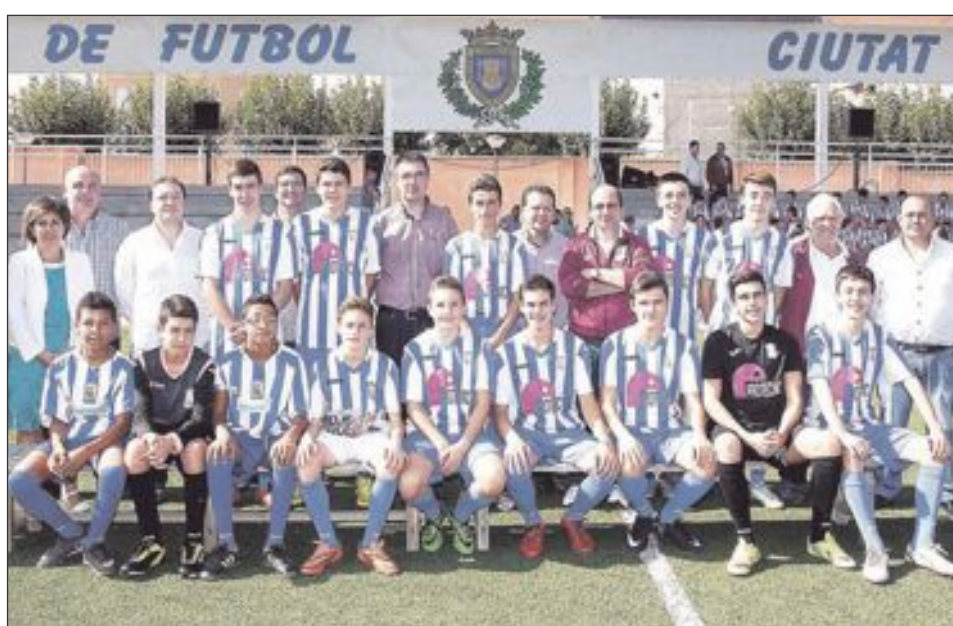
CF Castalla Cadete