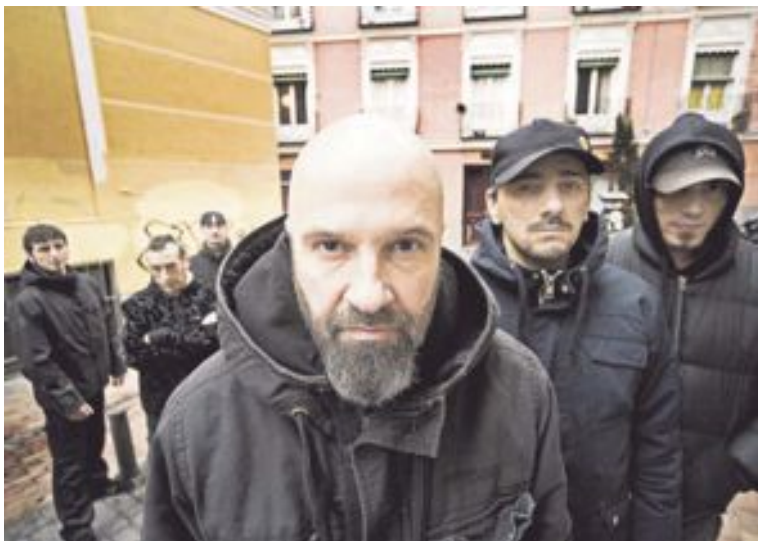
El grupo Def Con Dos encabeza el cartel de este II Castalla Rock Festival

Bostok prepara también su primer LP, que verá la luz próximamente, repleto de su metal alternativo un tanto rabioso, y Pipo está también muy cerca de lan-