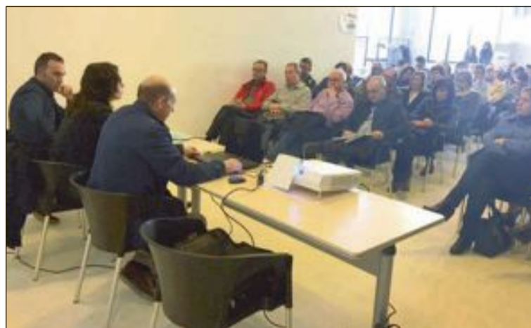
Cerca de 150 personas asistieron a la reunión sobre fiscalidad que organizó el Ayuntamiento el 18 de febrero en la fábrica Rico

El polígono tiene una superficie de 1.086.000 metros cuadrados, del que se urbanizarán en la primera fase 317.000 m 2 .