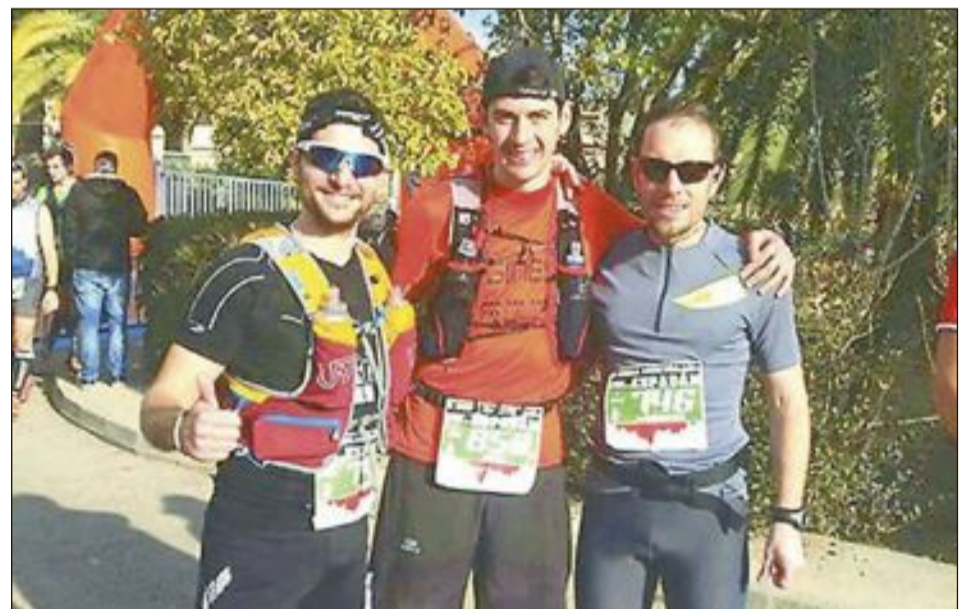
Atletas del equipo Xtrem-Ibi que participaron en el Medio Maratón de Espadán (Segorbe)