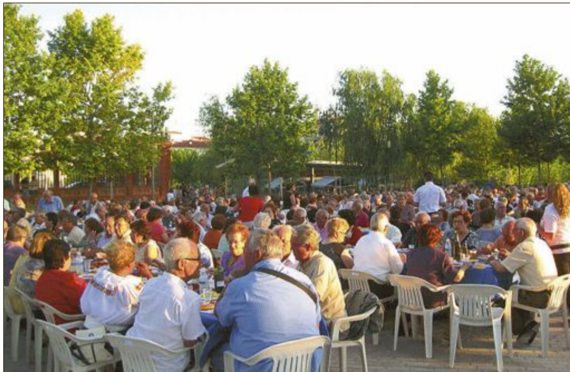
A fecha 31 de diciembre de 2016 en Ibi había un censo de 23.701 habitantes

En cambio, la progresión en Castalla ha sido descendente. La localidad castallense tenía en 2014 un censo de 10.143 habitantes, perdiendo 149 vecinos en 2015 y otros 135 en 2016. Su