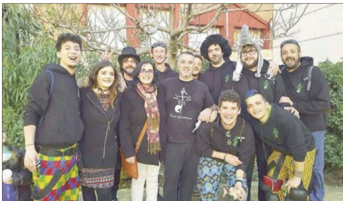
La batucada de Ibi Trencatoms también participó en el desfile de carnaval celebrado por la tarde