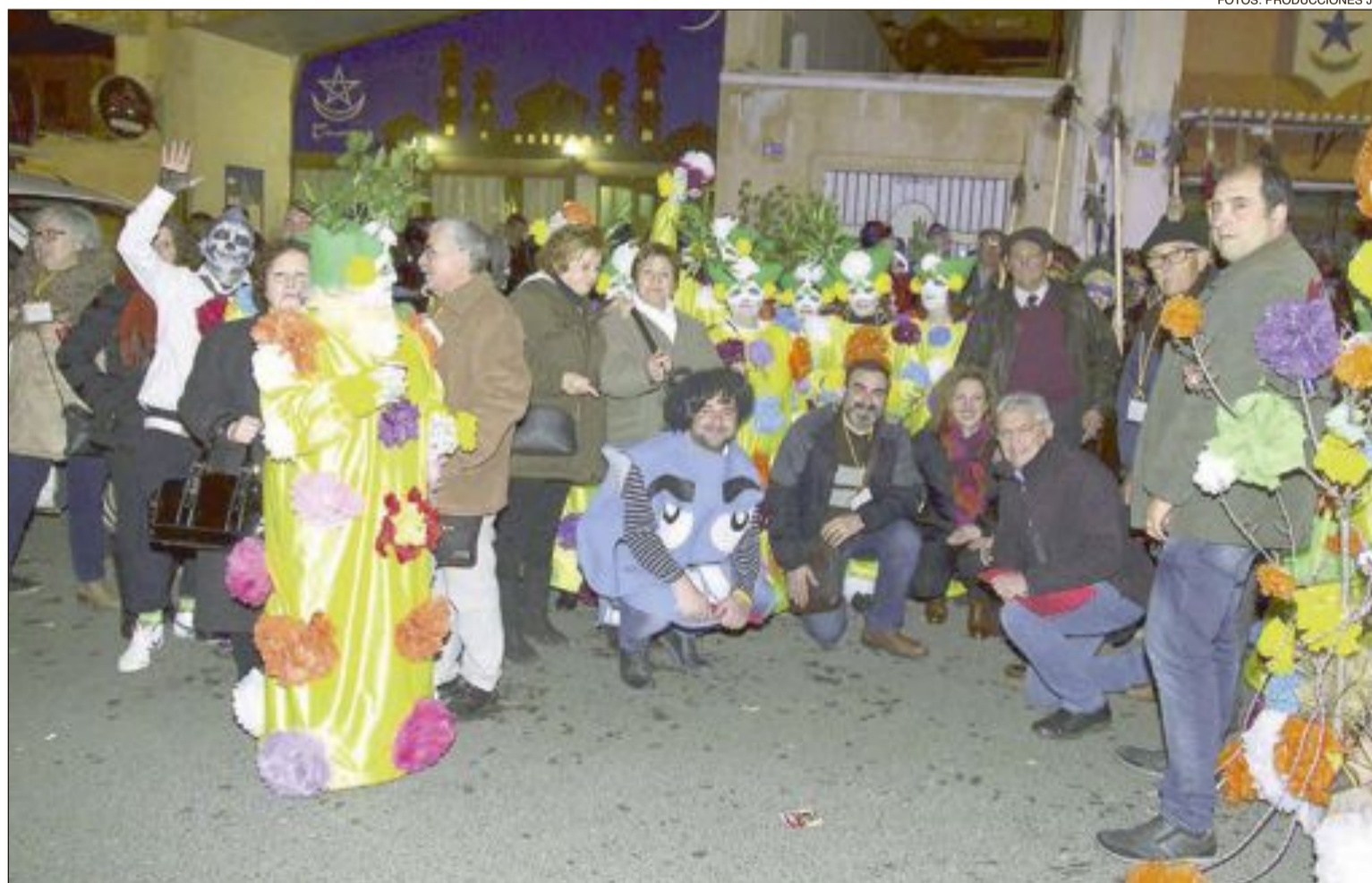
Miembros del jurado del carnaval de Ibi junto al grupo ganador del concurso de disfraces, tras fallar los premios

En ambos casos, cada Ayuntamiento invitó a merendar a los niños, que desfilaron de una forma multitudinaria, para mayor satisfacción de los organizadores. Además, en Onil se entregaron varios premios a los mejores dis-