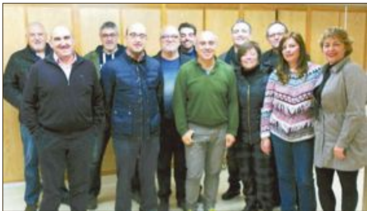
Está formada por militantes de Ibi, Banyeres, Alcoy, Cocentaina, Onil, Muro y Penáguila