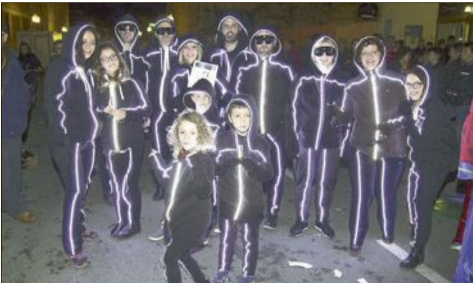
Tercer premio: Los Iluminati