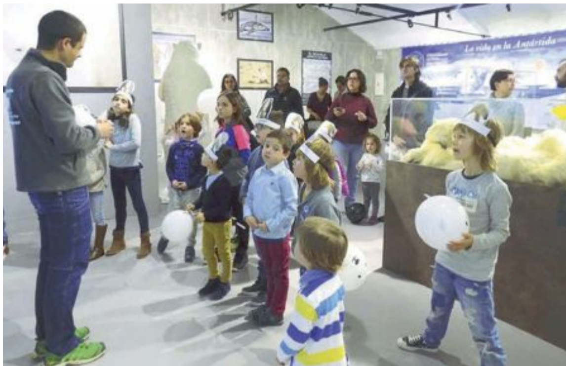
80 personas asistieron a la visita guiada organizada el domingo 26 de febrero en el Museo de la Biodiversidad