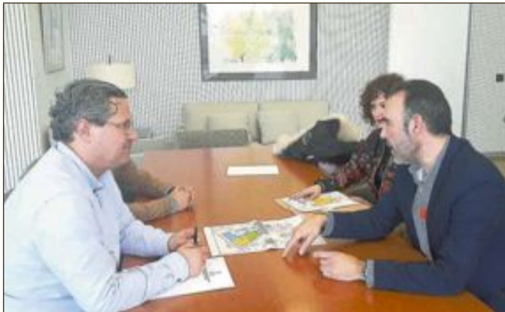
La reunión tuvo lugar en Valencia el 16 de febrero