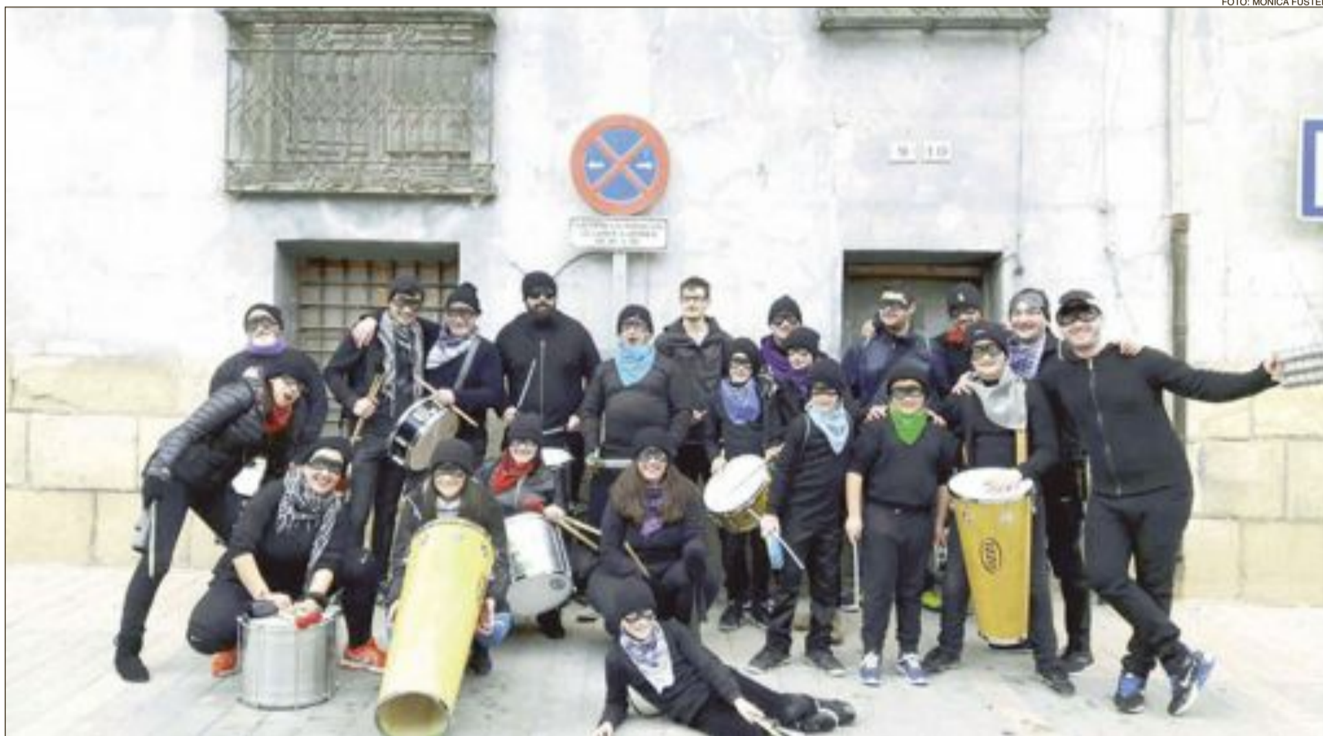
El grupo de batucada del Espai Jove amenizó con su ritmo el carnaval de Castalla