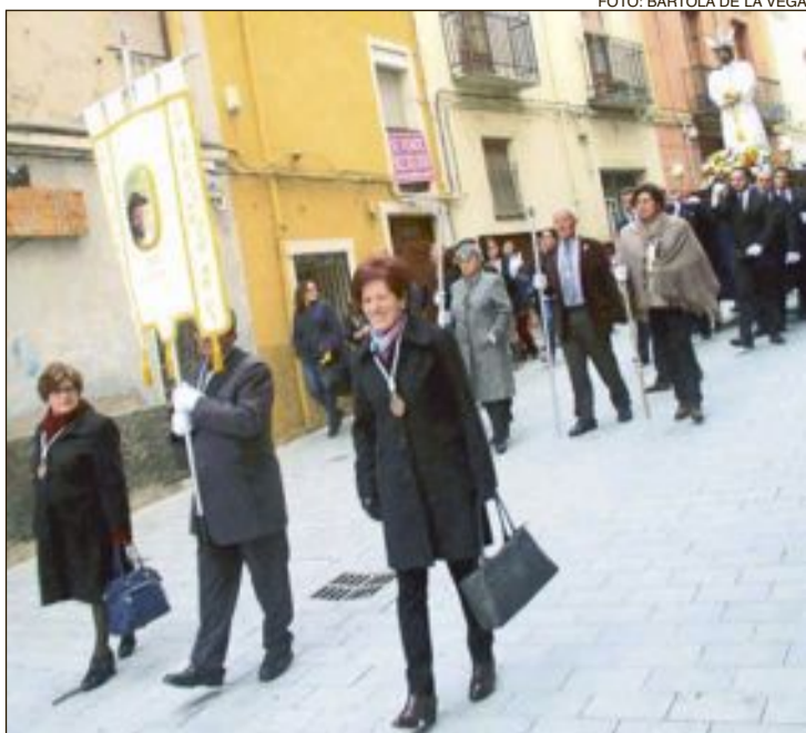
Traslado de la imagen desde la Transfiguración del Señor hasta la parroquia de Santiago Apóstol el domingo 26 de febrero

Con el traslado de la imagen de Jesús Cautivo