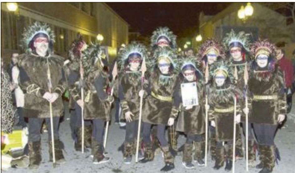
Segundo premio: Tribu Madremiacomomolamos