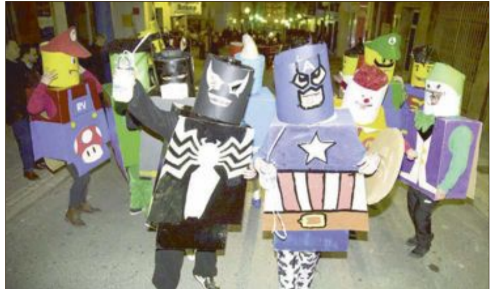
Quinto premio: Lego Ravalet 44