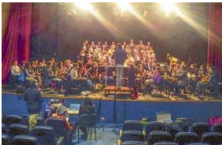
El CIMO i la Coral Cristòbal Pastor han gravat un disc sobre el folklore colivenc

Per a que este treball pugui vore la llum cal recaptar 3.000 euros en un termini de 40 dies. Els qui vulguen col·laborar poden fer-ho des de nou euros, rebent recompenses a canvi. Per a més informació: www.verkami.com .