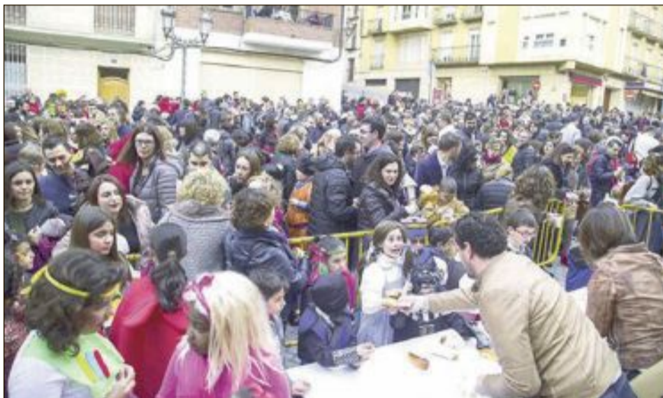
Todos los participantes disfrutaron de una chocolatada por cortesía del Ayuntamiento