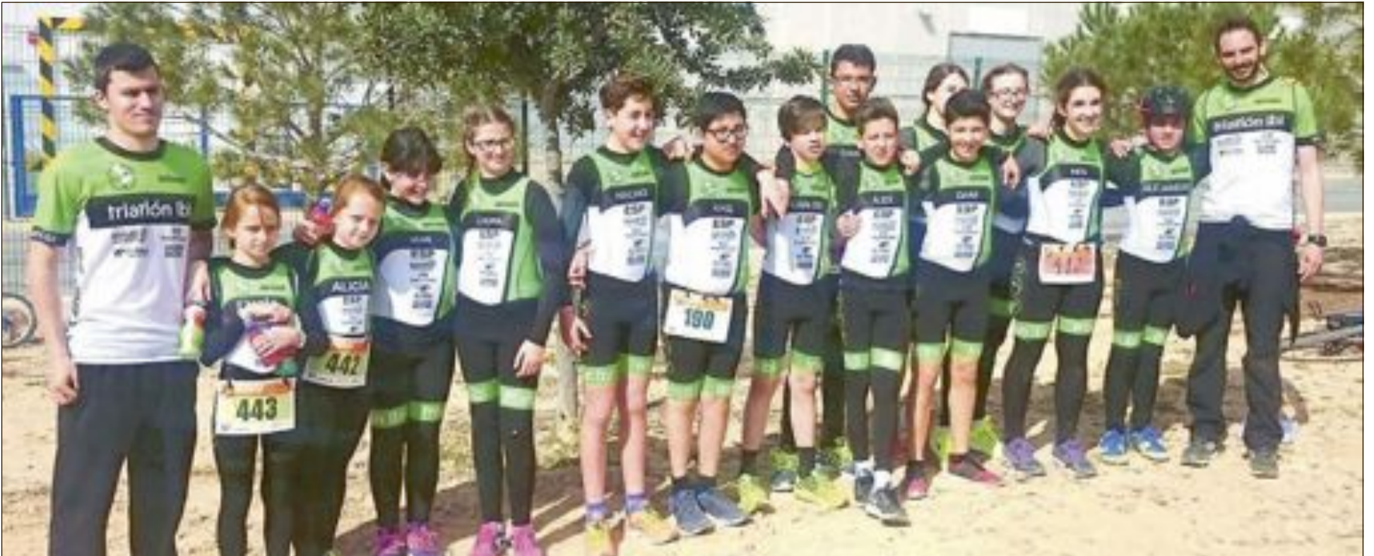
Alumnos y monitores de la Escuela de Triatlón de Ibi, en el II Duatlón Escolar de San Vicente del Raspeig