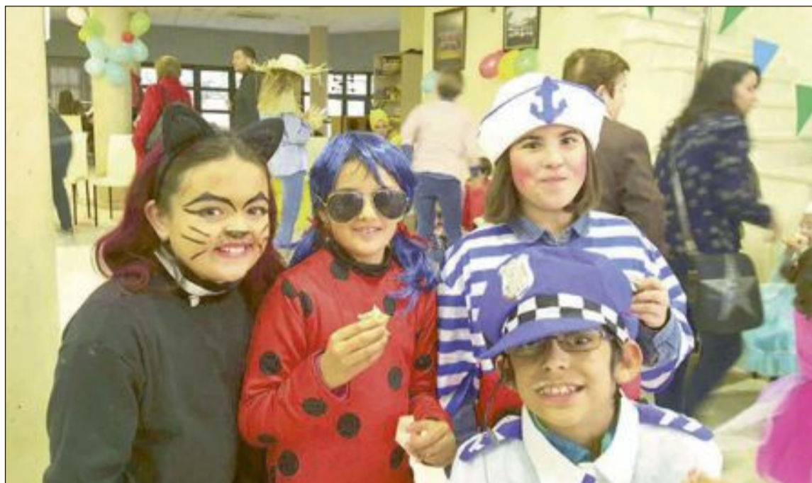
El Ayuntamiento ofreció una merienda a todos los participantes en el Centro Social después del desfile