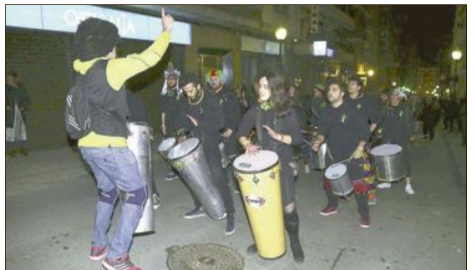
La batucada Trencatombs amenizó los desfiles tanto infantil como adulto