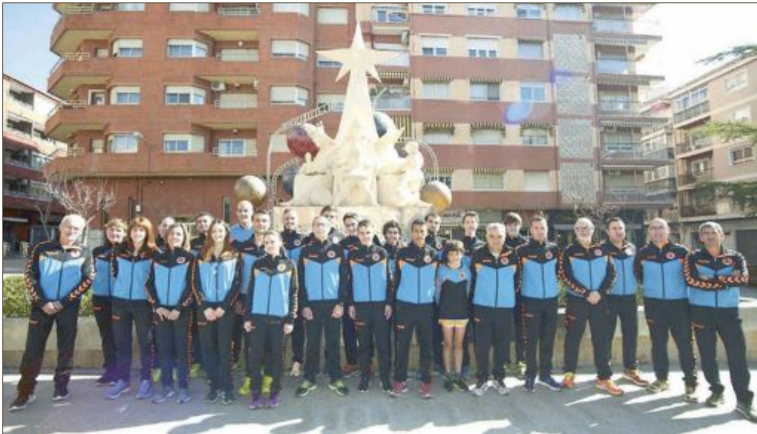
Miembros y directivos del Club de Atletismo Teixereta, en la plaza de los Reyes Magos de Ibi

Envía la información de tu equipo, club o logros deportivos personales a: deportes@escaparatedigital.com