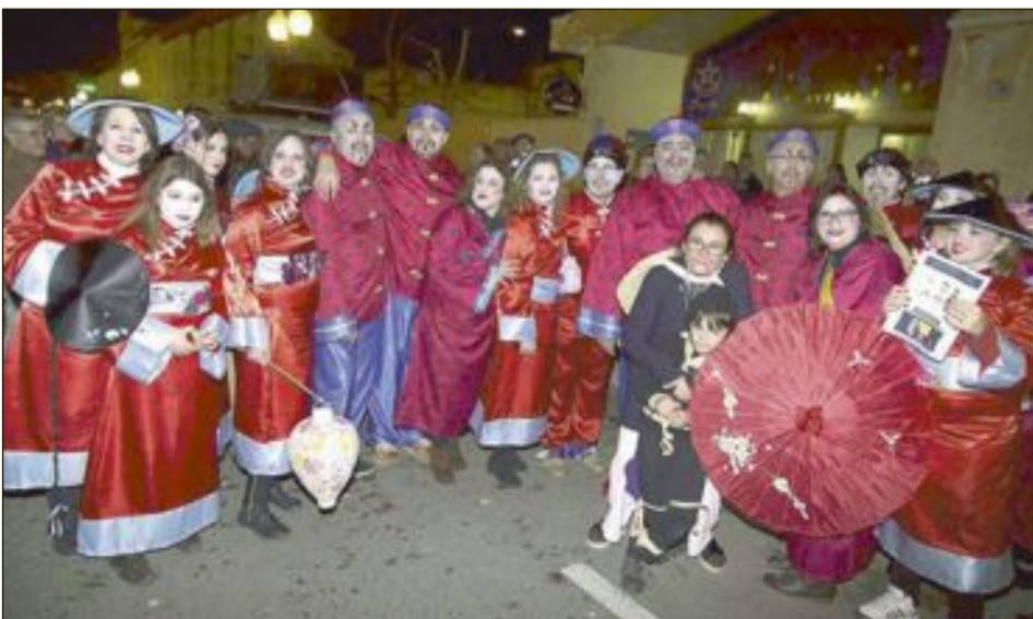
Cuarto premio: Las Pochi hasta en la China