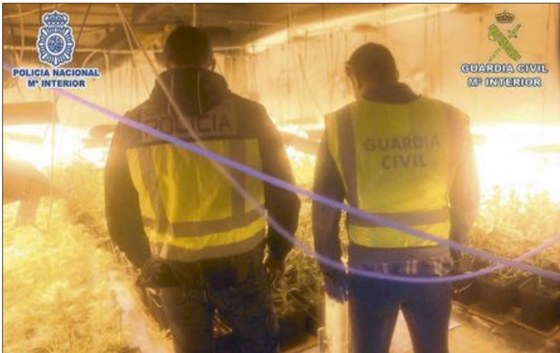
En la operación se incautaron de 450 plantas de marihuana y 16.000 euros en efectivo

La primera actuación se practicó en Crevillente, donde se localizó en una casa rural de la Partida Deula un cultivo indoor de marihuana, en el que se incautaron de más de un millar de plantas, además de maquinaria para el cultivo, envase de la droga, abundante documentación y se procedió a la identificación