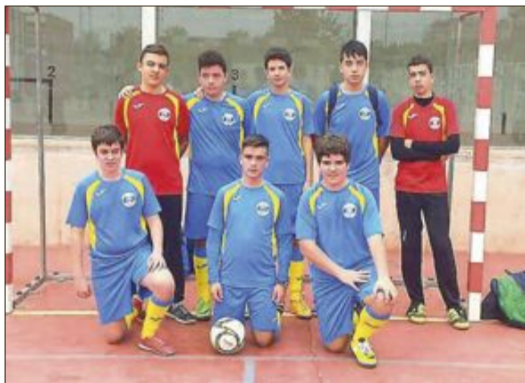
Equipo Cadete del Club Salesianos Ibi en San Vicente del Raspeig

Por un lado, el equipo Benjamín supo remontar un partido que se les había puesto muy cuesta arriba frente a San Juan. El cuadro visitante, tras adelantarse en el marcador, se plantó muy bien atrás para defender el resultado. Los locales, se veían incapaces de perforar la portería rival a pesar de las continuas acometidas. Fue en el tramo final cuando el equipo ibense consiguió el empate y, sin tiempo para reaccionar para el cuadro costero, el 2 a 1. Con este resultado el rival se abrió, cayendo del lado local el definitivo y costoso 3 a 1. Del mismo modo, el equipo Alevín supo remontar