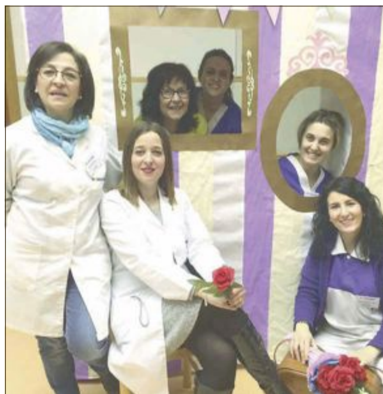
Las trabajadoras del Centro de Día confeccionaron su propio photocall