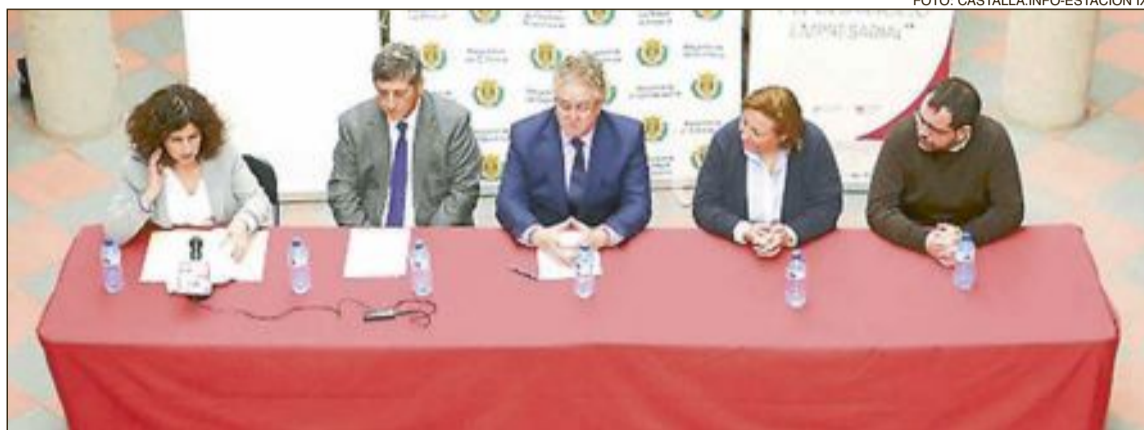
La presentación de 'Castalla Emprende' tuvo lugar recientemente en la Casa de Cultura de esta localidad

-Modelos de negocio y estrategia, donde se formará a los asistentes en metodologías, técnicas y herramientas para analizar