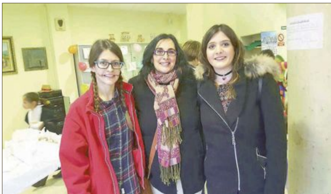
La concejala de Educación con voluntarias de Cruz Roja