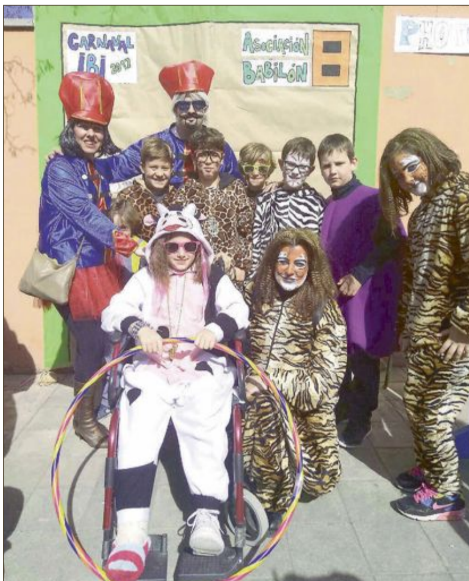
La Asociación Babilón instaló un photocall en el desfile infantil