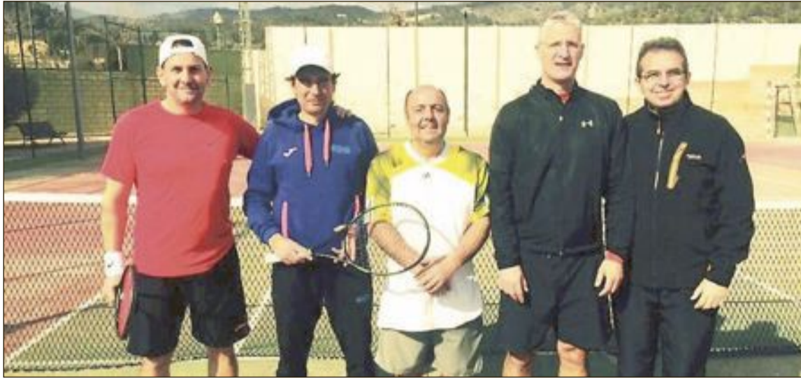
Equipo Veteranos +40 del Club Tennis Teixereta

Como muestran los resultados, fue una eliminatoria muy iguala-