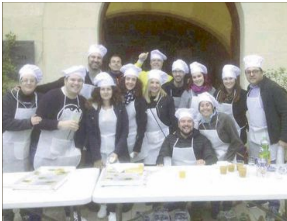
Concejales y voluntarios sirvieron una merienda para todos los niños participantes