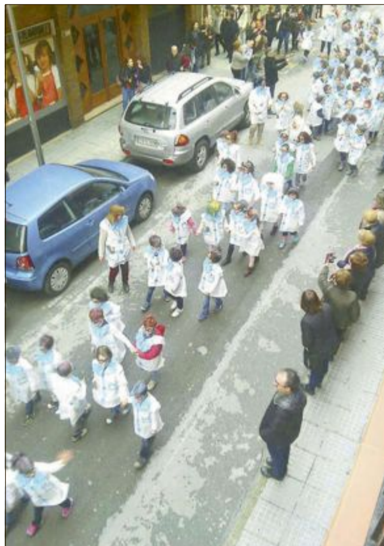
Desfile de los alumnos del colegio disfrazados de científicos locos