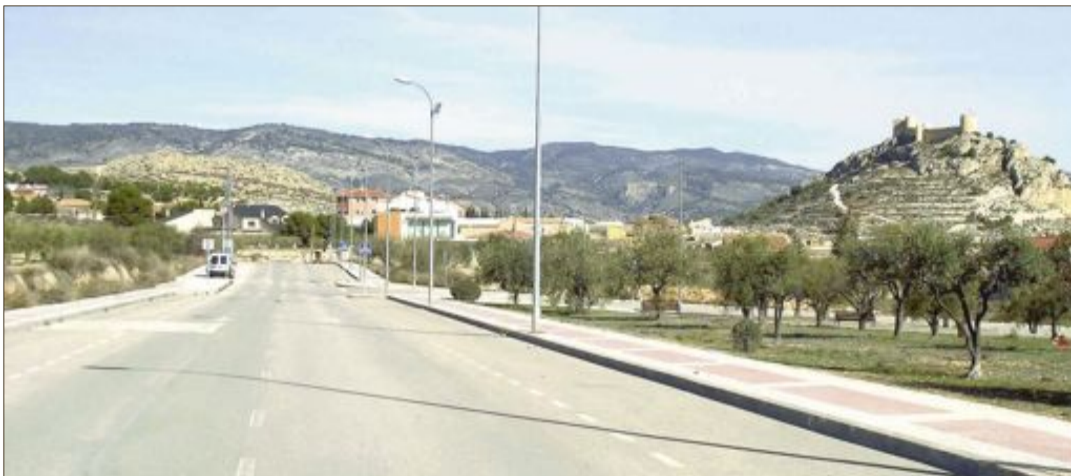
Vista parcial de la urbanización de La Llauria, en la zona alta de Castalla