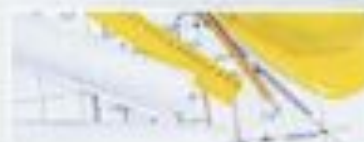
Medición de proyectos