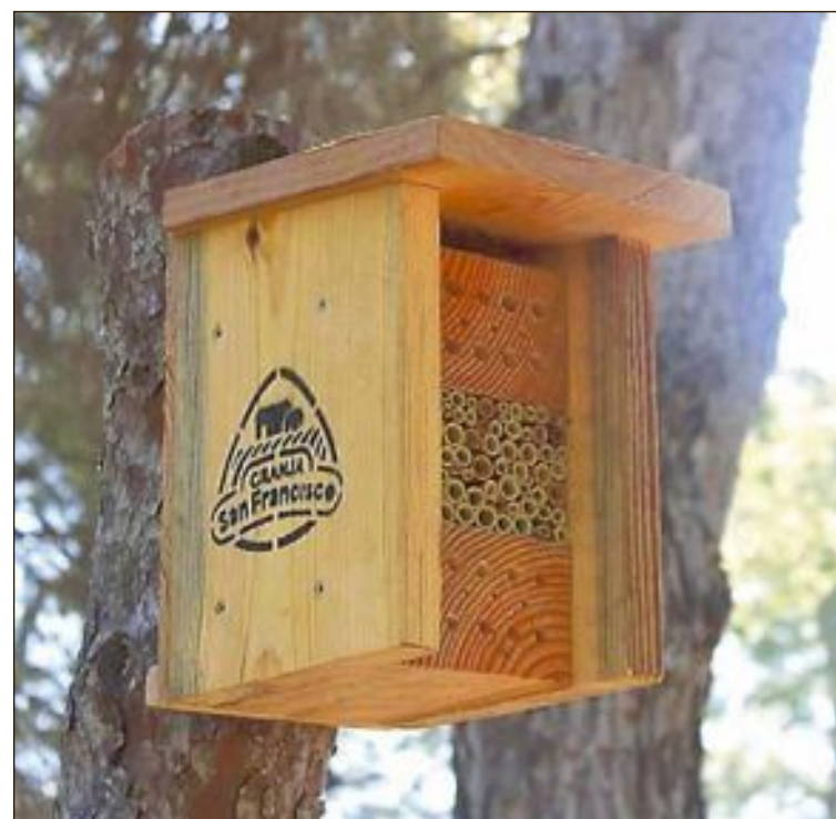
Uno de los 'hoteles' instalados en la Estación Biológica

La marca Granja San Francisco ha instalado el 'hotel de bichos' para la conservación de insectos polinizadores