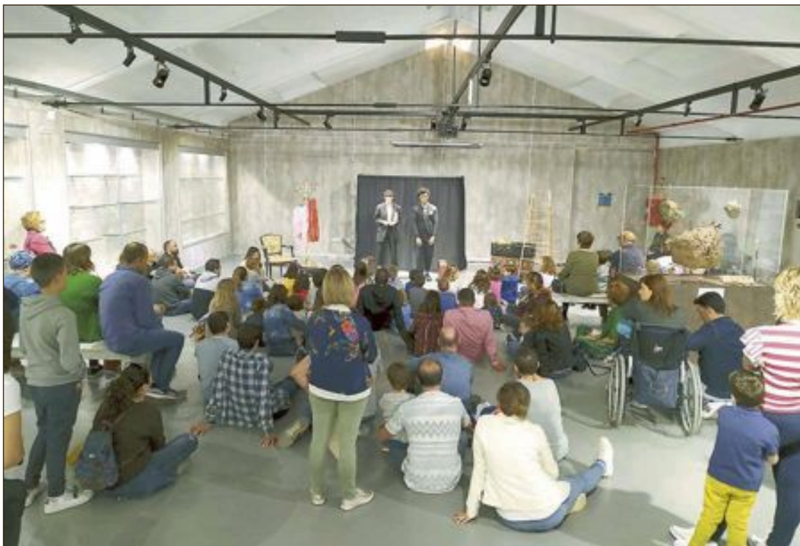
Imagen de archivo de un cuentacuentos en el Museo de la Biodiversidad

Para recoger los premios, los premiados deberán estar presentes en el momento de su proclamación.