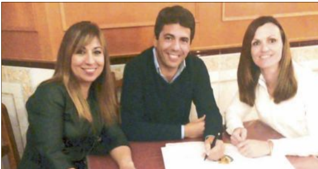
Les dos regidores del Partit Popular amb el president de la Diputació, Carlos Mazón

En este sentit, recorden el compromís de Carlos Mazón de realitzar diverses inversions en el municipi, de les que destaquen la Via Verda "que serà un atractiu per al turisme d'interior" i la creació d'un edifici multiusos, "que donarà cabuda a diferents associacions del nostre municipi". I afegien que "es constata la importància de les inversions de la Diputació per als xicotets municipis de la província i ens enorgullix que la Diputació, governada pel Partit Popular, seguisca compro-