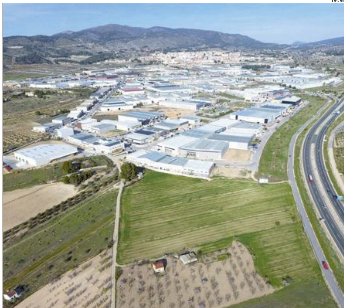
El retraso en la recepción de mercancía procedente de China es ya de dos meses

Desde que comenzaron las infecciones por el coronavirus, la fabricación está prácticamente detenida en China y los princi-