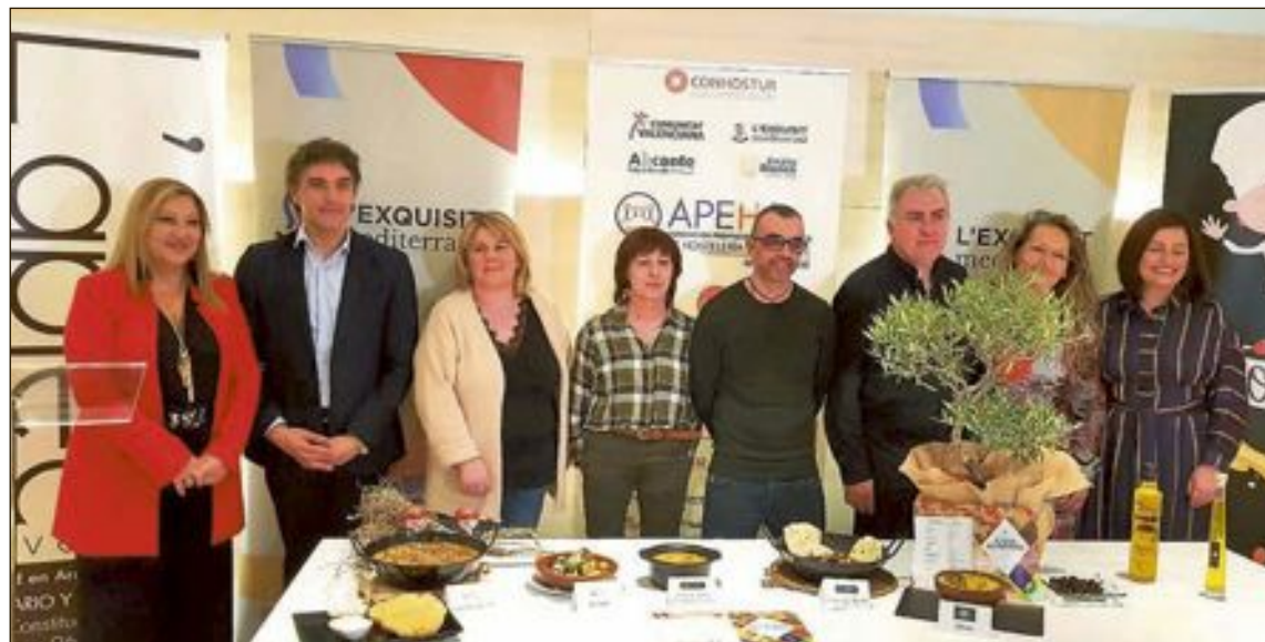
L'Aplec, Samalet, Casa Pili, El Chirri i El Museu, seran els encarregats d'elaborar les tradicionals plats de cullera

Amb l'objectiu de ressaltar i reivindicar la tradició gastronòmica, així com la gran qualitat de l'oferta de restauració de la província d'Alacant, la Confederació de Hostaleria i Turisme de la Comunitat Valenciana (CONHOSTUR), de la qual forma part la Associació Provincial d'Empresaris d'Hostaleria d'Alacant (APEHA), amb la col·laboració de Turisme Comunitat Valenciana, són els encarregats d'organitzar la segona edició d'estes 'Jornades dels Plats de Cullera'. A la província d'Alacant van arrancar el del 20 de febrer i conclouran el 8 de març. Cal no oblidar que participen restaurants de 12 municipis de la província: Alcoi, Alfara, Almoradí, Asp, Benjúser,