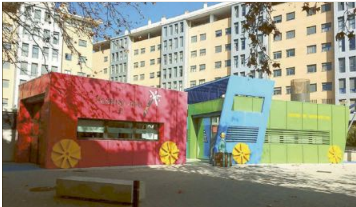
Se trata de una propuesta encaminada a poner en valor los recursos turísticos de Ibi

ción de una mesa de trabajo donde estén representados todos los agentes implicados del municipio, como museos, hostelería, asociaciones y entidades del sec-