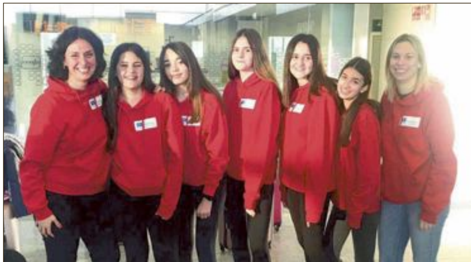
El grupo de cinco alumnos de Secundaria y dos profesores, que se desplaza hasta la ciudad italiana de Sicilia para participar en un proyecto de Arte