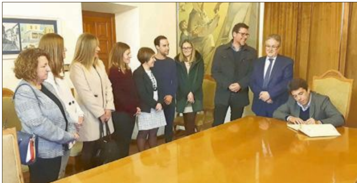
El president de la Diputació va firmar al llibre d'honor de l'Ajuntament

El president de la Diputació va assegurar que és "la primera visita oficial de moltes".