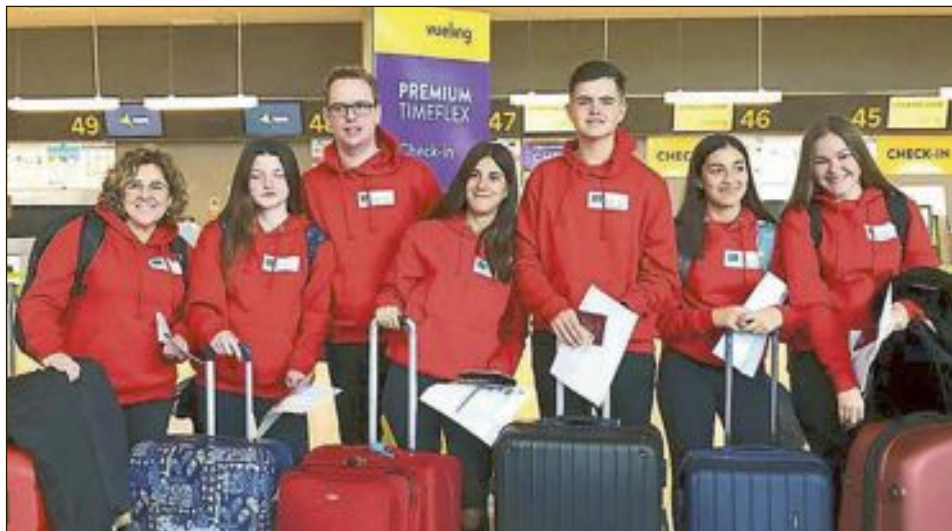
El grupo formado por cinco alumnos y dos profesores, que viaja hasta la capital turca de Ankara para participar en un proyecto de Juguetes