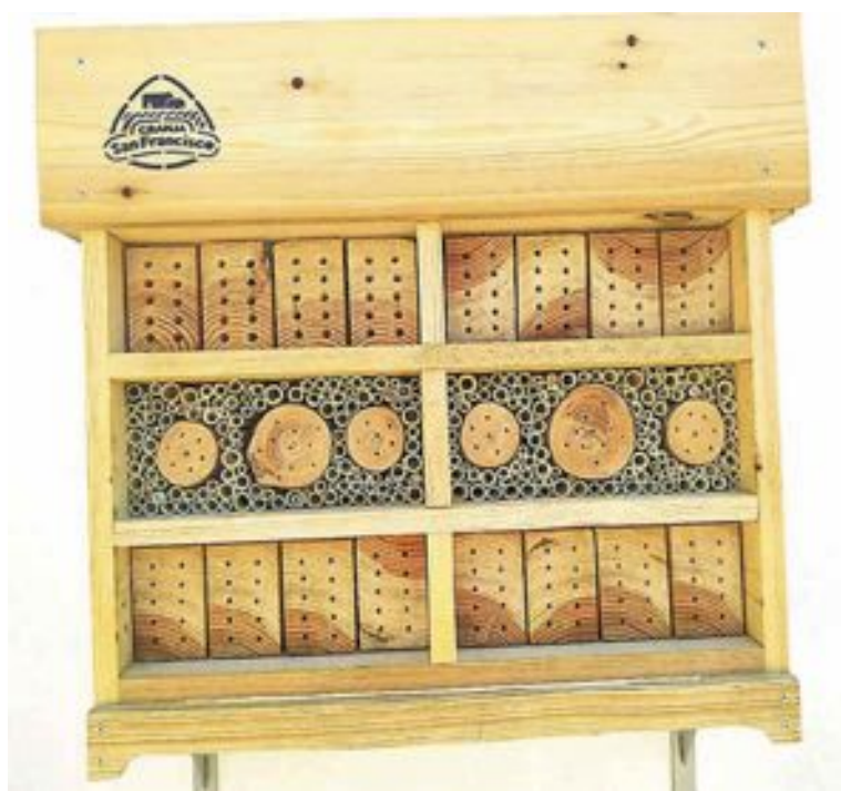
Estas abejas hacen nidos en galerías de distintos diámetros y profundidades por lo que los 'hoteles de bichos' buscan proporcionarles estos hábitats

La propuesta partió del instituto de investigación CIBIO (Centro Iberoamericano de la Biodiversidad) de la Universidad de Alicante con el apoyo del Ayuntamiento de Ibi. Una vez valorados los informes de viabilidad y la pertinencia de su creación por la Junta Directiva de la AeE, la designación de esta nueva reserva fue refrendada por la asamblea general de la AeE celebrada durante el XVIII Congreso Ibérico de Entomología, que tuvo lugar en Madrid el pasado año.