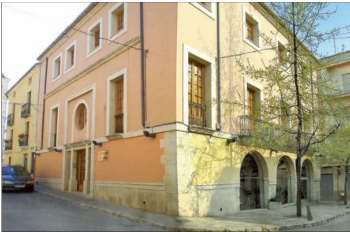
El edificio del Archivo municipal podría incluirse en la ordenanza de celebraciones civiles

pla actualmente la ordenanza son: la ermita de San Vicente, el Ayuntamiento y los jardines de la Casa de la Cultura y el PSOE