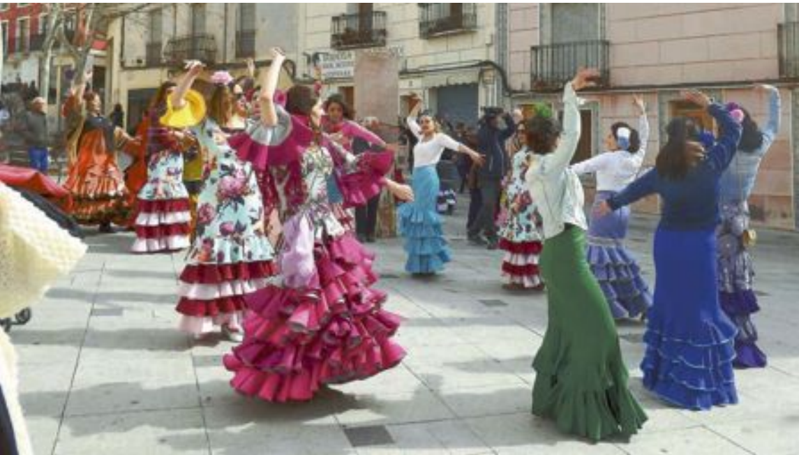
Grupo de bailaoras a ritmo de sevillana en la plaza de la Palla durante la festividad andaluza

El domingo habrá concentración de caballos, pasacalles, juegos infantiles, misa rociera y comida de hermandad.