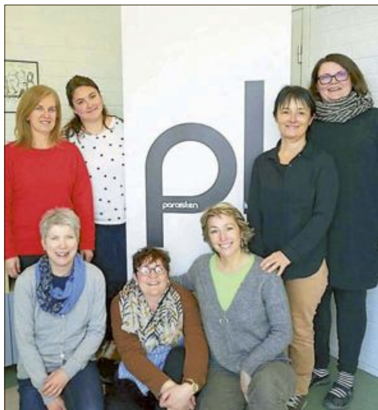
Dos profesoras del centro han participado en el proyecto WOW

El centro confía que ambos grupos “disfruten de una experiencia única tanto a nivel educativo como social y afectivo”.