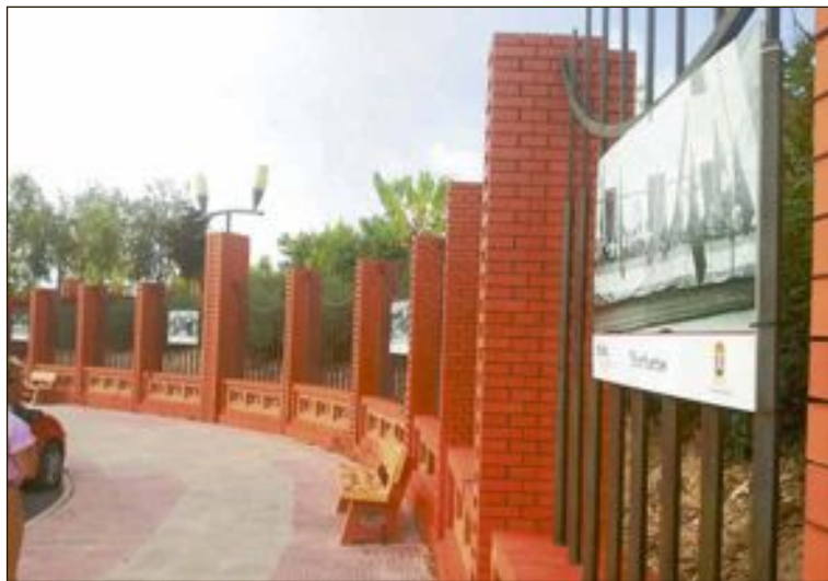
En septiembre de 2018 ya se realizó una exposición urbana sobre fiestas

Con motivo del II Trofeo Villa del Juguete