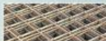
Taller de ferralla