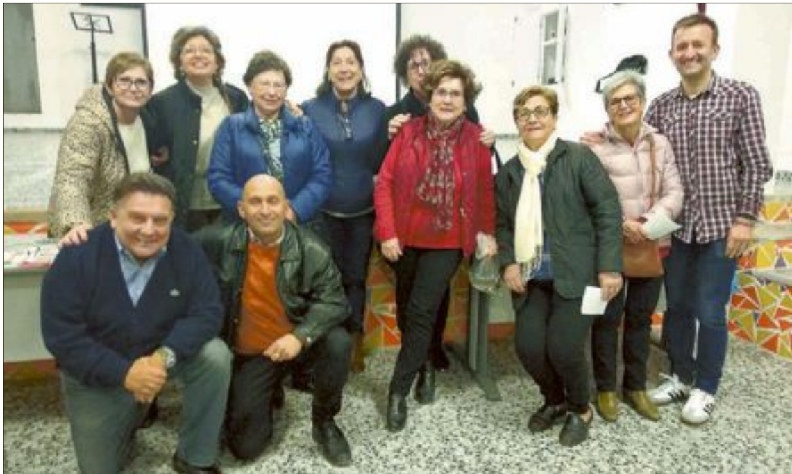
Representantes de las organización de Cáritas de Ibi y Castalla en la reunión del lunes 17 de febrero

Desde Cáritas señalan que la violencia, la pobreza y el cambio climático son algunos de los principales factores de este fenómeno social.