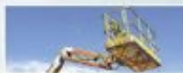
Alquiler de maquinaria