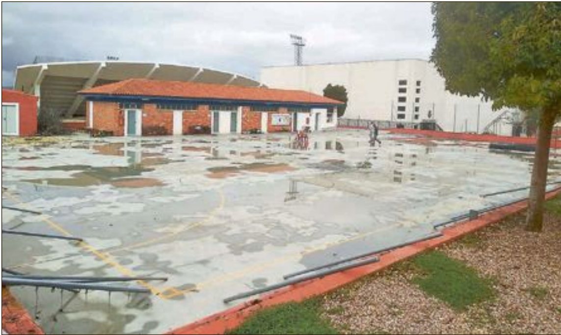
Els treballs van començar el 17 de febrer i mentres es duen a terme s'han canviat els accessos als altres espais