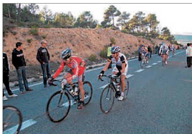
Un momento de la prueba

La siguiente etapa será en Castalla el sábado día 12 de febrero a las 15:30 horas, dándole tres vueltas a un circuito de carretera por la antigua