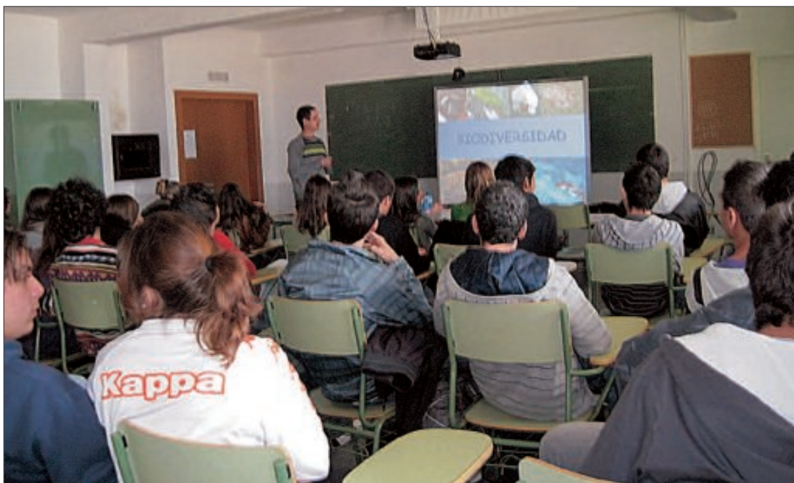
La programación incluye una exposición didáctica del Museo