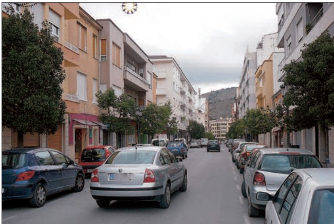
La Avenida de la Constitución es una de las principales vías comerciales de Onil