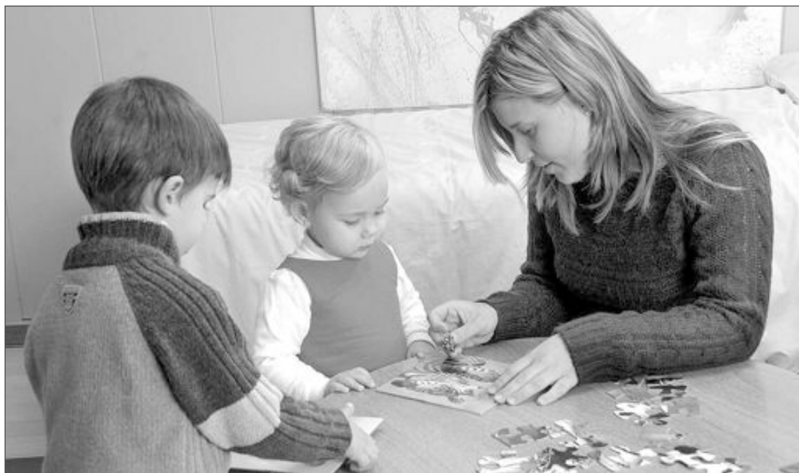
El derecho al juego está recogido en el artículo 31 de la Convención sobre Derechos del Niño de la ONU de 1989

Sus principales objetivos serán medir la implantación del derecho al juego en la sociedad española en los ámbitos particular, familiar, social y