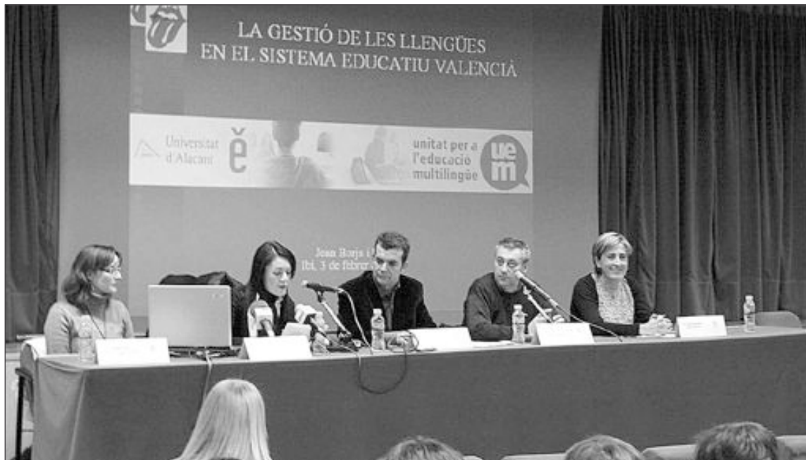
Acto de presentación de Les Trobades el pasado 3 de febrero en el Centro Social Polivalente

La próxima cita de la Trobada será el día 12 de febrero, en el que se realizará un taller de cuentacuentos para profesores y padres en el Centro Social Polivalente. La programación está compuesta por multitud de actividades diver-