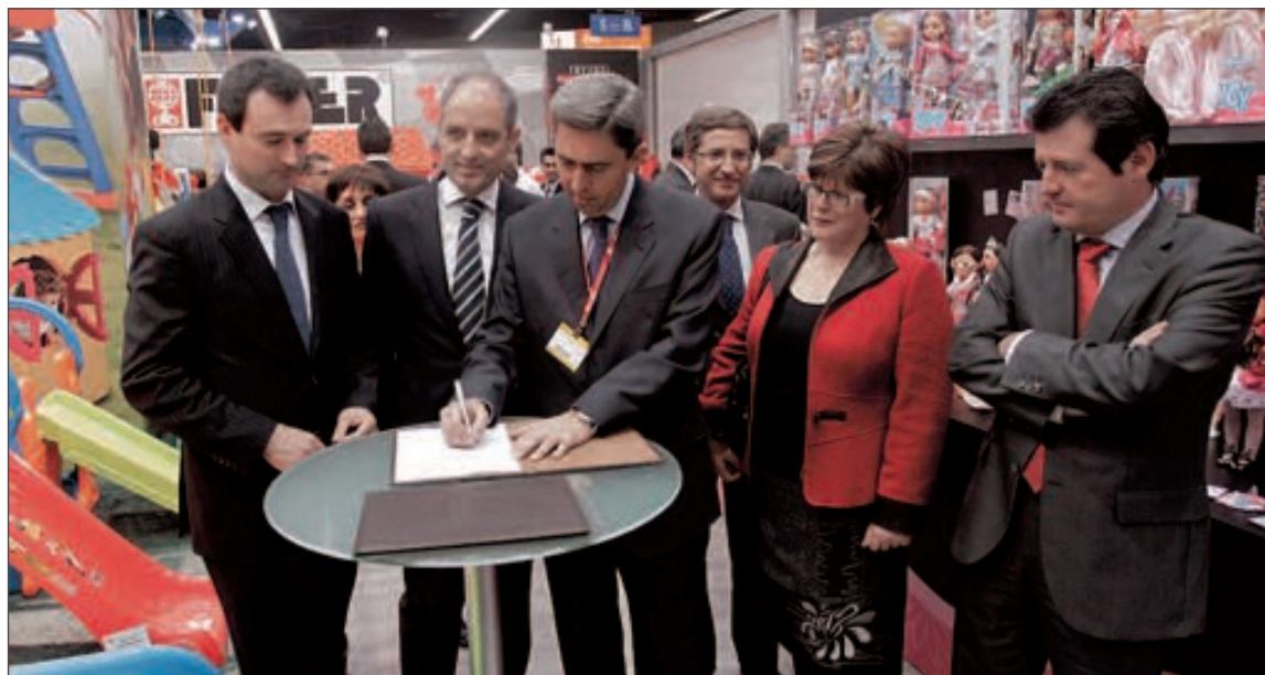
El conseller de Industria y el presidente de AEFJ renovaron en la feria el convenio de acciones de promoción

Para el presidente de AEFJ, debe abordarse la desestacionalización con una campaña a largo plazo