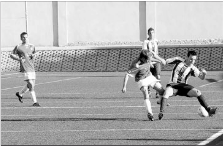
Imagen de archivo de un partido del Castalla en casa esta temporada

asentado en el terreno de juego, no dio ninguna opción al Dénia 'B' en ningún momento del encuentro y le pasó por encima completamente. De ahí que el resultado fuera tan contundente, e incluso pudieron ser algunos goles más. El Rayo Ibense está demostrando que cada vez va a más, que el equipo está por encima de cualquier individualidad y que, juegue quien juegue, la maquinaria siempre funciona. Todos corren, todos luchan, todos presionan, todos se apoyan y puede ser sencillamente imparable. ibifutbol.blogspot.com