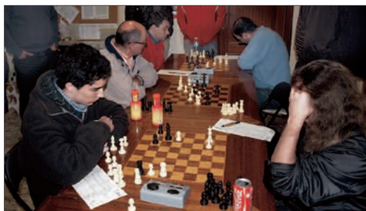
Las partidas del Club de Ajedrez Ibi se desarrollan en el Casino Primitivo

ble a los locales. Fuentes del club ibense informan de que "sigue la remontada y ya estamos en séptima posición, con cuatro puntos, y a dos del segundo clasificado". La siguiente jornada será contra el Alicante 'B', donde esperan confirmar la recuperación si no fallan los titulares.