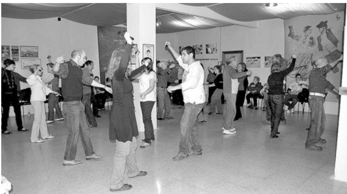
Bailes al son de la rondalla en una edición anterior de las noches de música

pasado viernes 4 de febrero con un destacada asistencia de público. La exposición podrá visitarse hasta el 20 de este mes, de lunes a domingo, en horario de tarde.