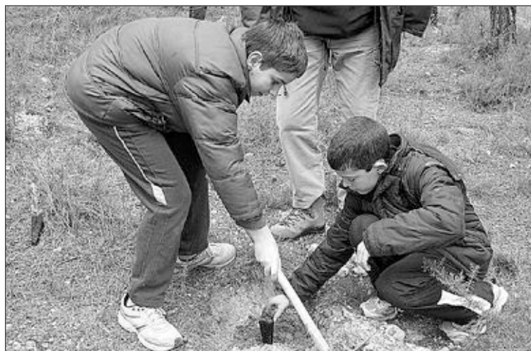
Ediciones anteriores de la campaña