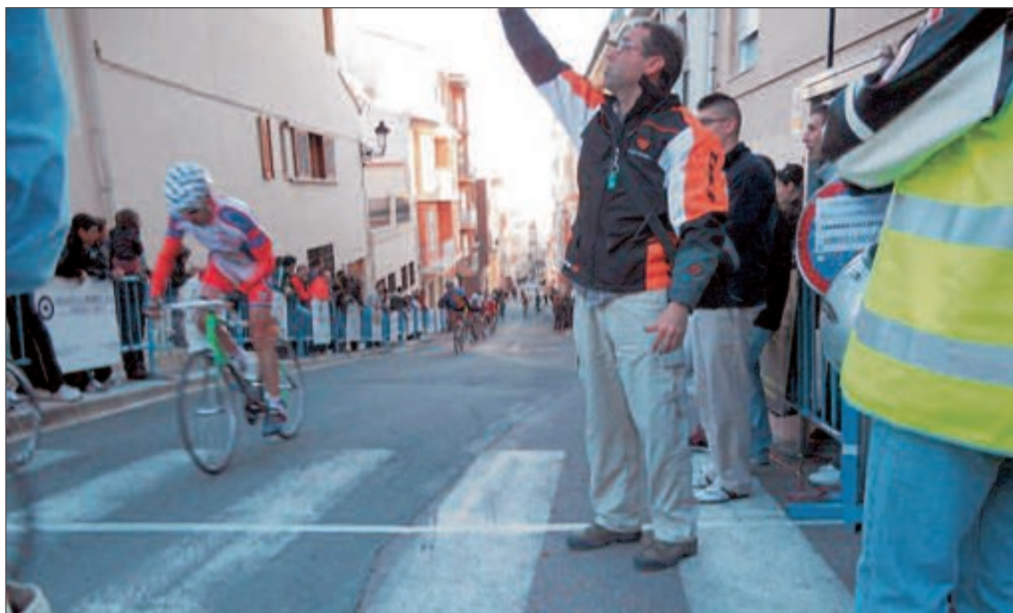
El último tramo antes de llegar a la meta era una empinada cuesta por el casco antiguo de Ibi

El resto de corredores hizo un muy brillante papel, destacando también la 35ª y 36ª posición respectivamente de