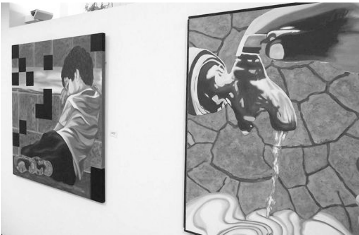
Algunas de las obras que se exponen estos días en la ermita de San Vicente de Ibi

En la ermita de San Vicente hasta el 20 de febrero