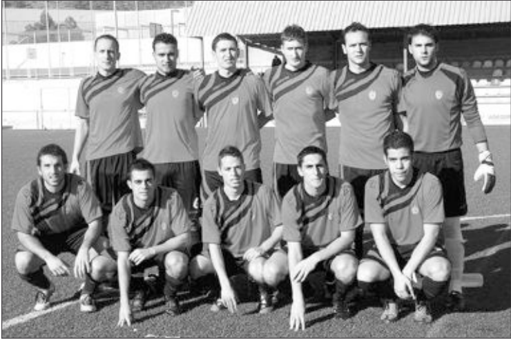
Once inicial del Rayo Ibense en su partido contra el Dénia 'B' en casa