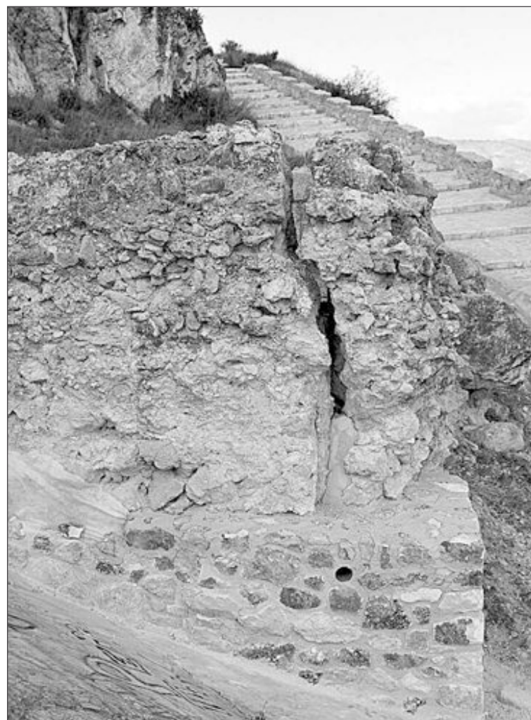
Base del aljibe con la mampostería finalizada

Conjuntamente se realiza un seguimiento arqueológico, en