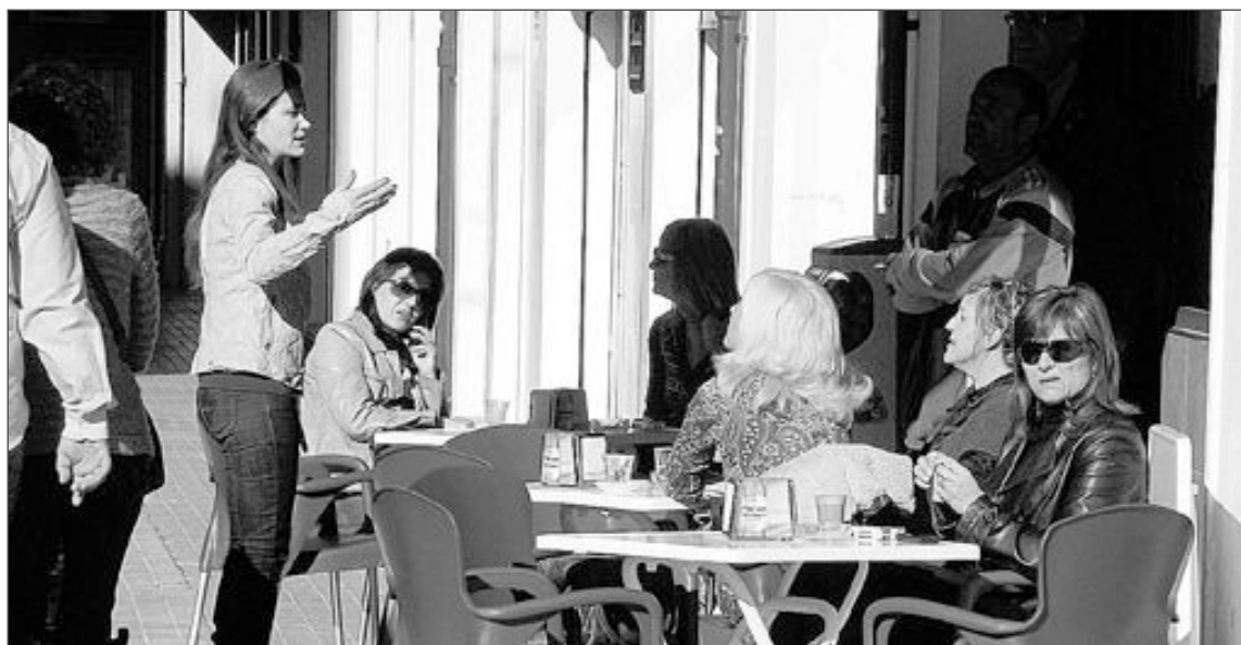
Las terrazas en invierno se plantean como la solución para evitar la pérdida de clientes por la ley del Tabaco