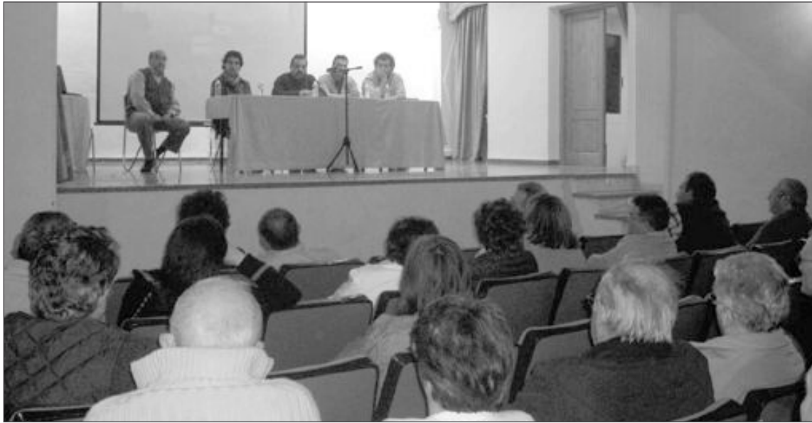
Interior del actual teatro, con una capacidad para sólo 120 personas, repartidas en dos plantas

Según Abad, "en ese tiempo puede haber otro alcalde en el Gobierno local y se le limita la posibilidad de obtener ayudas". El edil popular considera que un teatro no es una obra tan imprescindible para la localidad "si ese dinero fuese destinado a otro tipo de proyectos como un depósito de agua estaríamos de acuerdo, pero el teatro tampoco es tan necesario". Por otro lado, el concejal duda que el Ayuntamiento disponga de los terrenos para ejecutar el proyecto "aunque si lo tienen y también el dinero que lo hagan".