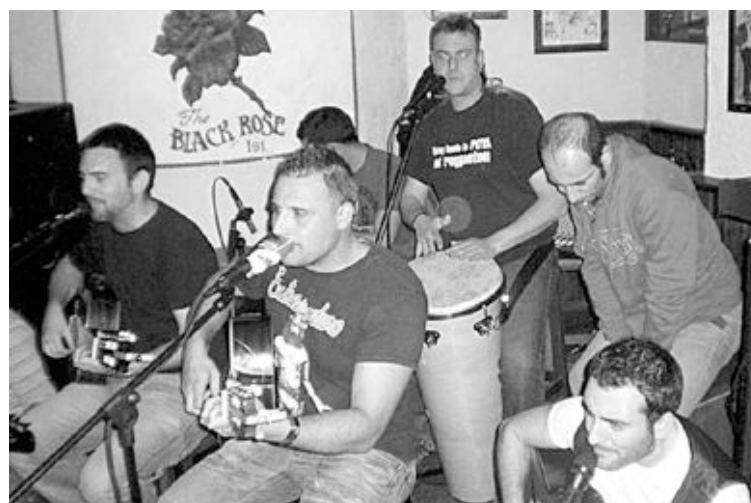
Los del Medio fueron arrojados por un buen número de paisanos