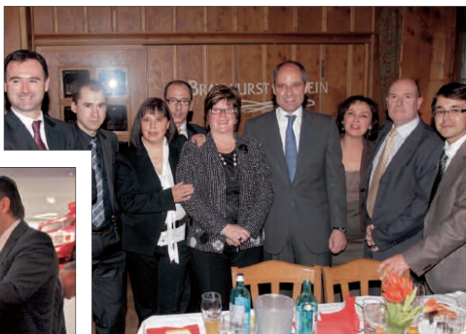
El presidente de la Generalitat, la alcaldesa de Onil y el presidente de AEFJ, junto a empresarios colivencos desplazados a Nuremberg