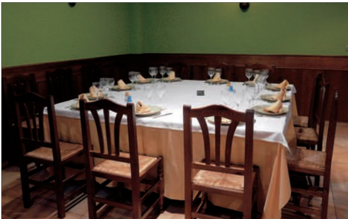
El Restaurante Les Eres ofrece la noche del sábado 12 de febrero un apetitoso menú para celebrar San Valentín

Durante la cena, el restaurante efectuará un sorteo y al premiado le saldrá gratis el succulento cubierto.