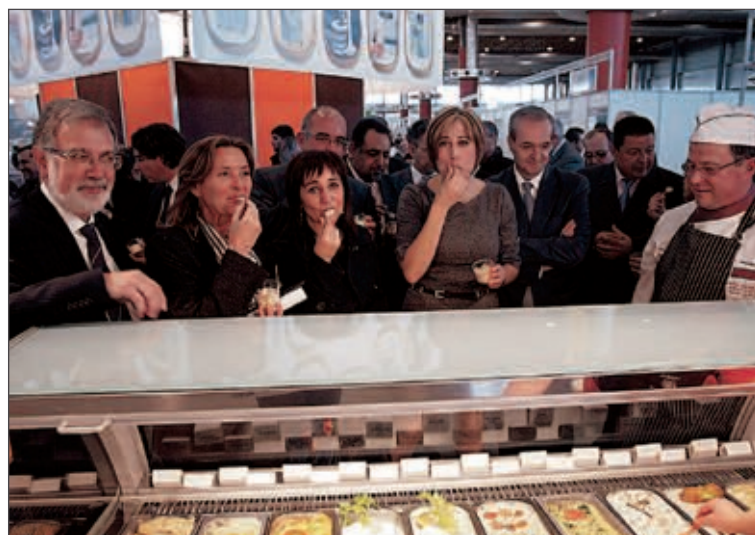
La alcaldesa y la edil de Educación asistieron a la inauguración de la feria

El único requisito para la realización de las actividades es que los centros interesados deberán contar con un espacio diáfano para albergar la muestra museística y la exposición fotográfica. Para más información o solicitudes pueden llamar al propio Museo de la Diversidad de Ibi, en el teléfono 96 655 31 68, o llamar al 96 555 24 50 ext. 420.