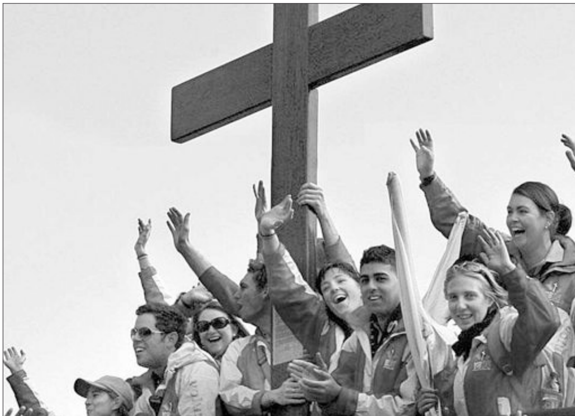
La Cruz de la Juventud comenzó su periplo por el mundo en el año 1984

En el año 2003 al final de la Misa de Ramos, Juan Pablo II quiso regalar a los jóvenes una copia del icono de María Salus Populi Romani : "A la delegación que ha venido de