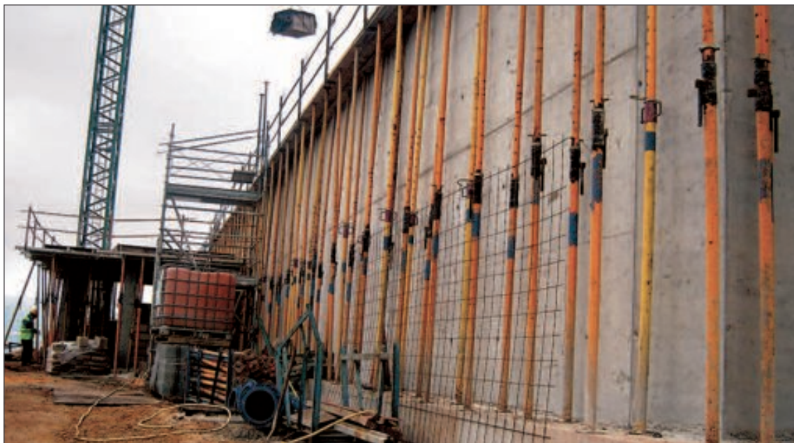
Estado de las obras de construcción del nuevo depósito de Onil

Dejará de funcionar, pues, uno de los dos depósitos que actualmente prestan servicio al municipio, concretamente el de 800 metros cúbicos, que se encuentra muy deteriorado.