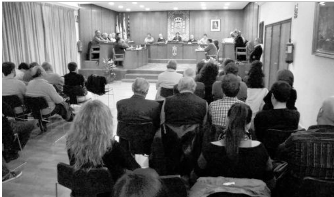
El público observa las intervenciones durante la última sesión plenaria