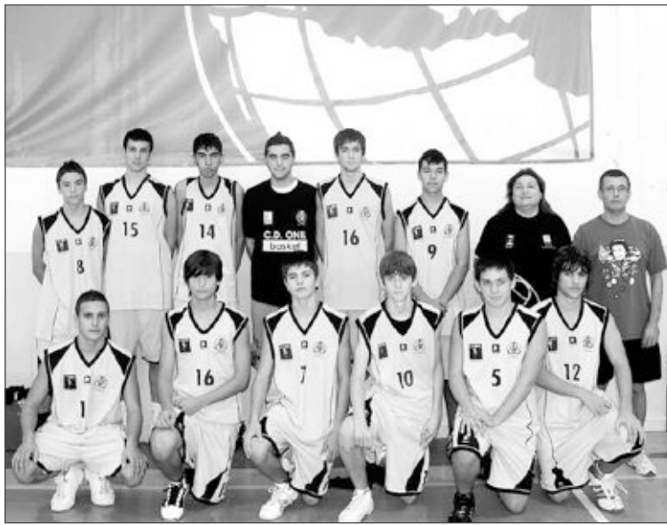
El Júnior Masculino a punto estuvo de ganarle al segundo clasificado, el Elda 'A' (70-75)

El Sénior 'B' ganó por 105-81 al Muro en un espectacular partido con bastante público. El Muro llegaba con todo su equipazo a intentar permane-