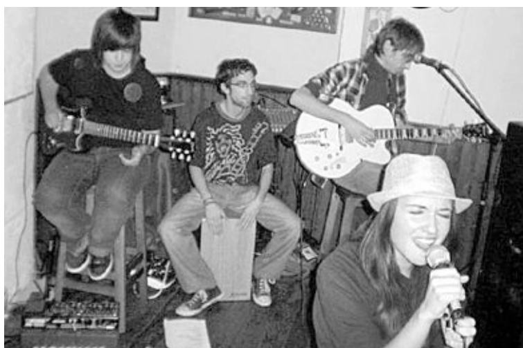
Los alicantinos Arenae ganaron el duelo musical en el pub Black Rose

director del museo Arqueológico Camil Vicedo Moltó de Alcoy y llevará por título El Patrimonio Arqueológico y los Museos .