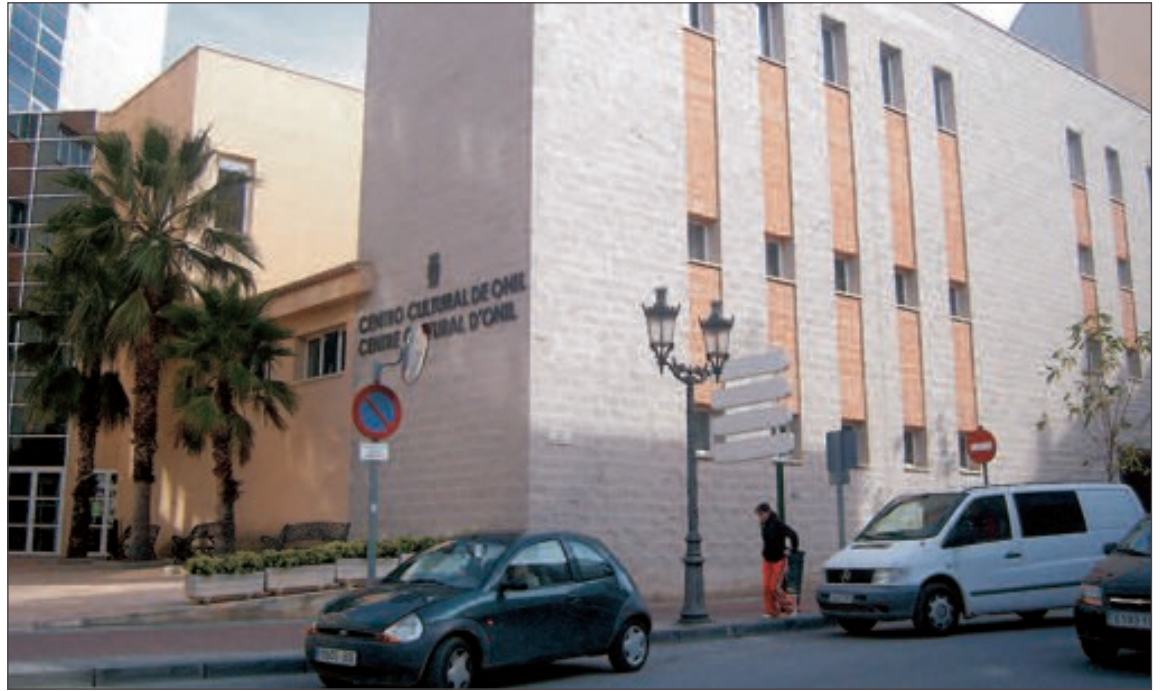
Fachada del Centro Cultural de Onil

Estas nuevas lámparas permiten un ahorro de hasta el 80% de la energía consumida, con una iluminación "sensiblemente mejorada", informan