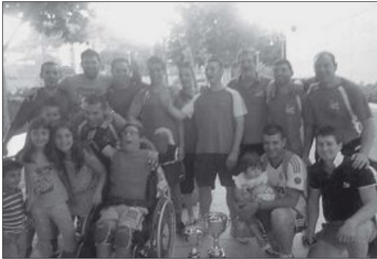
Clínica Láser, campeón de las 24 Horas Deportivas (fútbol sala)

El inicio del campeonato tendrá lugar a las 16:00 horas de viernes 12 de julio, mientras que la final se jugará a las 18:00 horas del domingo día 14.