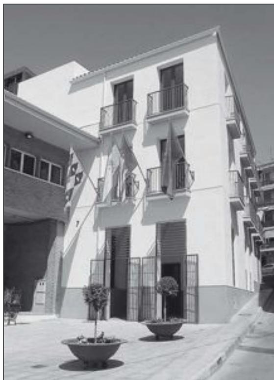
El Edificio Multiusos está situado junto al Mercado

El edificio, con tres plantas y sótano, aprovecha al máximo la luz natural y cuenta con varias placas solares en la azotea para