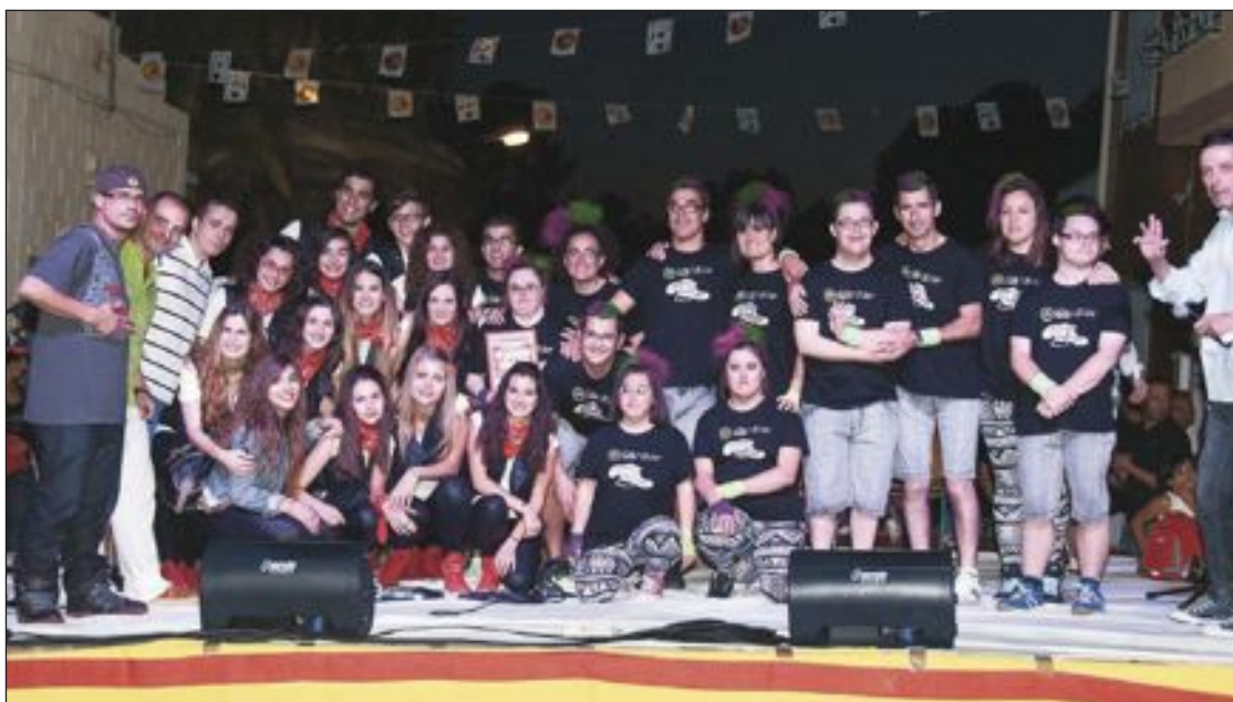
Todos los ganadores del concurso, que se celebró el domingo 30 de junio en el barrio de Mirasol