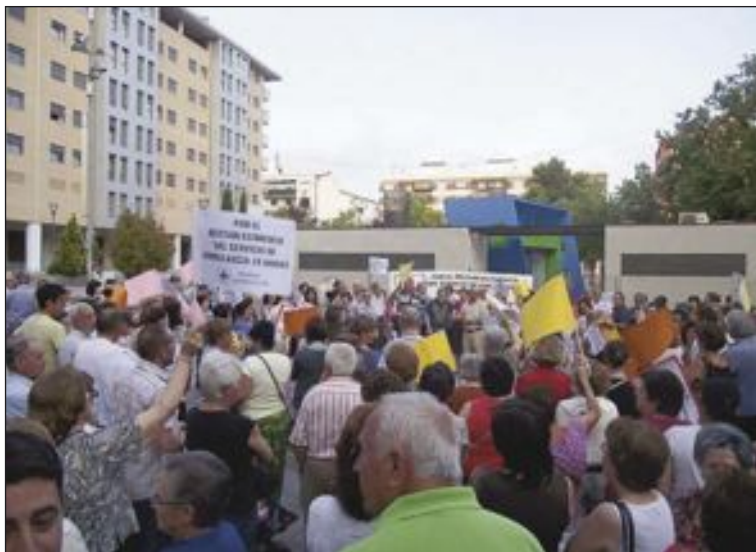
Cerca de doscientas personas protestaron por el recorte de la ambulancia

Onil celebra del 12 al 14 de julio la quinta edición de la Feria de San Cristóbal, con mercado medieval, comercio y artesanía