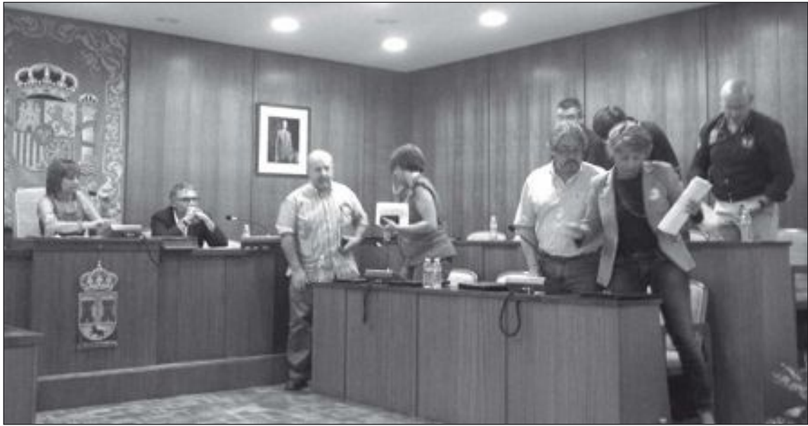
Momento en el que los grupos de la oposición, PSOE, EU y ADI, abandonan el Pleno del 28 de junio