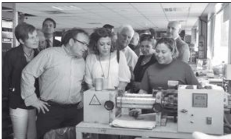
Tras la recepción, los asistentes visitaron las instalaciones

Esta inversión se enmarca dentro de un proyecto de investigación a nivel europeo, que consiste en obtener un masterbatch biodegradable, respetuoso con el medio ambiente, incorporándole cáscara de almendra. La actuación ha venido acompañada, además, de una ampliación de plantilla.