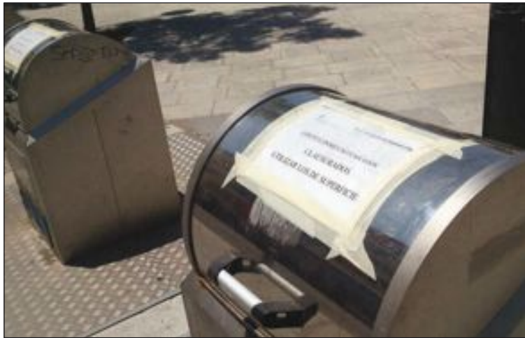
El Ayuntamiento ha colocado carteles para anunciar la medida

Una vez concluya todo este proceso, según añaden los técnicos, los contenedores volverán a estar operativos. Mientras tanto, hay que usar los de superficie.