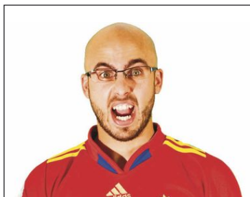
17 julio - El Pequeño Buda