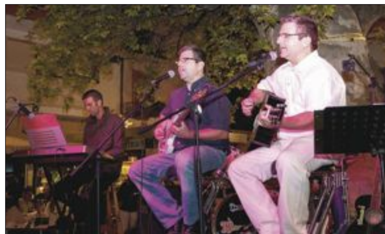
Rolling Bessons ofrecieron temas de su nuevo disco y otros ya clásicos