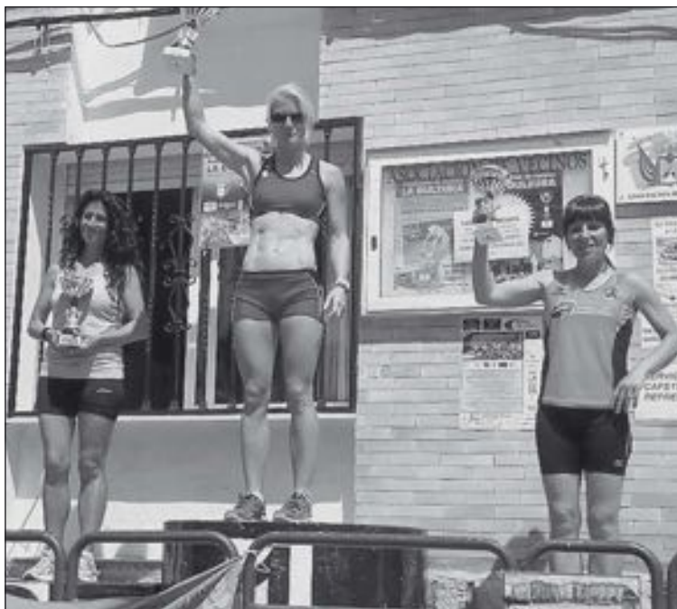
Podio de la categoría Veteranas

Participaron corredores de toda la comarca, entre ellos del Club Teixereta d'Atletisme de Ibi y del Club Atletisme Castalla .