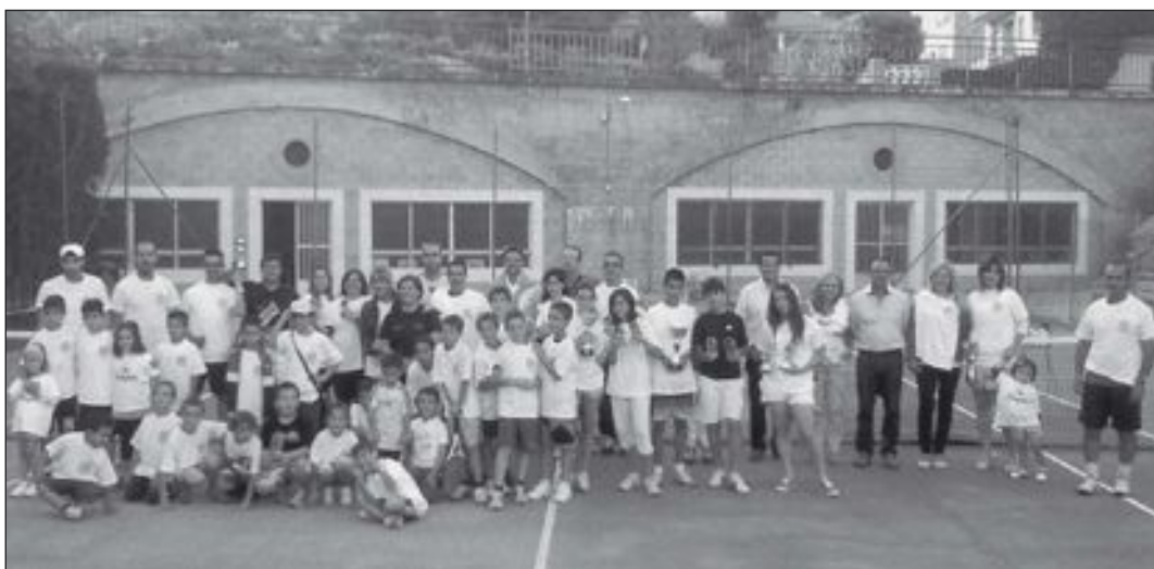
Participantes en el fin de curso de la Escuela de Tenis de Onil