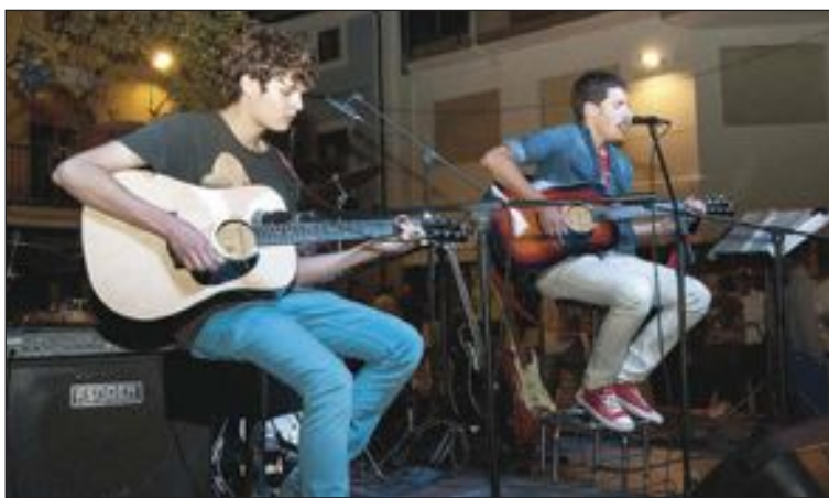
Los jóvenes promesas del pop local deleitaron a los espectadores

El sonido y la iluminación corrieron a cargo de Juanjo Sanchís ( JSarga ) y la organización quedó muy satisfecha con el resultado.