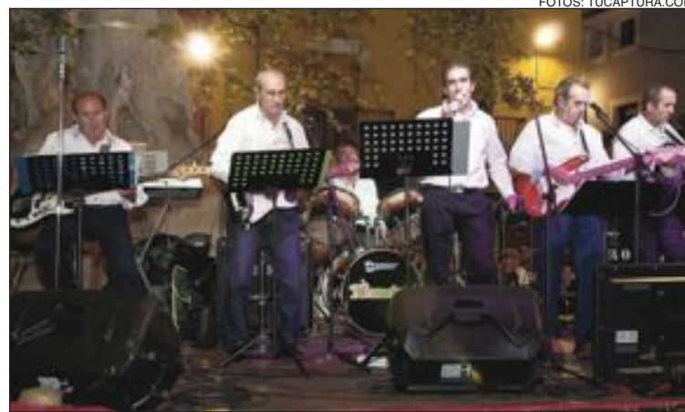
La veterania de Fórmula Sexta instauró la nostalgia en la plaza La Palla