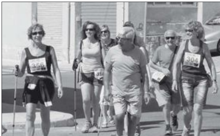
Aparte de corredores, también participaron marchadores