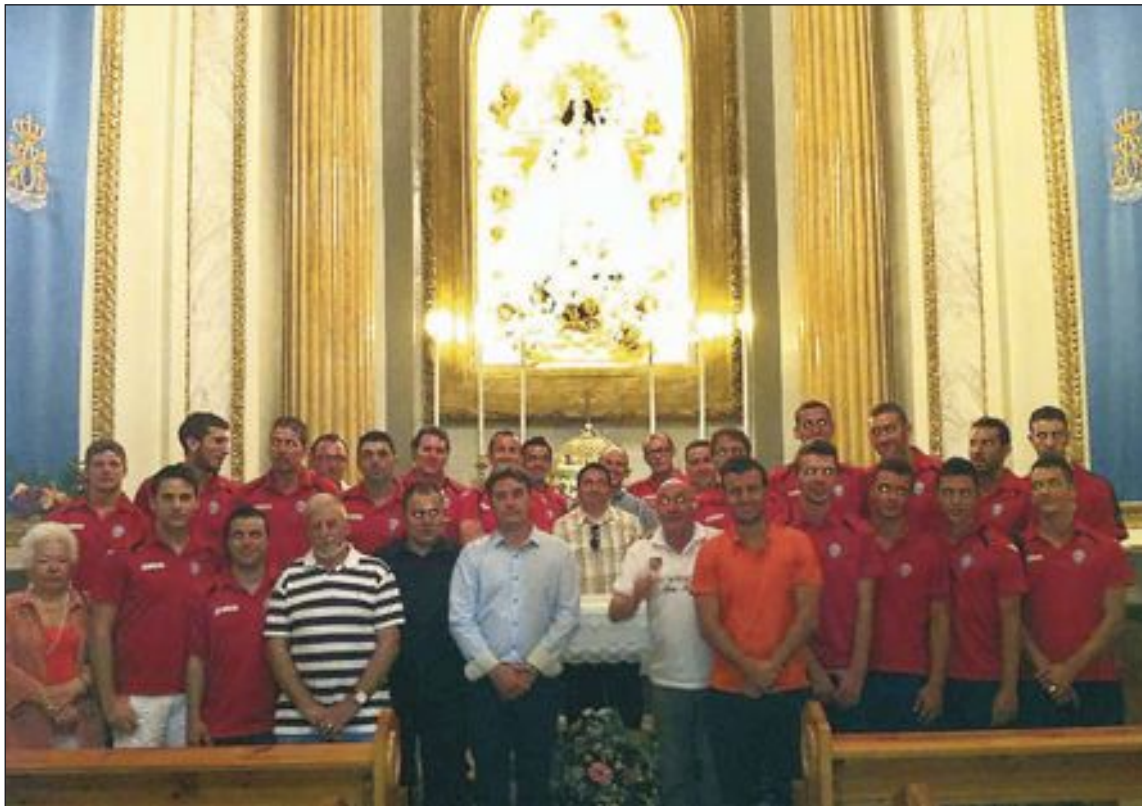
El Rayo Ibenso Sénior protagonizó una ofrenda de flores a la Virgen de los Desamparados en la Iglesia de Ibi

Por otro lado, el Rayo Ibenso Sénior y la Directiva protagonizaron una ofrenda de flores a la Virgen de los Desamparados, el viernes 28 de junio en la Iglesia de la Transfiguración del Señor. A continuación, se desplazaron al Ayuntamiento, donde fueron recibidos por la Corporación.