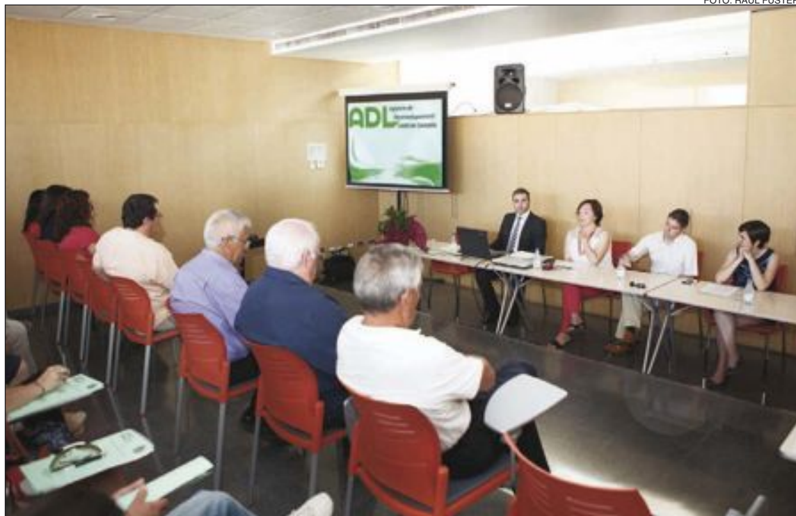
La jornada se celebró en una de las salas de conferencias del Auditorio de Castalla

Prats es también el edil delegado de la Agencia de Desarrollo Local (ADL), por lo que, tras analizar con ambas presidentas la actual situación económica, comercial e industrial de Castalla, les explicó las funciones de la ADL y cómo se pueden estrechar lazos entre este organismo y las dos asociaciones locales.