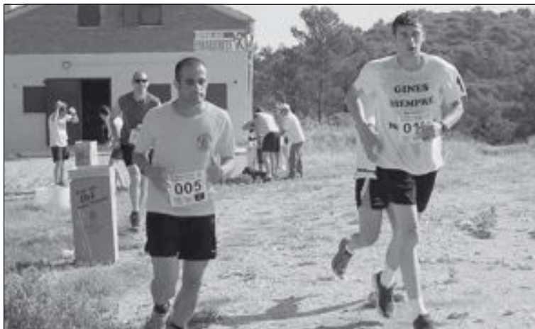
Una vez en el Refugio, los participantes emprenden el regreso a Ibi