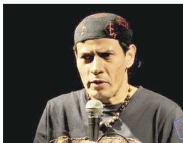
21 agosto - Caoz