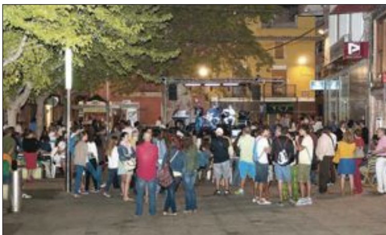
La plaza La Palla estuvo muy animada durante todo el festival