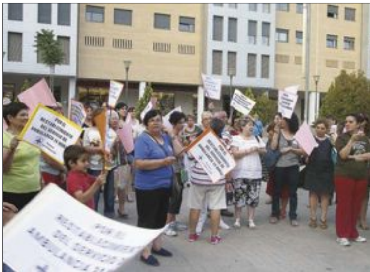
La concentración tuvo lugar el martes 2 de julio en la plaza del Centenario