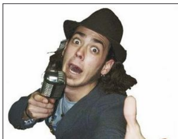
14 agosto - Acho