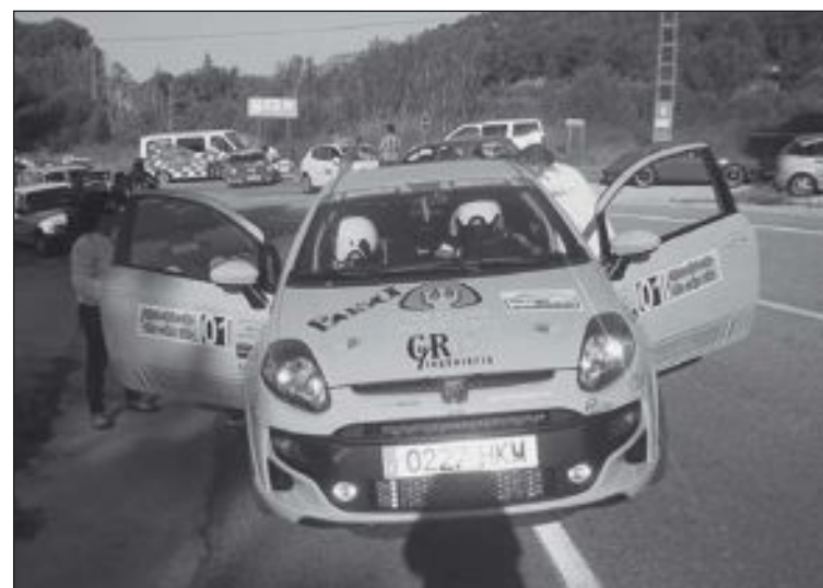
Uno de los vehículos participantes