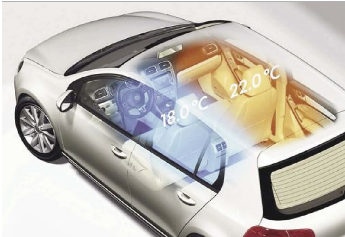
Con los nuevos climatizadores puedes controlar la temperatura de distintas zonas del habitáculo