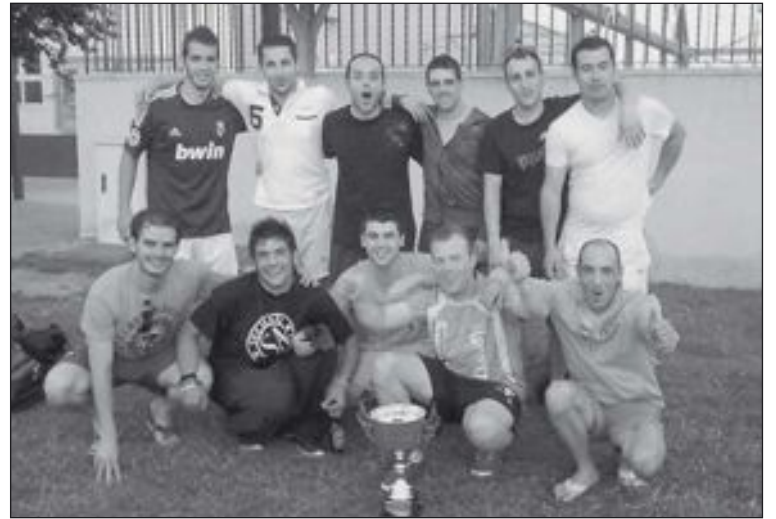
Cafetería Ca Abraham, subcampeón de las 24 Horas Deportivas