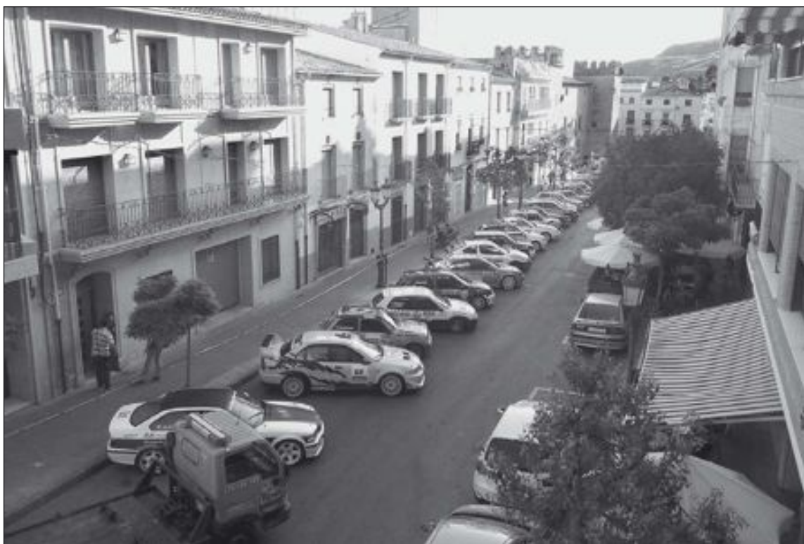
Los vehículos participantes estuvieron expuestos en la avenida de la Constitución