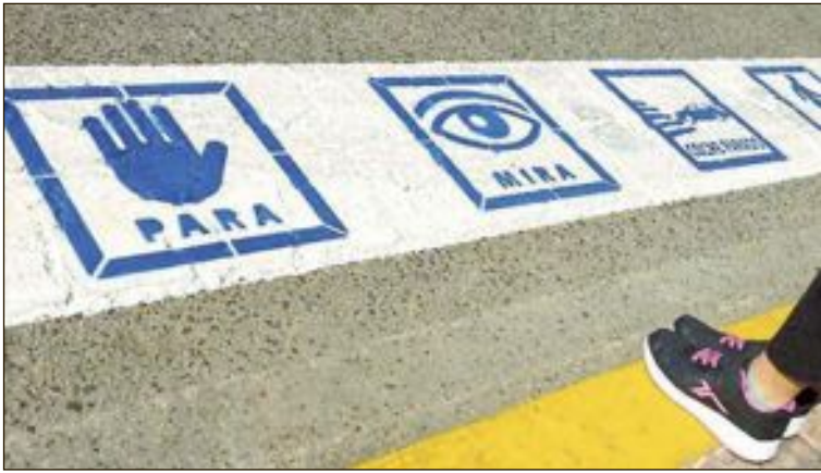
Pictogramas para facilitar la accesibilidad de personas autistas