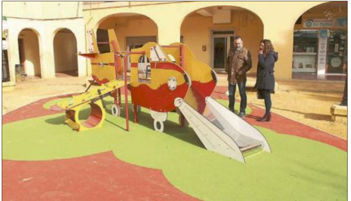
El alcalde y la edil de Servicios Públicos ante el nuevo juego infantil instalado en la plaza

Por todo ello, solicitan que se estudie la viabilidad de rotular las aceras en los pasos de peatones cercanos a los centros educativos y en vías principales.