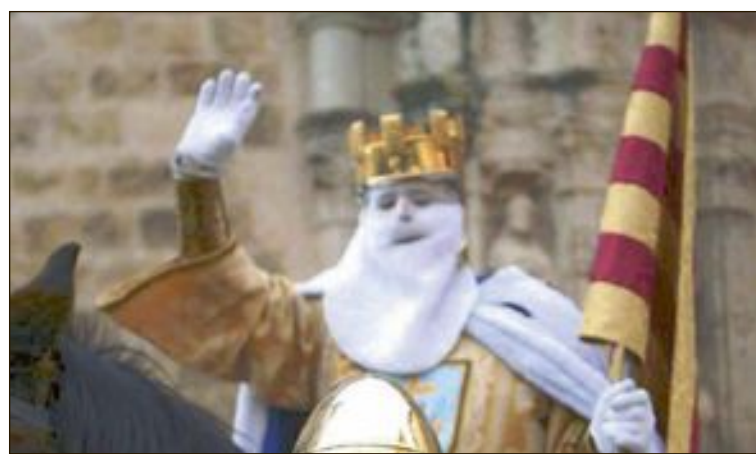
La primera cavalcada del Rei Pàixaro tindrà lloc la nit del dissabte

Los servicios médicos estabilizaron al hombre de 62 años, que presentaba fracturas costales y neumotórax y, tras ello, fue trasladado al Hospital General Universitario de Elda en la ambulancia de soporte vital avanzado.