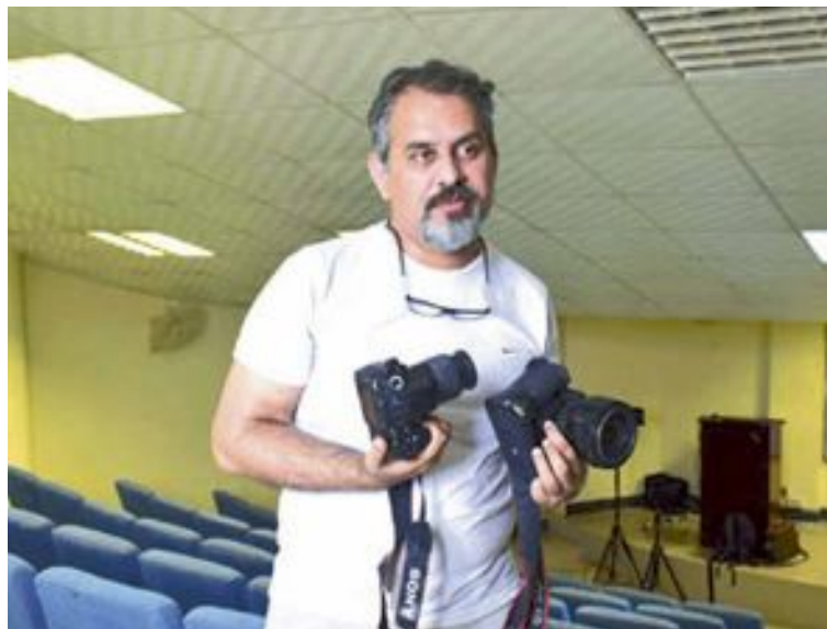
El fotógrafo Víctor Escuin Borràs es el autor de la exposición

La exposición recoge dos de las mayores pasiones del autor: su amor por la naturaleza y por