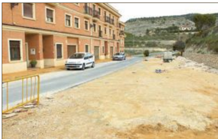
Obras en la calle San Nicolás