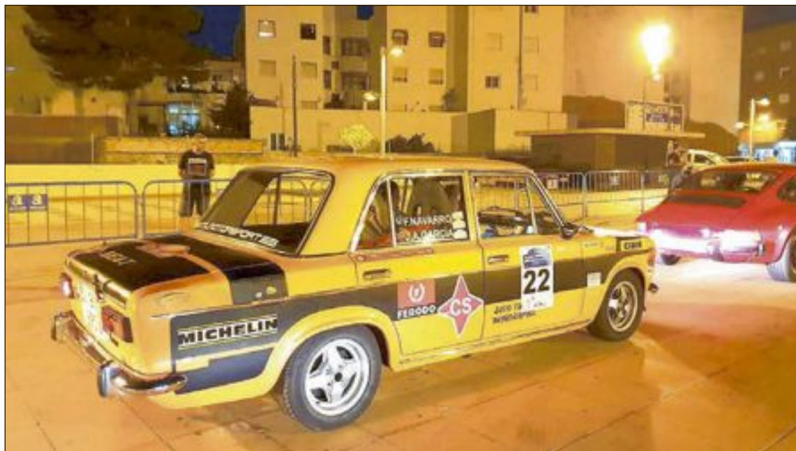
Los aficionados podrán ver de cerca estos vehículos a partir de las 10.50 horas en el parque Les Hortes de Ibi

Los equipos harán un alto en el camino el 18 de enero al término de la 1ª sección tras haber realizado tres tramos de clasificación para un avituallamiento. Los aficionados al motor podrán observar de cerca a estos vehículos históricos a partir de las 10.50 horas en el Parque Les Hortes de Ibi. No dispondrán de mucho tiempo, puesto que