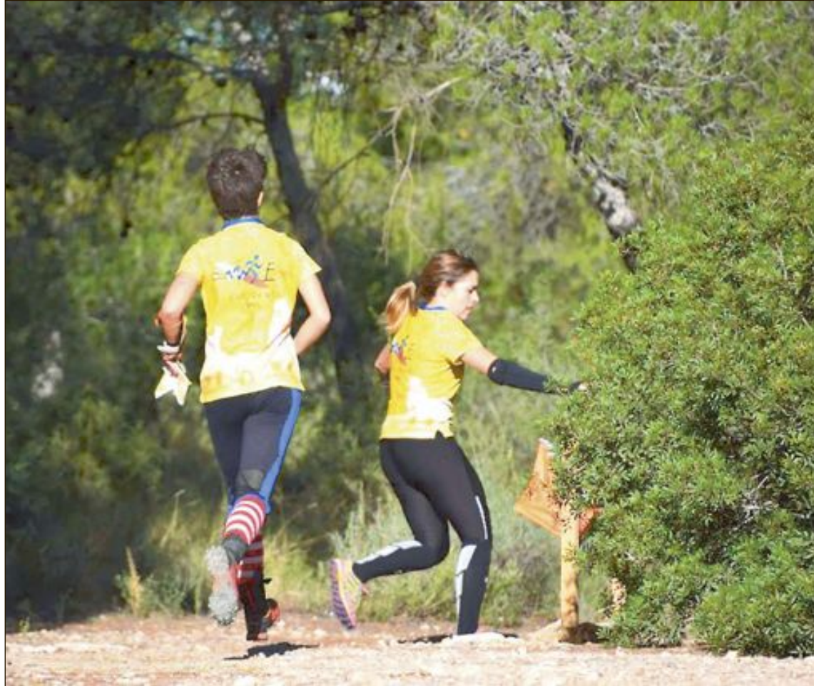
Los orientadores del CE Colivenc han subido al pódium en 25 ocasiones en el campeonato Autonómico

El conjunto de Onil repetirá en 2020 en las tres ligas. Desde el CE Colivenc el mensaje no cambia. Fiel a su filosofía de club familiar y diferente en todos los sentidos, aboga por “disfrutar primero y competir después”.