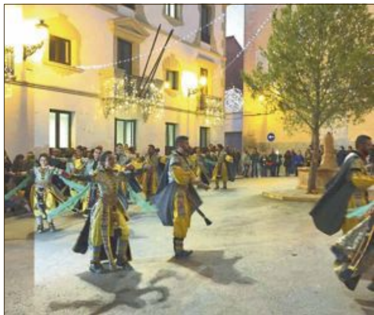
Dansa del Regnat Moro, el dissabte 11 de gener