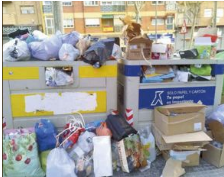
Contenedores de la avenida Juan Carlos I, a la altura de la plaza Miguel Servet

Ha vuelto a suceder estas fiestas navideñas y los socialistas han pedido, de nuevo, tras las demandas vecinales que se tomen las medidas oportunas para solucionar el problema.