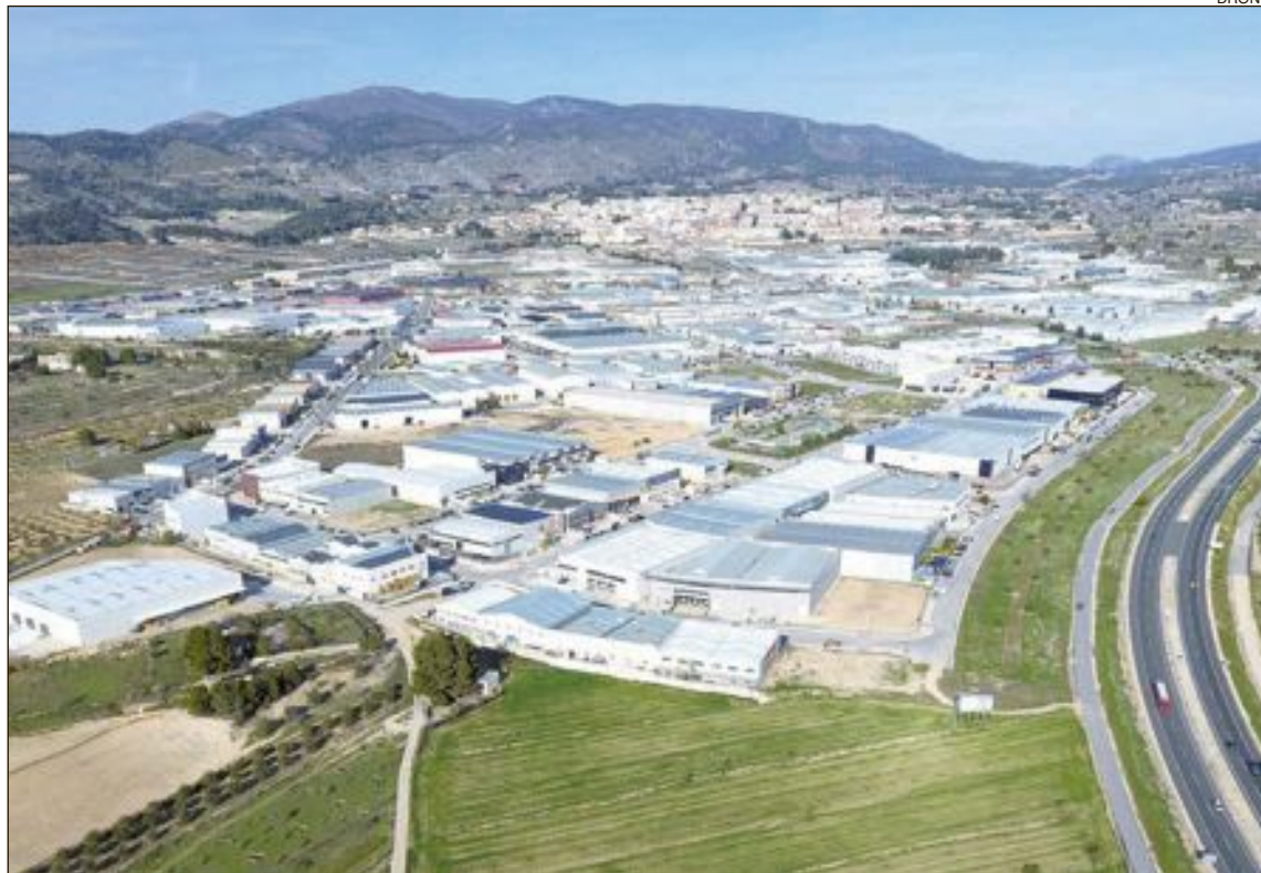
El proyecto tiene previsto concluir en 2022 con un coste de más de 7'5 millones de euros

Todos los grupos políticos apoyaron la medida pero pidieron al equipo de gobierno que emprendiera ya los trámites de las dos siguientes fases del polígono para intentar simultanear las obras y que se produzcan los menos retrasos posibles, “porque