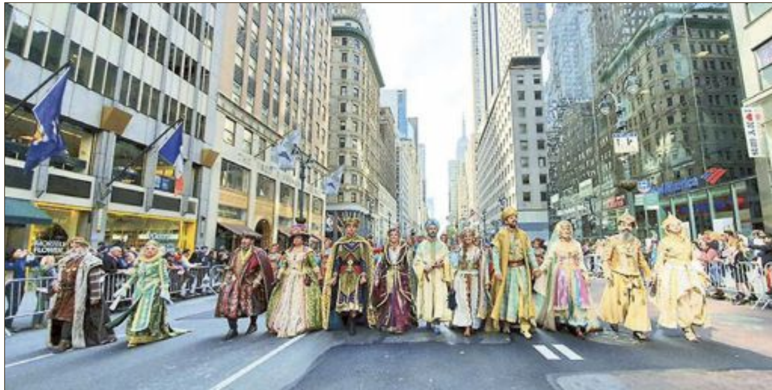
Representació de les comparses d'Onil desfilan per la 5ª Avinguda de Nova York en la desfilada de la Hispanitat a l'octubre de 2019

En la pròxima celebració de la Fira Internacional de Turisme a Madrid (22 al 25 de gener) Onil estarà present sota el parai-gües del Patronat de Turisme de la Costa Blanca. Una de les acti-