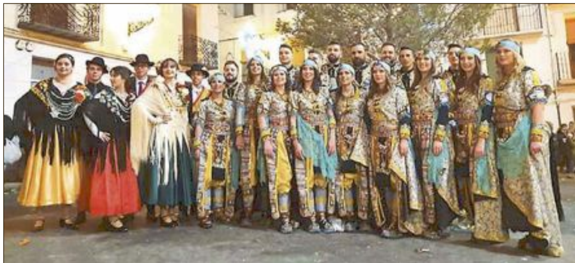
L'últim dia ballen les parelles dels dos regnat en la plaça

Des de l'Ajuntament expres- sen el seu agraïment "a les ballaores i ballaors dels dos regnats, a les xaramites i tambors, al subhastaor, a les vestidores de mantons, al servei de neteja, a pares, mares i familiars, així