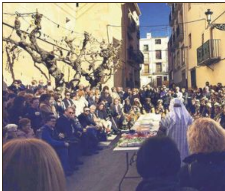
La subhasta de tonyes es va celebrar el matí del diumenge 12 de gener