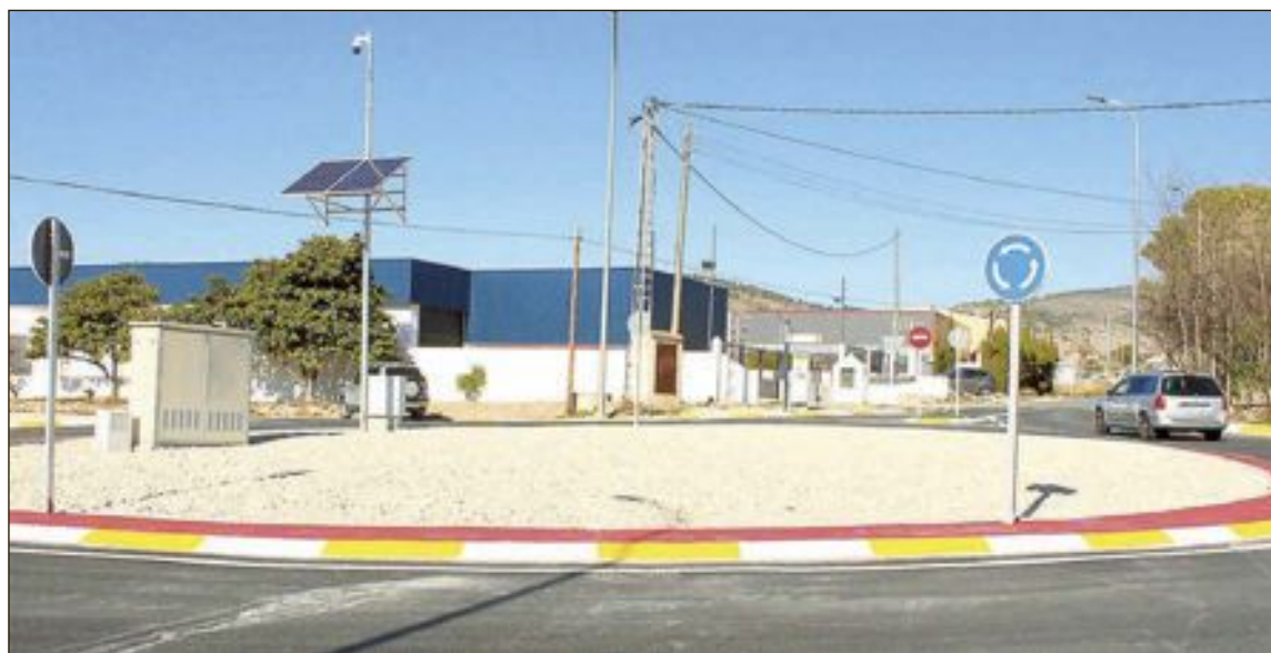
La nueva rotonda regula el tráfico en la avenida de Azorín con avenida del Juguete, a la altura de los polígonos industriales, en dirección a Tibi

Esta semana se procederá a la pavimentación de la calzada, por lo que los vecinos de la calles no podrán tener acceso a los garajes en al menos 15 días, ni tampoco transitar con vehículos por ella.