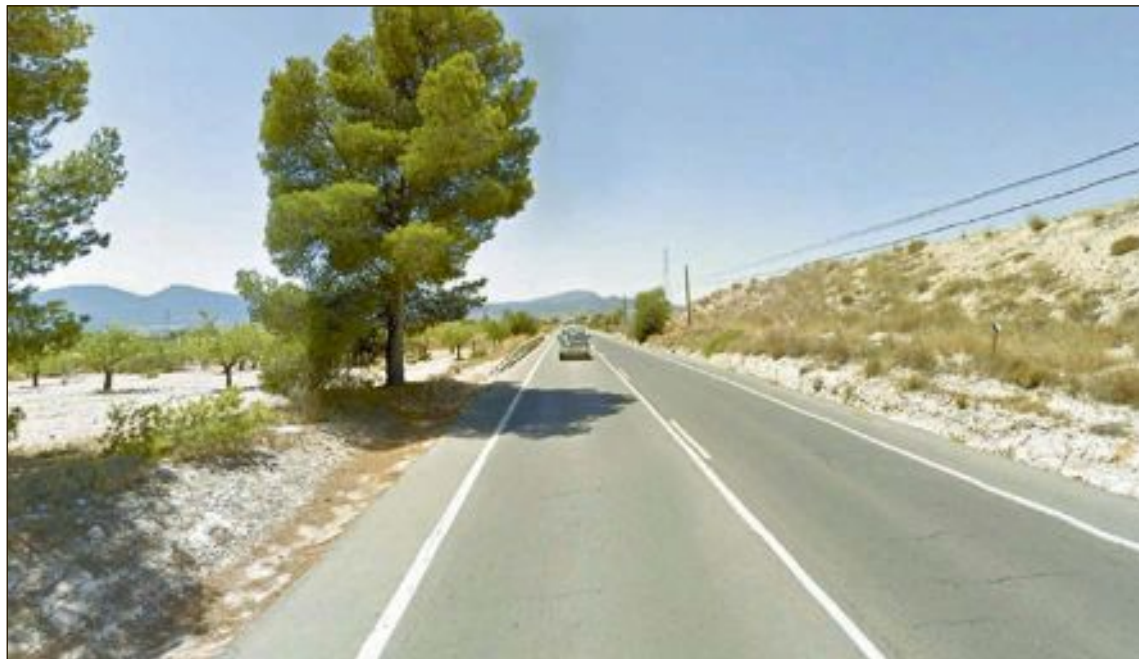
El suceso tuvo lugar sobre las 18:05 horas en la carretera CV-806 con sentido hacia Castalla, a la altura aproximada del punto kilométrico 4'7 (pasado el almacén del butano)

Ante la inseguridad que generaba el escenario de los hechos, la patrulla policial señaló la zona y procedió a regular el tráfico, para garantizar la integridad de los allí presentes, mientras llegaba la unidad de tráfico