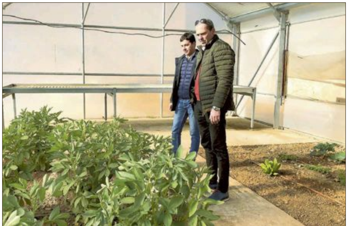
La Casa Tàpena està considerada com un dels espais més complets de tota la xarxa provincial

No obstant això, els principals reclams són el seu imponent laberint vegetal, considerat com un dels més importants d'Espanya, i els arbres monumentals -centenaris-, entre els quals es troben pins, carrasques i un dels arboços més grans de la província d'Alacant.