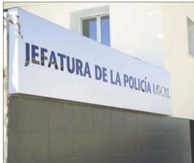
En la actualidad hay 25 policías operativos, de una plantilla con 33 plazas

Los socialistas recuerdan que ya en mayo de 2018 pidieron que el Ayuntamiento efectuara el citado tramite oficial.