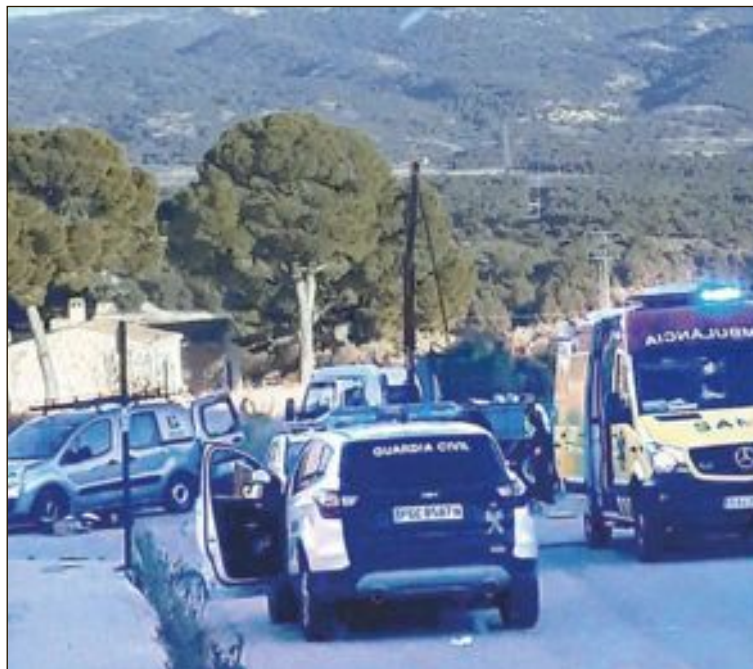
Agentes de la Guardia Civil y una unidad del SAMU, en el lugar del suceso

periódico, por la mañana tuvo lugar el vaciado de la fosa colectiva de la urbanización y, por la tarde, los trabajadores acudieron para cambiar las válvulas. El más joven se introdujo primero y al abrirla comenzaron a emanar los gases tóxicos, dejándolo en cuestión de segundos completamente inconsciente. Inmediatamente, su compañero se introdujo para rescatarlo corriendo la misma suerte. Les acompañaba