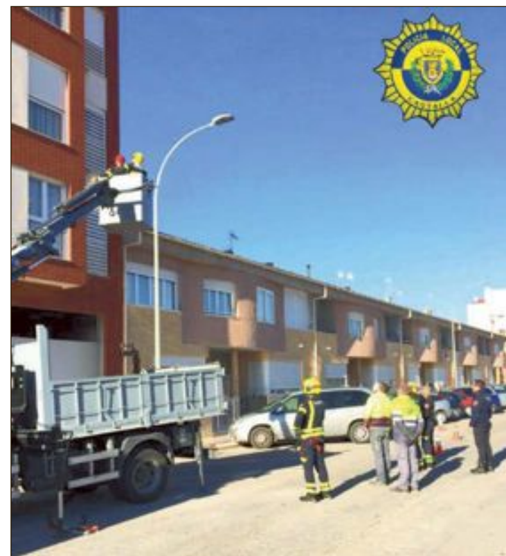
Para realizar el rescate, la Policía solicitó la presencia de los bomberos de la Diputación y un camión y una grúa de la brigada municipal de obras

También acudieron efectivos del parque de bomberos de Ibi, sanitarios y agentes de la Guardia Civil, que se han hecho cargo de la investigación.