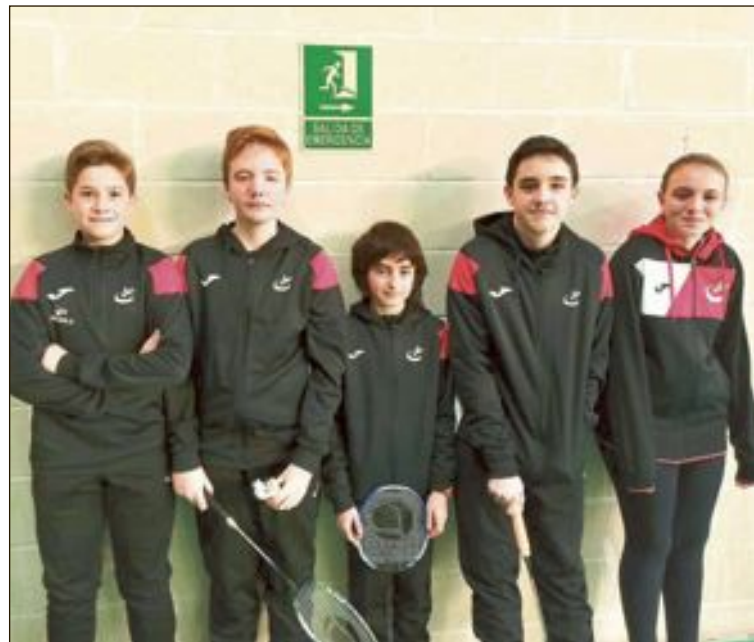
Alumnos de la Escuela de Bádminton Ibi

vares es en Medina del Campo para disputar un nuevo Máster Nacional Absoluto en individual y dobles.