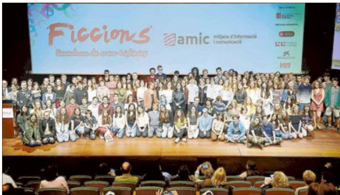
Alguns dels alumnes participants en el concurs Ficcions

Un jurat format per persones vinculades al món de la literatura i l'educació serà l'encarregat d'escollir els guanyadors i els finalistes. Es valorarà la qualitat literària dels textos, la coherència argumental i l'originalitat de les històries. La segona quinzena del mes d'abril es publicaran els noms dels finalistes, i al mes de maig es farà l'entrega de premis i diplomes en diversos actes