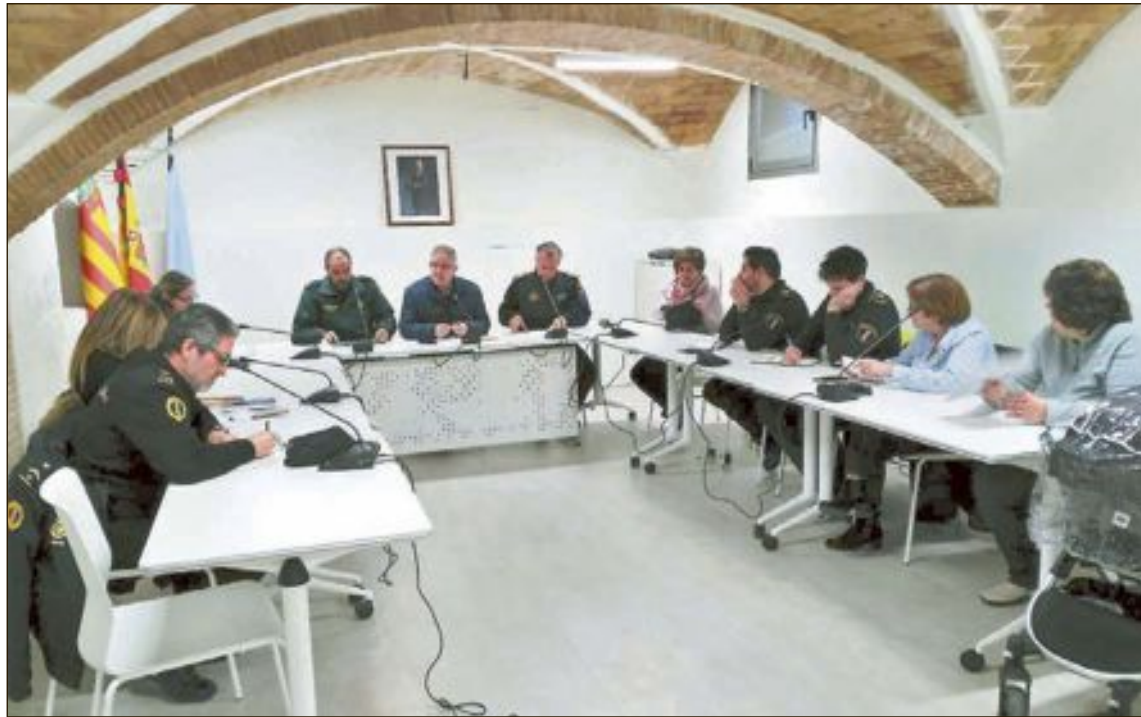
La junta de Seguridad tuvo lugar el martes 14 de enero con la asistencia de representantes de la Policía Local, Policía Nacional, Guardia Civil, Bomberos, Protección Civil y Cruz Roja y representantes políticos