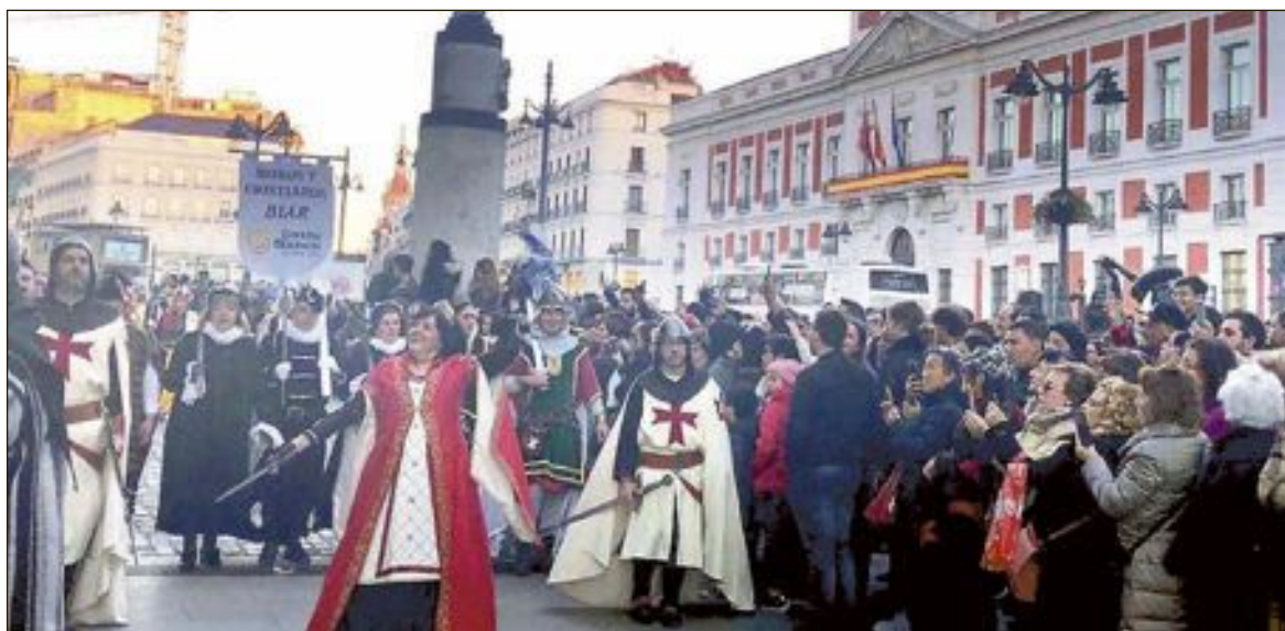
Les esquadres partiran de Callao pel carrer Preciados fins al Palau Reial

La localitat tornarà a desplegar en la fira tota la seua oferta turística i, principalment, el seu gran atractiu com a poble, ja que els seus carrers respiren història, i recórrer-ho és un exercici de volta al passat.