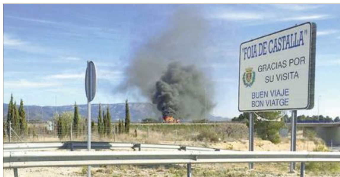
El incidente tuvo lugar el 13 de enero, sobre las 14:15 horas

donde les alertaba de que se había quedado encerrada en su casa. Para realizar el rescate, la patrulla policial solicitó la presencia de una dotación del cuerpo de bomberos de la Diputación que, junto con el camión y una grúa de la brigada municipal de obras, procedieron a rescatar a la mujer a través de la ventana de la galería.