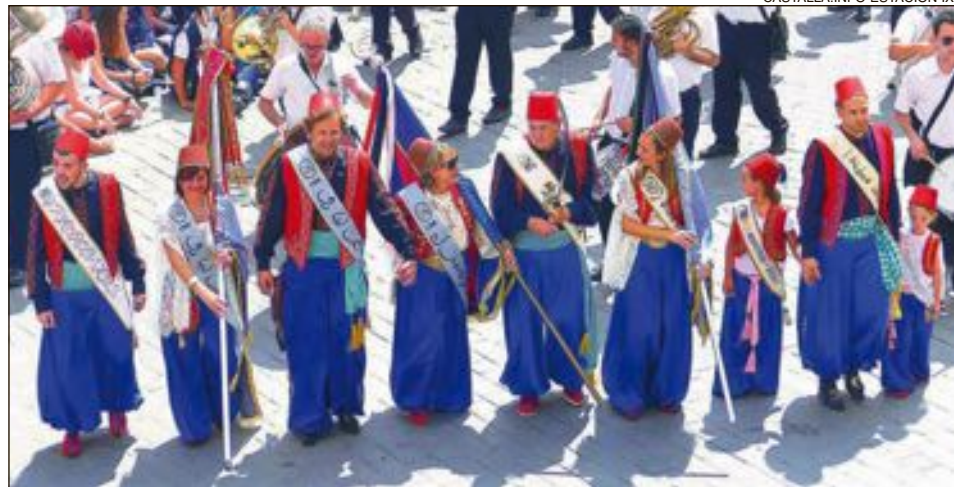
Comparsa Moros Vells: família Poveda-García