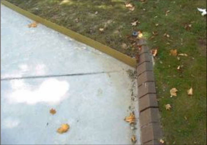
Los socialistas han pedido que se revise si este bordillo con el perfil tan estrecho cumple la normativa y es seguro para los niños