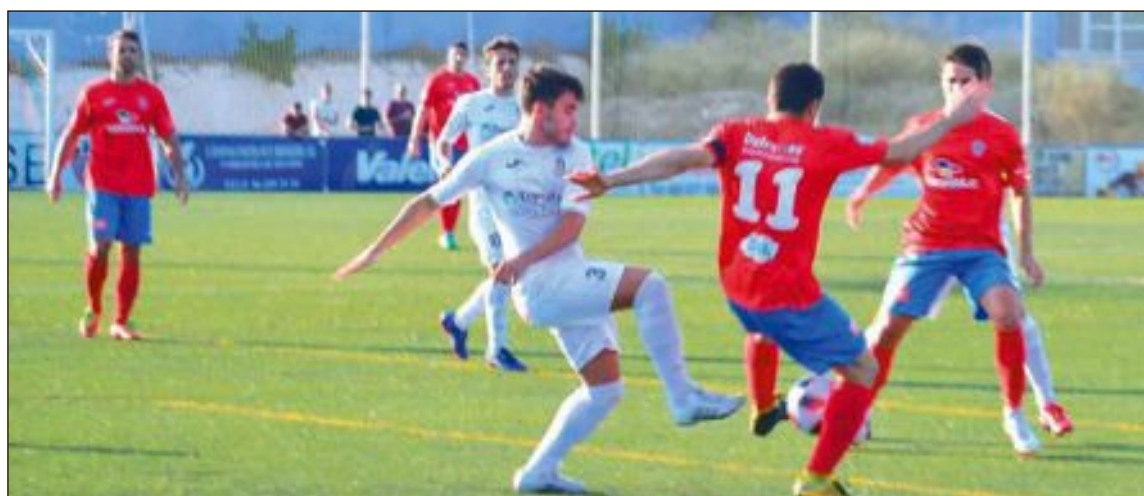
Balón disputado en el centro del campo