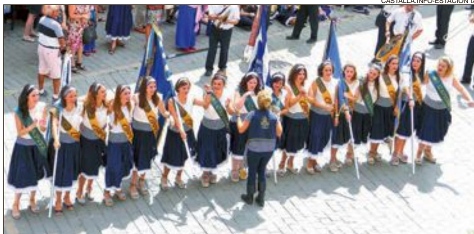
Comparsa Mariners: esquadra 'Les Piules'