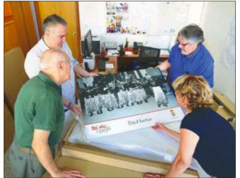
La iniciativa está organizada por la concejalía de Cultura, a propuesta del PSOE, y se expondrán en la plaza la Palla y parque Les Hortes

El Ayuntamiento organizó el viernes 31 de agosto una recepción en el despacho de Alcaldía para despedirle y mostrarle el afecto de toda la ciudadanía, haciéndole entrega de un pin institucional y una figura del monumento de los Reyes Magos. El alcalde, Rafael Serralta, recalcó el reconocimiento de los ibenses tras tantos años ofreciendo consuelo y cariño a muchas familias del municipio y le recordó que en Ibi siempre tendrá su casa.