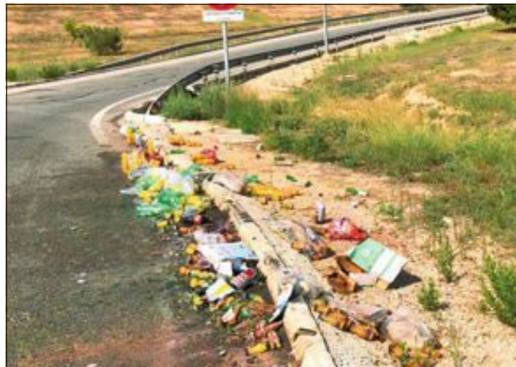
Vertido causado por un camión de reparto en la rotonda de entrada a Ibi

El Ayuntamiento recuerda que la colaboración ciudadana es necesaria para tener un Ibi limpio y que “el comportamiento cívico de cada vecino es la pieza clave para mantener nuestra ciudad con un aspecto limpio y cuidado”.