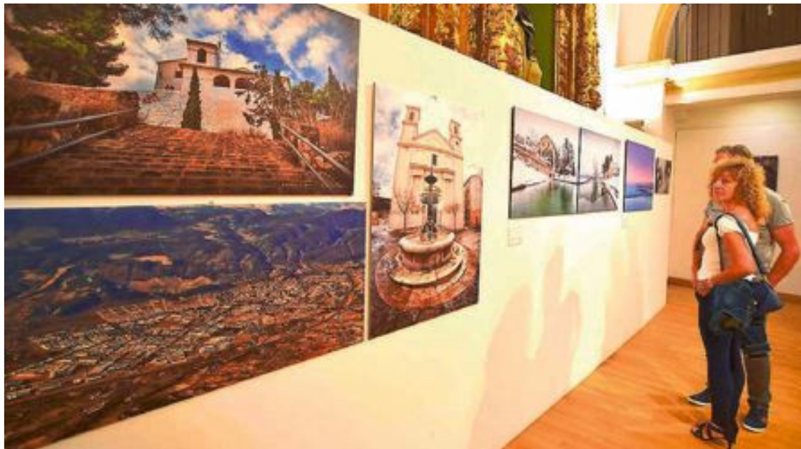
La muestra fue inaugurada el lunes 3 de septiembre en la ermita de San Vicente, de Ibi