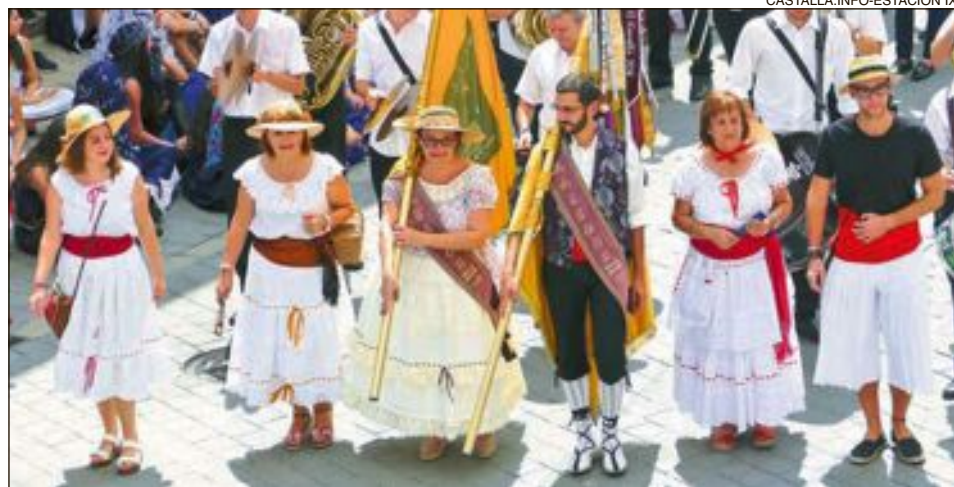
Comparsa Maseros: família Cerdà-González