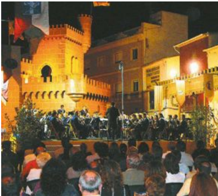
El concierto de la Unión Musical de Ibi comenzará a las 21:30 horas

Los desfiles de les entraetes comienza el 7 de septiembre, con Mozárabes, Cides, Mudéjares y Tuareg. El día 9: Templarios, Maseros, Chumberos y Argelianos. El lunes 10: Contrabandistas y Piratas y el día 12: Guerreros, Almogávares, Beduinos y Almorávides.