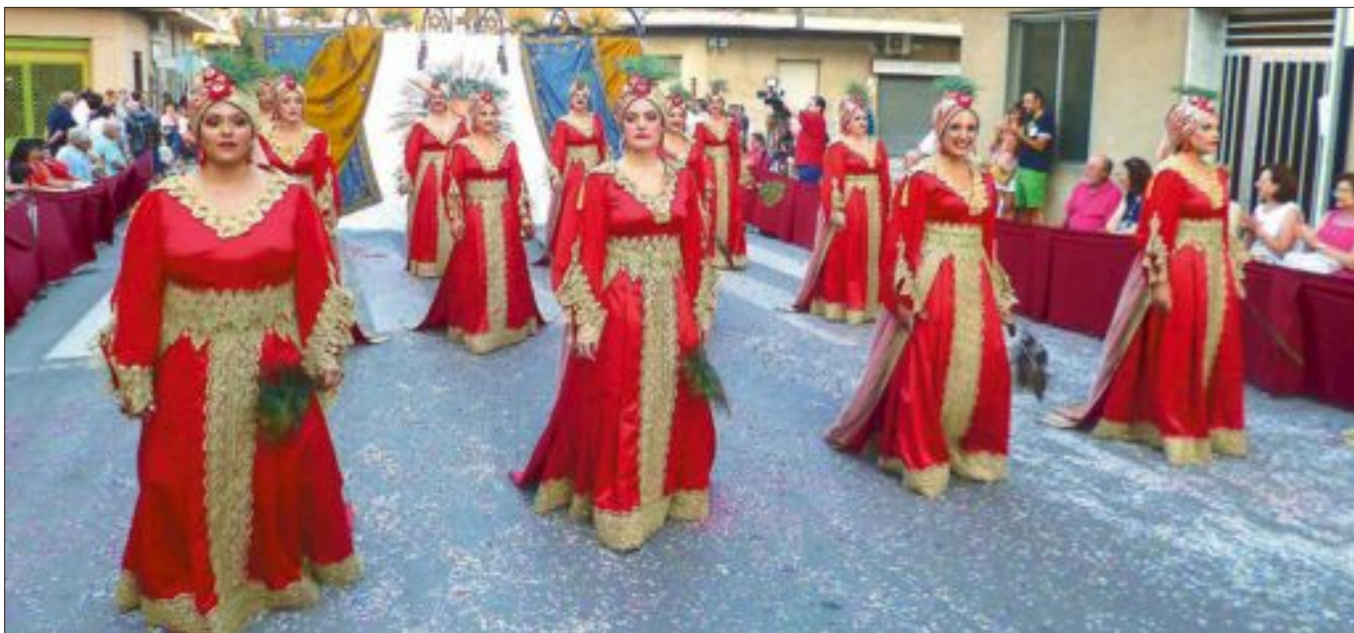
Capitania Moros Vells: esquadra 'Saharais'