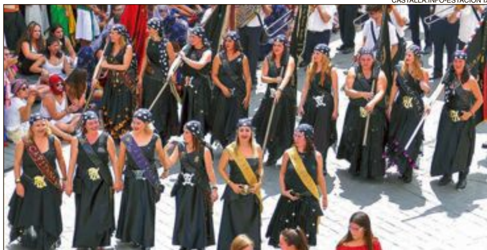
Comparsa Pirates: esquadra 'Tempesta'