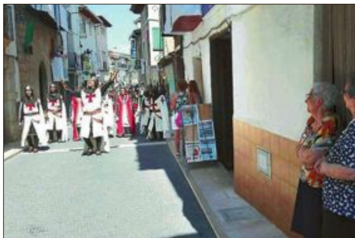
Els veïns de Cincorres van gaudir de l'espectacle fester