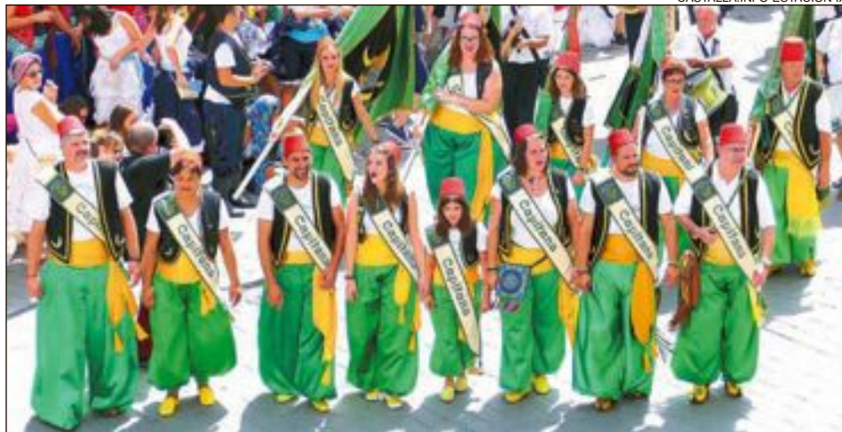
Comparsa Moros Mudéjares: la capitania recau en tota la comparsa