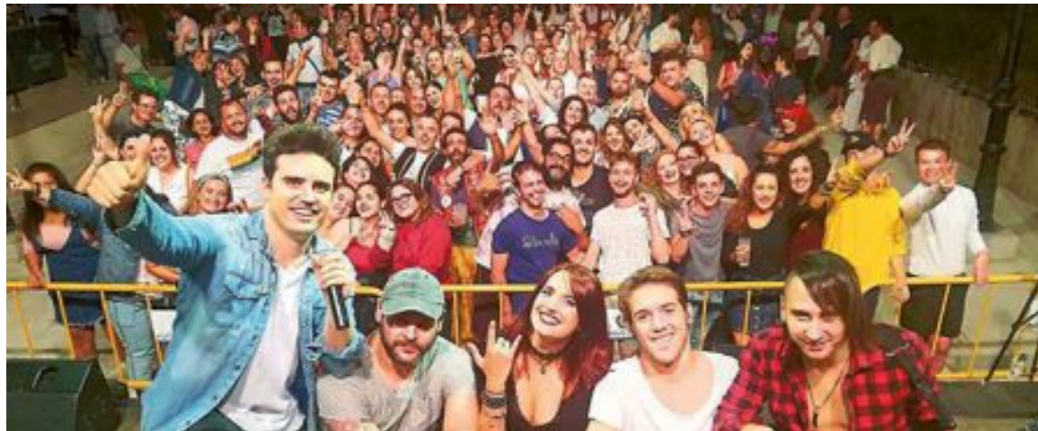
La nit del dilluns 3 de setembre, després de l'Ofrena, l'Orquestra Syberia va oferir una entretinguda actuació