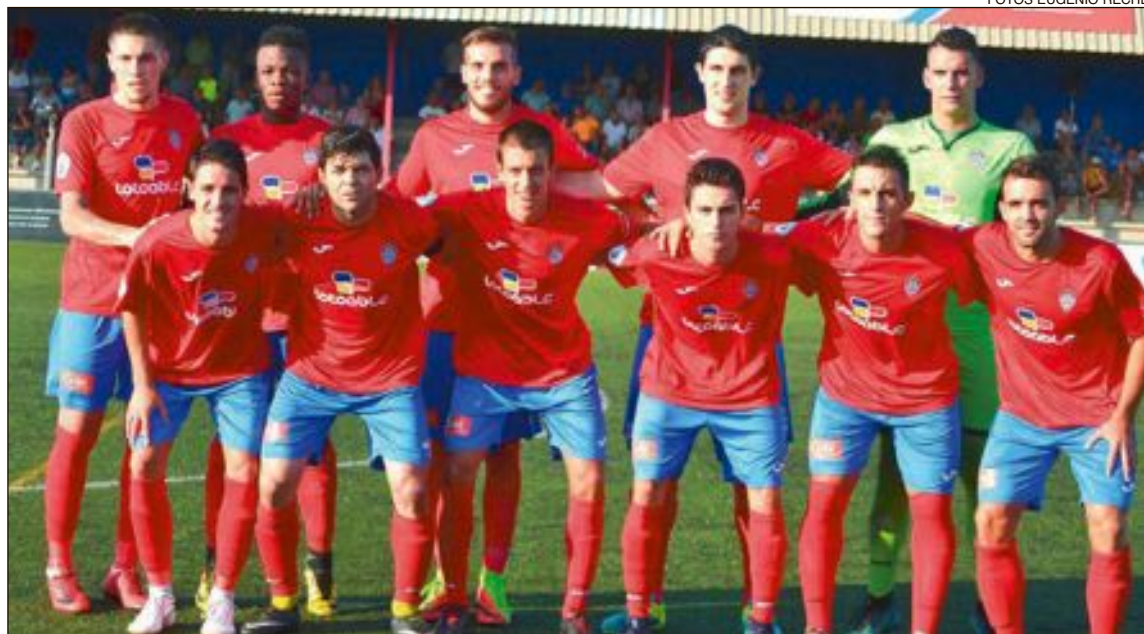
Once titular del Rayo Ibense en el partido disputado el sábado 1 de septiembre contra el Silla CF