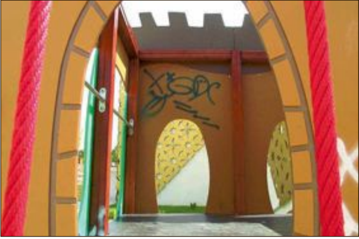
El Ayuntamiento pide la colaboración ciudadana para identificar a los autores de las pintadas en los nuevos juegos infantiles