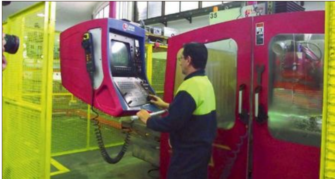
El sector industrial es el que más empleo destruyó en agosto con 180 parados más

La industria ha sido el sector que más empleo ha destruido con 180 parados más, de los cuales 63 estaban en Ibi, 57 en Alcoy, 28 en Castalla y 13 en Onil. En el sector servicios se han destruido 106 empleos, de los cuales 29 han sido en Ibi, 25 en Castalla, 23 en Alcoy y 13 en Onil.