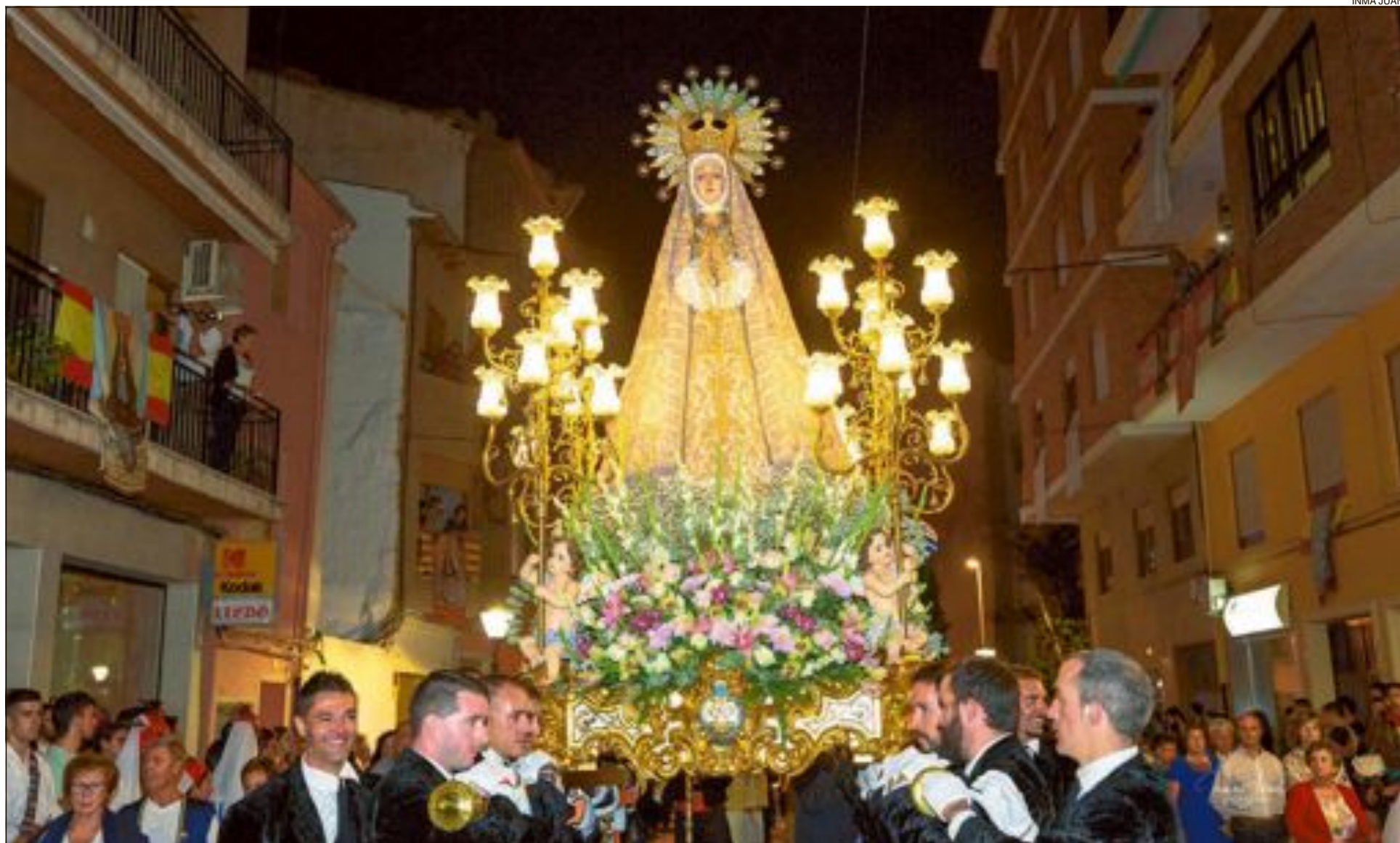
La Mare de Déu de la Soledat Gloriosa, patrona de Castalla, va rebre de nou l'homenatge i el fervor de festers i veïns de l'1 al 4 de setembre