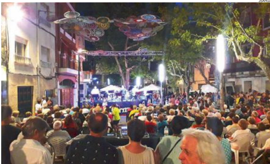
El grupo ibense Fórmula VI actuó el domingo 2 de septiembre en la plaza de la Palla, ante numeroso público

El domingo 2 de septiembre le tocó el turno al grupo local Fórmula VI, logrando también un lleno absoluto y un gran ambiente festivo en la plaza la Palla, donde actuó. Con esta programación, el Ayuntamiento retoma la tradición de los conciertos de Fiestas.