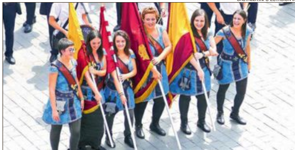
Comparsa Cristians: esquadra 'Pipes Pelaes'