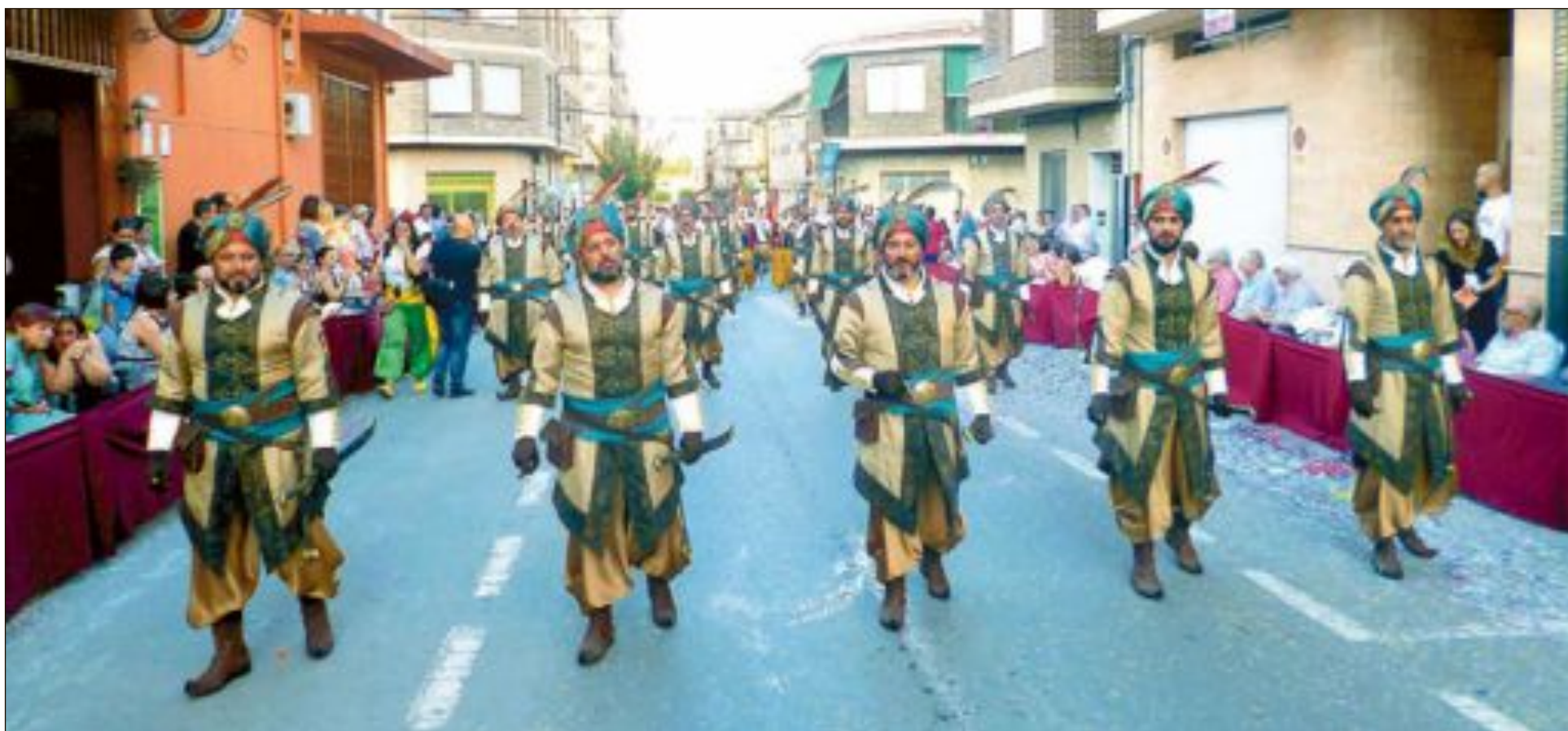
Capitania Moros Grocs: esquadra 'Ali Ben Bufat'