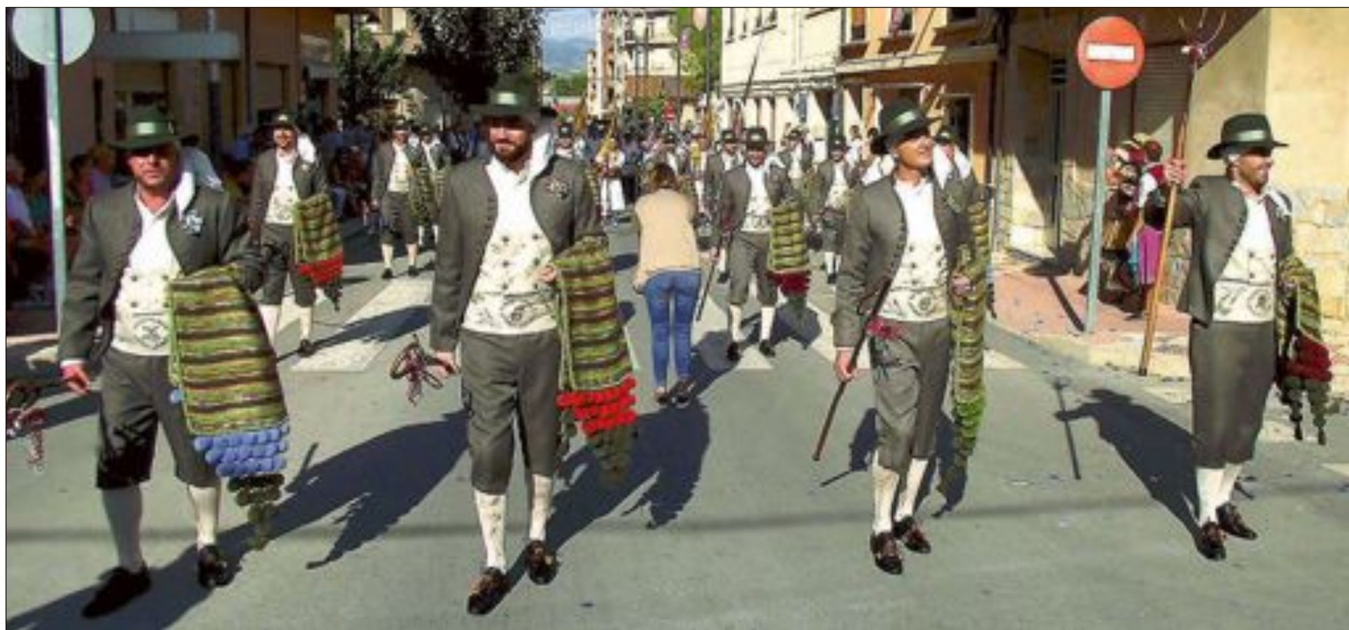
Capitania Maseros: esquadra 'Alça que arrastra'