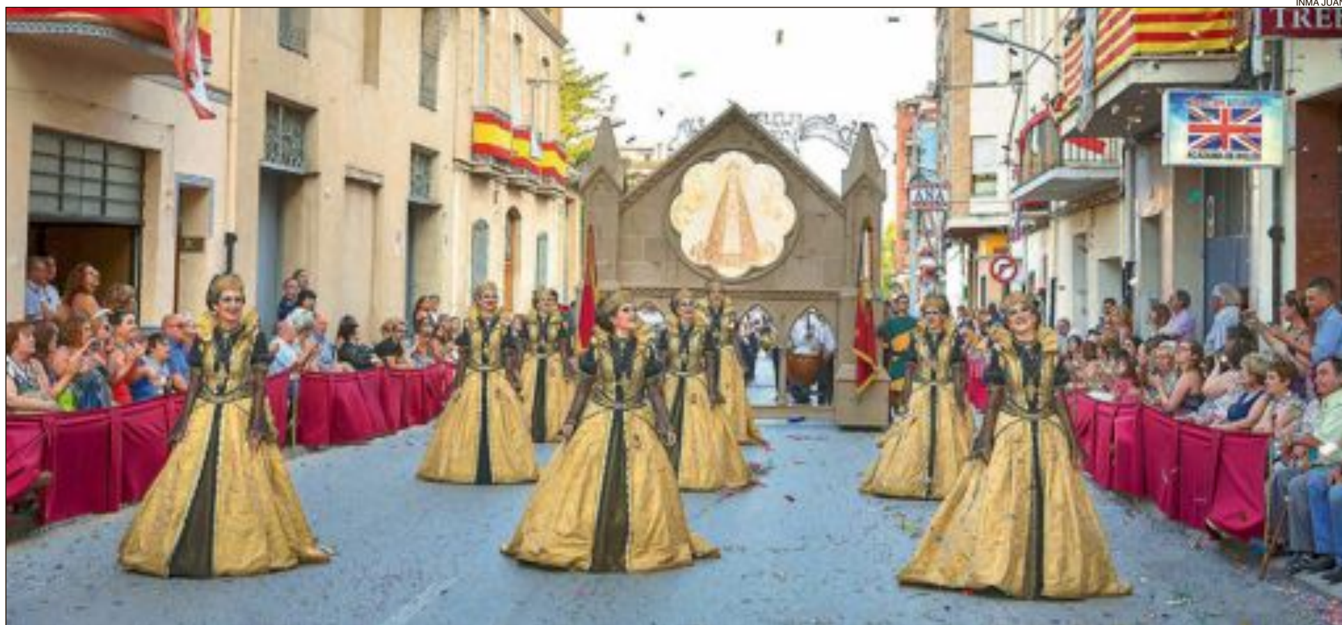
Capitania Cristians: esquadra 'Creïlles al pilot'