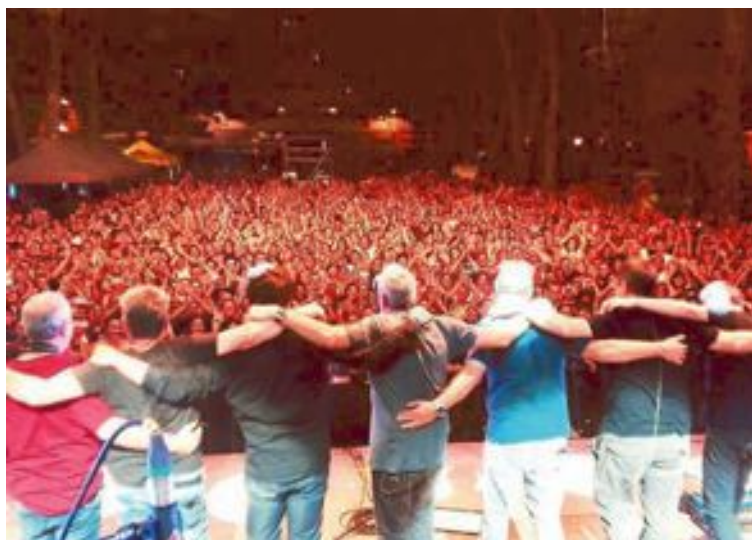
El grupo Space Elephants (a la izquierda) y Hombres G consiguieron un lleno absoluto de público en los conciertos de la Glorieta de España