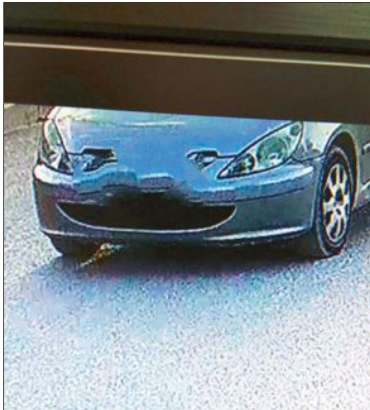
Imagen del vehículo tras ser captado por las cámaras de control de tráfico

La mujer, muy conocida en Ibi por su vinculación con los colectivos de Cáritas, fue abandonada cerca del restaurante Las Gemelas, de Finca Terol, donde recibió las primeras atenciones de auxilio, ya que se encontraba muy aturrida. El conductor llegó hasta ese lugar por la carretera que une Ibi con Tibi, entrando a la urbanización por la parte alta y siendo grabado por las cáma-