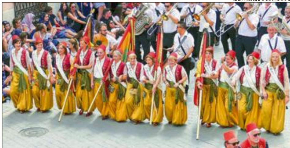
Comparsa Moros Grocs: esquadra 'Odaliques'