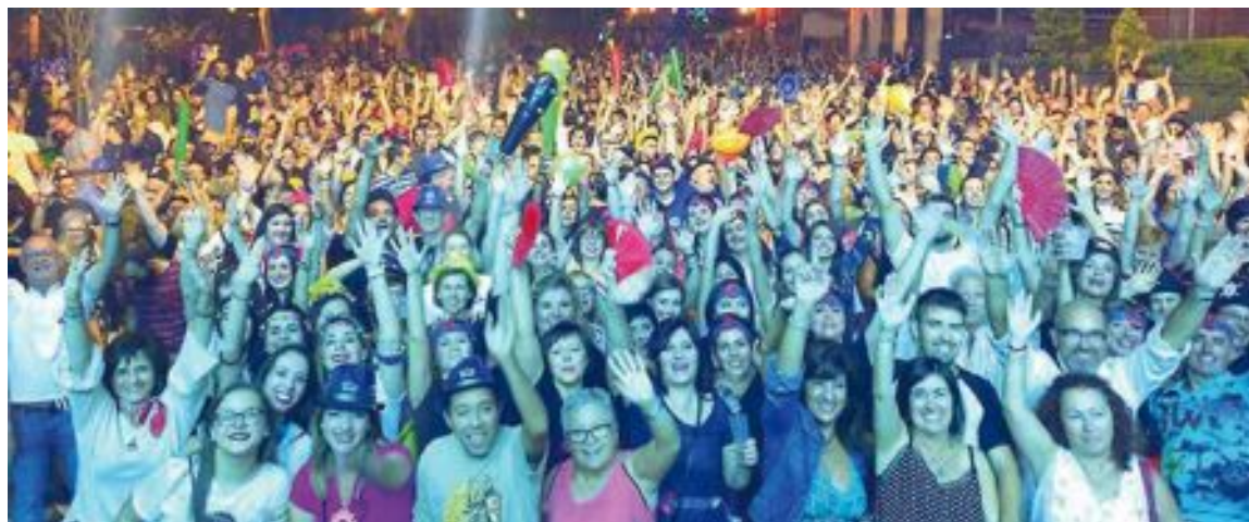
El divendres 31 d'agost, després de l'Olleta, va actuar l'Orquestra Montecarlo, que va plenar de gom a gom el Parc