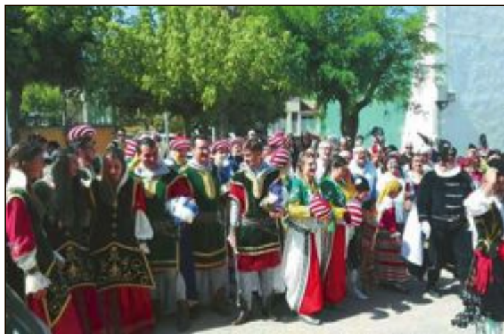
Una representació de totes les comparses va participar en les festes

Cincorres és un municipi de només 516 habitants i celebra les seues festes durant l'última setmana d'agost. Té en comú amb la localitat de Biar que estan dedicades a la Mare de Déu de Gràcia i un dels seus actes més importants són la processó del fanal, les novenes, els bous de carrer i les revetles al saló de festes.