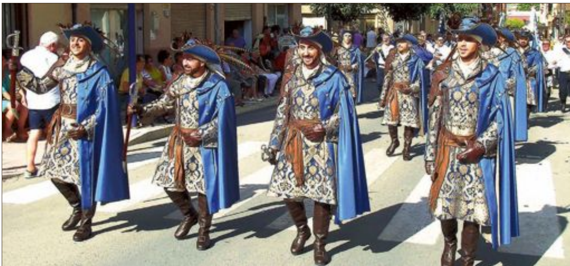
Capitania Mariners: esquadra 'Xupla la gamba'