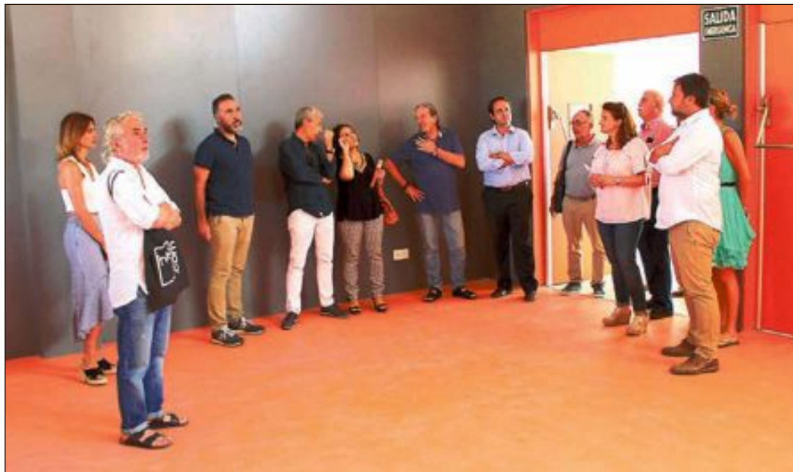
La directora territorial de Educación, Virtudes Torró, y el alcalde, Rafael Serralta visitaron el 31 de agosto el centro, junto a los ediles de Educación y Urbanismo, el director del colegio y técnicos de Conselleria y del Ayuntamiento

El proyecto tuvo un presupuesto de licitación de 3.757.230 euros y a los 5.934 metros cuadrados ya construidos se les han añadido otros 2.298 metros de obra nueva. Es actuación ha permitido solucionar los problemas de accesibilidad, mejorar la habitabilidad del centro, remodelar las aulas y crear otras nuevas, al igual que los aseos. La nueva infraestructura permitirá un considerable ahorro de energía, al haberse renovado toda la carpintería de puertas y ventanas. Además, el Ayuntamiento ha ejecutado en los últimos meses diversas actuaciones,