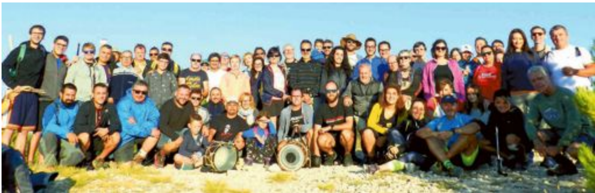
El Centre Cultural Castellut, l'Associació Cultural El Teix d'Ibi i l'Ateneu Cultural Republicà de Petrer, entre altres entitats, van celebrar, el dimecres 22 d'agost, des d'abans d'eixir el sol, un homenatge a l'escriptor castellut Enric Valor en el seu aniversari, en el cim de l'Alt de Guisop