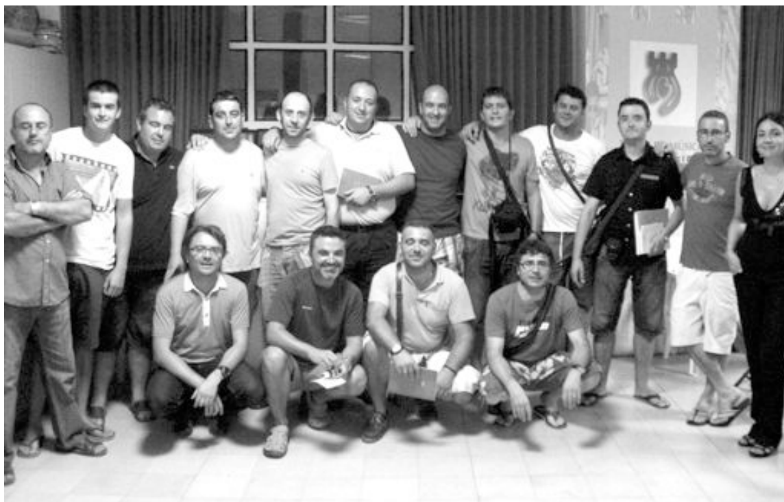
Miembros del grupo de música junto a los componentes de la escuadra chumbera que encargó la pieza