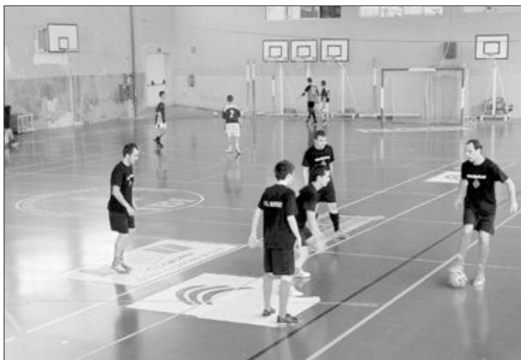
Partido de pretemporada de la Unión Deportiva Ibense contra el Castalla

Por otro lado, el jueves 2 de septiembre por la noche estaba previsto celebrar la votación para elegir al nuevo equipo directivo del Club de Fútbol Sala Ibense, tras la reciente dimisión del anterior presiden-