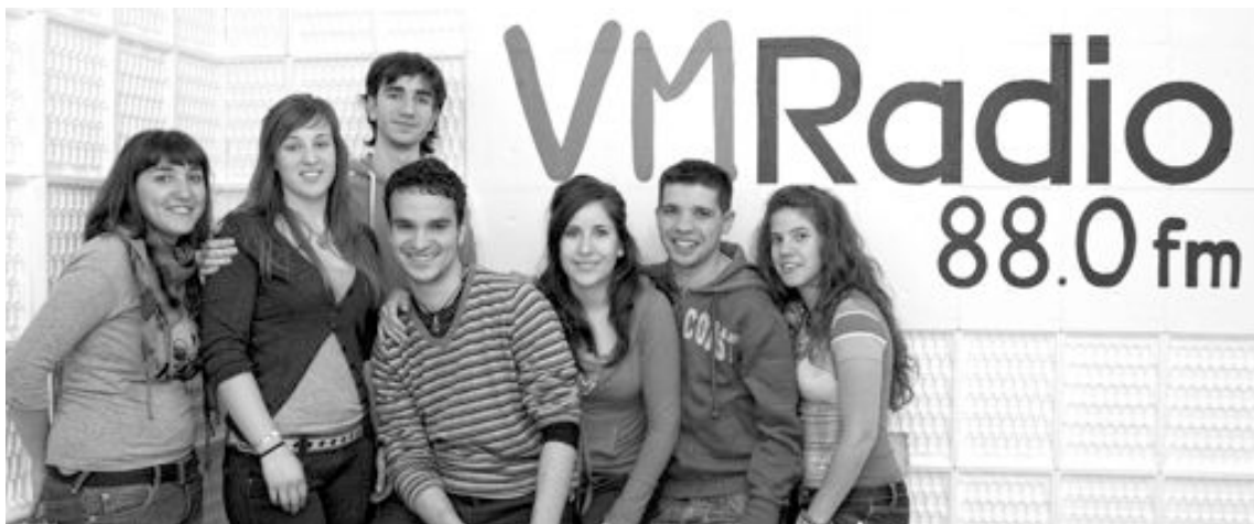
Parte del equipo de la joven emisora ibense VM Radio

El viernes día 10, un nutrido grupo de locutores cubrirá en directo la entrada cristiana, a partir de las 10:45 horas de la