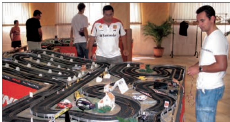
El Open de Slot se celebró en el local de la comparsa Tuareg de Ibi. Sobre esta línea, los tramos 1 y 6 y algunos participantes