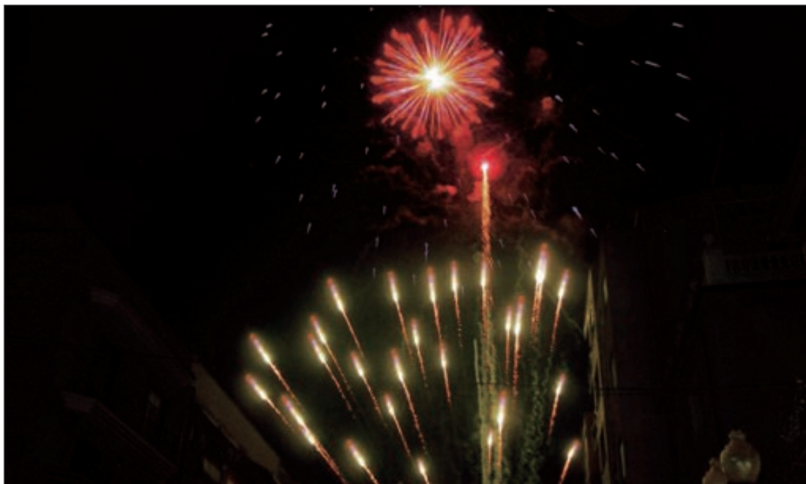
Antes del encendido oficial del alumbrado se disparó un luminoso castillo de fuegos artificiales

El presupuesto del alumbrado, que incluye la iluminación de verbenas, Navidad y fiestas de barrio, es de 100.000 euros