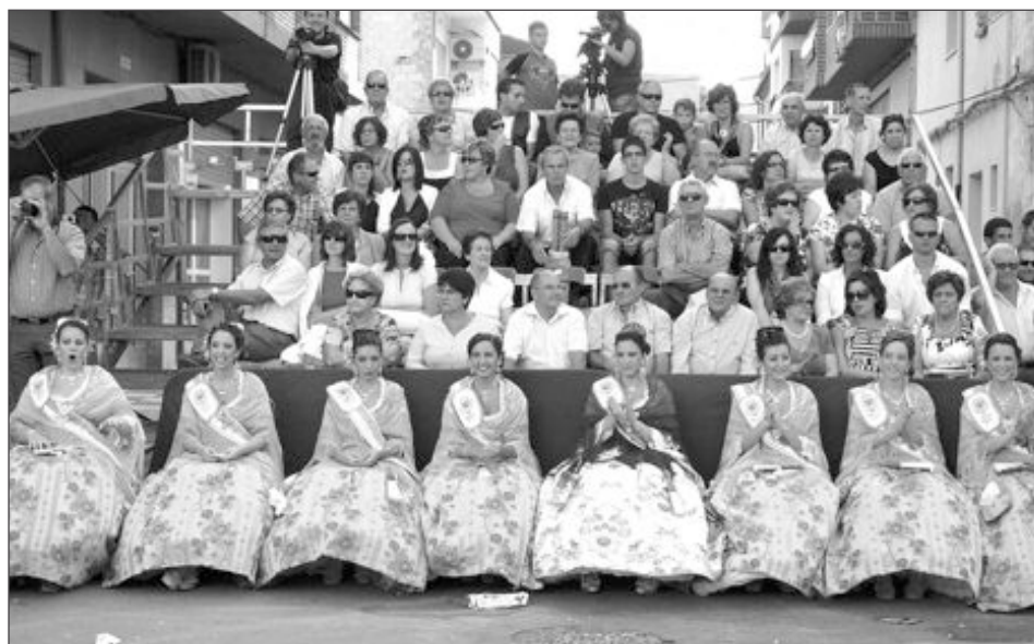
La Reina y las damas de honor presenciaron la Entrada desde un lugar privilegiado