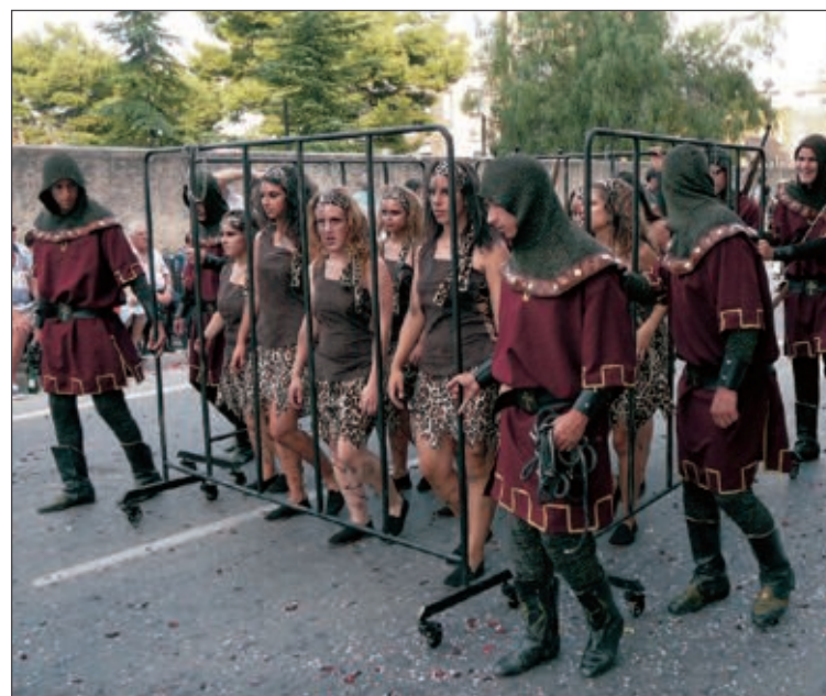
Un ballet del boato de la comparsa Cristians