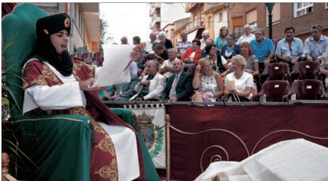
El embajador de la Media Luna Mora anuncia la derrota cristiana ante la tribuna de autoridades (Moros Grocs)