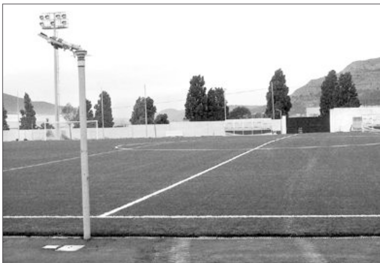
El campo de fútbol contará con dos actuaciones del Plan Confianza. A la derecha, solar donde se construirá el edificio multiusos