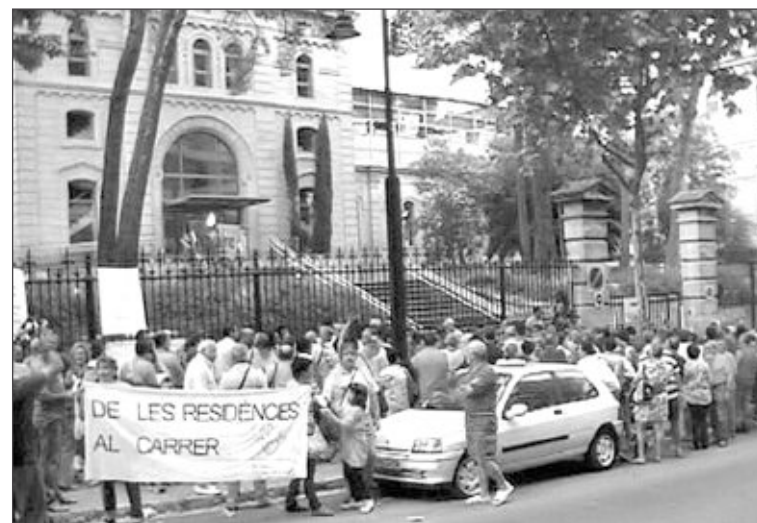
Las concentraciones se llevaron a cabo en Alcoy y Cocentaina

La Plataforma espera que los contratos de concertación con las empresas no se firmen, de manera provisional, para tres meses, como se ha anunciado, sino que se hagan por un tiempo suficientemente largo que garantice la seguridad de los dependientes.