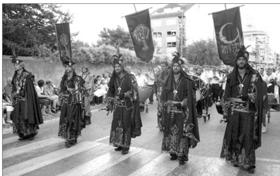
Comparsa Moros Vells