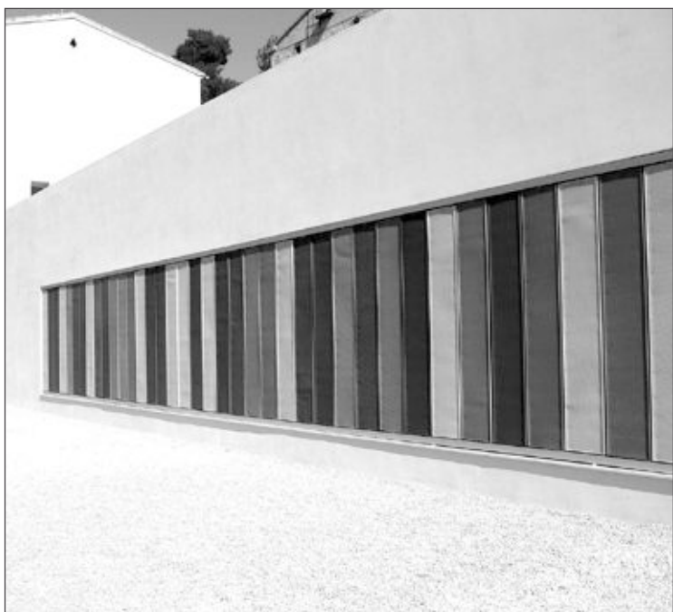
Nuevo edificio de la escuela infantil pública