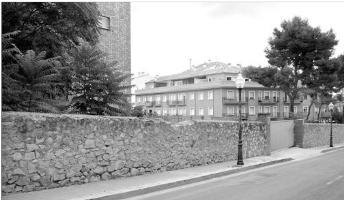
Solar de la calle Santiago Rico Molina donde se ubicará este año la carpa popular

Para ello, se ha contratado a Cadena 100 que traerá el espectáculo la noche del sábado 11 de septiembre. Además de buena música, está previsto