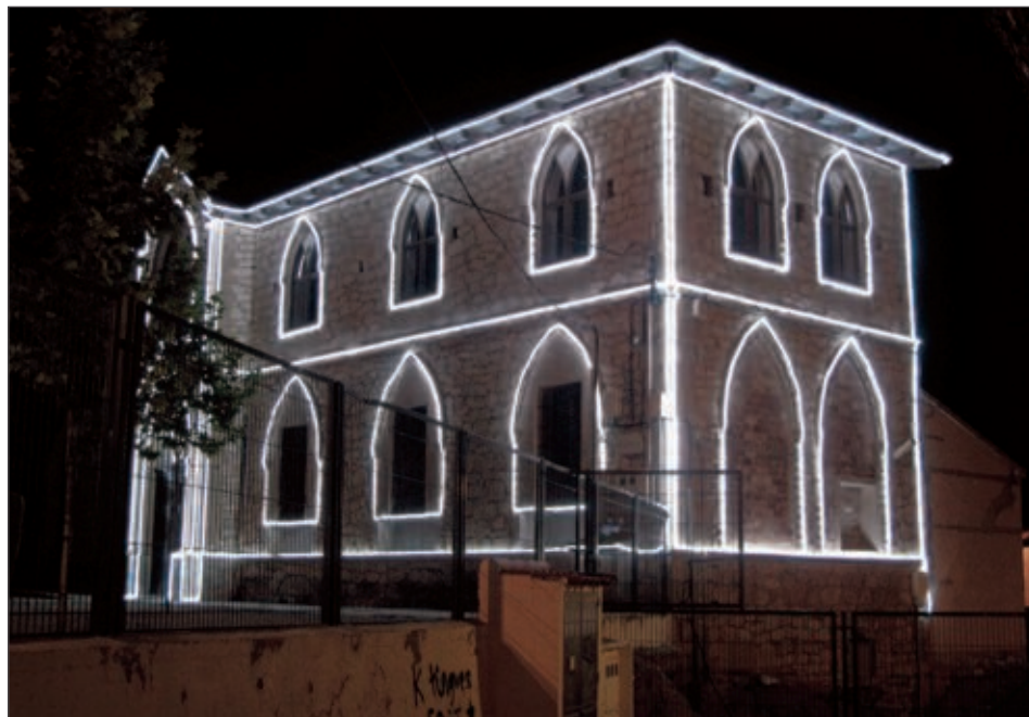
Nueva decoración de la fachada del edificio del Patronato

Cientos de personas asisten al encendido de las luces, el primer día de Novena