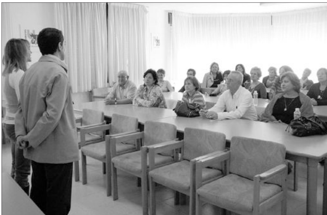
Las clases se imparten en el Centro Social Polivalente de Ibi

cambian conocimientos que “nos hacen crecer más allá de las aulas”.