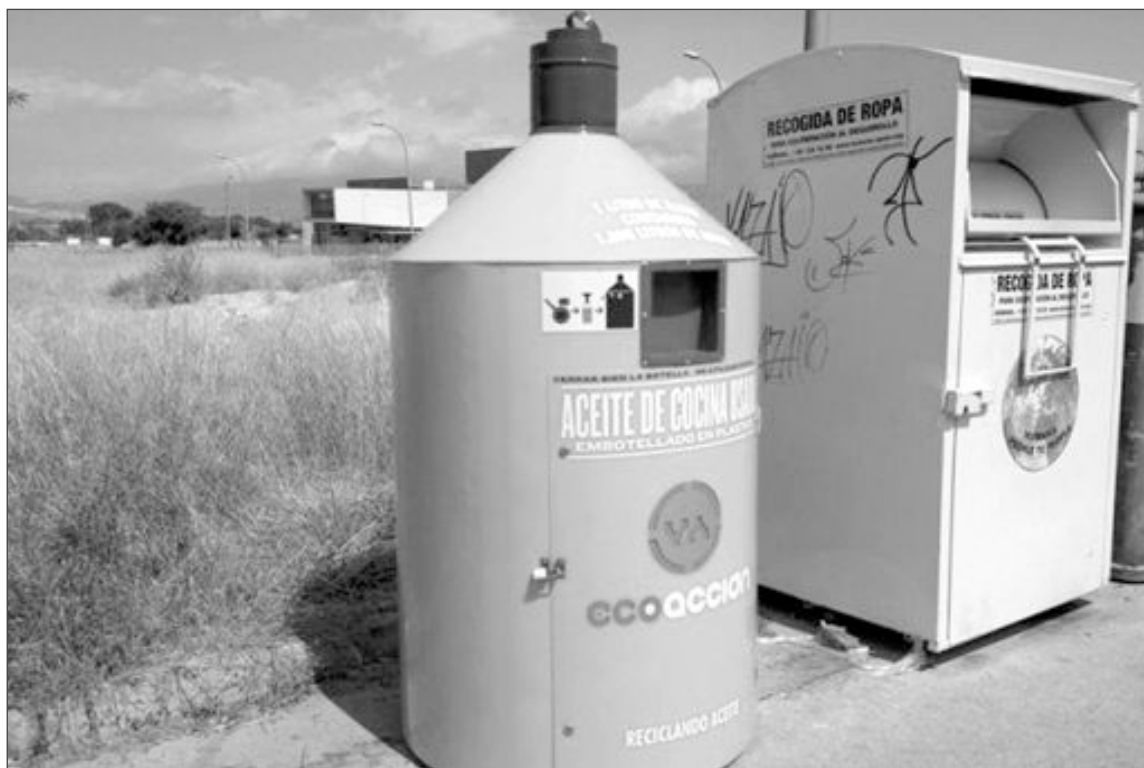
Uno de los contenedores de aceite vegetal usado se encuentra en los alrededores del colegio Rico Sapena

La Junta de Gobierno Local del 23 de agosto aprobó la adjudicación a la empresa AUSA Center SLU el suministro de una barredora dúmp , por un importe de 40.356 euros. La nueva máquina reforzará el servicio de limpieza viaria.