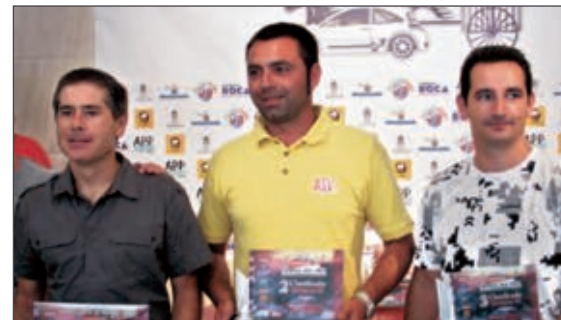
Podio Grupo N