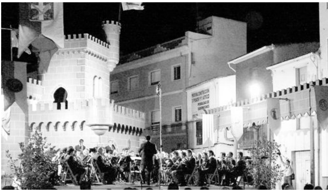
El Concierto de Fiestas se celebra el 7 de septiembre a las 21,30 horas en la calle Les Eres, frente al Castillo