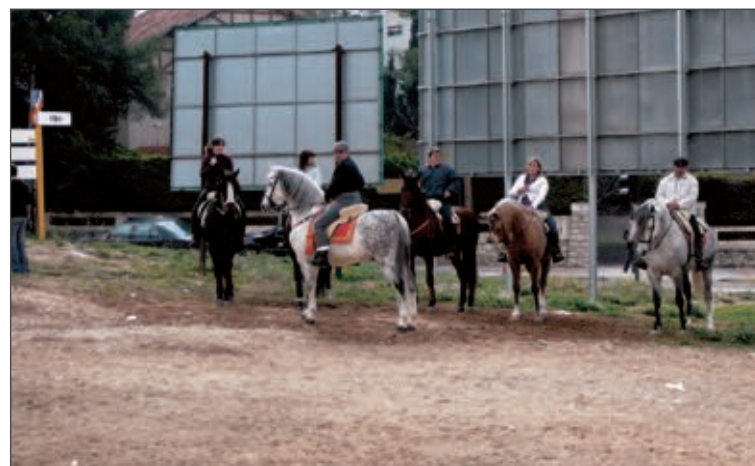
El solar está situado en la calle Les Eres, frente a la gasolinera

su uso, se procederá al desbrozado del terreno para facilitar el acceso de los coches, que de manera temporal y sólo durante la duración de los días de fiestas (del 10 al 12 de septiembre) podrán estacionarse en este lugar.