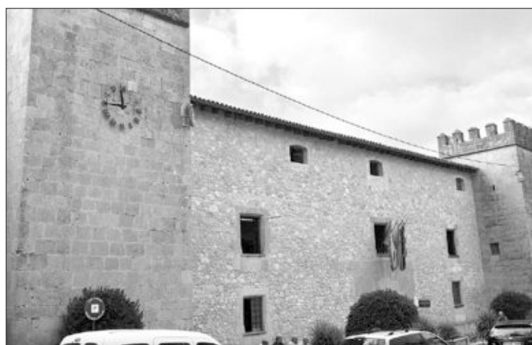
Palacio del marqués de Dos Aguas (Ayuntamiento de Onil)

miento ha adjudicado a la Unión Temporal de Empresas (UTE) ADD4U-Gobernalia Global Net el 'suministro para la implantación de la Ley 11/2007 de 22 de junio, de acceso electrónico de los ciudadanos'. El importe de adjudicación es de 121.000 euros (IVA incluido). Este contrato finalizará el 31 de diciembre.