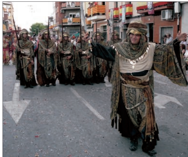
Comparsa Moros Grocs