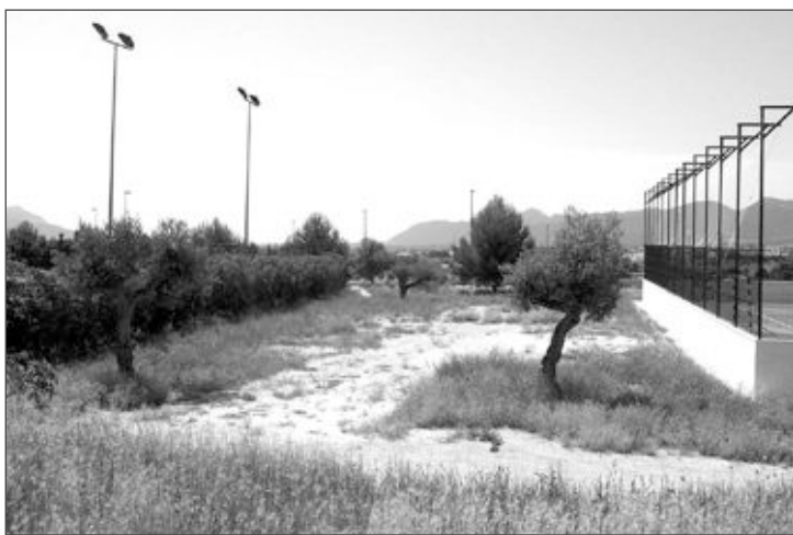
En este solar de la zona deportiva se construirá una pista de tenis

Las obras de la nueva pista de tenis, más dos de pádel, en la zona deportiva, comenzarán a partir del lunes 6 de septiembre, una vez hayan finalizado las Fiestas de Moros y Cristianos de Castalla, puesto que la empresa constructora, Dopema, es de esta localidad, informan fuentes municipales.