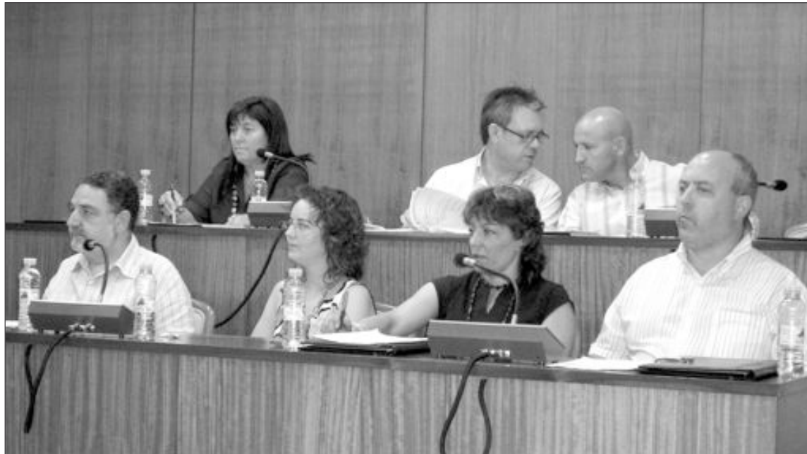
Los grupos socialista y Esquerra Unida en una sesión plenaria

Los grupos de izquierda fundamentan su recurso en motivos tanto de forma como de fondo. Por una parte, entienden que el silencio que guarda el plan respecto a las cuentas