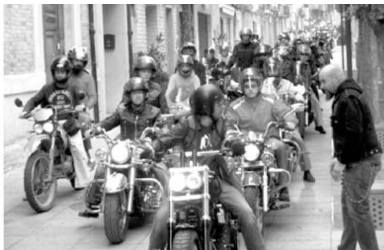
La primera edición de la Matinal Motera Javibi fue un gran éxito

El precio del almuerzo y el resto de actividades: 8 euros.