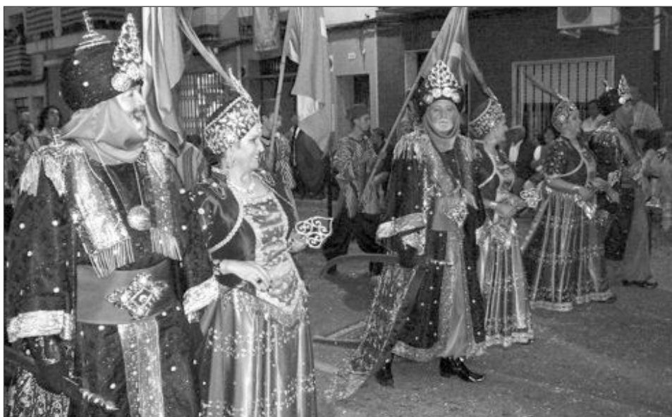
Comparsa Moros Mudéjares