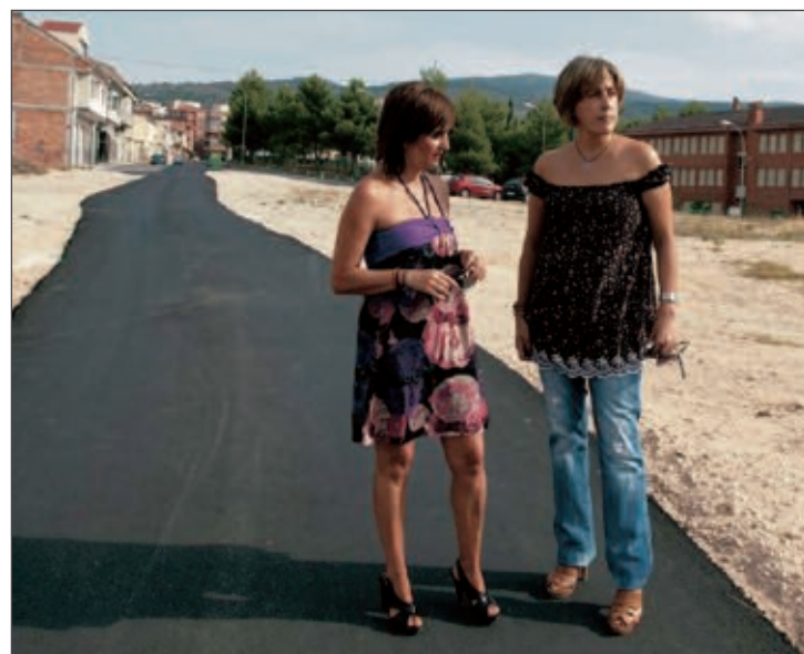
Una de las obras ha consistido en asfaltar un camino de tierra

Este domingo 5 de septiembre tendrá lugar la inauguración de la rotonda que estará dedicada a la figura del fundador de la Obra Salesiana, Don Bosco. En la base de la imagen se colocará el monumento, financiado por los salesianos y la Diputación y con la colaboración del Ayuntamiento.