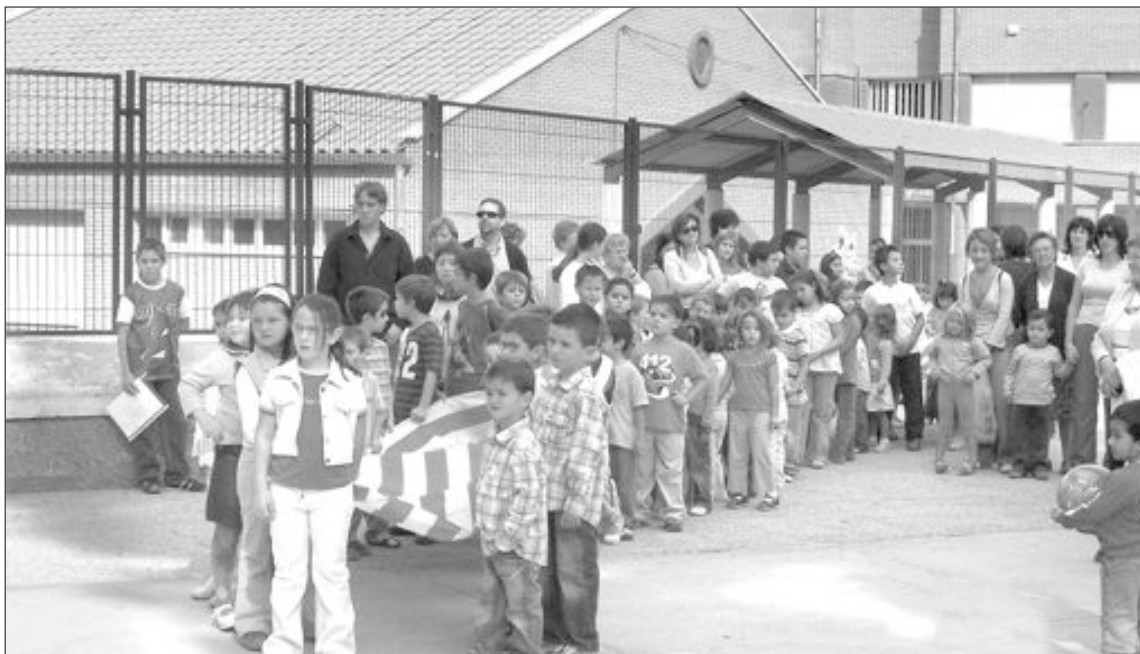
El 14 de septiembre comenzará el curso escolar con 2.192 alumnos matriculados

Escolarización no tuvo ningún problema el jueves 2 de septiembre en otorgar plaza a los catorce alumnos que han cursado la solicitud fuera de plazo y en atender las dos peticiones de cambio de cen-