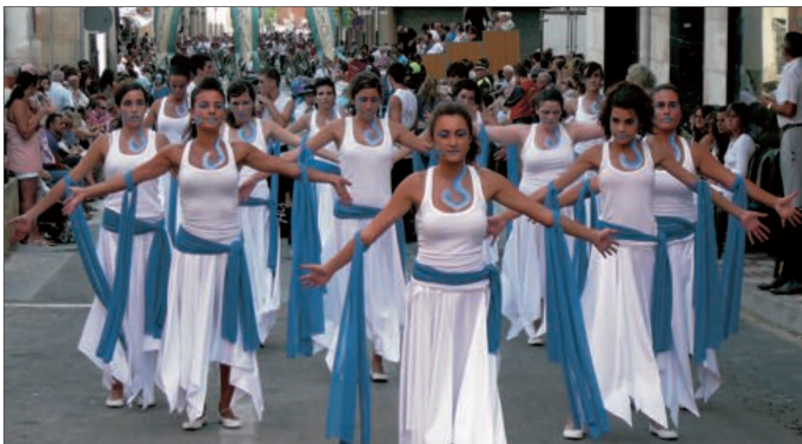
Un ballet abrió el boato de la comparsa Mariners