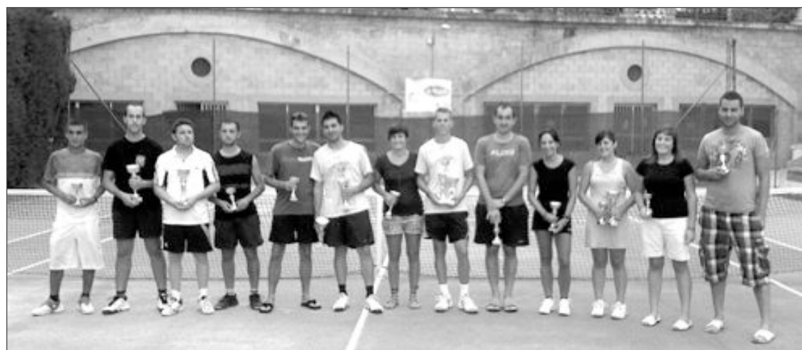
Campeones de las 24 Horas de Tenis Dobles de Onil

Inscripciones hasta el viernes 3 de septiembre llamando al 686.10.58.41.