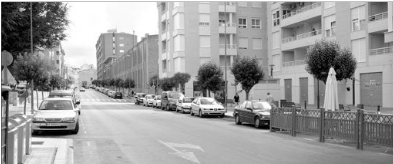
La segunda fase de las obras en la avenida de La Paz ha sido adjudicada provisionalmente a la empresa Riegosa

Las empresa constructoras han ofrecido una serie de mejoras que no han trascendido por el momento.