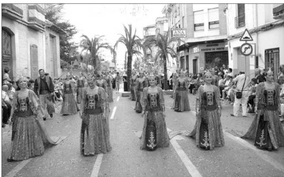
Comparsa Moros Grocs