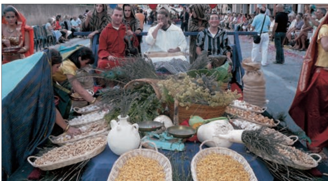
Los sones del violín, el arpa moruna y la darbuka acompañaron el boato de los Moros Vells