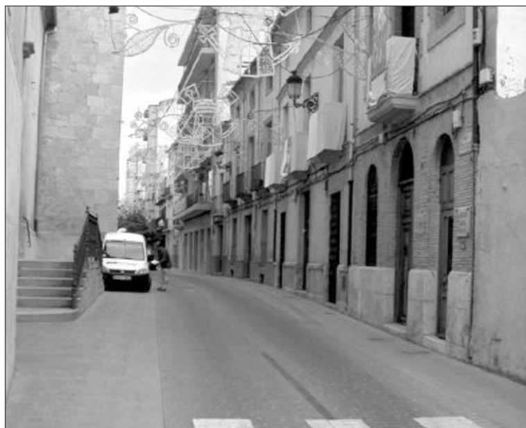
Nuevo aspecto de la calle Les Eres tras las obras

La carpa popular abrirá a partir del viernes y a las 22 horas. La asociación confía en el éxito de esta iniciativa con la que pretenden completar la oferta de ocio que ofrecen a los ciudadanos las Fiestas Patronales.