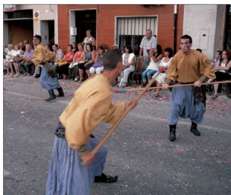
Luchadores en el boato de la comparsa Moros Vells