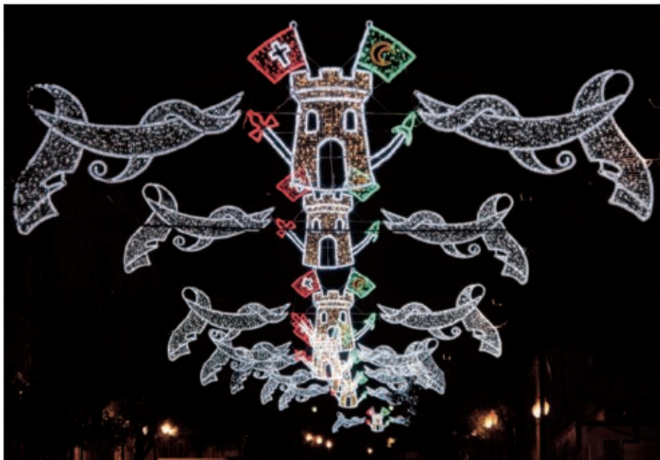
Nuevo alumbrado extraordinario de Fiestas