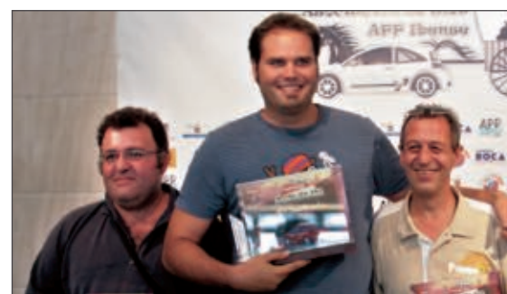
Podio Grupo A