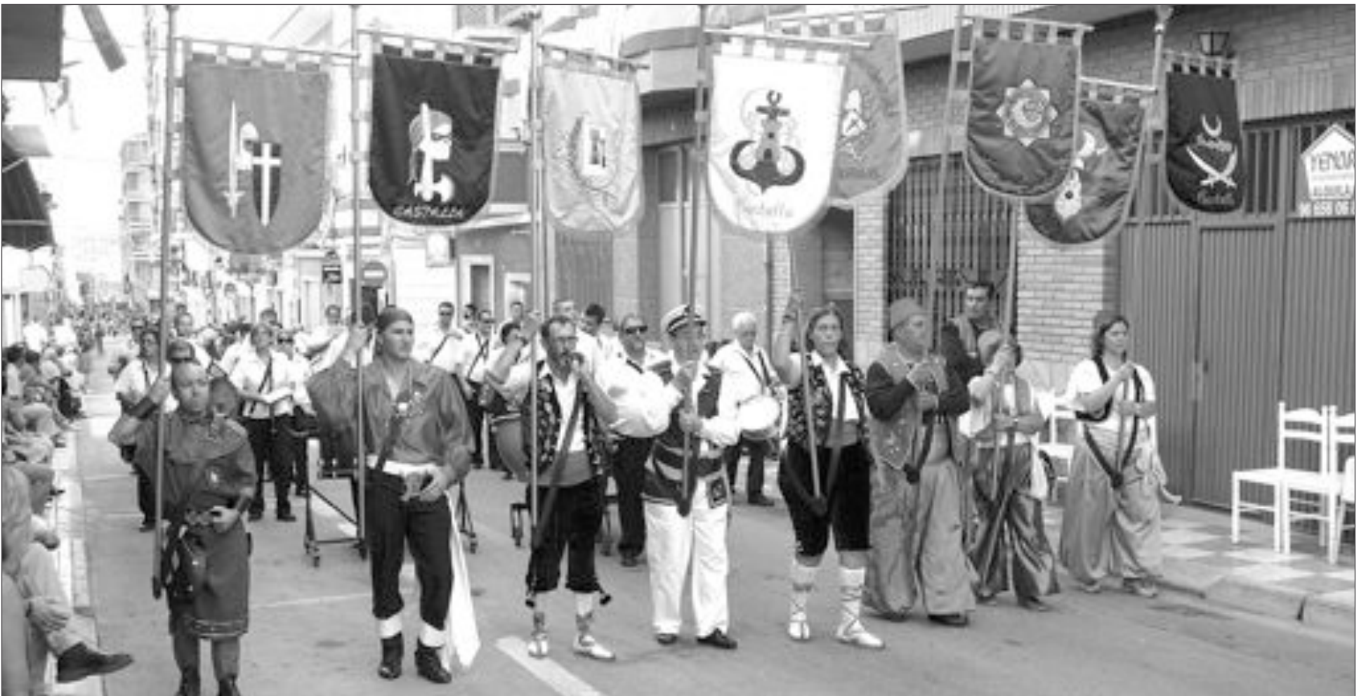
Los estandartes de las siete comparsas abrieron la Entrada de Moros y Cristianos