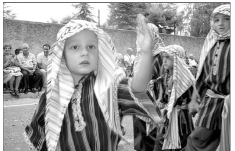
Un jovencísimo cabo de escuadra de la comparsa Moros Grocs