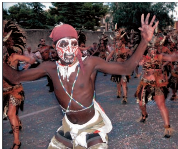
El grupo 'El color del movimiento' abrió el boato de los Moros Mudéjares