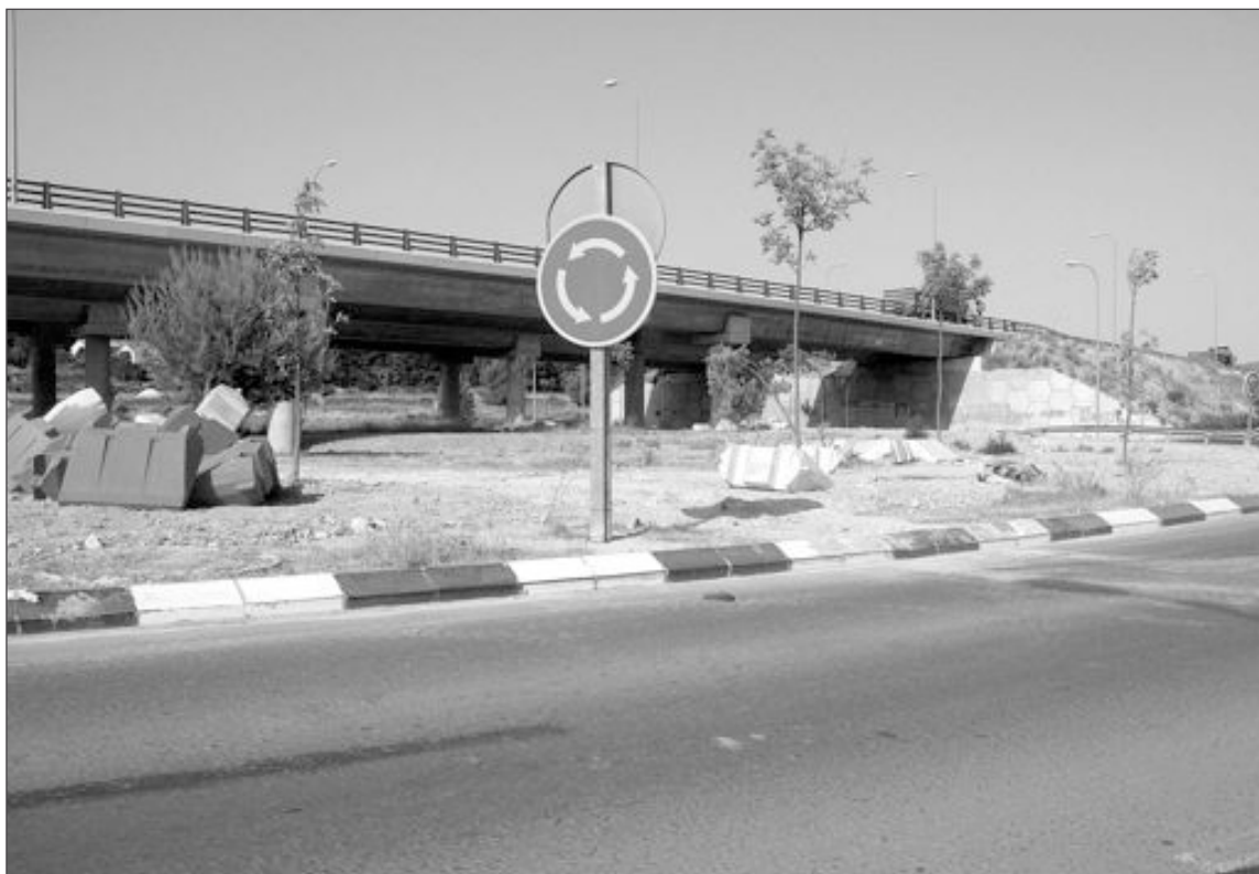
El Río Verde pasa bajo la rotonda de la carretera entre Castalla y Onil

El acondicionamiento del Río Verde va desde la Marjal de Onil hasta la depuradora de Castalla, pasando por debajo de la rotonda que une ambos municipios. En total, cerca de tres kilómetros de canalización con el objetivo de evitar inundaciones en épocas lluviosas.