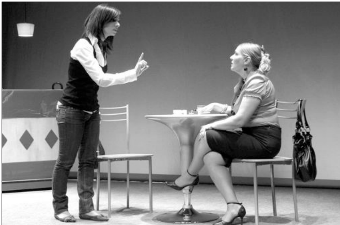
Un momento de la obra 'Mentiras'

Tables Teatre nace en Onil en el año 2005 y hasta la fecha ha realizado diversos montajes, donde destaca su versión de la obra 'La criadas' y ésta, 'Mentiras', comedia con la que el grupo colivenc obtuvo el premio a la mejor interpretación femenina en el Festival de Teatro de Madrid y fue seleccionado en el Festival de Teatro de Torrelavega (Cantabria) y en la Mostra de Teatre de Torrent, donde obtuvo una mención especial.