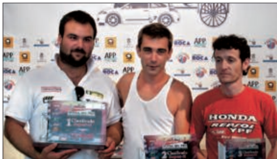
Podio Grupo Súper N