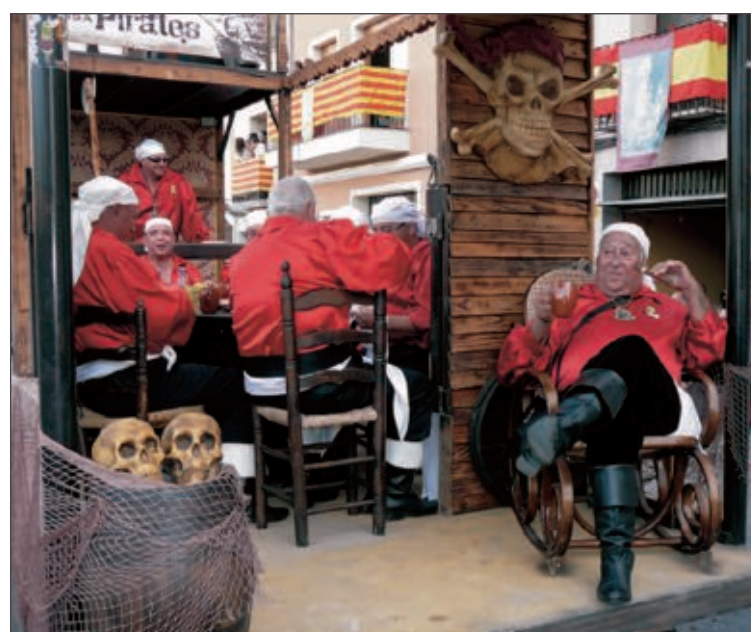
Carroza con los fundadores de la comparsa Pirates