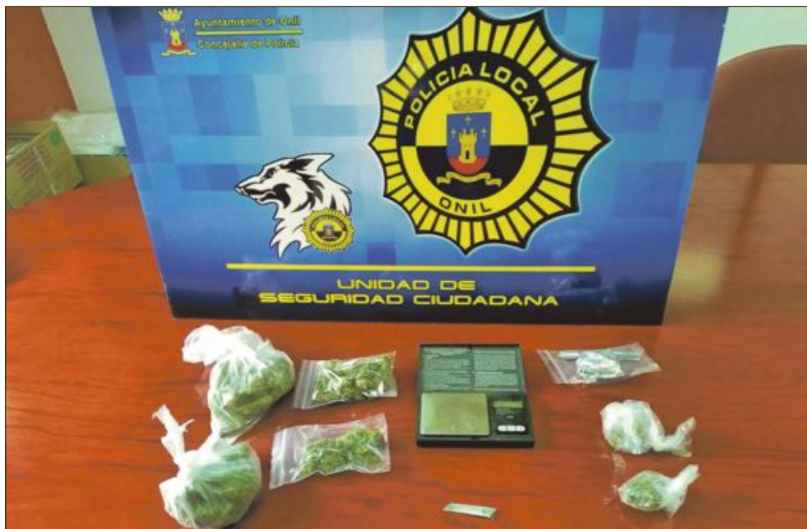
La Policía Local de Onil ha decomisado varias dosis de estupefacientes durante los controles

De las 37 denuncias impuestas, 22 han sido relacionados con la normativa anti covid. En el informe de la Policía Local, se han reflejado “no portar mascarilla o su mal uso, fumar sin respetar la distancia de seguridad y saltarse el toque de queda”.