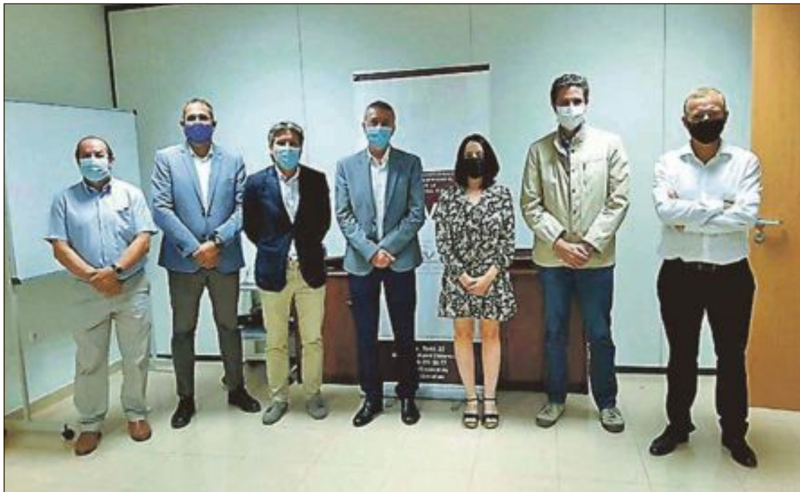
Miembros de la Plataforma en una reunión celebrada en octubre con el conseller de Economía

Los empresarios, de hecho, piensan que se debería fomentar con el apoyo de las administraciones la creación de empresas auxiliares de proveedores en el territorio, situación que aseguraría el flujo de estos productos pero que además serviría para generar riqueza y puestos de tra-