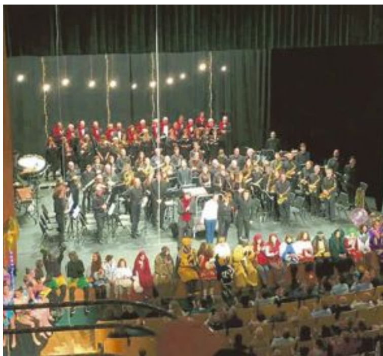
El concierto estará interpretado por la Unión Musical de Ibi