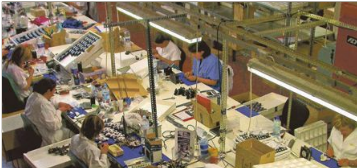
En noviembre descendió el desempleo femenino en 18 parados menos, mientras que el masculino lo hizo en 64

Aunque por otro, alerta de la fragilidad endémica de nuestro mercado laboral. En España, "la pandemia nos ha revelado, con toda crudeza, que la sociedad creada durante los años de la crisis y que se mantuvo intacta en los años de la recuperación