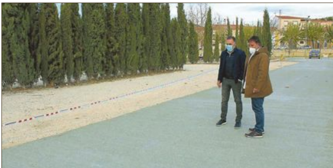
El alcalde y el concejal de Urbanismo en el nuevo tramo asfaltado de la vereda