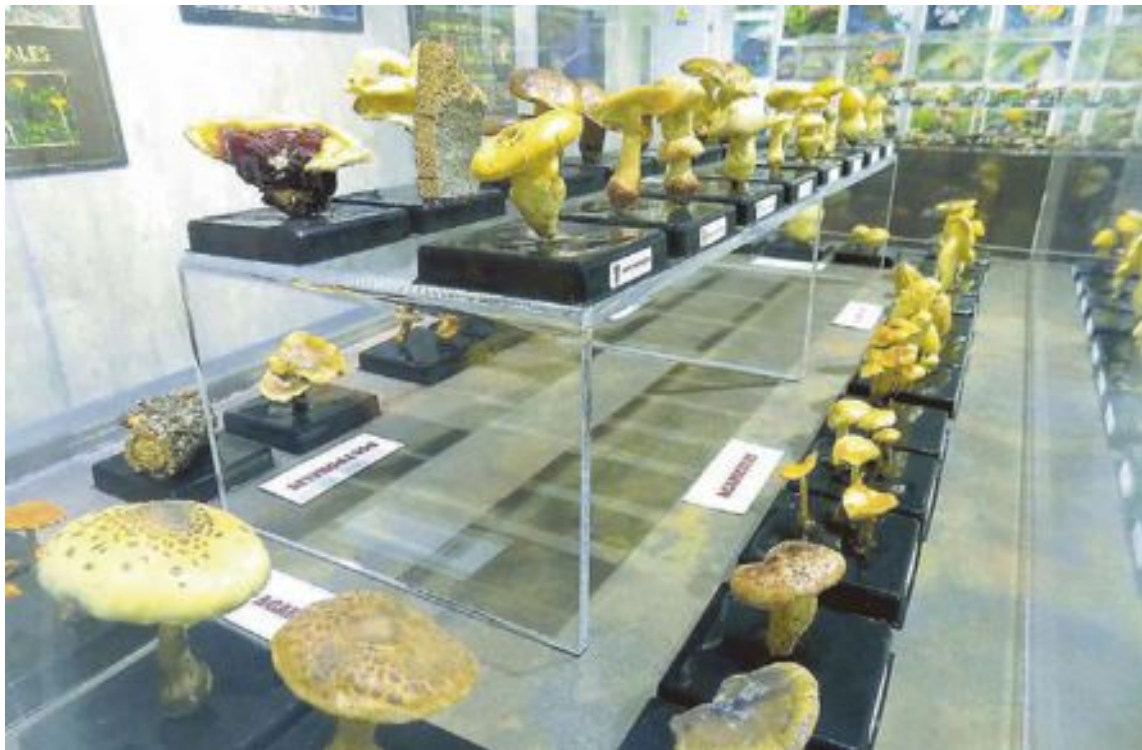
Exposición de las Jornadas Micológicas de 2019 en el Museo de la Biodiversidad de Ibi

La sede universitaria de Alicante se encuentra ubicada en un palacete de finales del siglo XIX, que se ha transformado para adaptarse a las nuevas necesidades, pero conservando sus elementos estructurales básicos.