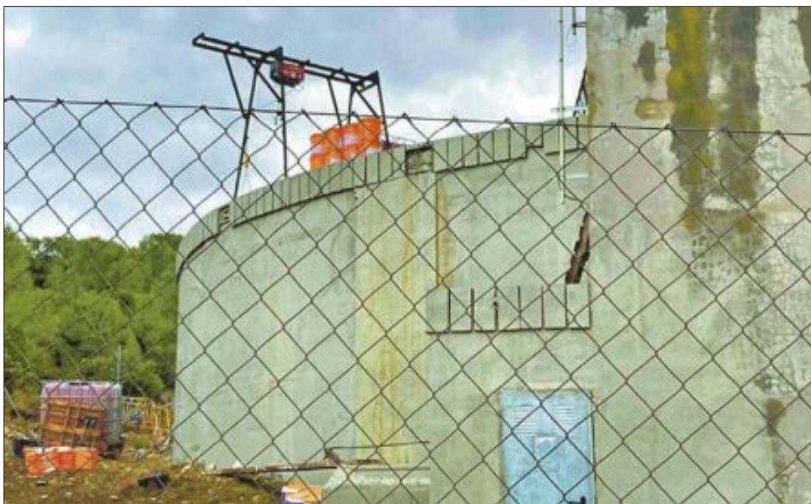
Depòsit de les lloletes de la Marededeu