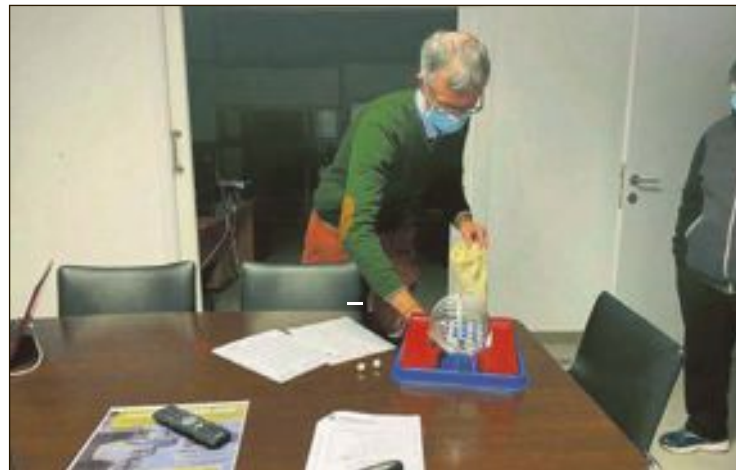
El sorteo fue realizado en las dependencias del Ayuntamiento de Onil

Paralelamente a la actividad del huerto urbano, se va a iniciar en el mismo lugar un pro-