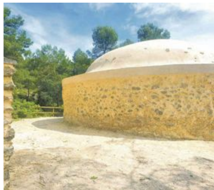
El pou del Barber ha sido restaurado recientemente

Ofrecerá dos actuaciones, a las 18 y a las 21 horas. Las entradas ya se pueden comprar.