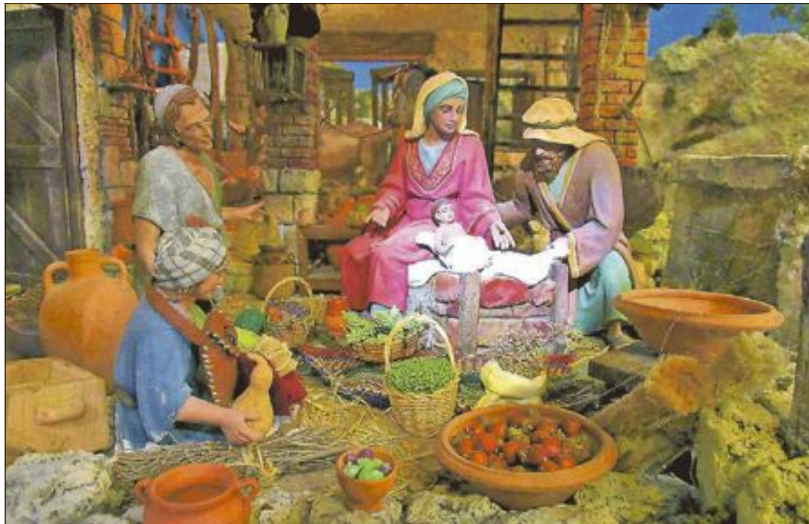
El premi del concurs consistirà en un naixement de 25 centímetres

El Grup Betlemista hi ha remés un comunicat a través de les seues xarxes socials on anuncia que enguany no realitzaran la tradicional exposició del