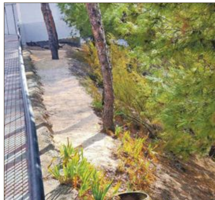
S'han realitzant labors de neteja en la zona de l'Ancornia, Castillo de Tibi, carrer Olivar Bogaret i en l'avinguda Foia