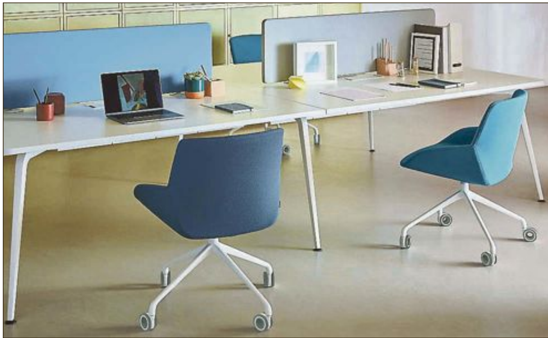
Algunas de sus propuestas incorporan un tejido realizado a partir de plástico reciclado

Además, Actiu ha desarrollado una guía para diseñar y equipar los espacios de trabajo en el hogar, adaptándolos a los estilos decorativos que son tendencia y favoreciendo la conectividad, concentración y salud. Entre ellos se encuentra el estilo mediterráneo, con una combinación de colores donde el blanco se contrarresta con toques de colores vibrantes como el azul y el amarillo.