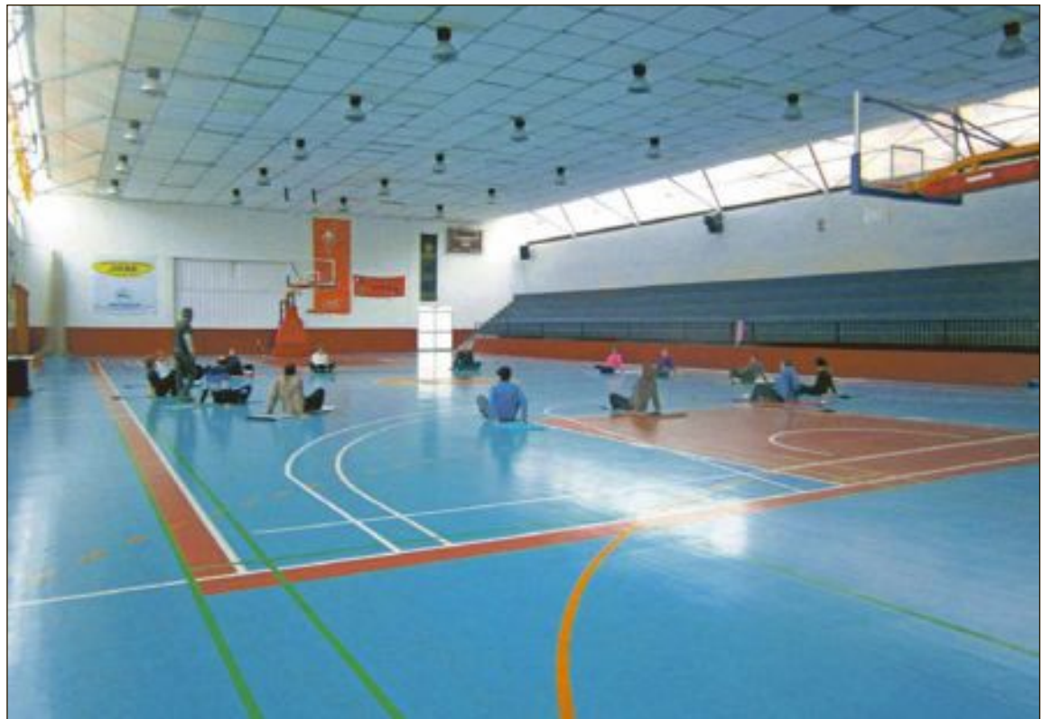
Las autoridades locales recomiendan la práctica deportiva al aire libre, evitando lugares cerrados y poco ventilados

El Ayuntamiento de Onil destaca la necesidad de “la realización de actividades de forma individualizada y sin contacto con la higiene adecuada, con mascarilla, manteniendo siempre la distancia de seguridad y evitando siempre aglomeraciones.