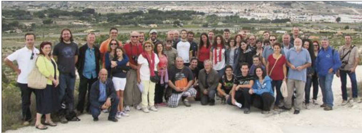
Participantes en el seminario visitaron el domingo 29 de septiembre diversos escenarios de las Batallas de Castalla

No puedo acabar este apartado sin reconocer la ayuda y colaboración de Rafael Zurita, profesor en la Universidad de Alicante y codirector del seminario, por el trabajo hecho, que se ha traduci-