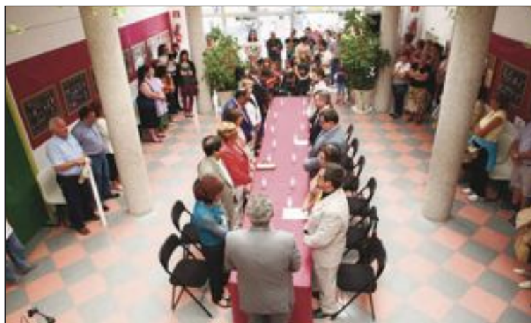
La Casa de Cultura albergó la celebración de un Pleno extraordinario