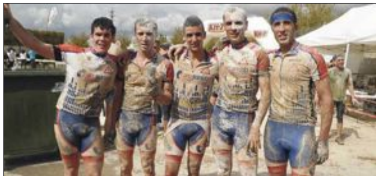
El Club Ciclista Tibi-AM Sonido consiguió el premio al mejor equipo de entre cinco y nueve participantes y colocó a tres de sus miembros entre los diez primeros clasificados de la General