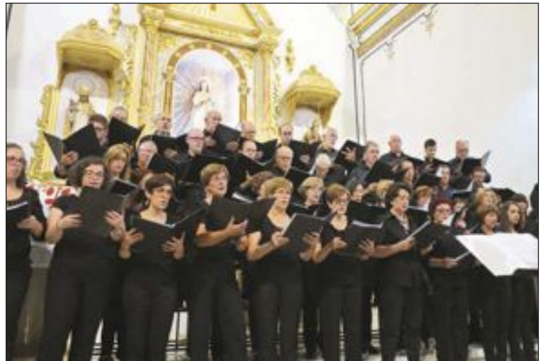
Coral Polifónica 'Cristóbal Pastor' d'Onil