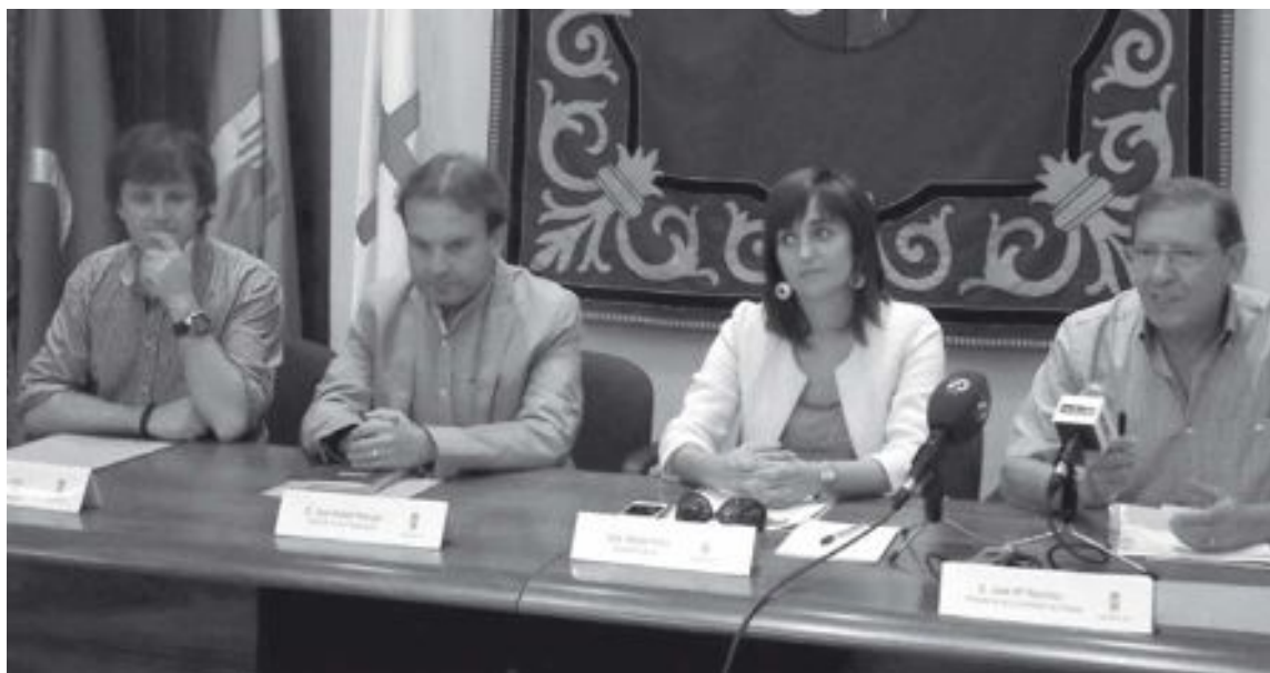
Contratada por la Comisión de Fiestas, a la presentación asistieron el autor y el director de la banda de Onteniente