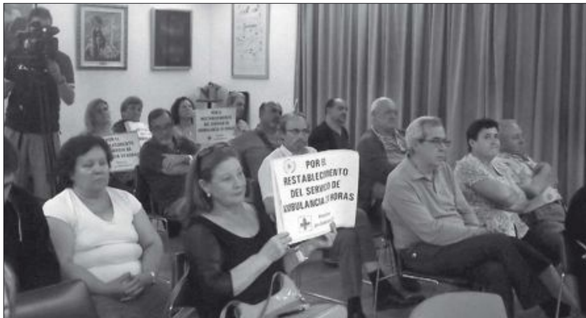
En el pleno del lunes 7 de octubre miembros de la plataforma proambulancia volvieron a exhibir pancartas

Según dijo el concejal del CDL, al Ayuntamiento le costaría 70.000 euros anuales cubrir