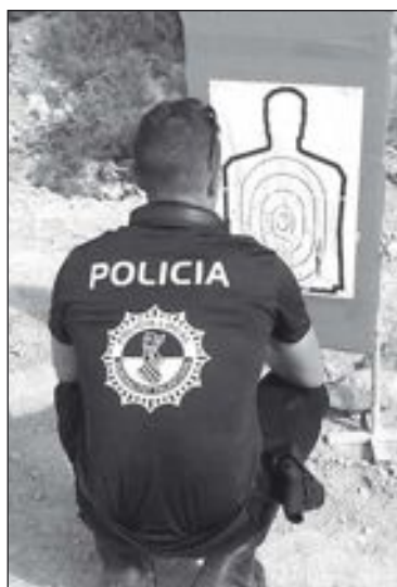
Un agente observa el resultado de la práctica de tiro

Las prácticas consistieron en un recorrido de tiro con diferentes obstáculos y simulación de atracadores con rehenes, donde,