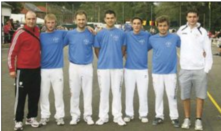
Equipo del Club Pilota Tibi que jugó en Bélgica

Envía la información de tu equipo, club o logros deportivos personales a: deportes@escaparedigital.com