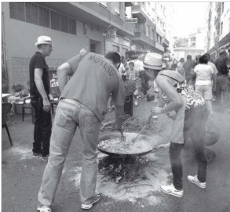
A media mañana comenzó la elaboración de paellas para el concurso