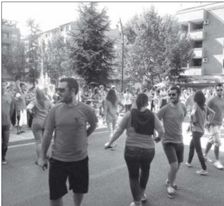
El Grupo de Danzas interpretó los bailes populares