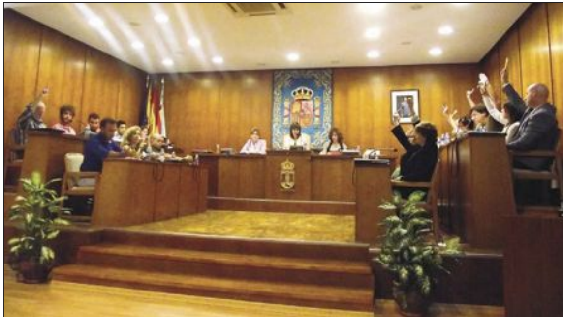
Toda la oposición votó en contra de la moción de la alcaldesa para adelantar los Plenos a las seis de la tarde