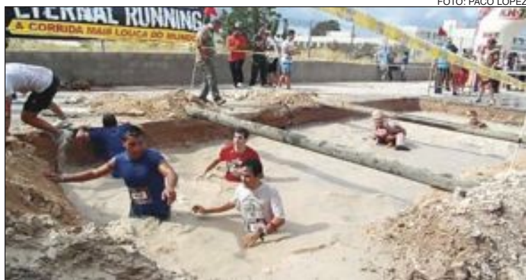
Tanto el interior del Polideportivo como los alrededores estuvieron repletos de pruebas y obstáculos de muy diversa índole y dificultad