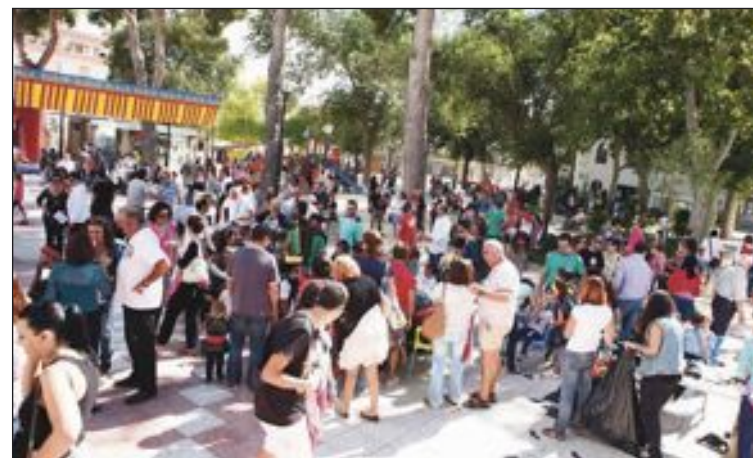
El Parque Municipal registró un gran ambiente el miércoles 9 d'Octubre