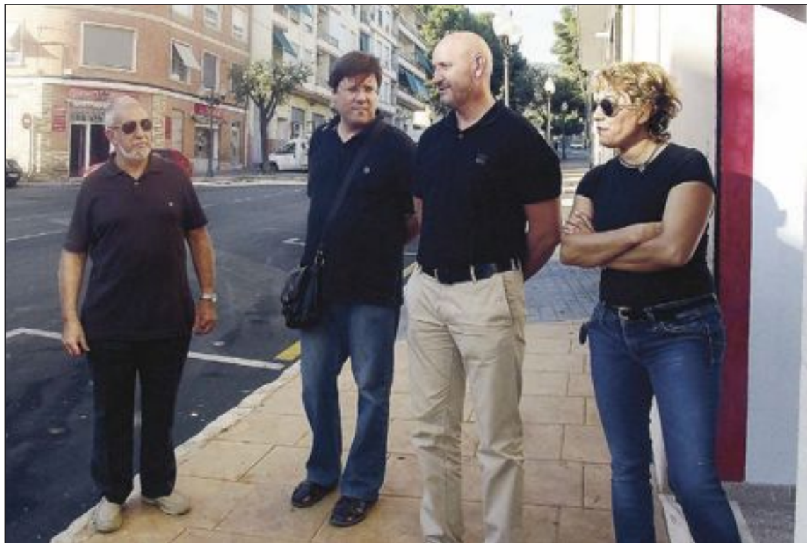
Los cuatro líderes de la oposición en la primera reunión que mantuvieron el 24 de septiembre en la sede el PSOE