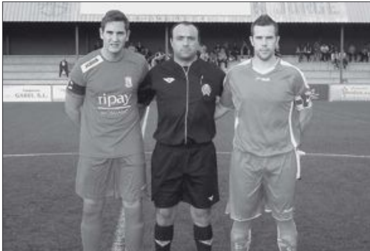
Los capitanes de ambos equipos flanquean al árbitro

El partido comenzó con el Castalla llevando la batuta del juego y la Peña bien organizada y con criterio a la hora de sacar el balón jugado. Se pudo ver un