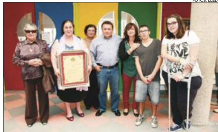
Miembros de Cáritas Parroquial muestran con orgullo el premio recibido