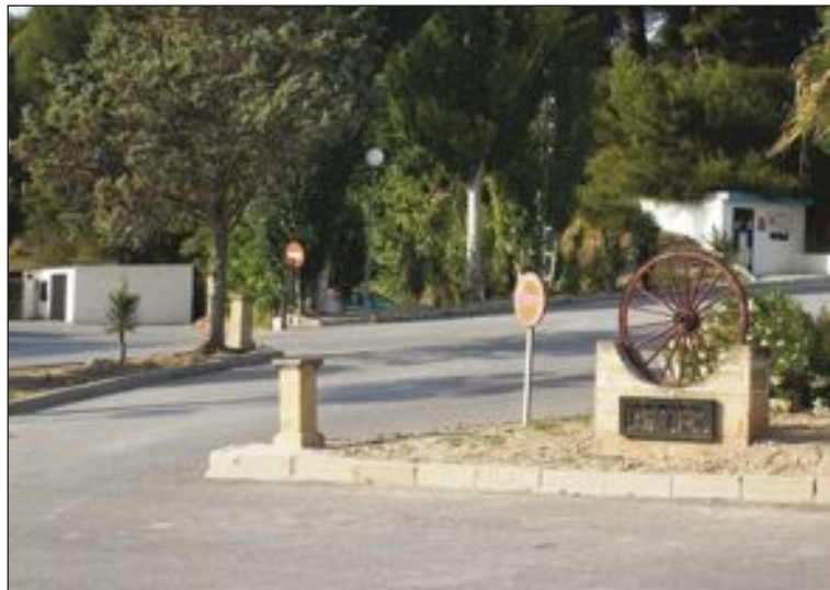
Uno de los accesos a la urbanización Terol

El Pleno se convocó a petición de los socialistas que presentaron una propuesta para aprobar, de manera simultánea, todo el proyecto del sector cuatro de Terol, es decir, el Plan Parcial, el proyecto de Urbanización y el proyecto de Reparcelación; sin embargo, PP y AIDU presentaron una contrapropuesta con el fin de sacar adelante, únicamente el Plan Parcial, que finalmente fue aprobado.