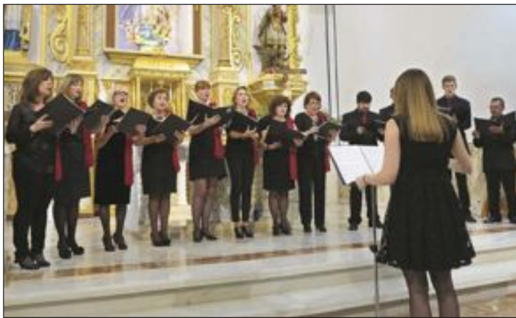
Capella de l'Assumpció (Castalla)

BIAR: Visitas guiadas.- Rutas guiadas y gratuitas todos los domingos, a partir de las 11'30 h. desde la Plaza de la Constitución.