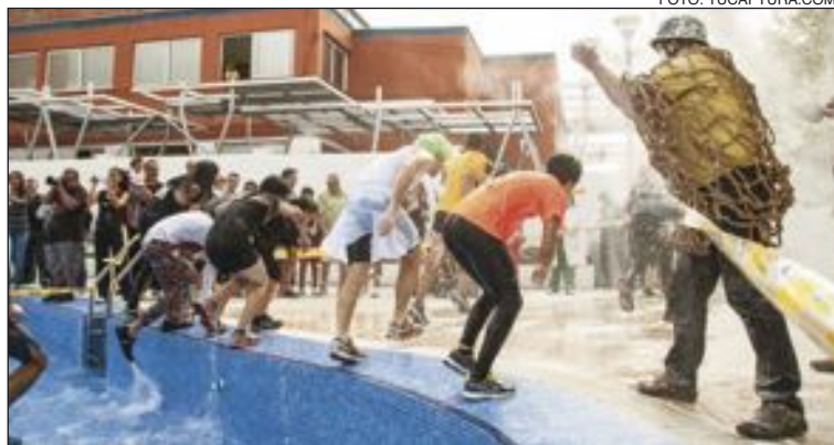
Los participantes salen como pueden de la piscina del Polideportivo, 'ayudados' por els Enfarinats , que pusieron la nota estrafalaria a la jornada

Dado este gran éxito, tanto el Ayuntamiento como la organización están dispuestos a repetir la carrera el año próximo, cuando se celebrará, a priori , el primer sábado del mes de octubre.