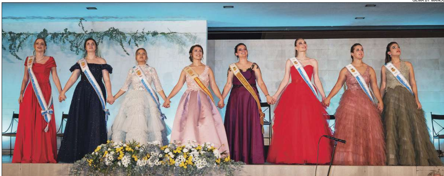
La Reina i dames d'honor d'enguany junt als càrrecs de les festes de l'any passat

Posteriorment, es va dur a terme la solemne cerimònia de coronació de la Reines i dames del present any, càrrecs que