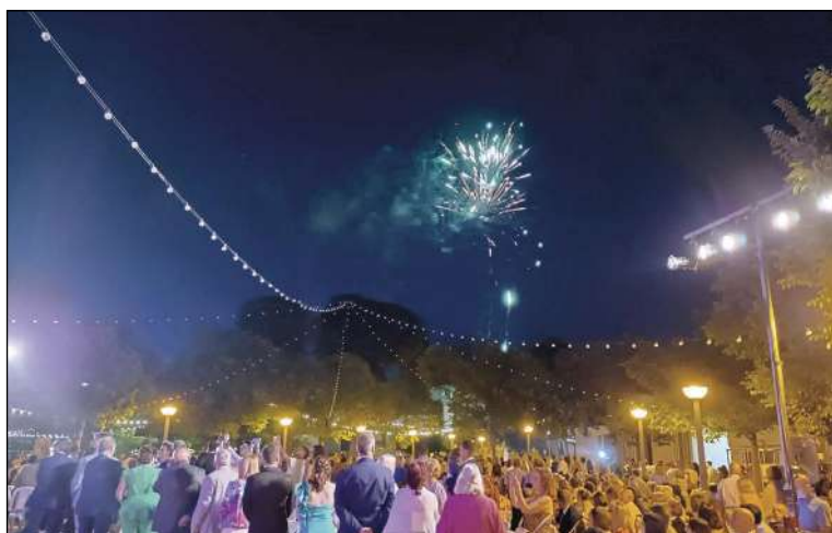
Els actes van tindre lloc al parc de l'Era de Teular i van finalitzar amb un castell de focs