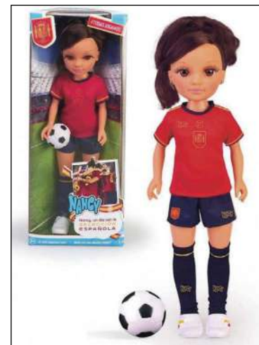
La muñeca Nancy con la equipación oficial del equipo de fútbol femenino

Bajo el lema #TodasJugamos, el fabricante lanzará en los próximos días esta nueva muñeca, una rubia y otra morena, las dos con la equipación oficial del equipo de fútbol femenino, que