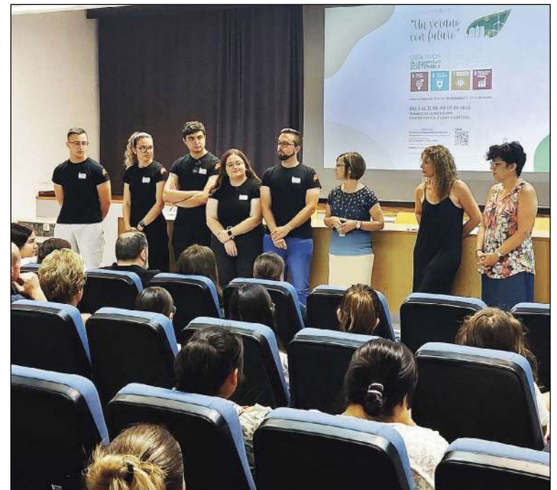
Presentación del curso de verano de Educación

El número de mujeres asesinadas por violencia de género en España asciende a 24 en 2023 y a 1.208 desde 2003.