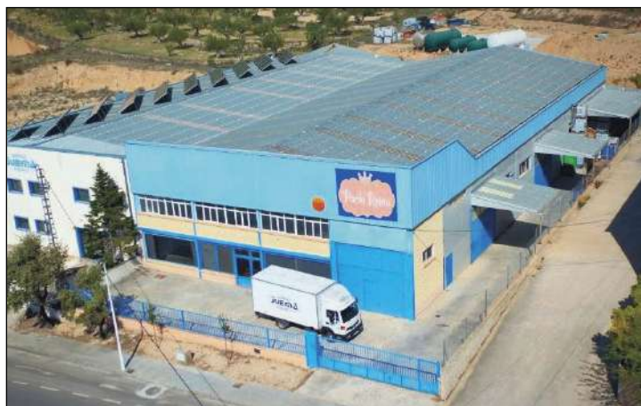
El jurado ha reconocido la labor de esta empresa familiar por promocionar oficios tradicionales, aunar artesanía y desarrollo industrial

El Premio Nacional de Fomento de la Creatividad en el Juguete recompensa la meritoria labor del galardonado a través de una obra que, en este ámbito creativo, haya sido hecha pública durante 2022, o, en casos debidamente motivados, a una completa trayectoria profesional a lo largo del tiempo.