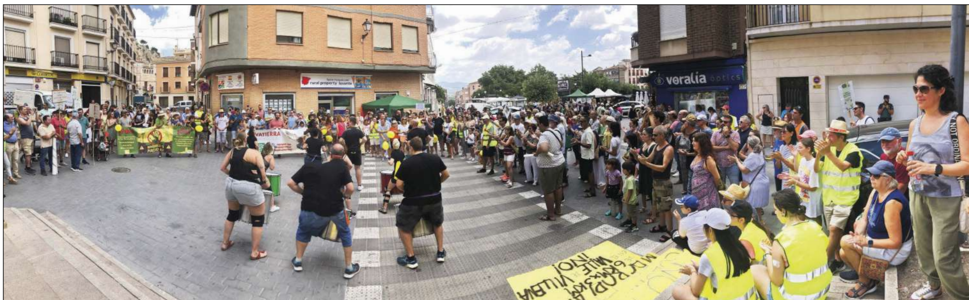
La marcha recorrió el centro de Castalla hasta la plaza Font Vella donde se leyó un manifiesto con la presencia de los alcaldes de Tibi, Castalla y Onil