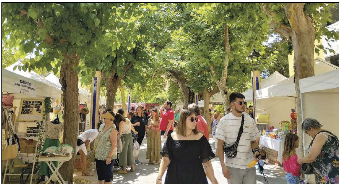
La fira comercial i artesanal es va situar en el passeig i l'esplanada del Plàtan, i en la Plaça d'Espanya