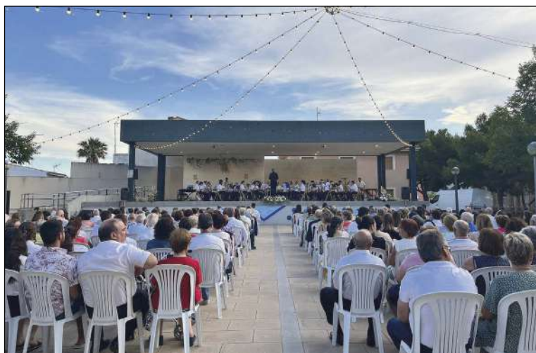
El diumenge dia 2 es va celebrar el Festival de Bandes de música

cipació de la Unió Musical 'Ciutat de 'Asis' i la Societat Musical La Magdalena de Tibi.