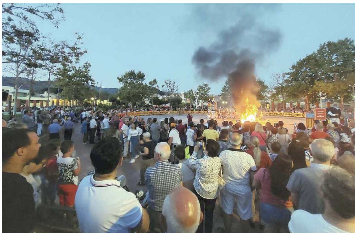
Momento de la cremà de la falla, situada en el parque Les Hortes

Desde sus redes sociales, el equipo de profesionales del centro agradece todo el apoyo recibido, "porque la afluencia de público a todos los actos que se han organizado ha sido la recompensa absoluta a nuestra labor. El sábado ardió mucho más que una falla, culminó un año repleto de actividades, emociones, sentimientos...Sencillamente gracias por estar. Estamos muy satisfechos".