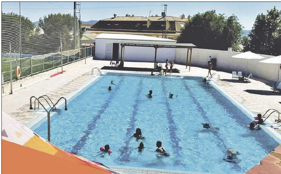
La piscina Climent solo abre de lunes a viernes, de 11 a 20 horas

Cintas explica que se está averiguando porqué el anterior gobierno no dejó previstas las contrataciones del personal”.