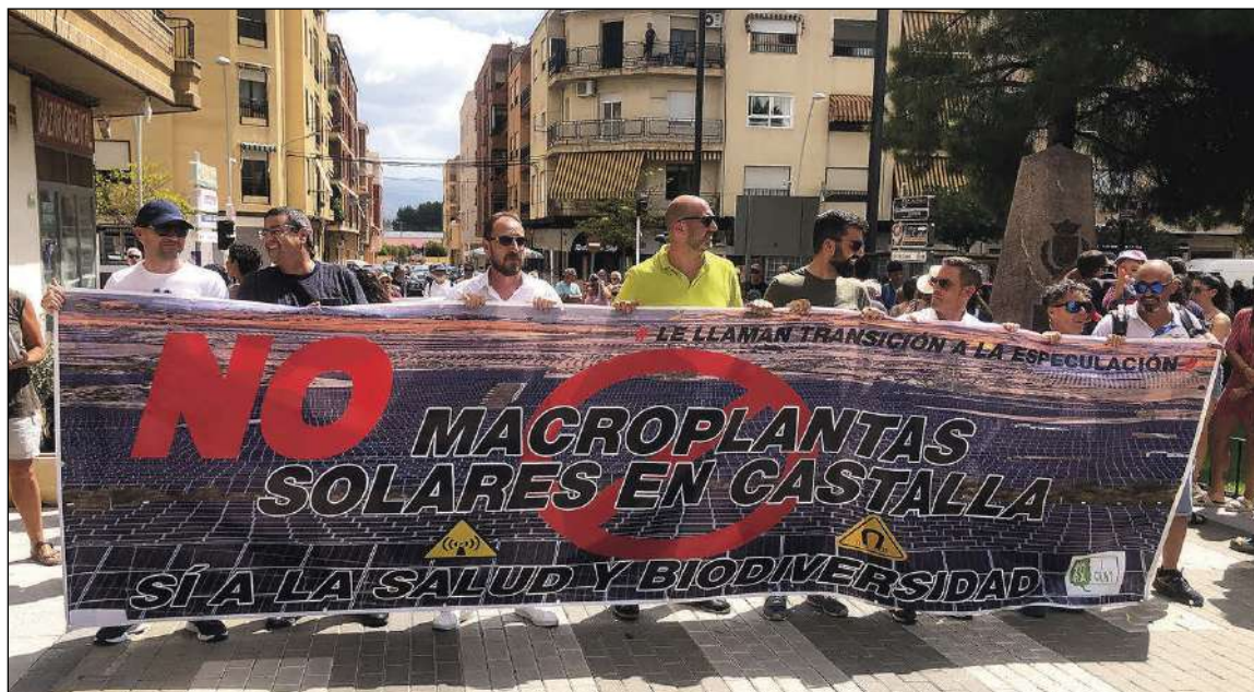
Els alcaldes de Onil, Castalla i Tibi van encapçalar el dissabte 1 de juliol la massiva manifestació

Els manifestants van demanar que es respecte l'autonomia municipal com a administració més pròxima i coneixedora del seu territori i que siga ella qui decidisca en quina superfície màxima es poden instal·lar estes infraestructures. Cal recordar, que l'Ajuntament de Castalla ha presentat un recurs d'alçada enfront de l'autorització del Ministeri i s'ha dut a terme una modificació puntual del PGOU per a determinar les àrees susceptibles d'albergar aquestes instal·lacions, que està pendent d'aprovació per la conselleria.