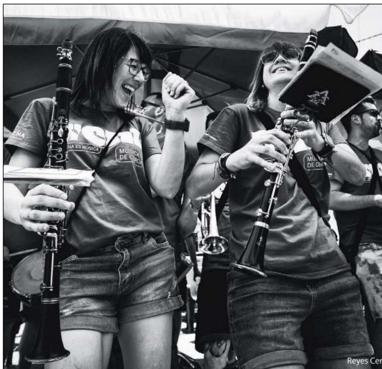
Obra premiada del fotògraf Reyes Cerdà Mira

Les obres premiades podran veure's exposades en el Space Photo de la Casa de la Cultura de Villena fins al divendres 14 de juliol.