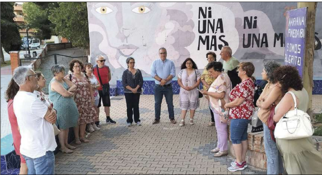
La asociación de mujeres Mariana Pineda convocó una concentración el lunes 3 de julio en la plaza 25N