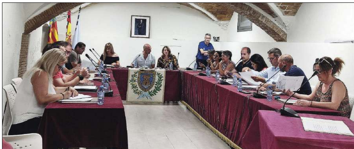
La sessió del plenari extraordinari de retribucions es va celebrar el dimecres 5 de juliol

Per altra banda, el equip de govern ha habilitat un lloc de treball a l'oposició a l'Auditori, ja