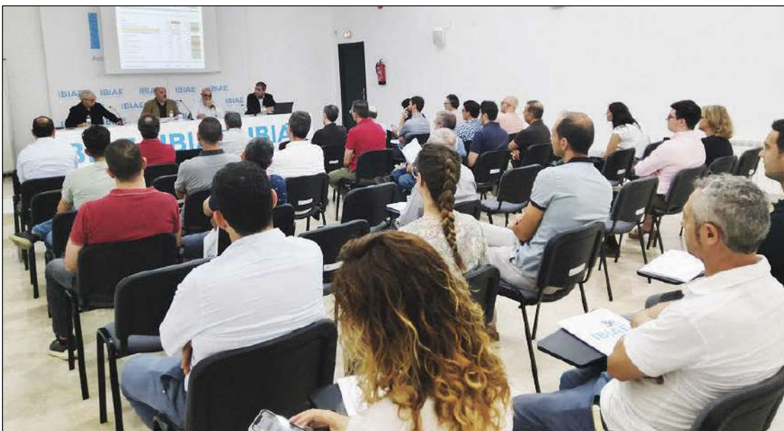
La asamblea se celebró el viernes 30 de junio en la sede de la Asociación de Empresarios Foia de Castalla