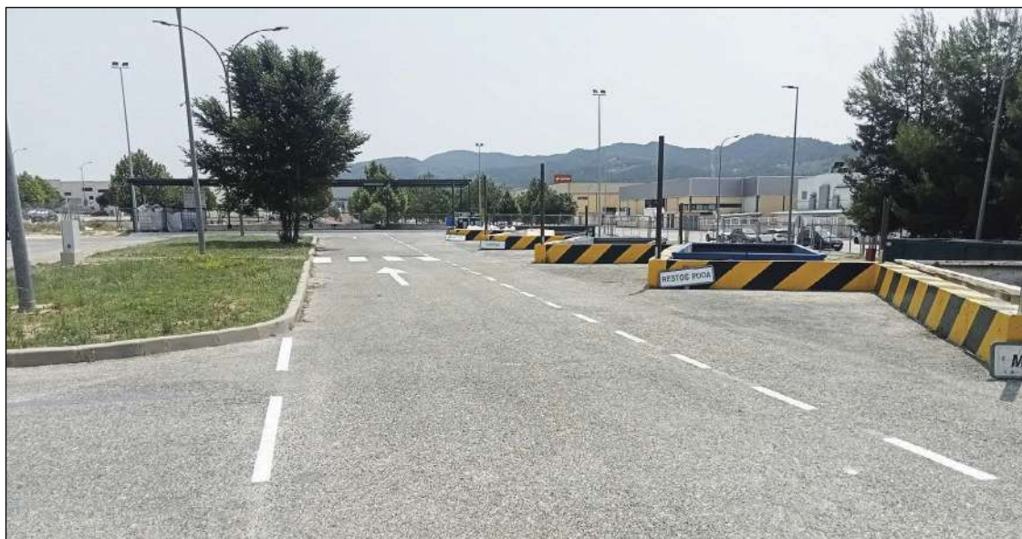
Las reformas se ejecutan para adaptar los ecoparques a la normativa del Plan Integral de Residuos de la CV