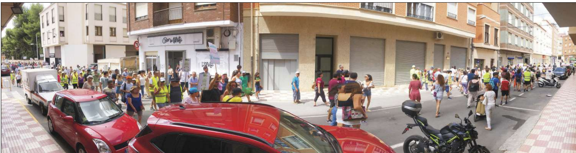
Convocats pel col·lectiu Natura i Gent, unes 600 persones van participar en aquesta manifestació on es va deixar clar que sí que s'aposta per les energies renovables, però no d'esta envergadura