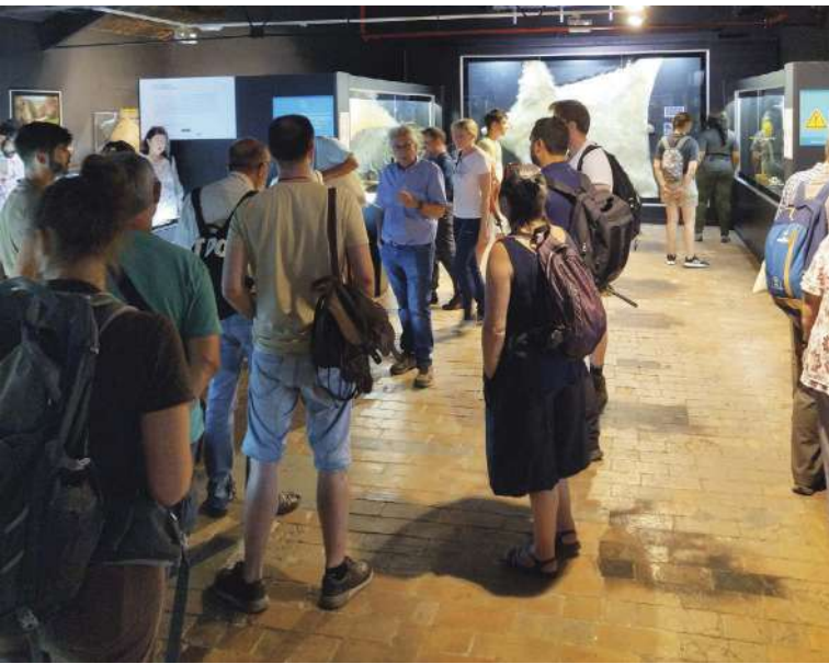
Visita de los expertos en insectos al Museo el viernes 30 de junio