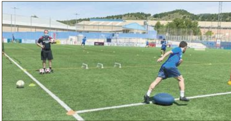
Jugadores del Rayo, en un reciente entrenamiento en el Vilaplana Mariel

Comunidad Valenciana fue la encargada de realizar el sorteo de cruces el pasado jueves 25 de junio y todos los encuentros se jugarán a puerta cerrada, salvo cambio de normativa.