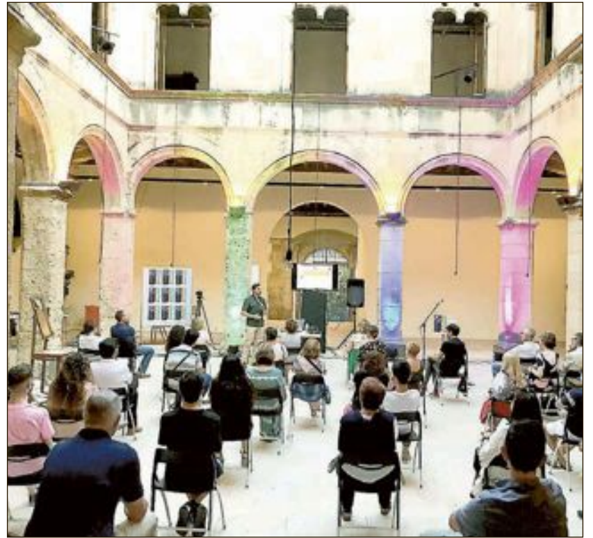
El claustro del Palacio albergó todos los actos de las jornadas LGBTI