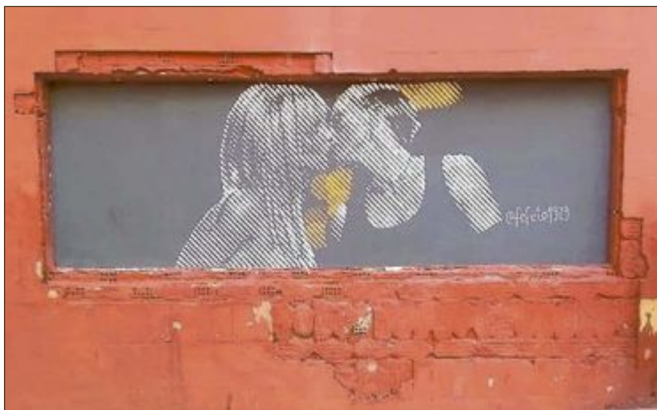
El mural mostraba a las cantantes Britney Spears y Madonna besándose