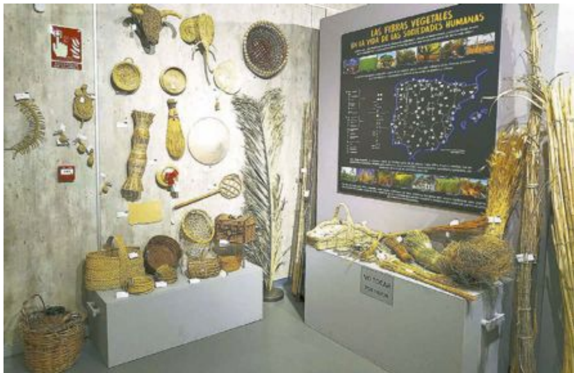
Las jornadas sobre fibras vegetales está previsto que se celebren del 24 al 26 de septiembre

Se trata de un proyecto con el que se pretende conservar el conocimiento tradicional acerca de las fibras vegetales, los oficios perdidos asociados a ellas y los recursos naturales existentes en el territorio, todo ello orientado a