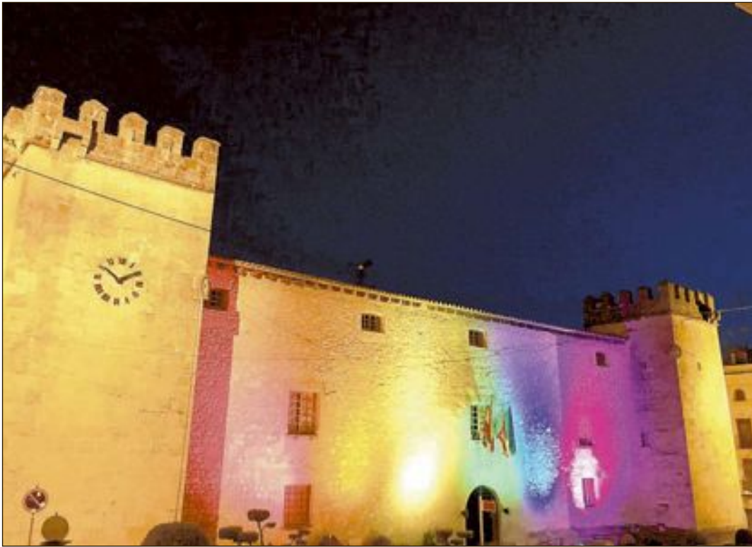
Aspecto de la fachada del palacio del Marqués de Dos Aguas, en la jornada inaugural