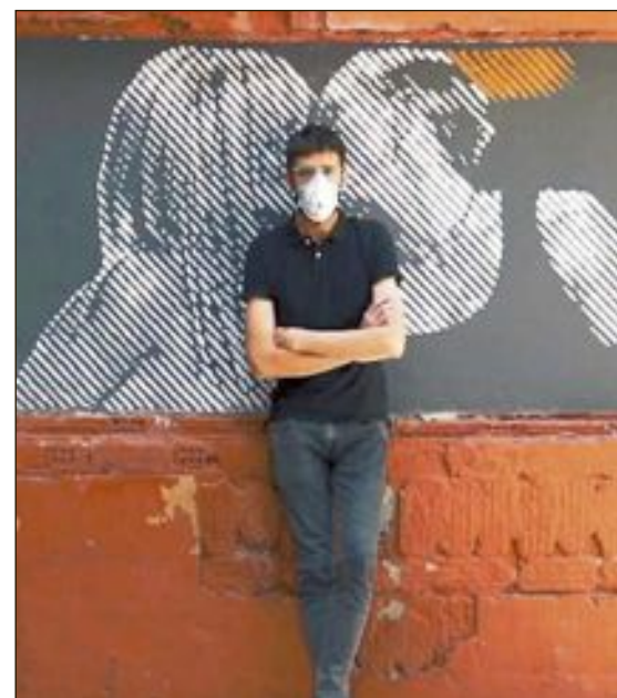
El autor junto al mural, encargado por el Ayuntamiento de Ibi

Este hecho no pudo empeñar la visibilidad del 28J, “ni la tolerancia, el respeto y la diversidad del amor en todas sus dimensiones”, según ha dejado escrito en su muro de facebook el PP, y Fefeto anuncia que se va a repintar el mural, ubicado en la calle Manuel Soler.