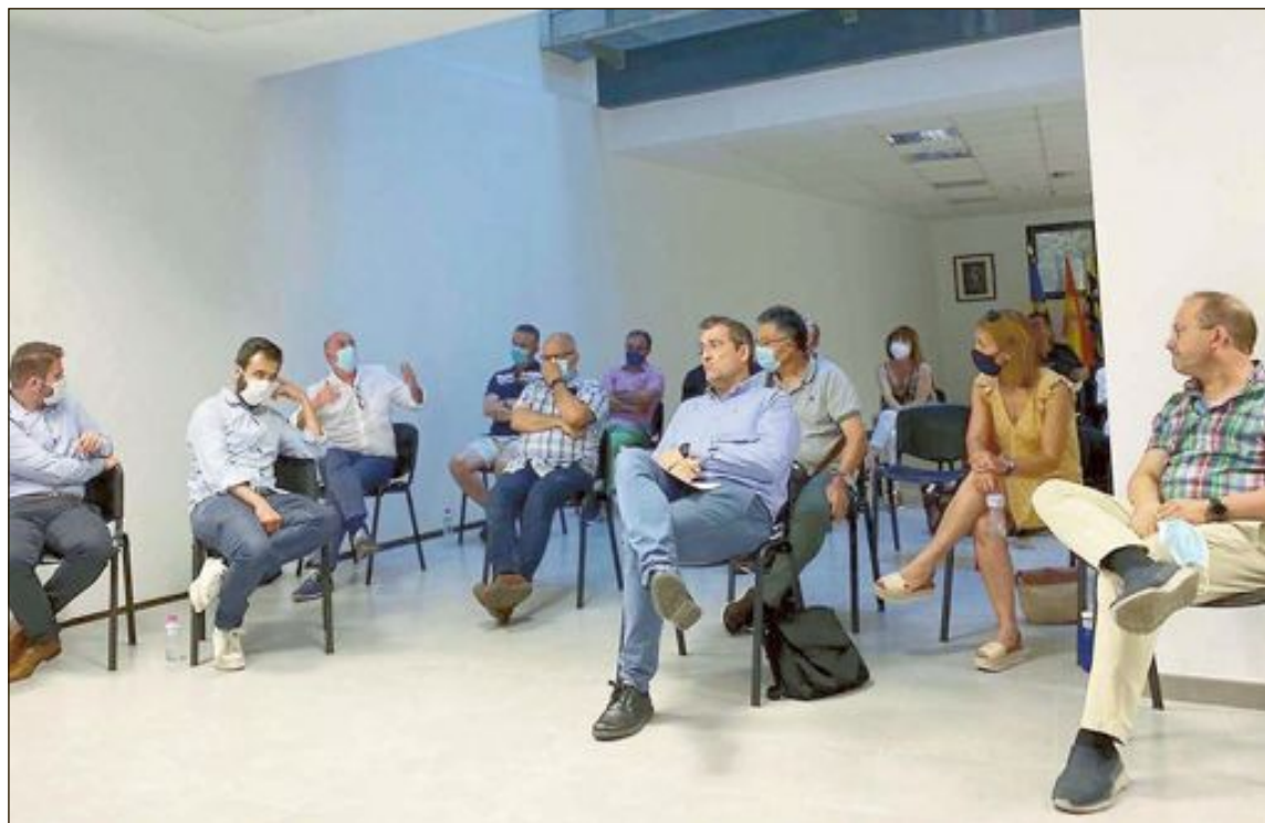
Empresarios locales y representantes de IBIAE asistieron a la reunión convocada por el Ayuntamiento de Onil

Desde la concejalía de Impulso Económico y la alcaldía se insis-