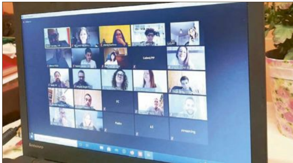
El pleno del miércoles 1 de julio se realizó también de forma telemática