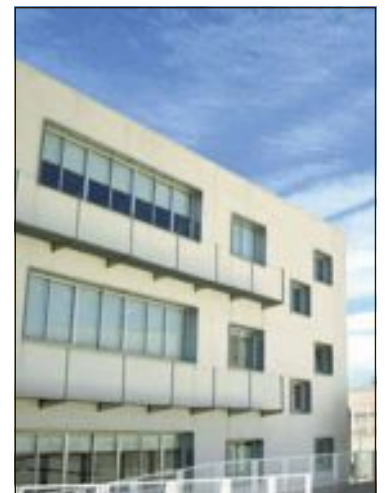
Las aulas de la EOI se encuentran en el IES La Foia

El viernes 3 de julio comienza el proceso de admisión de matrícula para las EOI. Se puede consultar toda la información sobre la matrícula en la página web de la escuela: http://mestreacasa.gva.es/web/eoialcoi/271