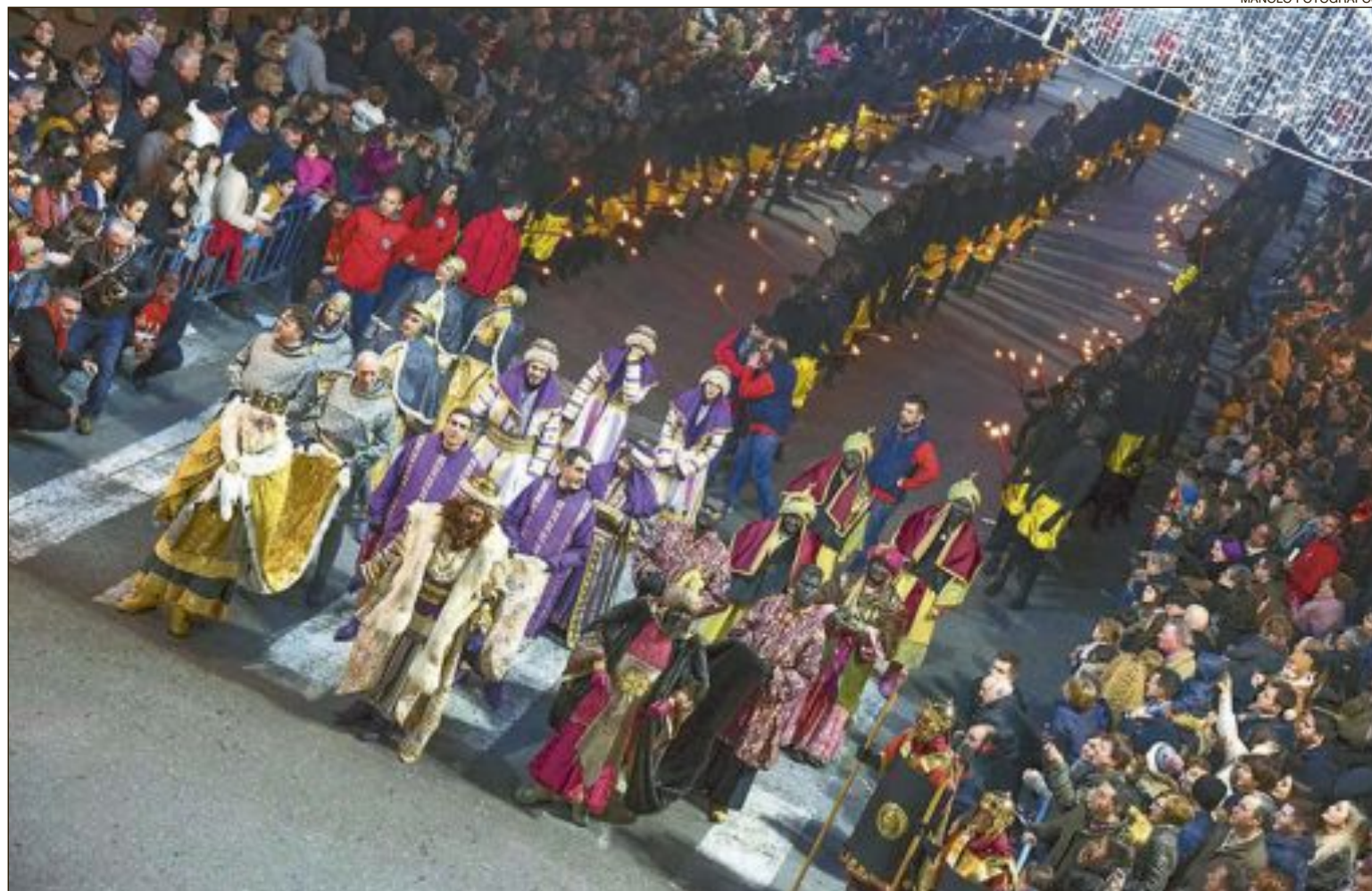
Bajada de los Tres Reyes Magos, durante la Cabalgata de 2020

hemos seguido manteniendo reuniones durante este período, de forma telemática, por lo que nada se ha frenado y todos los pasos que se tenían que dar durante este período se han dado, es decir, a día de hoy puedo decir que todo lo que tenía que estar hecho, está hecho y no hay retraso con respecto a los años anteriores.