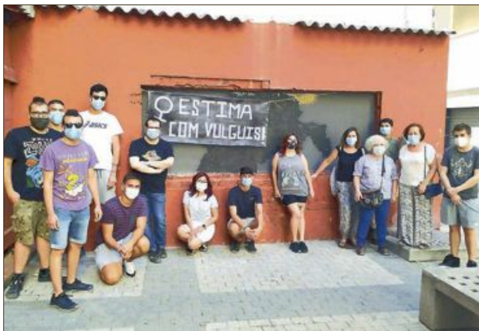
Un grupo de personas realizó un acto de desagravio, tapándolo con una pancarta reivindicativa