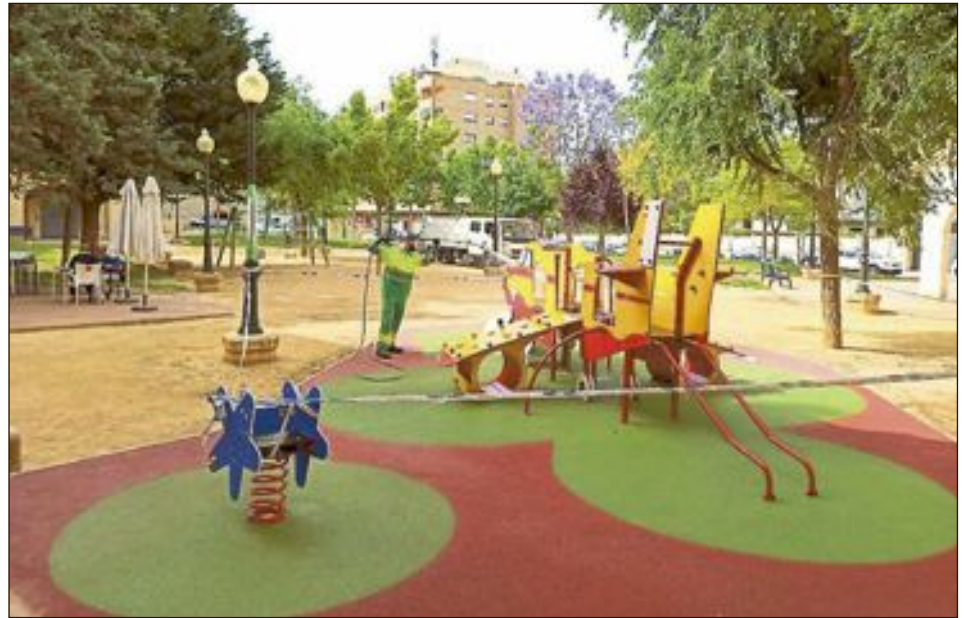
El Consistorio sigue manteniendo como prioridad la limpieza y desinfección de espacios públicos y en los juegos infantiles estos trabajos se realizan a diario