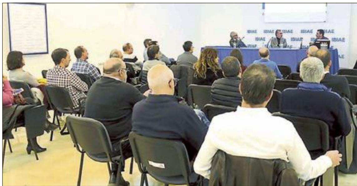
Imagen de archivo de una asamblea general

Con esta decisión, se ha decidido anteponer la seguridad y salud de los asistentes.