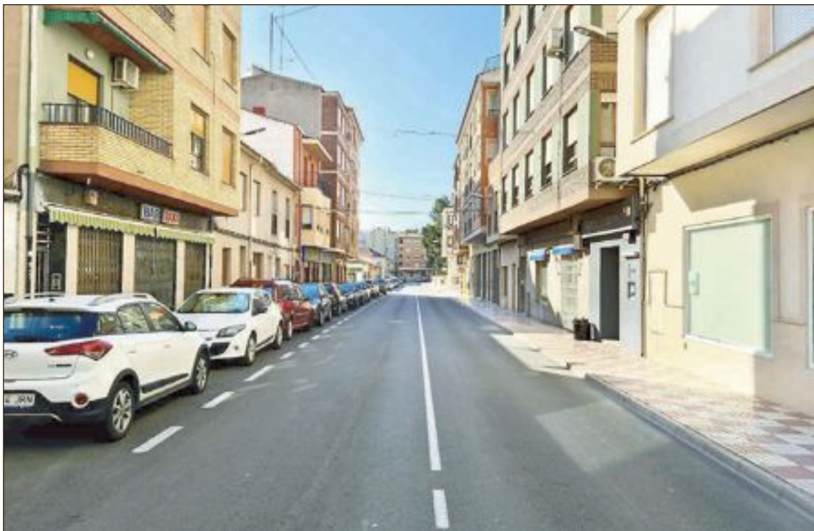
La iniciativa busca ajudar econòmicament als establiments del municipi afectats negativament pel coronavirus

Com explica la regidora de Comerç, Maite Gimeno, "d'aquesta manera, ajudem als nostres veïns subvencionant la meitat de les seues compres a Castalla i ens assegurem de què tots aquests diners s'inverteixen al nostre municipi".