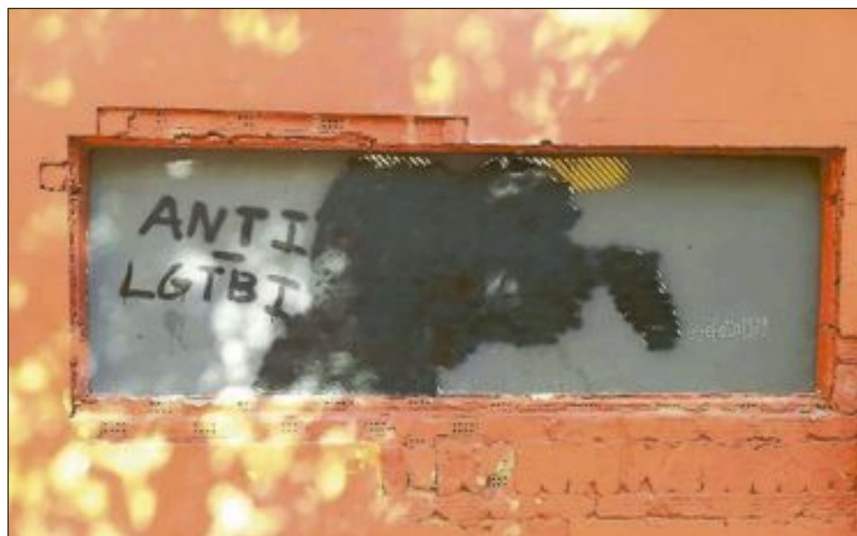
El mural, ubicado en la calle Manuel Soler, tras recibir el ataque homófobo