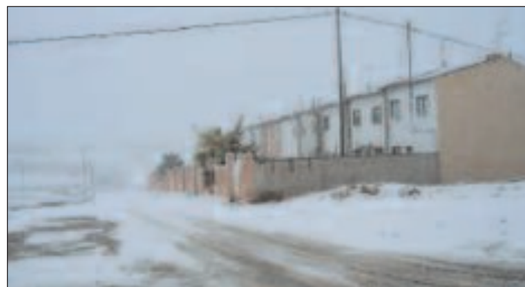
La nieve cayó toda la mañana sobre el casco urbano de Ibi