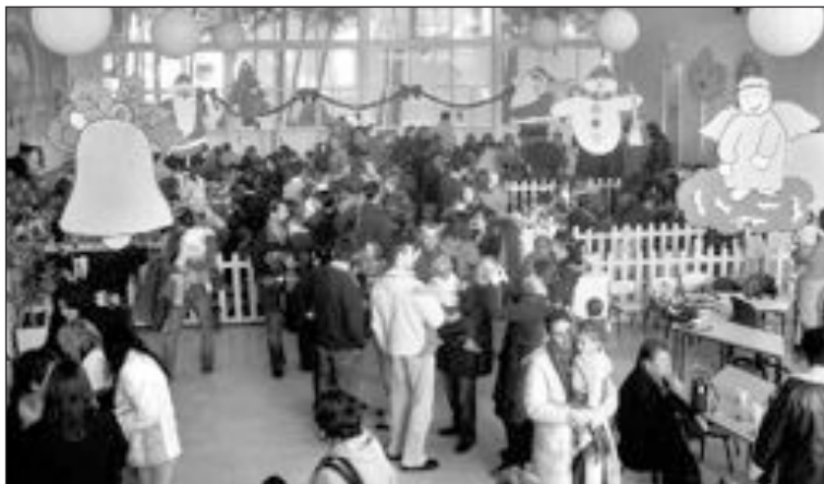
La escuela infantil ofreció una merienda el jueves a los padres y niños