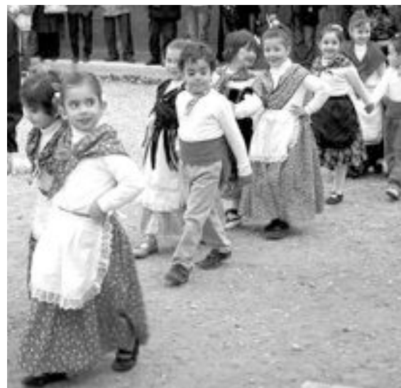
Los 'tapats' y los 'ballaors' del colegio Pla y Beltrán contaron un año más con la colaboración del Castell Vermell

aries Quizás hayas pensado en cambiar ciertas cosas en la relación con tu pareja. Olvidalo. Tu pareja ya se encargará de cambiar lo que tenga que cambiar sin consultar contigo. Incluso puede que cambie de pareja.