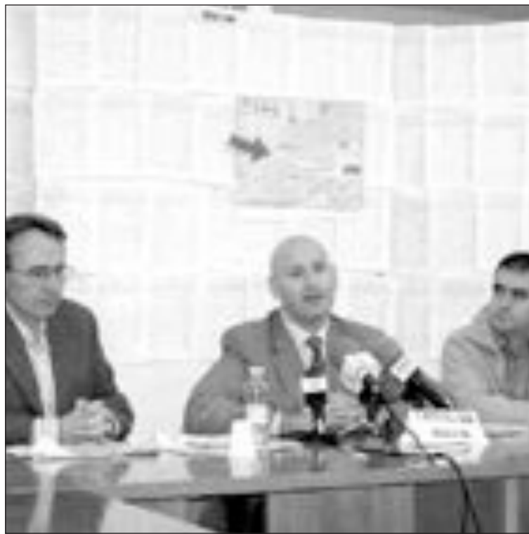
Los concejales de ADli presentaron el jueves las firmas recogidas