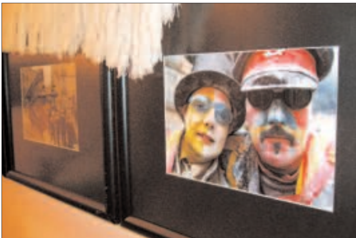
Exposición fotográfica 'Els Enfarinats' del autor Paco Gil que puede visitarse en el Archivo Histórico municipal