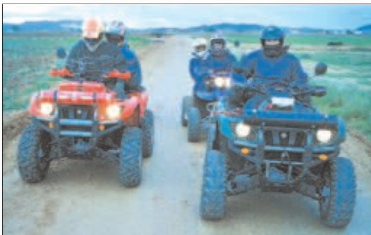
Los aventureros ibenses durante uno de los tramos en tierras almerienses

La primera etapa, entre Ibi y Pozo Alcón (Jaén), siempre por caminos y pistas forestales, se desarrolló durante trece