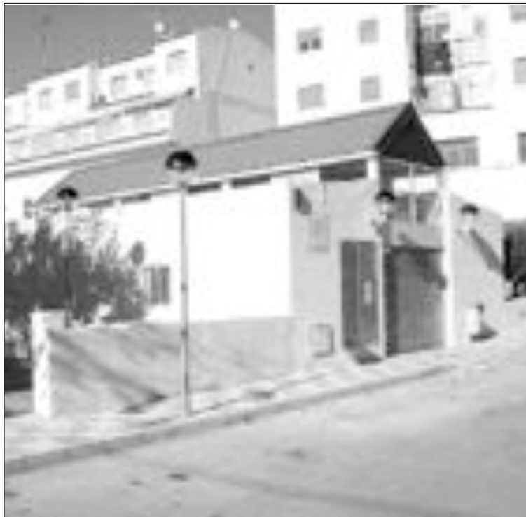
Se están instalando los nuevos equipos de luz y sonido en el Teatro

A partir de este viernes, 22 de diciembre, los puestos ya se trasladan al nuevo mercado. Queda ahora por realizar las obras del parque.