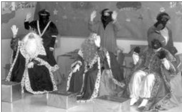
Los Reyes Magos recibieron las cartas de los alumnos del Barranquet