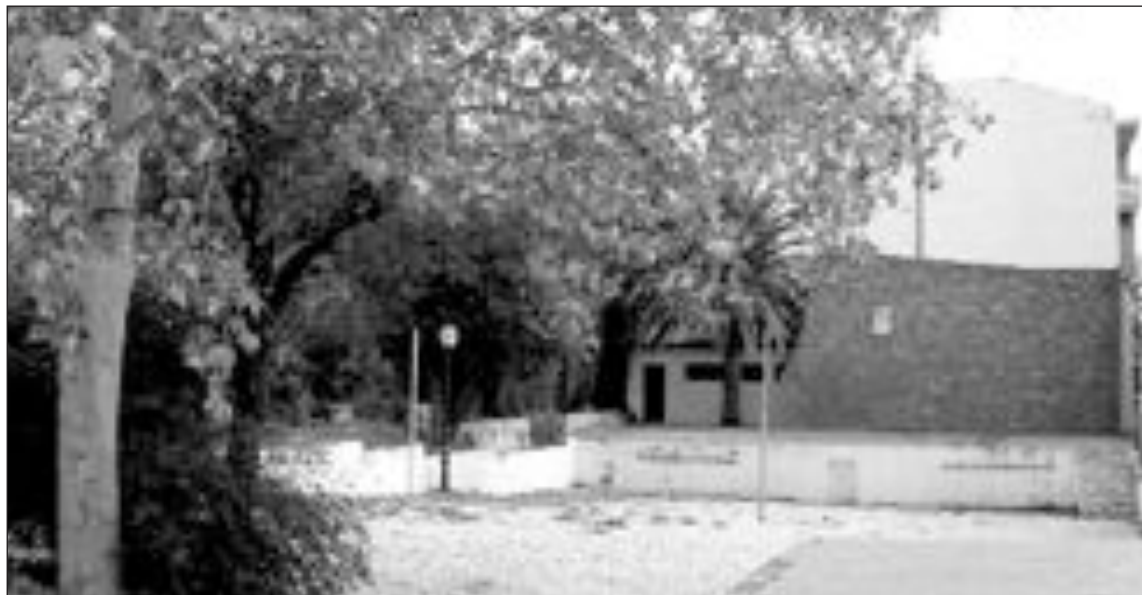
En concreto, el Ayuntamiento entrega al colegio 800 metros para poder edificar este salón multifuncional

A cambio de la cesión de los terrenos, el colegio San