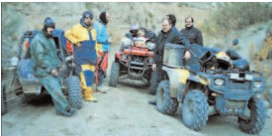
La mayor parte del camino se desarrolló por caminos y pistas forestales