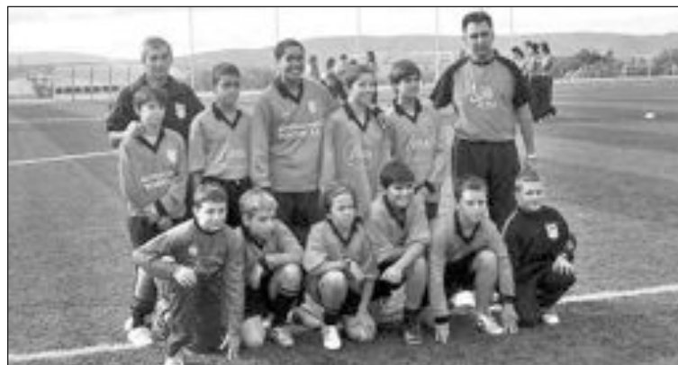
Plantilla del equipo alevín del CD Biarense

Por último, el equipo alevín (en la foto) sucumbió estrepitosamente en el campo de Castalla (6-0).