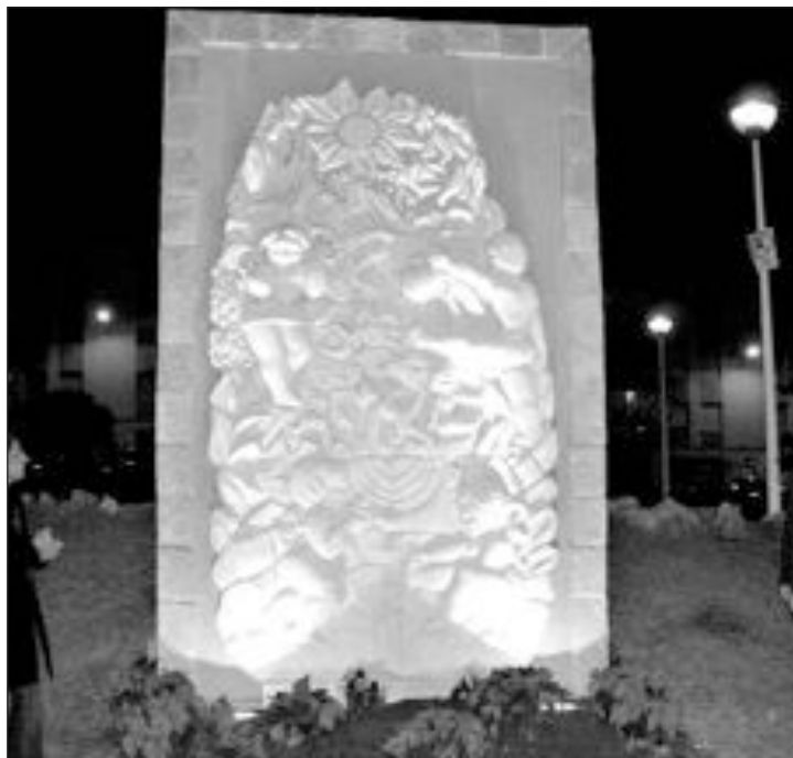
El mural ha sido instalado en el Parque Mariola

merienda, este jueves, para felicitarles la Navidad. Como cada año, los pequeños entregan a sus padres un regalo realizado por ellos y sobre todo por las educadoras que dedican muchas horas a su elaboración.