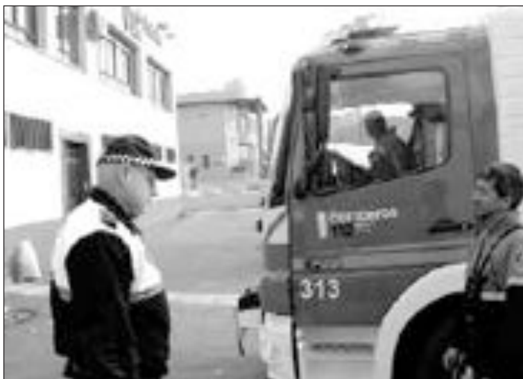
Un agente y un bombero, a las puertas de la empresa siniestrada

la creación de la Comisión pero lo hizo asegurando que no servirá más que "para perder el tiempo" ya que las obras están certificadas por los técnicos. Desde el PSOE, se teme que se haya incumplido la ley de contratos administrativos ya que la obra ha tenido un sobrecoste del 30% sobre el presupuesto inicial. La comisión está formada por tres representantes del PP, dos del PSOE y dos de ADli, uno para EU y otro para el grupo mixto.