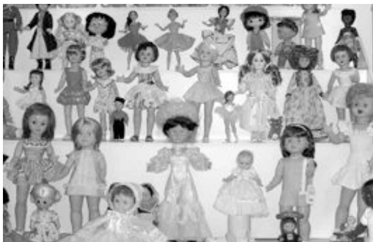
Muñecas de Famosa de la década de los 50