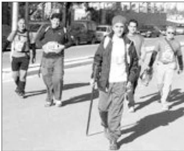
Los marchadores partieron a las 8:30 de la mañana