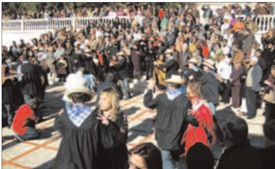
Cientos de ibenses acudieron a la plaza de la Iglesia para ver los primeros bailes de les dansaes de este año