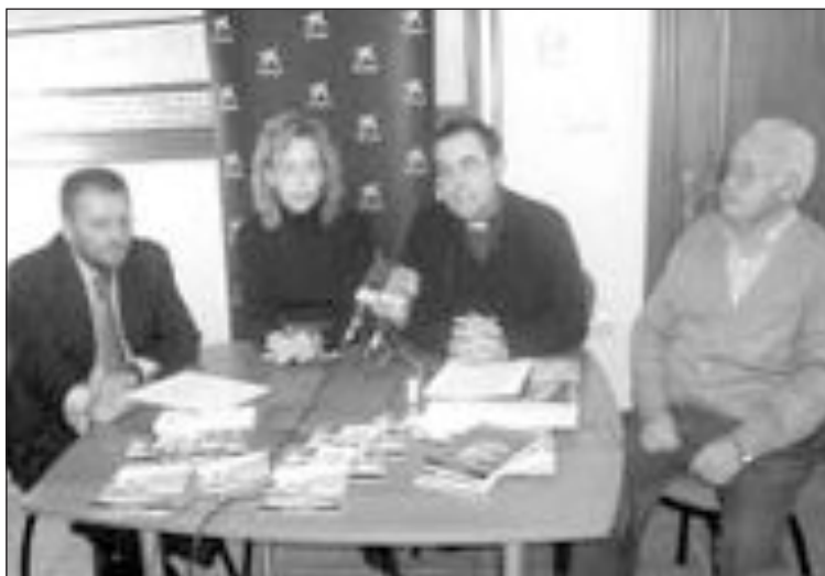
Momento de la rueda de prensa celebrada en la Casa Abadía de Castalla

Las donaciones se celebrarán entre enero y agosto, cada mes en el local social de una de las siete comparsas, además de en la sede de la Agrupación Musi-