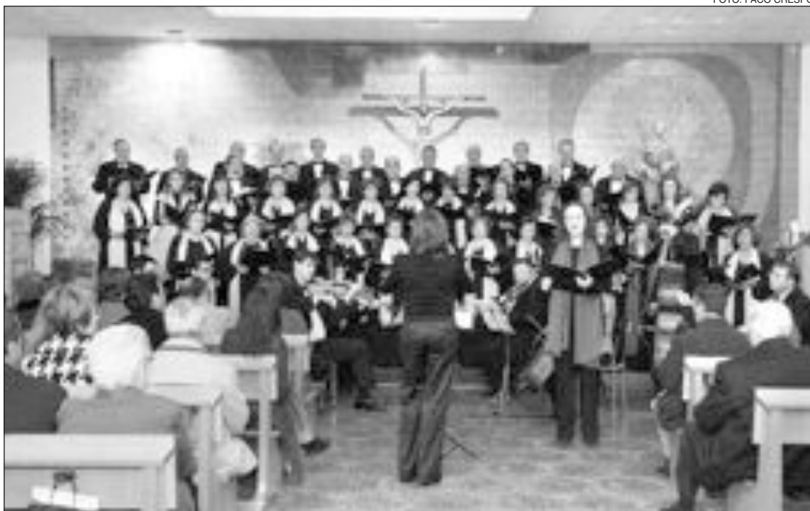
Actuación de la Coral Ibense en la parroquia Santiago Apóstol, el pasado sábado

El martes 2 y miércoles 3 de enero, a las cinco de la tarde, habrá un espectáculo de magia a cargo de 'Magic Dexter' en el Centro Cultural de Ibi, a partir de las cinco de la tarde. Para el jueves por la mañana, se han preparado juegos infantiles en la Plaza Sanchis Banús y a las siete de la tarde llegará el Heraldo. A las seis de la tarde del 5 de enero tendrá lugar la tradicional cabalgata de Sus Majestades Los Reyes Magos.