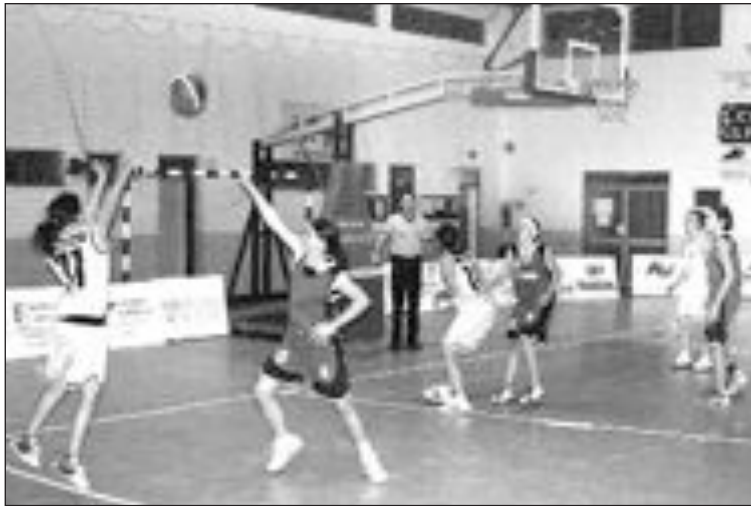
Las colivencas del equipo Júnior vieron desaparecer su primer puesto

Sénior Femenino. Apabullante primer cuarto de las oriolanas, que les sirvió de renta, para aguantar los buenos intentos de remontada que protagonizaron las chicas mayores de Onil, aunque con el tiempo muy en contra, y sin reflejo en el marcador.