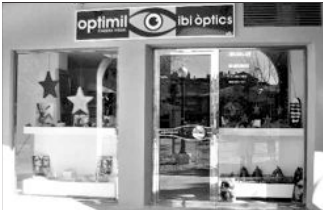
Escaparate del nuevo establecimiento de Optimil en Ibi, situado en la Plaza Miguel Servet

Además son distribuidores autorizados de las monturas de Emporio Armani, tanto para sol como para graduación. Con motivo de estas fechas, Optimil desea a todos unas felices fiestas.