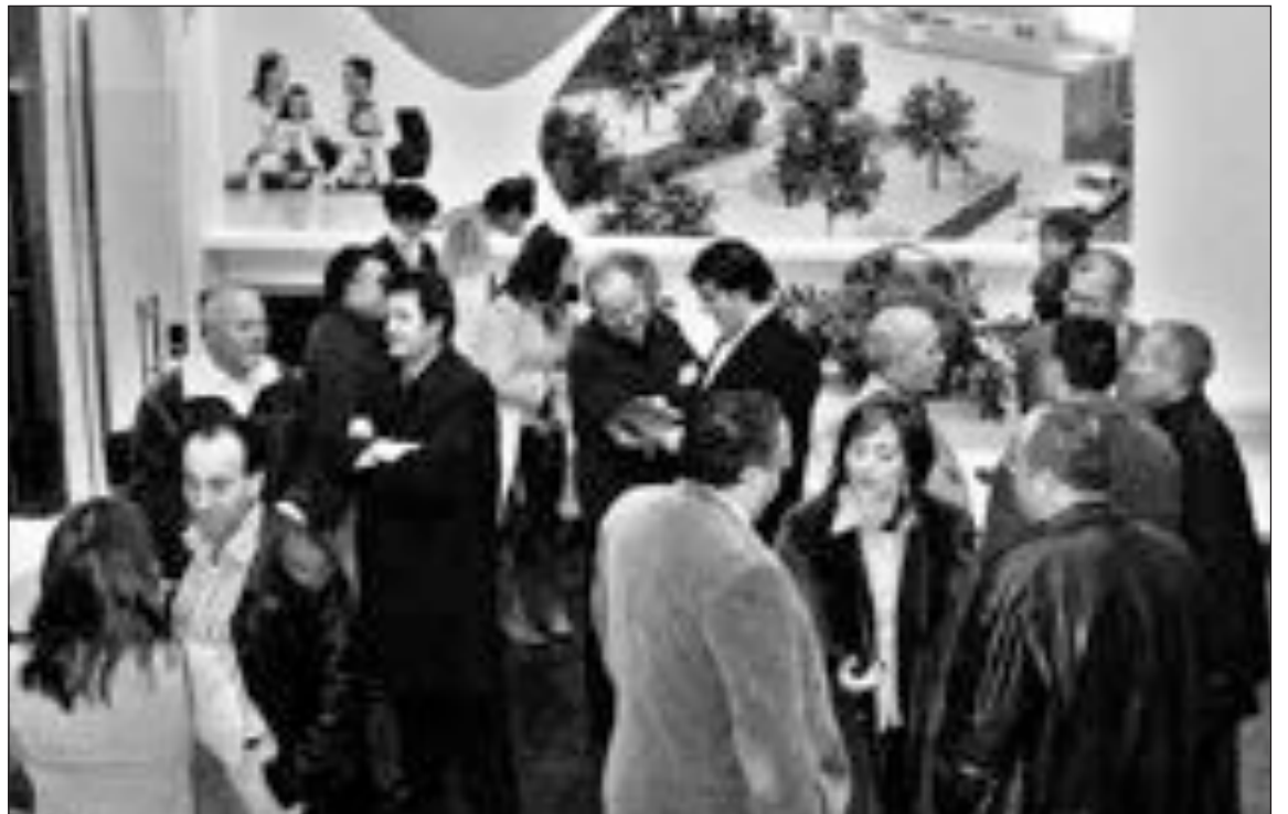
La alcaldesa y representantes de otros grupos políticos asistieron a la presentación del proyecto e inauguración de la oficina de la promotora

La inversión prevista en esta primera fase es de 10 millones de euros y el plazo de ejecución de dos años.