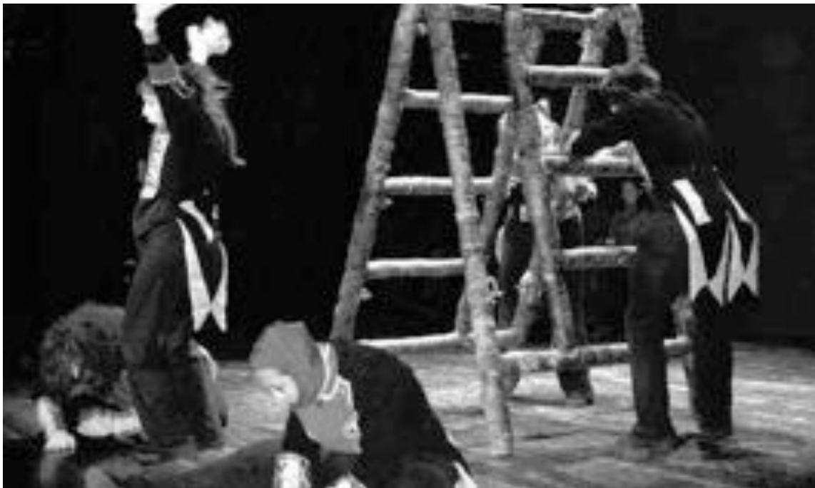
El Taller de Teatro Font Viva escenificó algunos sketches para la ceremonia de entrega de premios