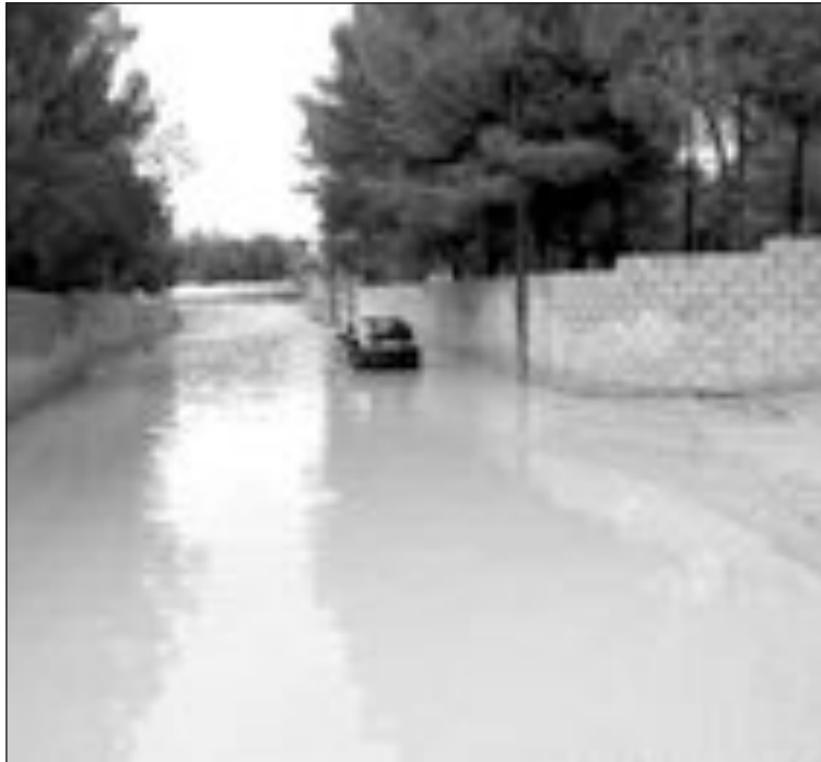
Estado de unas de las vías de Terol tras las pasadas lluvias

Por su parte, el alcalde, Jesús Ferrara, que asistió también a la asamblea, mantuvo