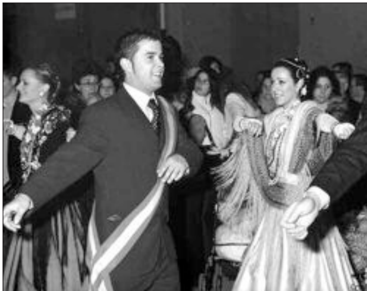
Las danzas de los dos reinados tienen lugar en la Plaza de España

El 8 de enero, se celebran las danzas de ambos reinados. Si en el transcurso de las mismas no sale un Reinat afegit , (reinado agregado) se acabarían las danzas hasta el año siguiente.