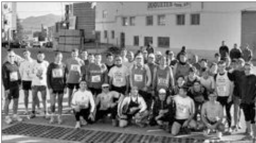
En la carrera tomaron parte un total de 51 atletas