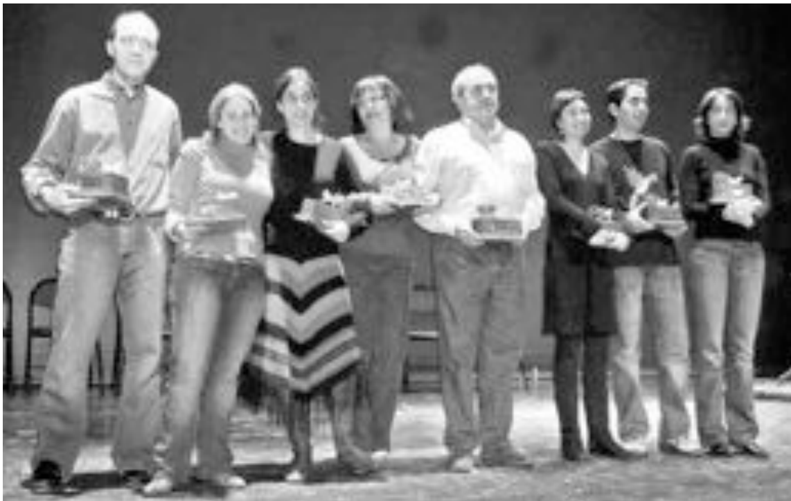
Todos los grupos premiados en el concurso, tras la entrega de galardones