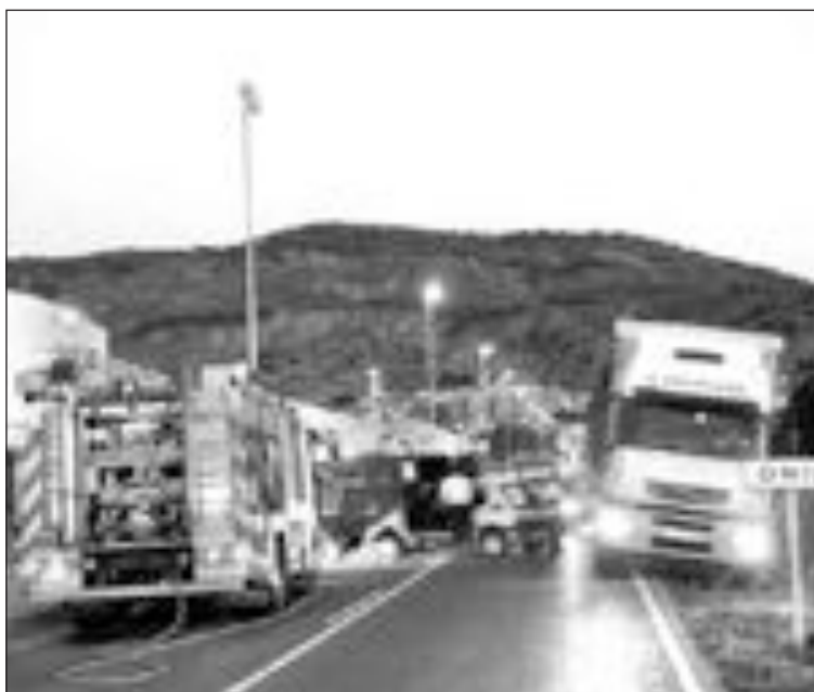
El tráfico se vio afectado durante las dos horas que duró el rescate