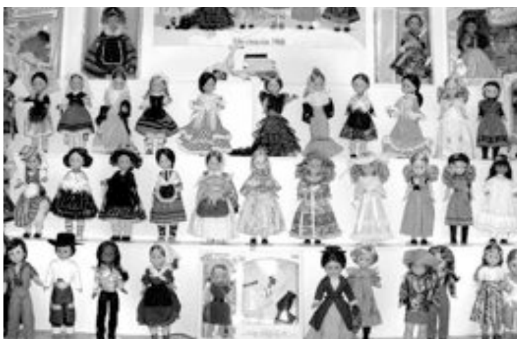
La Nancy es, sin lugar a dudas, la muñeca estrella de Famosa