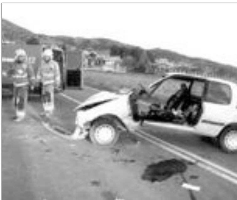
Aspecto del coche tras ser arrancada la puerta para poder sacar al conductor