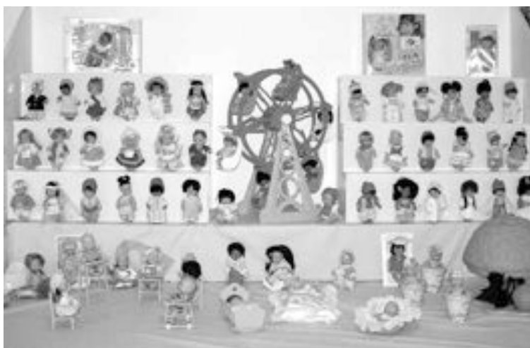
Las Barriguitas, con sus complementos, forman parte de esta muestra