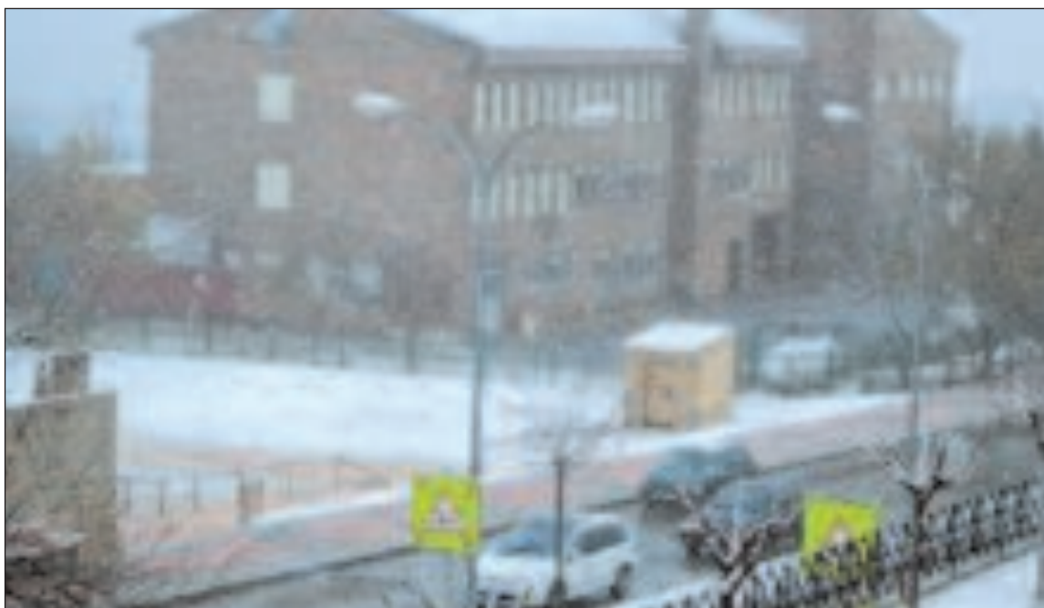
La nieve caída por la mañana provocó el cierre de los colegios la tarde del miércoles y la mañana del jueves