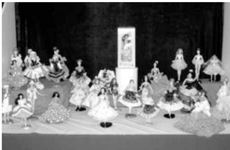
La exposición está abierta en el Centro Cultural hasta el 11 de enero

Del 23 de diciembre al 4 de enero, Onil acoge la cuarta edición de la muestra colivenca de artes plásticas. En ella participan un total de 27 artistas que expondrán pintura, escultura, fotografía y dibujo, entre otras cosas. Para anunciar la muestra se ha realizado un original cartel con la fotografía de casi todos los participantes.