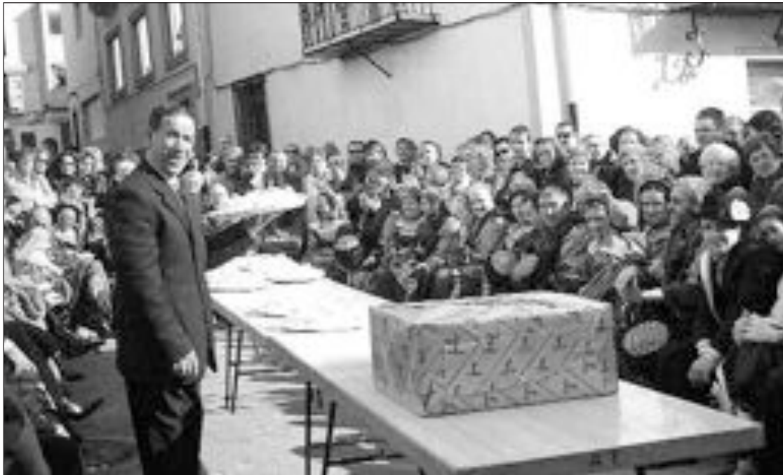
Subasta de 'tonyes' que realizan durante las fiestas los reinados moro y cristiano

La noche del 5 de enero comienzan los actos propios de los reinados. Los miembros del Reinado Cristiano, acompañados por la dolçaina i el tabalet , visitan todas las casas de la localidad para invitar a los vecinos a misa i taula . Se trata de una tradición que significa que todos los tiberos deben acudir a Misa el día de Reyes y, después, participar en la