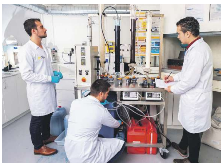
Laboratorio de medioambiente del instituto tecnológico AIJU

En el ámbito de la Comunidad Valenciana, existe una total dependencia del exterior al no dispo-