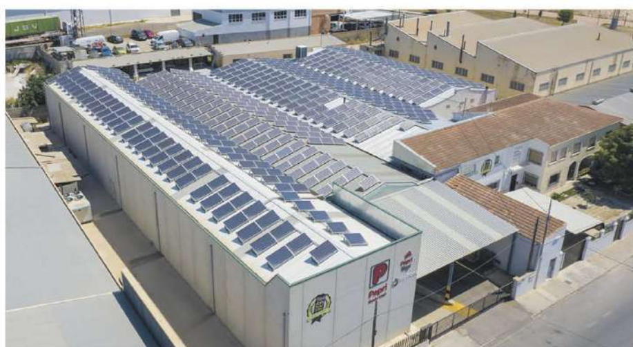
• Pepri, S.L. / 131,67 kWp