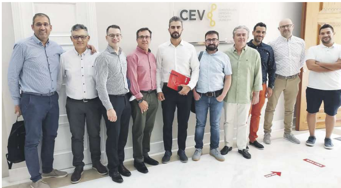
Representación de empresarios de la Asociación de Empresarios de la Foia de Castalla que asistió a la presentación de la gigafactoría de baterías de Volkswagen, a cargo de su filial Seat

Una de las cuestiones que subrayó Sancha es que en septiembre habrá una resolución sobre el PERTE (un proyecto basado en la colaboración público-privada y centrado en el fortalecimiento de las cadenas de valor de la industria de automoción española, un sector estratégico para España). A finales de ese mes tendrá que estar la resolución definitiva del otorgamiento de los fondos europeos para acelerar en la puesta en marcha de la gigafactoría.