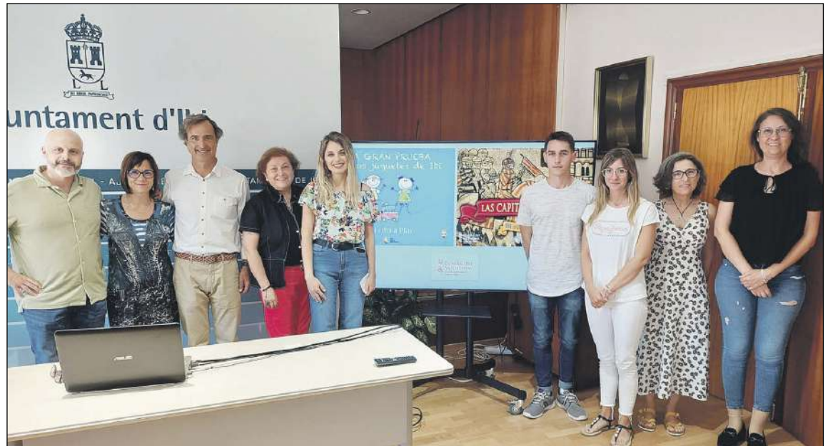
La presentación del programa educativo tuvo lugar el martes 7 de junio

Las misiones recorrerán puntos estratégicos de Ibi a través de los cuales los participantes