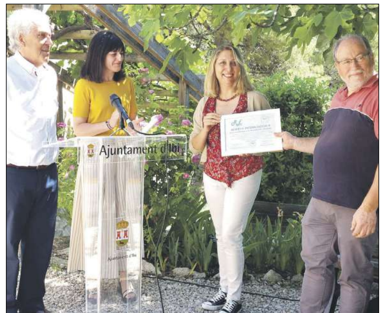
El acto de descubrimiento de la placa tuvo lugar el viernes 3 de junio

Así, han establecido refugios para insectos, como es el caso de los polinizadores, para promover su supervivencia invernal y favorecer los procesos ecológicos. Además, la restauración y potenciación de 'charcas refugio' es una prioridad para facilitar la colonización y dispersión de las especies con ciclos biológicos