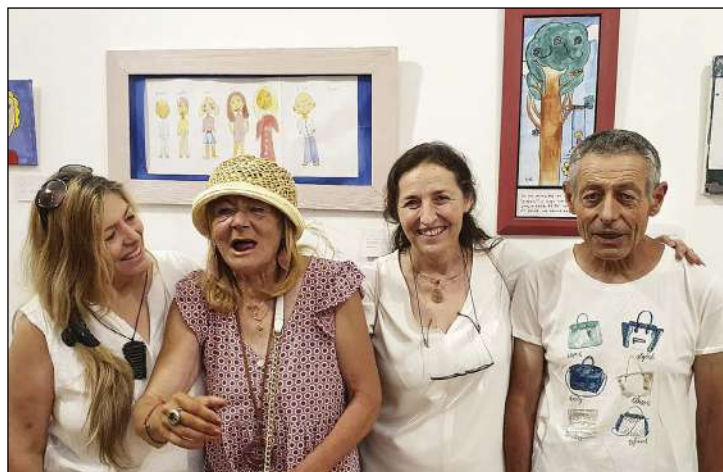
La autora, con sombrero, junto a algunos de sus hermanos

sencillez de los dibujos, donde la autora retrata a su familia, su animal favorito o sus gustos, junto con la profundidad y sinceridad de los textos que los acompañan, porque como bien reza uno de sus trabajos «si alguien juzga tu camino... préstale tus zapatos». La exposición se inauguró el 6 de junio con una gran asistencia de público, donde la autora estuvo arropada por familiares y muchos amigos. Puede visitarse hasta el día 19, en horario de 18 a 21 horas.