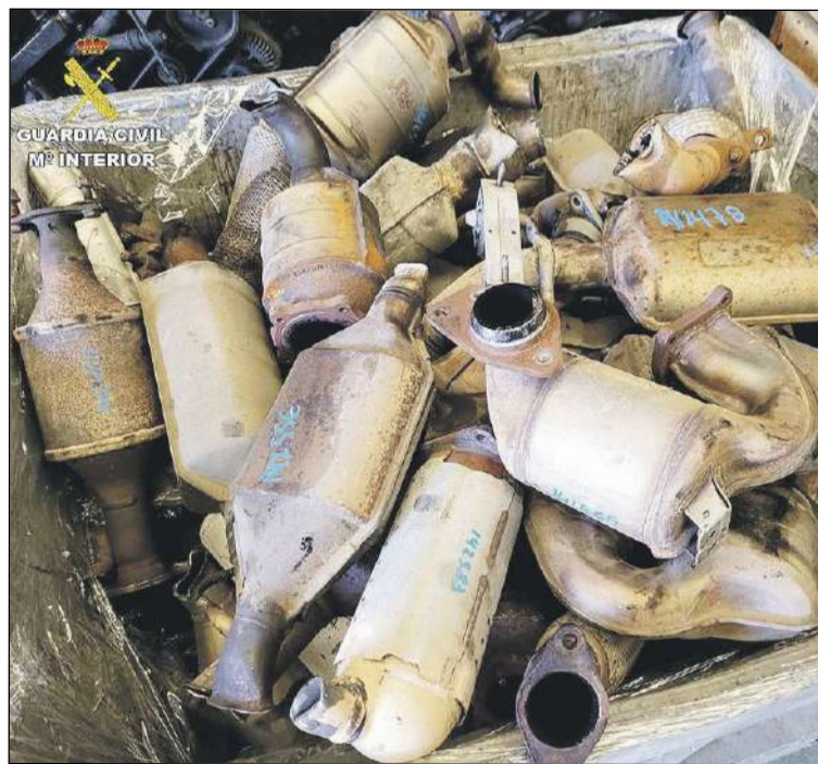
Los agentes han puesto a disposición judicial más de 10.000 catalizadores

La función principal de los catalizadores de los vehículos es la de reducir la contaminación producida al expulsar los gases al exterior. El aumento de los robos de estas piezas, se ha debido al incremento de los precios de los metales que lo componen, como el paladio y el platino, ya que actualmente el precio del gramo sobrepasa los 50 y 30 euros, respectivamente.