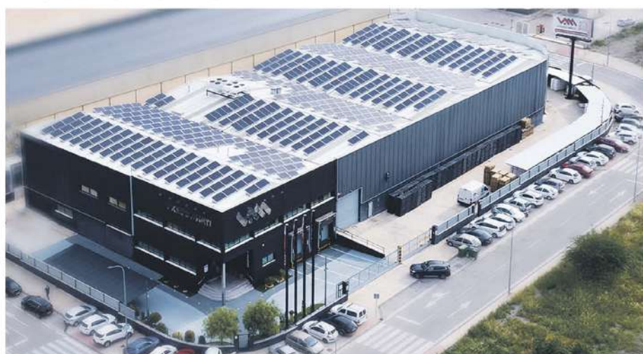
• Vicedo Martí, S.L. / 153,05 kWp