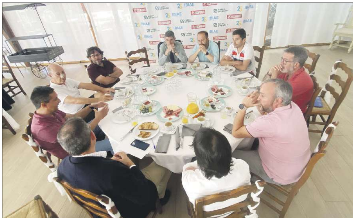
El desayuno empresarial, organizado por IBIAE en colaboración con Escaparate y Caixa Popular, se celebró el miércoles 1 de junio

La unanimidad de opiniones es clara. Es necesario cambiar el planteamiento y conseguir un museo que sea interactivo. «Para efectuar muchas actividades está limitado. En un museo de este perfil el visitante tiene que tocar la muñeca, manipularla y jugar con ella y contar con una visita teatralizada. Esa zona de acción no está presente en el museo, como sí está presente en una ludoteca. Se le ha dado más importancia al edificio que