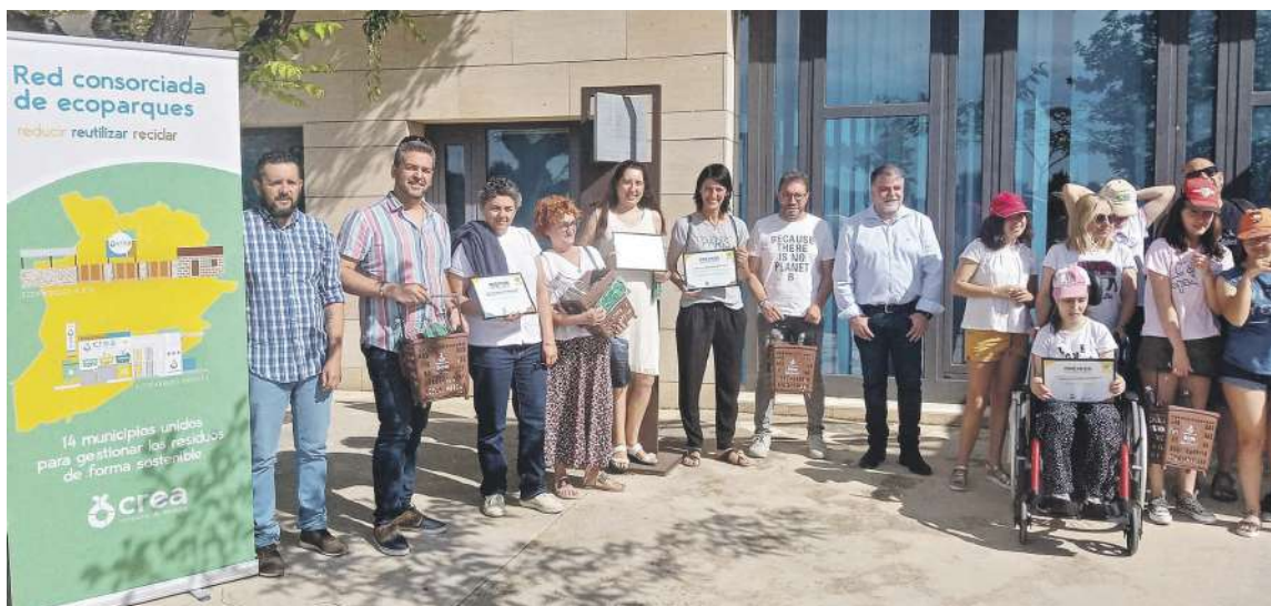
Los premios a los centros educativos se entraron el martes 7 de junio