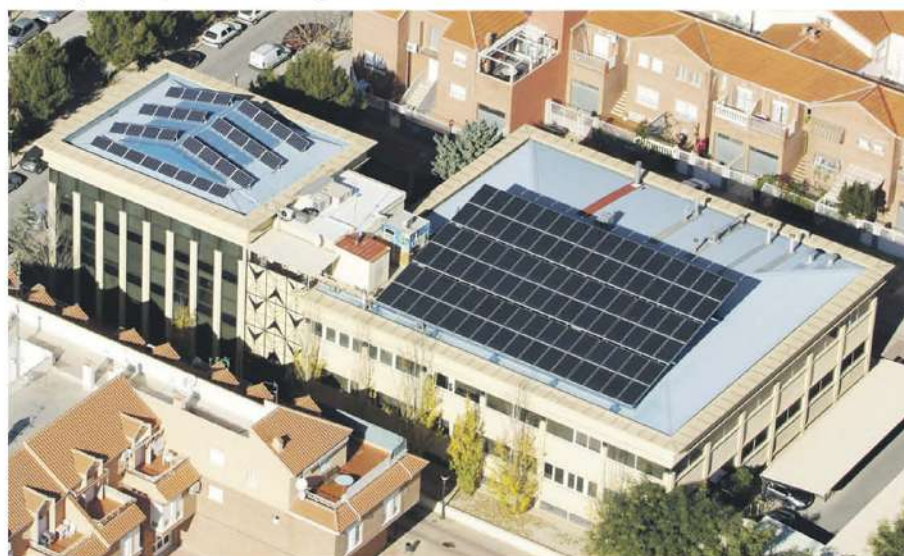
• AIJU / 40,30 kWp

C/ Cádiz, 38 - Polígono Industrial Alfaç III - Ibi Tlf. 96 655 36 08 / 902 10 30 84 / sitec@grupositec.com / www.grupositec.com