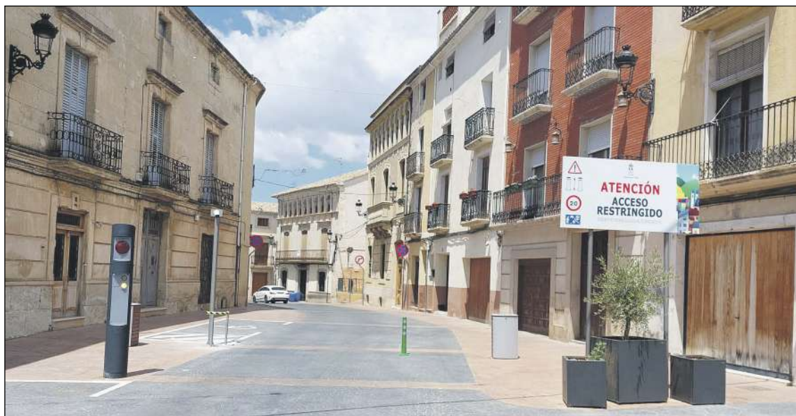
El acceso al casco antiguo desde la plaza de la Iglesia será a través de bolardo con lector de matrícula

Así pues, el 1 de julio el acceso desde la plaza de la Iglesia será a través de bolardo con lector de matrícula, ya que estará cerrado al tráfico, de lunes a viernes de 14:30 a 7 horas. Los sábados solo estará abierto de 10 a 12:30 horas y los domingos y festivos permanecerá cerrado las 24 horas.