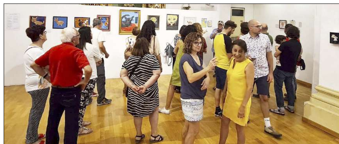
Inauguración de la muestra el lunes 6 de junio

El resultado es una colección que atrapa por el colorido y la