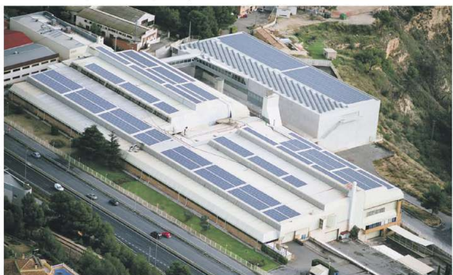
• Grupo Jover / 601,15 kWp