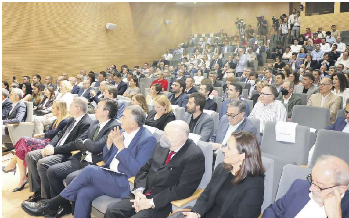
El evento reunió a más de 250 empresas y sectores en la sede de la Confederación Empresarial de la Comunitat Valenciana (CEV) en València