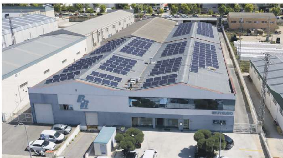
• Bru y Rubio, S.L. / 88 kWp