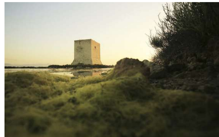
La fotografía de Vicente Guill, premio en la categoría de Patrimonio