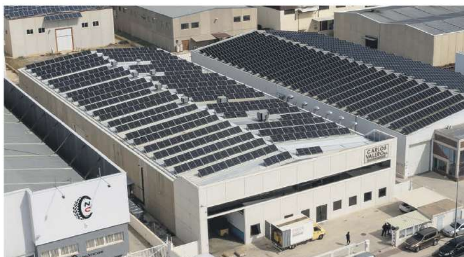
• Carlos Valero, S.L. / 108 kWp