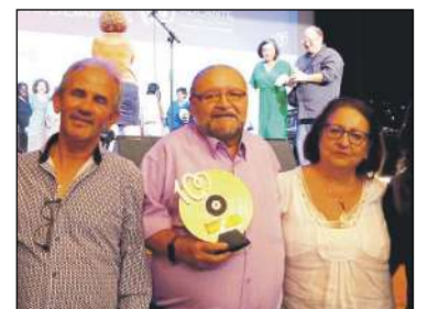
ADSPA, galardonada en los I Premios Solidarios Cadena Cien Alicante

Mundial de la Donación de Sangre. Los donantes de sangre estamos bastante olvidados de los medios de comunicación, aún y eso en España, los DONANTES y los PROFESIONALES SANITARIOS de la transfusión sanguínea, dan respuesta a las más de cinco mil transfusiones diarias, con el espectacular resultado de salvar la vida a más de ochenta personas cada día y mejorar la salud y calidad de vida de muchas más.