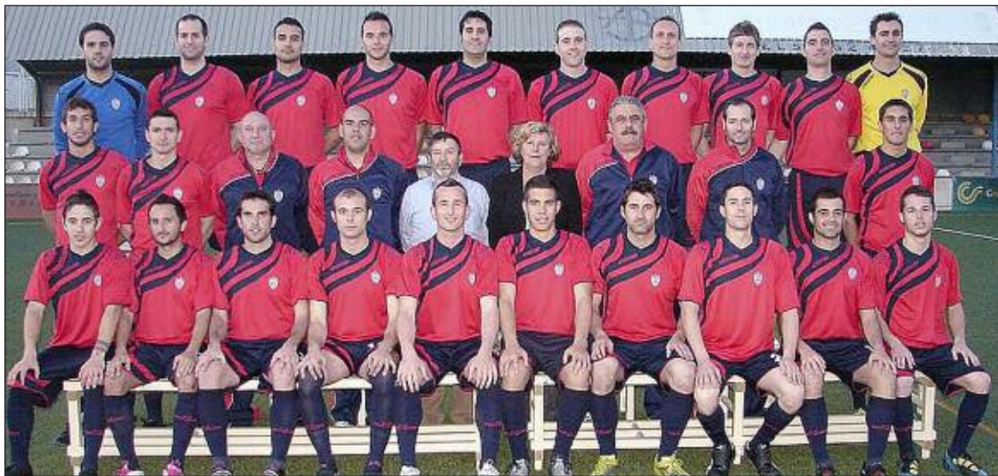
Plantilla, directivos y cuerpo técnico del Rayo Ibense Sénior