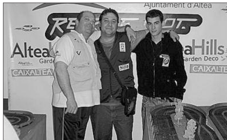
Podio con los tres primeros clasificados de la prueba disputada en Altea

Posteriormente se procederá a la elección de sedes para la segunda fase (con dieciséis equipos clasificados), que se jugará los días 21 y 22 de mayo, informan fuentes del Club de Billar Caseta Nova.