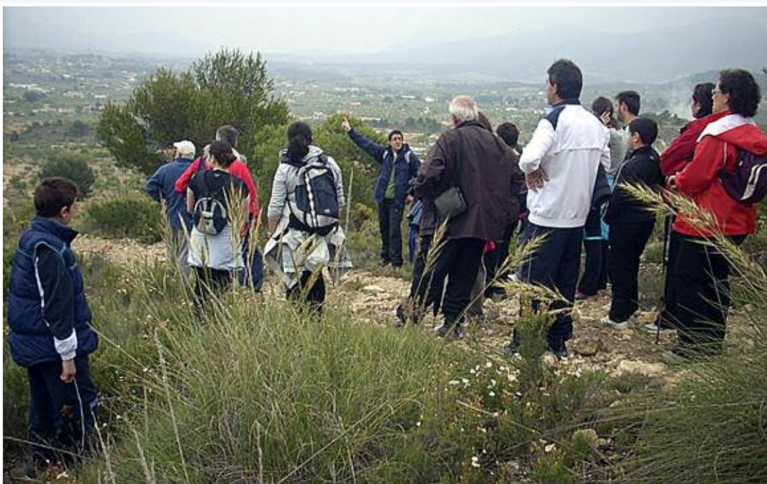
El guía explica a los excursionistas detalles sobre el uso que se le dio a este sendero castallense durante la Batalla de Castalla (Guerra de la Independencia)

Asimismo, también fue un éxito, aunque la lluvia impidió que participaran todos los inscritos, la visita guiada a un sendero utilizado durante la Batalla de Castalla, en plena Guerra de la Independencia.