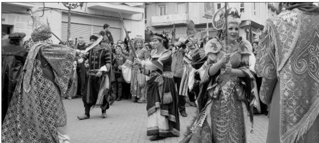
Una lucha con espadas entre componentes de ambos bandos, en la plaza Mayor