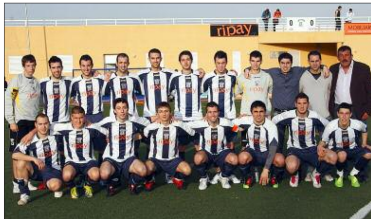
Plantilla del CF Castalla