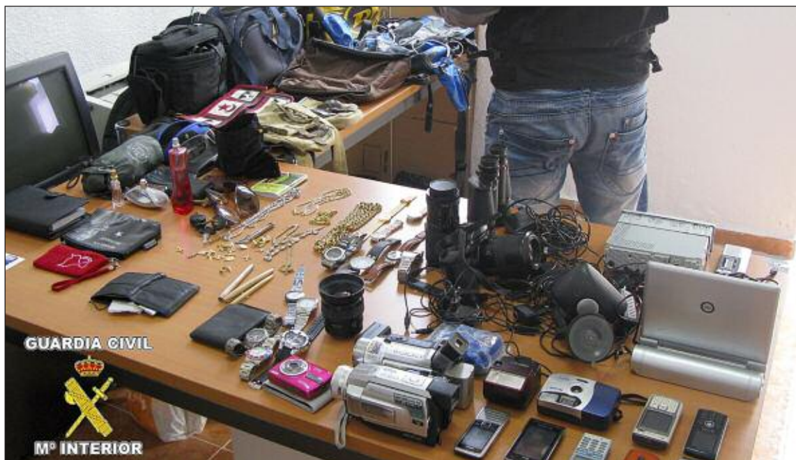
Entre los objetos se encuentran teléfonos móviles, cámaras fotográfica, GPS, joyas y bolsos, entre otras cosas

Las poblaciones afectadas por los robos son Ibi, Onil y Castalla, principalmente, aun-