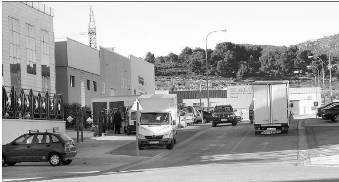
La industria es el sector que más empleo ha destruido en abril

El cómputo general deja en abril 57 desempleados más en las comarcas de l'Alcoià, Com-