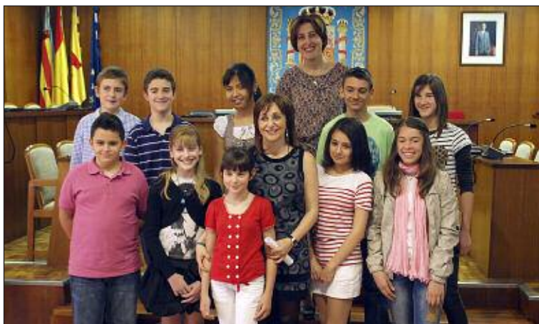
Los alumnos junto a la alcaldesa y la concejal de Educación

Portada de la revista del PSOE editada a principios del mes de abril