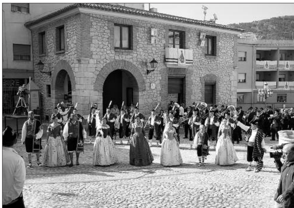
Acto de la guanyada del castell, protagonizada por el bando cristiano