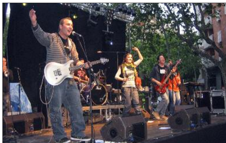
Actuación del grupo Pellikana en el Passeig de Sant Joan de Barcelona

Pellikana prevé el lanzamiento de un disco de estudio.