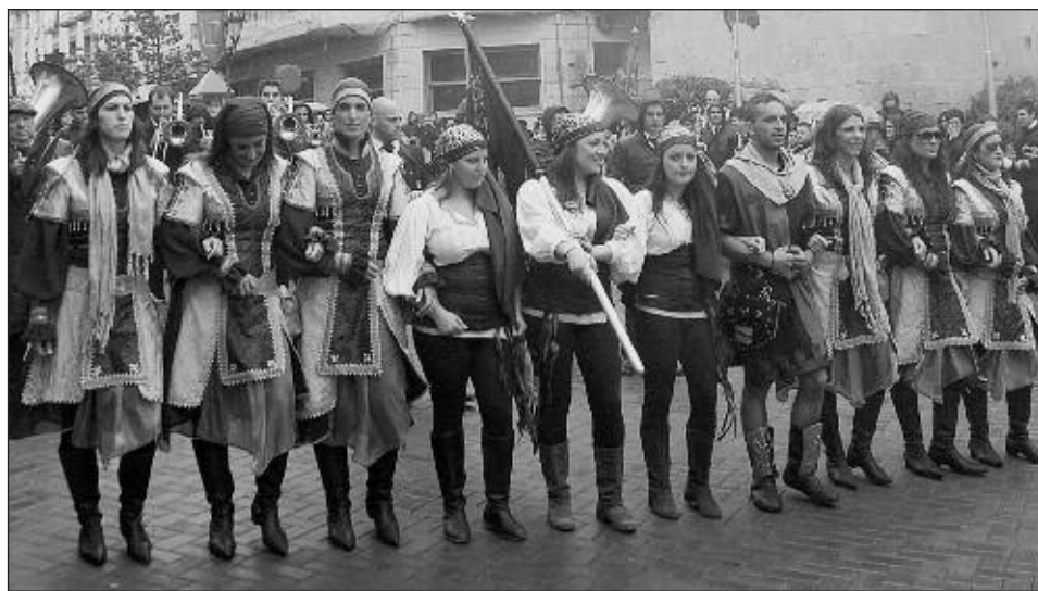
Capitanía Crisrians 2012: un grupo de amigas