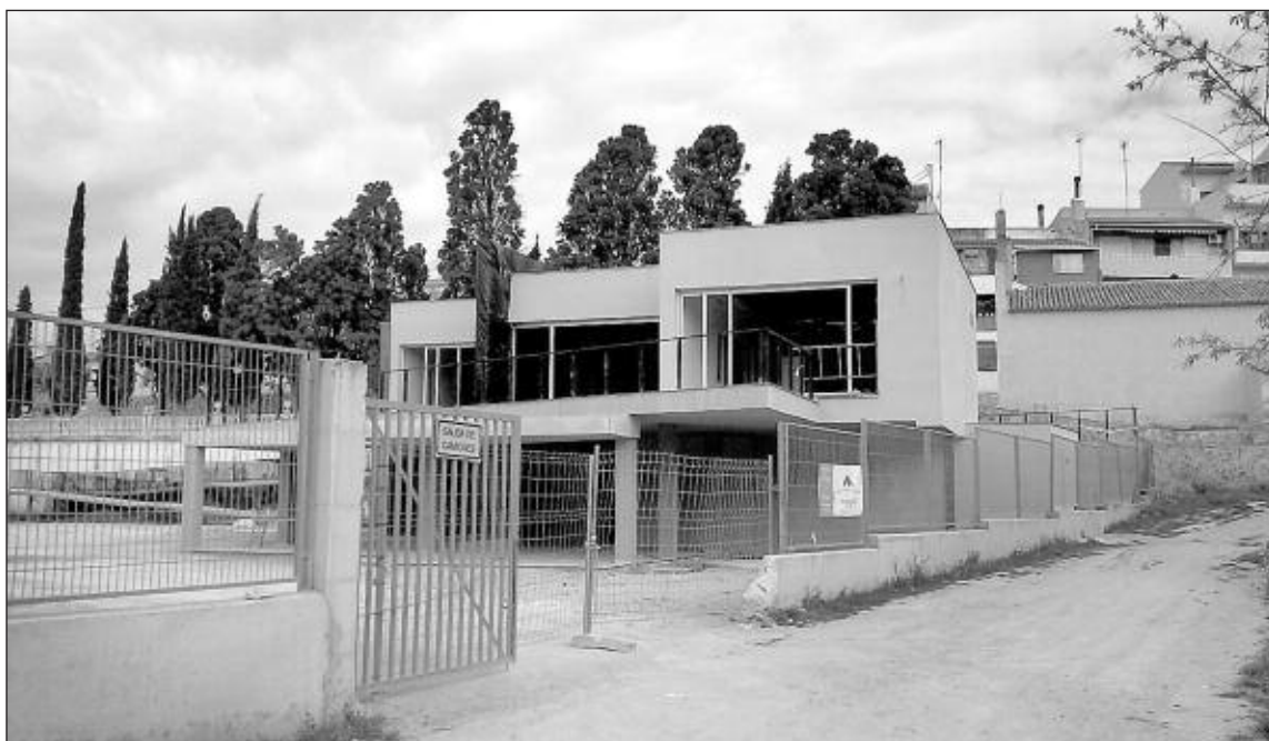
Edificio de la nueva guardería y comedor escolar

Divertidos y originales fueron los coches que se construyeron para participar en la carrera de coches locos que organizó el Ayuntamiento el 17 de abril, con motivo de las I Jornadas de la Juventud. No sólo lo pasaron bien los participantes sino los cientos de vecinos que salieron a la calle a disfrutar del evento.