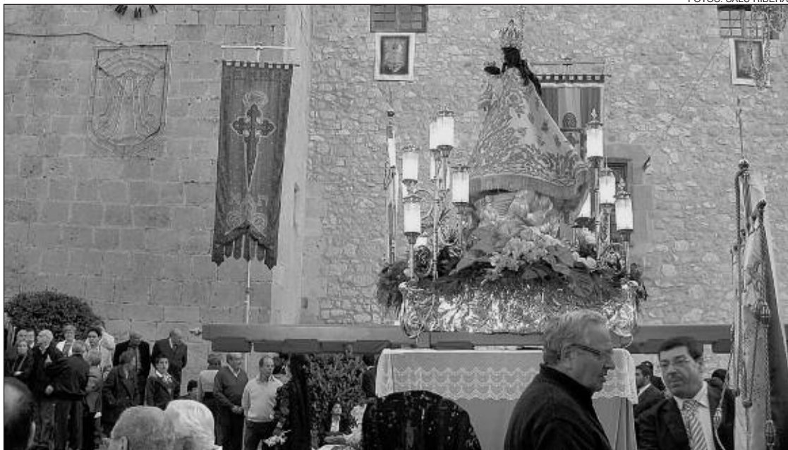
Momento de la procesión de la despedida de la Patrona de Onil, la Virgen de la Salud