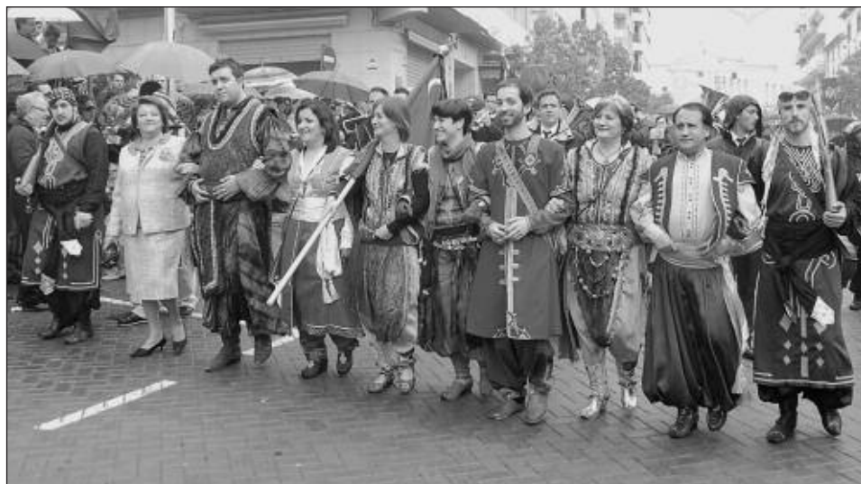
Capitanía Marrocs 2012: miembros de dos familias