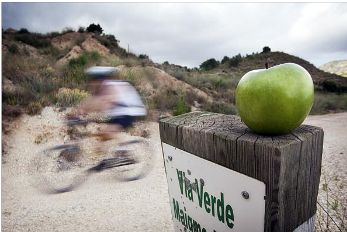
Fotografía titulada 'Vida saludable', de Vicente Guill Fuster

El trabajo de Vicente Guill Fuster lleva por título 'Vida saludable', y recoge una escena de un ciclista en movimiento, por una ruta del Maigmo, mientras en primer plano aparece una espléndida manzana.