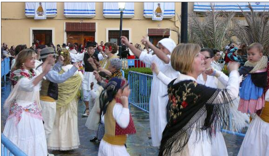
En las fiestas del pasado año participaron más de 500 parejas en el baile