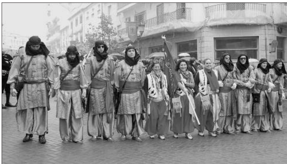
Capitanía Moros 2012: un grupo de amigas