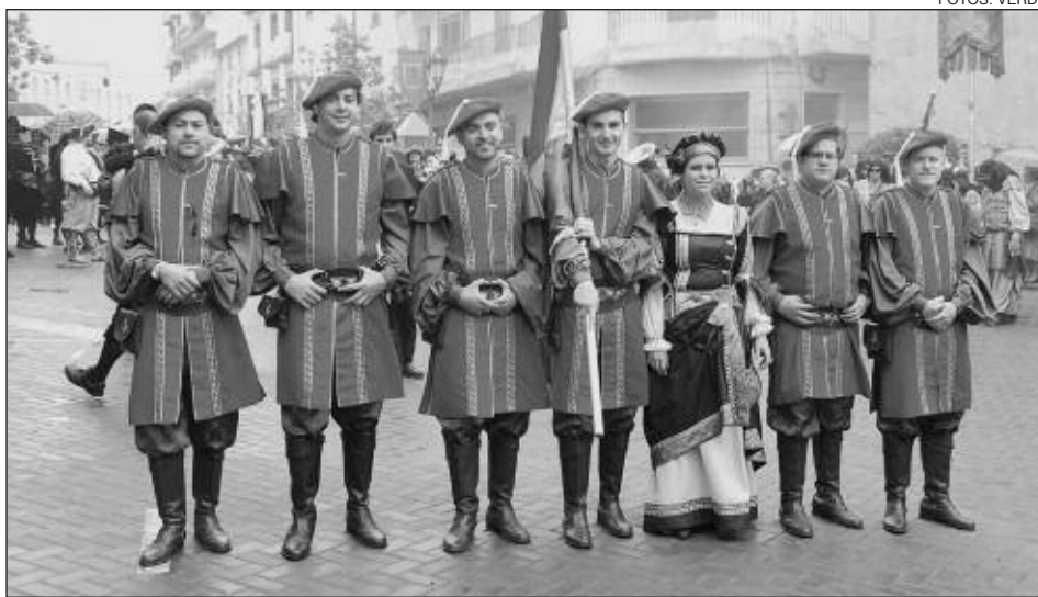
Capitanía Vizcaínos 2012: escuadra 'Sense pressa'