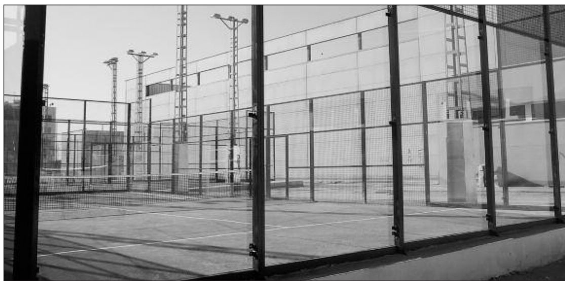
Pistas de pádel donde se celebrará el campeonato