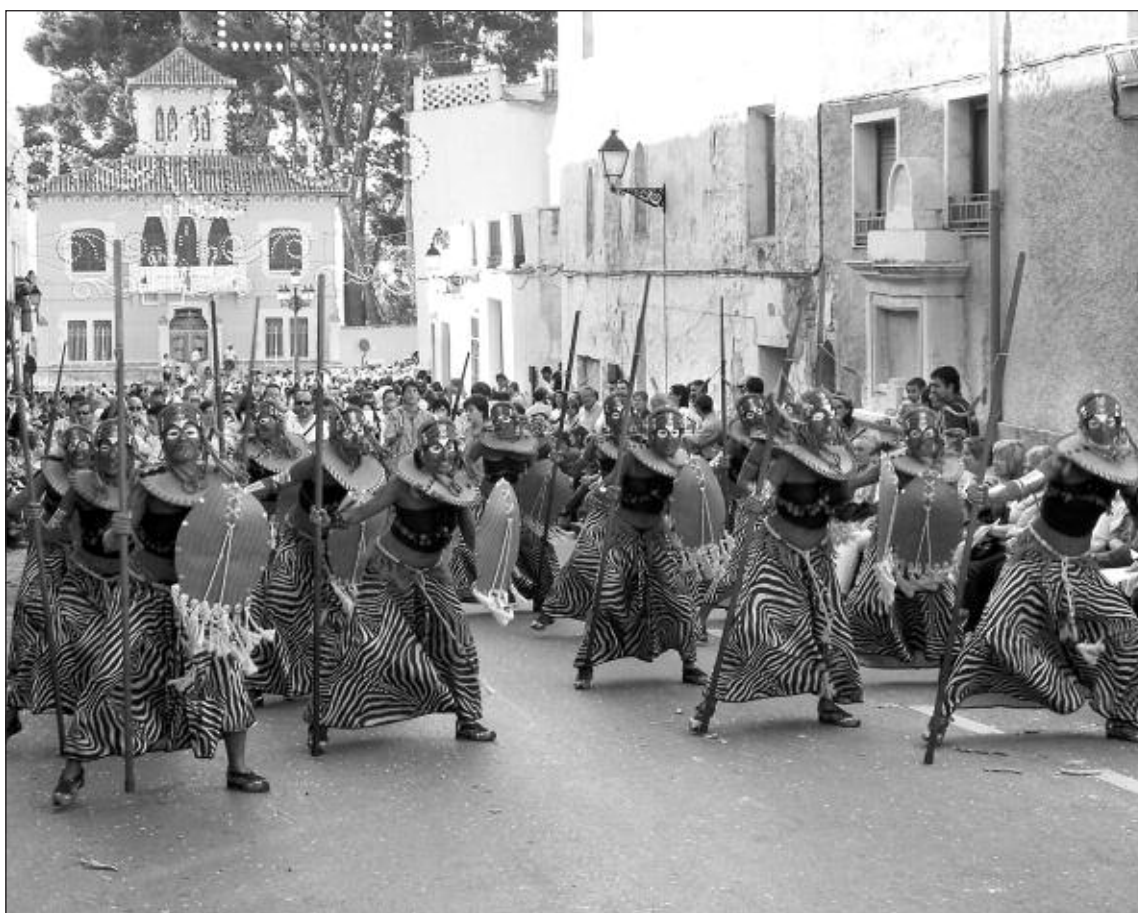
Las fiestas de Biar cuentan con uno de los mayores censos festeros de la comarca