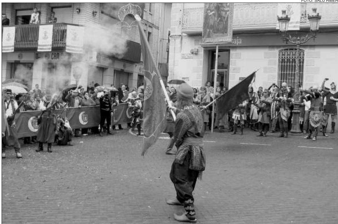
Momento de la espectacular Ballà de Banderes en la plaza Mayor

- Moros Artistas: algunos miembros de la escuadra 'Al-Hasim'.