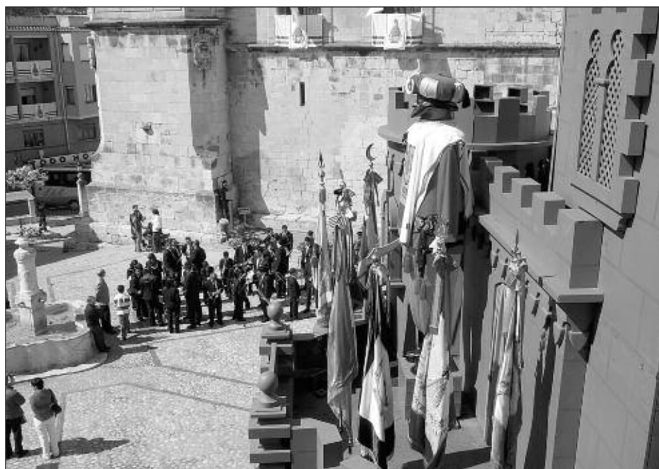
El Castillo presidido por la efigie de la Mahoma