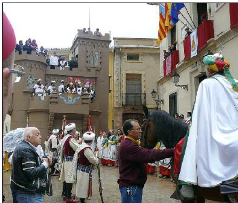
Acto de la Embajada de las fiestas del pasado año