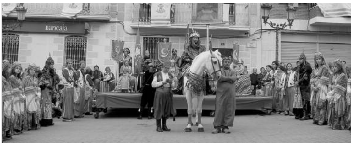
Momento de la Embajada, justo delante del Palacio del Marqués de Dos Aguas