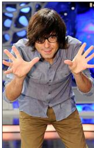
El humorista Luis Piedrahita

-Sábado 4 (20:30): monólogos humorísticos de Luis Pie-