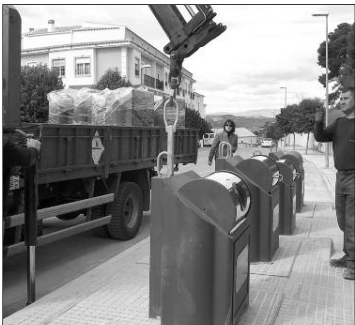
Los contenedores terminaron de instalarse en el mes de febrero