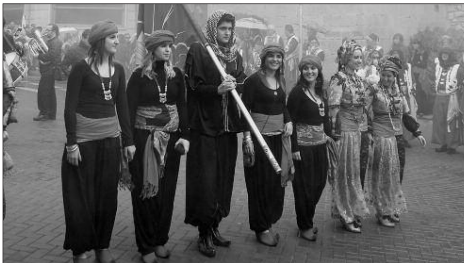
Capitanía Moros Artistas 2012: parte de la escuadra 'Al-Hasim'