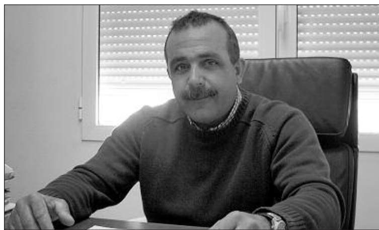
Ferrara explica que el debate podría celebrarse en el teatro

Ferrara considera que sería un buen ejercicio democrático y beneficioso para los vecinos "porque se podrían aclarar muchas cuestiones y rumores".