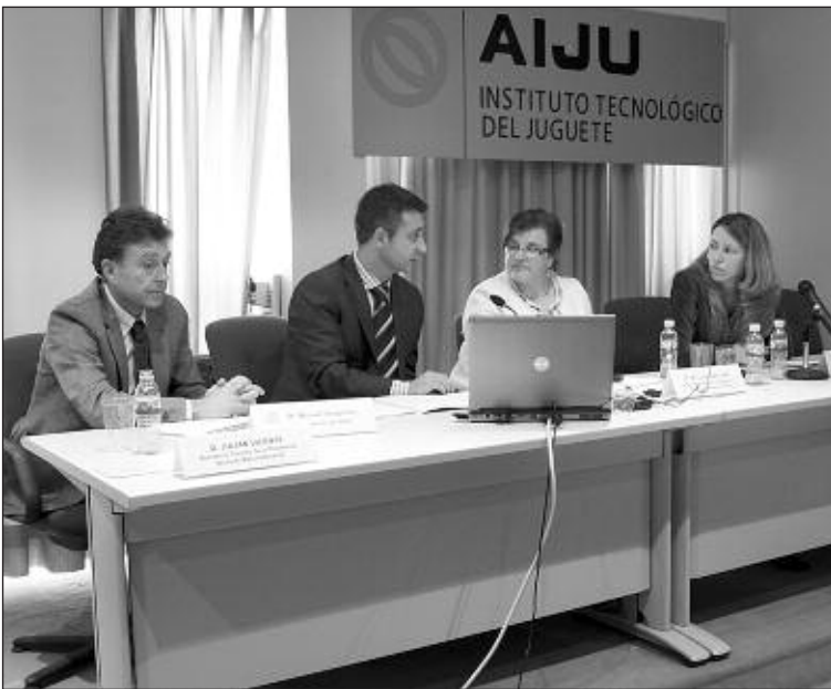
La presentación tuvo lugar el 28 de abril en AIJU

Participan cuatro institutos tecnológicos