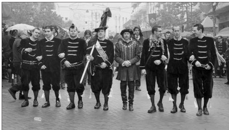
Capitanía Estudiantes 2012: escuadra 'La coca de sardina fa cremor'