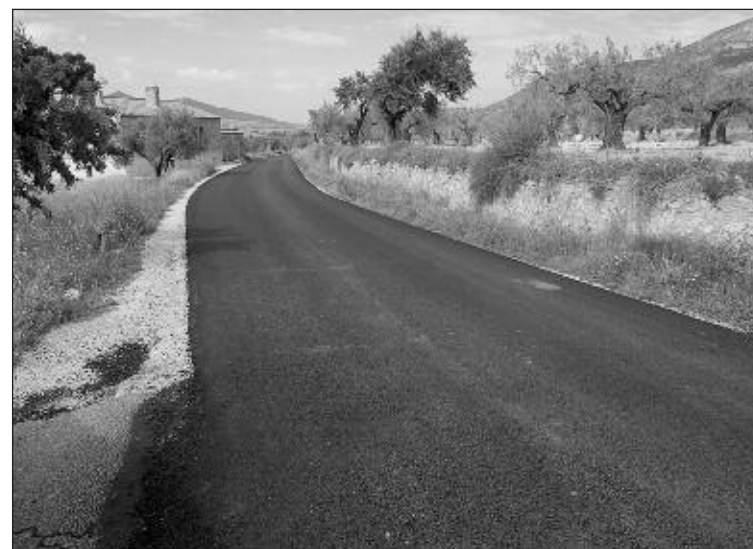
Inicio del camino viejo de Sax, recién asfaltado