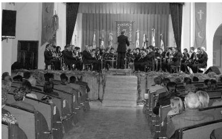
El concierto tendrá lugar el domingo 8 de mayo

El domingo 8 de mayo, a las 19 horas, tendrá lugar en el auditorio de la Casa de Cultura de Biar el II Concierto de Música festera a cargo de la colla de dolçaines i tabals La Bassa la Vila y un grupo de músicos de Biar y Campo de Mirra.