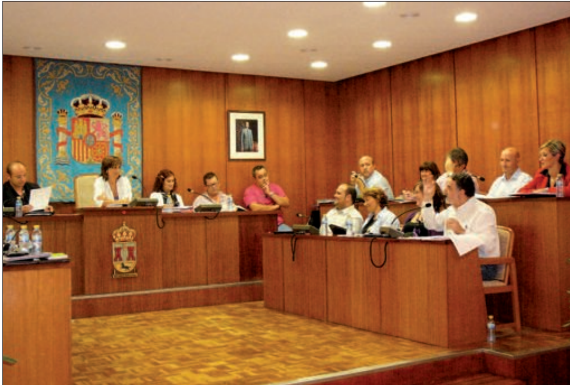
El Pleno comenzó a las dos y media de la tarde y finalizó pasadas las cuatro y media

Impone al Ayuntamiento una “sanción pecuniaria” que asciende a 6.250 euros y propone también la pérdida automática de las ayudas para los programas de empleo.