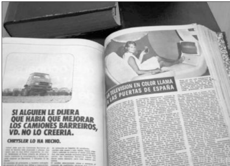
Uno de los volúmenes recoge el ejemplar del diario ABC donde se anunciaba la llegada a España de la televisión en color