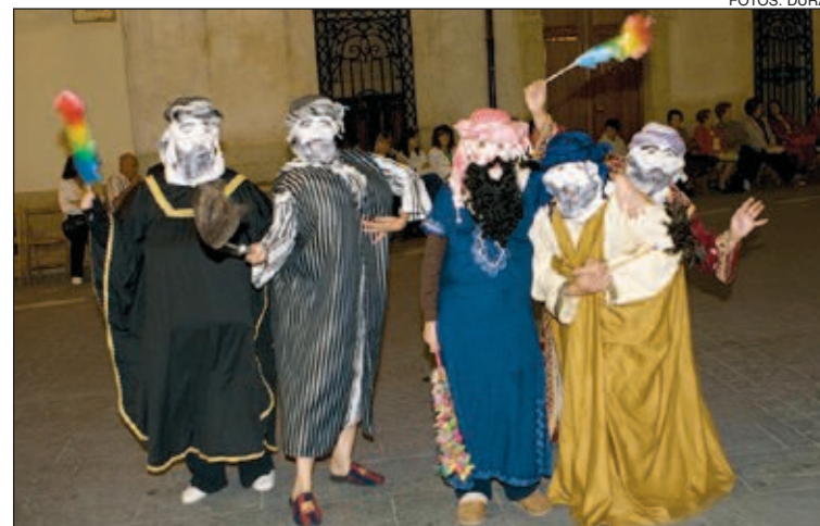
Las tradicionales 'Carasses' no faltaron en la Plaza Mayor