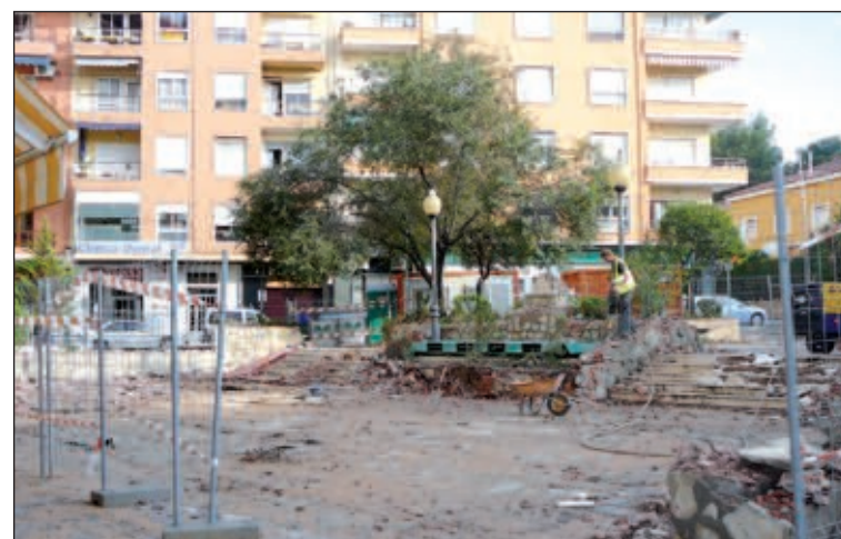
Estado actual de la Plaza de la Tartana

plataformas que estarán unidas por rampas, "cumpliendo con la normativa de accesibilidad" y, además, dos cenadores, un quiosco, una fuente para el monumento de la Tartana y grandes relojes. Las obras está previsto que terminen antes de fin de año. Con la nueva plaza y las recién inauguradas rotondas, se crea un espacio totalmente reformado en esa zona, a la que se le dota de nuevos servicios y mejoras para los vecinos, explica Agüera.