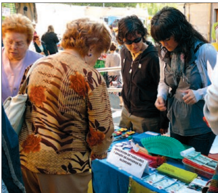
Mesa de la asociación de Alzheimer en una de las puertas del mercado