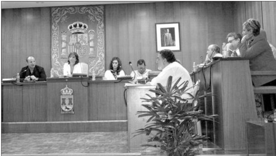
PSOE, EU y ADli votaron en contra de la aprobación de las cuentas generales de 2008

Verdú indicó que las cuentas no son creíbles al no estar contabilizada la caja B del Polideportivo o las facturas de