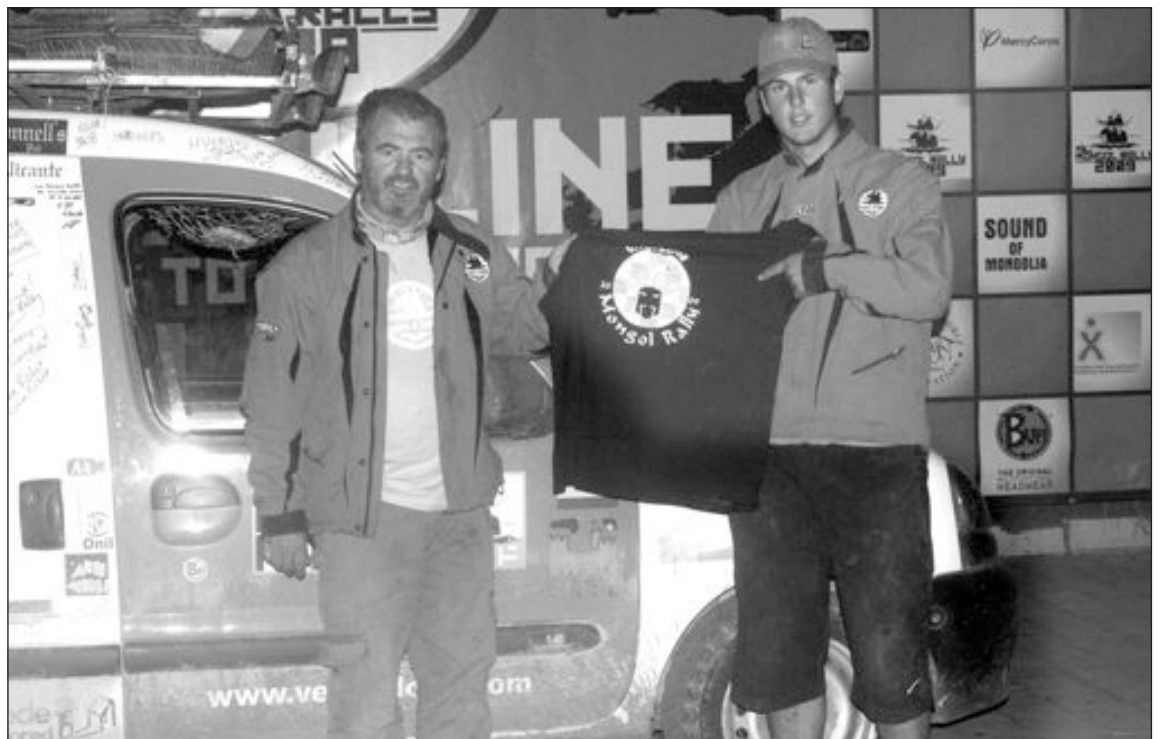
Muy cansados, pero tremendamente satisfechos, los colivencs celebran su llegada a Ulan Bataar

También hemos visitado el Darvaza Crater o Puerta del