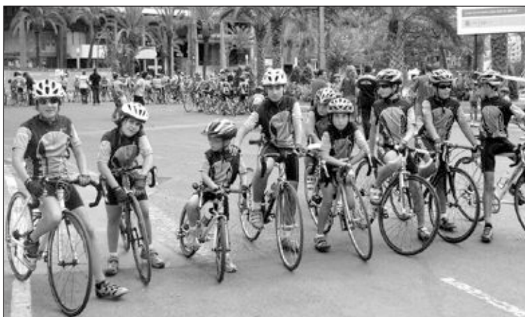
El equipo de Castalla se toma un respiro en la rotonda de Luceros