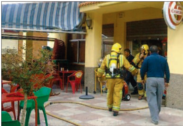
El incendio se desató a causa del aceite quemado de una freidora

La cocinera fue trasladada al centro médico de la localidad y posteriormente, al Hospital de Alicante.