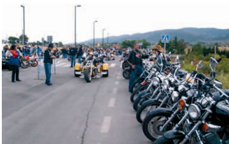
Los moteros aparcaron sus 'máquinas' en la zona de ocio de Ibi