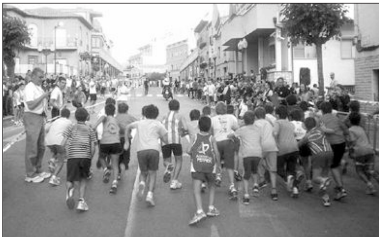
En la prueba hubo cabida para niños y mayores

La semifinal será el domingo 4 de octubre a las once de la mañana, mientras que la final se jugará ese mismo día a las cinco de la tarde.