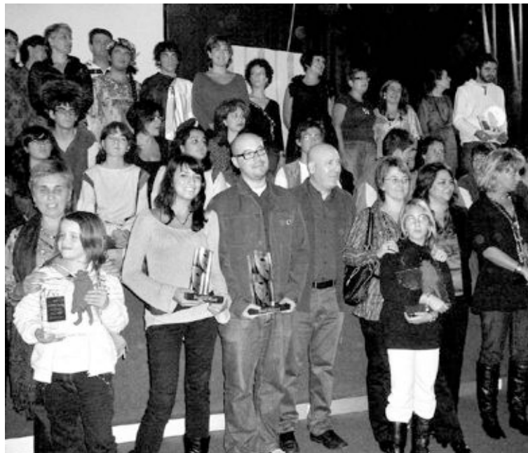
Algunos de los premiados en la pasada edición del concurso

El segundo día, el drama Destinatario desconocido , basada en la novela 'Paradero desconocido' de Kressmann Taylor, de la mano de La Garnacha Teatro de Logroño y, el tercero, una comedia muy divertida