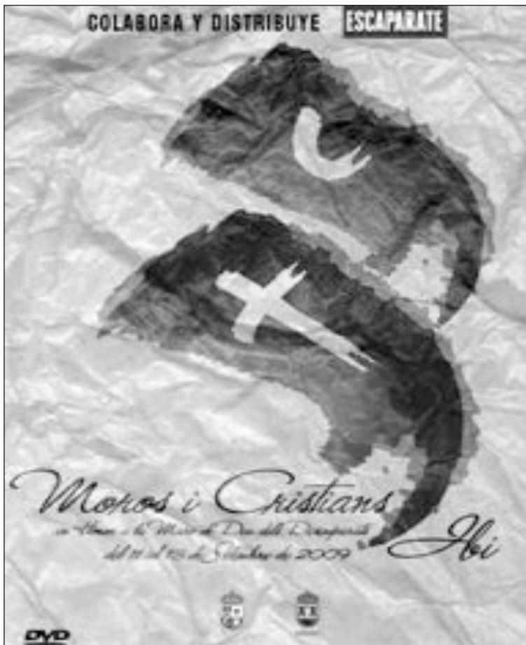
Carátula del DVD que se entregará con el periódico el próximo 2 de octubre

Con esta fórmula la Comisión consigue sacar a la luz este coleccionable, que este año edita el nº 20, con mucha mayor antelación que en pasadas ediciones, apostando también por dar más protagonismo