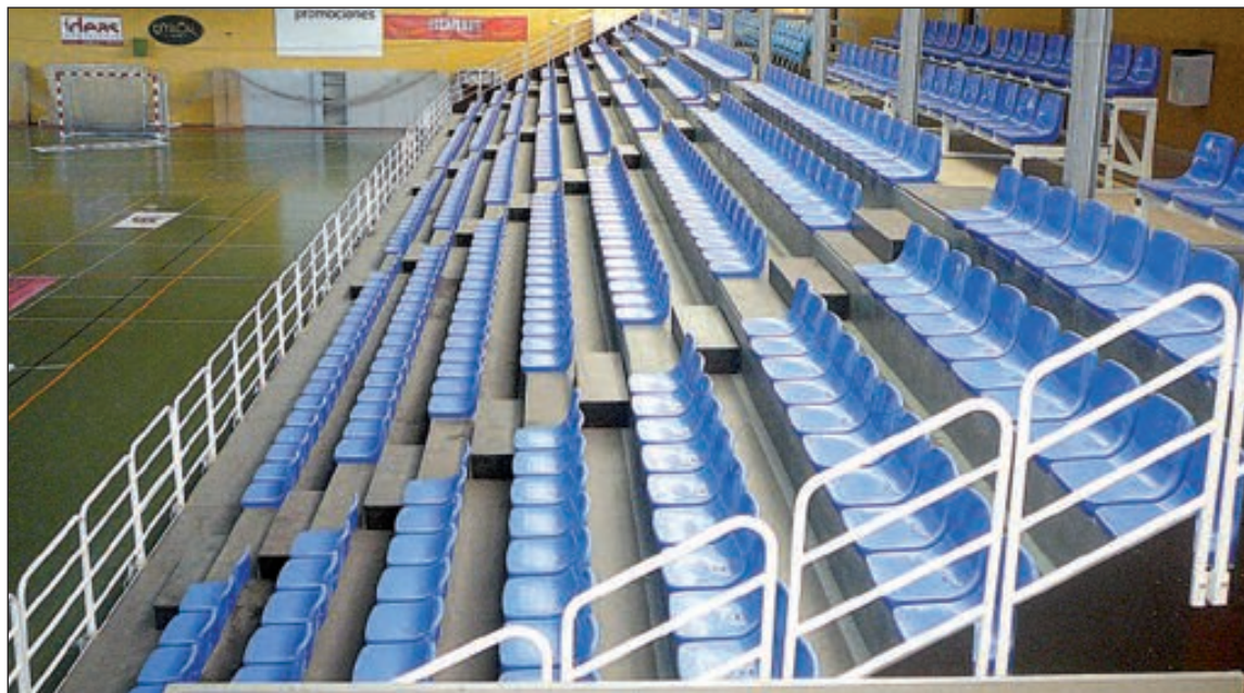
Las gradas del pabellón uno no cumplen la normativa vigente y deben adaptarse antes de poder ser usadas

están abiertas dos pistas exteriores de tenis y se están realizando obras en otra, la situada junto al colegio Derramador, para la práctica del fútbol sala.