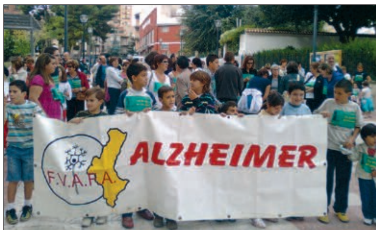
La vuelta solidaria se realizó aprovechando la soleada mañana

También se está organizando un curso de manipulador de alimentos.