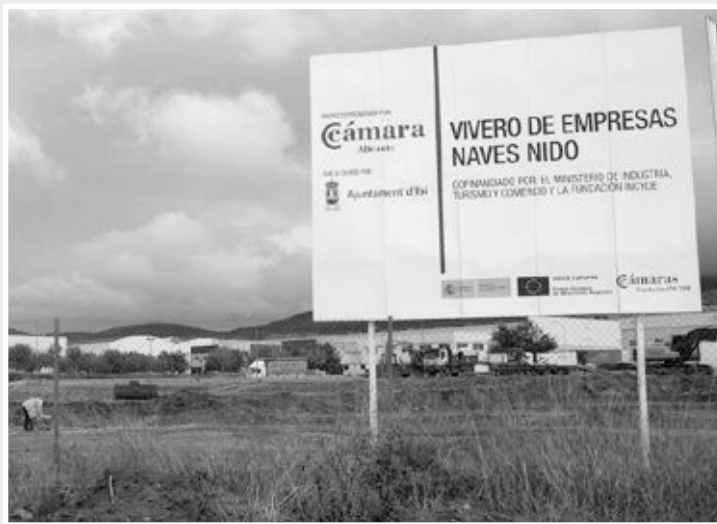
Cartel anunciador del futuro vivero de empresas