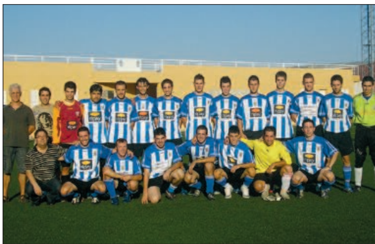
Plantilla del equipo Sénior del Castalla CF

Comentario: La temporada 09-10 comienza de la mejor manera posible para el Castalla CF, que se impuso con claridad al Banyeres por 4-2 (goles de Adrián, 1, y Lledó, 3) y demostró una ambición que dará mucho que hablar.