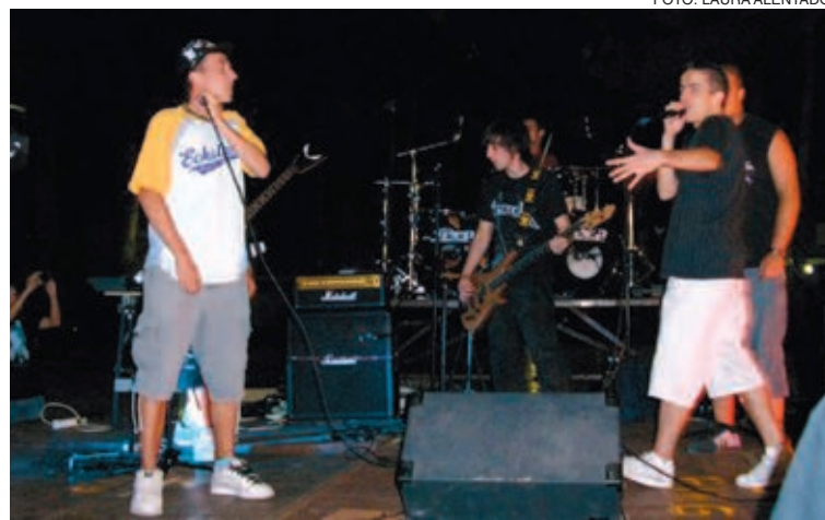
Rap y rock se fusionaron unos minutos con Santa Morte y Kubbe

Santoyo explicó que ha quedado patente que la villa juguetera "cuenta con una gran cantera de grupos de música que desean formar parte del IbiRock, y ello nos empuja a comenzar a trabajar desde ya en la edición de 2010, que ya adelanto que no será tan entrado el mes de