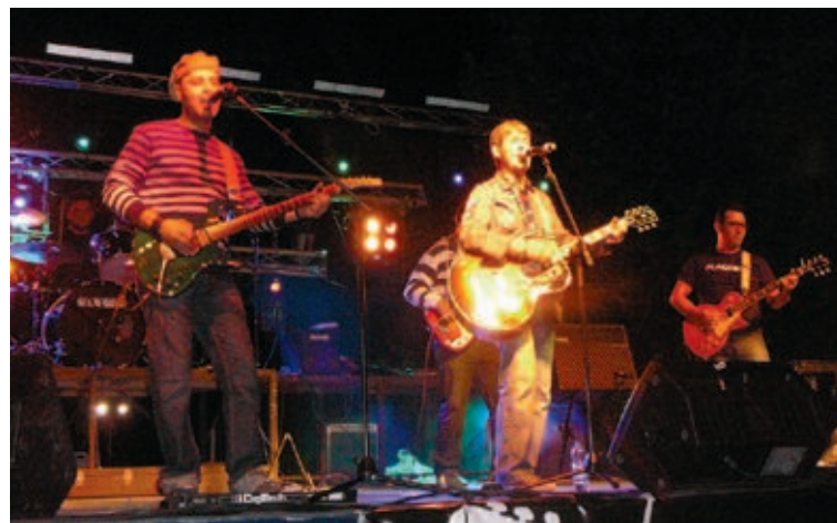
Los Dalton, un grupo veterano que vuelve con fuerza

septiembre para evitar las inclemencias meteorológicas".