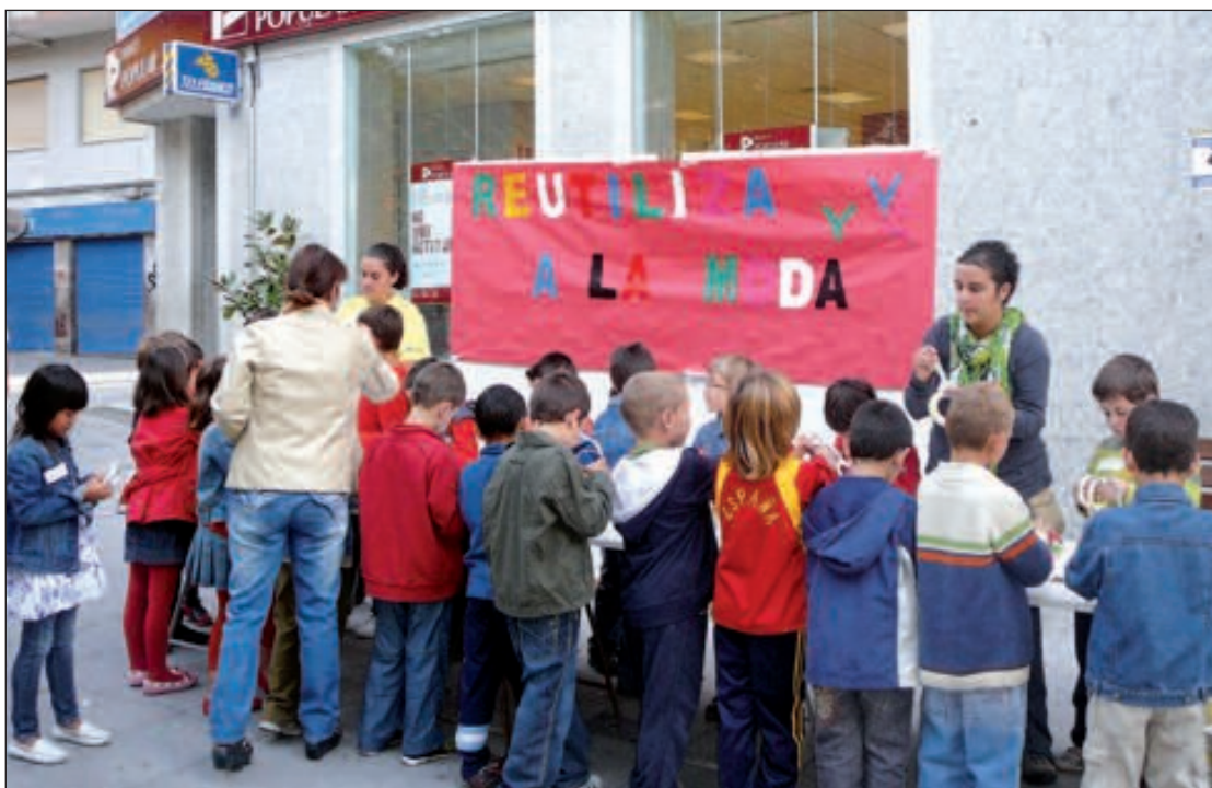
Los talleres medioambientales no comenzaron hasta el jueves por culpa de la lluvia

Mai estem tots representarán la obra que resulte este año ganadora.