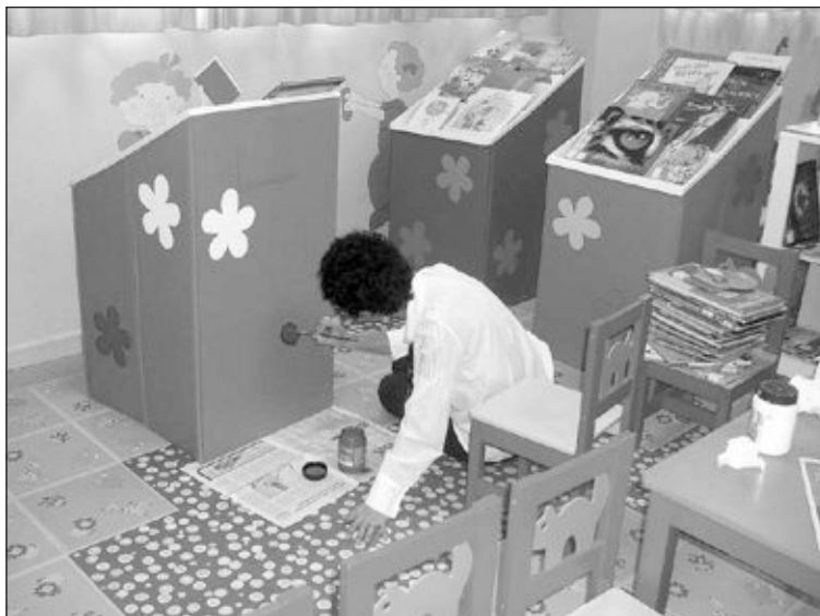
Una voluntaria decora una mesa de la sala infantil de la Biblioteca