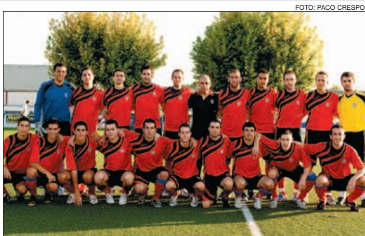
Plantilla del Rayo Ibense en Primera Regional para esta temporada

trolado para los rojillos, que en quince minutos fueron capaces de colar dos tantos y descolocar a los jugadores locales.