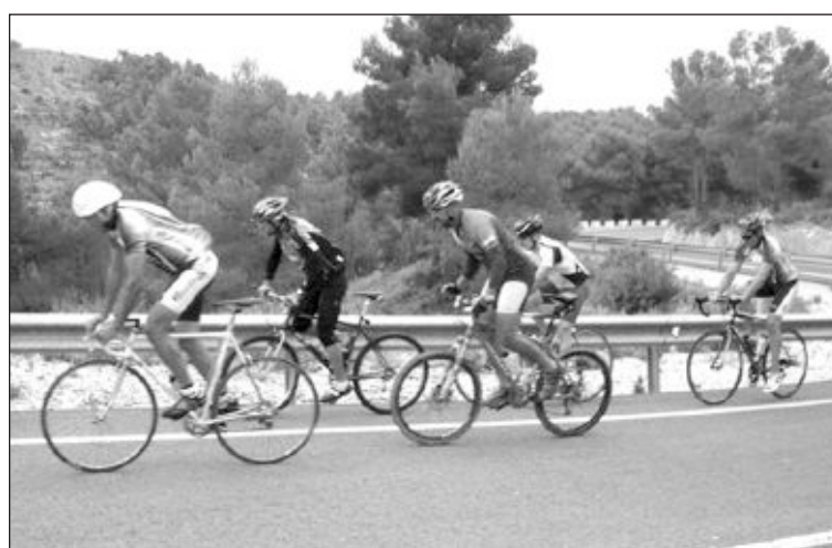
Un momento duro de la Subida al Canalís

En Onil se conoce como el Canalís el tramo de la carretera CV-803 entre la villa muñequera y la localidad de Banyeres de Mariola.