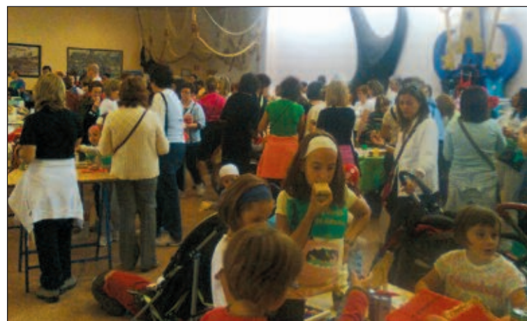
El rastro solidario, en la comparsa Mariners, recibió cientos de visitas