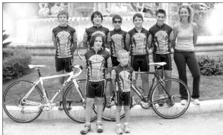
Los chavales posan delante de la fuente de Luceros