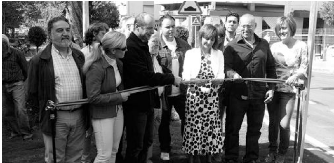
La alcaldesa, acompañada de concejales de la corporación, inauguraba el jueves a mediodía las rotondas

Respecto a la construcción de las rotondas en la avenida Juan Carlos I, la primera edil