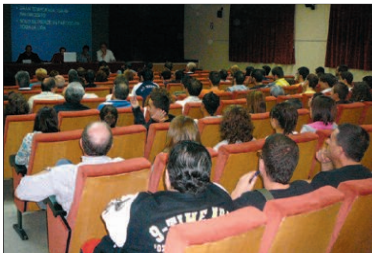
El salón de actos del Centro Social Polivalente de Ibi albergó la asamblea

Otra de las cuestiones tratadas, que preocupa tanto a la directiva como a padres y ju-