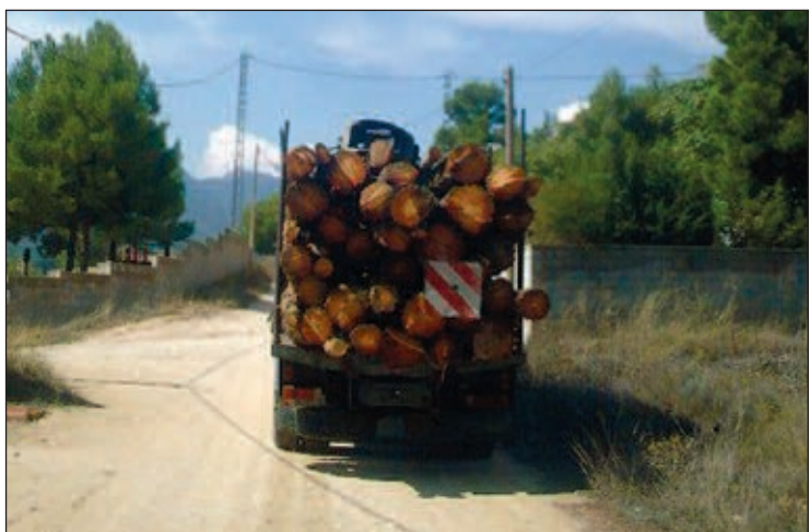
La tala se está efectuando en una finca cercana a la urbanización Terol