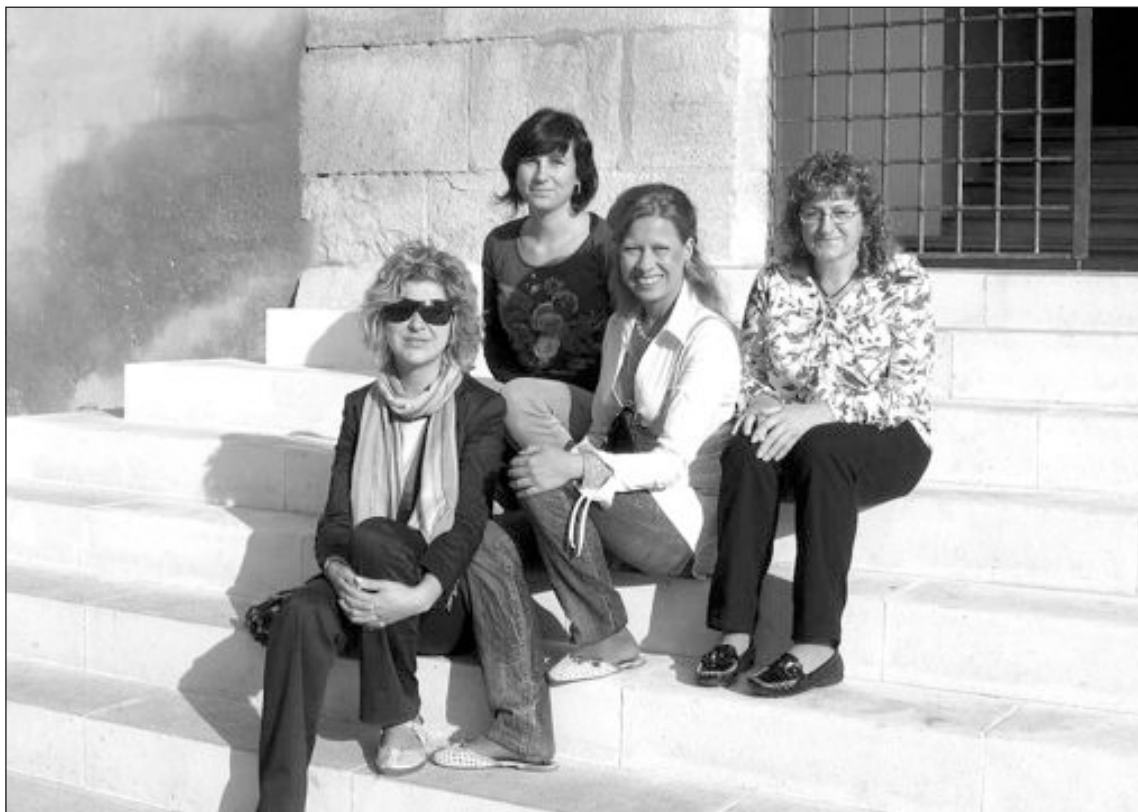
Representantes de los comercios de Onil que han obtenido el distintivo de calidad

fuerzo diario; así, se encarga la propia Conselleria y la FVQ (Fundación Valenciana de la Calidad) de difundirlo y de editar guías para que los