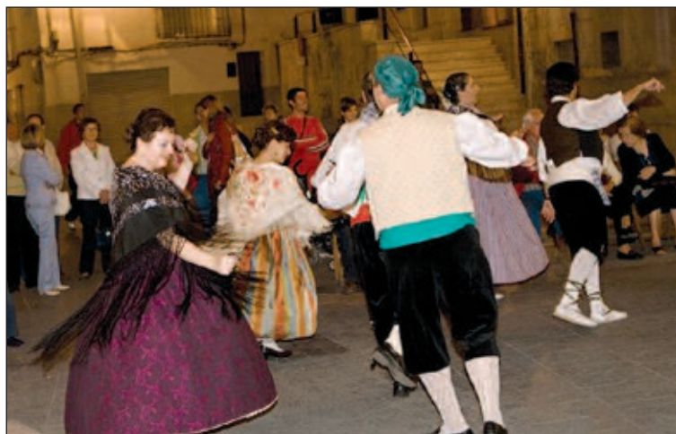
El viernes participaron 20 parejas, además de personas del público

El día más concurrido fue el viernes, donde participaron 20 parejas, y numerosos espectadores se animaron a salir a bailar. Fueron, en definitiva, dos jornadas dedicadas a revivir tradiciones ancestrales.