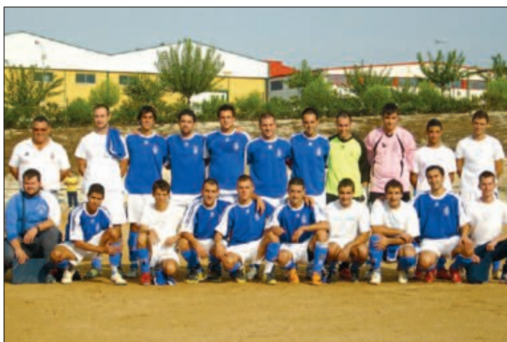
Plantilla de la Unión Deportiva Onil

a las obras del césped que al final comenzaron la semana pasada, en el seno de la UD Onil no pueden disimular cierto mosqueo, pues las consecuencias de esa inactividad ya se han dejado notar en el primer partido. Hubo ilusión y ganas, pero faltó práctica.