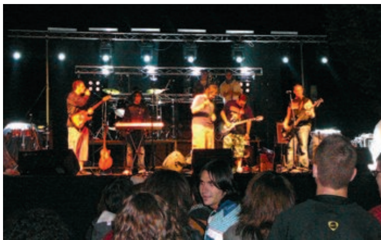
Kontaminació Akústica abrió el Festival el viernes a las diez de la noche