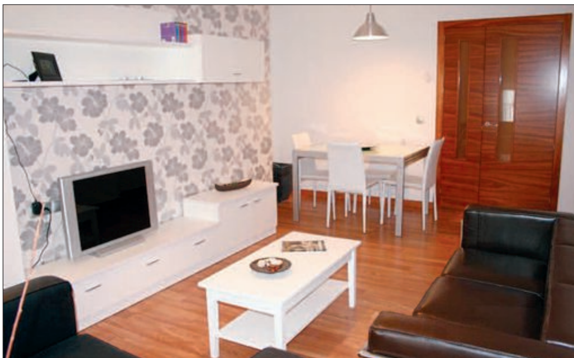
Como una imagen vale más de mil palabras, qué mejor que visitar el piso piloto

Son viviendas que van desde los 56 metros cuadrados, con dos dormitorios, hasta un máximo de 90, con tres dormitorios, a las que puede optar cualquier persona, aunque, sin lugar a dudas, los más beneficiados son los jóvenes menores de 35 años, habitualmente mileuristas, dado que, si es su primera vivienda, pueden conseguir hasta 39.000 euros de ayudas. También son ideales para separados, divorciados o mayores de 35 años, siempre que sea su primera vivienda o no tengan ninguna otra, dado que este sector de población puede optar hasta a 26.000 euros de ayudas.