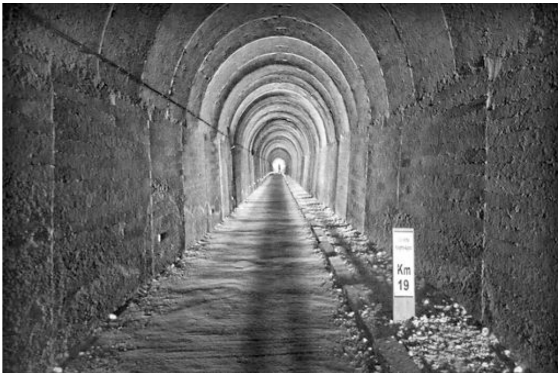
La fotografía ganadora del tercer premio lleva por título 'La sombra del túnel'

El concurso ha contado con la participación de más de 500 fotografías de toda España, de las que se preseleccionaron 50 finalistas. Todos los trabajos están expuestos en la página www.viasverdes.com y pronto recorrerán España en una exposición itinerante.