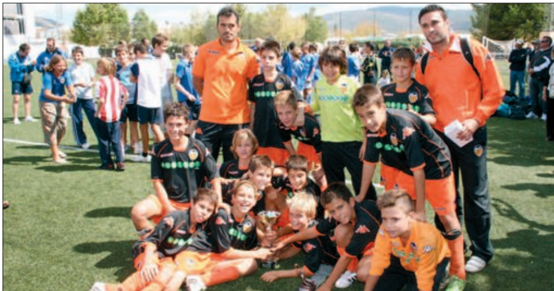
El Valencia CF Alevín celebra su triunfo en el estadio Vilaplana Mariel

La satisfacción fue total tanto entre la organización como en los participantes.