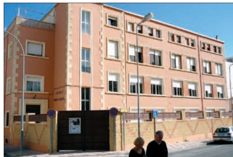
Exterior del colegio María Asunta