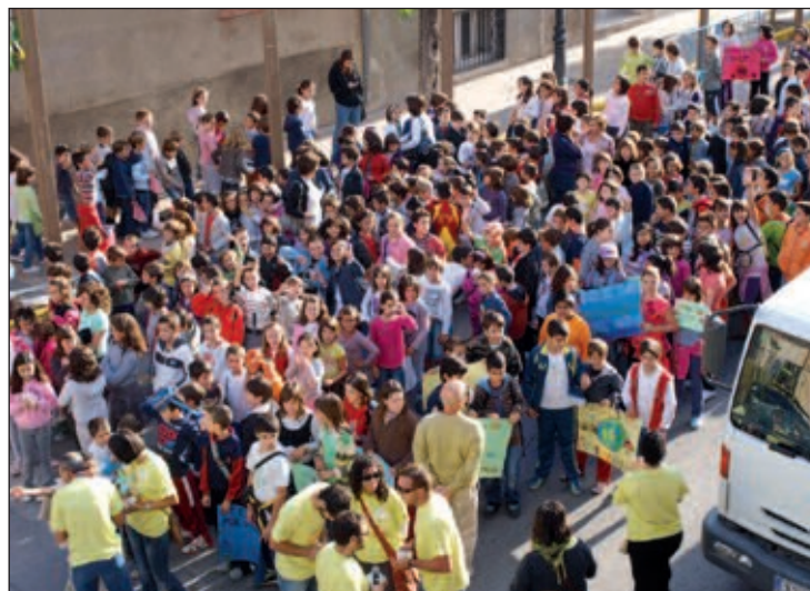
Los escolares participaron el día 22 en el Día Mundial sin Coche

Esta actividad, programada para los mayores por la tarde, tuvo que suspenderse a causa de la lluvia. Lo mismo ocurrió con el primer día de talleres medioambientales que se realizan en la plaza la Palla. Afortunadamente, el