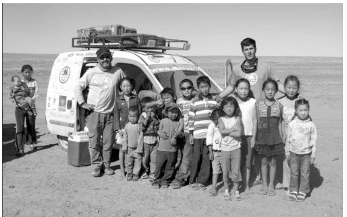
Durante su aventura tuvieron la oportunidad de conocer a mucha de gente, como estos niños mongoles

Hemos conocido gente maravillosa y, sobre todo, muy amable; hemos visto la sonrisa de los niños al darles cualquier regalo