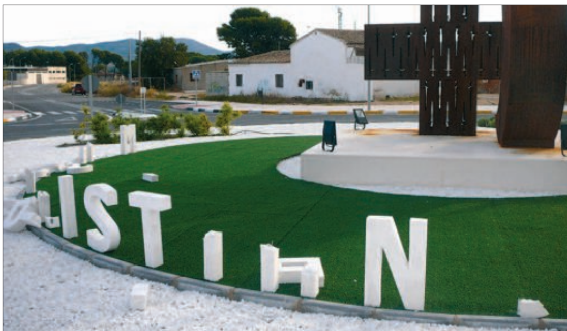
Las grandes letras donde se podía leer 'Moros i Cristians' están destrozadas casi en su totalidad