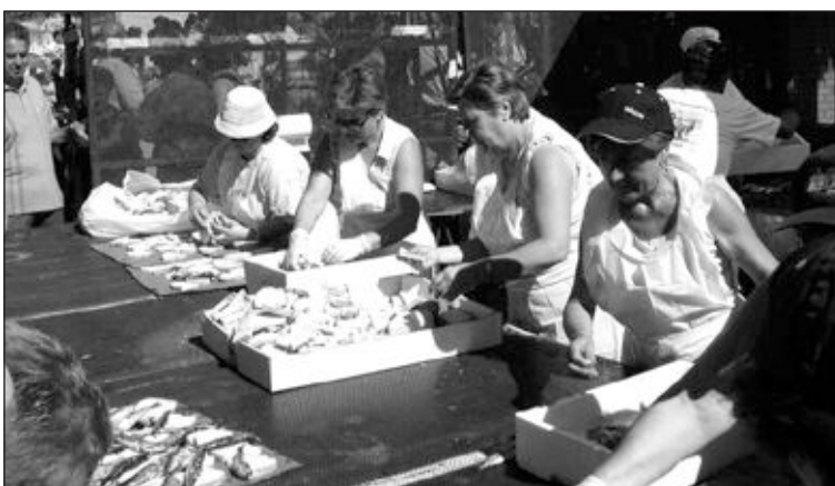
El domingo 4 de octubre tiene lugar la tradicional sardinada

El sábado se celebrará el XV trofeo ciclista y a las 21,30 horas, se ofrecerá el vino de honor, al que seguirá la actuación de la orquesta La Sarga. El domingo es el día grande. A las diez se celebrará la misa en honor a San Miguel y después, almuerzo de coca i oli. A las 12 horas, II concentración de migueles, con obsequios para todos los participantes y, después, la tradicional sardinada. La fiesta concluirá con una comida.