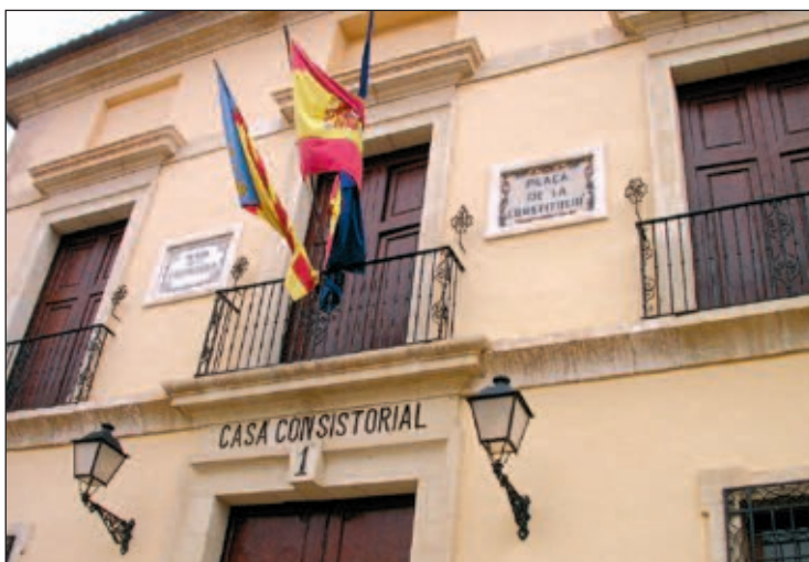
El Ayuntamiento celebrará un Pleno ordinario la próxima semana