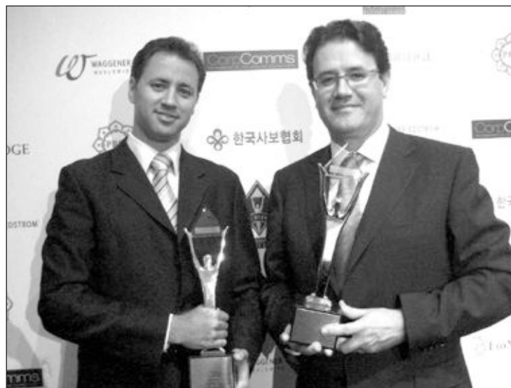
Representantes de la campaña de la CAM, con el galardón

desde que se crearan estos prestigiosos galardones, se han recibido 1.700 candidaturas de más de 30 países, que han competido en 40 categorías.