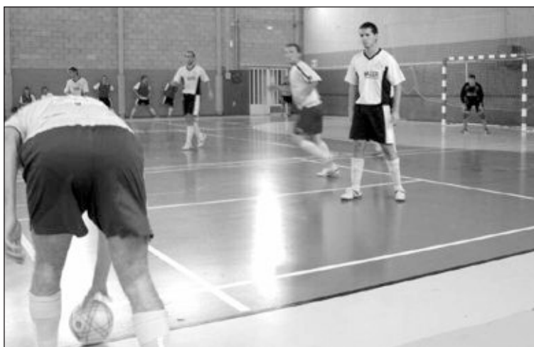
Un momento del partido, disputado en el pabellón 2 del Derramador

Reanudada la segunda mitad, el encuentro se igualó algo más y se comenzó ver