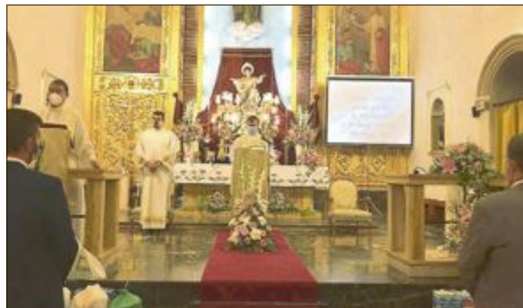
La Missa Major es va celebrar el dimecres 22 de juliol

A més, en l'Ajuntament es pot visitar una exposició de quadros amb els cartells anunciadors de les festes patronals que van ser guanyadors i finalistes des de 2009 fins al 2019.