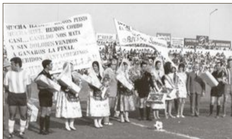
La final se jugó en el campo de La Viña, propiedad del Hércules CF