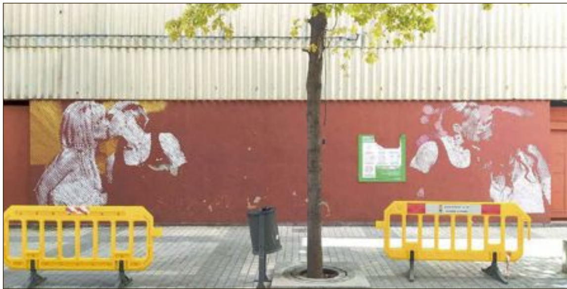
Los murales se han pintado en una pared del antiguo cine Roxy, en la calle Manuel Soler