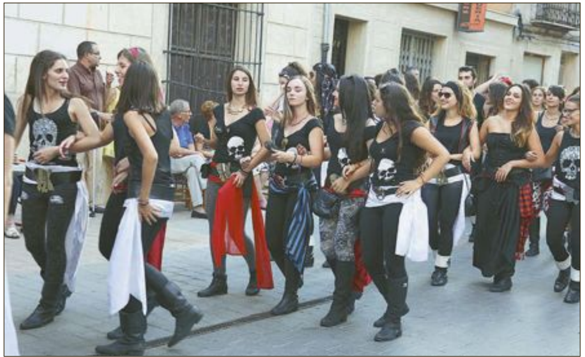
Sant Jaume és una festa local relacionada amb els Moros i Cristians, que se celebra tots els anys el 25 de juliol

Recorden que les circumstàncies excepcionals d'aquest 2020 marcat per la pandèmia del coronavirus “ens obliguen a actuar amb mesura i trellat. Actuar amb responsabilitat en el present és la millor garantia per poder gaudir de les nostres festes en un futur pròxim.