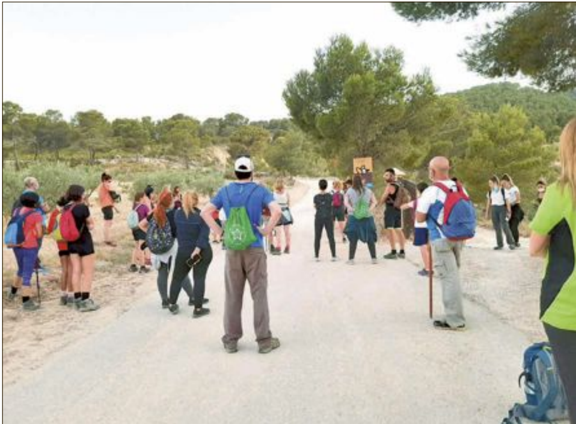
Els excursionistes, proveïts de mascareta, roba i calcer adequat, van complir en tot moment les mesures de seguretat per a fer front al coronavirus

En aquest sentit, Asunción Vera, ha destacat que “a Castalla tenim fins a quatre figures de protecció i reconeixement ambiental: els Paisatges Protegits