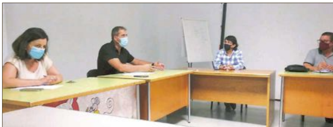
Los empresarios y el Ayuntamiento de Onil se reunieron el 22 de julio

El curso capacitará para trabajar en las compañías del sector. Existe un compromiso de contratación por parte de los empresarios a la finalización del mismo del 40% de los desempleados que superen la formación, con un contrato laboral a jornada