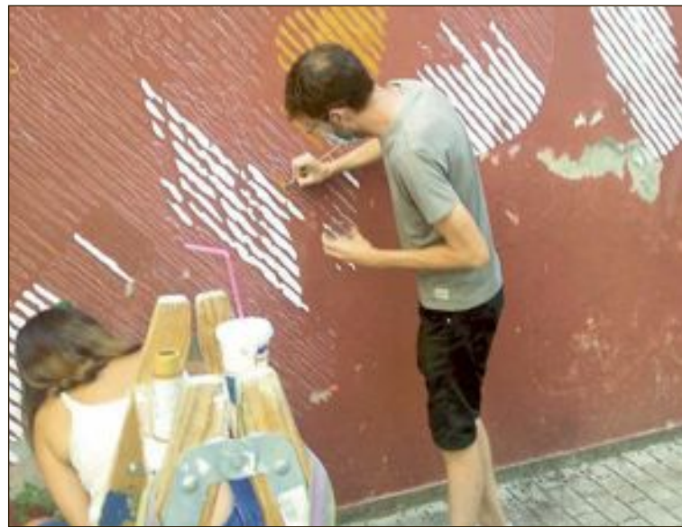
Fefeto, junto a una colega, durante la ejecución de la obra