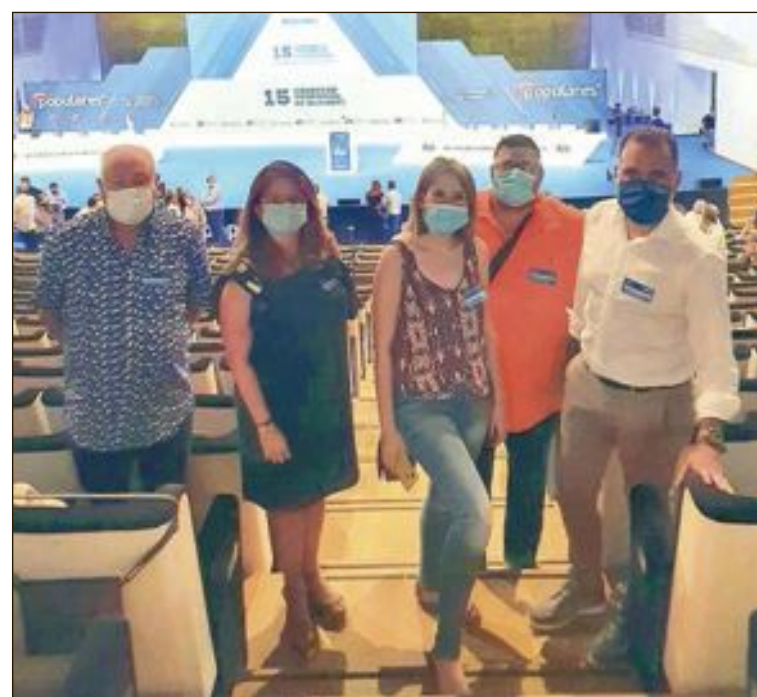
Compromisarios del PP en el Congreso del partido en Alicante

A la clausura del congreso asistieron Pablo Casado y Teodoro García-Egea, presidente nacional y secretario general respectivamente, la presidenta autonómica Isabel Bonig y el alcalde de Madrid, Jose Luis Martínez Almeida, entre otros.