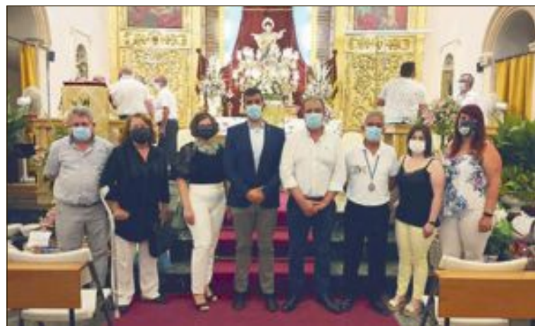
L'equip de govern va assistir a l'Eucaristia