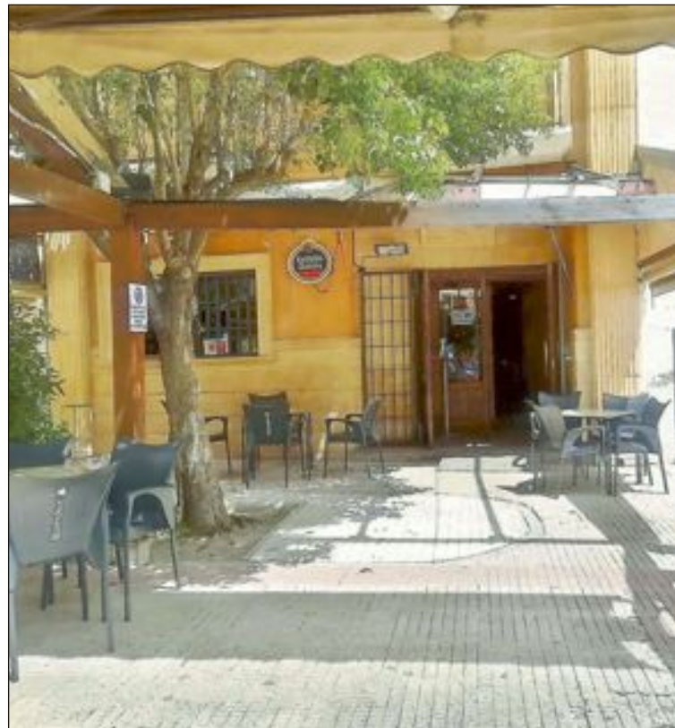
El sector cree que se corre el riesgo de aglomeraciones en los pocos locales abiertos que puedan quedar a partir de esas horas y que aumenten los botellones

Aunque representantes de la asociación mantuvieron el miércoles 22 de julio una encuentro con el alcalde, donde le expusieron todos estos puntos, no será hasta la semana que viene cuando se produzca una reunión oficial para acordar algún tipo de medida, si las hubiera.