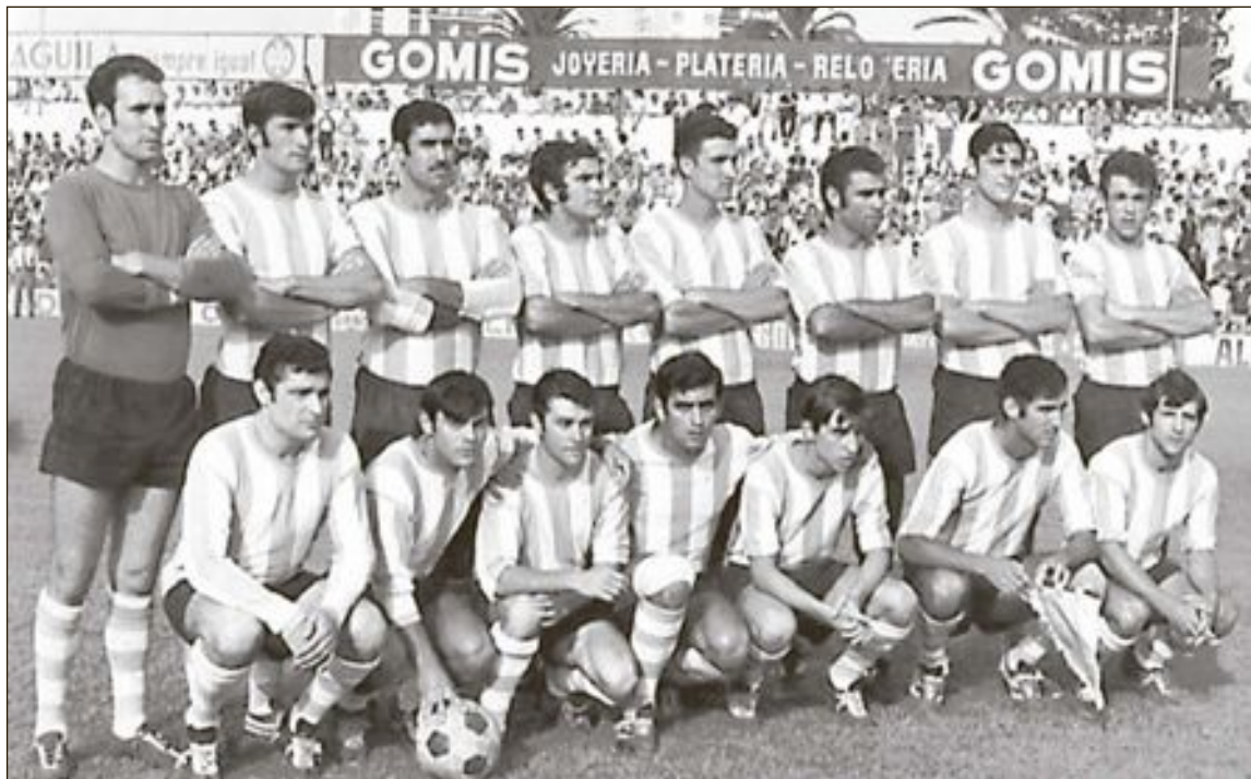
El Castalla jugó la final del torneo con la siguiente alineación: Genovés, Machi, Esteban, Mateo, Robles, Nebot, Peque, Román, Diego, Romera y Año