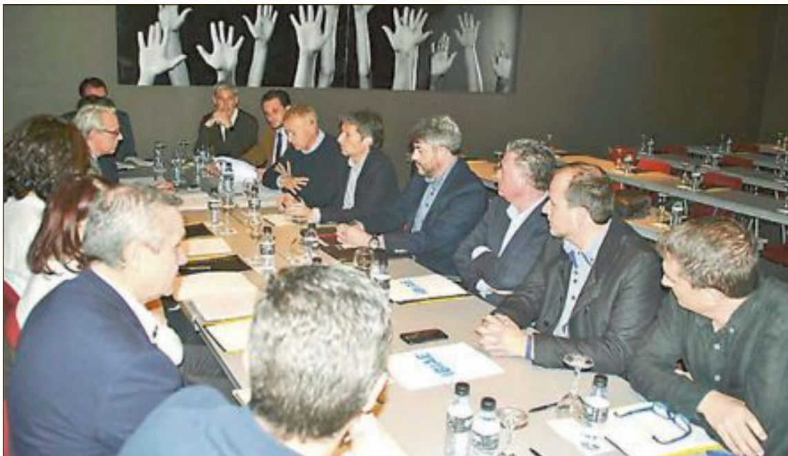
La Plataforma está integrada por COEVAL (Confederación Empresarial de la Vall d'Albaida), FEDAC (Federación Empresarial de las Comarcas de L'Alcoià y El Comtat) e IBIAE (Asociación de Empresarios Foia de Castalla)

Esta situación, explican desde la Plataforma, “acredita el potencial de presente y futuro industrial del mismo, potencial que debe apoyarse por parte de las administraciones para mejorar las condiciones con las que puedan competir nacional e internacional, siendo por ello importantes las inversiones en mejoras de polígonos industriales o la firmeza en el compromiso por impulsar la formación profesional y los estudios universitarios en el territorio para retener