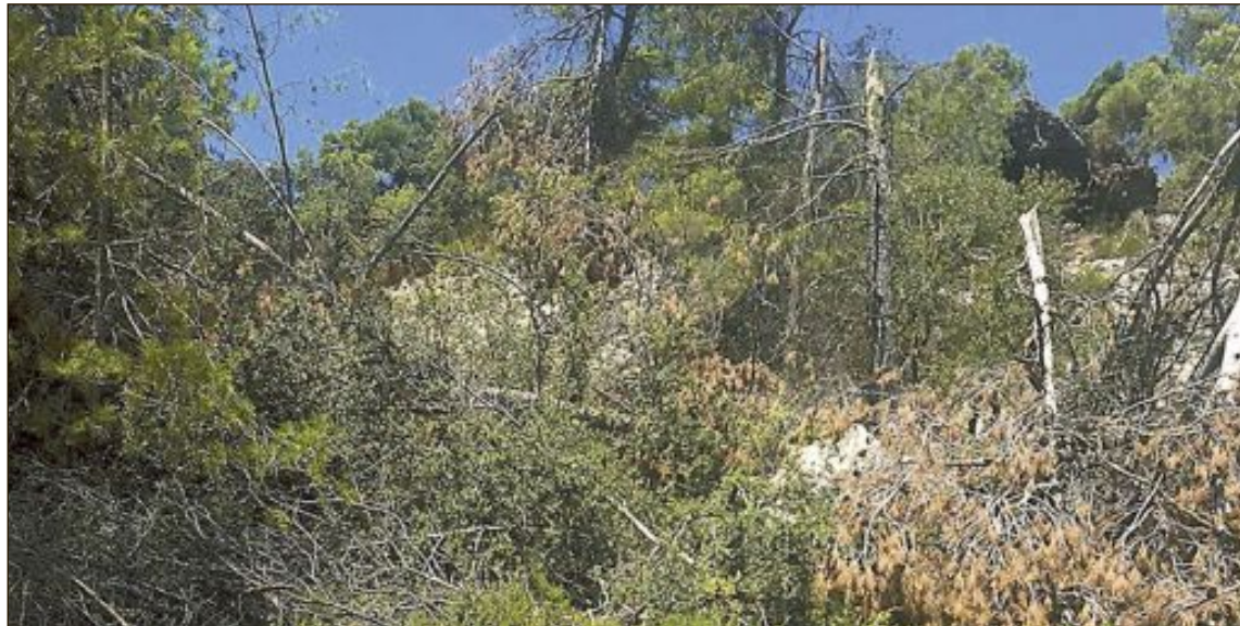
La borrasca Gloria dejó un monte con infinidad de árboles caídos, la mayoría ya enfermos y debilitados, dejando un sotobosque con material leñoso disponible para arder

Con todos estos datos, y hay quien duda del cambio climático todavía, nos plantamos en este verano con nuestros montes apa-