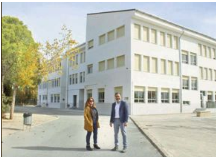
En el colegio Felicidad Bernabeu ya se han invertido 355.299 euros para reparar las cornisas del edificio, que estaban en muy mal estado

trán consistirán en la construcción de un pabellón cubierto como espacio plurifuncional (pista, gradas, vestuarios y almacén de material), pistas deportivas, instalación de un ascensor, adecuación de la caldera de la calefacción, adecuación de la zona infantil (ampliación del edificio y dotación de algún juego infantil adicional), dotación de bancos en el patio, cambio de ventanas con persianas, sustitución de puertas de acceso al exterior, pintado interior, renovación de la instalación eléctrica y mejoras en calefacción y otros.