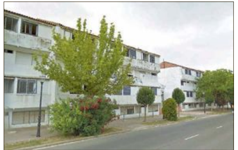
La instalación multifuncional de atletismo se construirá en la zona que ahora ocupan las conocidas como 'casas de los maestros'

Asimismo, se acondicionará una zona de aparcamiento junto al skatepark, con un total de 74 plazas de aparcamiento y obras para convertir los vestuarios en accesibles. Estos proyectos tienen una inversión de 493.131 euros,