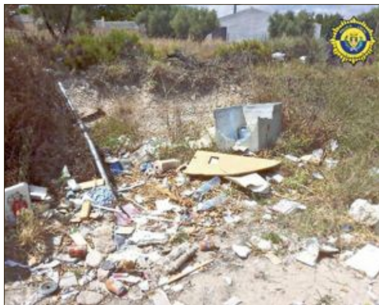
Abocaments incontrolats en els contenidors de la zona rural