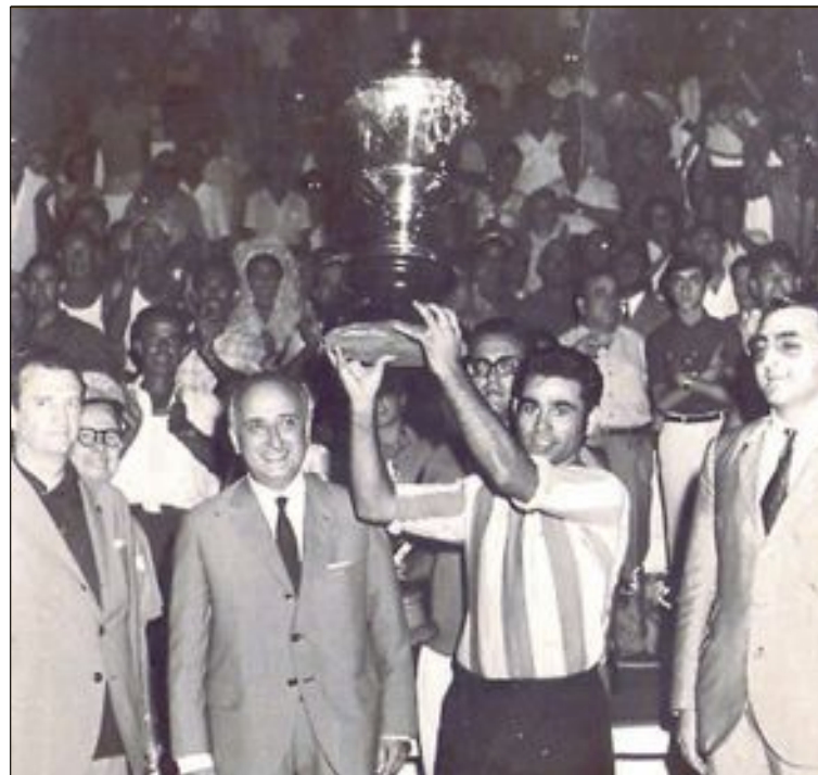
El capitán del equipo castallense alza, ante la afición, el trofeo conseguido

El domingo 2 de agosto se cumplen 50 años de esta gesta