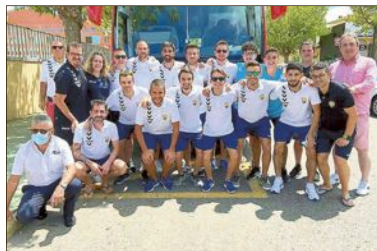
Jugadores y equipo técnico del Futsal Ibi