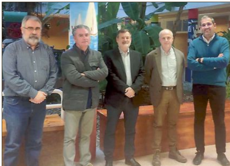
El director general de Formación Profesional, Manuel Gomicia (en el centro), visitó en febrero el IES La Foia para atender la demanda del nuevo ciclo

El director del IES La Foia destaca la importancia de este Ciclo, cuyos contenidos han sido diseñados con la implicación de IBIAE y sus empresas para ofrecer al alumnado un conocimiento actualizado del