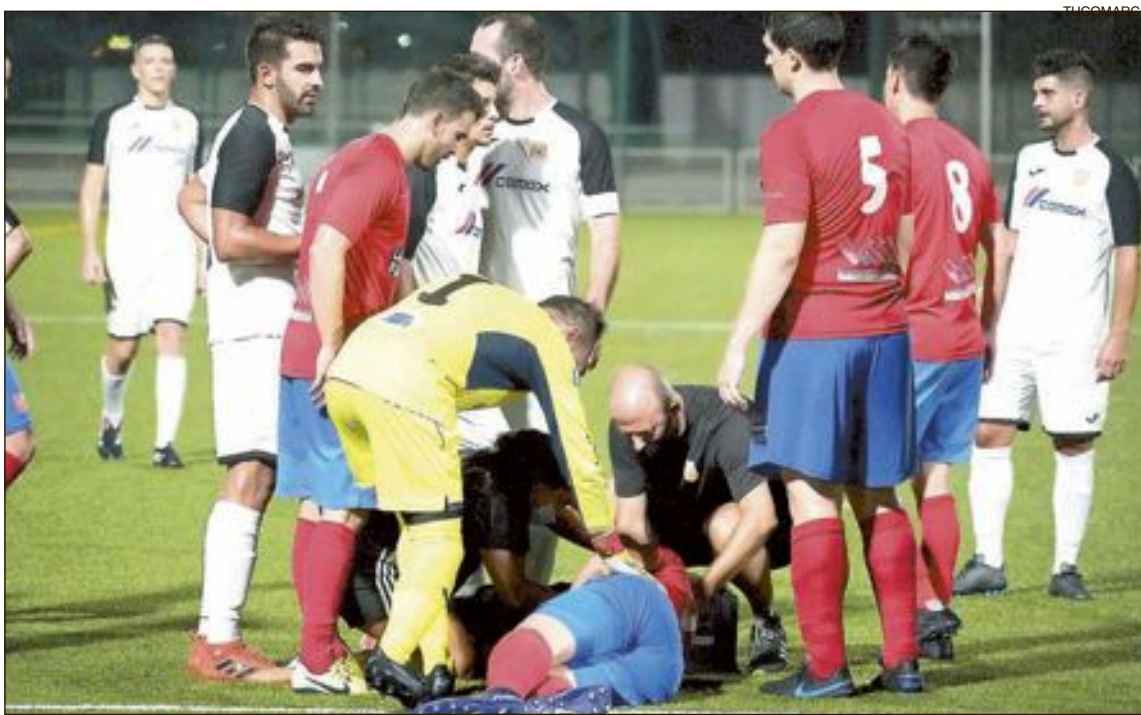
El primer partido del playoff en Alberic tuvo momentos de gran dureza

Tras la reanudación, los blancos han salido a por el partido con todo y consecuencia de eso ha sido su claro dominio en una segunda mitad en la que el Rayo Ibense construyó un muro infranqueable para intentar sorprender a los blancos al contraataque. No obstante, el CD Buñol ha recibido otro jarro de agua fría con el segundo gol en