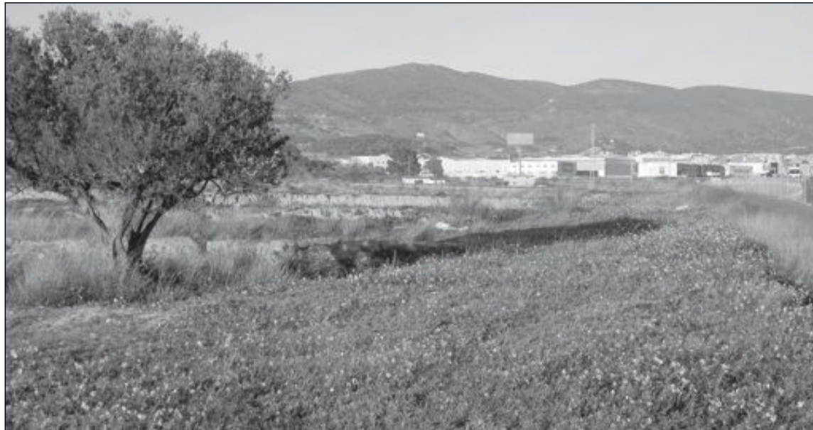
El futuro polígono industrial Alfaç IV comprende una superficie de un millón de metros cuadrados junto al Alfaç III en dirección a Castalla

El único polígono que actualmente tiene parcelas sin ocupar es el Alfaç III, pero son privadas