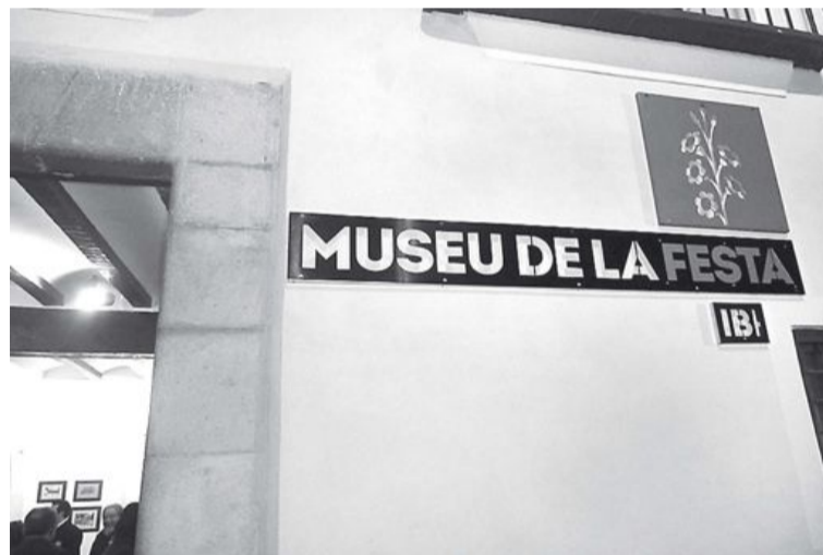
Aspecto de la entrada al nuevo Museo de la Fiesta

Otra de las salas está dedicada a la fotografía y la contigua, a las imágenes audiovisuales con proyecciones de los actos más destacados de las Fiestas. El Museo también reserva un espacio para las obras pictóricas de Rafael Guarinos y Ramón Castañer. La rehabilitación de la Casa Gran se realizó en 2010 y supuso una inversión de 250.000 euros.