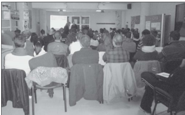
La conferencia tuvo lugar el 29 de enero en el Casal Jove de Onil