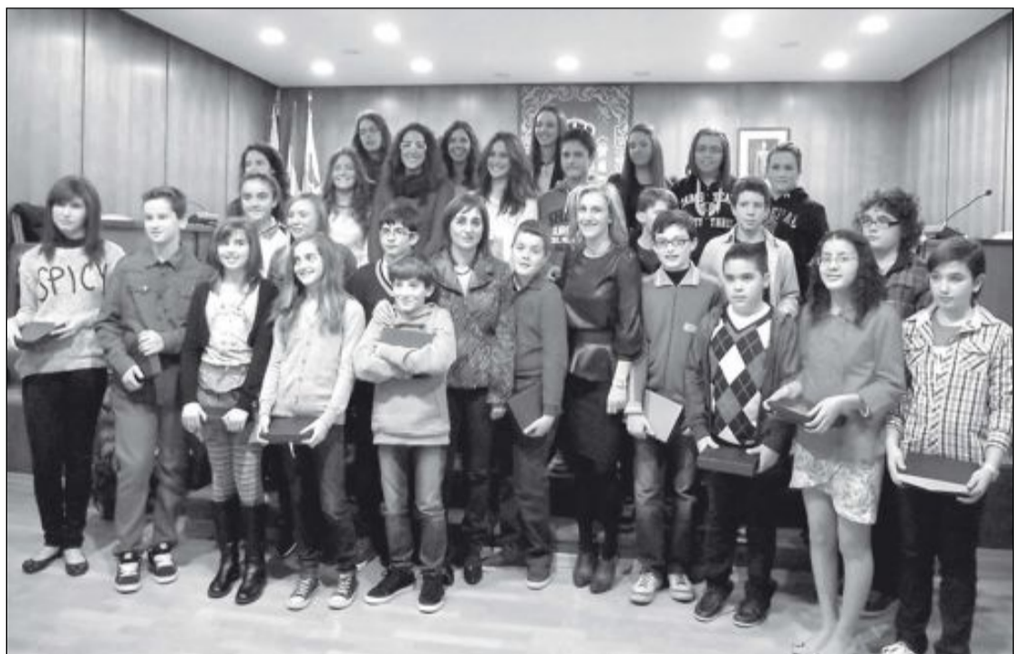
Los alumnos premiados se hicieron, al finalizar el acto, una foto de familia

El premio ha consistido en un lote de CDs de música y obras literarias también relacionadas con la música.