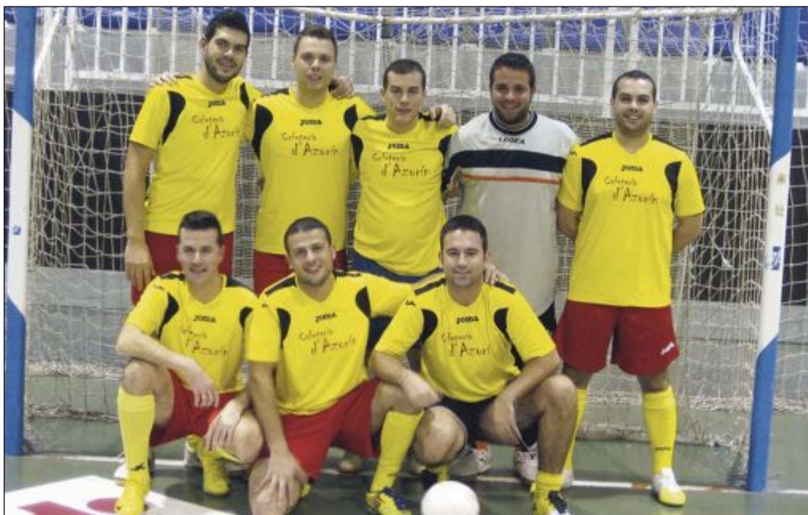
Equipo Cafetería d'Azorín

La siguiente jornada de esta liga local se disputará del 1 al 3 de febrero, con ocho partidos (tres el viernes, dos el sábado y tres el domingo). Como es habitual, los horarios de los partidos vienen recogidos en la agenda deportiva de Escaparate y también pueden consultarse en la web del Club Fútbol Sala Ibense ( http://cfsibense.blogspot.com ).