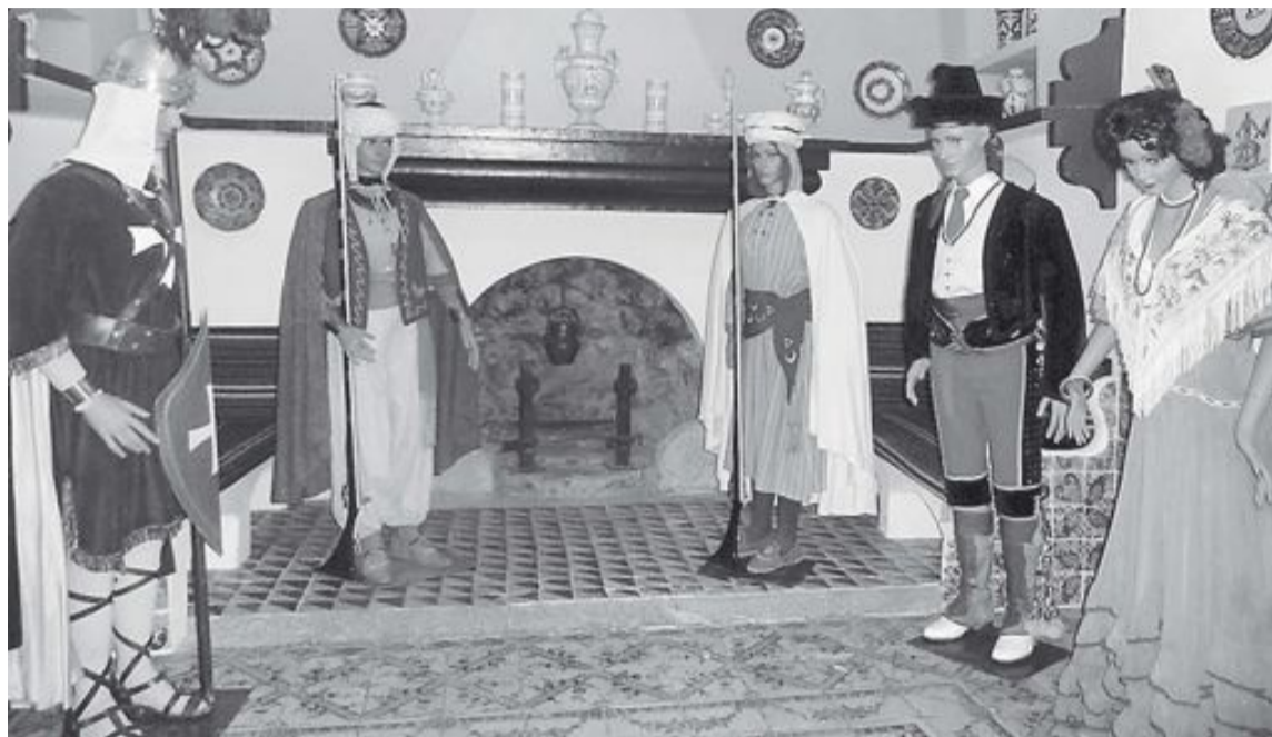
El Museo expone los trajes oficiales de las catorce comparsas de Moros y Cristianos

En la primera planta se ha conservado la antigua distribución del Museo del Juguete y una de las salas se ha dedicado