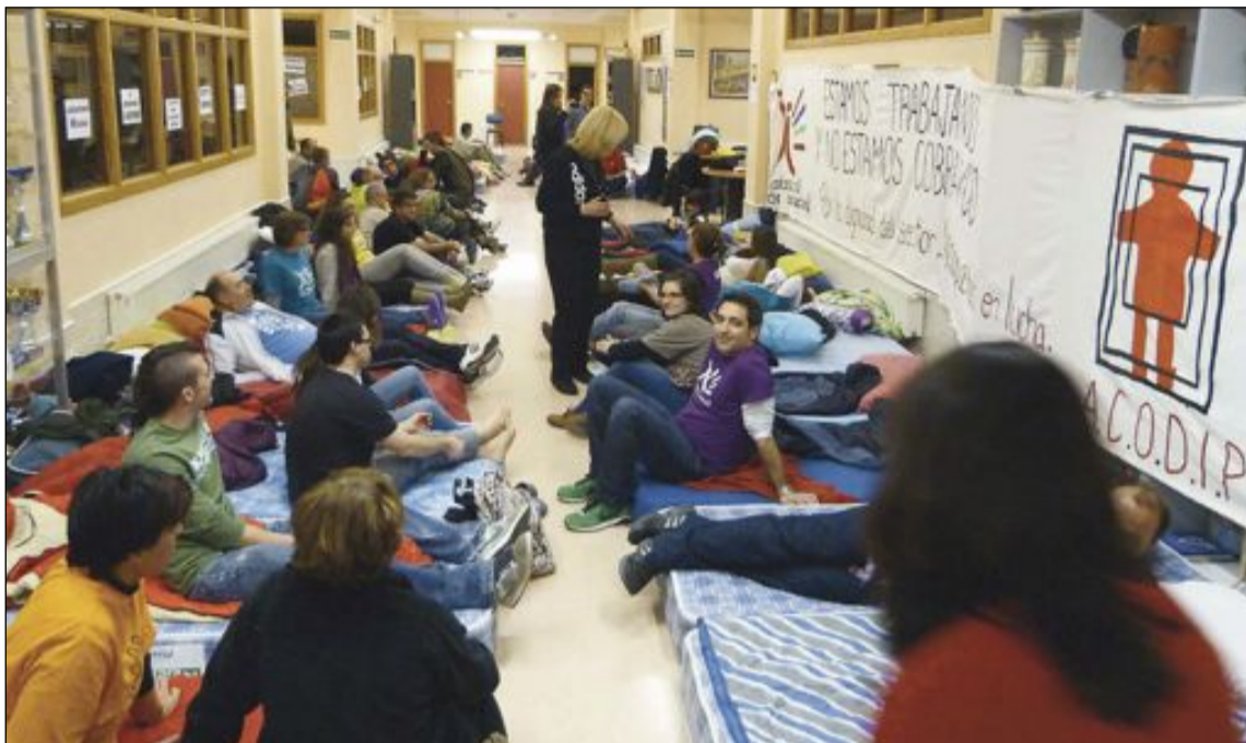
El encierro del 30 de enero fue el más numeroso ya que cerca de cincuenta personas se quedaron a dormir

La asociación que gestiona el Centro, ACODIP, y los trabajadores suspendieron el mismo jueves el encierro tras recibir la subvención que se adeudaba.