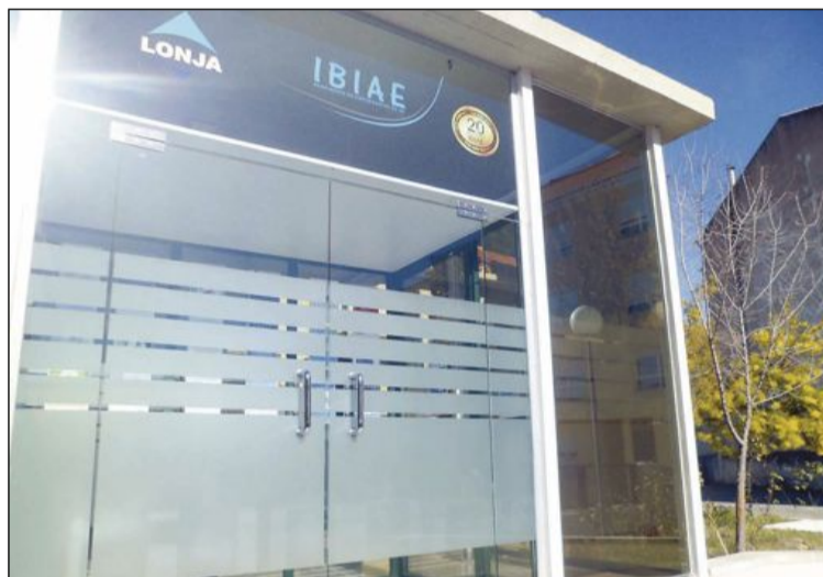
Sede de Ibiae, calle San Juan Bosco, 1

Para conmemorar el 20 aniversario, desde la asociación realizarán diversas acciones que irán desvelando a lo largo del año y que irán relacionadas con la evolución empresarial de nuestra comarca a lo largo de todo este tiempo.