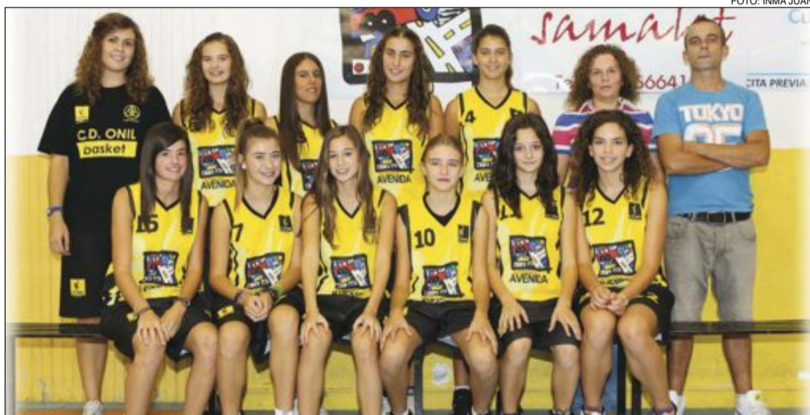
El CD Onil Cadete Femenino dio una paliza al Banyeres en casa (74-18)

El segundo cuarto fue el más igualado del partido, sobre todo porque el Illice se plantó en zona, y aunque sabían que podía pasar, dudaron unos ataques y el Illice recortó un poco la distancia; pero al final lo arreglaron y