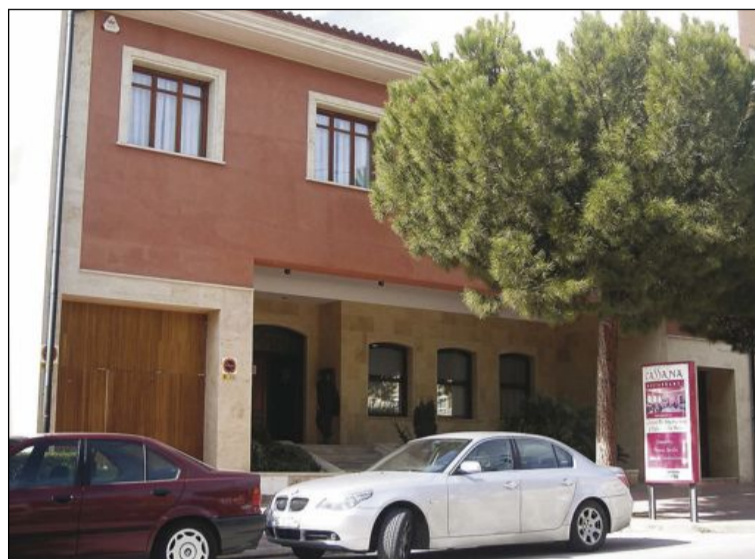
El curso se impartirá en el restaurante Cassana (foto de archivo)

Esta actividad gratuita (gracias a la cofinanciación de la Generalitat y el Fondo Social Europeo) está dirigida a jefes de cocina, cocineros y ayudantes de cocina en activo del sector de la restauración de la Comunidad Valenciana. Entre sus contenidos, se hablará de aperitivos, ensaladas, arroces, sopas y cremas, con cuatro objetivos básicos: potenciar los productos básicos de la cocina mediterránea, la cocina mediterránea en los municipios de interior, diversificar ingredien-