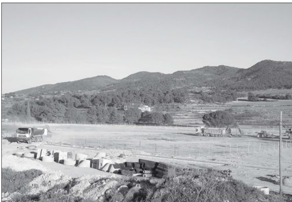
Las obras para la instalación de la empresa ya han comenzado en el polígono NPI-7, junto a la depuradora

Otros puntos recogidos en el anexo son el nombre y la señalización del polígono, la garantía ante la mercantil compradora de suministro eléctrico suficiente para el funcionamiento de las instalaciones, edificabilidad de la parcela, licencias de obras y actividad y, por último, el compromiso firme de apoyo institucional para facilitar al grupo empresarial su relación con otras administracio-