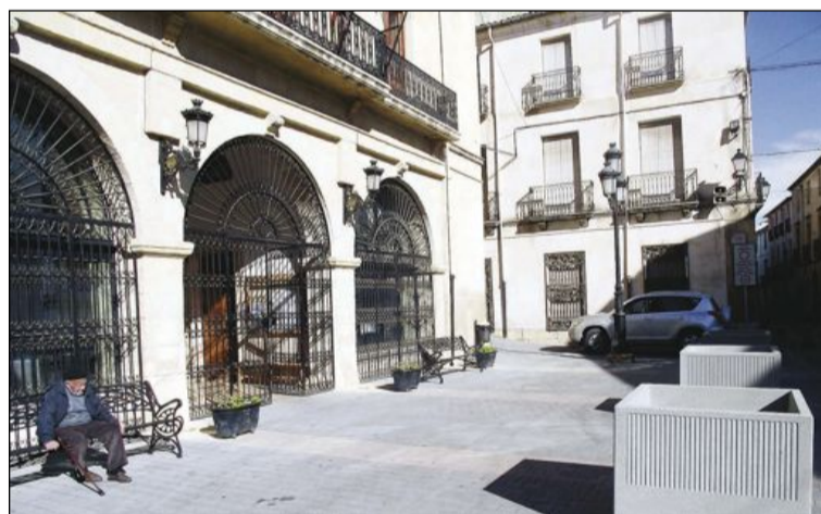
Fachada del Ayuntamiento de Castalla (archivo)

Entre las atribuciones del Consell de Participació Ciutadana