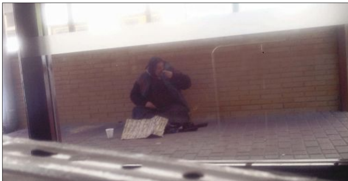
Una mujer, de nacionalidad rumana, practica la mendicidad a las puertas del Mercado de Abastos de Ibi

Pero no sólo piden limosna, también roban y cometen pequeños hurtos. El último tipo de robo que están utilizando en la localidad (ello no quiere decir novedoso) es solicitar ayuda a personas que están haciendo la compra. "Se acercan a ellas y les dicen que si les pueden coger algún producto que está en alguna estantería superior ya que ellos no alcanzan", explican fuen-