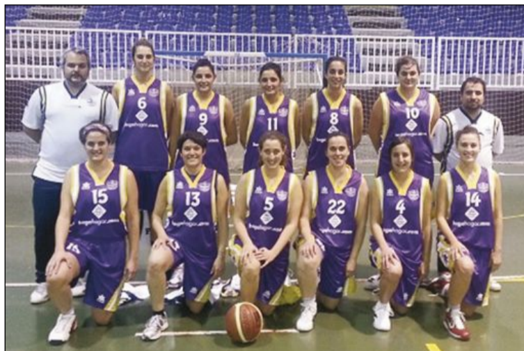
Equipo Teixereta Sénior Femenino con la nueva equipación

Llegaba entonces uno de los peores rivales del Teixe en los últimos partidos y se ponían a prueba: el temido paso por los