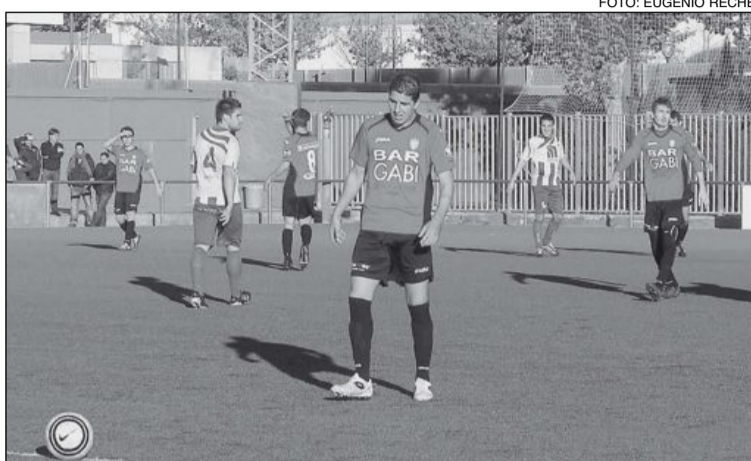
Imagen de archivo de un partido del Rayo Ibense en el Vilaplana Mariel

En el minuto 18 es expulsado uno de los centrales del Bocairent por desconsideración hacia el árbitro. Poco después, penalti clarísimo a Cintas que el árbitro