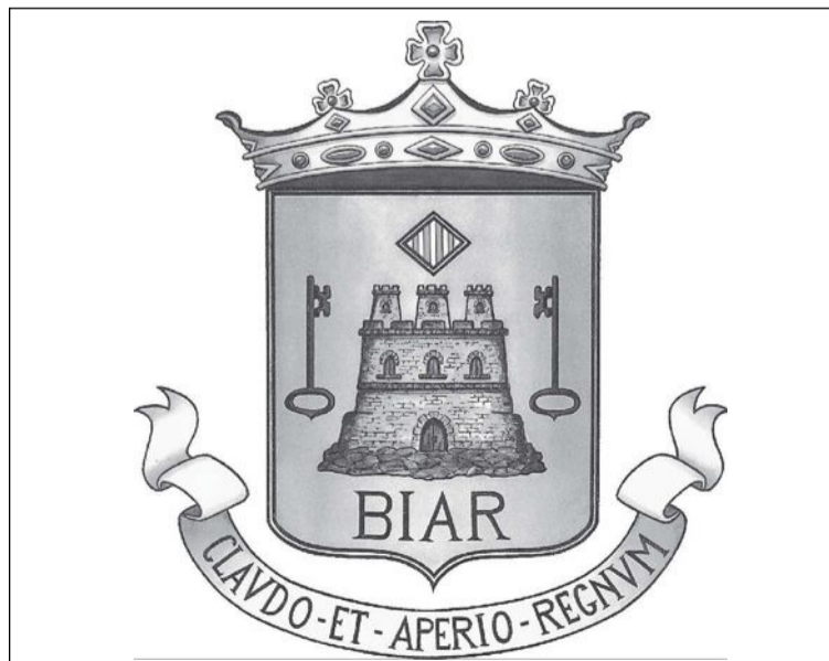
Actual Escudo de Biar que ha tenido que modificarse para ser homologado

Sin embargo, se ha podido acreditar la antigüedad del diseño terminado en pico, por lo que esta característica no ha tenido que modificarse.