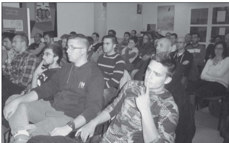
Los asistentes fueron, en su mayoría, deportistas de toda la comarca