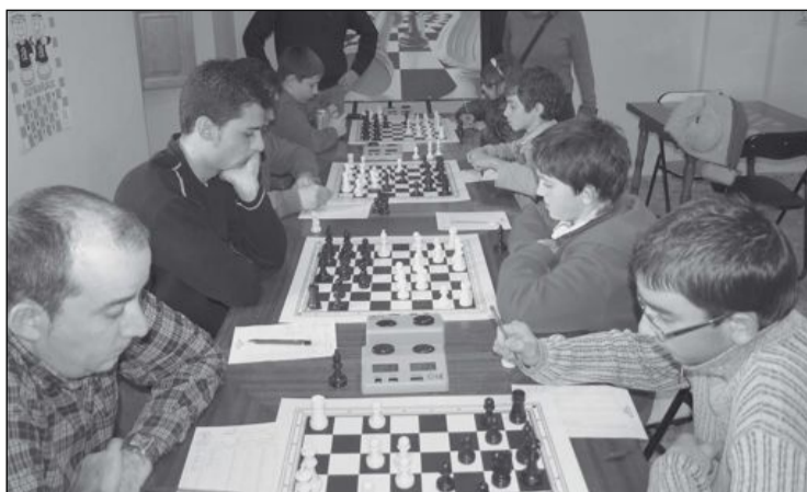
Las partidas se disputan los sábados a las 16:30 h. en el Casino Primitivo