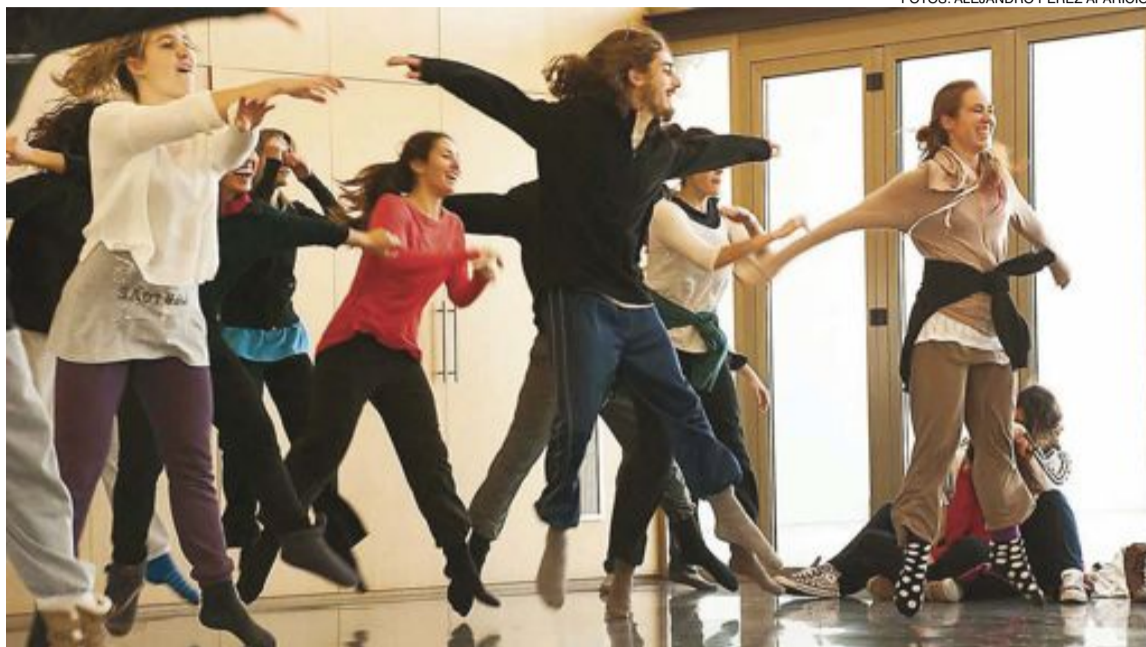
Arriba, clase magistral de danza contemporánea en las dependencias del Auditorio y en las dos fotos de abajo, sendos momentos del espectáculo ofrecido el sábado 26 de enero con un gran éxito de público

mundo cine mundo VIDEO CLUB C/. Tíbi, 8 • Tel. 96 633 82 09 • IBI www.mundocineibi.com