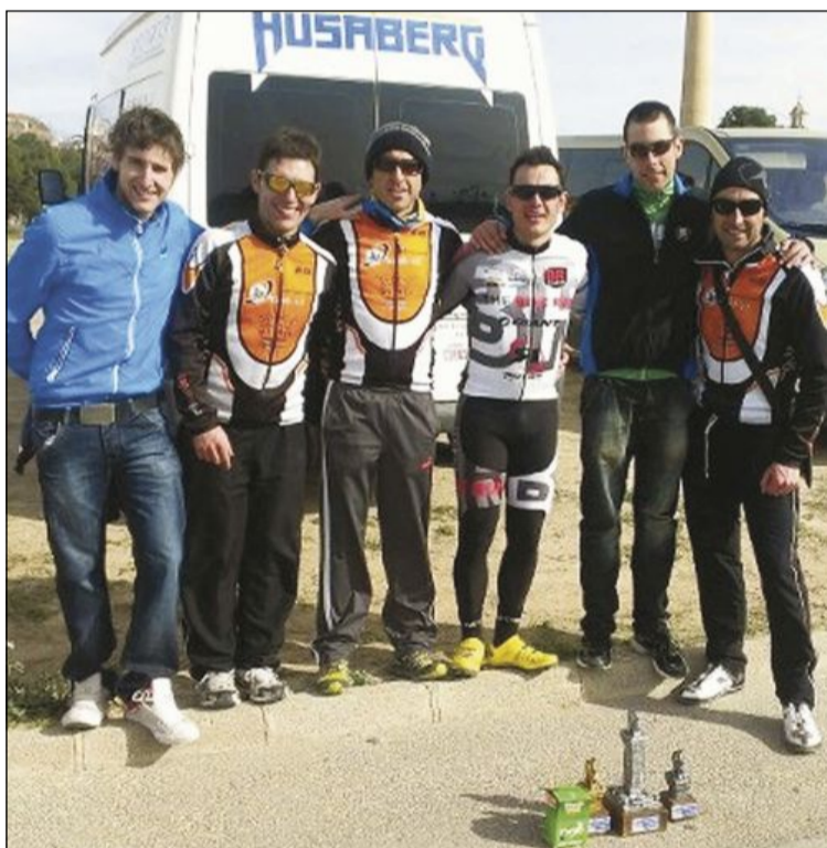
Integrantes del MTB Evotecnik que compitieron en Jumilla

La participación fue muy alta y salieron alrededor de unos 350 participantes.