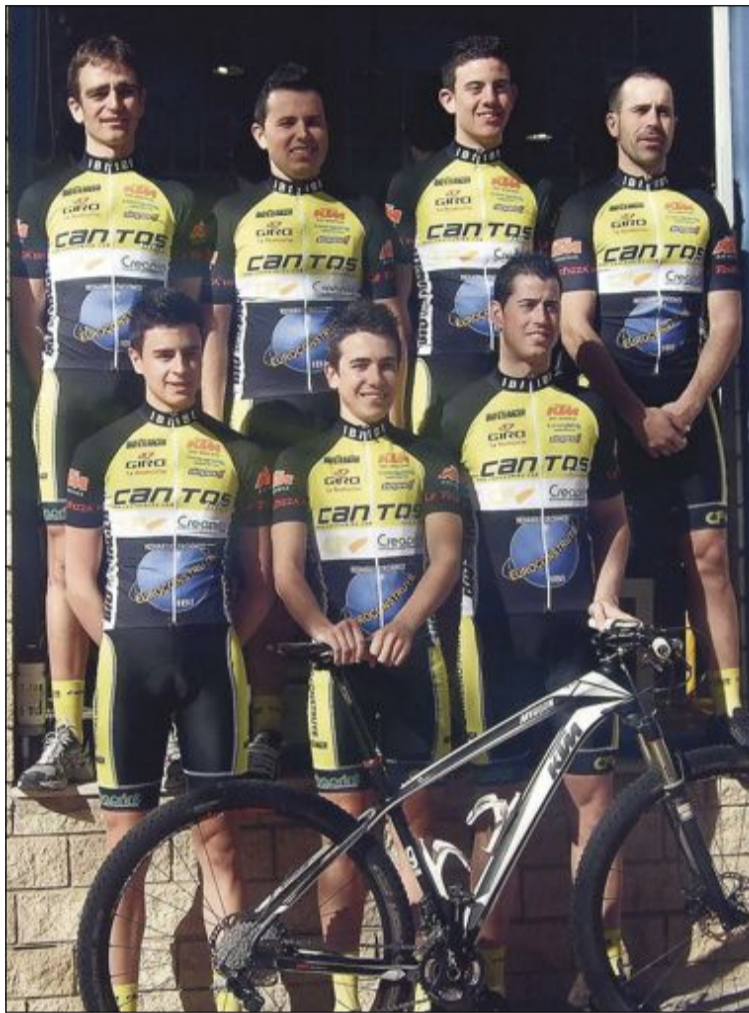
Miembros del nuevo equipo de ciclismo Cantos Bike-Euroconstruye

Desde la Dirección del equipo desean agradecer públicamente "la inestimable ayuda de los principales patrocinadores (Euroconstruye, Cantos Bike, Creaprint y Telepizza-Ibi, así como de los colaboradores (Bio-Racer, Giro, Keep Going, Slopes y KTM Bike Industries).