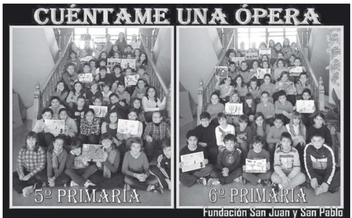
Alumnos ganadores del concurso, en el que tuvieron que competir con más de 205 participantes

Solemnemente llegan hasta nosotros, a través de los siglos, las palabras amonestadoras de nuestro Señor desde el Monte de las Olivas: "Mirad también por vosotros mismos, que vuestros corazones no se carguen de glotonería y embriaguez y de los afanes de esta vida, y venga de repente sobre vosotros aquel día" (Luc. 21: 34).