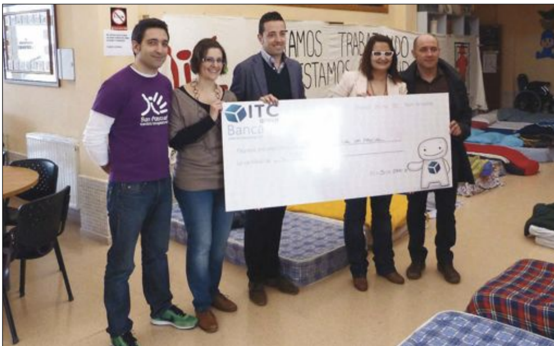
El último donativo recibido fue de la empresa ITC que entregó al Centro 2.002 euros