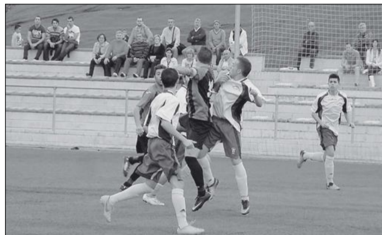
Una jugada de la Peña Madridista de Ibi

En la segunda parte salió el Sax completamente al ataque, sabiendo que se le escapaba una gran oportunidad de dejar a un rival directo en el camino. Así, a los diez minutos de la reanudación, jugada de contraataque del Sax por banda, que centra raso y la defensa no llega a despejar y un jugador local remata a placer en el segundo palo, acortando distancias (1-2). A partir de ahí, la Peña despertó, se convirtió en un muro infranqueable, y aprove-