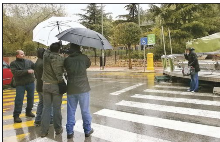
Para el rodaje en exteriores hubo que aprovisionarse de varios paraguas

Esta experiencia pionera en España, conocida como 'Taller Exprés de Cine con Vecinos', tuvo la particularidad de que la película fruto de este taller se proyectó el viernes 26 en el Centro Cultural de Onil.