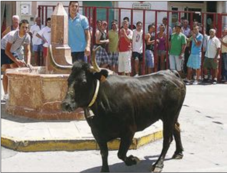
La suelta de vacas es el mayor atractivo de las fiestas de Tibi