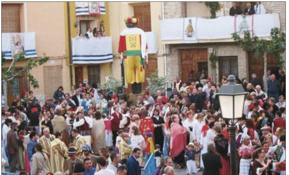
Varias parejas bailando la tonadilla tradicional de esta danza