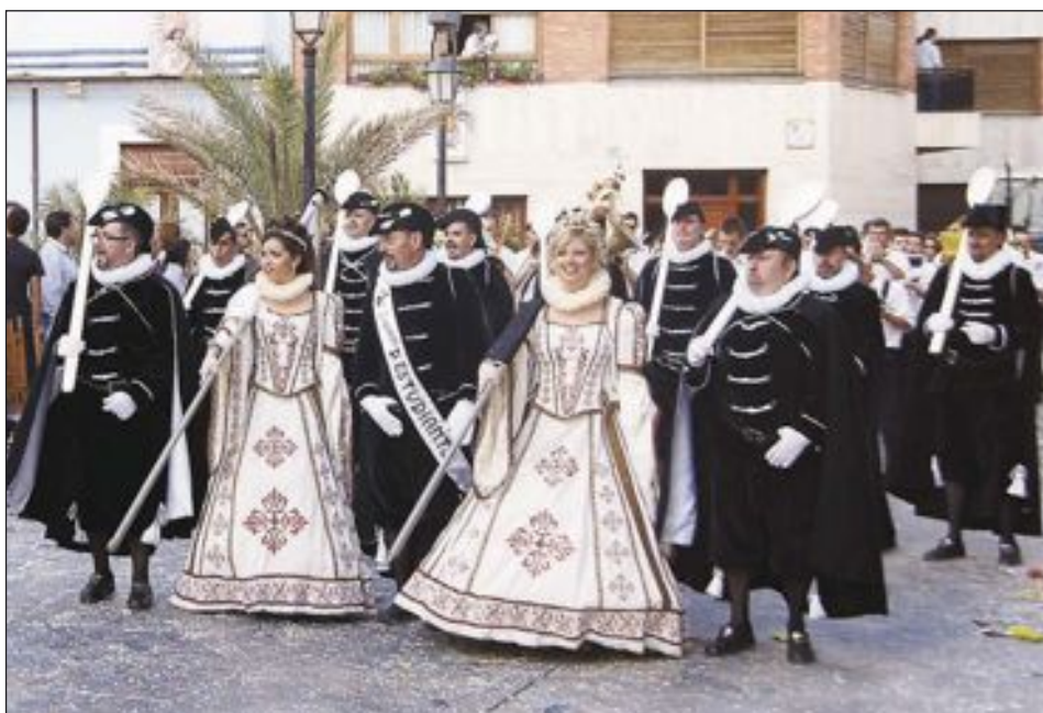
Capitanía de la comparsa Estudiantes