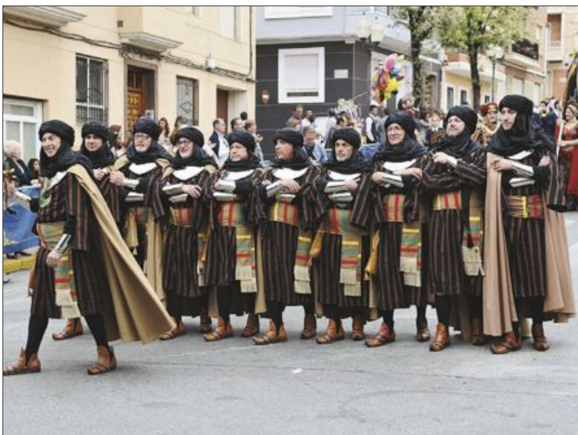
Escuadra de la comparsa Almorávides desfilando delante del capitán y la abanderada del bando moro