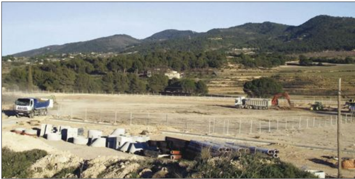
Obras de urbanización en el polígono NPI-7 donde se instalará la multinacional Smurfit Kappa

Sin embargo, los servicios económicos no han estimado otras reclamaciones presentadas por PSOE, EU y ADI que pedían, por un lado, incluir también la deuda de casi tres millones de euros que el Ayuntamiento arrastra con la constructora del par-