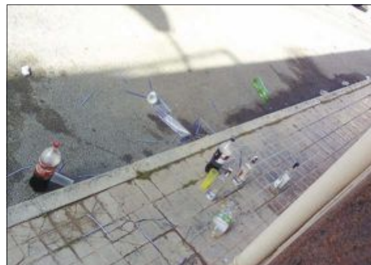
Aspecto de la calle Pintor Segrelles durante la mañana del 12 de mayo