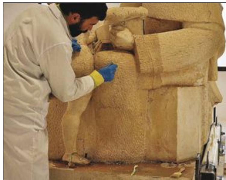
Los trabajos de restauración corren a cargo de técnicos del IVC+r