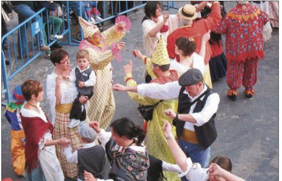
El ball del espies se celebra la tarde del 11 de mayo y este año estuvo especialmente concurrido