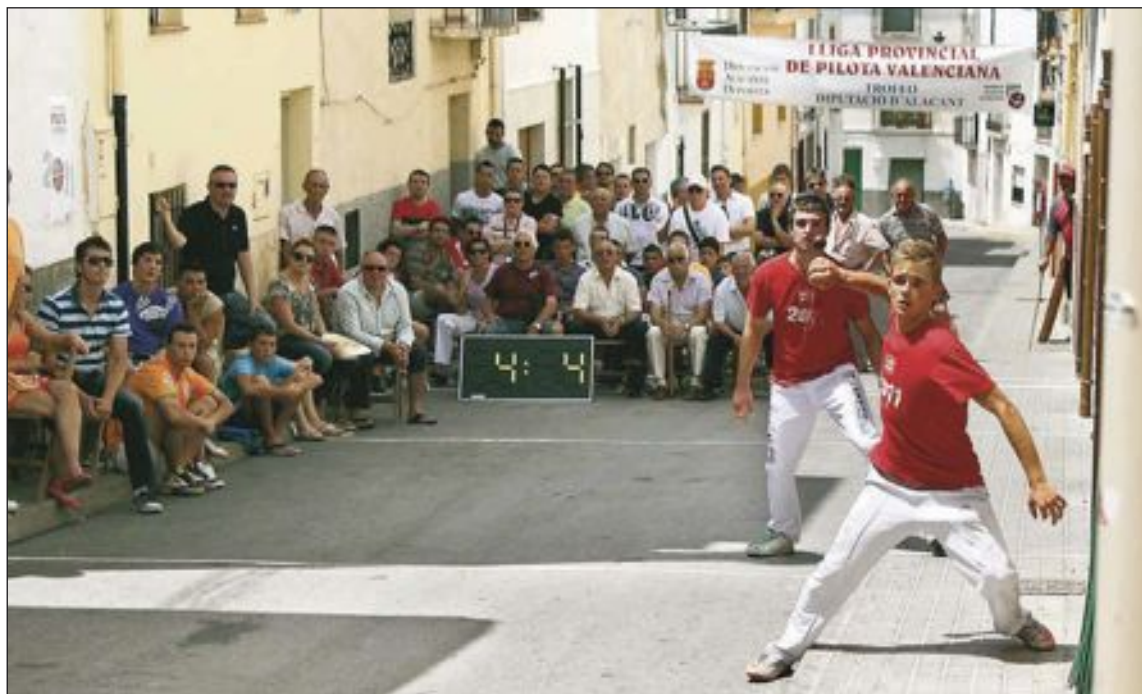
Imagen de archivo de una partida de pilota disputada en Tibi