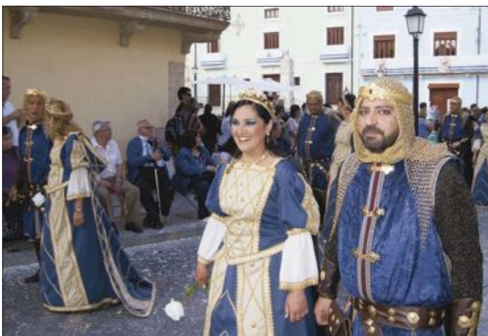
Escuadra de jóvenes de la comparsa Moros Vells