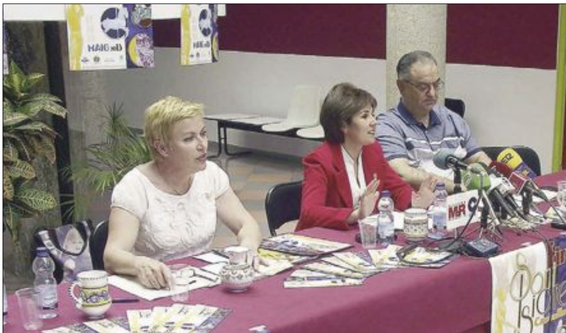
La presentación de la XXI Feria de San Isidro se celebró el lunes 13 de mayo en la Casa de Cultura de Castalla

Desde el viernes a las siete de la tarde se podrá visitar esta vigésima primera Feria de San Isidro, organizada con la mayor ilusión del mundo y con la intención de hacer de Castalla el centro de atención de La Foia.