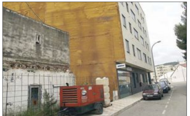
A fecha 14 de mayo, un generador suministraba corriente al edificio

Tras quedarse a oscuras, los vecinos acudieron a protestar al Ayuntamiento, casualmente a la misma hora en que en la Casa de Cultura se estaba presentando la XXI Feria de San Isidro, por lo que sólo encontraron a los funcionarios. Aun así, de allí no se movieron hasta que no se les