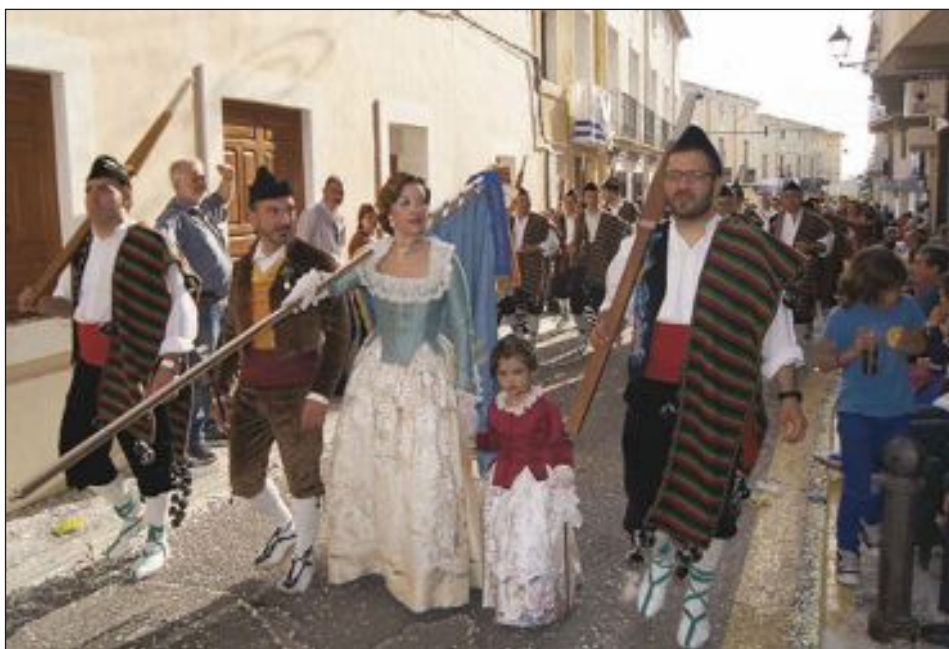
La capitanía de la comparsa Maseros el día de la Entrada de Moros y Cristianos