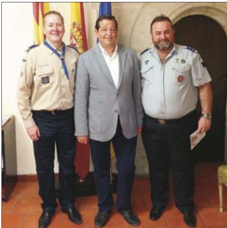
Dos representantes de la OJE fueron recibidos por el alcalde de Onil

El presidente nacional de la Organización Juvenil Española (OJE), el presidente de esta fundación y el presidente de la Confederación Europea de Escultismo visitaron el lunes 13 de mayo el Hogar de la OJE en Onil. Además, estuvieron en el Palacio del Marqués de Dos Aguas, donde mantuvieron una reunión con el alcalde y firmaron un convenio de colaboración con el Ayuntamiento.