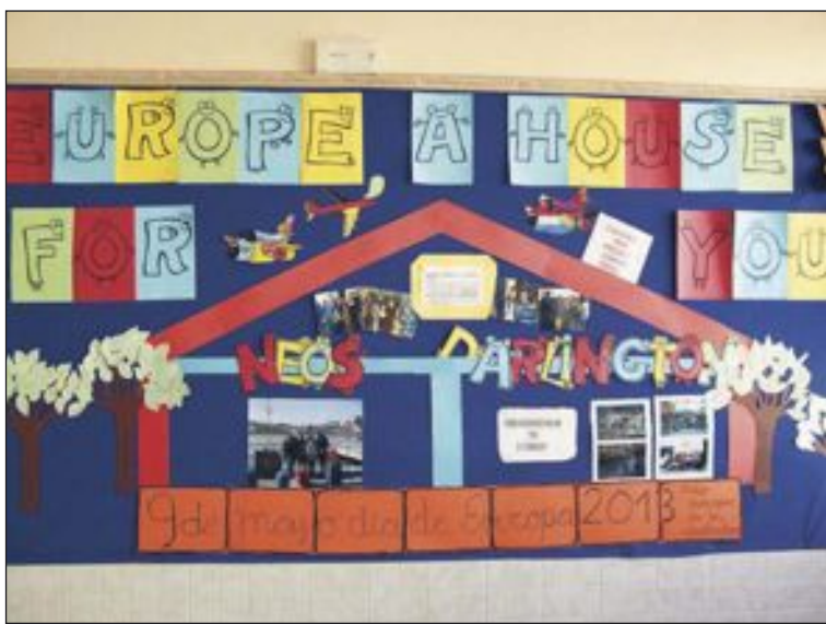
Mural realizado por los alumnos

El Ayuntamiento pondrá un servicio de autobús con salida desde la calle Les Eres.