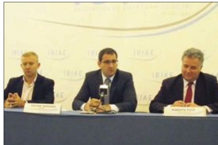
Presentación del encuentro Enrédate en la sede de IBIAE

La primera edición se celebró en Alcoy y la segunda, en mayo