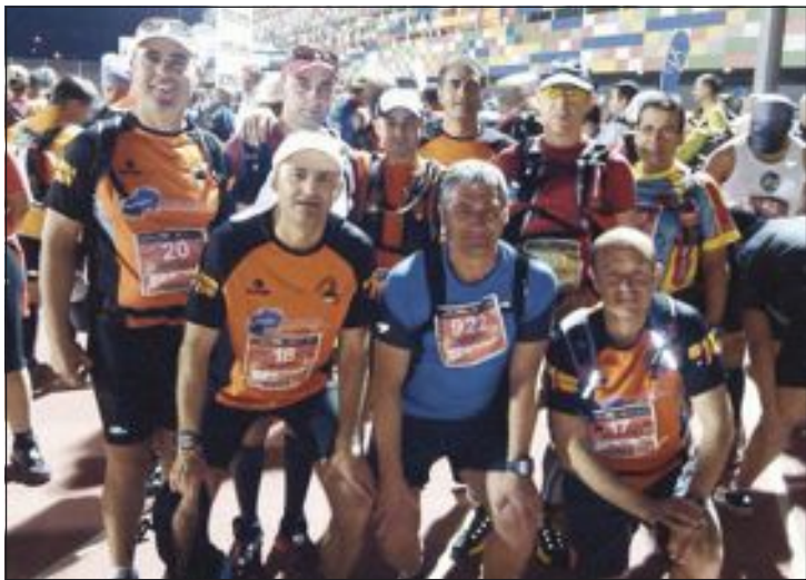
Atletas del Club Teixereta de Ibi en Peñagolosa