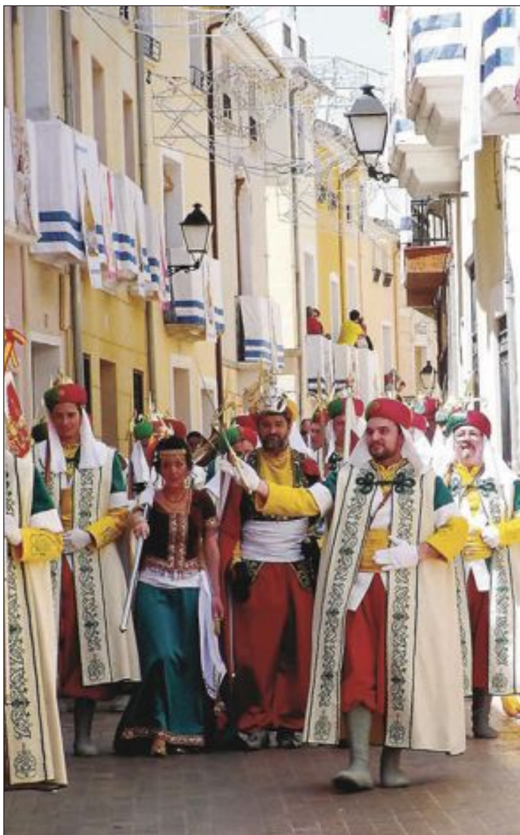
Capitanía dels Moros Vells el día 13 de mayo

Una vez concluye la danza, le toca el turno a los bandos que se leen desde el carro de la Mahoma, efigie que representa el triunfo de los moros en la Villa.