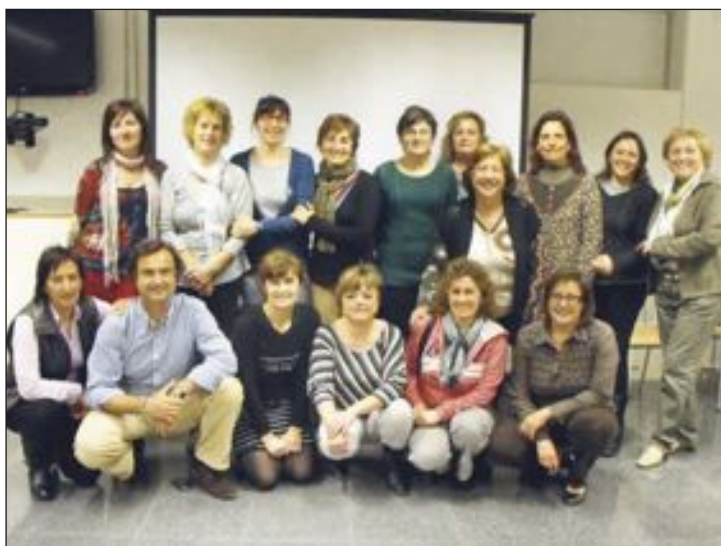
Padres integrantes de la escuela puesta en marcha en el instituto

El día se celebra con motivo del discurso que impartió Robert Schuman en 1950, donde expuso la idea de una nueva forma de cooperación política en Europa, organizada y pacífica.