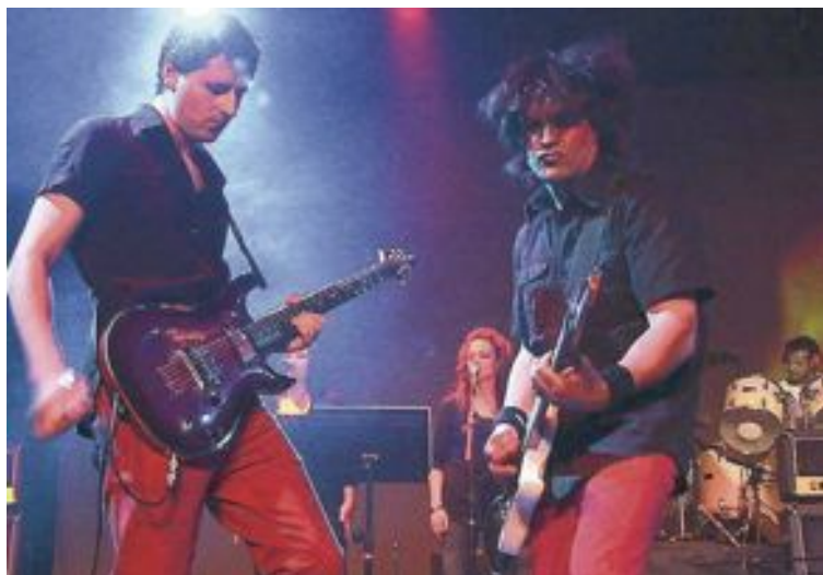
El grupo local Síntesi presentó su primer trabajo el sábado 11 de mayo