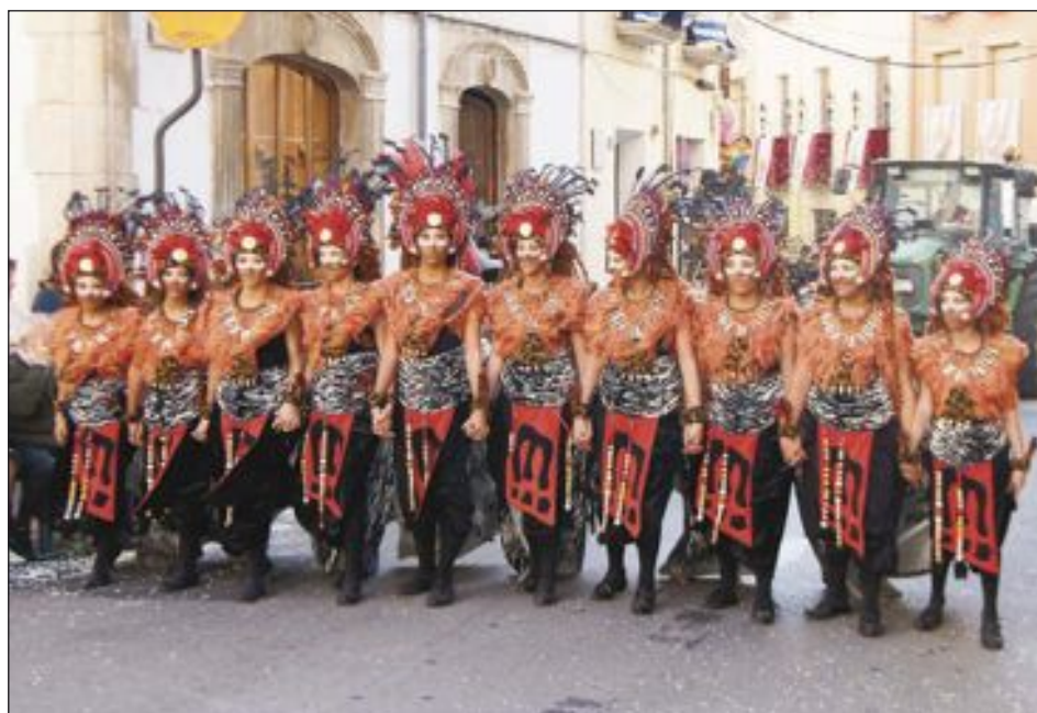
Escuadra especial de la comparsa Moros Vells