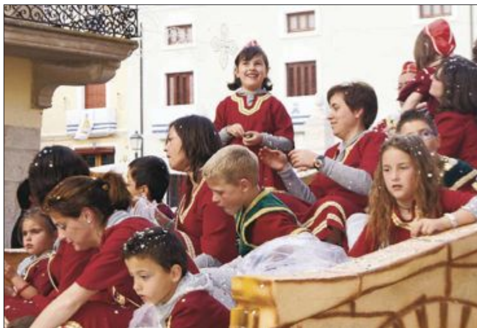
Carroza de niños de la comparsa Blavets en el desfile de la Entrada