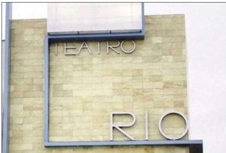
Fachada del Teatro Río