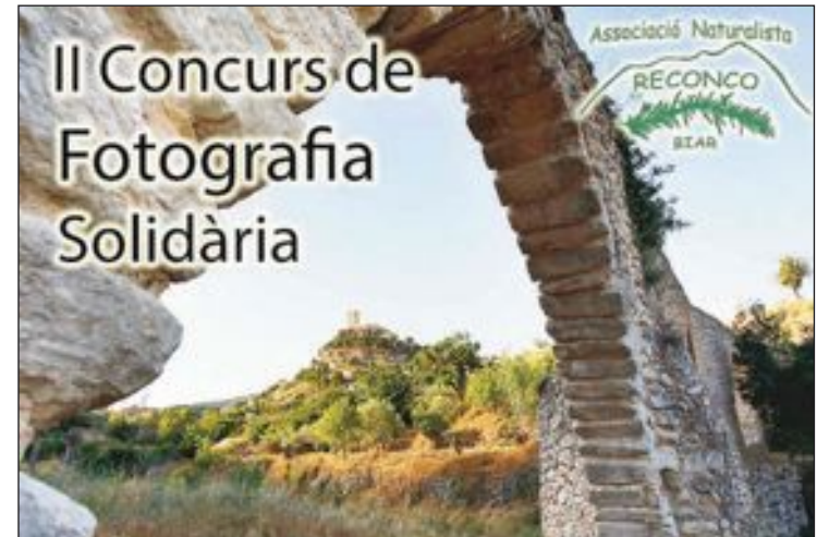
Cartel con la foto ganadora del pasado año del autor Vicente Guill

El concurso se desarrollará entre las 11 horas del sábado y las 12 horas del domingo y para participar habrá que rellenar una hoja de inscripción en la mesa de la organización, situada en la plaza de la Constitución, entre las 11 y las 13 horas del sábado. El precio es de 3 euros y de 1 euro para personas en paro y estudiantes,