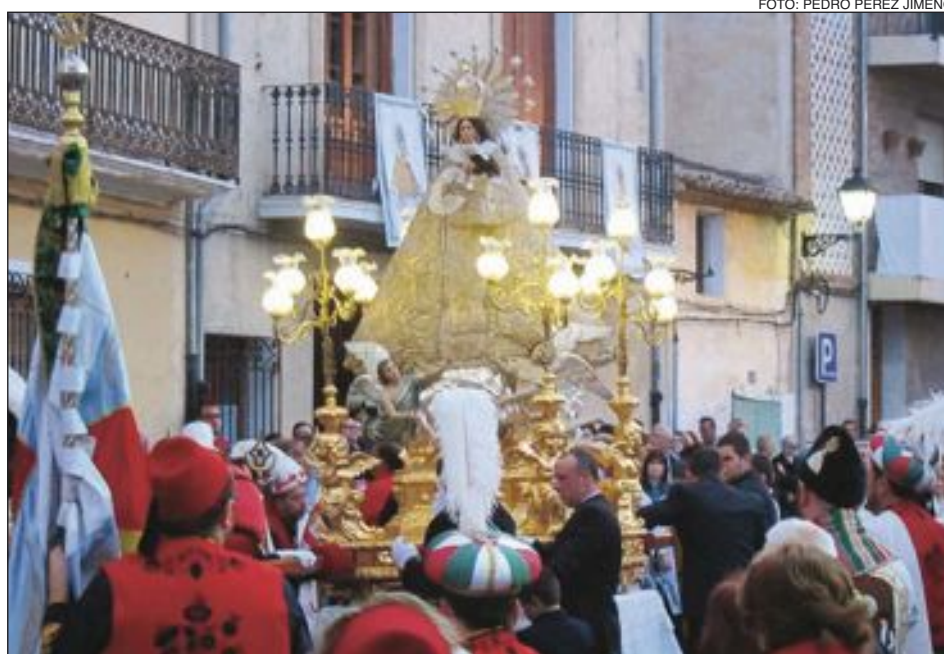
La imagen de la patrona de Biar, de regreso al santuario, el último día de fiestas