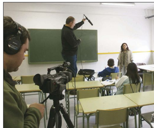
Un momento del rodaje en el IES La Creueta