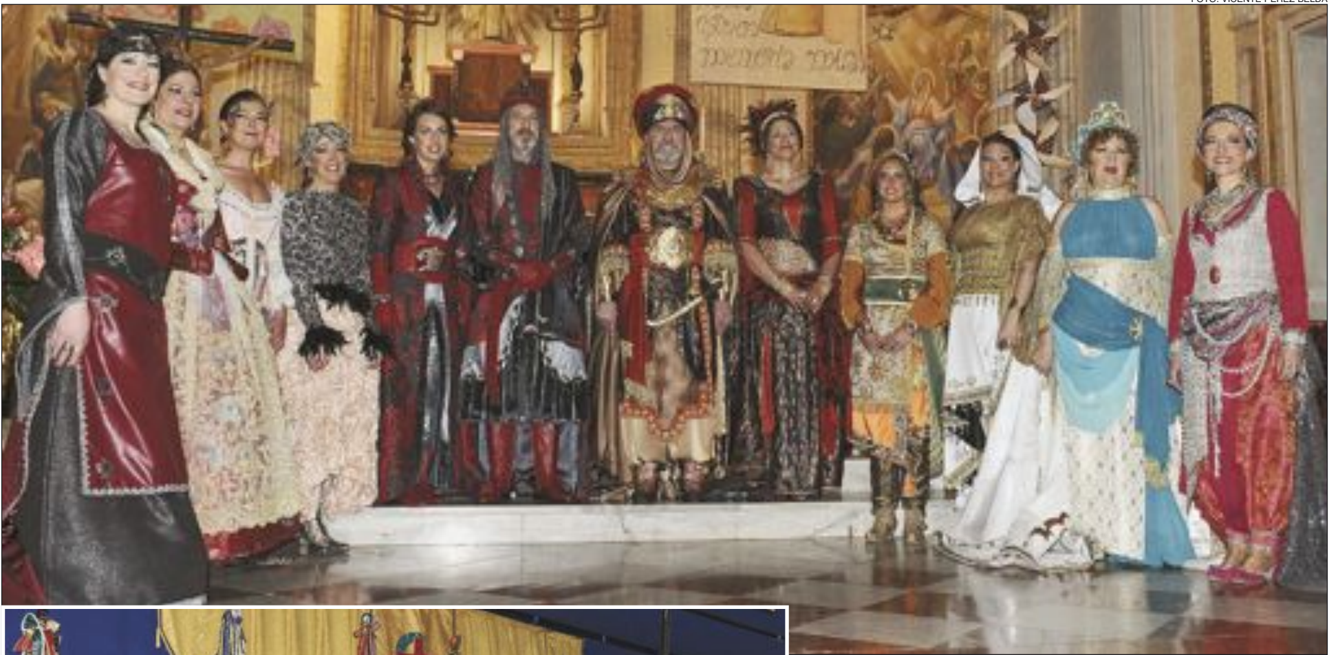
Capitanes y abanderadas, tras la misa del día del Avis, y en la Tribuna de Fiestas durante el concurso de cabos (foto de la izquierda)