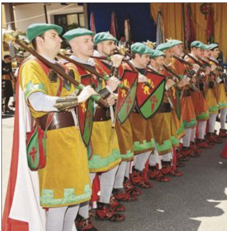
Escuadra oficial de la comparsa Guerreros