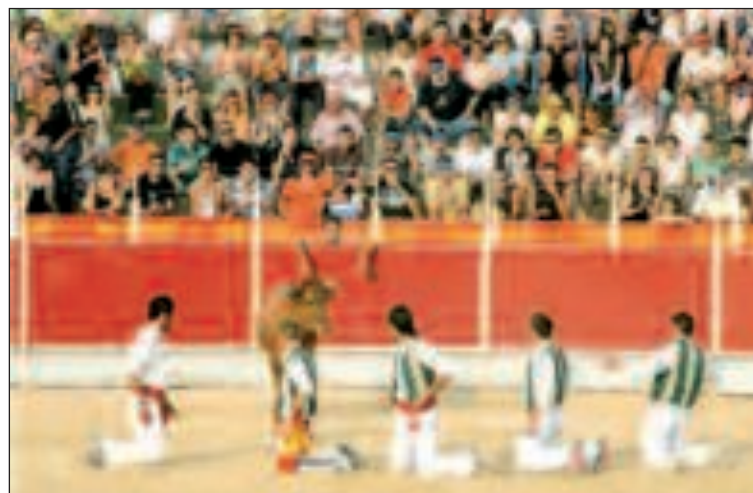
Los espectadores se divirtieron de lo lindo en la plaza de toros portátil