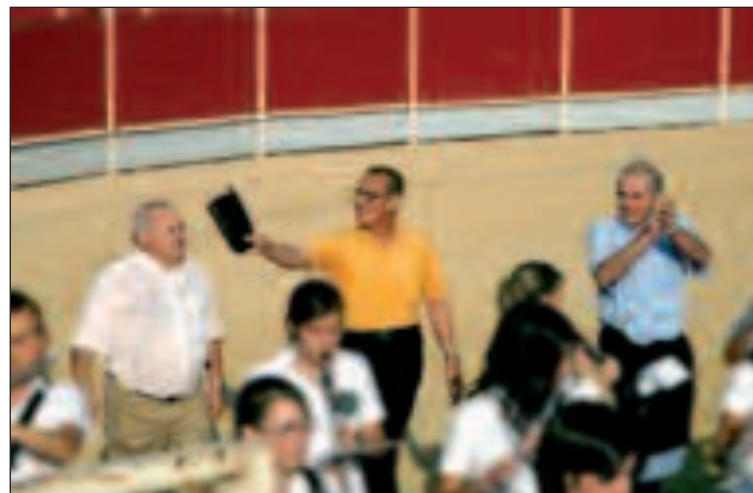
Los tres novilleros homenajeados dieron una emotiva vuelta al ruedo