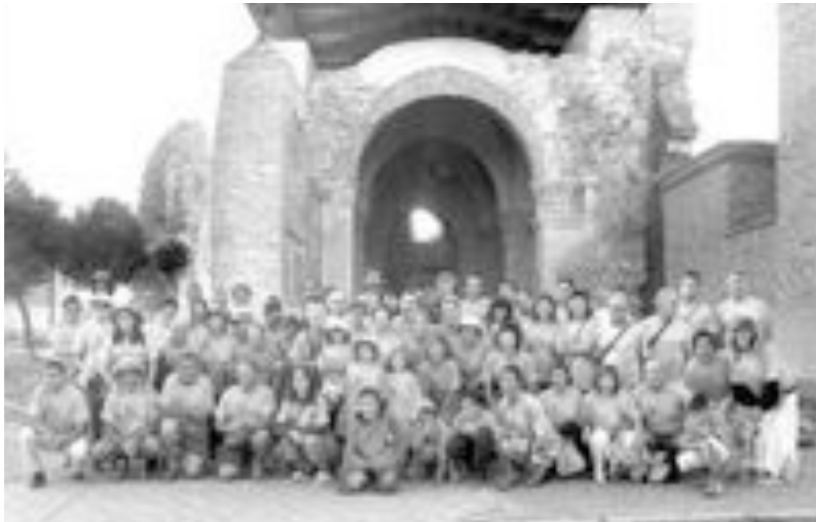
Grupo de senderistas, a su llegada a Sahagún en León, última etapa de la ruta que realizaron del Camino de Santiago

Más de 70 ibenses recorren la segunda etapa del Camino de Santiago