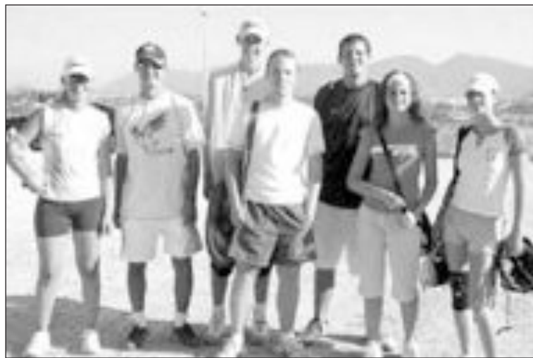
Algunas de las parejas participantes en el campeonato colivenc