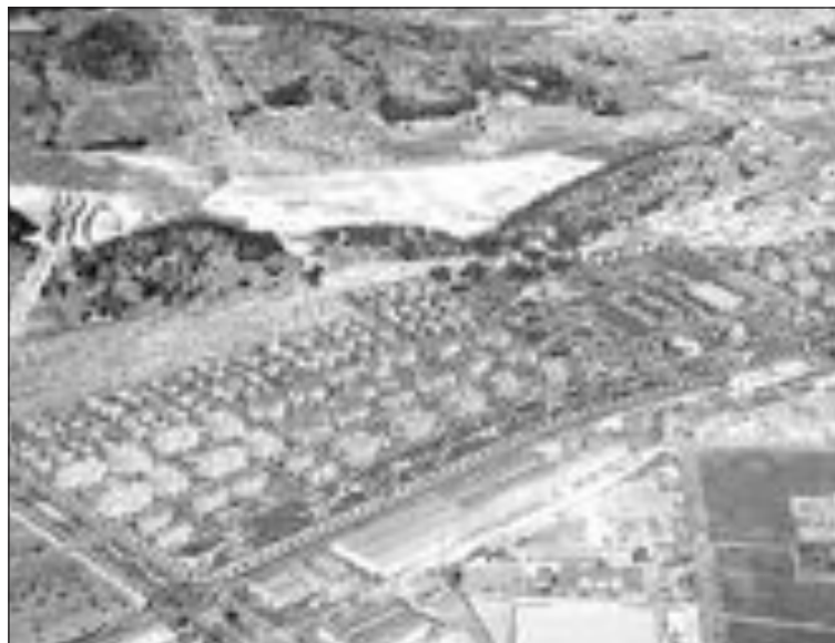
Maqueta virtual de la futura urbanización del Alamí