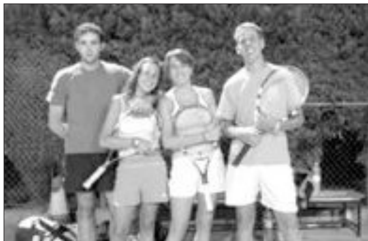
Parejas finalistas de Mixtos

pareja Vanessa (Castalla) y Casillas (Onil). La final, que se jugó a tiempo de 45 minutos, se decidió a un punto con 6