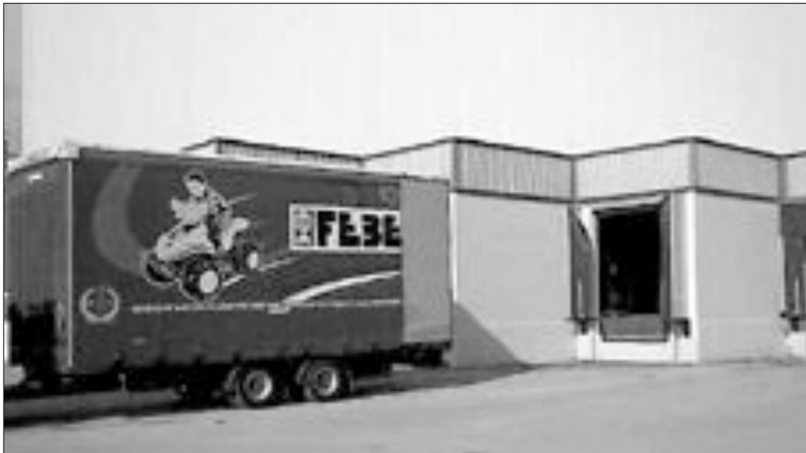
Desde el mes de marzo, Famosa y Feber han colaborado en la producción de juguetes