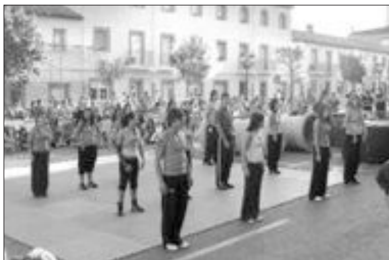
Numerosas personas participaron en la 'Gran Fiesta del Deporte' de Onil