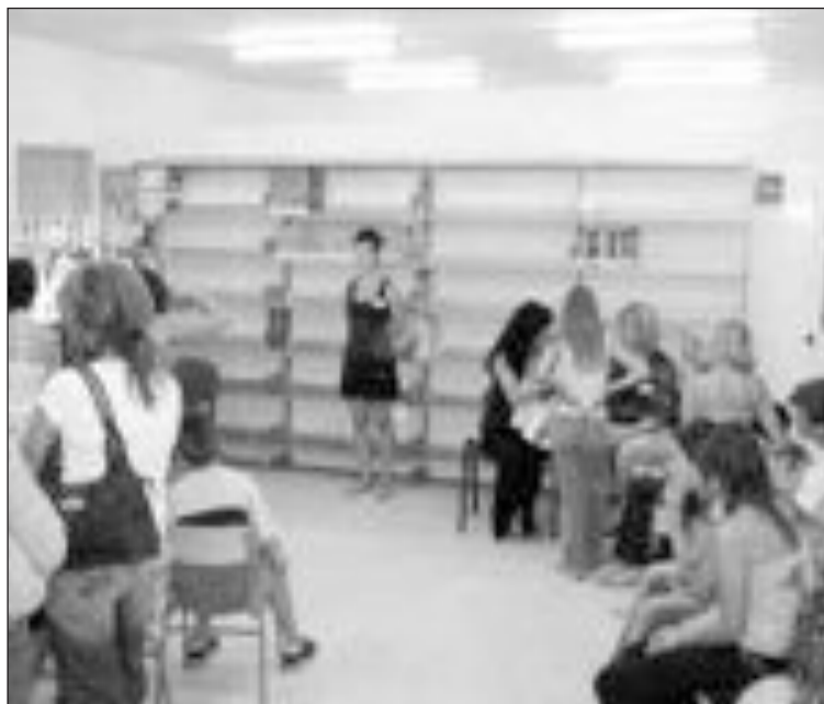
Cada uno de los participantes fue fotografiado durante el casting

Cerca de 50 personas, no sólo de Tibi, asistieron a este casting, en el que midieron, pesaron y fotografiaron a cada uno de los participantes. Las personas que resulten elegidas serán dadas de alta en la seguridad social y tendrán un jornal mínimo de 75 euros al día, a cambio de disponibilidad total para el rodaje.