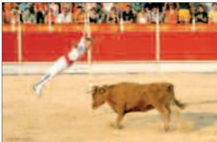
Impresionante momento del espectáculo 'Arte Mediterráneo'

El resto de días, la suelta de vaquillas por las calles castallenses se desarrolló con normalidad, gracias a las fuerzas de seguridad y al sentido común de los asistentes. La antesala de las Fiestas de Moros y Cristianos no pudo ser más divertida y todos, propios y extraños, disfrutaron con esta tradicional actividad, celebrada en honor del Patrón, San Roque, por las calles del centro de la ciudad y las adyacentes a la plaza Casinos.