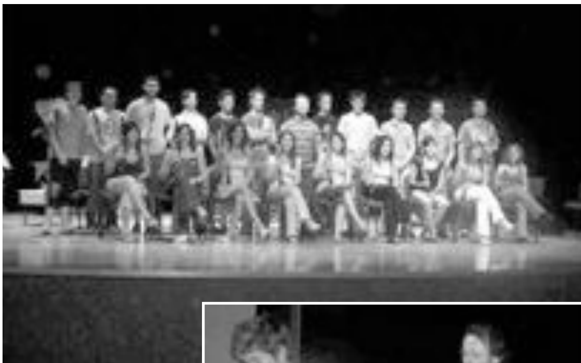
Grupo de alumnos de clarinete

Son muchas las localidades que promueven este tipo de iniciativas durante el mes de agosto con el objetivo de aportar unos conocimientos distintos y de mayor calidad que los