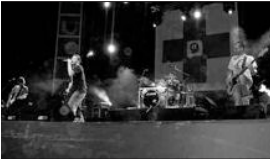
El canto del loco ya actuaron en Ibi en el verano del 2003

Ese viernes tendrá lugar también el tradicional correfocs a cargo del grupo 'La Quarantamaula'. La salida será a las 23,30 horas desde la plaza del Mercado y recorrerá las calles más céntricas para