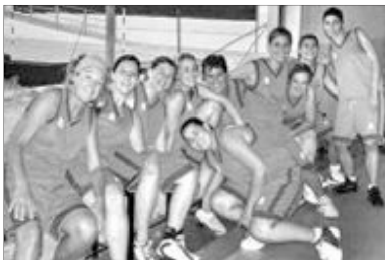
El equipo ganador, 'Mesclaet'

El equipo 'Mesclaet' se impuso en la pasada edición de las 24 Horas de Baloncesto Femenino de Onil, celebrada a finales de julio. 'Mesclaet' y 'Blanc i Negre' fueron los equipos que jugaron la final, donde ganó 'Mesclaet' por 45 a 38. Los resultados de las semifinales fueron: Distribuciones Batoy -'Blanc i Negre' (20-31) y 'Mesclaet'-Fan Magazine (48-29). Por el tercer y cuarto puesto lucharon Distribuciones Batoy y Fan Magazine, partido que ganó Fan Magazine por 45-20 y se proclamó tercero.