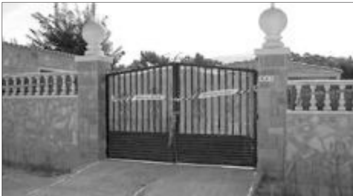
El chalet donde se ha requisado la plantación de marihuana ha sido precintado

Los agentes encontraron en el chalet un vivero con una gran plantación de marihuana,