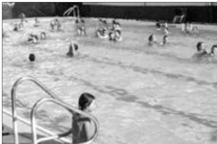
La actividad mejor acogida: la refrescante clase de aquafitness