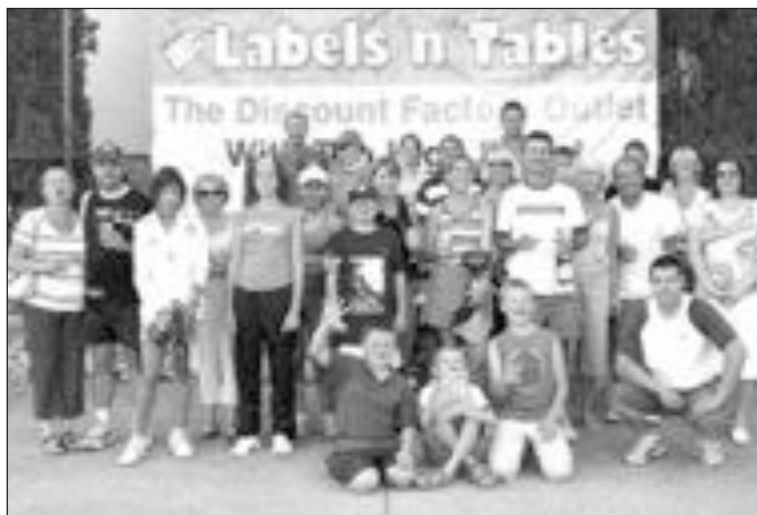
En el campeonato de La Nucía tomaron parte 28 parejas