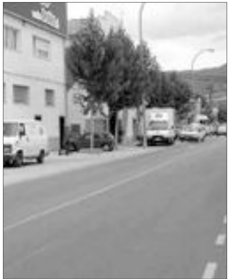
El estudio, realizado a empresarios locales, será presentado en septiembre

Actualmente, IBIAE está estudiando un acuerdo que tiene pendiente con dos empresas de seguridad locales. Teniendo en cuenta las necesidades reales de los industriales, entonces se contratarán los servicios de ambas firmas.