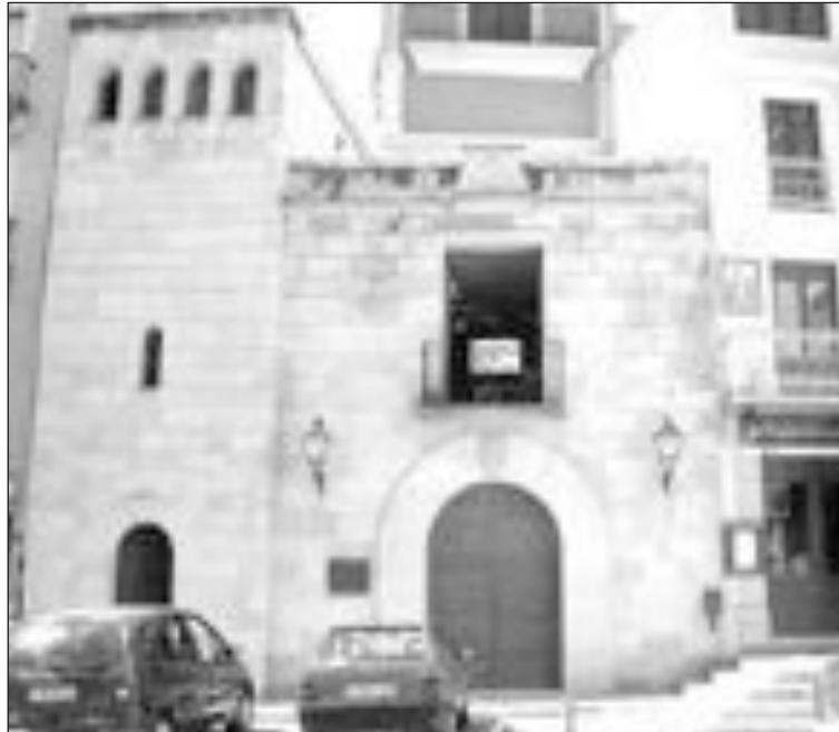
La Casa del Fester se prepara para vivir días intensos

Las calles con más demanda a la hora de comprar las sillas son las comprendidas entre la calle Constitución y la plaza de L'Hostal. Una de las más difíciles de 'vender' es, por ejemplo, la calle Cervantes, según fuentes de la citada institución festera.