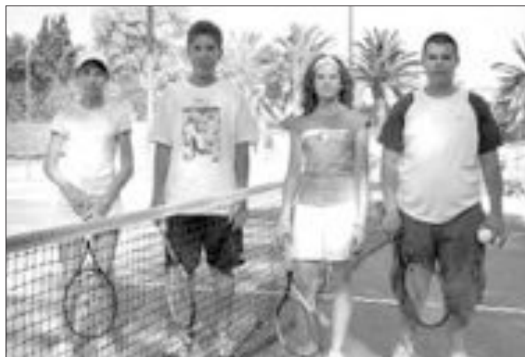
En La Nucía hubo participación colivenca