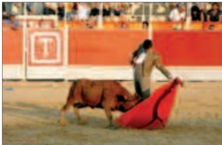
Un alumno de la Escuela Taurina de Alicante, durante la becerrada