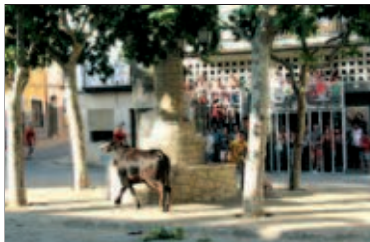
El animal se paseó por las calles de Castalla como Pedro por su casa