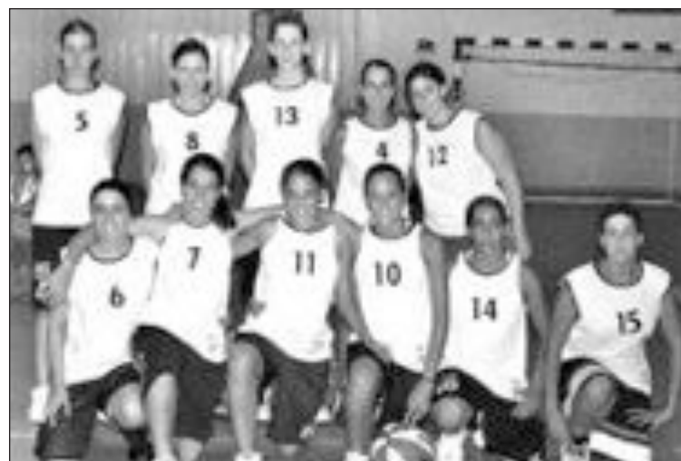
Las chicas de 'Blanc i Negre' quedaron en segunda posición