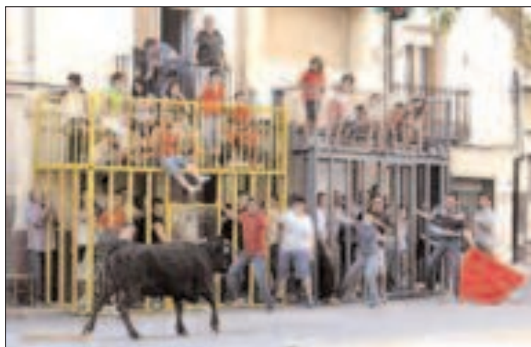
Sólo algunos osados se atrevieron a desafiar a la vaca