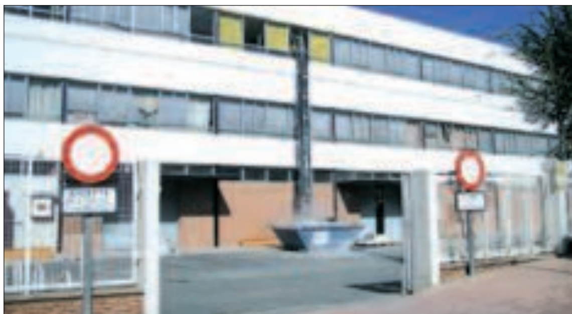
Aspecto actual de Famosa I, donde se encontraban las oficinas, que tras el convenio pasará a albergar viviendas

actual. Y por último, la obligación de que la mercantil construya viviendas de protección oficial en los terrenos conocidos como Famosa 1 lo que permitirá a “Onil reconvertir el centro urbano” con las nuevas edificaciones, espacios verdes y comercios.