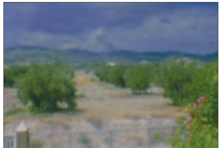
Imagen del incendio al fondo captada por un vecino

Las clases se impartirán en un aula del Centro Cultural que se habilitará para convertirla en taller. El Ayuntamiento se hace cargo del material y del instrumental mientras que la Conselleria de Educación se responsabiliza del profesorado.