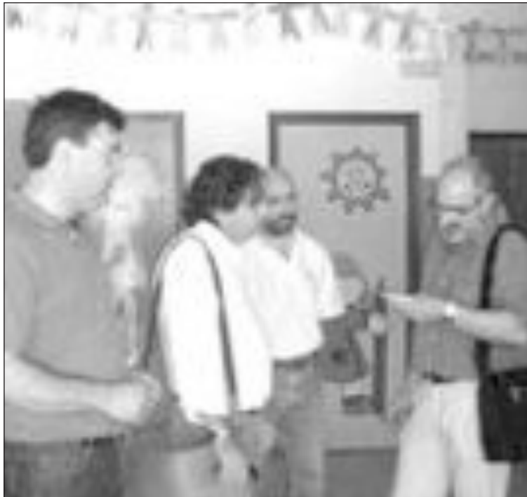
Visita del arquitecto de la Generalitat a los colegios en julio

El pasado mes de julio, el arquitecto de la unidad técnica de la dirección territorial de Educación visitó los colegios Pla y Beltrán, Felicidad Bernabeu y Cervantes para comprobar los trabajos que debían ejecutarse.