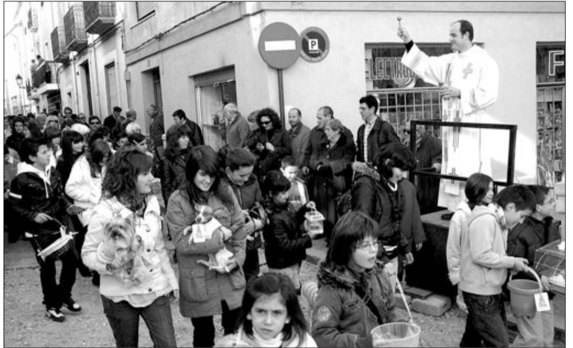
Multitudinaria participación de vecinos en la bendición de los animales