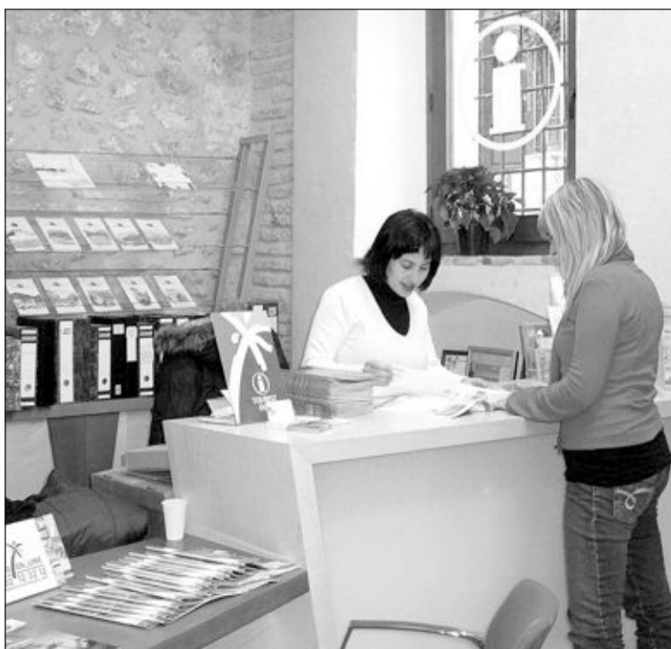
Nueva oficina de la Tourist Info de Biar

El viejo local de la Tourist Info se destinará al proyecto de la nueva escuela infantil.