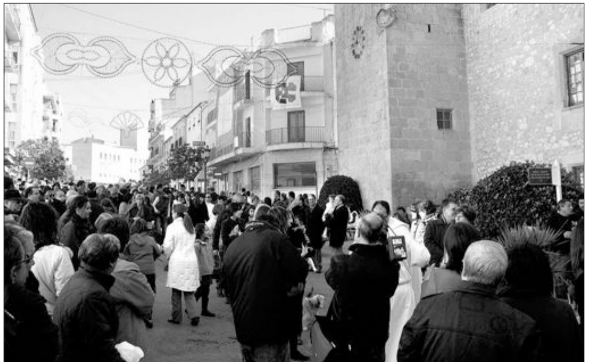
La plaza Mayor registró cientos de personas que quisieron que sus mascotas fueran bendecidas