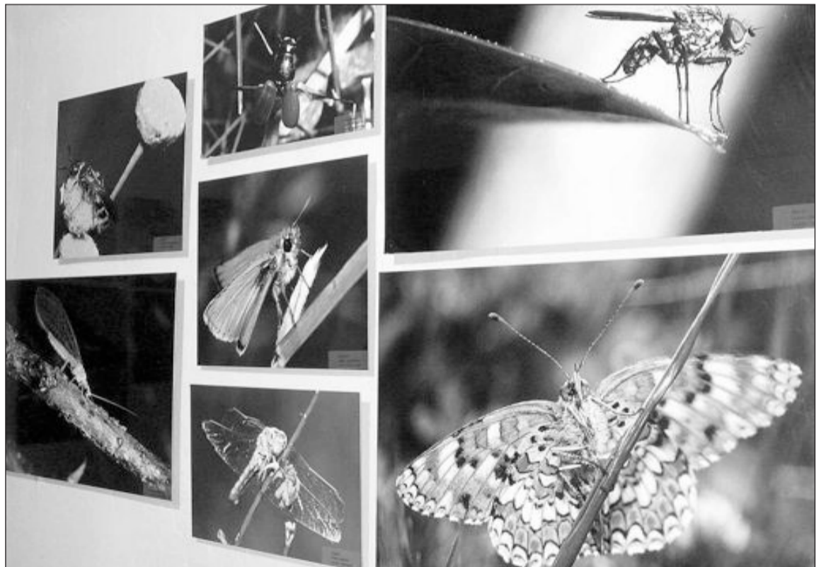
La exposición acoge una muestra fotográfica de diferentes especies de insectos