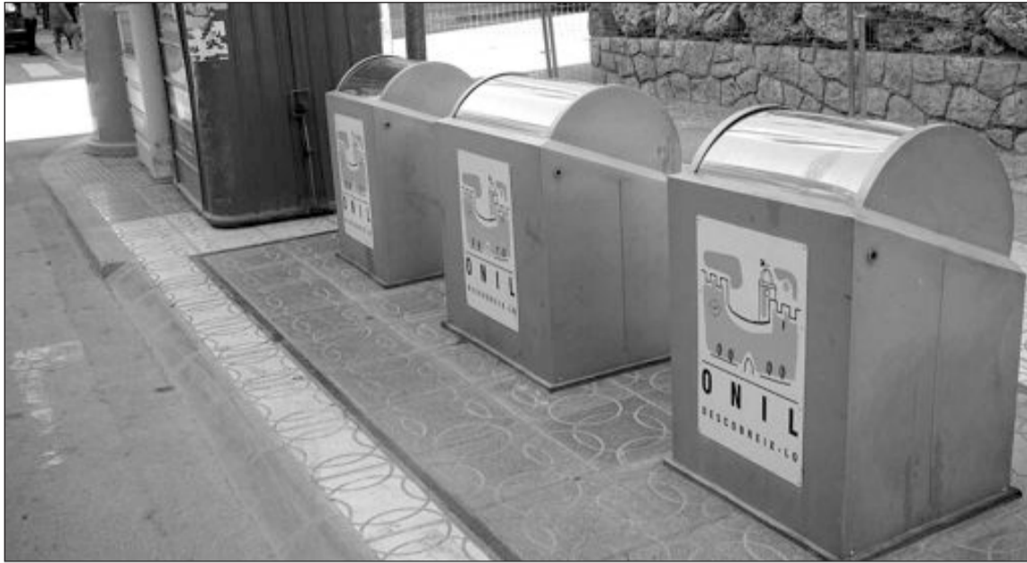
Dos de los proyectos aprobados prevén instalar contenedores soterrados en las calles Maestro Giner, Santa Ana y vías adyacentes

Onil se beneficiará de 1'35 millones de euros (IVA incluido), cantidad que le corresponde por número de habitantes, según la baremación hecha pública por el Gobierno.