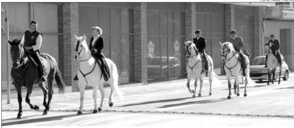
Los caballos iniciaron el pasacalle en la zona del colegio Rico Sapena