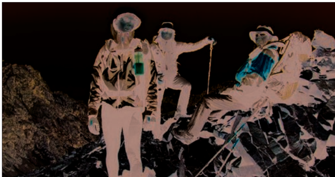
Los tres expedicionarios ibenses se toman un descanso en su aventura

El viernes 23, los tres aventureros harán turismo por Buenos Aires, mientras que el sábado volarán hacia Madrid. Está previsto que lleguen a Ibi sobre las 20:00 horas del domingo, donde les esperarán familiares y amigos en la plaza de La Tartana.