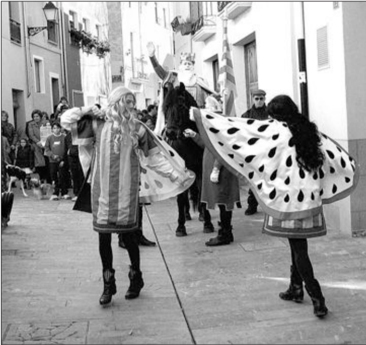
Cabalgata del Rei Pàixaro por las calles de Biar