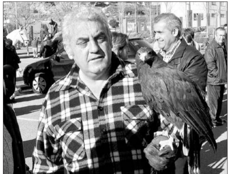
Se pudieron ver animales, nada domésticos, como esta águila