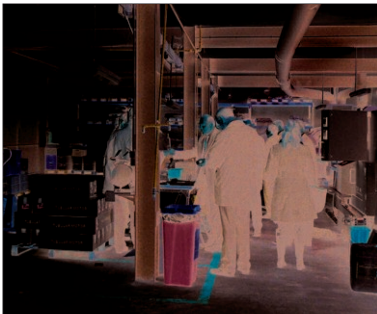
El 80% de la producción de la empresa va destinada al automóvil

El responsable calificaba el ERE de medida preventiva y