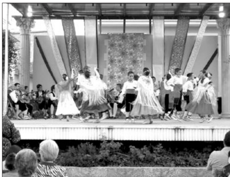
El escenario de la Era del Teular tendrá financiación para su reforma

De todos modos, el concejal indica que es posible que el comedor "pueda a comenzar a funcionar el próximo curso".