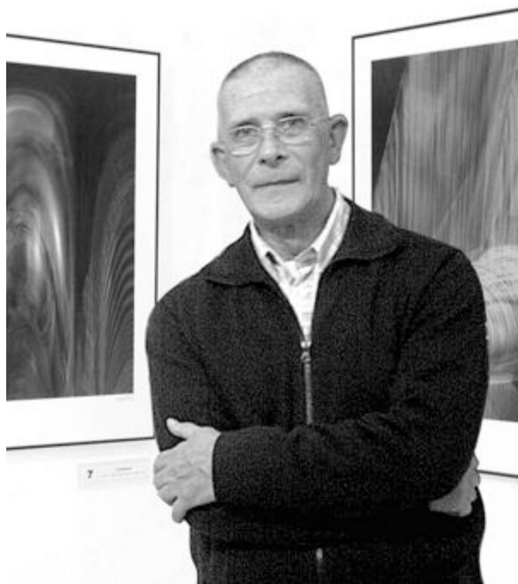
Para el autor, el ordenador puede ser una herramienta muy útil para el arte