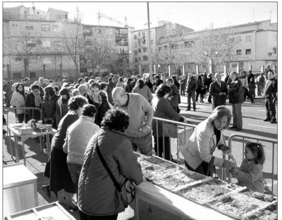
En el parque Les Hortes se organizó un almuerzo a base de cocas