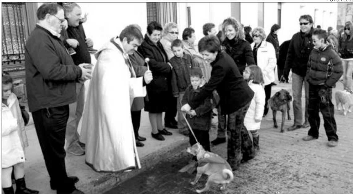
El párroco local bendijo una por una a las mascotas que pasaron por la calle Mayor

Cientos de animales, acompañados por sus dueños, fueron pasando por delante del párroco local, quien, en la calle Mayor, les bendijo en nombre de su Santo Patrón, San Antonio Abad.