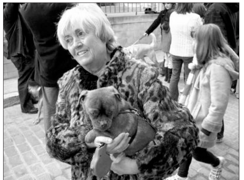
Una vecina muestra orgullosa su perro