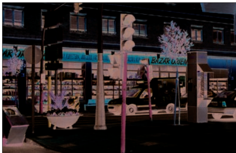
Algunos semáforos aún no funcionaban el martes día 20 por la mañana