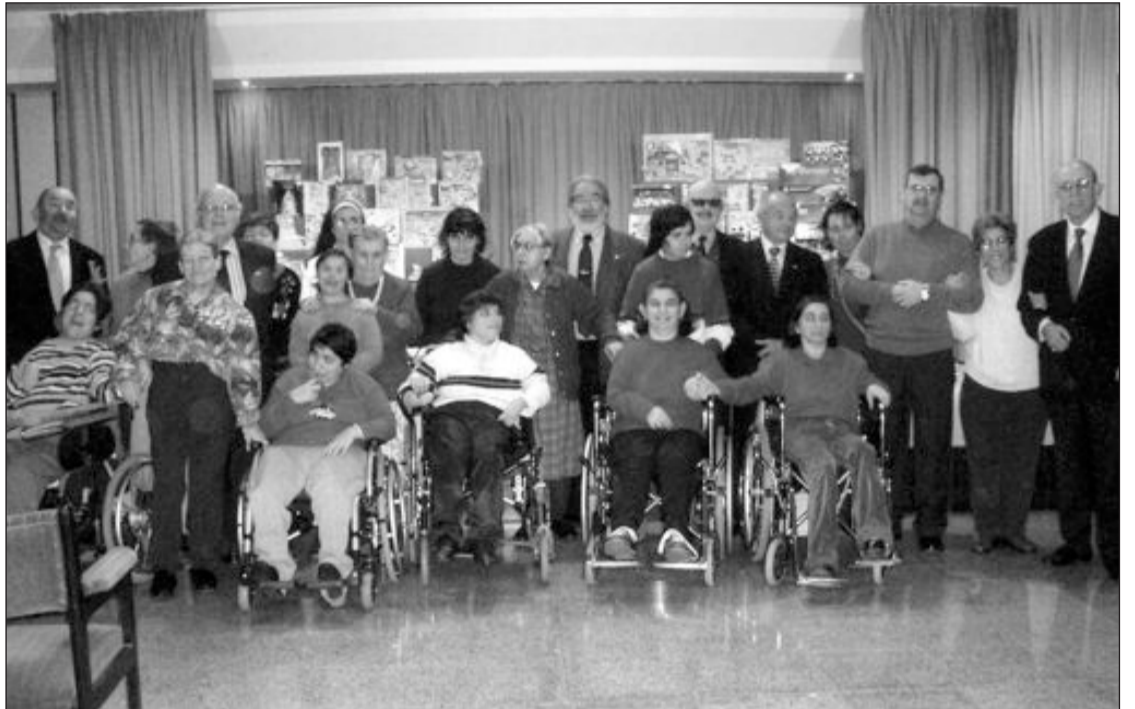
Miembros de la Agrupación de Artilleros junto a internas del centro

La agrupación agradece la colaboración de las empresas Claudio Reig, Coloma y Pastor, Color Baby, Fábrica de Juguetes, Ibi-trans, Injusa, Jopi, Juguetes Industriales, Moltó y Palau.