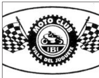
Logotipo del Moto Club de Ibi