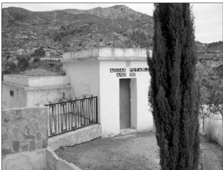
La guardería se ubicará en el lugar que ocupa el antiguo depósito de agua