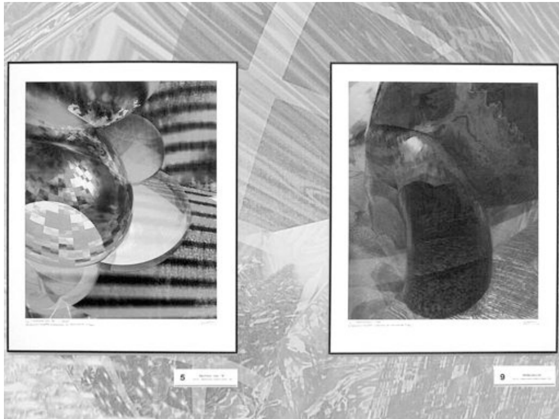
Algunas de las obras de la exposición del pintor ibense Joaquín Miralles

C/. Tibi, 8 - Tel. 96 633 82 09 - IBI www.mundocineibi.com