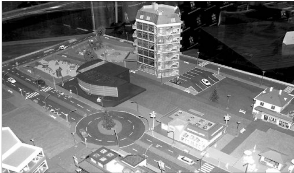
Maqueta representativa de las previsiones iniciales para la zona de ocio La Capellanía

unánime alcanzado entre todos los grupos política a los siete proyectos que finalmente se han enviado al citado Fondo Estatal.