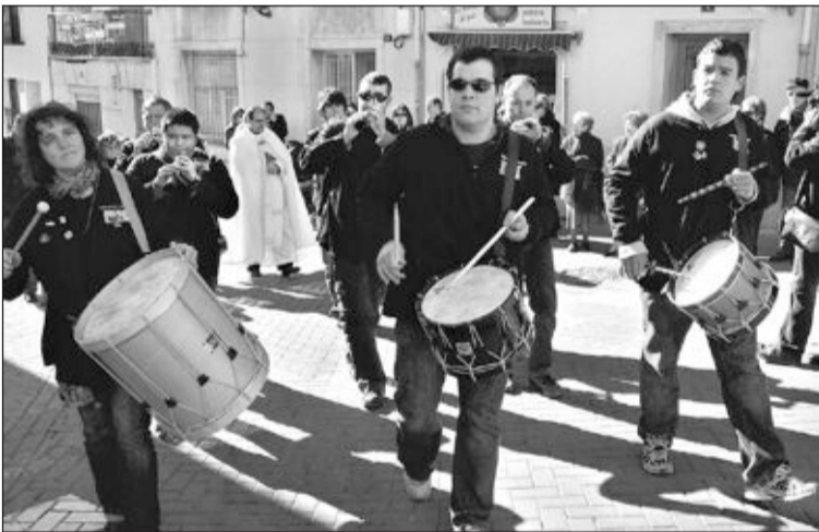
La banda de dolçaina i tabalet amenizó la bendición de animales