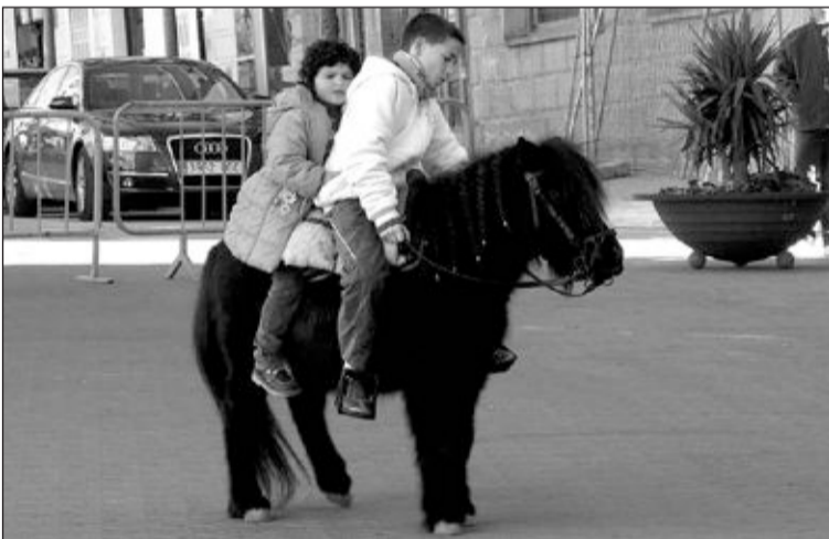
Momentos antes de la bendición, unos niños pasean a lomos de su poni