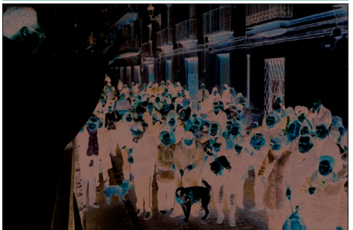
San Antón bendice a las mascotas de la comarca. El domingo 18 de enero se sucedieron en las localidades de la Foia las bendiciones de animales en conmemoración de la festividad de San Antón. La bendición más madrugadora tuvo lugar en Ibi, con pasacalle y almuerzo en el parque Les Hortes. Y Biar cumplió su tradición centenaria con el Rei Paixaro.