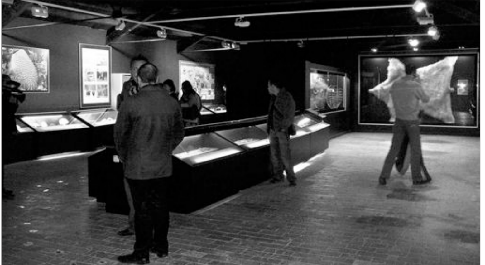
El Museo de la Biodiversidad, ubicado en la antigua fábrica Payá, acoge estas I Jornadas Entomológicas

El mismo día de la inauguración se iniciaba el ciclo de conferencias que se ha programado en el Centro Social Polivalente y que abrió el propio Eduardo Galante. El director del CIBIO recordó que son el grupo de organismos más diverso con cerca de 1 millón de especies conocidas y que aparecieron en la tierra hace 450 millones de años.