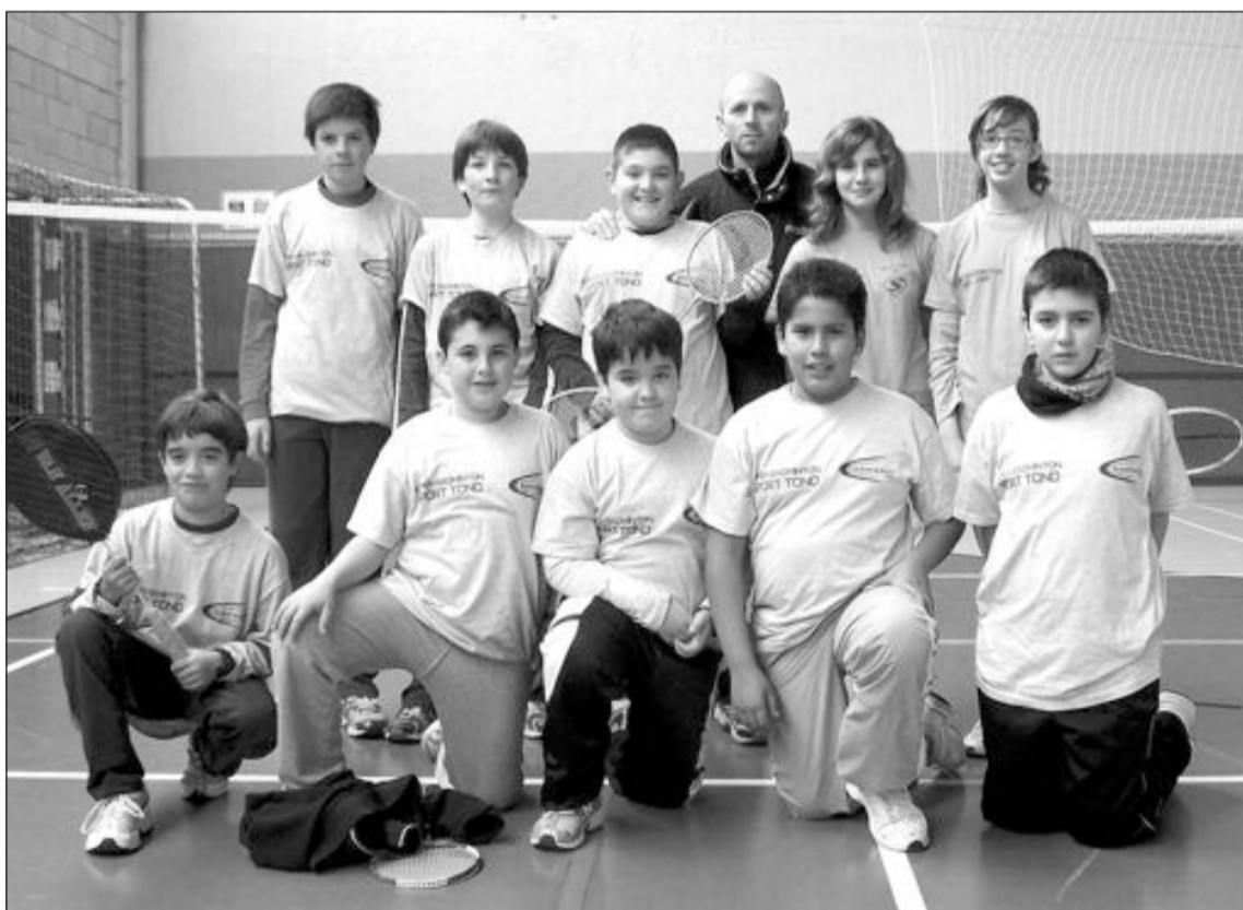
Equipo Sub-13 del Club de Bádminton de Onil, junto a su preparador