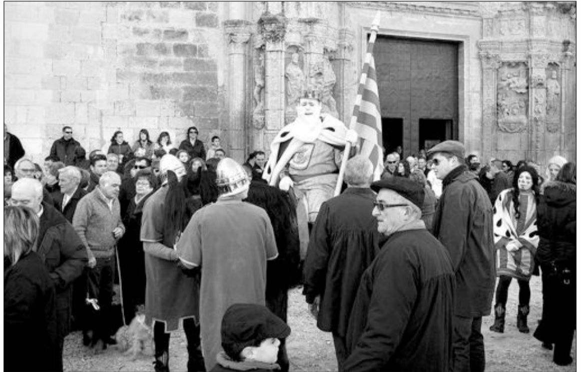
El Rei Pàixaro, montado en su caballo, es recibido por los vecinos en la plaza

La Comisión que organiza estas fiestas, obsequia ese día a todos los animales con una galleta y con una estampa de San Antón.