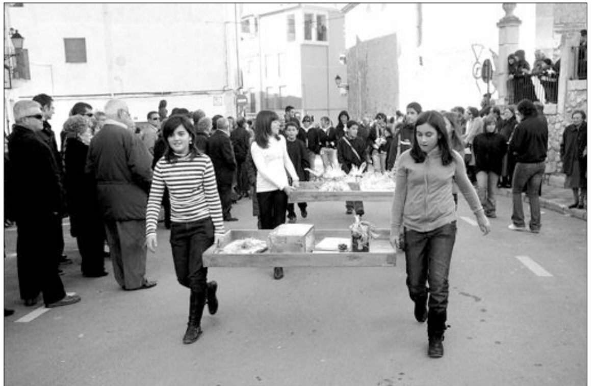
Los niños desfilan mostrando los productos que se han recogido para la subasta de la tarde