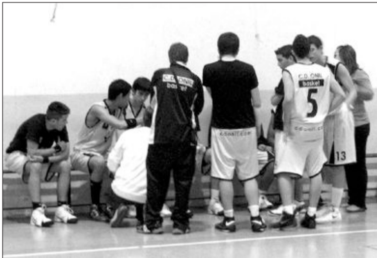
El Júnior Masculino ganó esta semana al Adesavi (55-44)

El Sénior Masculino B perdió en Burjassot (67-59), en su mejor partido de la temporada, pese a lo surrealista del encuentro. No dejaron jugar a