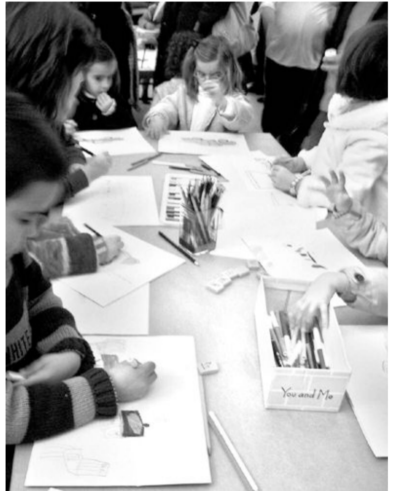
La primera actividad tuvo lugar el pasado domingo, 18 de enero

serán los cuenta cuentos y el 21 de junio, los juegos.