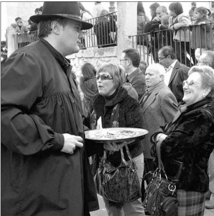
La Comisión es la encargada de recoger las donaciones