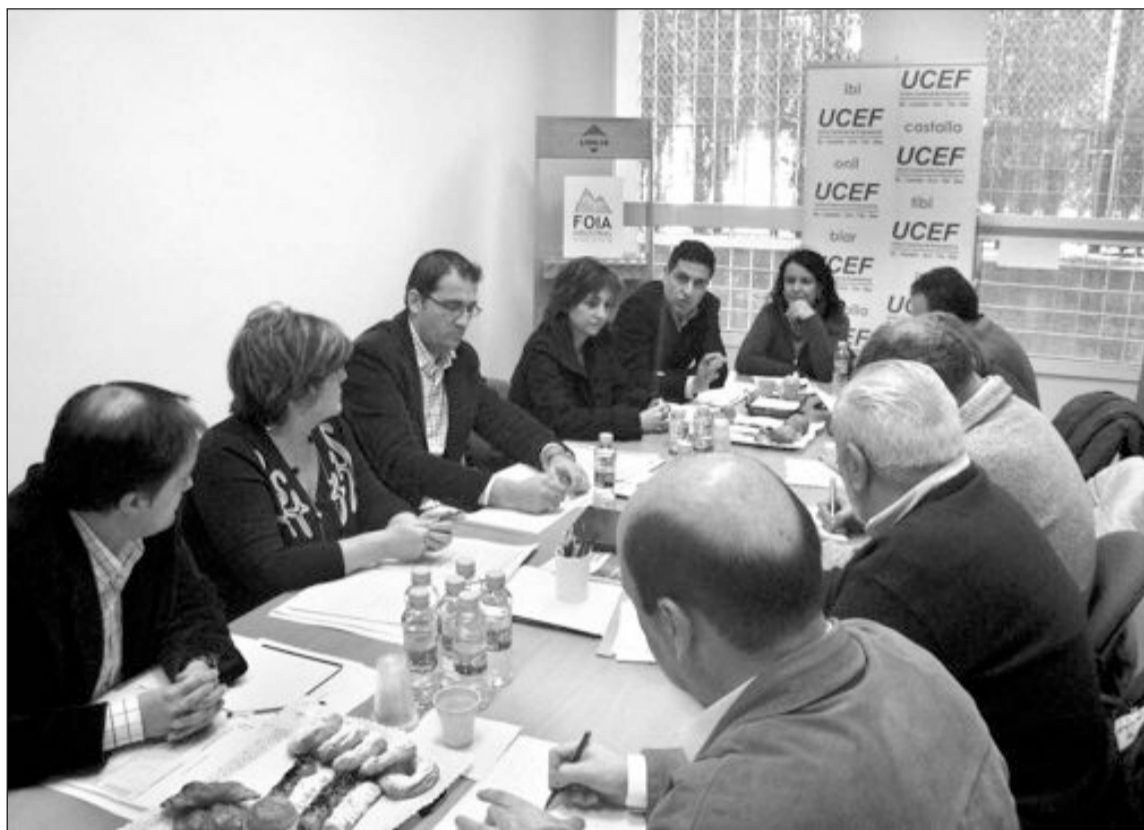
La reunión se celebró el miércoles, 21 de enero, en la sede de la UCEF en Ibi

El Pacto Territorial para el Empleo tiene entre sus objetivos fomentar la promoción del espíritu empresarial y del emprendizaje, mejorar la cohesión social de las personas menos favorecidas, impulsar la