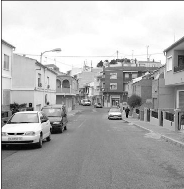
La falta de presión del agua es un problema en el barrio de Mirasol

En la misma entrevista, la primera edil, hizo entrega también a la responsable autonómica del proyecto del Pozo Calderetes, con el fin de que se confirme la puesta en marcha del mismo y así "asegurar a todo el pueblo el abasteci-