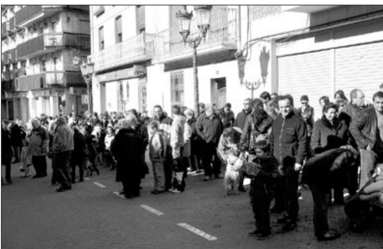
Los participantes esperaron en la plaza Mayor hasta que acabara la misa