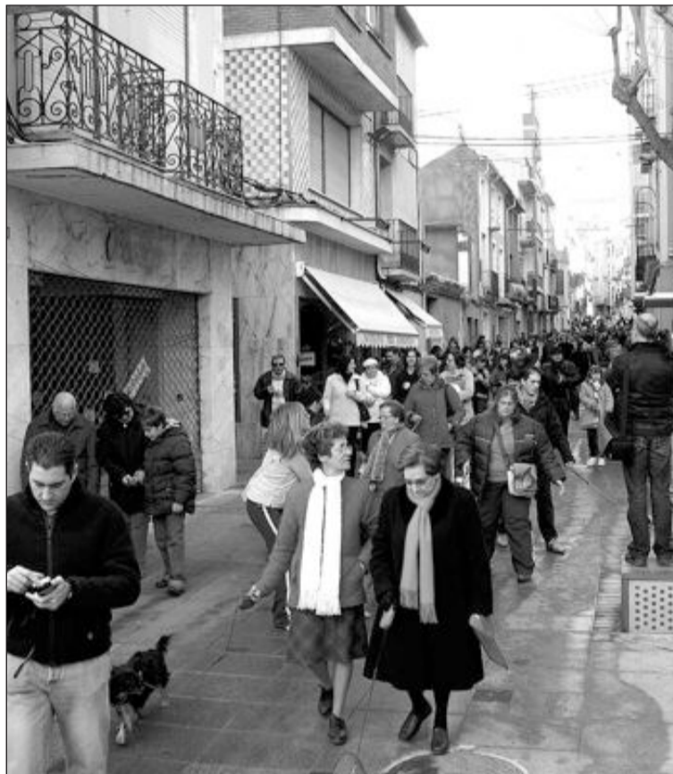
Los participantes realizaron un desfile hasta el parque Les Hortes

La agradable climatología propició una jornada de convivencia entre todos los asistentes que pudieron compartir sus experiencias y aficiones relacionadas con sus mascotas.