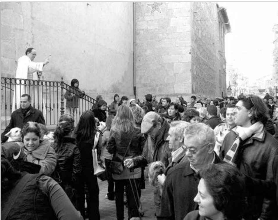
Bendición de animales en la iglesia de la Transfiguración del Señor