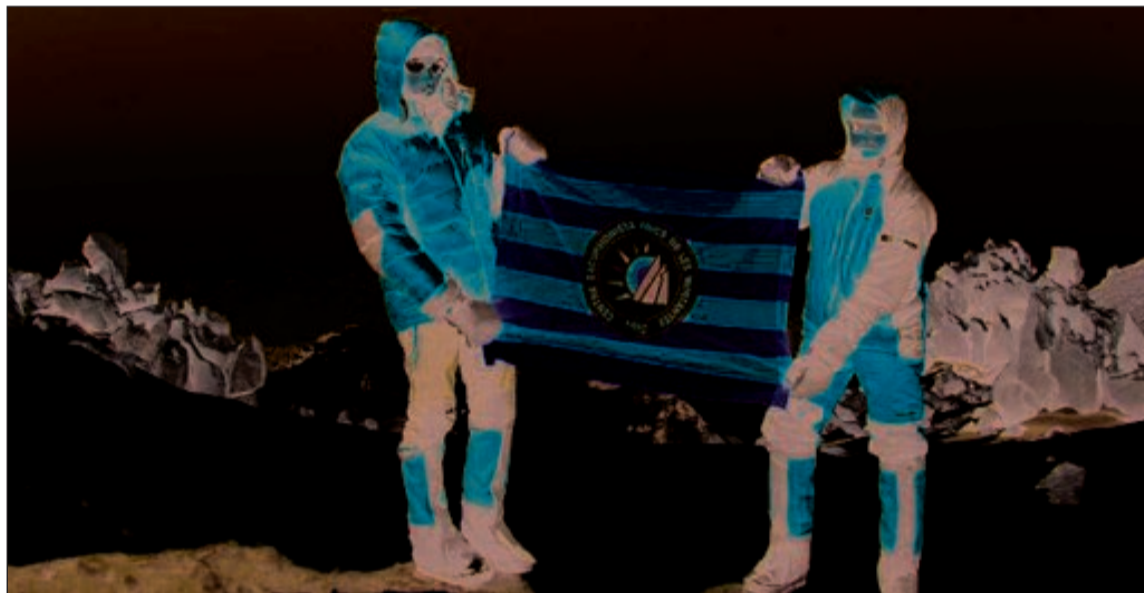
El Centre Escursionista 'Amics de les Muntanyes' estuvo presente en el Aconcagua