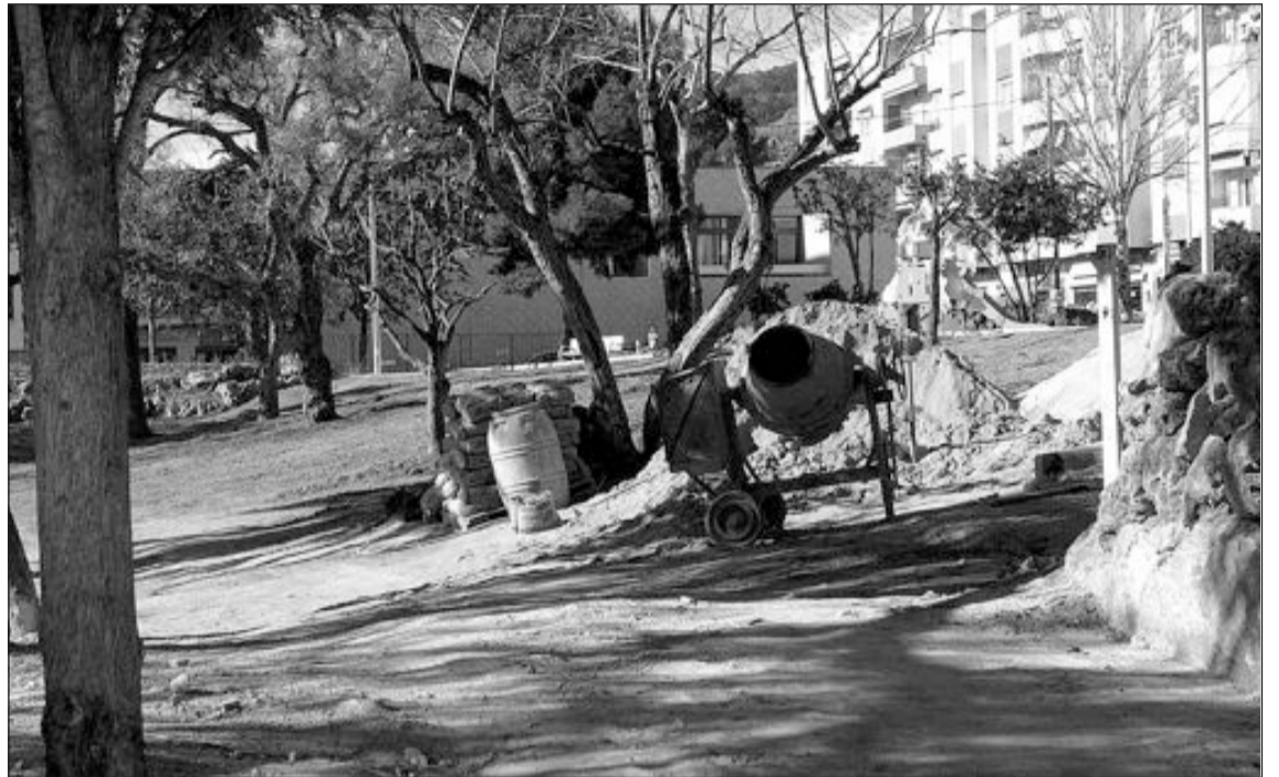
Estado de las obras en el interior del parque Félix Rodríguez de la Fuente

Asimismo, el área de Medio Ambiente de la Diputación y el Ayuntamiento están gestionando la instalación en el parque de un circuito biosaludable,