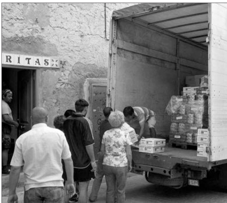
El cargamento llegaba el jueves 10 de junio a las 15,30 horas