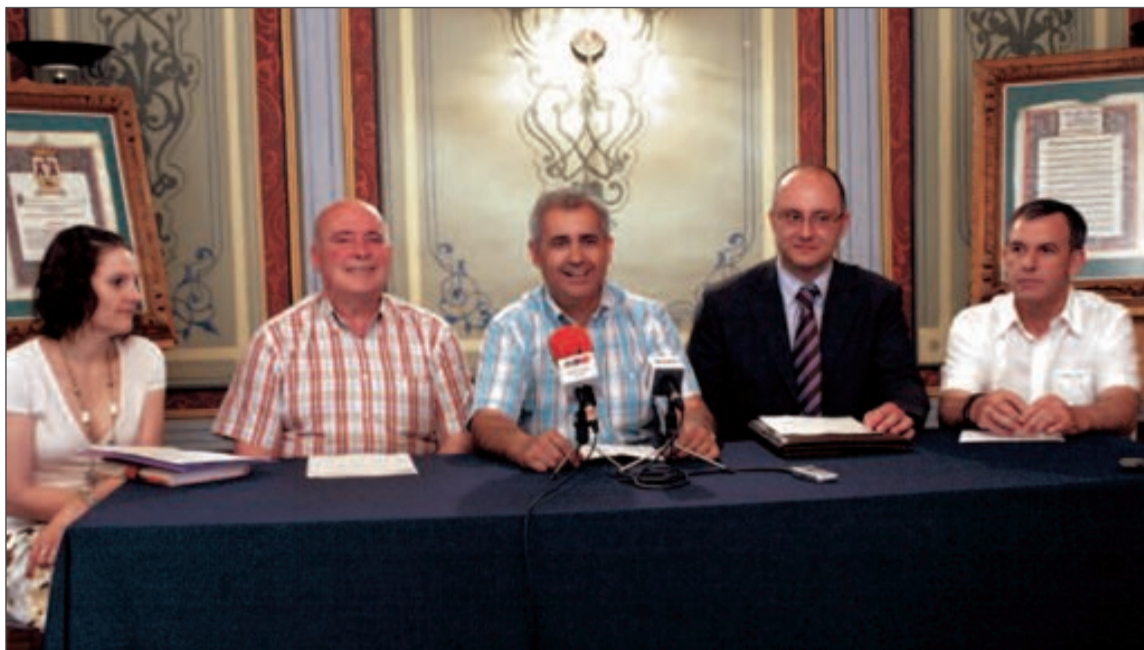
La presentación de los proyectos tuvo lugar el lunes 7 de junio en el Archivo Histórico Municipal

Amics de les Muntanyes realizará un inventario de la biodiversidad de la ladera sur de la Font Roja. El objetivo, según explicaba Manuel Mon-