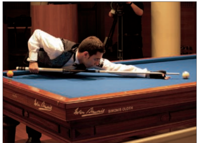
Un momento de la final entre Caseta Nova y Agipi

Por otro lado, el Hotel Caseta Nova alberga, del jueves 10 al domingo 13 de junio, las fases semifinal y final del vigésimo quinto Campeonato Na-