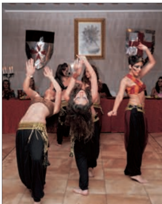
Los comensales fueron obsequiados con un baile árabe