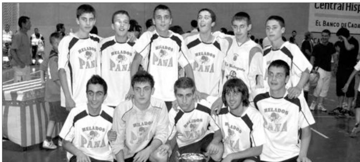
Campeón de la categoría Cadete: 'Amigos de Castalla'