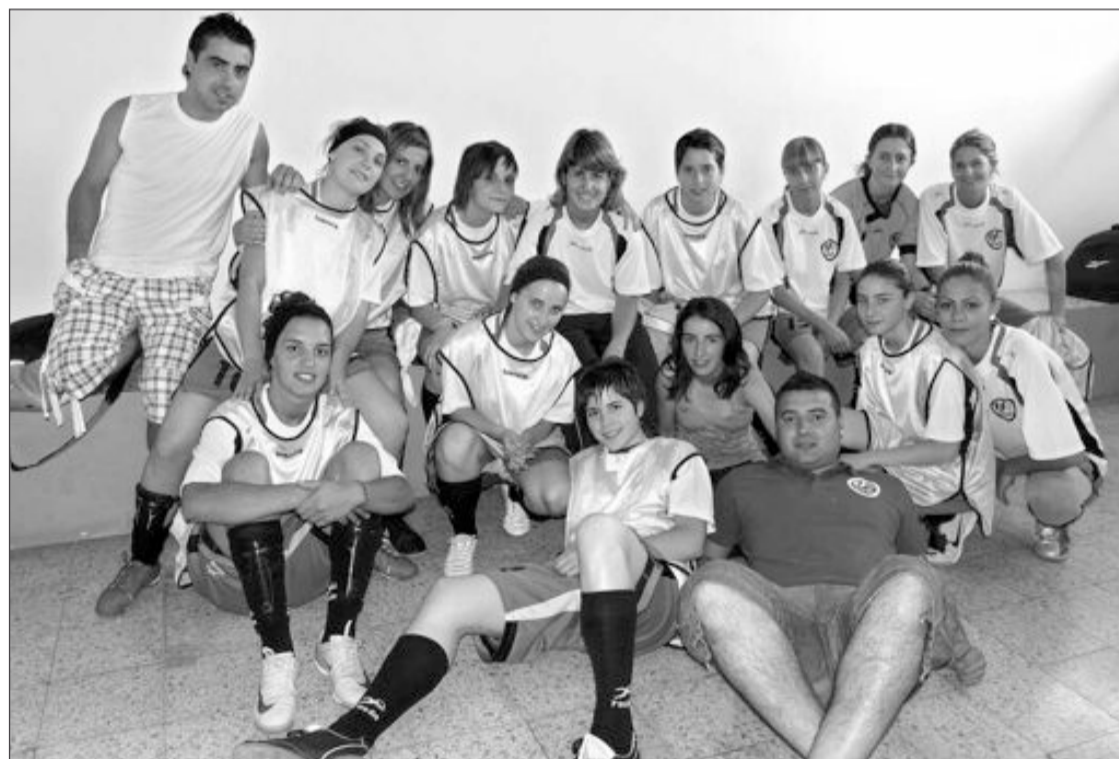
Jugadoras y entrenadores del equipo femenino del Club de Fútbol Sala de Onil