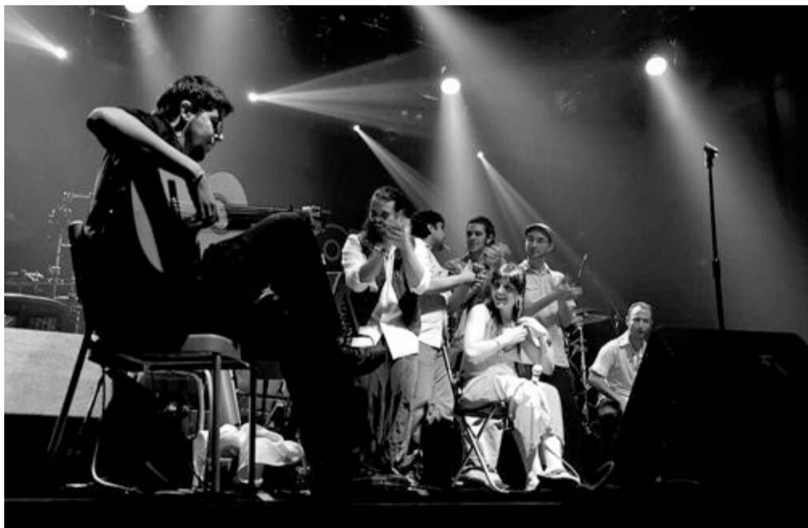
D'Callaos presenta el concierto-teatro 'El Café de las Niñas'

D'Callaos cultiva un estilo musical propio que bautizan como 'nu-flamenc', basado en el rock andaluz de los años 70,