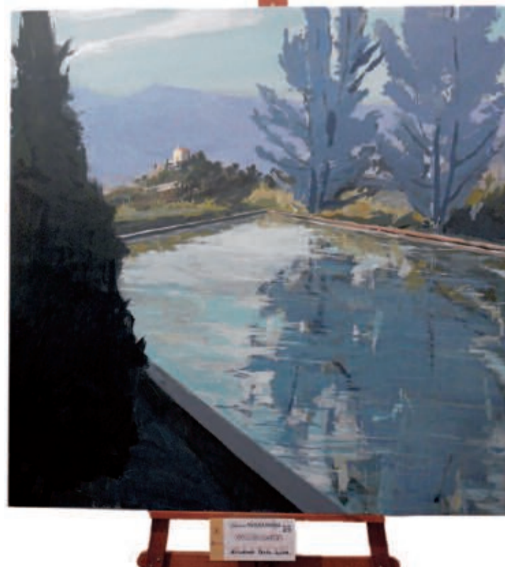
Obra ganadora del cuarto premio del autor Guillermo Ferri de Ontinyent