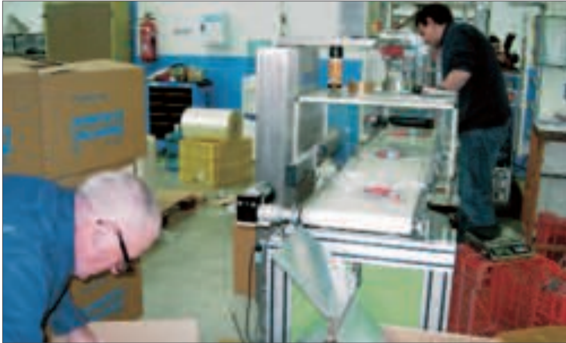
La industria lideró en mayo la contratación dando trabajo a 88 personas en la comarca

En cuanto a los Expedientes de Regulación de Empleo, en abril se presentaron un total de 9 que afectaron a 90 trabaja-