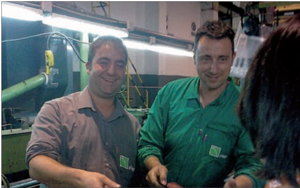
Trabajadores recibieron algunos consejos de la campaña contra el tabaco

A 86 alumnos y alumnas de 1º de ESO se les implicó para que participaran en una serie de actividades entre las que se había talleres de visualización de imágenes del tabaco y sus consecuencias, juegos de preguntas y el taller de 'La Máquina de Fumar' para experimentar cómo afecta el tabaco a los pulmones.