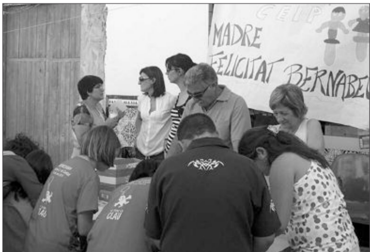
El taller del colegio Felicidad Bernabeu era de marcapáginas