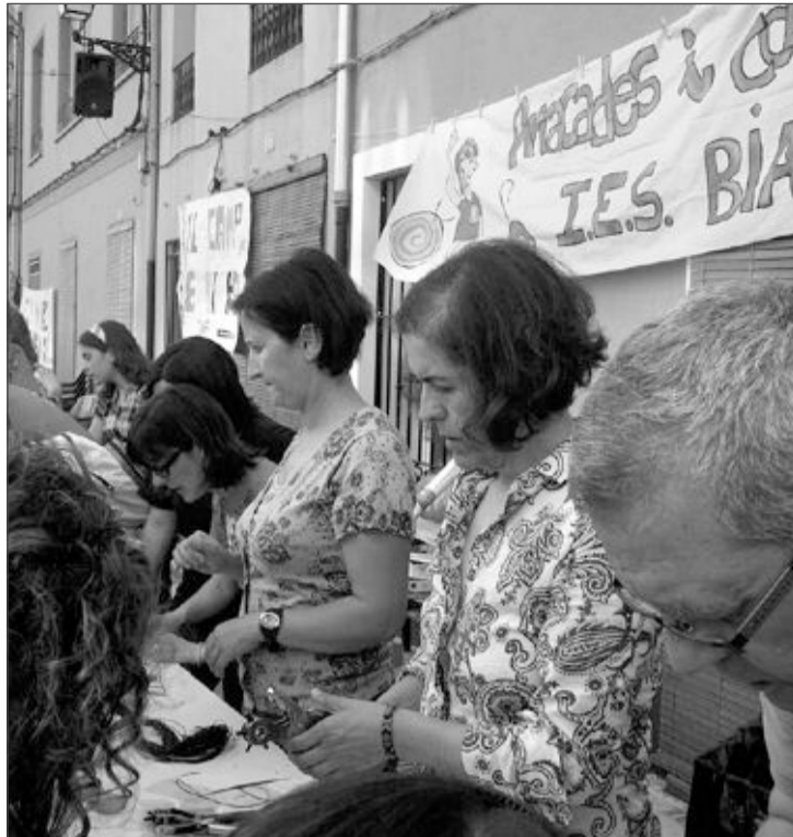
El instituto de Biar realizó un taller de collares de plastilina

También está la campaña de natación para adultos. La inscripción es gratuita para los socios de la piscina hasta un máximo de 14 alumnos.