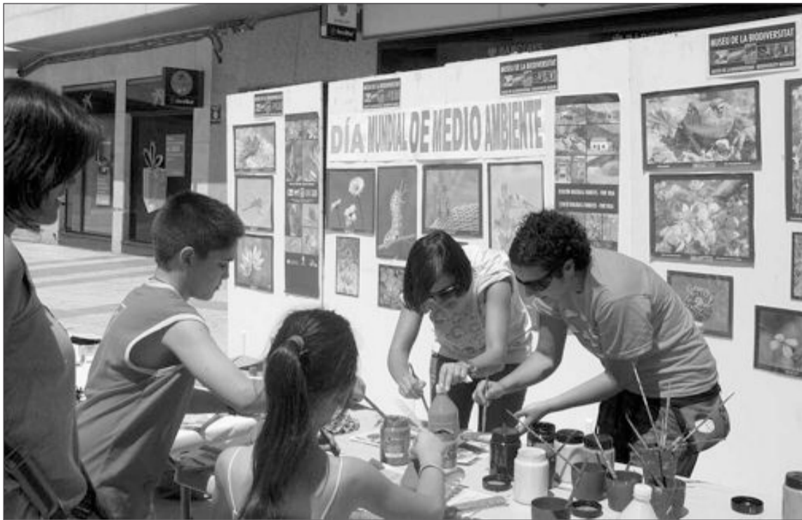
En los talleres se proponía la elaboración de animales a partir de material reciclado

El objetivo era sensibilizar a la opinión pública en temas ambientales y aumentar la conciencia sobre la importancia de la conservación de la biodiver-