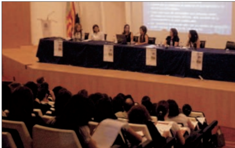
Las jornadas se desarrollaron en el Palacio de Congresos del Colegio de Médicos de Alicante