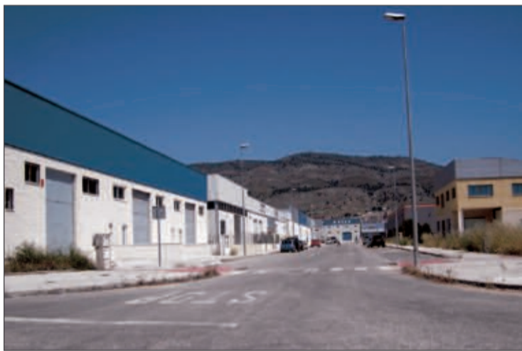
Vista del polígono industrial de Onil

los trabajadores es mantener tal cual su propuesta de cierre de convenio, esperando que los empresarios la acepten.