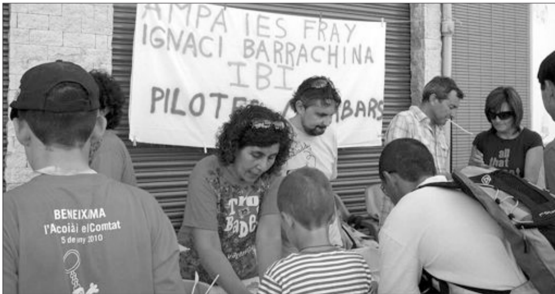
El IES Fray Ignacio Barrachina organizó un taller de creación de figuras de corcho

La localidad de Ibi organizará en 2011, la próxima edición de les trobades , para lo que ya ha comenzado a trabajar.