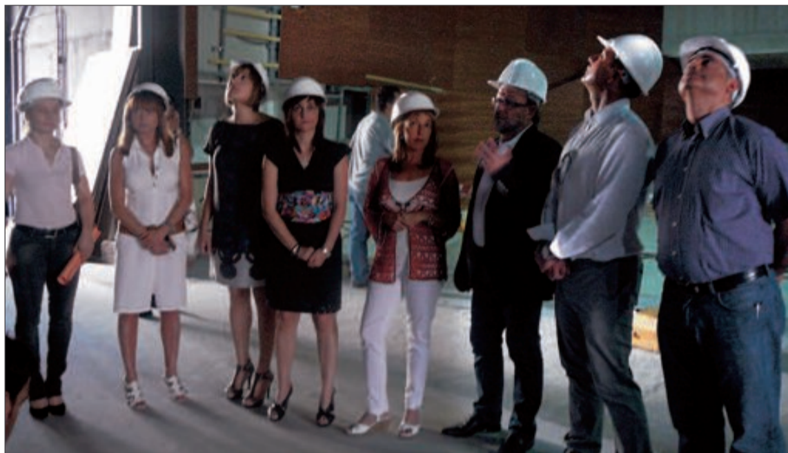
La consellera visitó las obras del teatro acompañada por la alcaldesa y varios concejales del equipo de gobierno

La responsable autonómica de Cultura, acompañada por la alcaldesa y varios concejales del equipo de gobierno, visitaba las obras que está efectuando la empresa Intersa y que según la primera edil son “las más importantes en inversión que se han realizado en el municipio y que equiparán