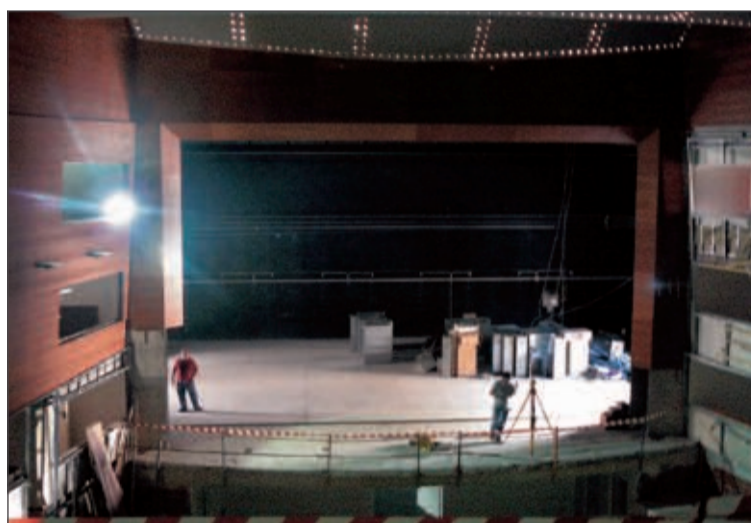
El teatro tiene una de las cajas escénicas más grandes de la Comunidad

El teatro Río tiene una superficie de unos 4.500 metros cuadrados y dispone de dos grandes salas, la principal