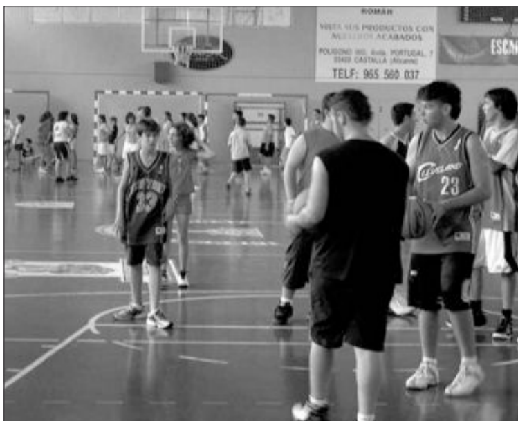
Imagen de archivo del campus de baloncesto celebrado el año pasado

El Stage de Tenis Verano 2010 lo organiza el Club de Tenis Teixereta de Ibi, del 5 al 30 de julio, de 9 a 13 horas en el Polideportivo Municipal.