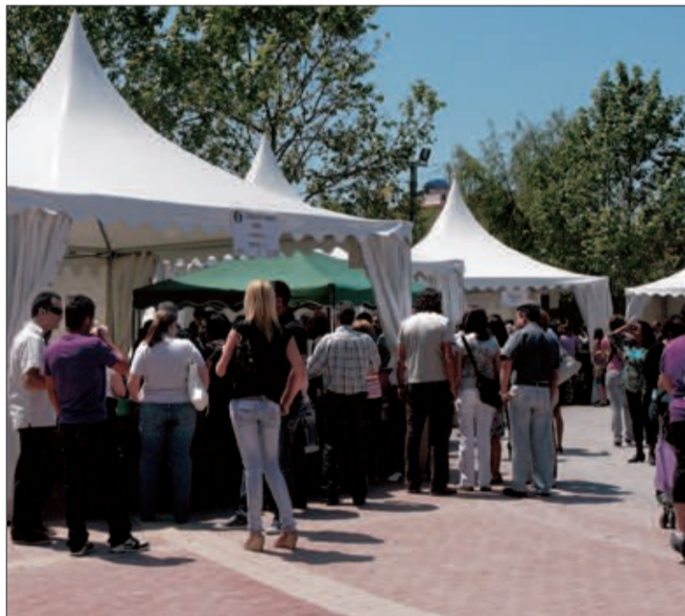
Entre tapas, bebidas y dulces se sirvieron más de 18.000 consumiciones

El gerente de Las Vegas opinaba que, en cada edición, se supera la calidad de la tapas y agradecía a todos los