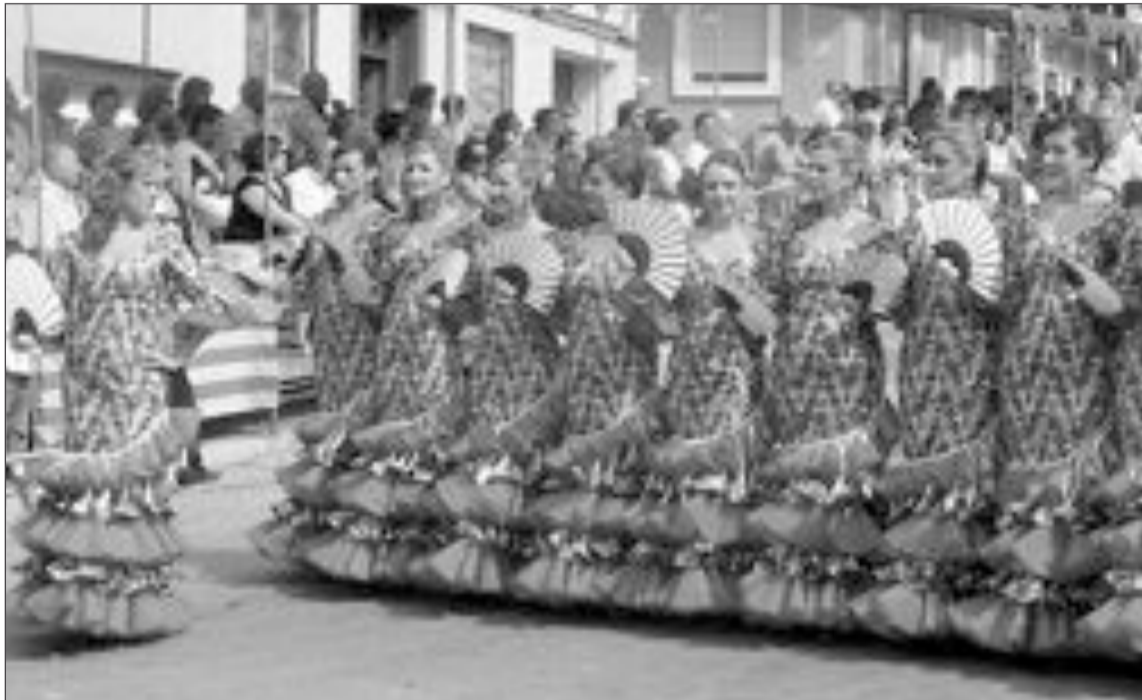
Las escuadras de mujeres cristianas, uno de los clientes del presunto estafador

De las investigaciones llevadas a cabo por la Guardia Civil, se ha podido saber que cuando las empresas de diseños y confección le reclamaban el importe de los trajes, el presunto estafador les ponía infinidad de excusas con tal de no hacerlo efectivo, llegando hasta coaccionarles a través de falsos