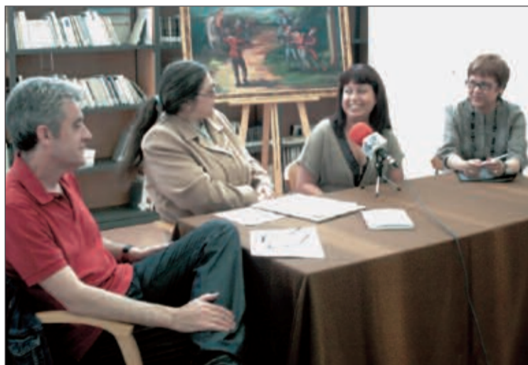
La presentación del libro tuvo lugar el 3 de junio en la Biblioteca

Ribera, explicó que Onil ha programado otros actos para conmemorar el centenario del poeta, tales como la obra teatral 'El palomar de las cartas'.