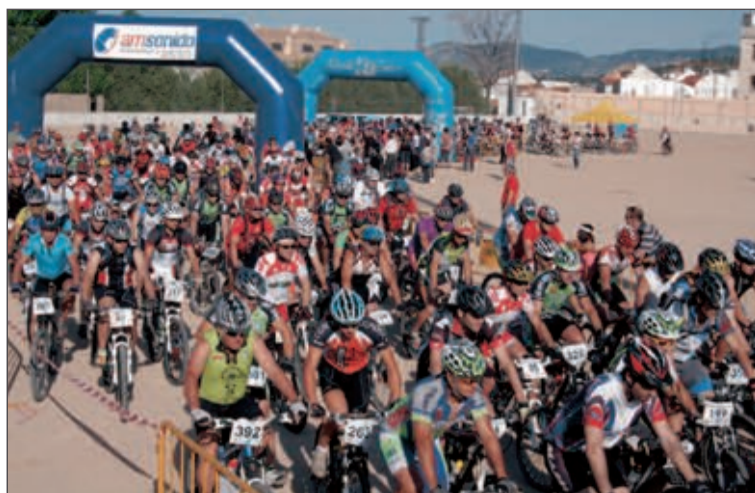
La salida y meta estuvieron fijadas en el estadio Climent

El Club Deportivo Onil celebra su cuarenta aniversario el sábado 12 de junio, con un partido entre el equipo de 1970 y ex jugadores del club, seguido de una cena (ver agenda).