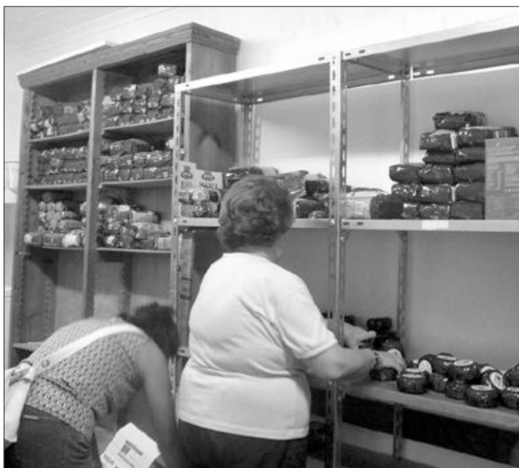
Los voluntarios ayudaban a descargar y almacenar todos los productos

El mayor cargamento de alimentos en siete meses