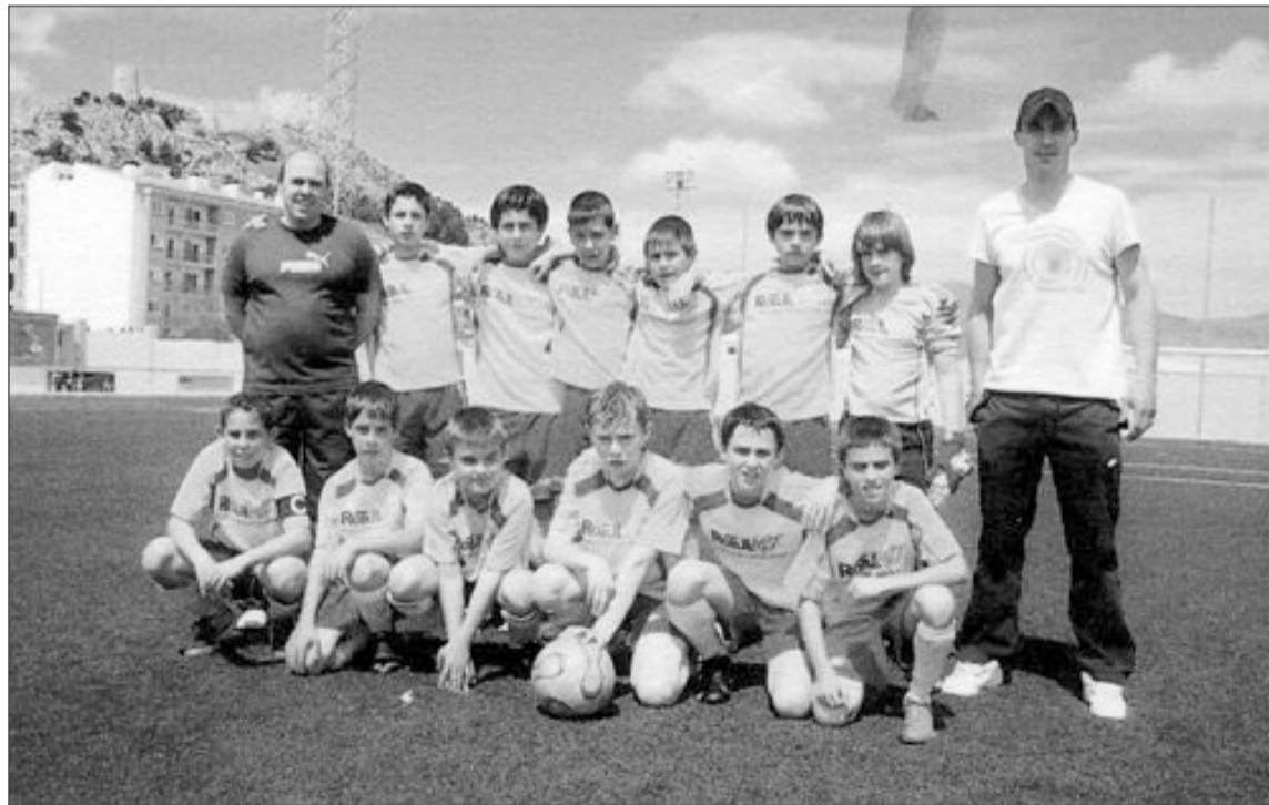
Plantilla y entrenadores del Club Frontenis Castalla (Alevín)

También quedan para el recuerdo partidos de torneos amistosos con el Alcoyano, Hércules o Levante, siempre contando con la inestimable colaboración del Castalla CF, que siempre ha contado con nosotros para la realización de torneos amistosos o desplazamientos a Alicante para ver al Hércules, o la sana rivalidad deportiva mantenida durante estos años con el otro equipo de Castalla de la misma categoría, la 'Renault', que nos ha motivado para seguir creciendo