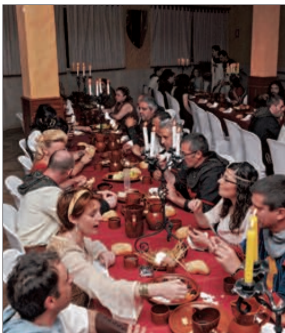
La cena se sirvió en vajilla de barro y sin cubiertos