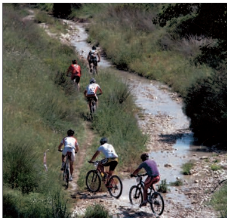
Los participantes cruzaron vistosos parajes

Los organizadores se muestran muy satisfechos por la evolución de la prueba y agradecen el civismo de los participantes, así como la colaboración desinteresada de los voluntarios.