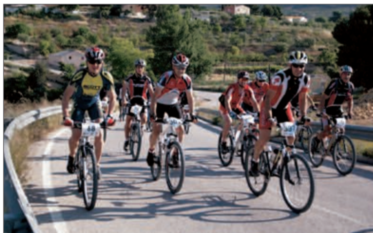
En los 38 kilómetros del recorrido hubo tramos de carretera