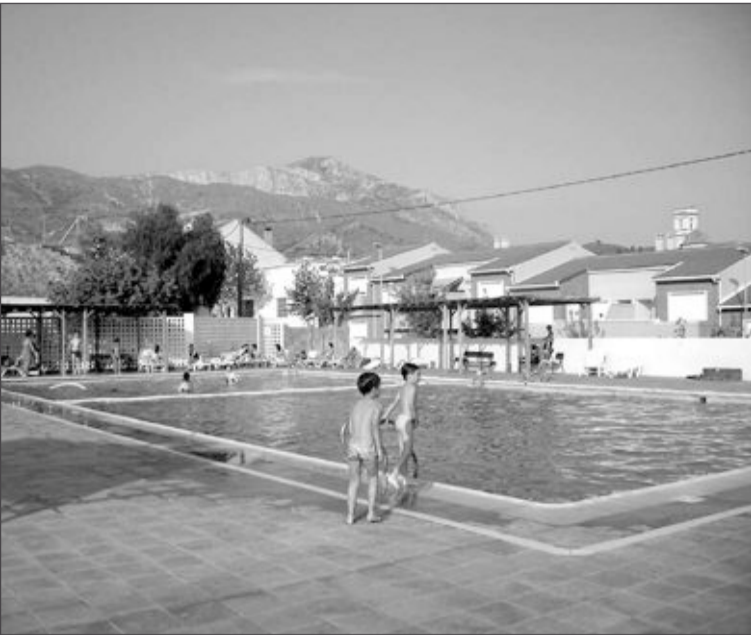
Piscina municipal de Tibi