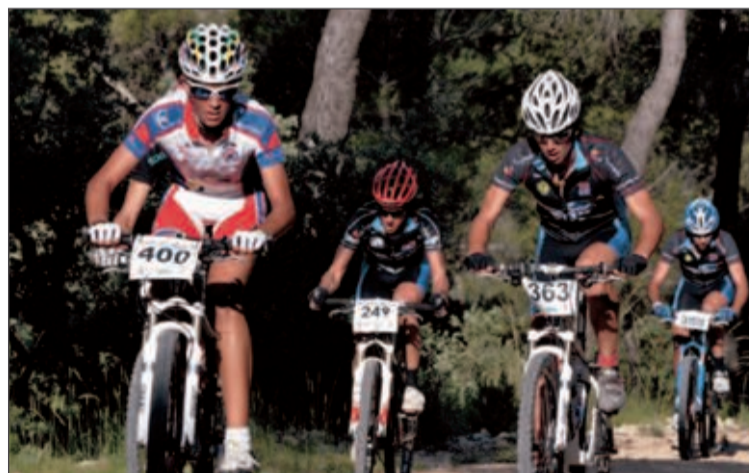
La jornada soleada propició que no hubiera indicentes