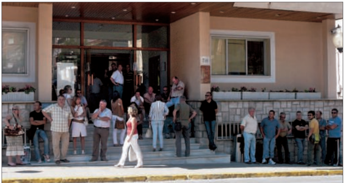
Los funcionarios municipales se concentraron durante algunas horas en la puerta del Consistorio

La normalidad fue la tónica general de esa jornada.