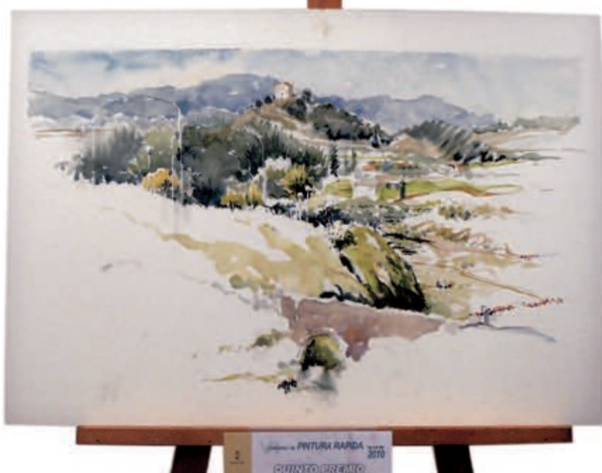
El quinto premio fue para Gonzalo Núñez de Alicante