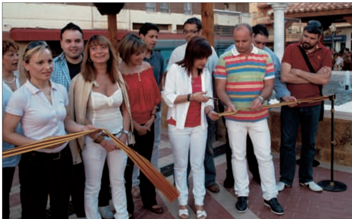
La alcaldesa cortó el viernes 4 de junio la cinta inaugural acompañada de los miembros de la corporación

Las obras han consistido en la impermeabilización de la plaza situada sobre un aparcamiento subterráneo y en la