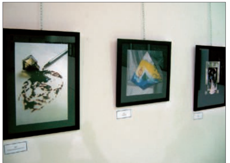
Los trabajos pueden contemplarse hasta el 27 de junio