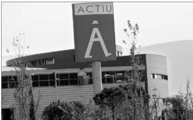
Exterior del Parque Tecnológico de Actiu

ta guiada por la localidad y por cortesía del Ayuntamiento sus lugares más emblemáticos, de Castalla.