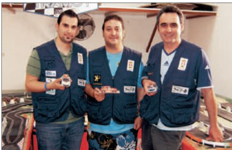
Participantes en el Rally de Alemania de Slot

Muy notoria la tercera posición conseguida en esta cate-