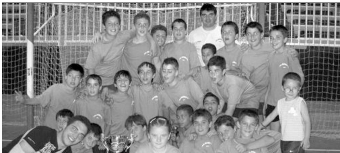
Campeón de la categoría Alevín: 'Peña del 98'