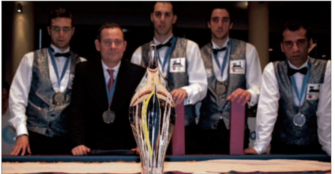
Los jugadores del Caseta Nova, junto a su presidente, con la copa que les acredita como subcampeones de Europa

El club castallense alberga la semifinal y final del Campeonato de España