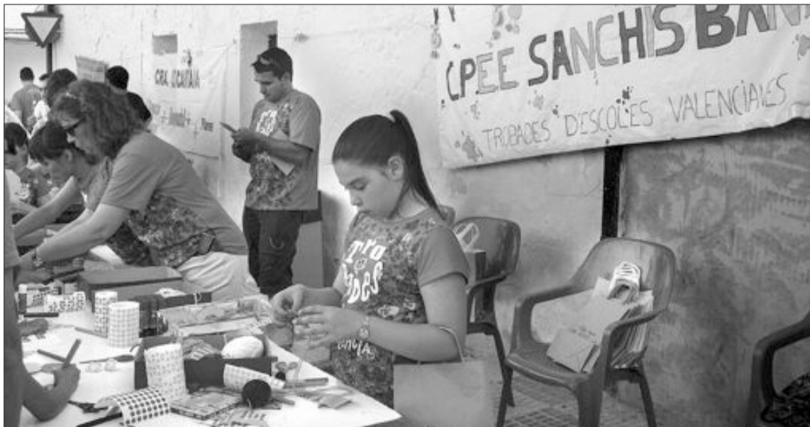
El colegio de educación especial Sanchis Banús participó creando móviles de gatos