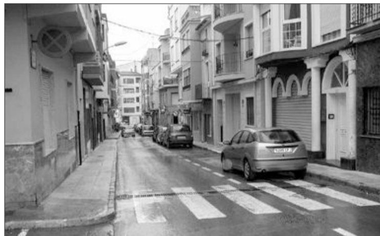
Paseo de la Santísima Trinidad de Castalla

Entre todos los participantes se sorteará un producto ecológico 100% reciclable.