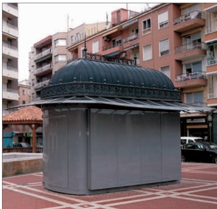
El quiosco ha permanecido cerrado desde su instalación

El quiosco, según el edil, se colocará junto a las pistas de baloncesto y se destinará a la venta de refrescos y golosinas, principalmente. Para que ello sea posible, el Ayuntamiento sacará a concurso público la explotación de este espacio, aunque, de momento, no se ha concretado fecha para ello.