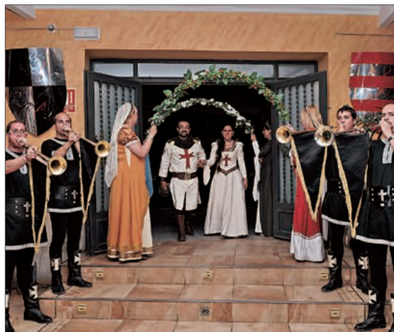
Los Capitanía Templaria, flanqueada por los trompeteros