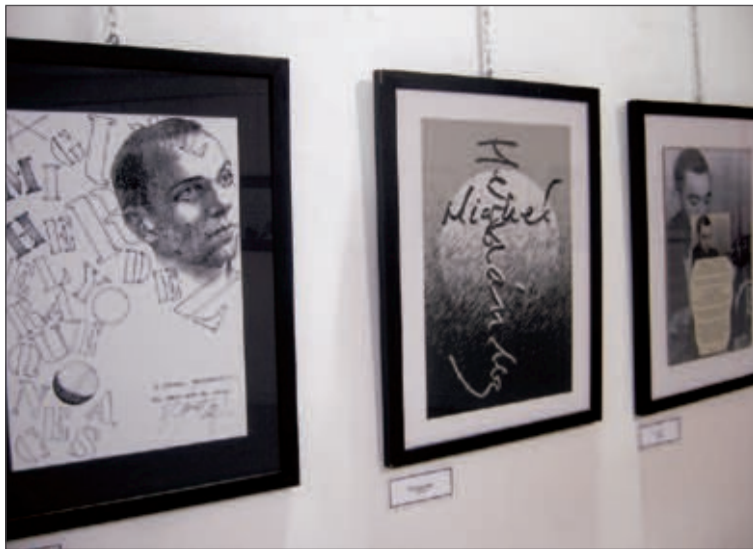
La exposición puede visitarse en la Pinacoteca del Centro Cultural de Onil

La huelga de funcionarios convocada para el martes 8 de junio tuvo escasa incidencia en la villa muñequera. En el Ayuntamiento apenas se notó la ausencia de algunos trabajadores, mientras que en el Instituto secundaron la huelga sólo cuatro de los 72 profesores del centro.