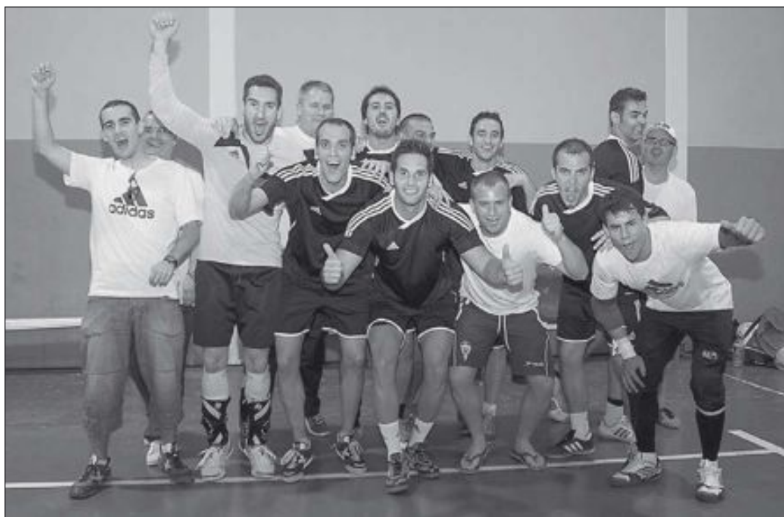
Jugadores del Vida Triste celebran su victoria en la final de fútbol sala. Arriba: exhibición del Gimnasio Ener-Gym

Tras dos horas de lluvia y el reajuste de los horarios, volvió la calma meteorológica y la práctica normalidad a estas 24 Horas, que registraron menos participación que otros años.