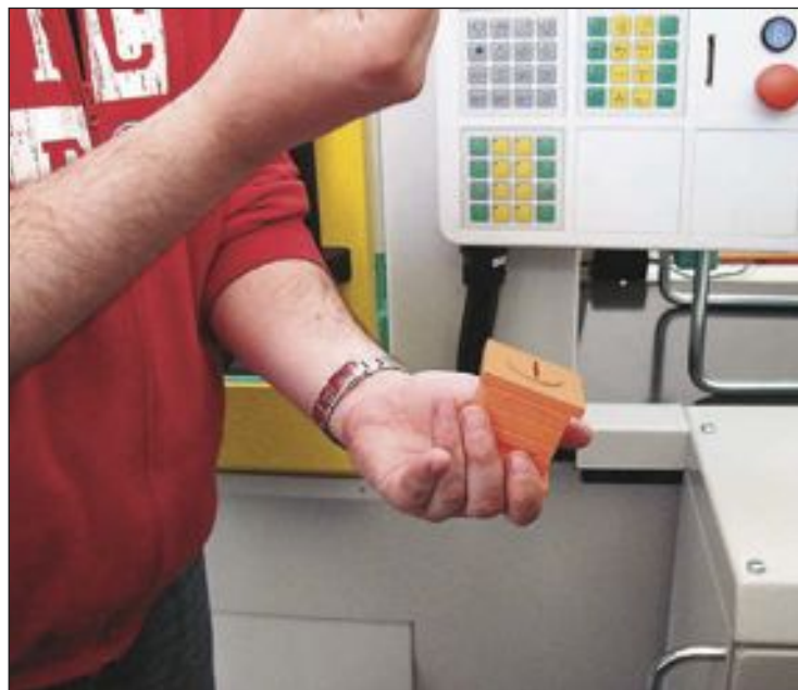
Jornada de formación sobre máquinas de inyección en el IES La Foia

Pastor recuerda que el nuevo instituto, inaugurado en 2011, dispone de unas instalaciones inmejorables para impartir esta materia. Entre ellas, un aula de plásticos de 181 metros cuadrados, un laboratorio de Metrolo-