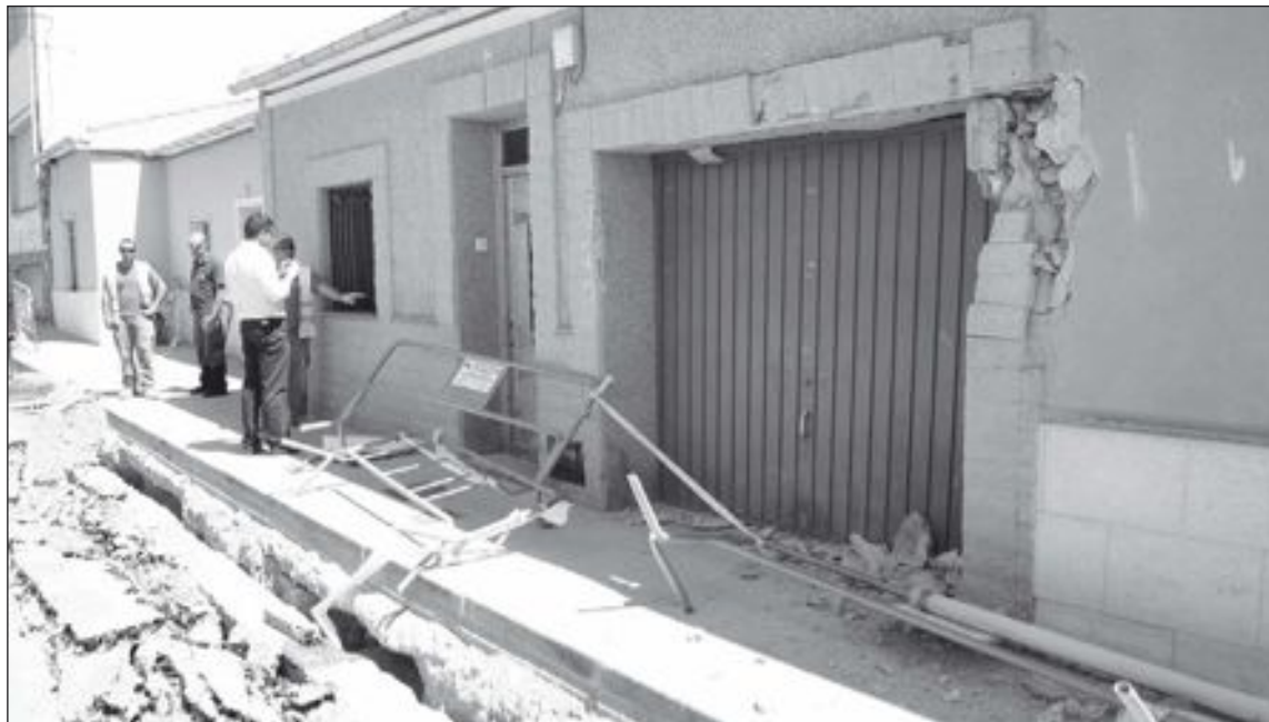
El accidente provocó destrozos en la fachada y el hundimiento de parte de la calzada en la calle Espronceda

nado que la empresa Hormigones del Valle es la responsable del incidente y se le atribuye un fallo al conductor del camión "que se acercó mucho a la zanja", indica la edil de Urbanismo. Por tanto, será esta empresa quien tenga que hacerse cargo, finalmente, de la cuantía de la reparación.