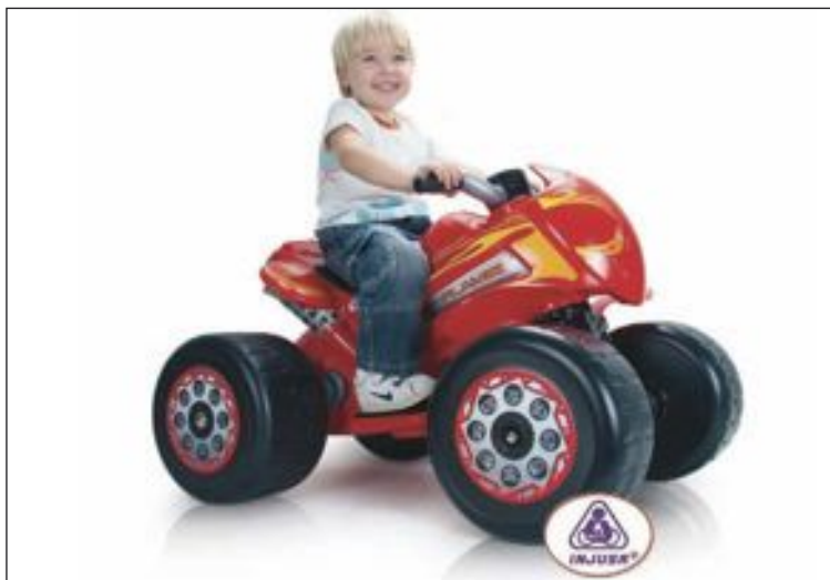
Quad Flames 6V, premiado por la revista TodoPapás

Injusa también es finalista para optar a los Premios TodoPapás. En este caso, los ganadores se decidirán por votación popular a lo largo de un proceso que comenzará el próximo día 19 de agosto y finalizará el 26 de sep-