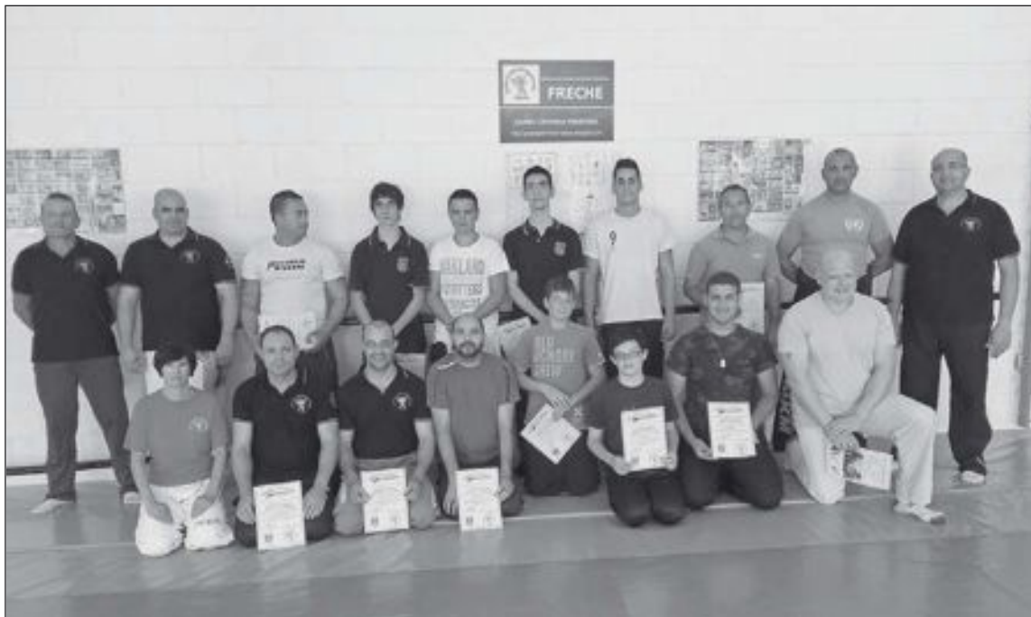
Participantes e instructores de los cursos de defensa personal celebrados en Onil

Y, por último, el día 7 de julio se celebrará el IV Torneo de Judo 'Ciudad de Castalla', con presencia de deportistas de toda España.