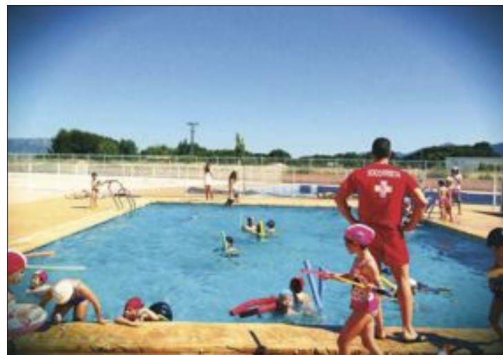
Alumnos del Muntori durante la jornada de Water Party

Concurso de peonzas, un delicioso concurso de tartas, juegos de parejas (entre padres e hijos) o diversos juegos en la piscina son algunas de las actividades del día del Colegio para fomentar las relaciones entre las familias.