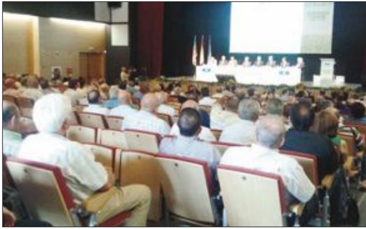
La asamblea general de Coarval se celebró el 21 de junio en el Auditorio

Durante el mes de agosto, la Biblioteca permanecerá cerrada, mientras que la sala de estudio abrirá en horario de Conserjería.