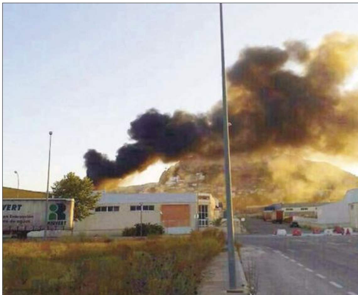
La espesa nube de humo pudo verse desde varios puntos de la localidad

Fuentes del Consorcio Provincial de Bomberos señalan que el incendio fue controlado hacia las 22:40 horas, mientras que su extinción total tuvo lugar sobre la una de la madrugada del miércoles 26. En cuanto a las consecuencias del incendio, afortunadamente no hubo que lamentar daños personales ni en la estructura de la nave.