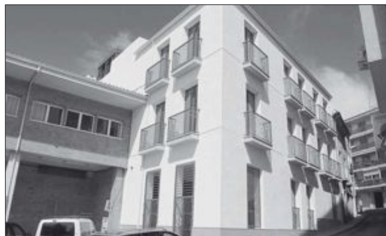
Fachada del Edificio Multiusos, junto al Mercado de Abastos