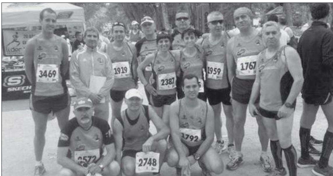
Participantes del Club Teixereta d'Atletisme en Albacete