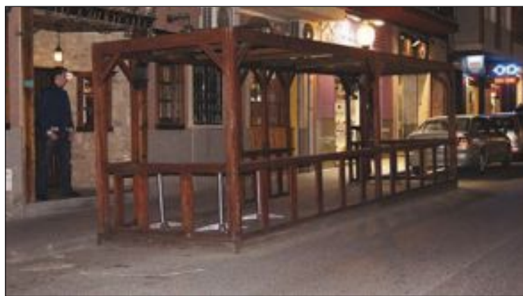
La normativa fue cambiada hace solo dos años

La nueva ordenanza incluye otras novedades, como que no se autorizan los cerramientos verticales con toldos o lonas y que para solicitar el permiso de instalación es necesario presentar un proyecto técnico y el certificado de un electricista de la toma de luz. Denuncian que estos trámites ya se solicitaron hace dos años para obtener la autorización.