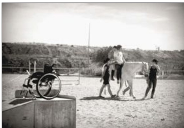
Arriba, miembros de Mueve-T y Cocemfe; abajo, equinoterapia en Mutxamel