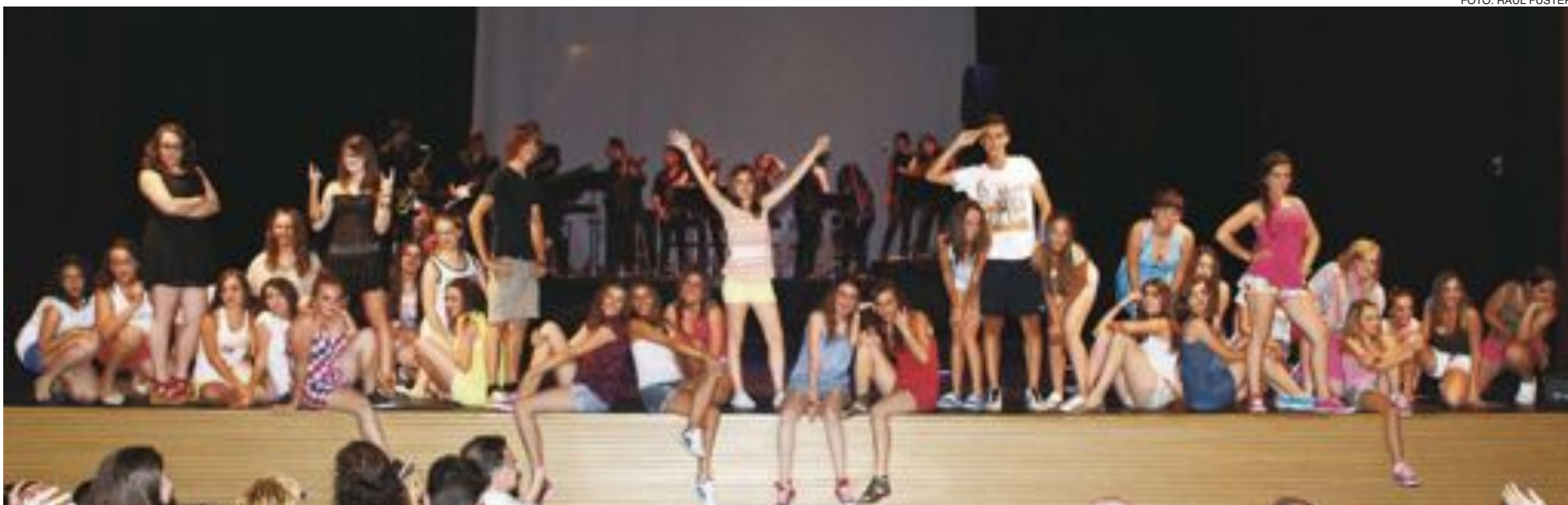
Los actores y actrices de 'Lectures arriscades' reciben los aplausos del público una vez finalizado el espectáculo en el Auditorio de Castalla

Obra musical a beneficio de Cáritas Parroquial y la Asociación de Afectados de Fibromialgia de la Foia