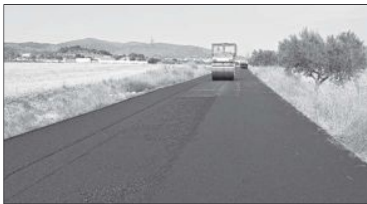
Asfaltado del camino viejo de Castalla