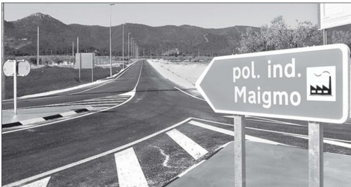
El polígono 'El Maigmo' de Tibi fue inaugurado en abril de 2006