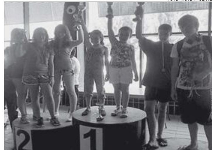
Miembros del CN Castalla con sus trofeos