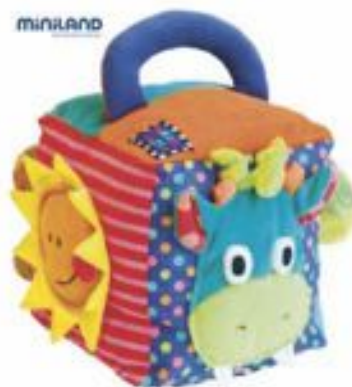
Cubo Dragy, de Miniland, mejor juguete en la categoría de primera infancia

Las votaciones se han dividido en dos fases; por un lado, los miembros del Observatorio del Juego Infantil (OJI), expertos en pedagogía, han formado parte de un jurado que ha decidido los premios, atendiendo a criterios como el potencial pedagógico, la recomendación de edad y las características del