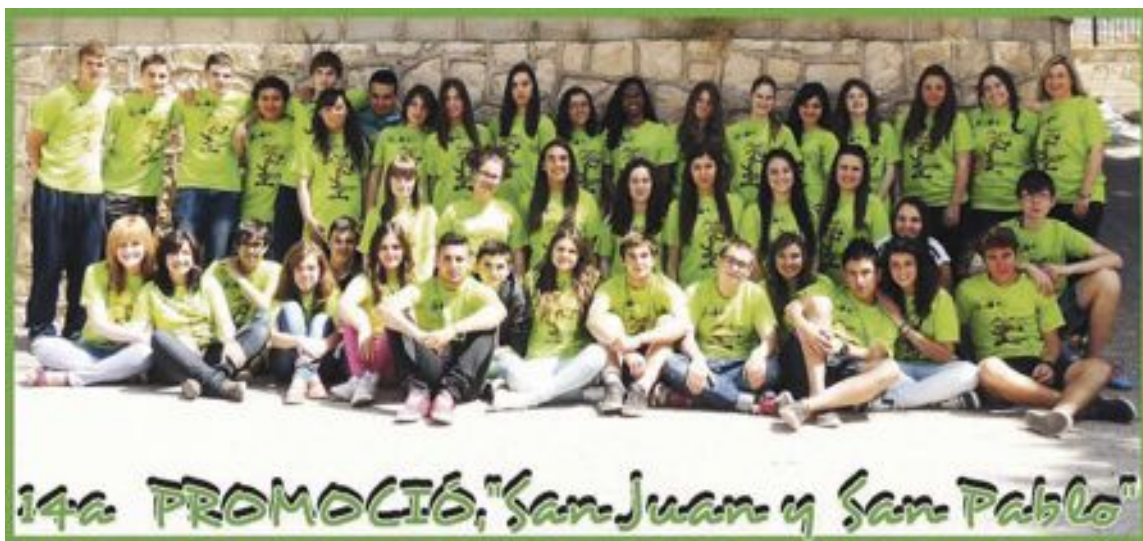
Alumnos de cuarto curso de la ESO que han finalizado sus estudios en el colegio San Juan y San Pablo