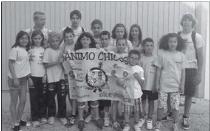
Judocas castallenses en la I Copa del Mediterráneo de Tortosa