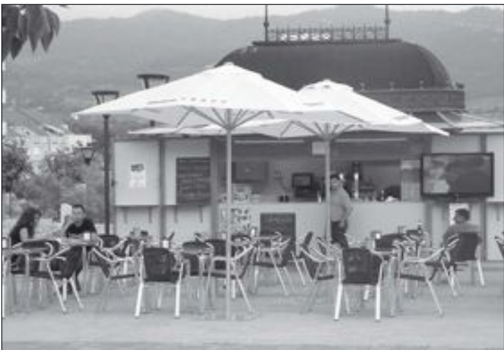
Quiosco del parque Giravela