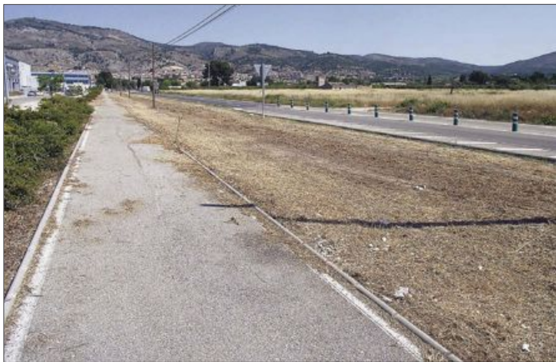
El carril bici de la carretera de entrada a Onil ha quedado totalmente despejado de hierbas y hierbajos