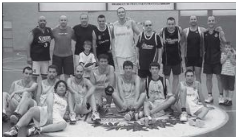
Miembros del CB Castalla, en el pabellón del Polideportivo

A continuación se celebró un partido en Juveniles, donde jugaron los padres y madres de todos los niños del club, para dar paso al partido estelar entre el equipo Sénior del CB Castalla y una selección de 'viejas glorias' del básquet local.