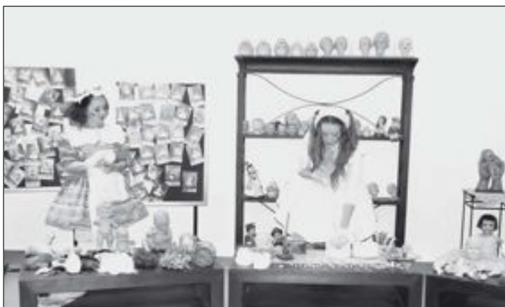
Representación de muñecas en el Museo de Onil

Después de varias intentonas, con mayor o menor fortuna, de innovar en la verbena de Santa Ana, este año se hará cargo de organizar este evento la Organización Juvenil Española (OJE), cuya intención es volver a hacer una verbena “de toda la vida”, para que la pueda disfrutar toda la familia, con música popular y servicio de barra a precios muy asequibles. La verbena de Santa Ana comenzará el viernes 26 de julio sobre las 22:30 horas en el paraje de la Ermita, y la intención de los organizadores es que las familias acudan ya por la tarde a participar en las carreras, se queden a cenar y, posteriormente, disfruten de la velada.