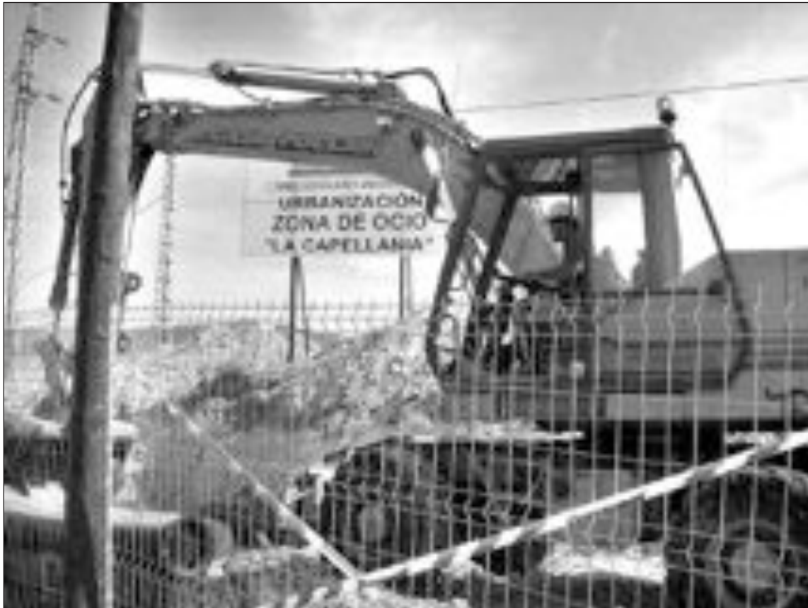
Estado actual de las obras de la zona de ocio, con una máquina trabajando en primer plano

La futura zona de ocio ocupa una superficie de 70.000 metros cuadrados y la mayoría