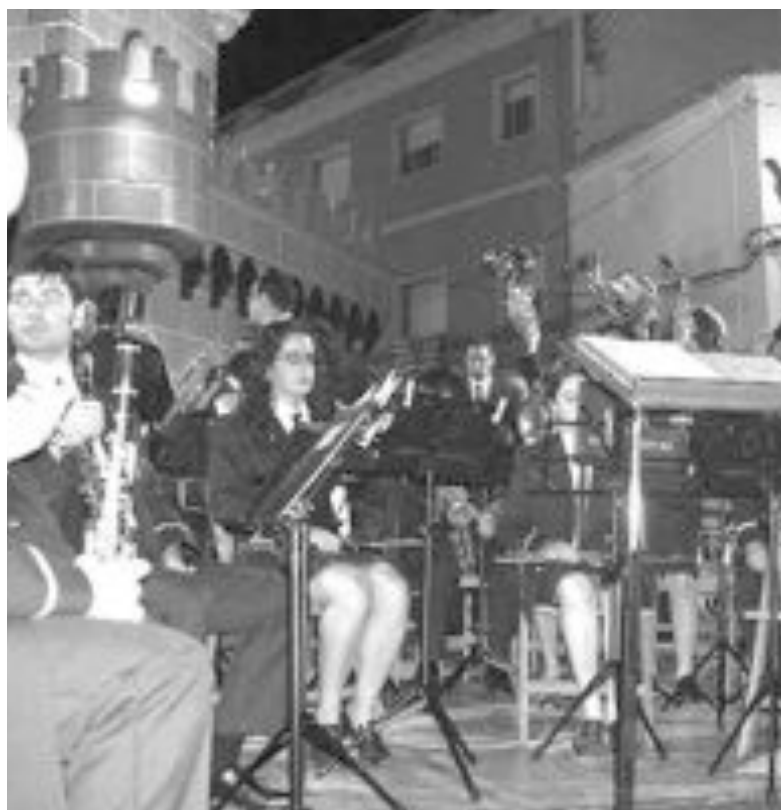
Imagen del concierto festero que ofreció la Unión Musial el año pasado

De nuevo se espera que el buen tiempo acompañe y que la banda de Ibi pueda ofrecer uno de sus conciertos más esperados del año, al que asiste numeroso público.