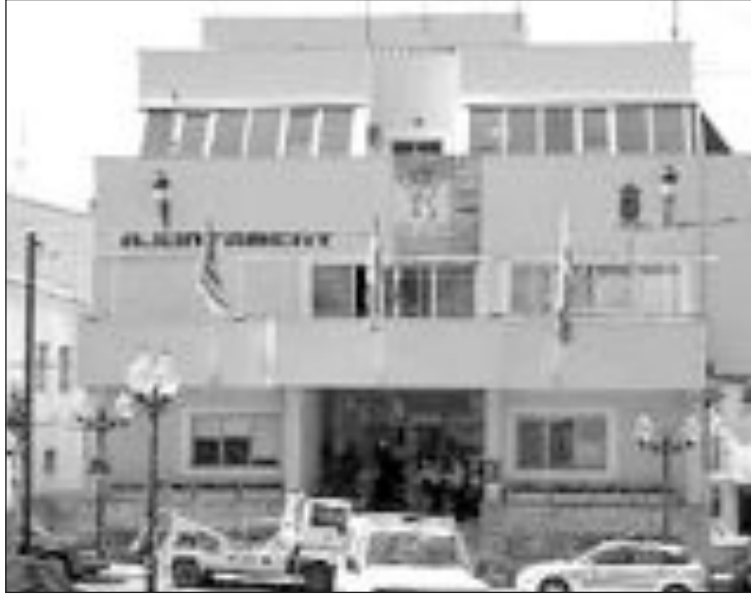
Fachada del Ayuntamiento de Ibi

La alcaldesa y los jóvenes han acordado retomar las conversaciones una vez transcurran las fiestas. Los agredidos tampoco han decidido, de momento, interponer ninguna denuncia. Los hechos ocurrieron el pasado 14 de agosto durante la celebración de la Feria de Málaga. Tres de los quince jóvenes permanecieron arrestados 36 horas.