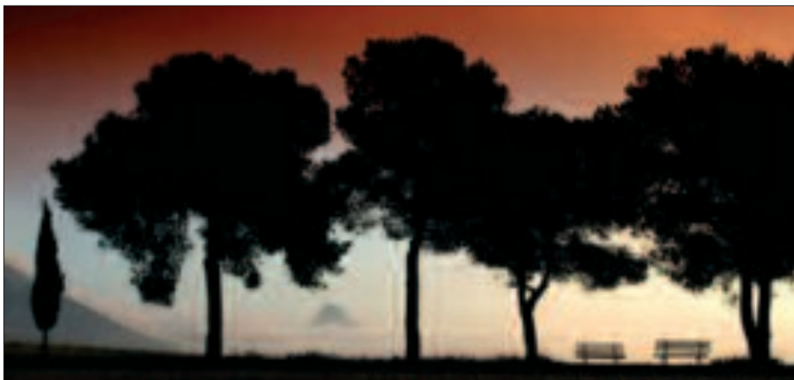
Fotografía ganadora del II Concurso Fotográfico 'Paisajes Cervantinos' Toledo