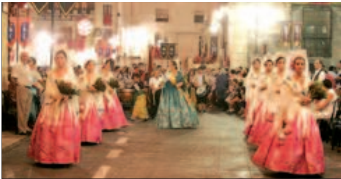
La Reina y sus Damas de Honor lucieron su bonito vestuario por las calles de la localidad