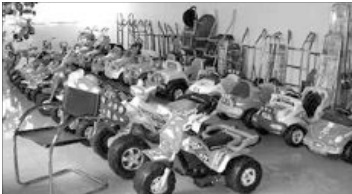
En países como Reino Unido, Italia y Francia, las exportaciones han caído

Frente a este “esfuerzo de las empresas”, la patronal reclama mayor respaldo a las administraciones públicas y