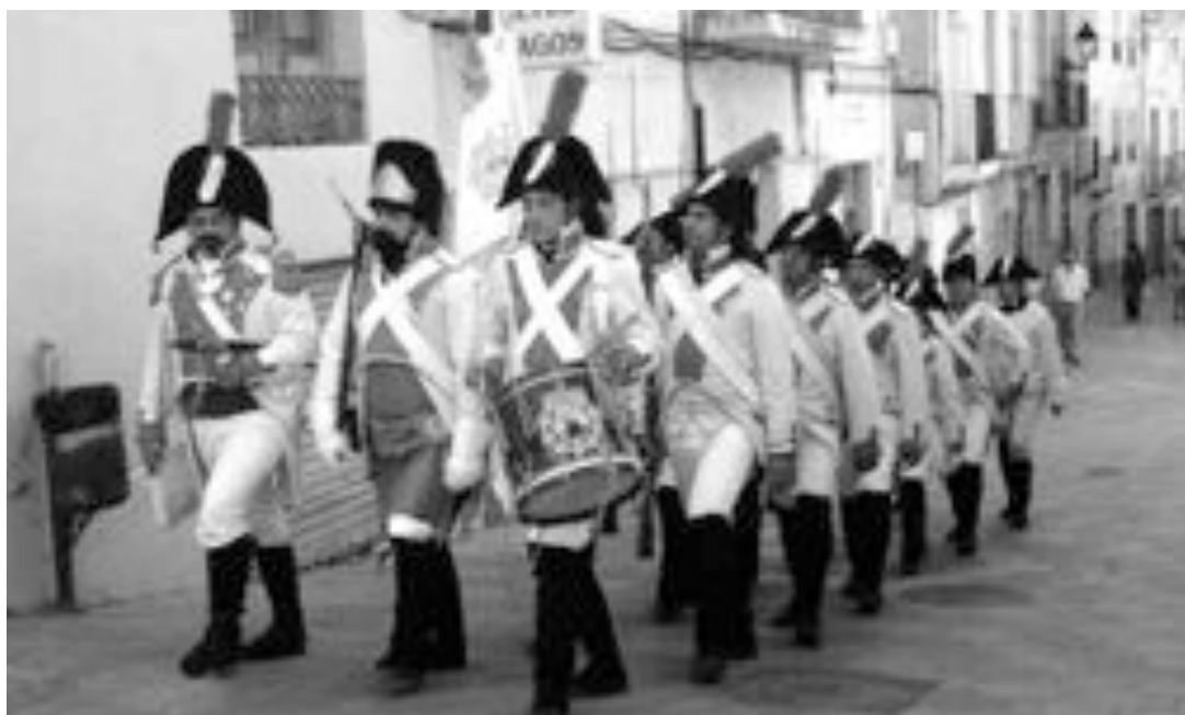
Desfile del regimiento de infantería de línea de Valencia 1808 por las calles del casco antiguo de Ibi

Este año, previamente a la cena de gala, se entregaron los premios, con la presencia de la escritora Elvira Lindo, autora de obras literarias como Manolito Gafotas que fue llevada posteriormente a la gran pantalla.