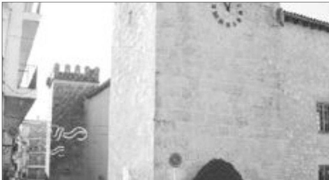
Las obras de reforma son subvencionadas en un 75% por el Ministerio de Fomento

El presupuesto de esta reforma asciende a 405.000 euros. El Ministerio de Fomento, a través del 1% cultural correspondiente al paso de la autovía central por el término municipal de Onil, financia el 75% de la obra. El resto es aportado por el Ayuntamiento del presupuesto municipal.