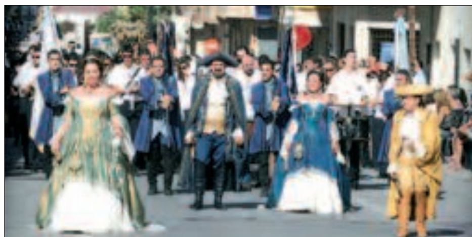
La Entrada fue brillante en todos los sentidos