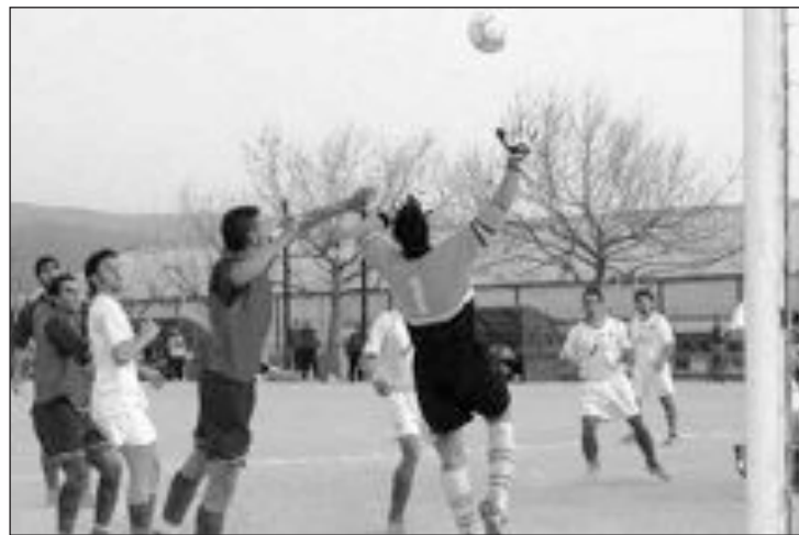
Imagen de archivo de un partido del Rayo Ibenense