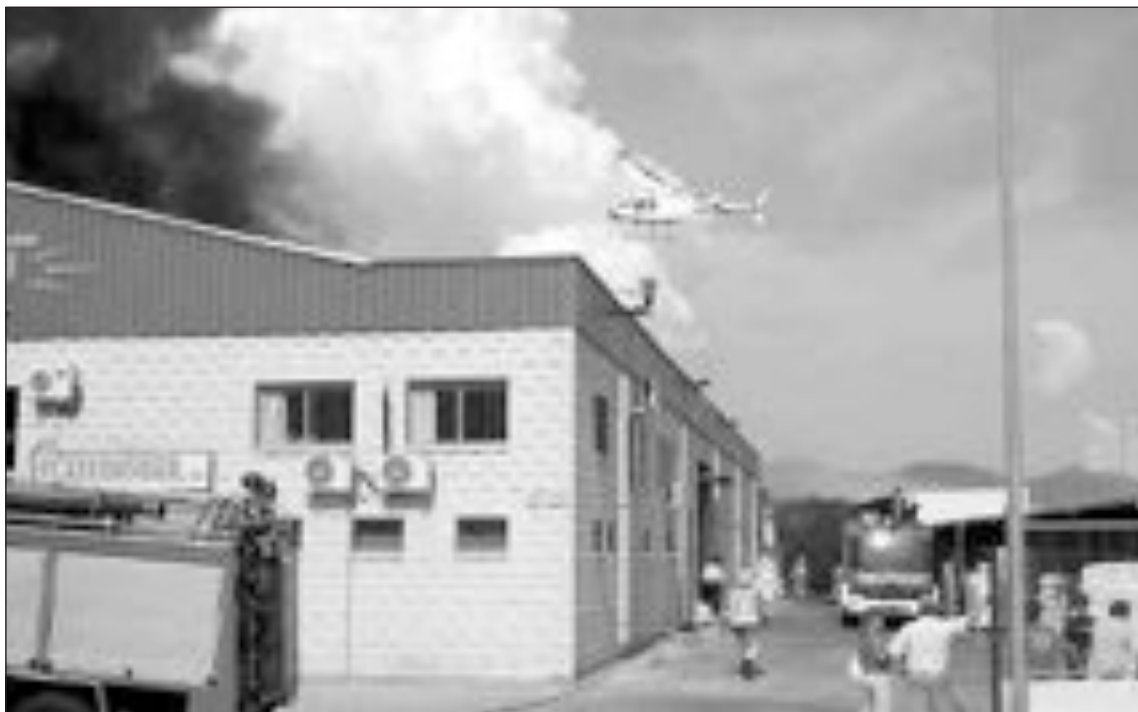
Un helicóptero de los bomberos colaboró en la extinción del incendio con más de una decena de descargas

Merce Mira señalaba a este periódico que el propietario D'Azucar se encontraba realmente afectado ya que se le ha quemado mucho producto acabado. Por contra, el incendio en Togoy no ha afectado a las máquinas de inyección, así que podrán reiniciar antes la actividad en las dos naves que se han salvado de las llamas.