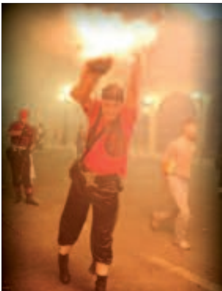
Un festero vive al límite La Baixà