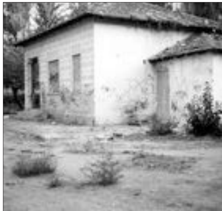
La casa, que tenía este aspecto, ya ha sido derribada

Acabados todos estos actos, la Imagen se trasladará nuevamente a la parroquia de la Transfiguración.