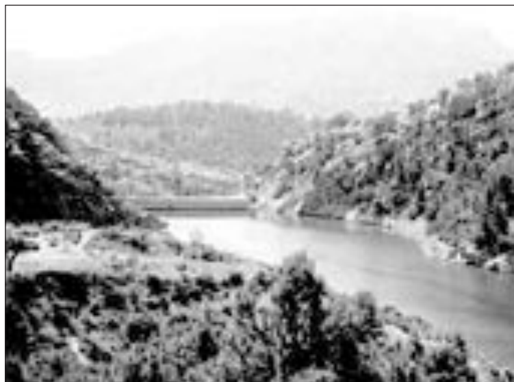
El Ayuntamiento de Tibi quiere impulsar turísticamente el pantano

Por otro lado, en breve se abrirá al público la nueva plaza de la Glorieta, a la que le falta sólo el alumbrado.