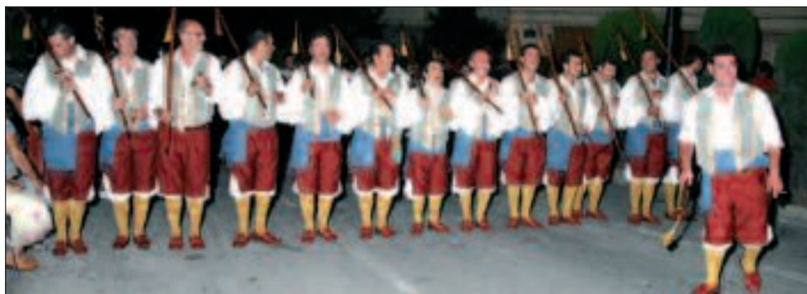
Todas las comparsas rindieron tributo a la Patrona de Castalla en la Ofrenda de Flores