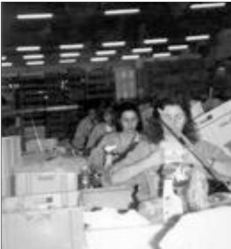
Cadena de montaje de muñecas de Famosa, en una imagen de archivo