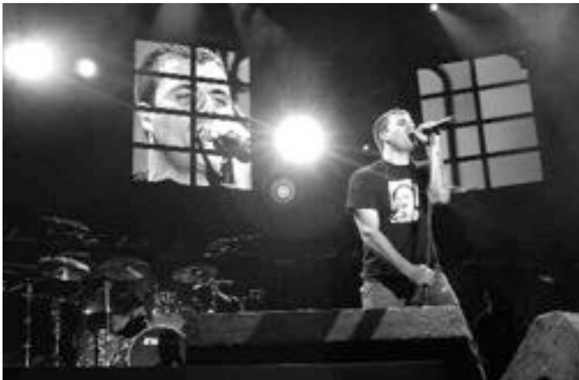
Dani Martín, el cantante de El Canto del Loco, fue el más vitoreado por el público durante toda la noche

Es la segunda vez que El Canto del Loco actúa en Ibi. Lo hizo en las fiestas de 2003, cuando el grupo empezaba a sonar fuerte, pero ha sido este año cuando ha conseguido un rotundo éxito de ventas y de público en sus conciertos. Eso se pudo apreciar en el concierto del viernes donde el grupo demostró la gran progresión