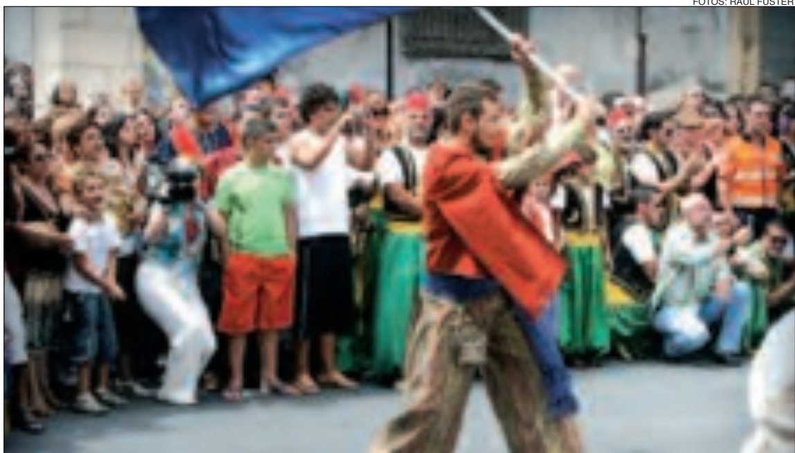
Espectacular momento de la Ballà de Banderes en la Plaza del Ayuntamiento