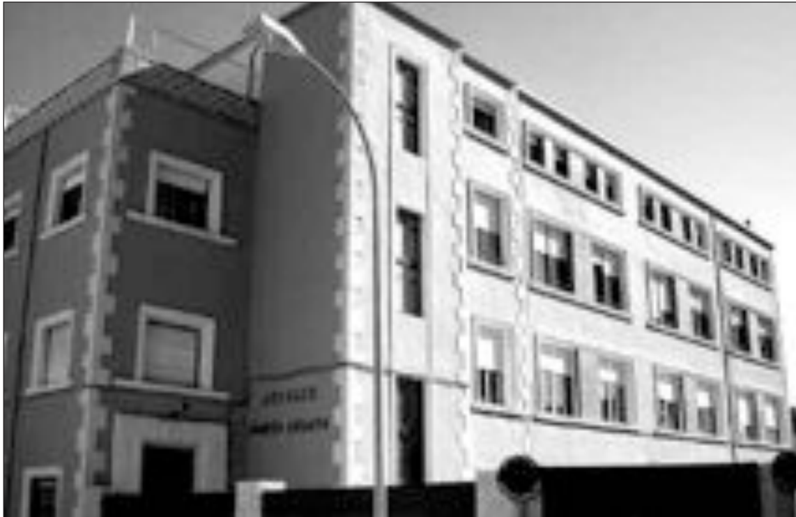
Un total de 365 alumnos están matriculados en el colegio María Asunta para este curso

En el apartado de infraestructuras, ha sido el colegio Rico Sapena el que mayores cambios ha experimentado,