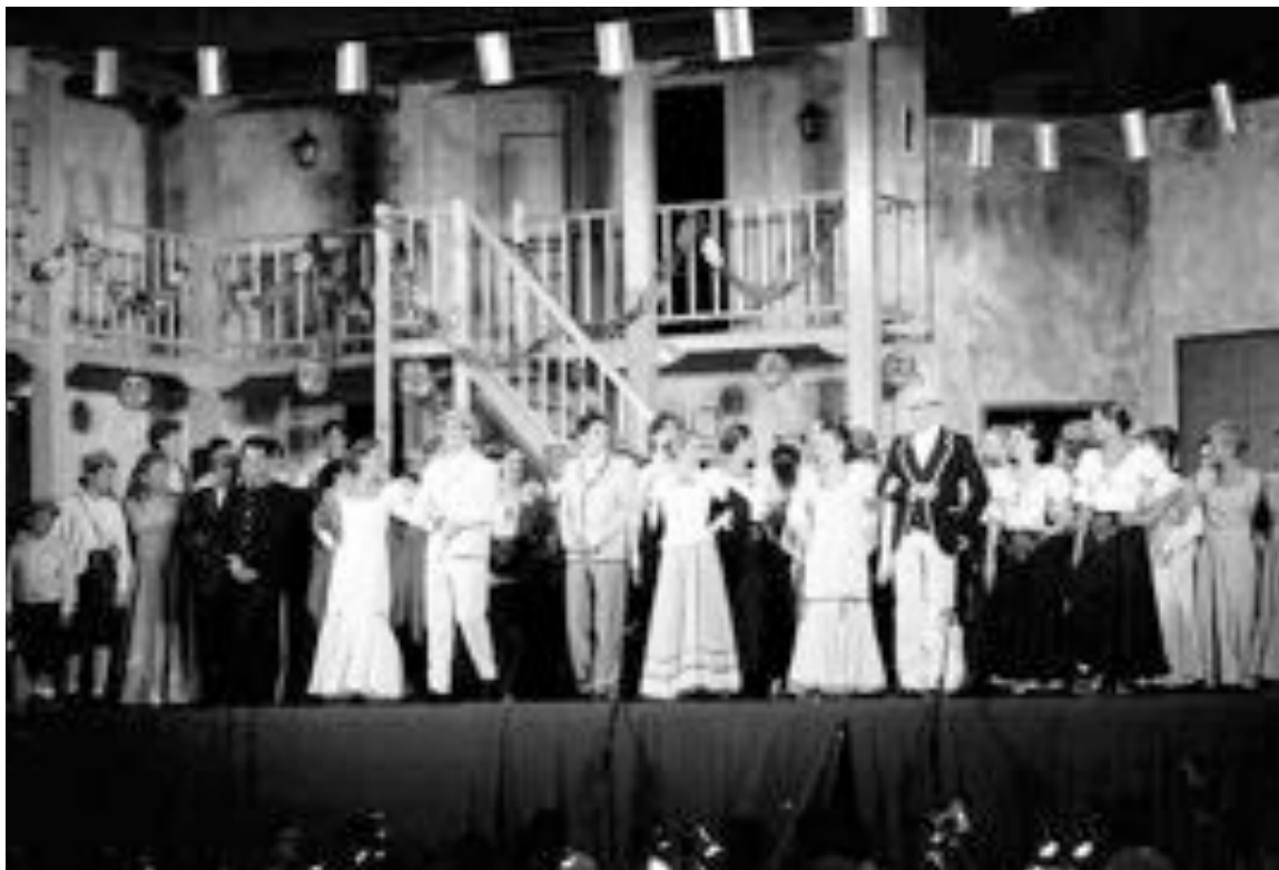
La Coral Crevillentina presentará "La Revoltosa" el 4 de noviembre en el Centro Cultural

Los bonos también se pueden adquirir a través de n SERVICAM.