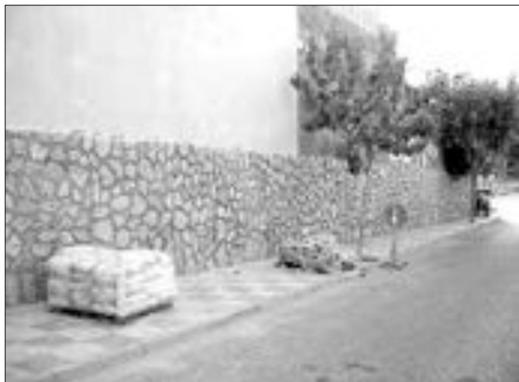
Uno de los muros que el Ayuntamiento está rehabilitando