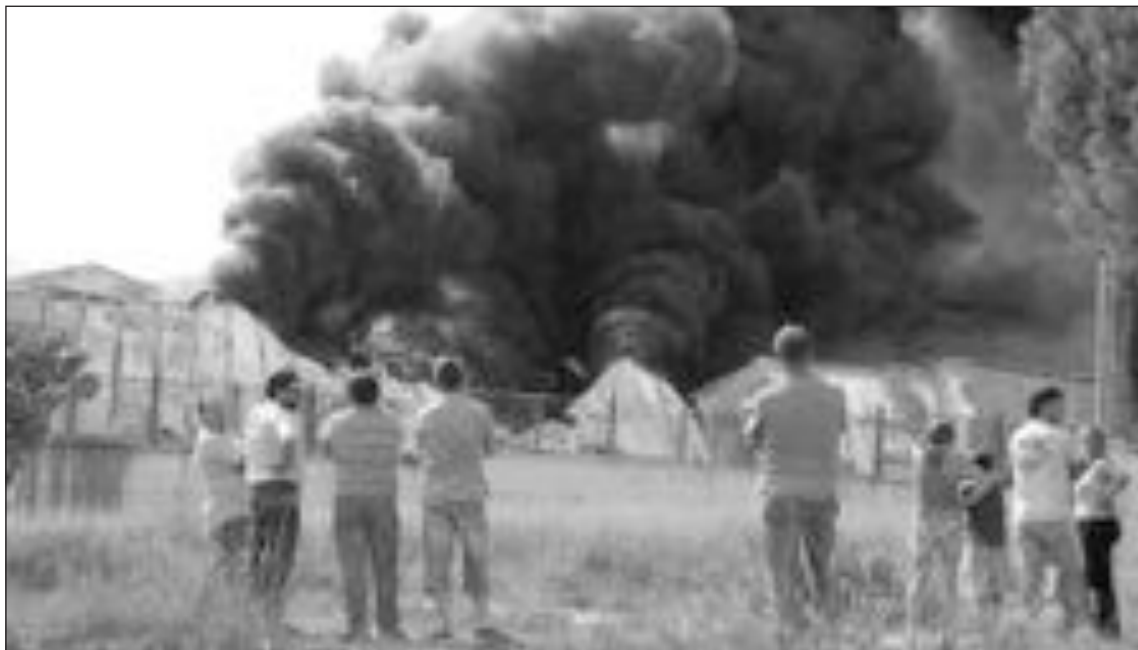
El incendio se produjo en el pasillo de seguridad, que era utilizado por Togoy como almacén, zona que tendría que estar vacía y abierta