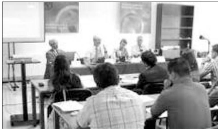
El seminario se ha desarrollado en la sede de AEFJ

Esta actividad ha servido para afianzar las relaciones comerciales entre los fabricantes españoles y el mercado escandinavo.