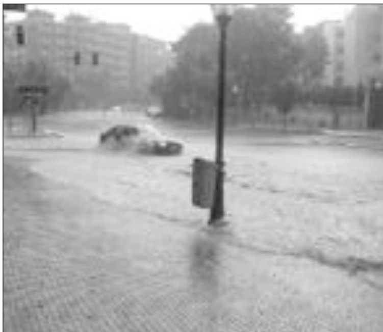
La tormenta del 3 de agosto dejó en Ibi 33 litros por metro cuadrado