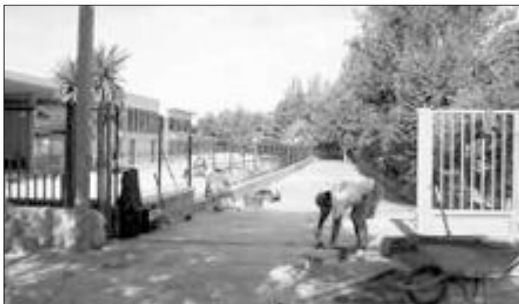
Estos días se ultiman los trabajos de la nueva entrada al Derramador