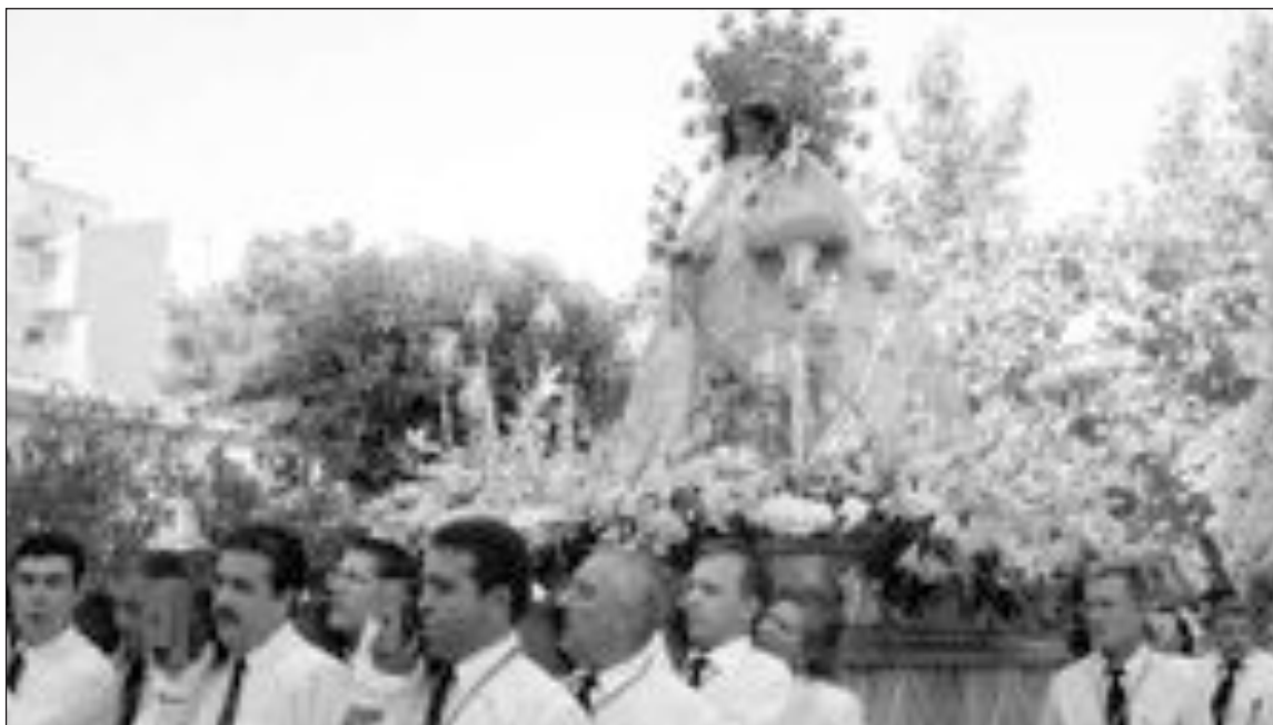
La Virgen es trasladada en procesión a la parroquia de la Transfiguración, el domingo, al final de todos los actos