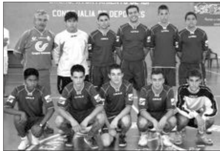
Equipo Juvenil B. Entrenador: Pina