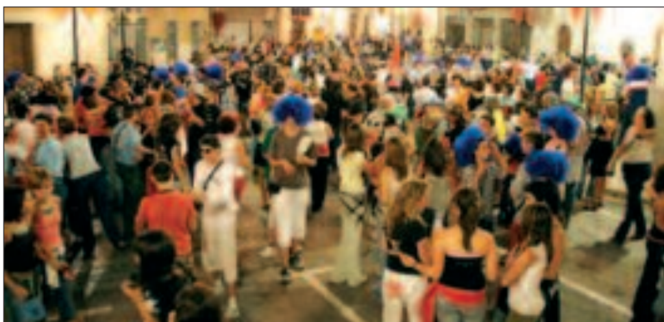
La diversión y el buen humor se apoderó de Castalla durante L'Oileta