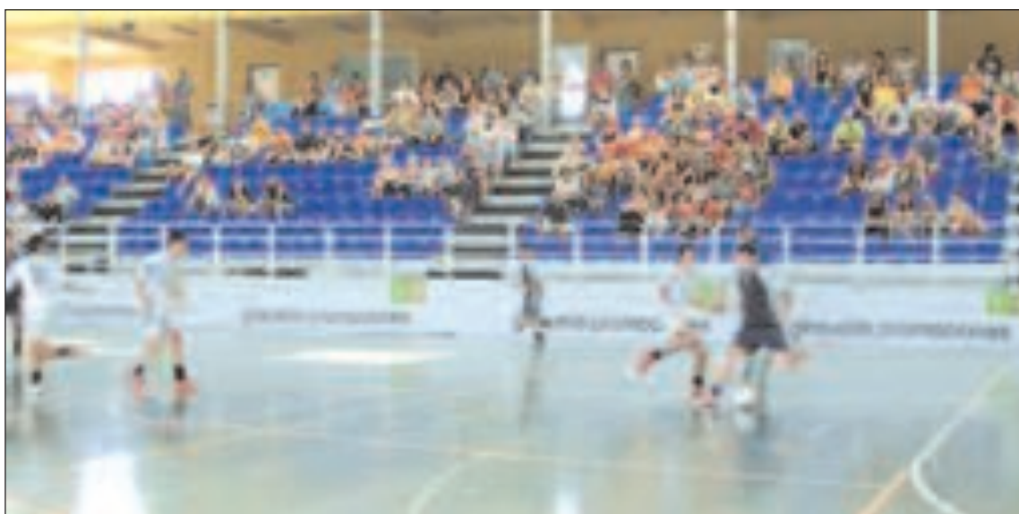
Momento de uno de los partidos que se jugaron en el pabellón 1 del Polideportivo Derramador de Ibi