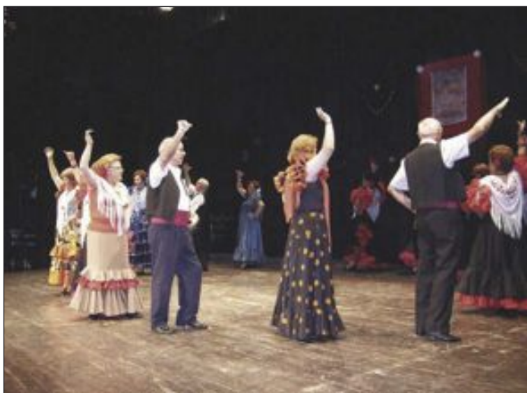
Actuación durante una edición de la semana cultural