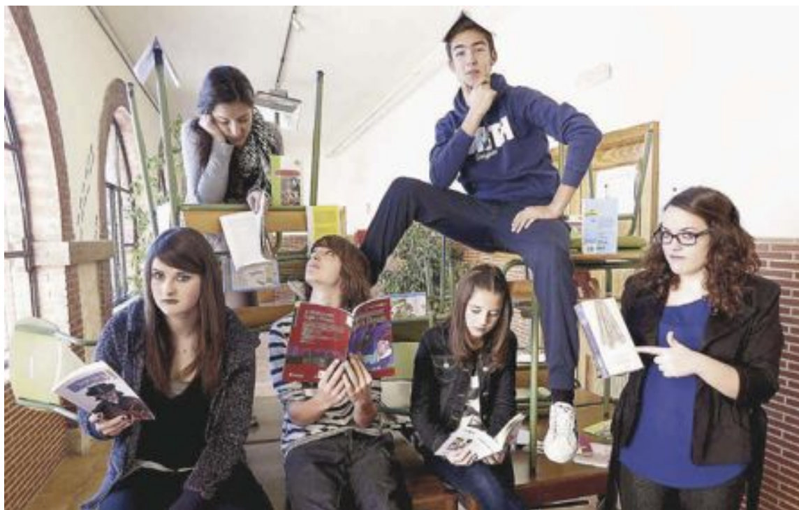
Los protagonistas de 'Lectures arriscades' son alumnos del Mª Asunta

mundo cine mundo VIDEO CLUB C/. Tíbi, 8 — Tel. 96 633 82 09 — IBI www.mundocineibi.com