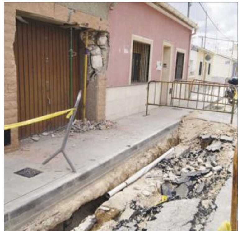
Estado actual de la calle donde volcó el camión

Escaparate ha intentado repetidamente obtener alguna información de la concejal de Urbanismo sobre este tema, sin obtener respuesta.