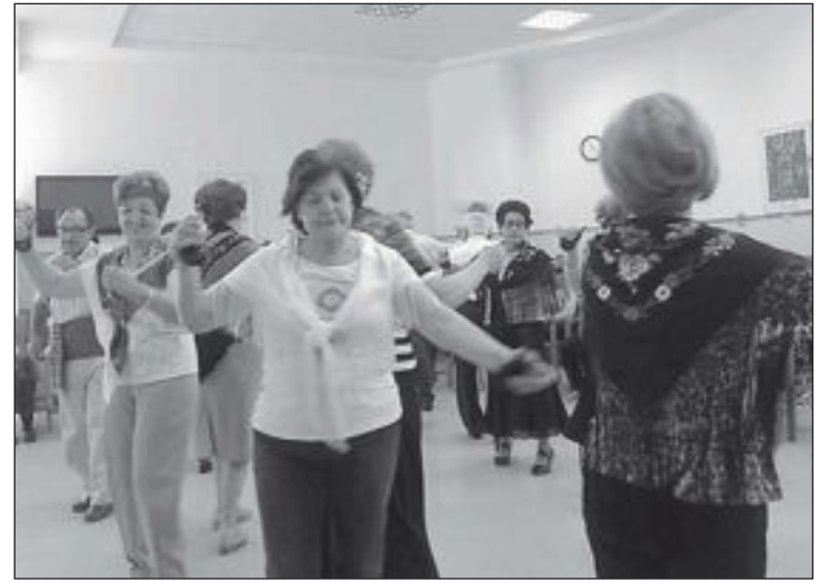
El grupo de danzas del CEAM ofreció bailes a los usuarios del Centro