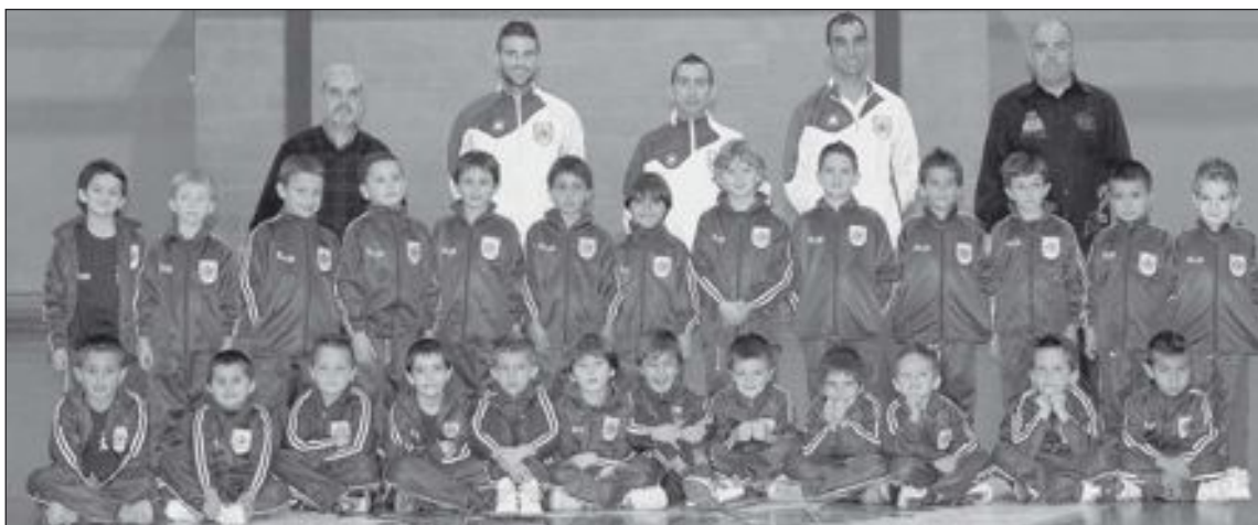
Equipo Infantil de las Escuelas de Fútbol Sala de Castalla