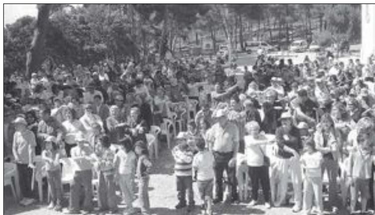
Encuentro de las familias del pasado año

Se hará especial hincapié en los niños que han recibido este año la primera comunión a quienes el obispo diocesano les