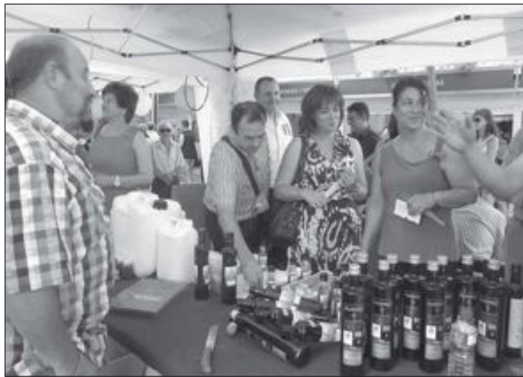
La primera edición de la Mostra fue un éxito de público y participantes

Dentro de la Mostra , se desarrollará la XXV Marcha Nocturna,