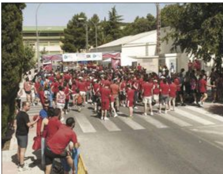
Participaron más de 800 personas entre corredores y marchadores