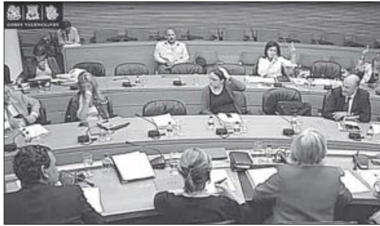
En el momento de la votación, la alcaldesa está ausente

En la comisión de Sanidad y Consumo celebrada el 30 de mayo en las Cortes Valencianas