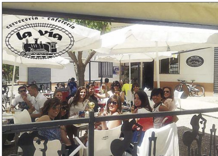
Disfruta de una copa bien fría en nuestra amplia terraza