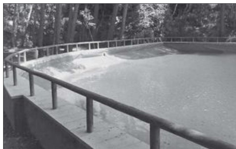
Arriba, bomberos y sanitarios en el lugar del rescate. Abajo, la balsa