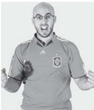
El humor de El Pequeño Buda llegará a El Kiosket el día 17 de julio

Paralelamente seguirán programándose actuaciones musicales.