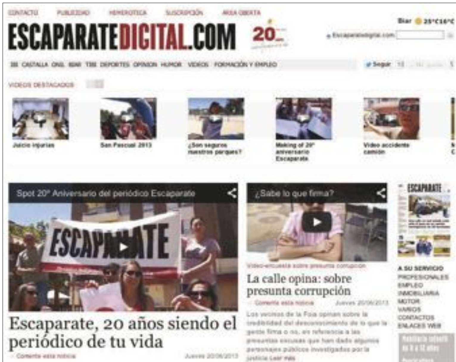
Nueva diseño de escaparatdigital.com

La participación, pluralidad y la libertad de expresión son conceptos que se han aplicado