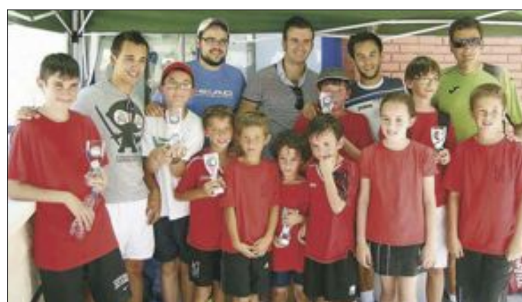
El edil de Deportes de Ibi junto a algunos jóvenes tenistas de las 13 Horas

El mismo sábado, pero en Monóvar, se disputaron las 12 Horas de Tenis Dobles Juvenil donde el Club de Tenis Teixereta