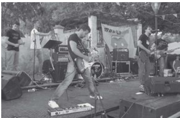
Los conocidos Mugroman, de Xixona, encabezan el cartel de este festival

Con cientos de conciertos y cuatro discos de estudio a sus espaldas, esta banda jijonense, que ha compartido escenario con Molotov, Celtas Cortos y Los