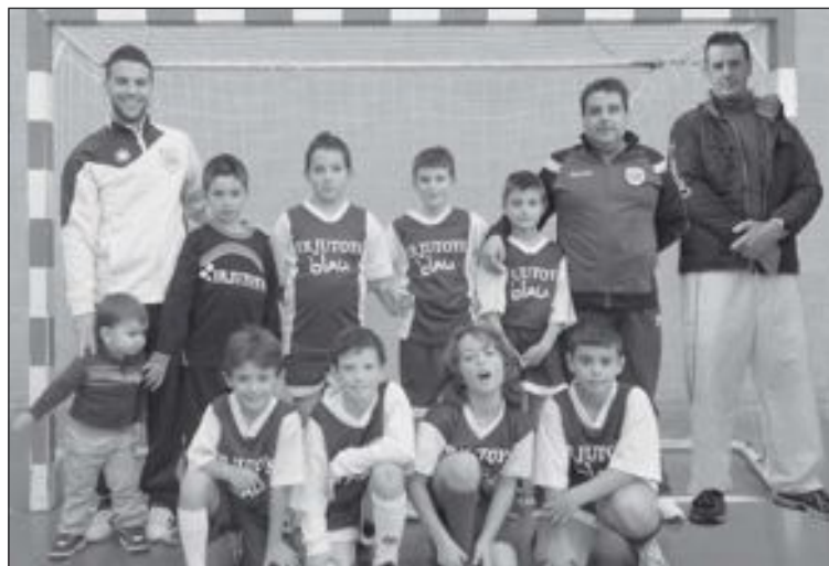
Equipo Benjamín del CFS Castalla

Los benjamines del CFS Castalla se han proclamado subcampeones de la primera Liga Intermunicipal de Alicante, en la que han participado colegios y clubes de toda la provincia. Tras quedar cuarto en la fase regular, el CFS Castalla accedió a las semifinales (celebradas en Mutxamel el 1 de junio), donde se enfrentó al líder de la fase regular (el Colegio El Valle de Alicante) y ganó por 4-3. En la final perdió contra el Atlético Mutxamel por 4-1 en un gran partido.