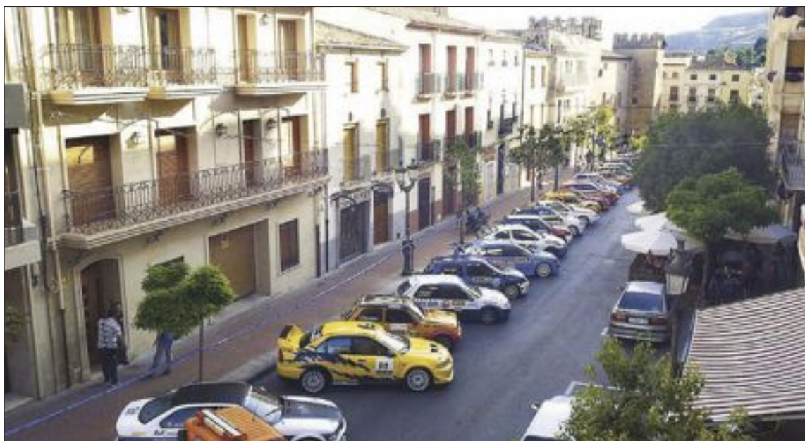
Los vehículos participantes estuvieron expuestos en la avenida de la Constitución