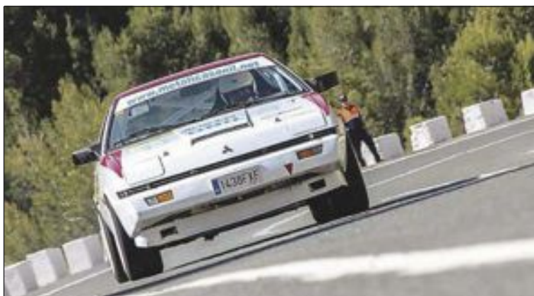
Emilio Cuadrado, bombero ibense, conducía este coche blanco