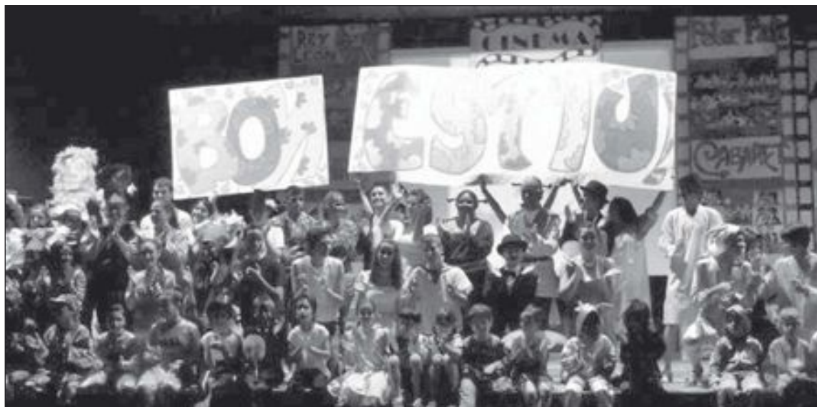
El colegio San Juan y San Pablo celebró el festival de fin de curso el miércoles 19 de junio

El colegio San Juan y San Pablo, a través de las imágenes y la música, envueltos por los diferentes universos, por la magia que nos contagian los niños, desea a todos los alumnos y alumnas un feliz verano.