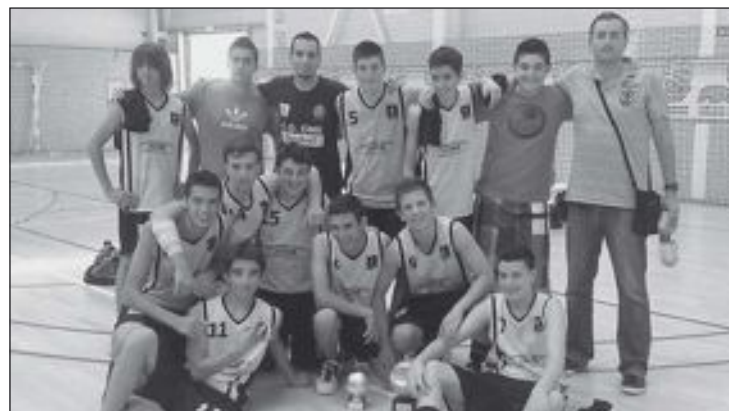
Equipo Cadete del CD Onil que participó y venció en el Trofeo Federación

to rival les defendió en zona los últimos 20 minutos para así poder reducir la renta, aspecto que consiguió, ya que los colivencs se bloquearon y bajaron su intensidad defensiva, también debido al gran desgaste realizado en los primeros 20 minutos, terminando así 13 arriba al final