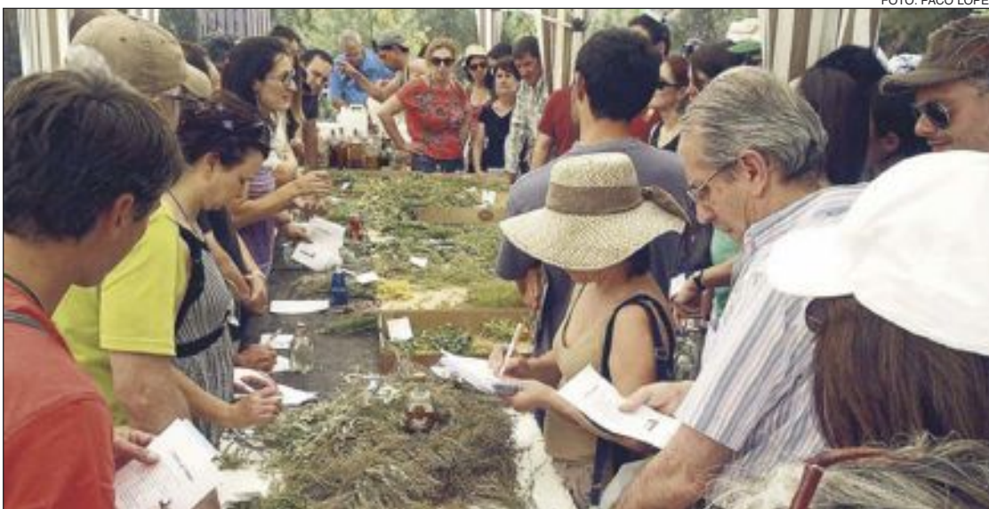
Con motivo del 10º aniversario de la Estación Biológica de Torretes se celebró una feria sobre el herbero

El Casal permanecerá cerrado desde el 29 de julio hasta el 2 de septiembre.