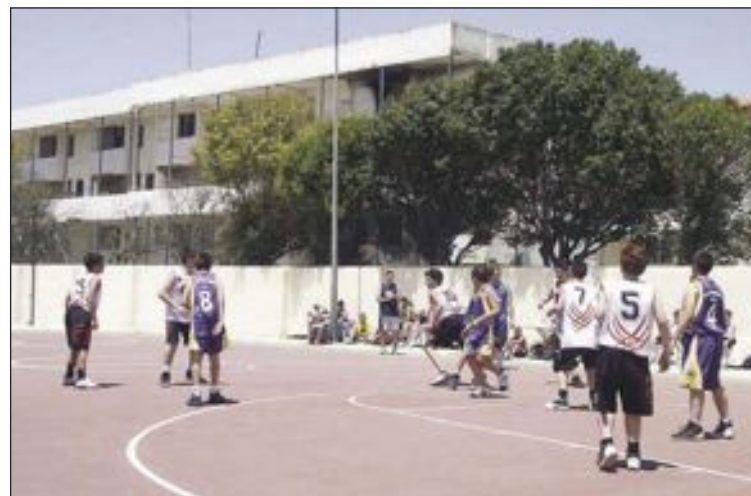
Los partidos se disputaron tanto en las pistas exteriores como en el pabellón