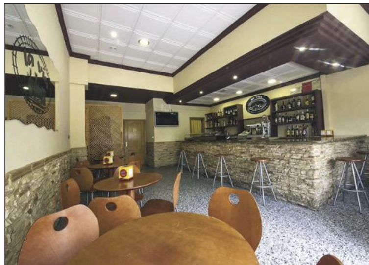
En Cervecería La Vía podrás degustar todo tipo de tapas al estilo andaluz