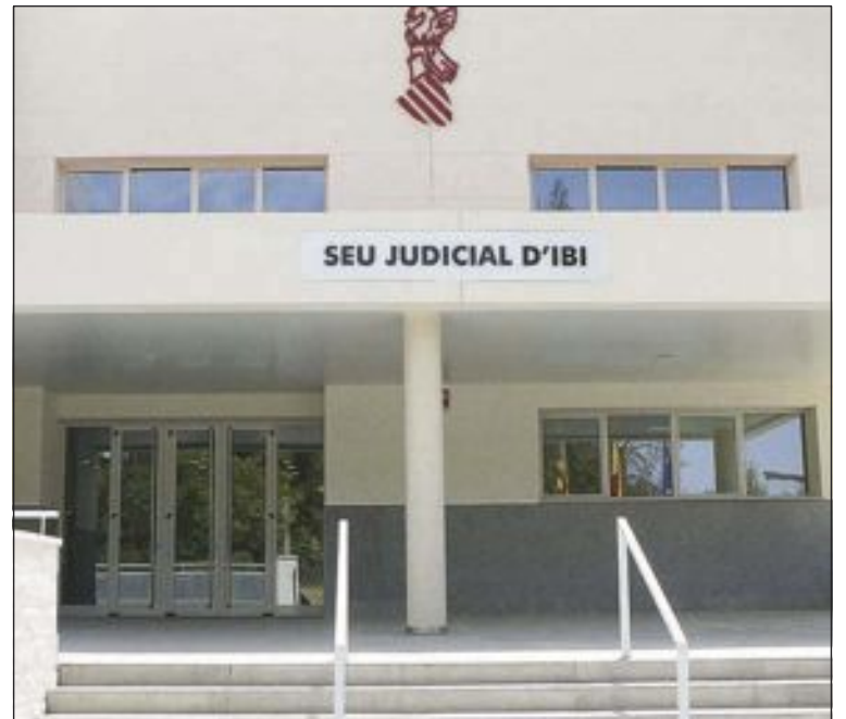
El juzgado de Ibi ha dictado dos resoluciones pioneras en la provincia

Las resoluciones del juzgado de Ibi son pioneras en la provincia, aunque se han producido ya casos similares en autos dictados por las audiencias provinciales de Castelló y Valencia. Todo hace suponer que habrá más ya que las fusiones, adquisiciones y extinciones de cajas de ahorros y bancos en los últimos años provocan este tipo de desajustes.