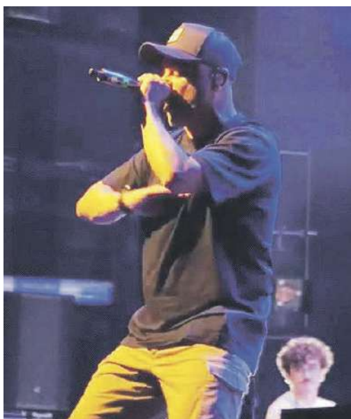
El rapero Nach llenó el auditorio del Teatro