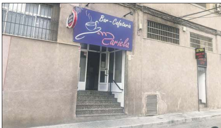
Local donde se produjo el accidente mortal

Al lugar del accidente se personaron dos agentes de la Policía Local que realizaron los primeros auxilios hasta la llegada