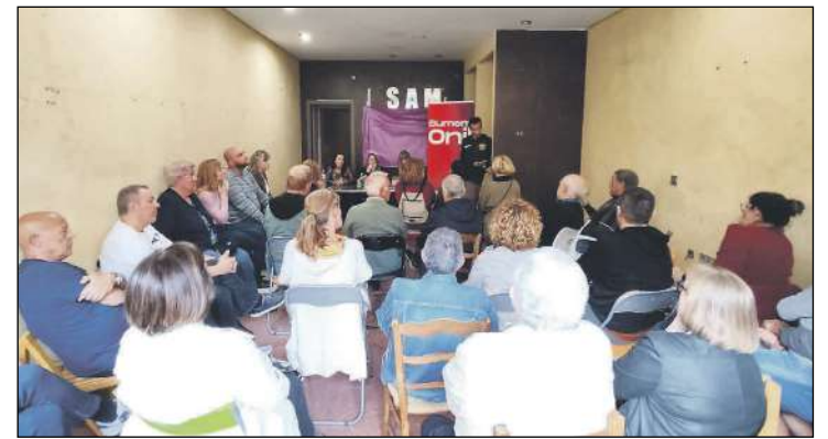
El 2 de junio se realizó una asamblea ciudadana para evaluar los resultados del 28M

El Ayuntamiento de Onil reafirma su compromiso con la construcción de una Europa unida y próspera desde el ámbito local. Por lo que «se espera que esta participación activa en la iniciativa fortalezca aún más la posición del como un referente en la gobernanza local y contribuya al crecimiento y bienestar de su comunidad».