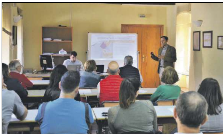
El Plan Estratégico está siendo realizado por Salto Consultores