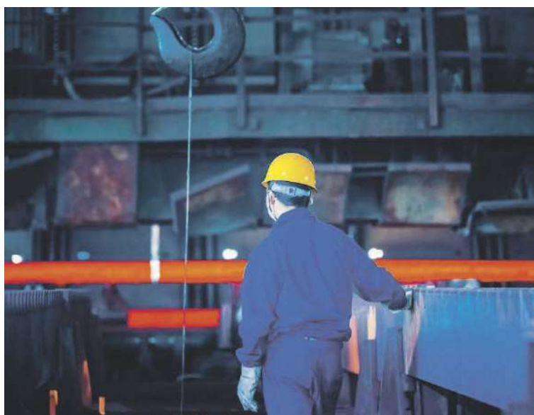
La cifra total de parados en la comarca se sitúa en 9.928 personas