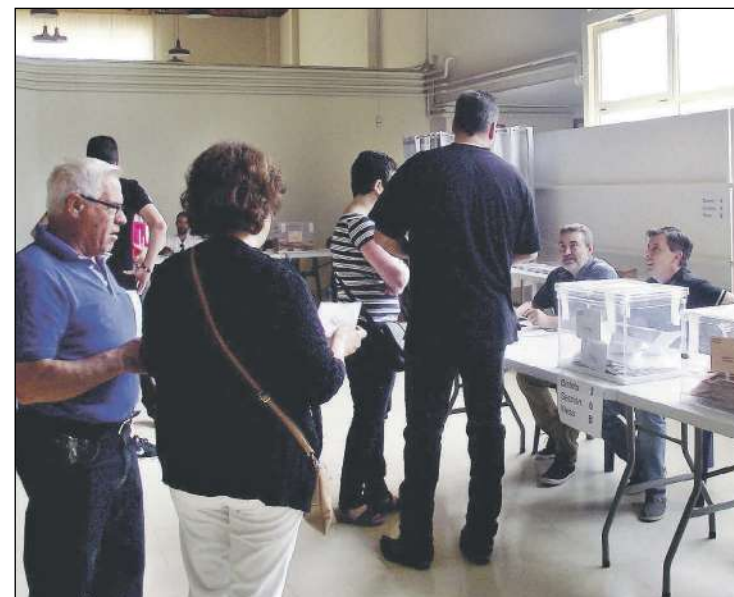
Jornada electoral del 28 de mayo en el Centro Cultural

Som Ibi, agrega Gándia, “quiere conseguir la estabilidad que el pueblo tanto solicita y espera que el PP deje esta pataleta que solo hace que perjudicar los avances que Ibi necesita”.