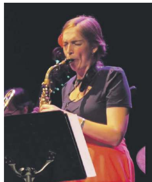
Nina dinamita y la Swing Milicia