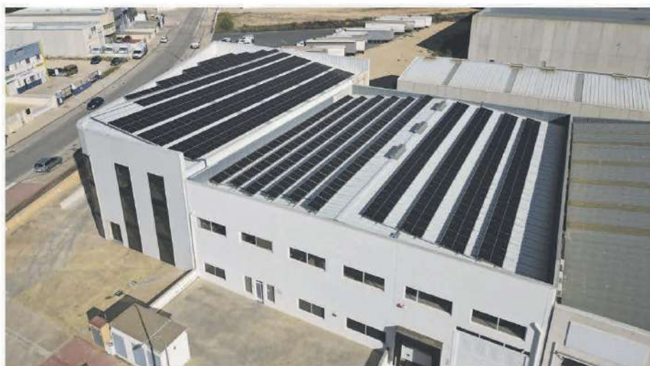
• Sarabia Plastics, S.L. / 202,16 kWp / Ibi