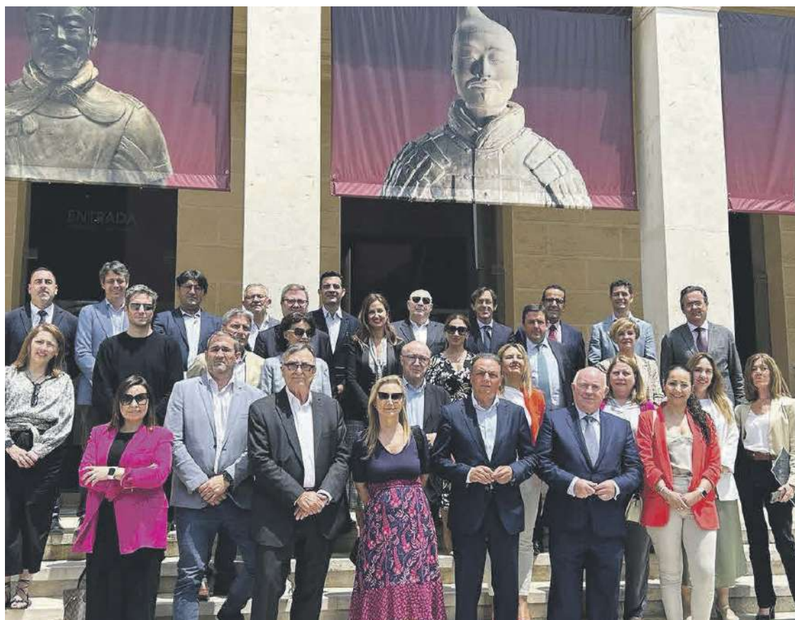
IBIAE participó en el comité ejecutivo y en la junta de CEV Alicante en el MARQ, donde defendió los intereses e inquietudes de las empresas de la Foia de Castalla

Esta labor que realiza IBIAE se lleva a cabo de manera altruista y con el único objetivo de velar por un servicio adecuado y satisfactorio para las empresas.