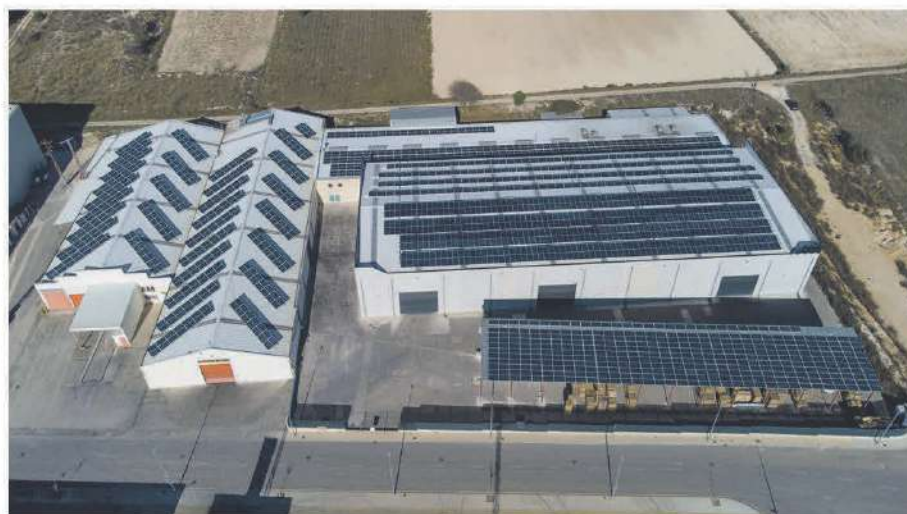
• Ondulados del Papel, S.A. / 211,70 kWp / Banyeres de Mariola

C/ Cádiz, 38 - Polígono Industrial Alfaç III - Ibi