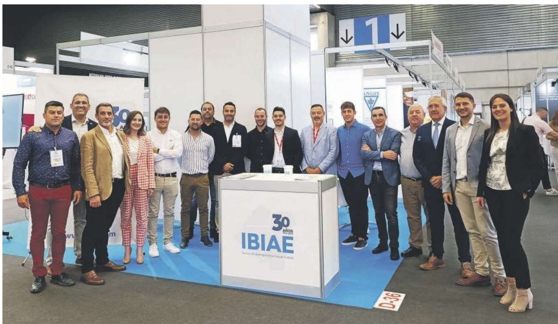
Un total de trece empresas han mostrado en este certamen todo su potencial a clientes nacionales e internacionales

Este evento internacional está especializado en profesionales y empresas de todos los sectores implicados en procesos industriales y productivos. Destaca por ser la única feria en España dedicada a las pymes subcontratistas. Este