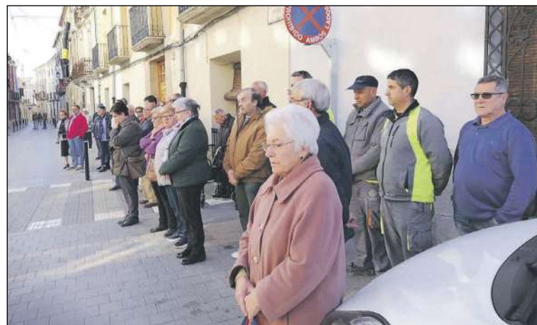
Un gran número de vecinos acudió el 16 de enero al minuto de silencio convocado por el Ayuntamiento como señal de duelo por el fallecimiento de los dos trabajadores la tarde del 14 de enero

Destaca el juez instructor que el Ayuntamiento contrató a la empresa, que debía reparar la bomba de impulsión de aguas fecales ubicada en la urbanización de Castalla Internacional, de forma verbal sin que existiera "contrato escrito ni presupuesto", ni tampoco realizó una evaluación específica de los riesgos laborales de este trabajo, ni comprobó que la mercantil contratada hubiera cumplido con sus obligaciones preventivas, labores que debían haber ejecutado los funcionarios técnicos y la edil del área de Urbanismo.