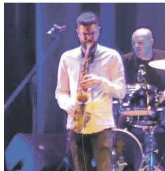
Actuación del grupo Valmuz en el Teatro Río