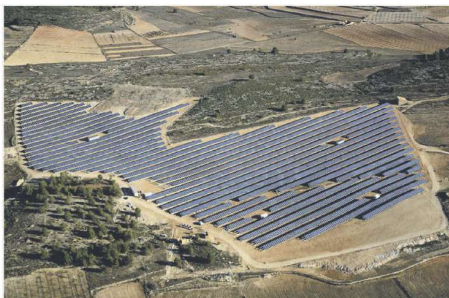
• Parque Solar Monóvar / 3,50 MWp / Monóvar