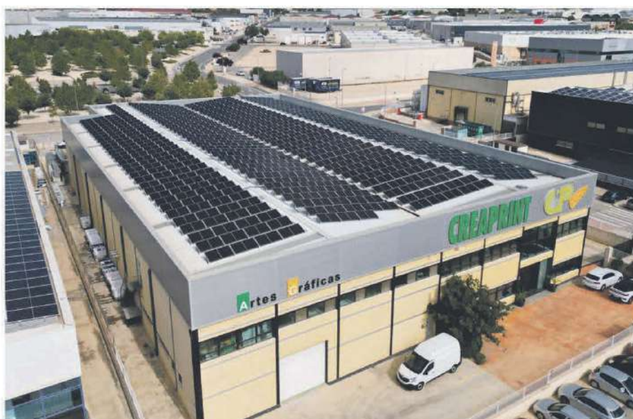
• Creaprint, S.L. / 232,56 kWp / Ibi

EL AUTOCONSUMO ELÉCTRICO: proponemos una solución rentable para ahorrar en la factura eléctrica de manera sostenible y respetuosa con el medio ambiente previo estudio de sus consumos y garantizamos contractualmente la productividad de nuestras plantas más allá de las garantías otorgadas por los propios fabricantes.