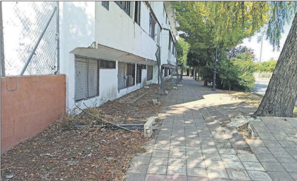
En el solar resultante tras el derribo de las casas se construirá una pista multifuncional de atletismo

La segunda campaña del bono consumo en Onil asciende a 112.876 para gastar en el comercio local