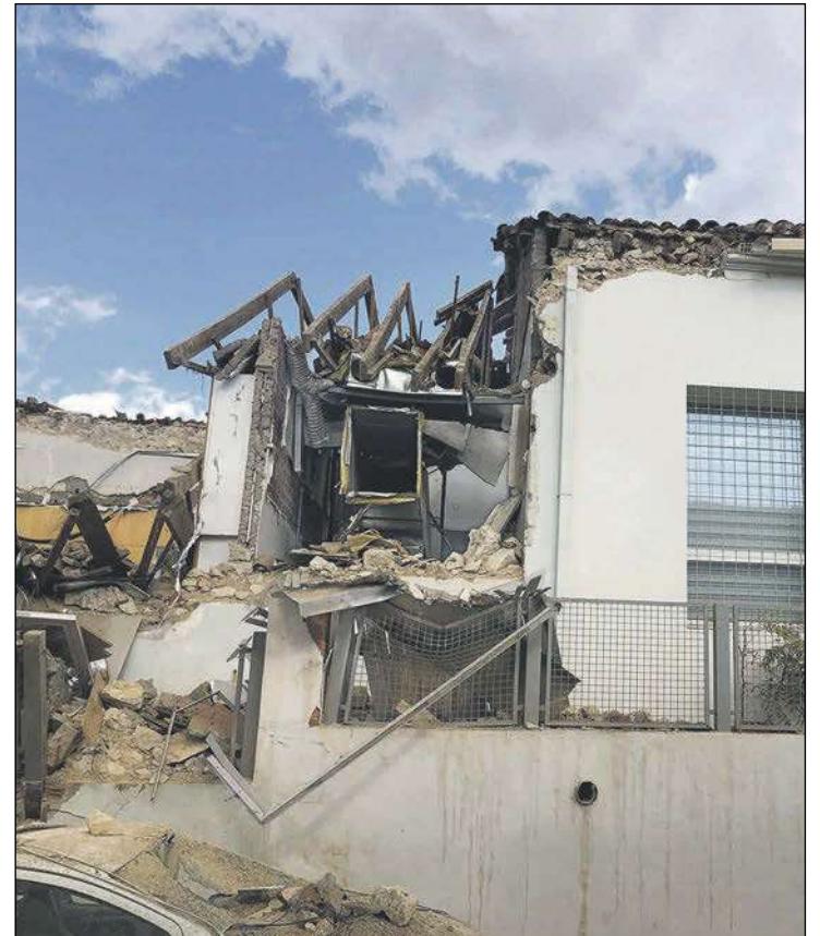
Estado actual de la sede de IBIAE tras el derrumbe de Labora

La pista tendrá una longitud de 288'45 metros y una pista de competición en cuyo interior se ejecutará una recta de atletismo de 100 metros de longitud, siendo el largo total de la pista de 119 metros con seis calles. También habrá un carril para salto de altura y dos carriles para salto de longitud y triple de 58 metros de longitud.