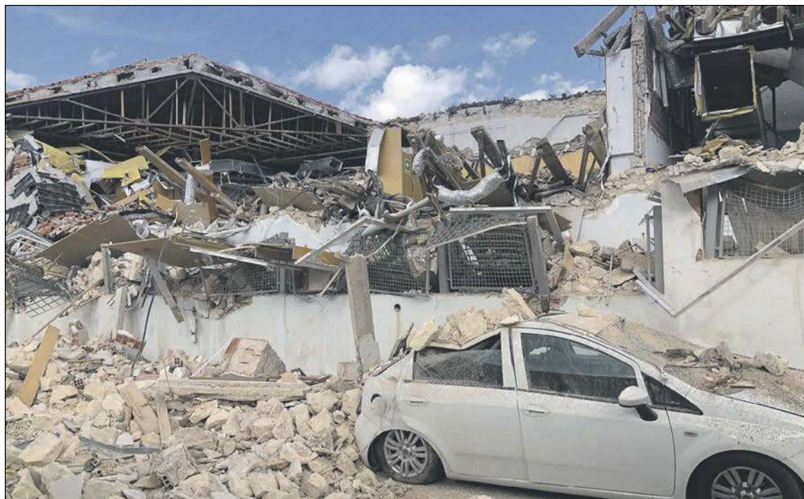
Estado en el que ha quedado el edificio tras el derrumbe que tuvo lugar la madrugada del 4 de diciembre

Precisamente, hace dos meses una inspección volvió a comprobar el lamentable estado de la estructura del techo y se decidió volver a reforzarla. Las obras ya habían comenzado y se estaban apuntalando las paredes más débiles. Por seguridad, toda esa parte del edificio estaba clausu-