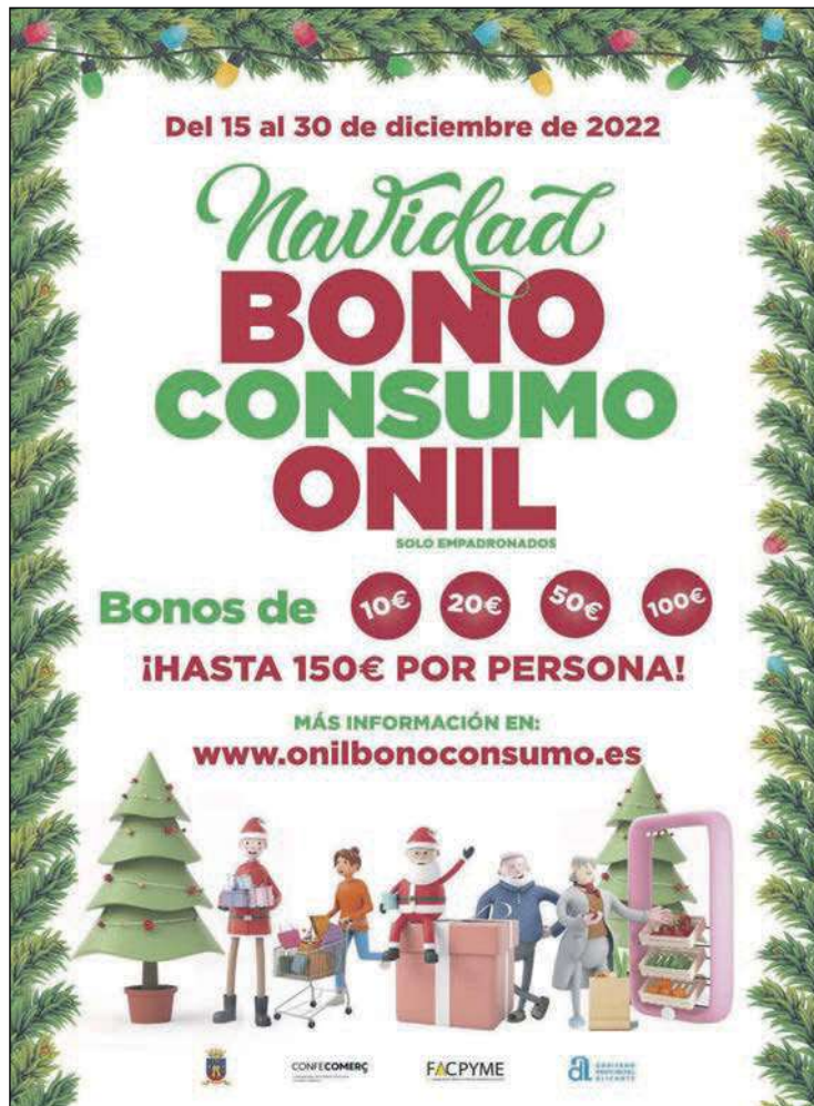
La campaña para gastar el bono consumo empieza el 15 de diciembre

Para usar estos bonos en cualquier comercio local, será necesario que el establecimiento en el que se pretenda usar, tenga que estar debidamente registrado. Para ello, comercios, bar y restaurantes y empresas de servicios que tengan su actividad económica en Onil, a partir del 7 de diciembre podrán