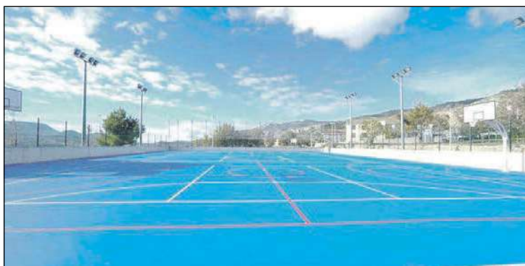
La multipista del Derramador recibe una inversión de 43.002,97 euros

También se está rehabilitando la nueva oficina del CMD que