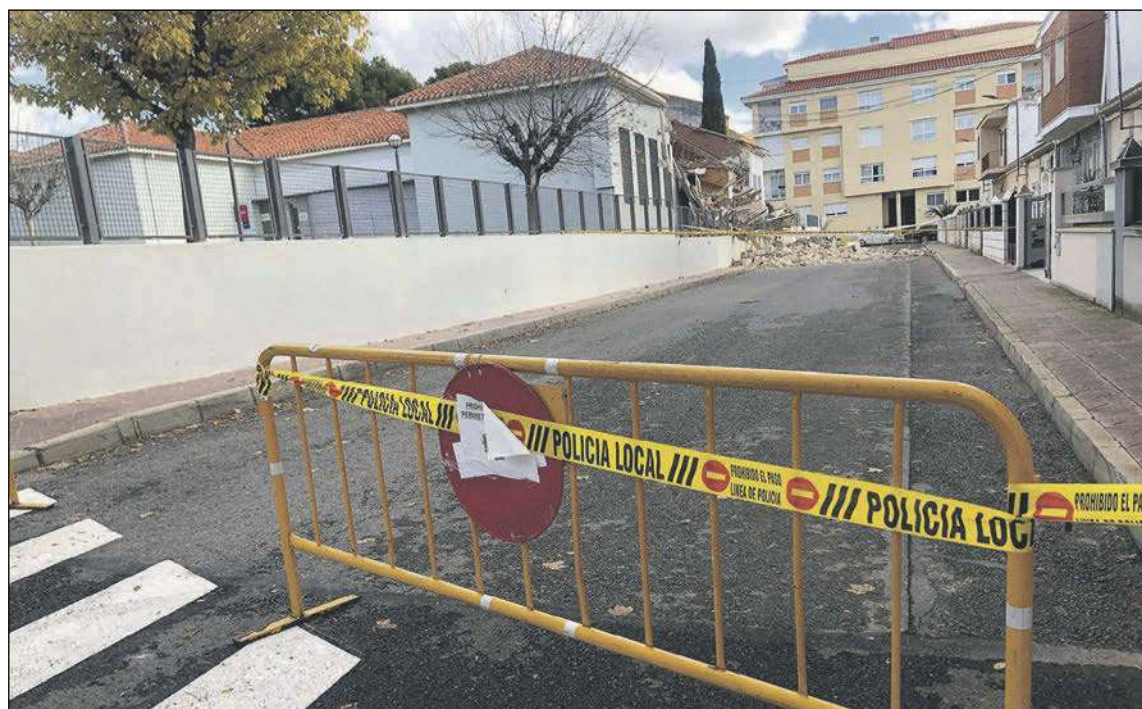
La calle San Juan Bosco está cerrada al tráfico a la espera de que se retiren todos los escombros

El edificio donde estaban las oficinas de empleo estaba en mal estado desde hace años y la parte que se ha derrumbado estaba cerrada al público