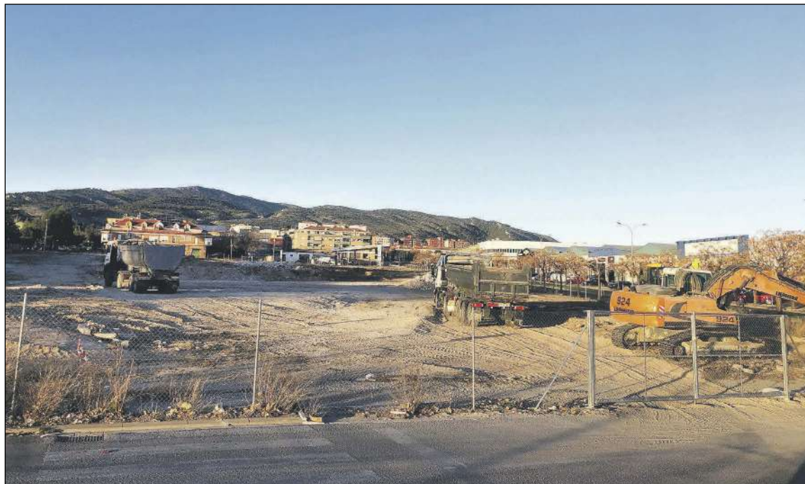
La parcela está situada entre las avenidas de la Provincia y de la Industria

Los trabajos para su construcción ya han comenzado, tal y como se aprecia con el movimiento de tierras en la parcela, aunque no ha trascendido cuándo podrían estar abiertos al público. El objetivo, sin embargo, es que ambos establecimientos puedan estar operativos durante este año.