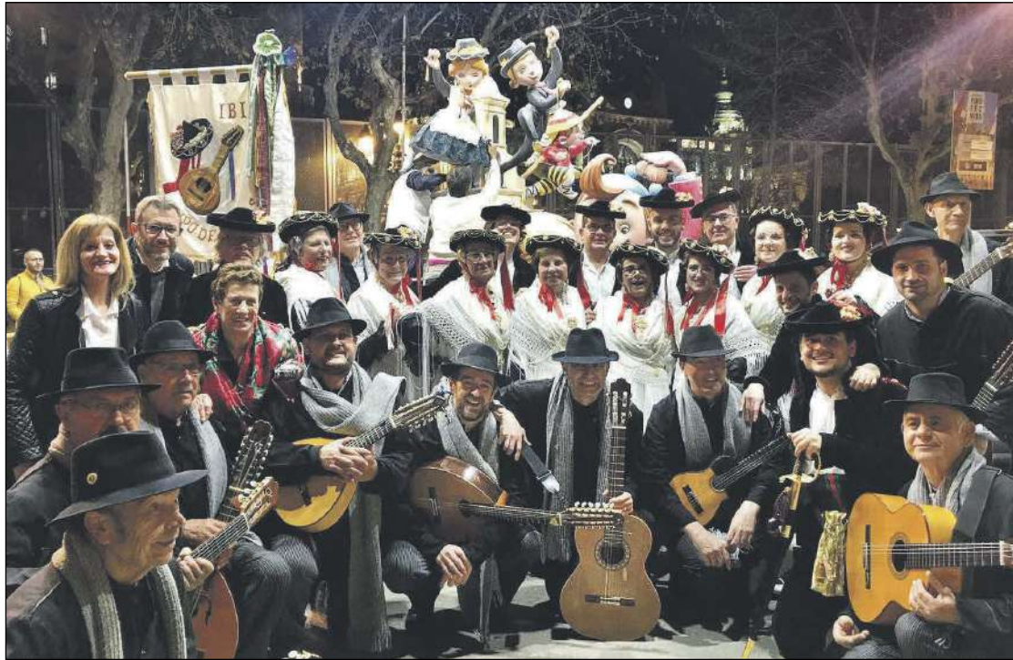
El Grupo de Danzas de Ibi posando delante de la falla que está coronada por una pareja de ballaors iberuts