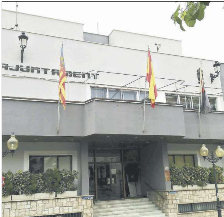
Un funcionario del Ayuntamiento ha ocupado la plaza de interventor de manera accidental hasta su jubilación