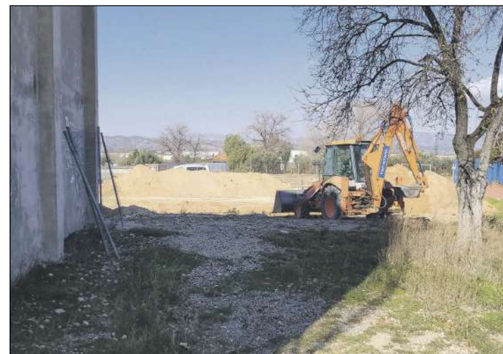
Las dimensiones del edificio serán de 27x10 metros con una altura libre de forjado de cuatro metros

El nou edifici d'Infantil compta amb sis aules, que tenen banys amb accés des de l'aula i patis exteriors, i també una aula multiusos, una altra per a treballar en grups xicotets i dependències per al professorat.