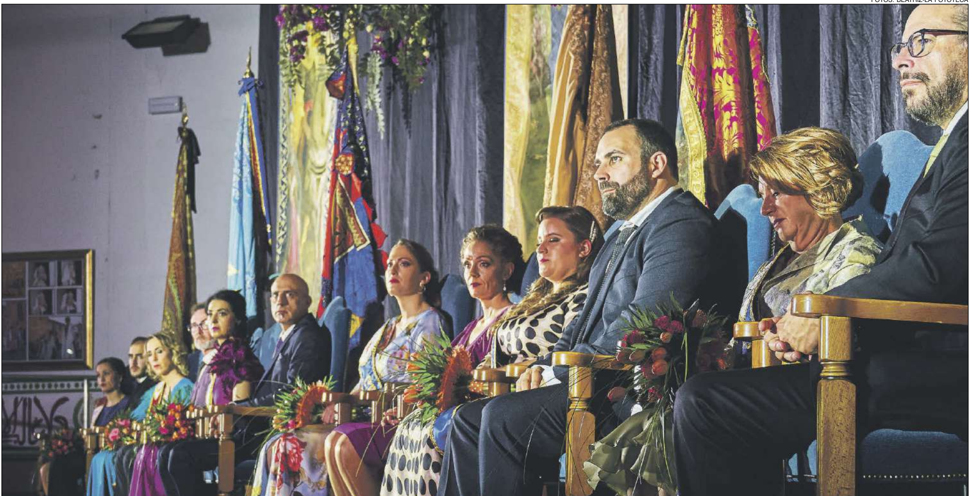
Los Capitanes de las comparsas presidieron el acto desde la tribuna en la comparsa de Moros Artistas