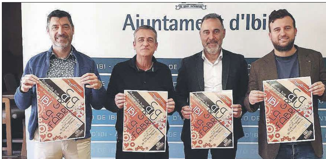
Las bases se pueden consultar en la página web del Ayuntamiento www.ibi.es , en el apartado de «ciudadanía»

Cualquier persona residente en la provincia de Alicante