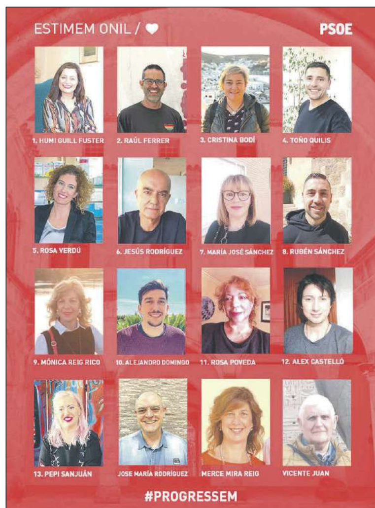
La lista del PSOE presenta nuevas caras en los puestos de salida

Tenemos mucho por hacer y vamos a hacer que merezca la pena que gobernemos revelando un proyecto viable y vital para Onil que atienda todas las necesidades actuales con la ayuda de "tots els Colivencs y Colivencas" que siempre colaboran para que las cosas salgan lo mejor posible.