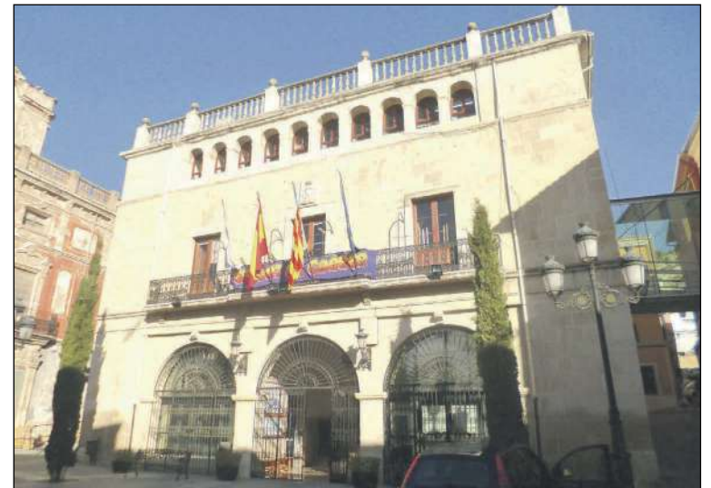
El Consistorio interpondrá un recurso ante el Tribunal Supremo

Tras el empeoramiento de la situación, los trabajadores interpusieron una demanda ante el Juzgado de lo Social de Alicante, que fue estimada condenando al Ayuntamiento de Castalla por vulneración de derechos fundamentales. El juez, además, obligaba al Consistorio a indemnizar con 15.000 euros a cada trabajador. Asimismo, la sentencia reco-