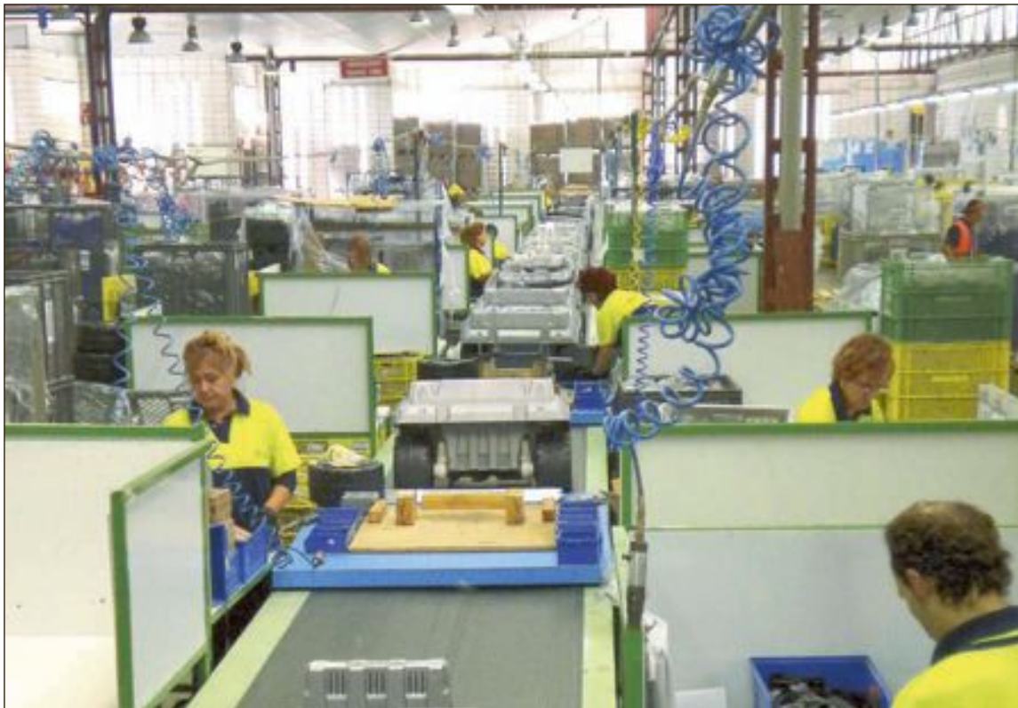
La industria sigue encabezando las contrataciones en mayo, seguido ahora de la construcción

Para UGT, estos datos revelan la reactivación de las actividades tras su paralización, debido a la situación por la que atraviesa el país. Señala el sindicato que “hay que conseguir salvar la actividad económica y salir de esta crisis encaminados hacia una recuperación así como la necesidad de extender las medidas de protección social, las prestaciones por desempleo etcétera”.