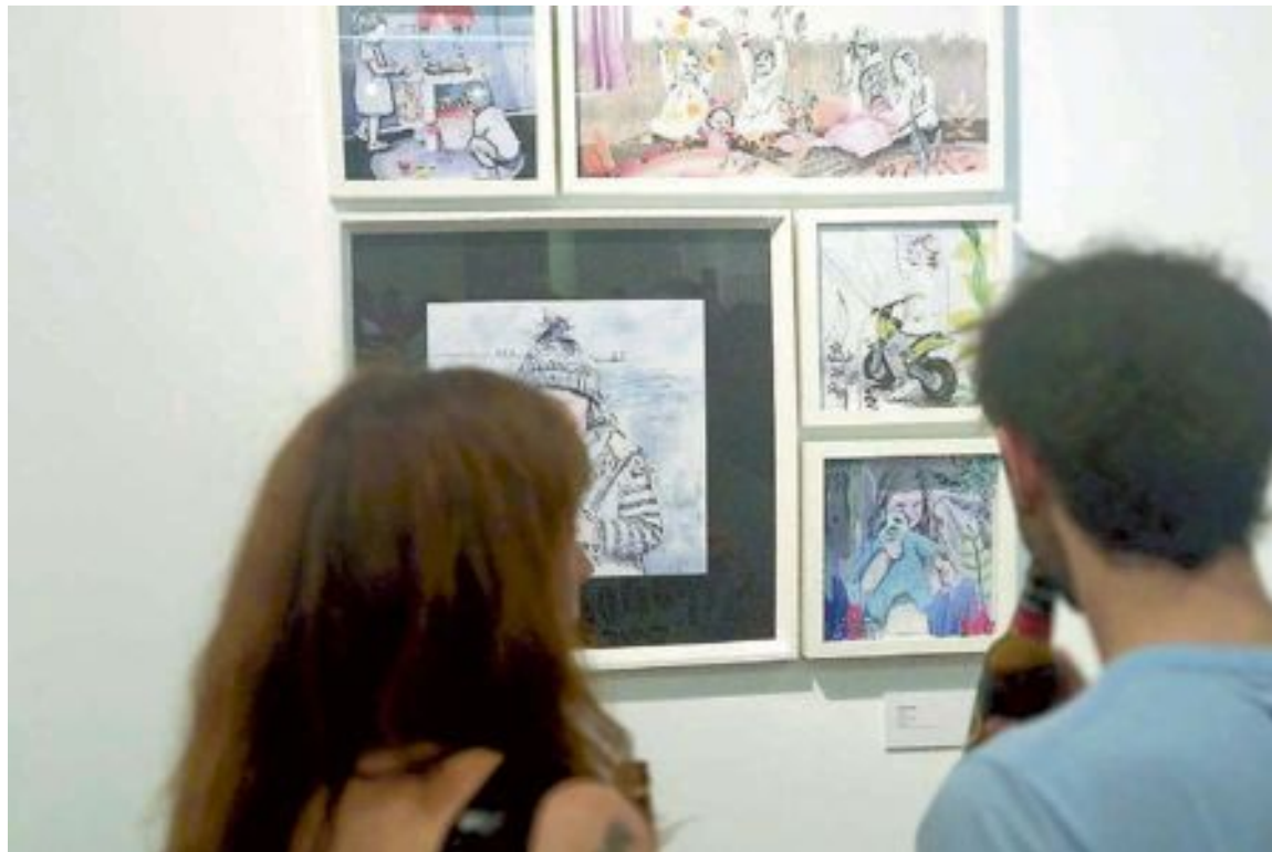
Con las obras presentadas se realizará una exposición en el Museo, que se abrirá al público el 17 de julio

Las bases para participar en esta nueva convocatoria pueden consultarse en la página web www.museojuguete.com