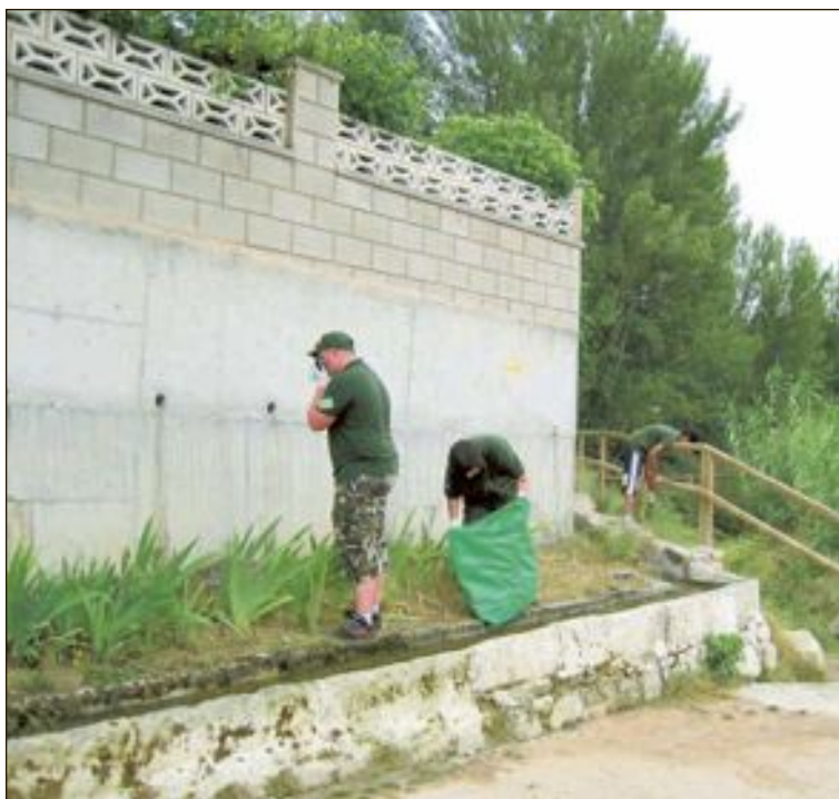
Voluntarios medioambientales de la campaña de 2019

A su vez, para contrarrestar dicha cancelación, la concejalía de Medio Ambiente ha intensificado las labores de desbroce de caminos y lugares conflictivos a la hora de producirse un incendio, así como la puesta en marcha, un año más, de las ya conocidas ‘ovejas bomberas’, que pastan estos meses por nuestros montes limpiándolos de malas hierbas.