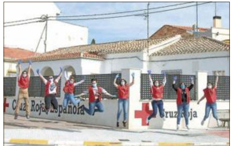
Grupo de trabajadores y voluntarios de Cruz Roja Ibi

Así mismo, con la puesta en marcha del salario mínimo vital, consideramos que sigue siendo indispensable una buena coordi-