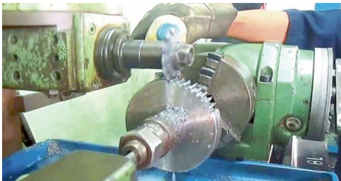
A estas ayudas acceden pymes del plástico, metal-mecánico, juguete, químico, envase y embalaje, papel y artes gráficas, entre otros

Las empresas de nuestro territorio han demostrado su versatilidad y compromiso con la socie-