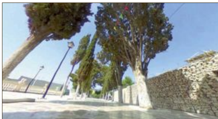
Les pel·lícules es projectaran en el passeig de la Santa, a las 22 hores

En 2019 junt amb Ecoembes i Ecovidrio, va realitzar dos campanyes de gran calat denominades que es van centrar en este mateix missatge.