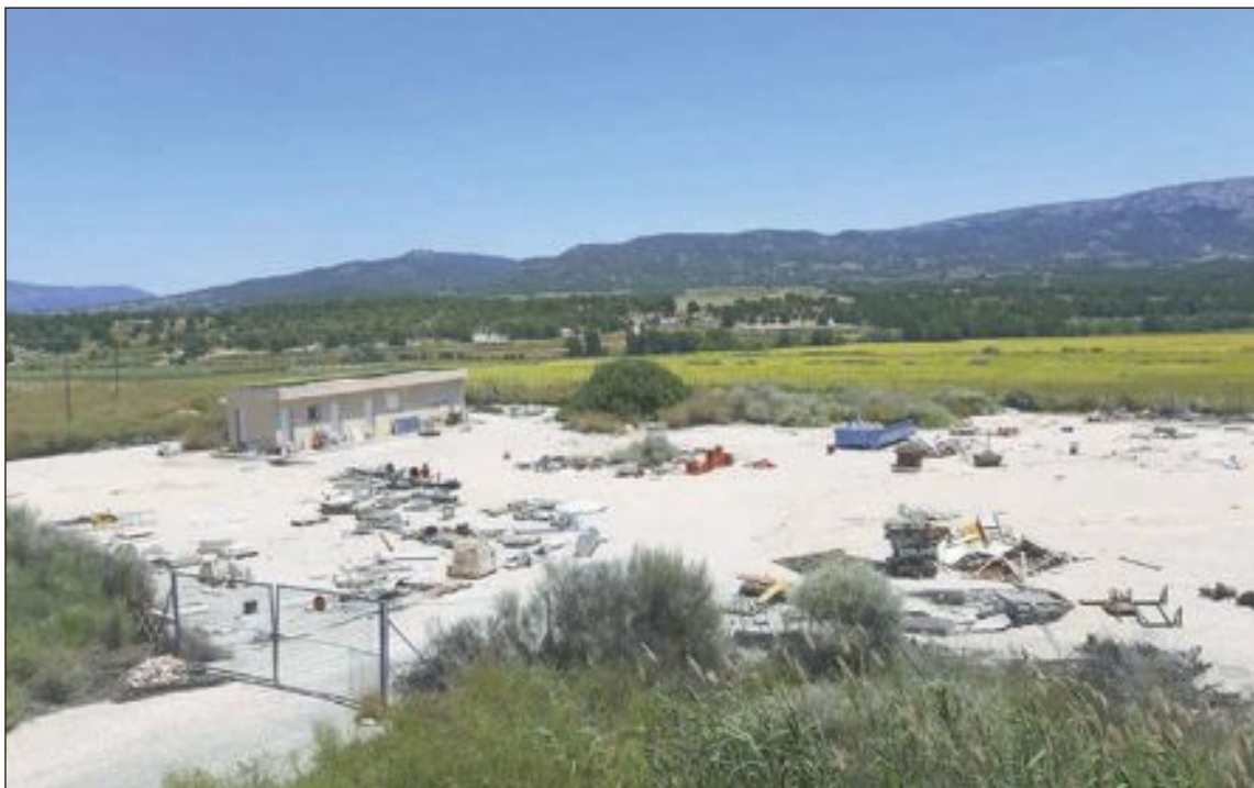
La nova infraestructura dotarà a més als veïns de Castalla Internacional amb uns equipaments que necessita.