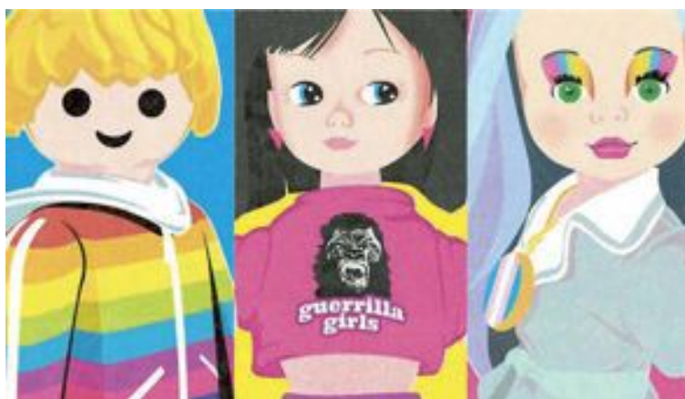
Queer Toys, obra del artista ibense Fefeto

La España actual no es la de hace 50 años, es un Estado social y democrático de Derecho, que no pertenece a nadie, en el que cabemos todos, incluso ellos, los intolerantes.