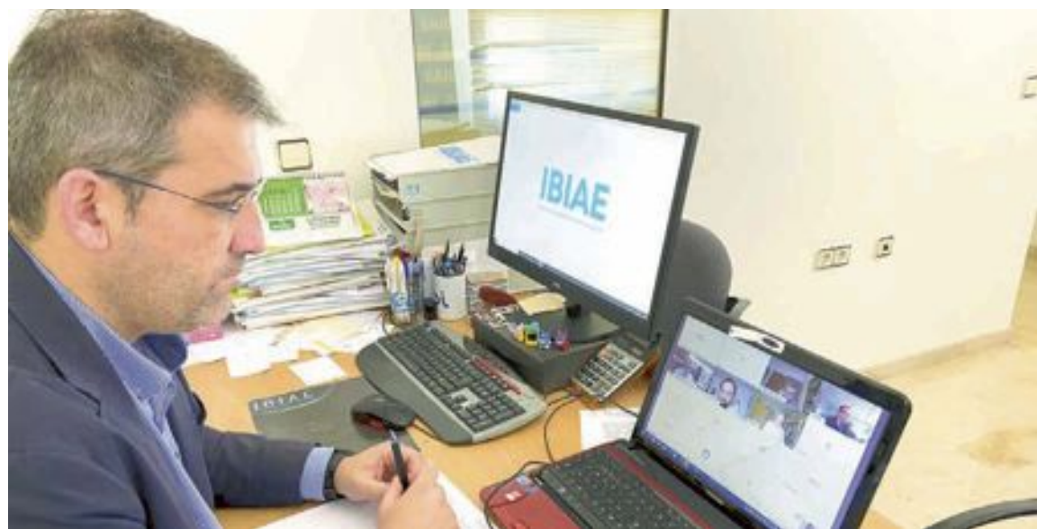
Las reuniones se han celebrado de forma telemática y han contado con la intervención del director de IBIAE

tanto, las ayudas no deben perderse en el camino. Mejorar su competitividad es necesaria para no dejar escapar el nuevo tren.