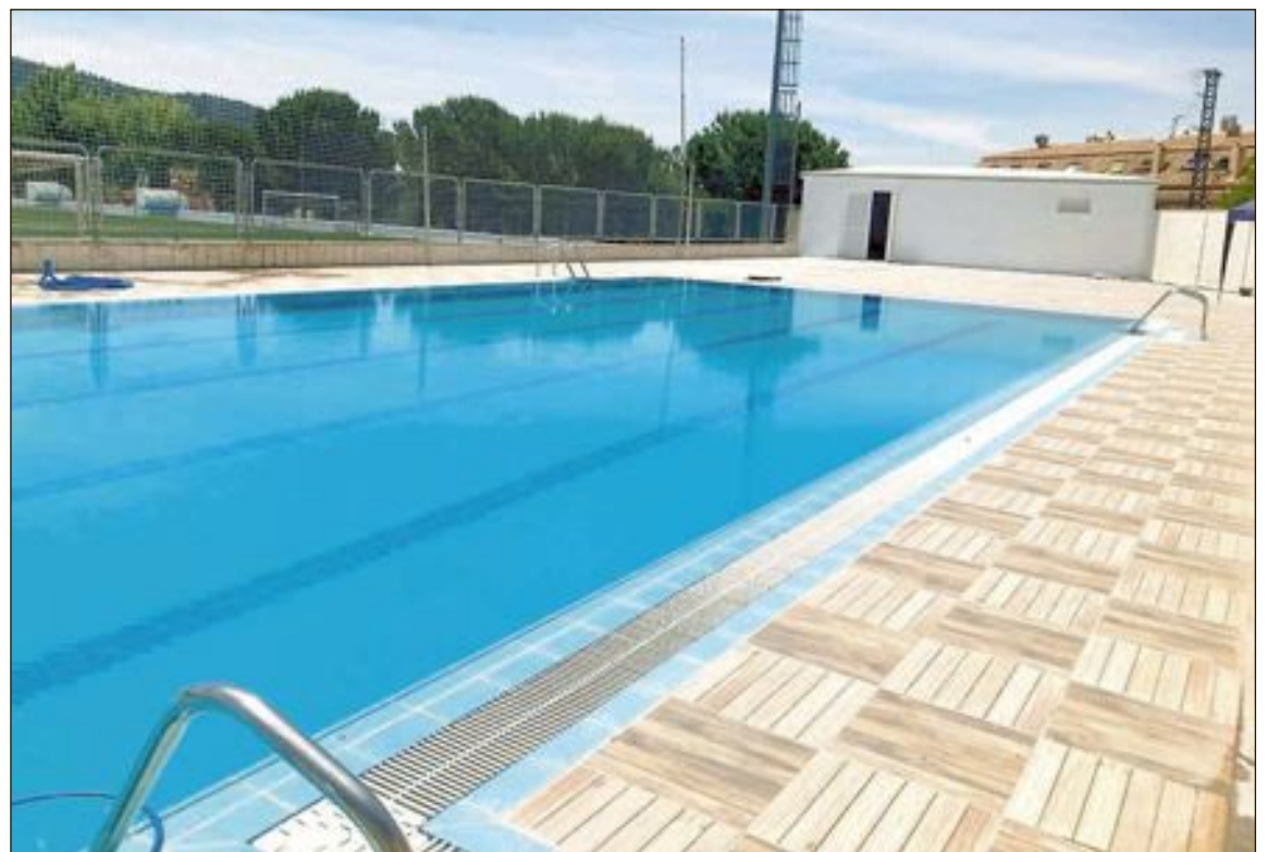
La zona de la terraza de la piscina del Climent ha sido rehabilitada recientemente

Para la apertura de esta instalación se ha tenido en cuenta unas estrictas medidas de seguridad