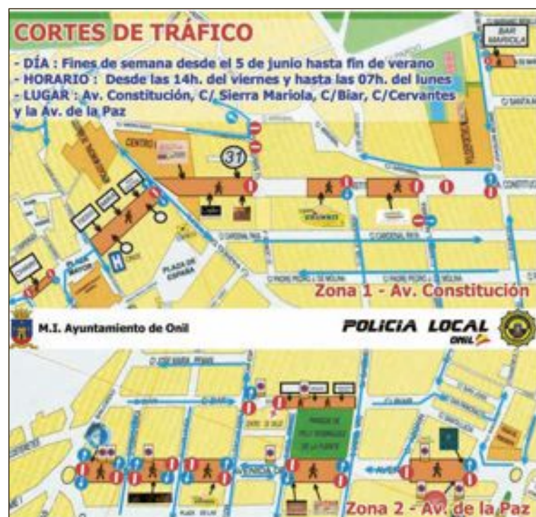
El plano callejero marca las calles que estarán afectadas

puesto en marcha una vez concluidos los meses de lluvia que han provocado un mayor crecimiento de las hierbas y matorrales este año. Por otro lado, la concejalía de Caminos está contratando el desbroce y ha previsto iniciar los trabajos en los caminos sobre el 15 de Junio.