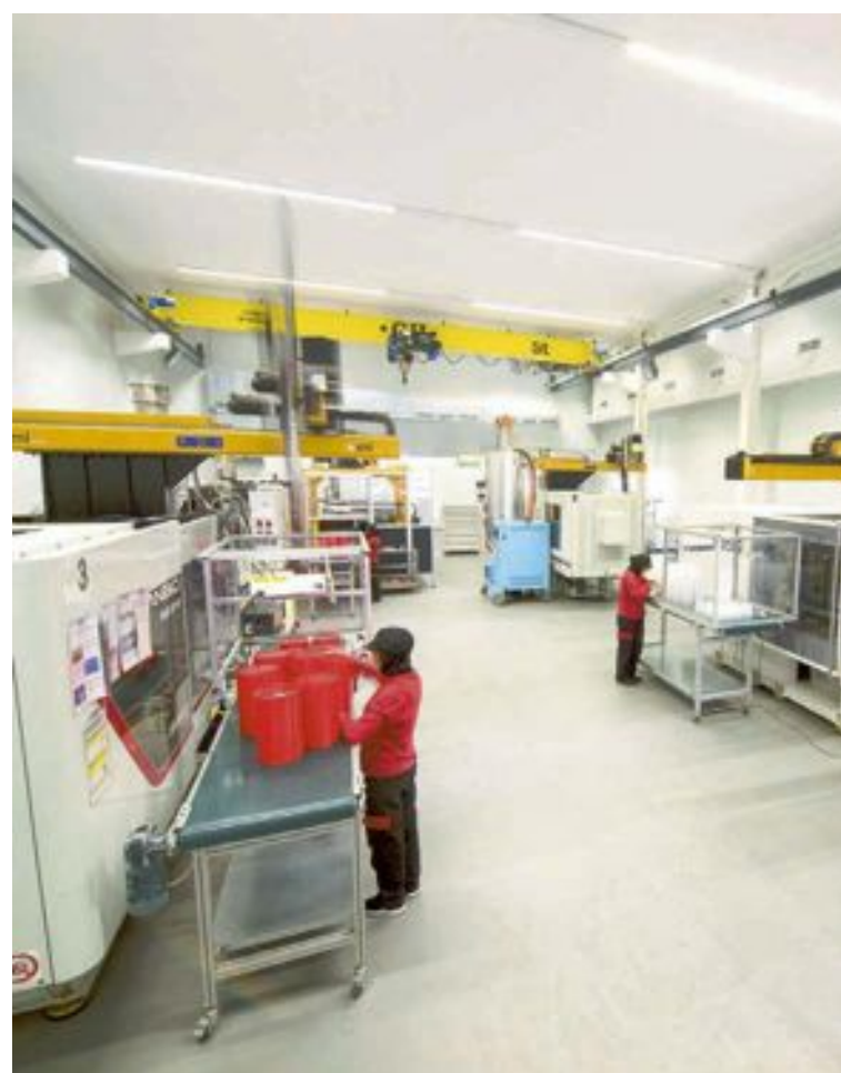
Los estudiantes estarán becados económicamente durante estas prácticas en empresas del sector

Para obtener más información, contactar con la asociación a través de comunicacion@ibiae.com .