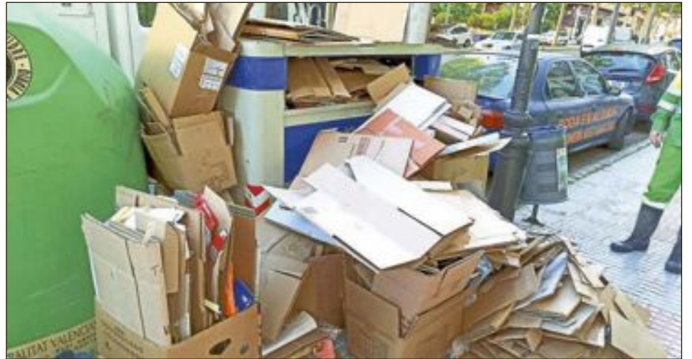
Estado en el que se encuentran los contenedores de basura de las zonas del extrarradio, así como los contenedores de reciclaje en algunas calles del municipio