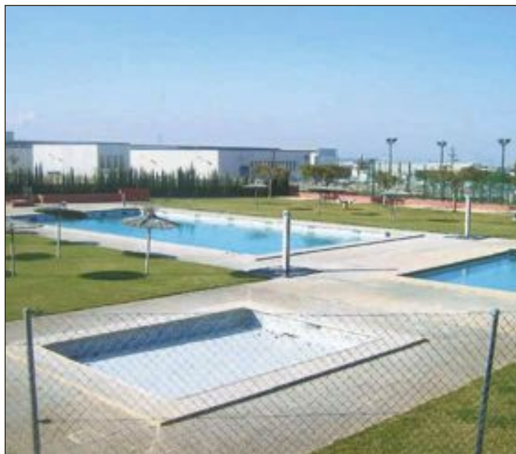
La decisió es pren "per cautela", ja que es tracta de zones públiques on es concentra gran quantitat d'usuaris

Segons indiquen els consistoris, la decisió es pren "per cautela", ja que es tracta de zones públiques on es concentra gran quantitat d'usuaris i, per tant, les convertix en llocs susceptibles de contagi i propagació del virus.