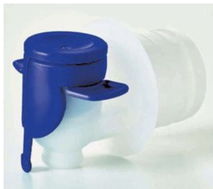
Bag-in-Box es una solución de envasado prometedora, debido a la gran variedad de tamaños disponibles y a su adaptabilidad